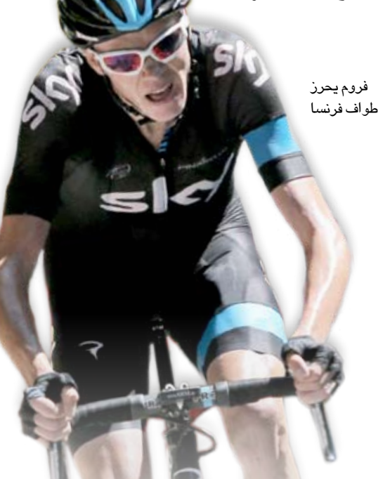
فروم يحرق طواف فرنسا

البيخاندرو فالغيريدي ثالثاً أمام الهولنديين باوكه مولياما ولاورنس تِن دَام. والفوز هو الثاني لفروم في فرنسا بعد فوزه بمرحلة واحدة العام الماضي أيضاً، وقطع مسافة 195 كلم بزمن ٥.٣١.١٨ ساعات بمعدل سرعة وسطي ٣٨.٦ كلم/ساعة. وتفوق فروم على عدة أبطال سابقين لدورة فرنسا منهم الإسباني البرتو كونتادور بطل عامي ٢٠٠٧ و ٢٠٠٩ الذي تخلف بفارق دقيقة ٥5 ثانية، واللوكسمبورغي أندي شليك زميله في فريق سكاي الأسترالي (٢٠١٠) الأسترالي كاديل إيفانز ريتشي بورت، وجاء الإسباني