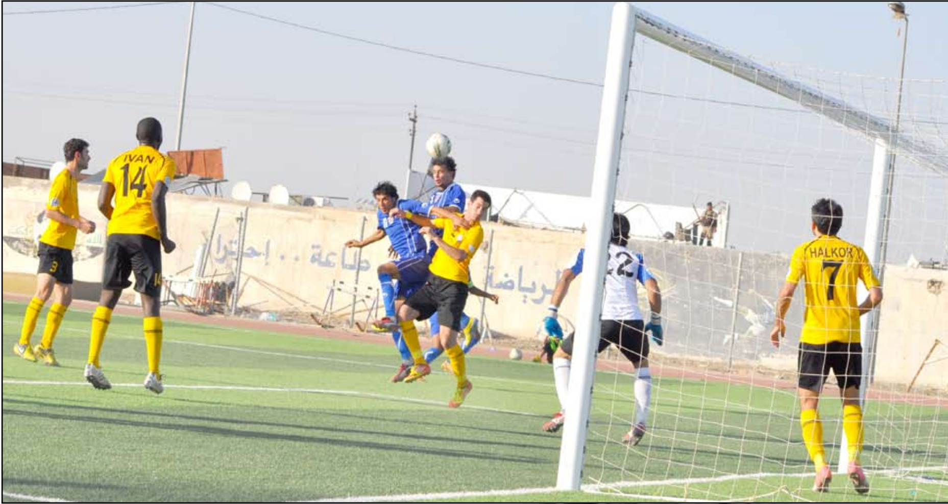
أربيل يخطف فوزاً غالياً من الميناء في دوري النخبة