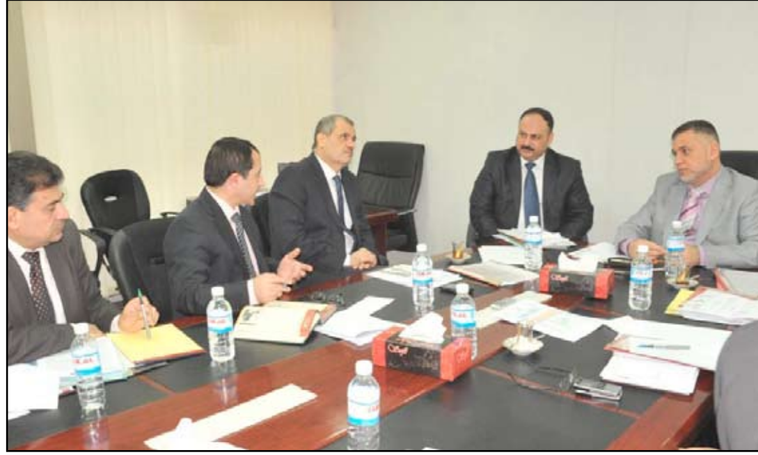
هيئة النزاهة تجتمع بلجنة النزاهية التباية داخل البرلمان.. ارشيف

واوضحت ان (١٣) من تلك القضايا أرسلت الى وزارة الثقافة لعلاقتها بتعيينات في دار الأزياء العراقية دون استحصال موافقة الوزير إضافة الى