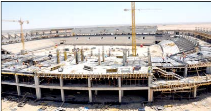
تواصل العمل لإنجاز ملعب الرمادي

الثانوي ليضاهي الملاعب العالمية وفق مواصفات فيفا، فيما أوّز وزير الشباب والرياضة المهندس جاسم محمد جعفر بإنشاء قاعة رياضية مغلقة سعة ٢٥٠٠ مقترح متعددة الأغراض ومسبح، وتم ربط الملعب بمحطة كهرباء سعة ١٣ ميكا واط ومحطة تصفية ١٠٠ متر مكعب في الساعة وخط ماء للشرب والسقي ومحطة معالجة للمياه الثقيلة وكبيل ضوئي من أجل تسهيل خدمات البث والإنترنت ووسائل الاتصال الدولي.