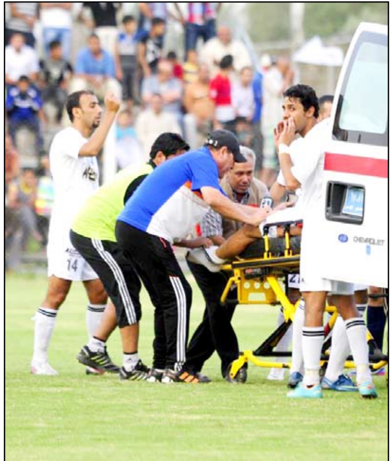
تصاعد الأصوات للحد من ظاهرة شغب الملاعب