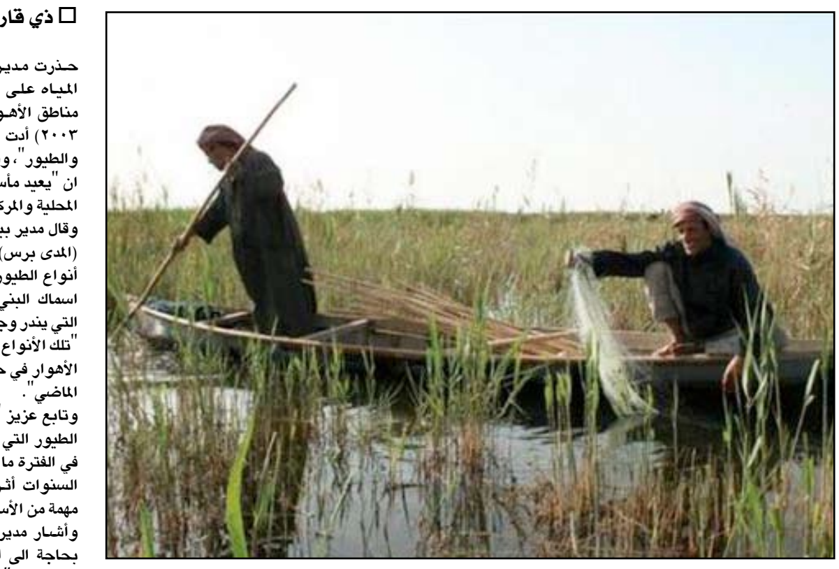
صيادو السمك في احد اهور ذي قار .. ارشيف

وتابع عزيز "كما رصدنا اختفاء بعض الأنواع من الطيور التي غيرت مسارها نتيجة تجفيف الأهوار في الفترة ما بين ١٩٩٣ - ٢٠٠٣"، مبيئاً أن "هذه السنوات أثرت في مسار الطيور واختفاء أنواع مهمة من الأسماك". وأشار مدير بيئة ذي قار الى أن "الأهوار حالياً بحاجة الى اهتمام أكثر من الحكومتين المحلية والاتحادية"، موضحاً أن "عملية الإنعاش لا تفي