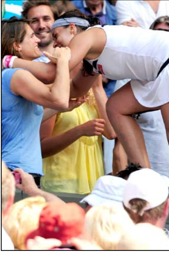
بارتولي تحفظ بطولة ويمبلدون للتنس للمرة الأولى في تاريخ مشاركتها

وستبدأ الولايات المتحدة حملتها امام بلين في بورتلاند يوم غد الثلاثاء ثم ستواجه كوبا وكوستاريكا ضمن المجموعة الثالثة.