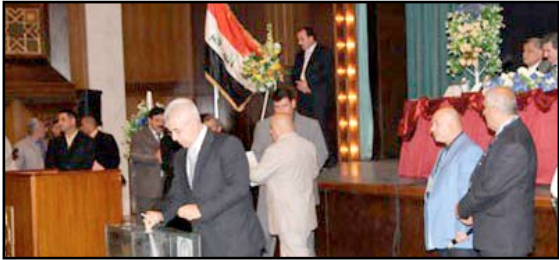
جانب من انتخابات المكتب التنفيذي في الدورة السابقة

وتراجع وغياب البنى التحتية والتخطيط العلمي والعملية وبالطبع هناك أسماء لامعة في سماء رياضتنا، جديدة وكفوءة لتدخل ميدان العمل الرياضي بنقل واقتدار. ومن الضروري أن ترشح وتفوز لتعمل بتوازن ومهارة وعلمنا ان نستفيد جدا من تجربة انتخابات المكتب التنفيذي السابقة وأن لا يكون للتحور والتكتل والمزاجية والعلاقات الجانبية والضغط واللائم أثر مهم فيما سيدت وأملنا كبير أن تكون انتخابات ديمقراطية نموذجية قولاً وفعلاً وهي تتزامن مع أيام شهر رمضان المبارك ومع قدسيته.