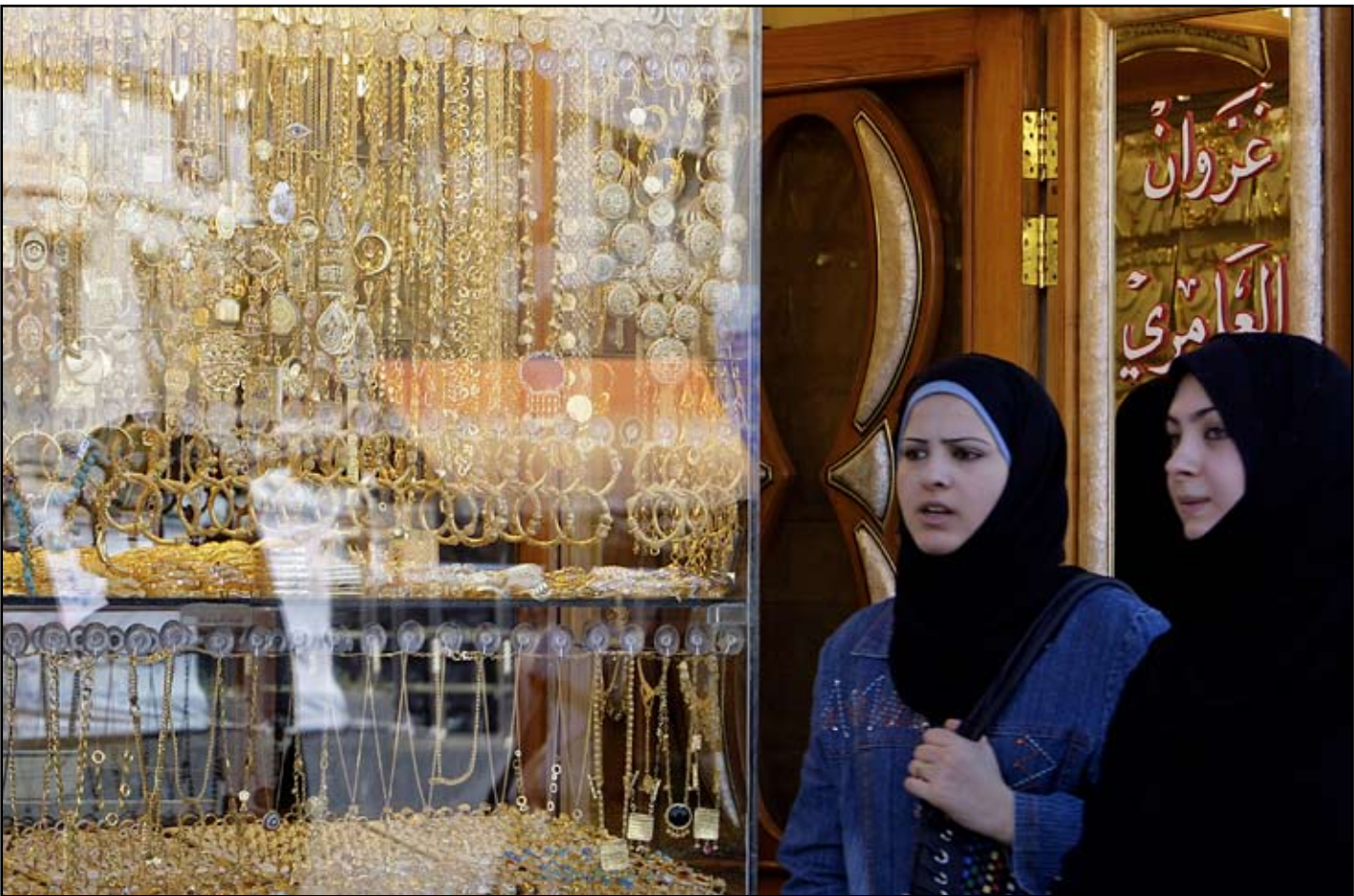
العرض المتزايد للذهب يساهم في انخفاض اسعاره .. ارشيف

بموامل كثيرة اهمها النفط والدولار، مبيناً ان العلاقة بين الذهب والدولار عكسية ما يعني عند ارتفاع سعر الدولار ينخفض الذهب وبالعكس. واصاف: ان هناك توجهاً عاماً من قبل الكثير من البنوك المركزية من اجل تخفيض اسعار الذهب، مشيراً الى ان الاسعار المحلية تتأثر بأسعار السوق العالمية بشكل بسيط من خلال الرسوم الكمركية والختم وتكلفة التصنيع، بالإضافة الى السعر العالمي حيث يتم التلاعب بهذا الفرق من قبل التجار وصاغة الذهب.