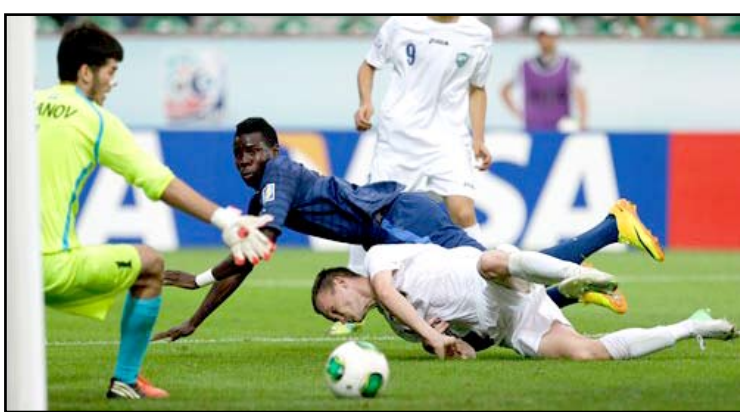
منتخب فرنسا اول الواصلين الى دور ٤ لمونديال الشباب

في كأس العالم للشباب (دون ٢٠ عاماً) المقامة في تركيا وبلغ نصف النهائي بفوزه الكاسح على نظيره الأوزبكستاني ٤-٠ صفر في ريزي. وسجل يايا سانوغو هدفه الرابع