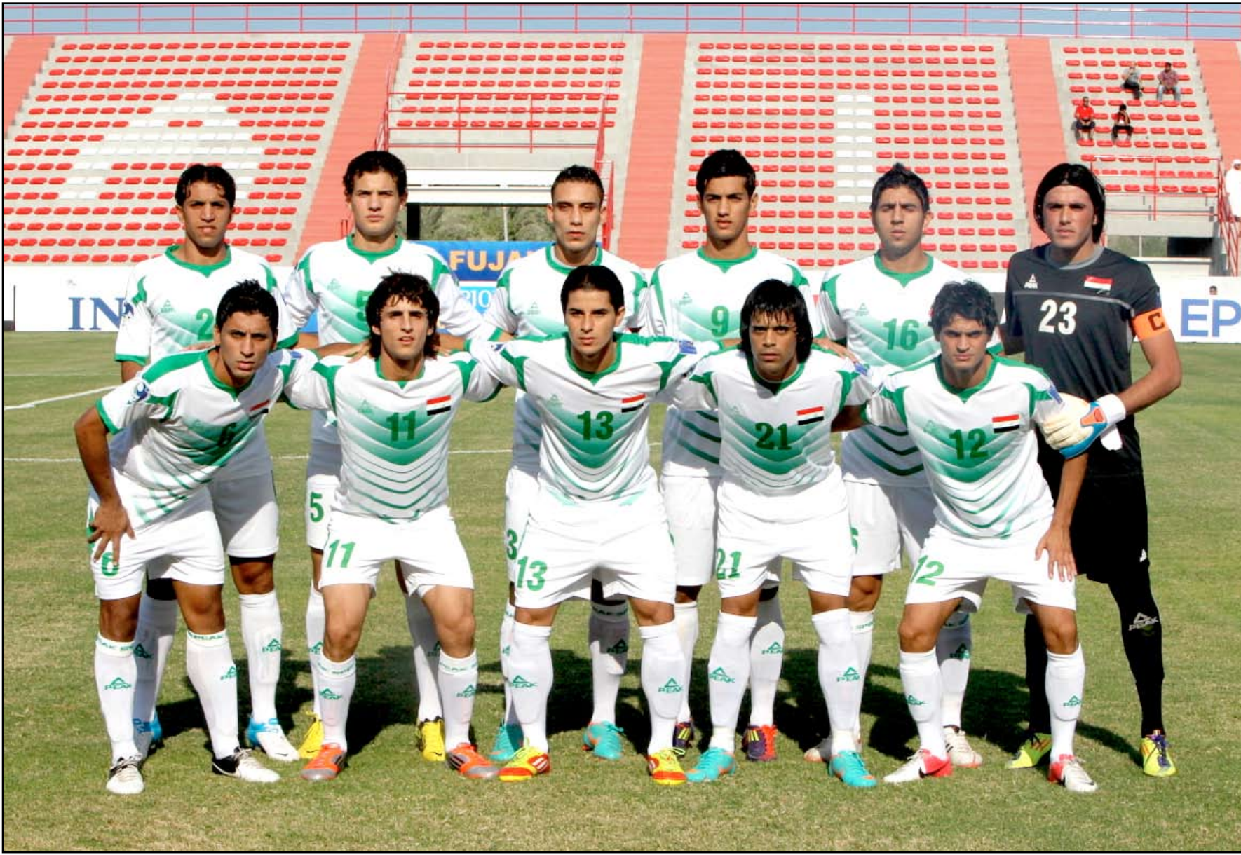
الليوث يضربون موعدا مع الأورغواي في نصف النهائي...