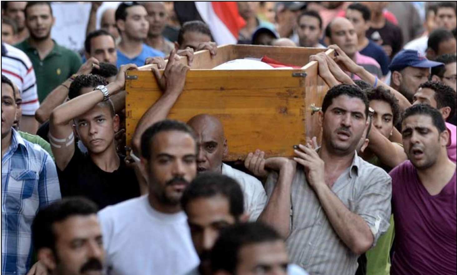
الشعب المصري يحملون نعش أحد ضحايا الاشتباكات التي اندلعت خلال حفل جنازة في القاهرة..