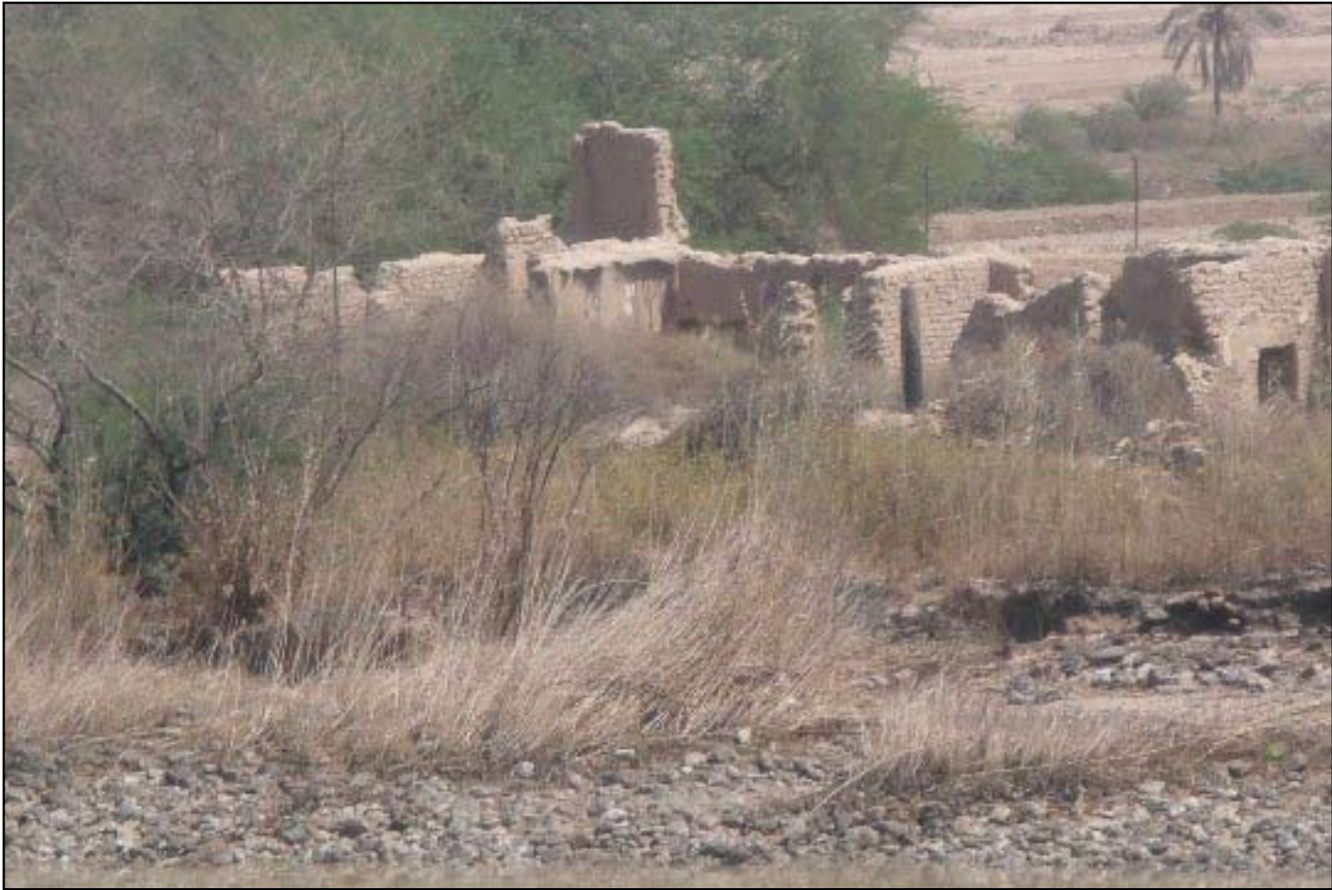
هلاك مزارع الحنّاء بسبب الجفاف وملوحة المياه في الفاو