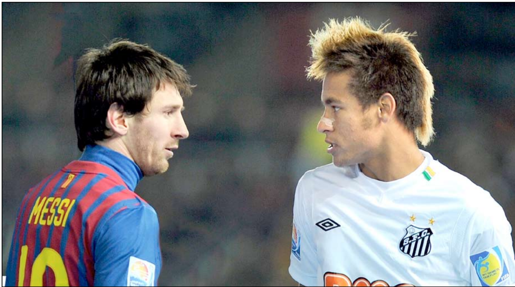
ميسي سعيد بانضمام نيمار الى برشلونة

إدينسون كافاني، واين روني، روبرت ليفاندوفسكي، ماريو غوميز، غونزالو هيغوين، ادين دزيكو وغاريث بال، هناك تهنئات يومية حول مصير كل منهم وحديث حول نهابهم إلى أندية بعينها.