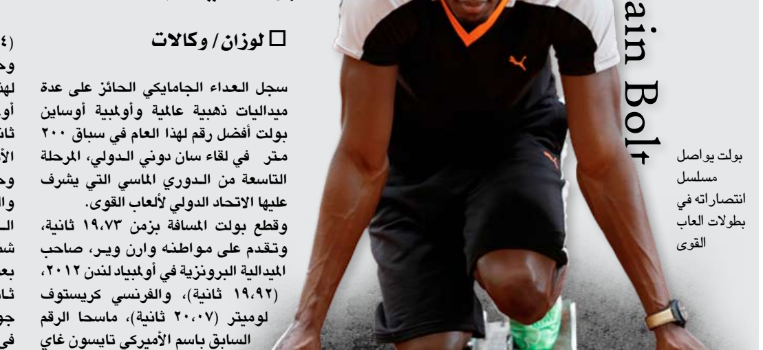
بولت يواصل مسلسل انتصاراته في بطولات ألعاب القوى

سجل العداء الجامايكي الحائز على عدة ميداليات ذهبية عالمية وأولمبية أوساين بولت أفضل رقم لهذا العام في سباق ٢٠٠ متر في لقاء سان دوني الدولي، المرحلة التاسعة من الدوري الماسي التي يشرف عليها الاتحاد الدولي لألعاب القوى. وقطع بولت المسافة بزمن ١٩.٧٣ ثانية، وتقدم على مواطنه وارن وير، صاحب الميدالية البرونزية في أولمبياد لندن ٢٠١٢، (١٩.٩٢ ثانية)، والفرنسي كريستوف لوميتز (٢٠٠٧ ثانية)، ماسحا الرقم السابق باسم الأميركي تايسون غاي