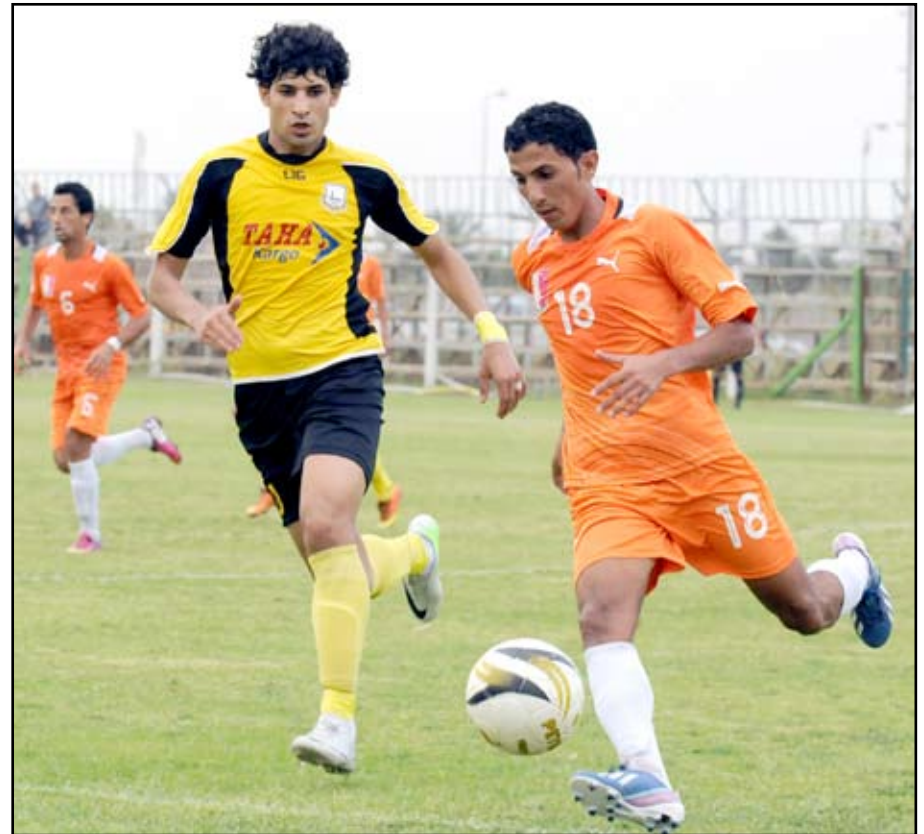
الكهرباء يسعى لتعويض نتائج المتواضعة

يبحث كل من الاسليمانية والكهرباء عن فرصة مهمة لإنقاذ مشوارهما في منافسات دوري النخبة عندما يلتقيا في الساعة الثامنة في إطار الجولة السابعة والعشرين من منافسات دوري النخبة الذي بدأ يدخل مراحل صراع ساخن من اجل التثبيت بالبقاء خصوصا لفريق المراكز المتأخرة التي تواجه خطر الهبوط ومغادرة دائرة الأضواء في الموسم المقبل.