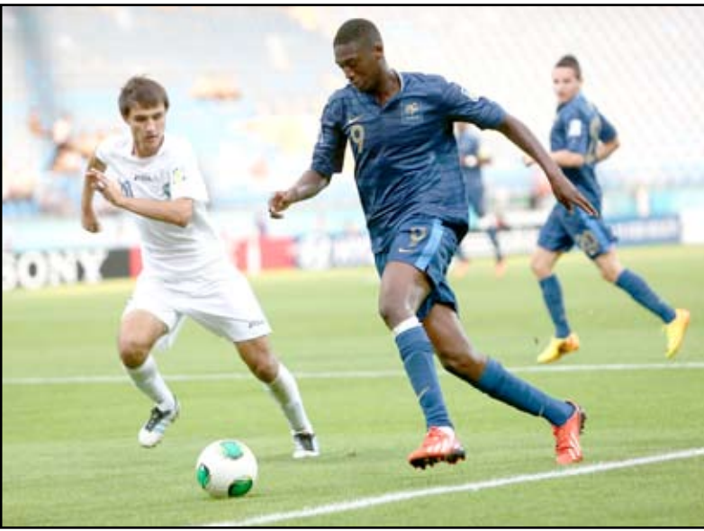
توقعات عراقية ترشح فرنسا لنيل لقب مونديال تركيا