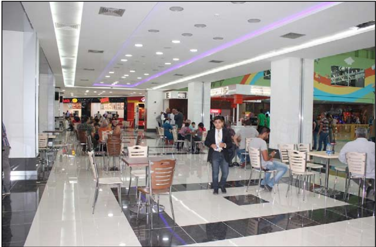
من داخل منصور مول في بغداد

وكان مجلس الأمن الدولي صوت، الخميس، (٢٧-من حزيران ٢٠١٣)، بالإجماع على قرار إخراج العراق من طائفة الفصل السابع، بعد أكثر من عقدين من العقوبات التي فرضها بموجبها في أعقاب غزو النظام السابق للكويت في الثاني من آب ١٩٩٠.