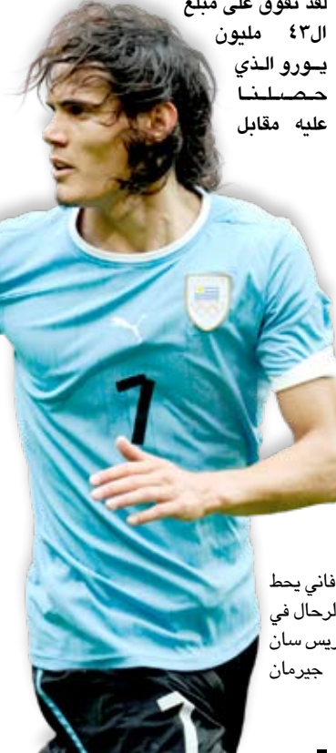
كافاني يحط بالريس سان جرمان

وأشارت الصحيفة أيضا الى ان كافاني ليس اللاعب الوحيد على لائحة مشتريات سان جرمان ومدربه الجديد لوران بلان، ان يسعى بطل الدوري الفرنسي الى ضم البرازيلي هرنانيس من لاسيو الإيطالي والظهير اليسر الشاب لوكاس دينيني من ليل.