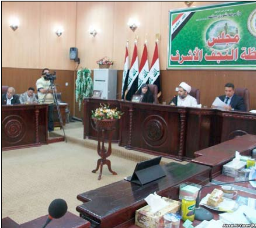
مجلس محافظة النجف السابق.. (ارشيف)

محافظة عراقية ولديه مكاتب فيها بالإضافة اربعة مكاتب إقليمية في بغداد واربيل وبابل والبصرة ويختص بتقديم المشورة للحكومات المحلية.