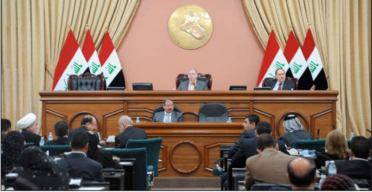
مجلس النواب - ارشيف

لـ"المدى" ان اعضاء البرلمان يرفضون التصويت على الموازنة بشكل عام وطالبوا ان يكون التصويت عليها بشكل منفصل، مرجحاً ان "تنخفض الموازنة والا فإنا بهذا الشكل وبهذه المبالغ لن تمرر بالتأكيد". ولفت العضو في لجنة الخدمات والاعمار الى ان "ائتلاف دولة القانون طلب التريث بالتصويت على الموازنة". وتابع مستغرباً "الموازنة تتضمن تخصيص مبالغ لشراء سيارات مصفحة لرئاسة البرلمان في الدورة القادمة"، وتساءل عن "مصير العجلات الموجودة لدى هيئة الرئاسة الحالية، وهل لكل نائب حق الاحتفاظ بالسيارات التي خصصت له بعد انتهاء الدورة الحالية"، مطالبا رئاسة البرلمان "بتوضيح كل هذه التساؤلات". ورأى العوادي ان الضغوطات التي مارسها الشارع هي من اجبرت رئاسة البرلمان على التراجع وسحب الموازنة من جدول الاعمال لحين مناقشتها وتخفيض مبالغ ابوابها". وفت الى ان "رئاسة البرلمان تسعى الى