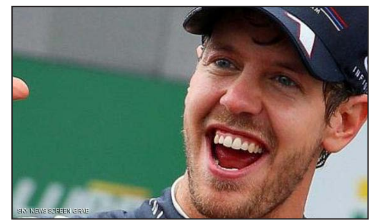
فيتل في مهمة شاقة في المجر

وبالرجوع لما حدث في المواسم السابقة فإن فيتل يزداد قوة في النصف الثاني من الموسم وسيكون على منافسيه على اللقب اقتناص كل نقطة يمكنهم حرمانه منها. ويحقق فيتل متصدر الترتيب العام نتائج رائعة بالفعل إذ جمع ١٥٧ نقطة من تسعة