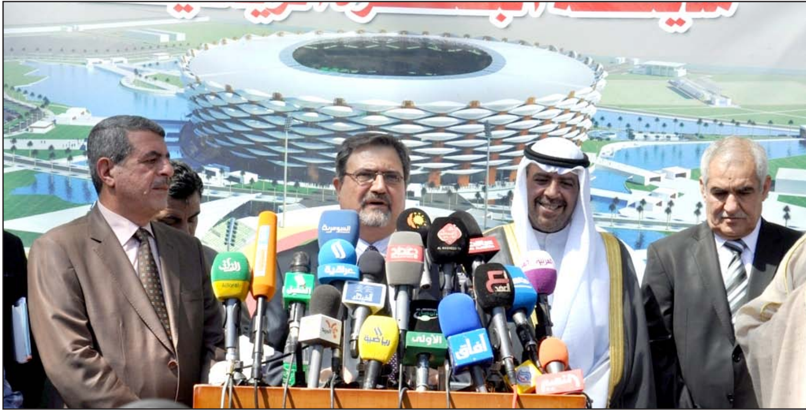
دعم خليجي متواصل لإقامة خليجي ٢٢ في مدينة البصرة