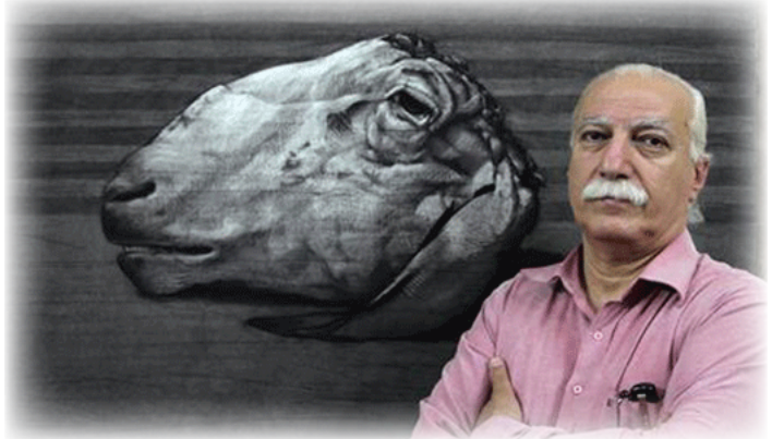
عبدلكي امام إحدى لوحاته

في تونس والقاهرة والأردن وبيروت والشارقة وديبي...، ويقنتي المتخلف البريطاني في لندن أربعة أعمال له (عشرين من عام ١٩٩٣ وعلمين من عام ٢٠٠٤) ومتحف معهد العالم العربي في باريس علمين (١٩٩٠ و١٩٩٥) ومتحف دينه لي باين Digne-Les-Bains (Museum) بفرنسا علمين من عام ١٩٨٦ كما يقنتي متحف الكويت الوطني أربعة من أعماله (٢٠٠٤) في حين يقنتي متحف عمان للفن الحديث عملا من أعماله الفنية (من عام ٢٠٠٣) بدأ عمله في الكاريكاتير منذ سنة ١٩٦٦ م، وكان ذلك بتشجيع من والده الذي أحب العمل السياسي التي أدت لاعتقاله بين العلمين ١٩٧٨ و ١٩٨٠ بسبب موافقه السياسية. كذلك رسم للأطفال في كتب للأطفال وفي مجلات للأطفال وشارك في عدة تظاهرات للرسوم الكاريكاتورية. يعد يوسف عبدلكي اليوم من أشهر فناني الحفر عند العرب، وأبرز فناني الجرافيك وتصميم الملصقات والأغلفة، والشعارات، كما يعد من الفنانين المهمين في مجال الكاريكاتير كما صدرت له عدة دراسات في الكاريكاتير العربي. حيث غامر يوسف سوريا إلى إسبانيا ثم فرنسا التي بقي فيها مُهجراً بشكل قسري قرابة ربع قرن من الزمن، ليعود في أول مرة إلى سوريا عام ٢٠٠٥، متابعاً مسيرته الضمالية والفنية من الداخل، وافتتح رسمه في دمشق.