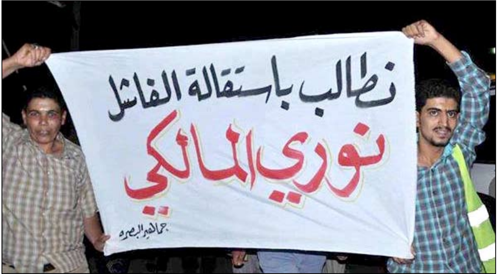
لائحة تطالب بإقالة رئيس الحكومة المالكي في البصرة

وشهد عدد من أقضية البصرة في الأسبوعين الماضيين سلسلة تظاهرات ليلية غاضبة طالب المشاركون فيها الحكومة بتوفير الخدمات ومعاقبة المسؤولين الفاشلين والمقصرين، وبعض تلك التظاهرات تضمنت إحراق إطارات السيارات وترديد هتافات تطالب بإسقاط الحكومة المركزية.