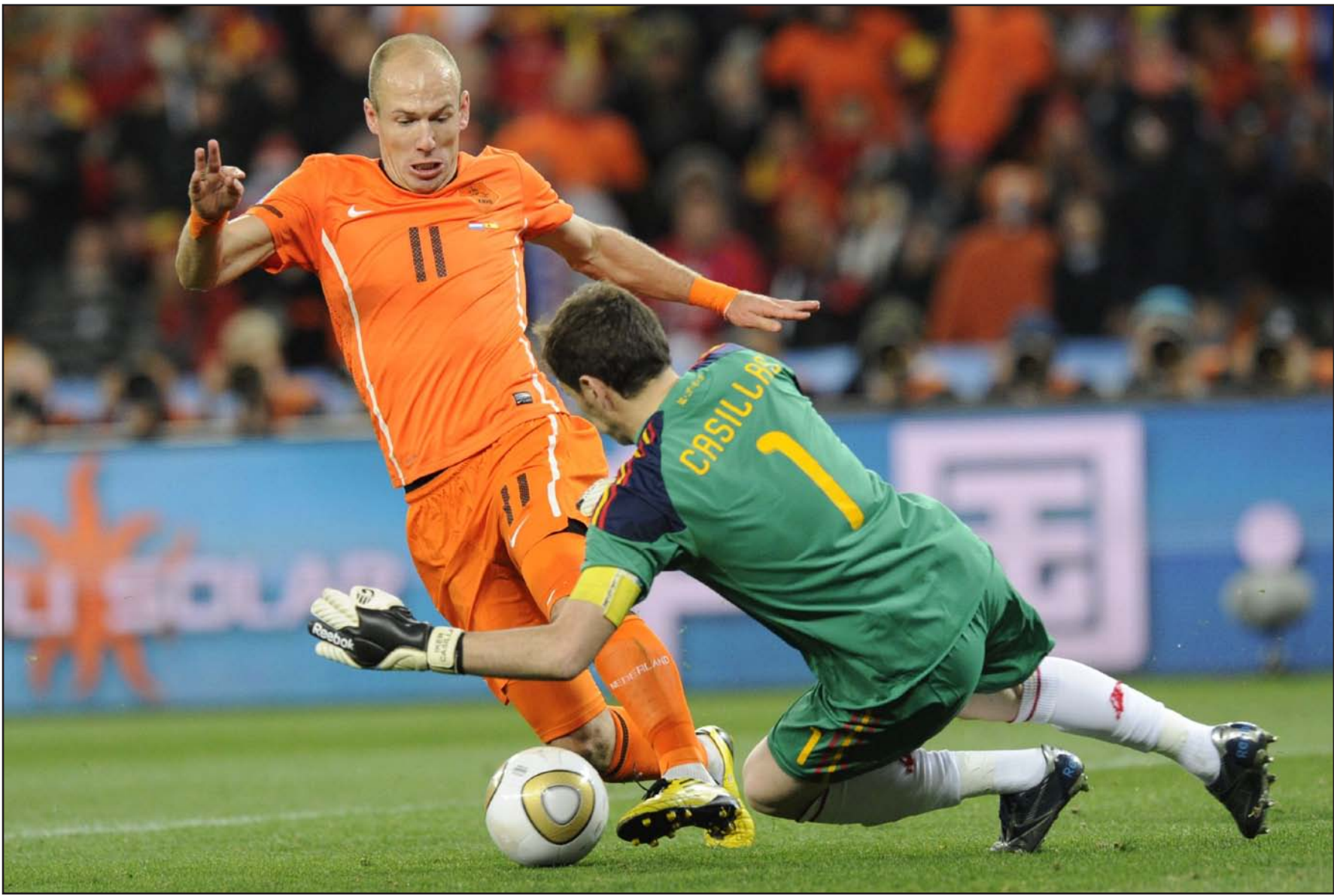
فيفا يحدد موعد كأس العالم ٢٠٢٢

سيؤثر سلباً على عقود نقل المباريات، كما رفض المدير التنفيذي لرابطة الدوري الانكليزي الممتاز ريتشارد سكامور توجه فيفا بشأن مونديال ٢٠٢٢، وقال الخميس الماضي انه يشعر بالقلق اكثر من اي وقت مضى في ما يخص هذا الموضوع خصوصا بعد الموقف الاخير لبلاتر، مضيفاً "من المؤكد اني اشعر بالقلق، نحن لسنا سخفاء، بإمكاننا ان نرى الى اين تتوجه الامور". وتشير جميع الأجواء والمواقف الى التوجه لإقامة مونديال ٢٠٢٢ في