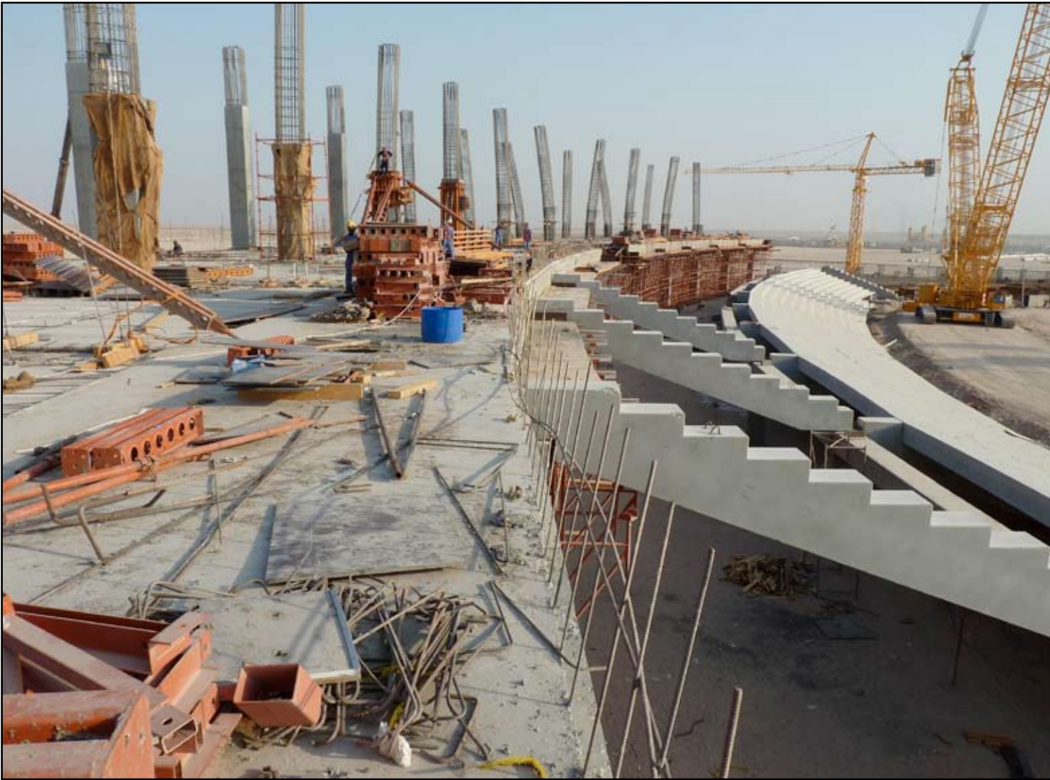
مشروع استثماري غير متكامل.