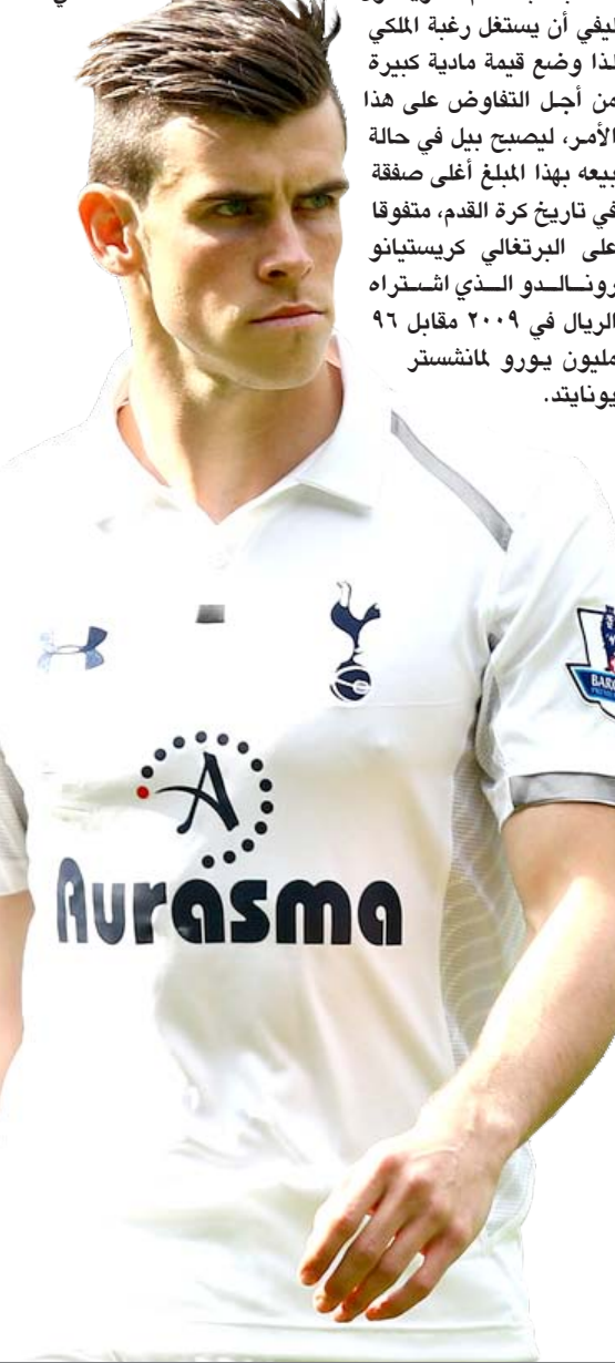
توتنهام يرفع سعر انتقال بيل إلى الريال

وترى (أسس) أن النادي الملكي بإمكانه قبول ضم بيل مقابل ١٠٠ مليون يورو وإبراج لاعب آخر في الصفقة مثل الأرجنتيني أنخل دي ماريا، الذي ضمه الريال من بنفيكا مليون يورو لبيع نجمه الويلزي غاريث بيل. وأضافت الصحيفة أن رئيس نادي توتنهام دانييل ليفي يعي جيدا أن رئيس ريال مدريد الإسباني فلورنتينو بيريز، يرغب في ضم بيل ويعد التعاقد معه بمثابة حلم له. ويحاول ليفي أن يستغل رغبة الملكي لذا وضع قيمة مادية كبيرة من أجل التفاوض على هذا الأمر، ليصبح بيل في حالة بيعه بهذا المبلغ أعلى صفقة في تاريخ كرة القدم، متغفقا على البرتغالي كريستيانو رونالدو الذي اشتره الريال في ٢٠٠٩ مقابل ٩٦ مليون يورو مانشستر يونايتد.