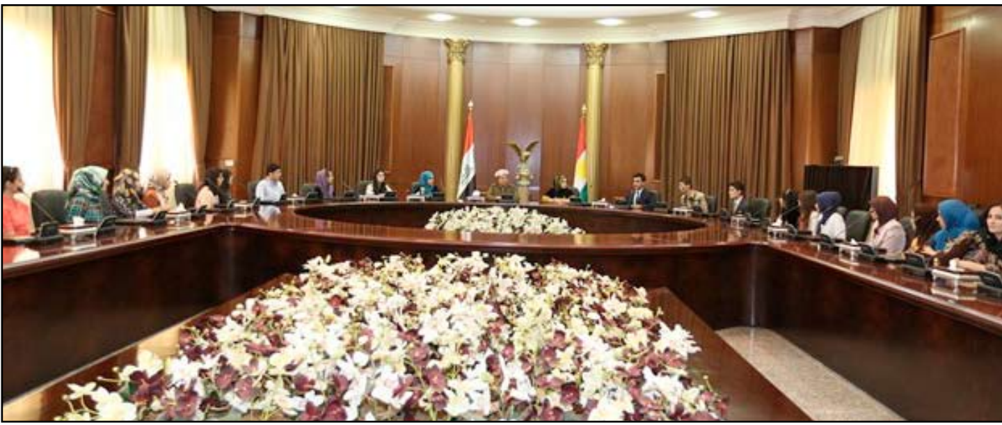
بارزاني اثناء لقائه مع الطلبة

تشهدهما كردستان في حين شهد نهاية اللقاء تكريم بارزاني لكافة الطلبة الأوائل في الإقليم . من جهة أخرى اجتمع رئيس إقليم كردستان مسعود بارزاني، باللجنة التحضيرية للمؤتمر القومي الكردي للاطلاع على المراحل الأولية لعمل اللجنة . وطالب بارزاني في بيان أصدرته رئاسة كردستان من كافة الأطراف "بأن يعملوا كممثلين للأمة الكردية وليس ممثلين لأحزابهم وقواهم السياسية". وأكد على أن يضع الجميع المصلحة القومية العليا نصب أعينهم ويعملوا بروح فريق واحد ولا يحاول أي طرف