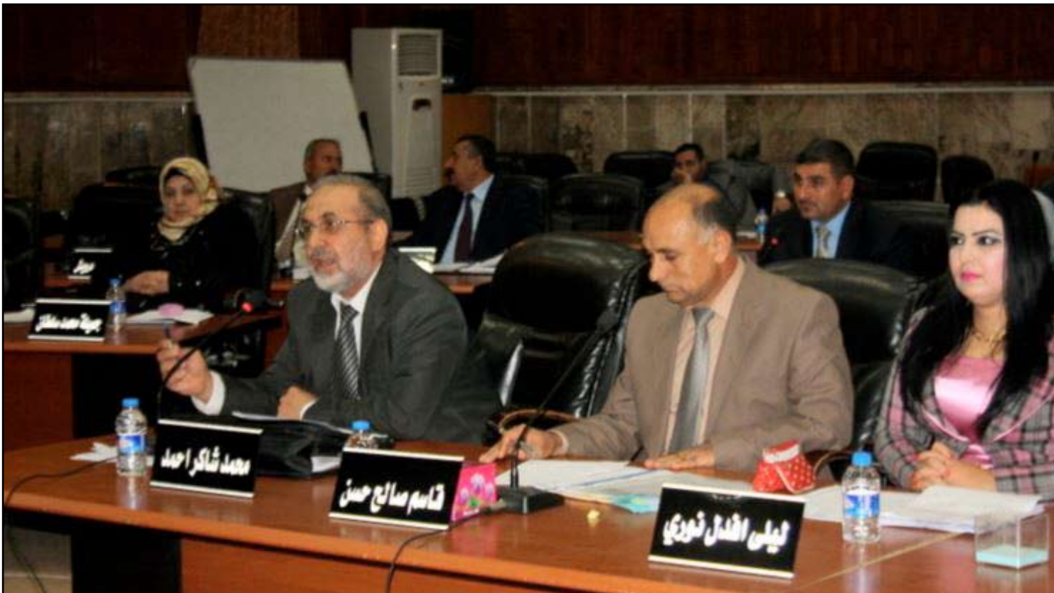
جانب من جلسة مجلس محافظة نينوى السابق... أرشيف

دعا مواطنوالموصل الكتل السياسية الفائزة بمجلس المحافظة الجديد إلى الاهتمام بالجانب الخدمي، وعدم الانجرار وراء التجاذبات والصراعات السياسية، متهمين المجلس السابق بإثارة الزامات التي أثرت على المشاركة في الانتخابات .