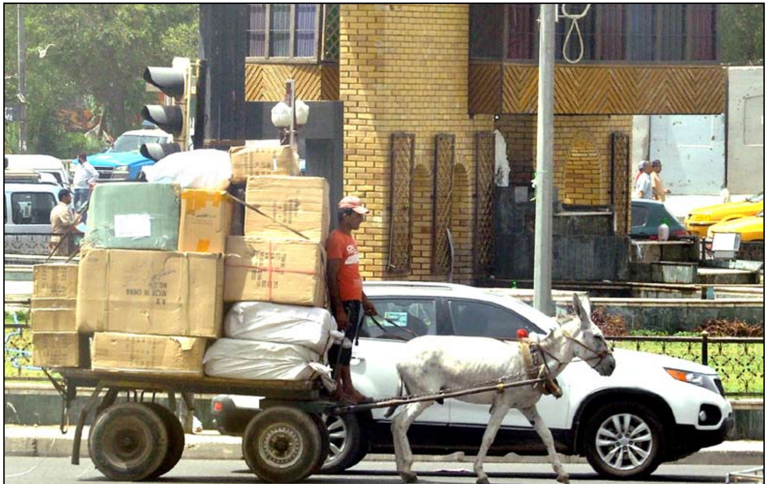
ساحة الخلائي ٢٥-٧-٢٠١٣..