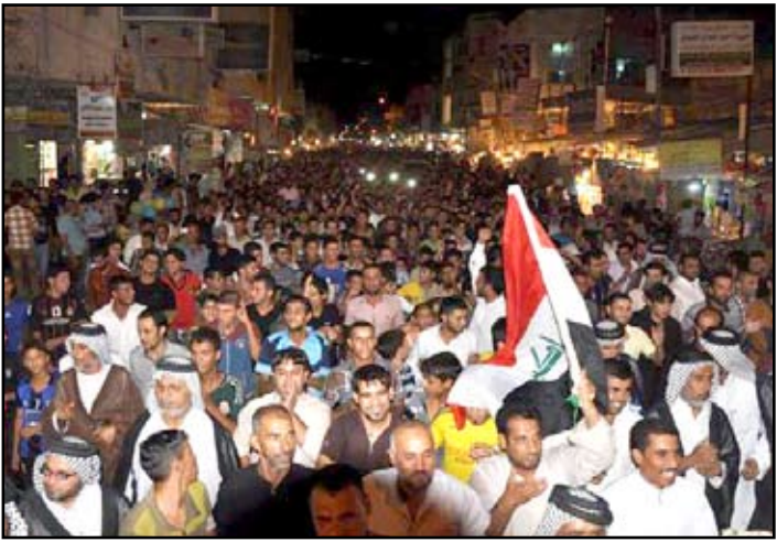
متظاهرو ذي قار ينددون بسياسة الحكومة في الملفات الخدمية

وكان العشرات من الشباب الناشطين في محافظة ذي قار، أعلنوا، في (١) حزيران ٢٠١٣) عن تنظيم اعتصام مفتوح، في ساحة الجبوري ووسط الناصرية، للمطالبة بتوفير الكهرباء وتحسين الخدمات وإطلاق سراح أحد زملائهم الذي اعتقل على إثر تقديم طلب بالموافقة على الاعتصام.