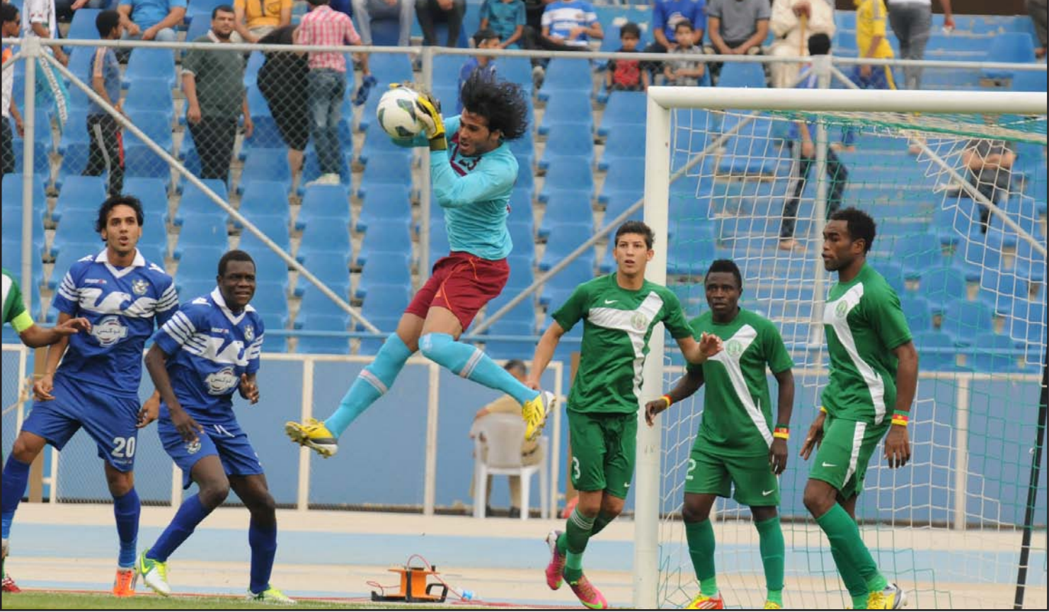
الشركة يسمى للظفر بلقب النخبة

× ما الشيء الذي شاهدته في البرازيل و تحاول أن تطبقه في الشرطة؟ . لقد قمت بزيارة البرازيل، لأن ظروفها تشبه إلى حد ما ظروف العراق، لأنه لا يوجد هناك تقنيات متطورة في عالم كرة القدم، إضافة إلى أن كرة القدم العراقية تحاكي نظيرتها البرازيلية، فأنا أعتقد أنسب شيء للكرة العراقية هو المدرب البرازيلي والمدرسة البرازيلية، لذلك سنحاول أن نجتهد من أجل تطبيق الأشياء الجيدة الموجودة في الملاعب البرازيلية في ملاعبنا وبالقدر المستطاع.