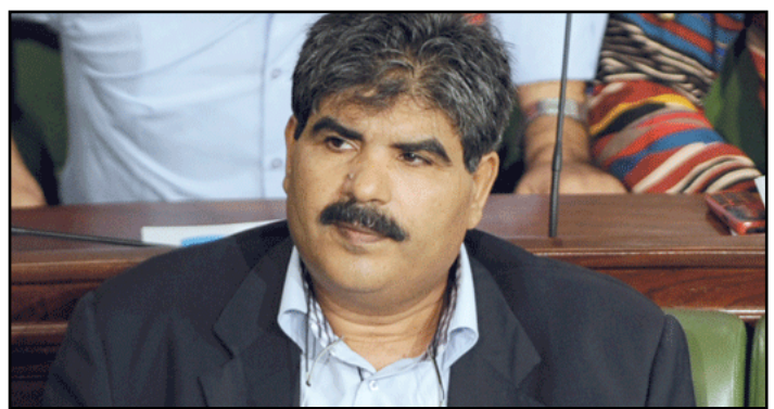
النائب اليساري المعارض محمد البراهمي

وقال مصدر ملاحى لوكالة فرانس برس، إن كل رحلات شركة الخطوط الجوية التونسية وفرعها الخطوط الجوية التونسية السريعة ألغيت الجمعة، ولم تقلع أي طائرة، تلبية لدعوة الاتحاد العام التونسي للشغل (المركزية النقابية)، وأضاف أن شركات الطيران "أير فرانس" و"اليتاليا" و"بريتش إيروييز" ألغت رحلاتها من تونس وإليها بسبب