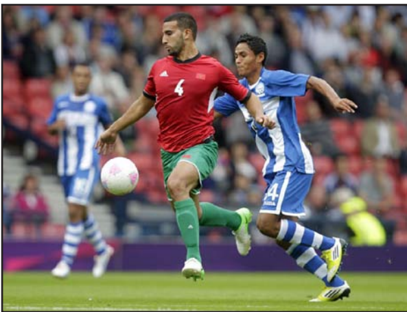
هندوراس يسعى للظفر بنقاط مباراة المكسيك

وتتأهل عن هذه التصفيات ثلاثة منتخبات بشكل مباشر إلى البرازيل ٢٠١٤، بينما سيخوض صاحب المركز الرابع مواجهة فاصلة أمام نيوزيلندا ممثلة الأوقيانوس.