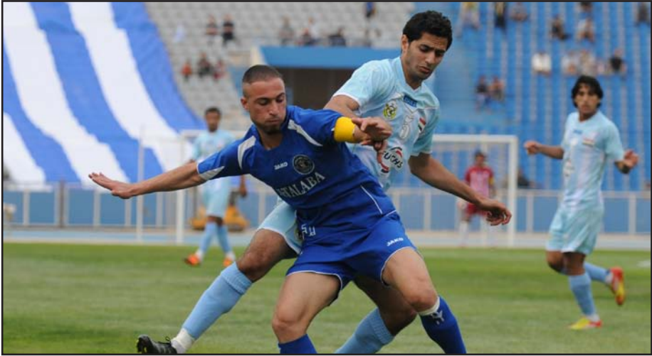
الجوية يهزم الطلبة في ديربي الشعب

وبهذه النتيجة وصل فريق الجوية الي النقطة ٥٢ في المركز الثالث مع امتلاكه ثلاث مباريات مؤجلة فيما بقي رصيد الطلبة عند النقطة ٢٨ في المركز الرابع عشر.