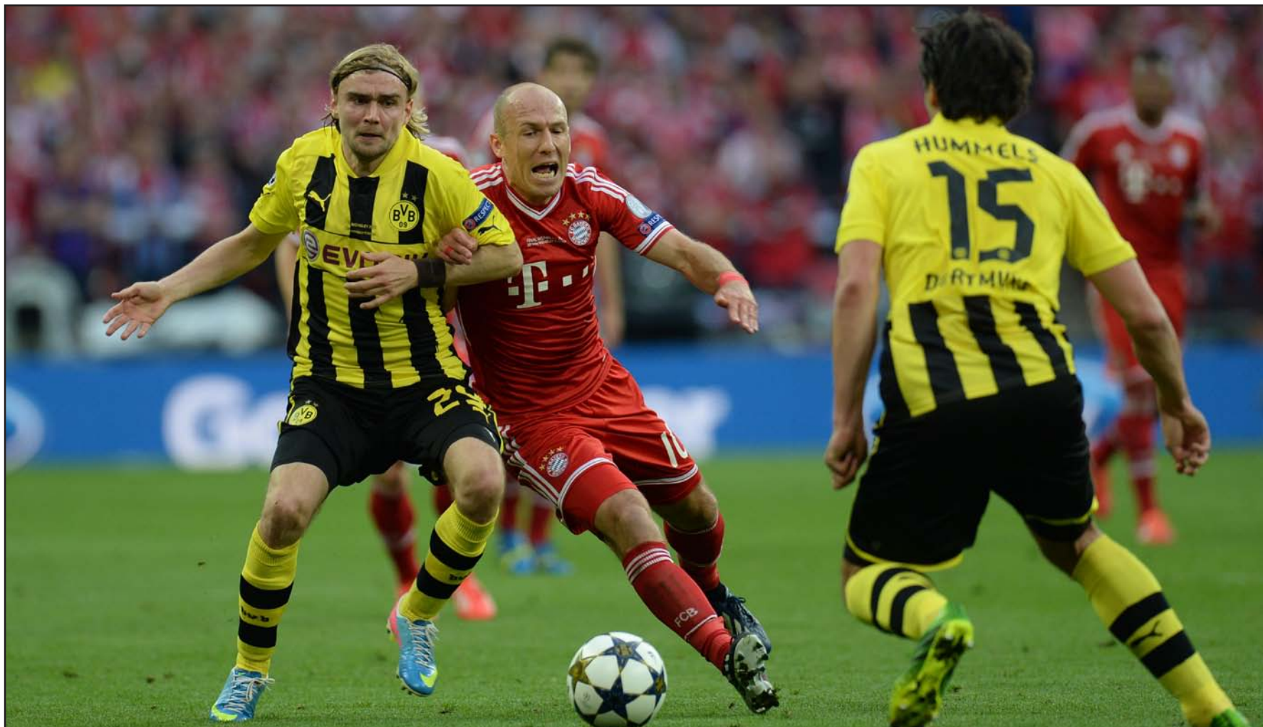
دورتموند يطمح بالثأر من البايرن في بطولة السوبر الألماني

ويحظى لقاء كأس السوبر الألماني باهتمام بالغ في كل أنحاء العالم. وقال أندرياس رينج المدير التنفيذي لرابطة الدوري الألماني "المباراة سبقت إلى ١٩٥ دولة ولم يعد متبقيا لها سوى ٢٠٠٠ تذكرة لحضورها".