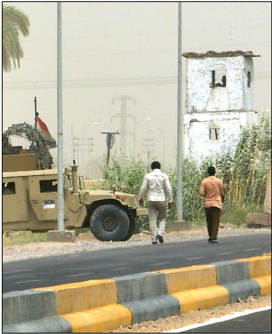
مواطنان يسيران قرب سجن أبو غريب.