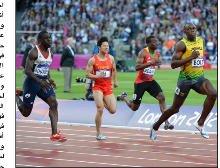
بولت يبرأ نفسه من فضائح المنشطات

للمنشطات بجانب العداء الأمريكي تايسون جاي ومواطنيه أسافا باول وشيرون سيمبسون. وتأتي تصريحات بولت في ظل اعتقاد كثير من المراقبين بأنه مدان خاصة بعد سقوط العدائين الكبار الآخرين في اختبار المنشطات كما جاءت اختبارات مواطنيه أيضا إيجابية.