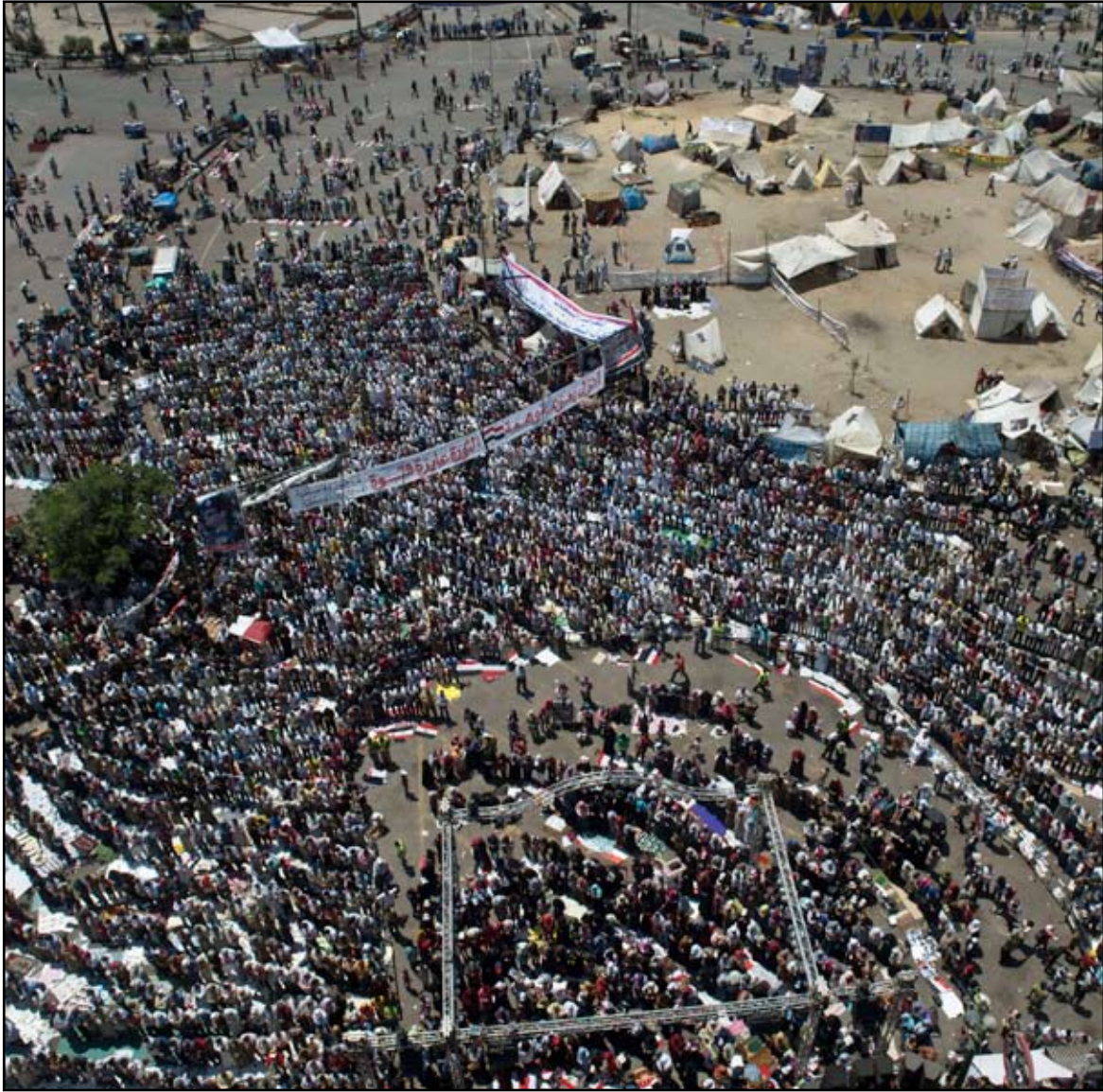
الملايين يتظاهرون تأييداً لدعوة وزير الدفاع (أ.غ.ب) ←

تقديم العون للجماعة وللرئيس المعزول محمد مرسي.