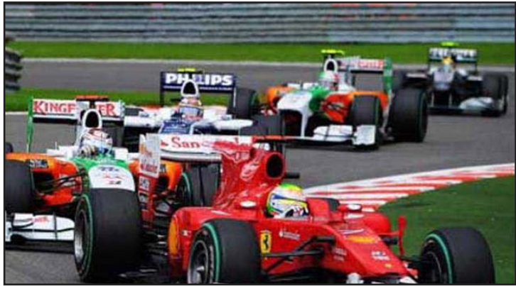
تدبير جديدة للأمان في سباقات فورمولا وان

وبدءاً من سباق المجر فإن أي سائق يخرج من حارة الصيانة بينما أحد اطارات سيارته غير مثبت جيداً فسوف يعاقب بالتراجع عشرة مراكز