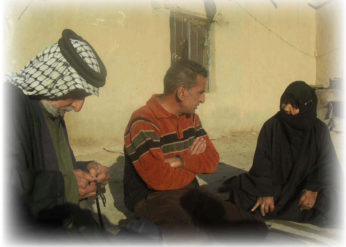
المرح بين عوف وزوجته