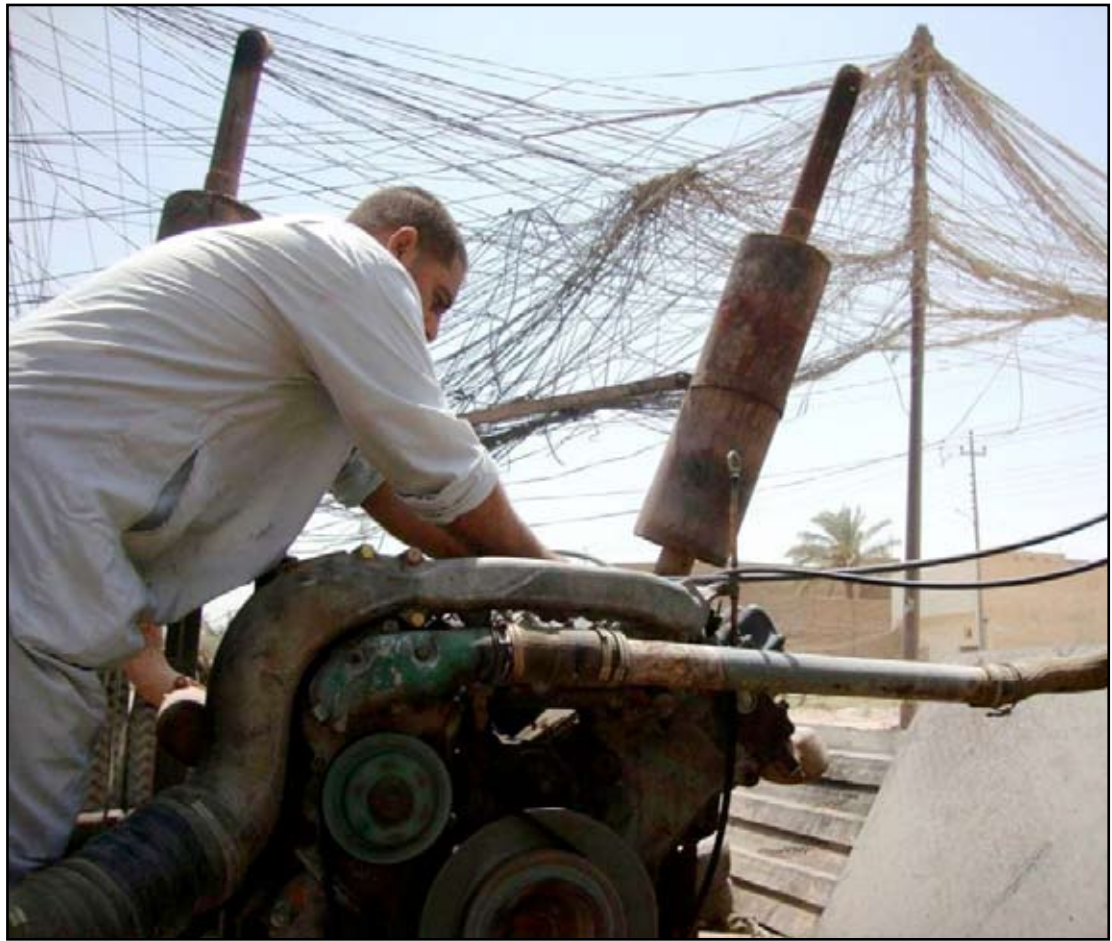
صاحب مولدة اهلية .. (أرشيف)