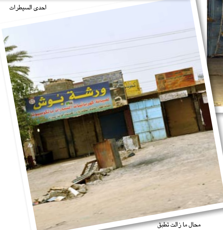
مجال ما زالت تطبق حظر التجوال طواعية

حدث الامر وماهي الاجراءات المتخذة، بل ذهب بالحديث عن اتهام الجماعات التي حاربها في بغداد والبصرة بحسب قوله، متجاهلا ما حدث من انهيار امني كبير تمثل بما يشبه إصدار عفو رسمي من قبل القاعدة لمجرميها على مرأى ومسمع من قوات الحكومة، وهذا ما يعطي حافزا كبيرا للمجرم بانة حتى وان القى القبض عليه فعاجلا ام اجلا سيطلق سراحه بفضل أخوته من المجرمين، وهذا ماجاء في بيان القاعدة الذي نشر على موقع حنين المعني بنشر أخبارها حيث ذكر البيان "ان العلية جاءت استجابة لنداء الشيخ المجاهد ابي بكر البغدادي حفظه الله في ان تختتم خطة (هدم الاسوار) التي بدأت قبل عام من اليوم بغزوة نوعية تتهر الطواغيت المرتدين وتكسر القيود وتحرر الاسود الرابضة في غياهب السجون"، وعلن التنظيم عن "تحرير المئات من اسرى المسلمين بينهم ما يزيد على (٥٠٠) مجاهد من خيرة من ولدتهم الأرحام".