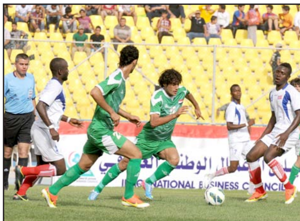
جهود عراقية لاقناع فيفا لرفع الحظر على الملاعب العراقية

تم التغلب على هذه المعايير فإن العراق سيعود لاحتضان المباريات الرسمية على أرضه. وتابع: نحن بإمكاننا أن نقيم الدورة من دون موافقة (فيفا) كونها دورة لا تنضوي تحت مظلة الاتحاد الدولي ، لكننا لا نريد التقاطع مع العالم، حيث نسعى لرفع التعليق المفروض على تضيق العراق للمباريات الرسمية.