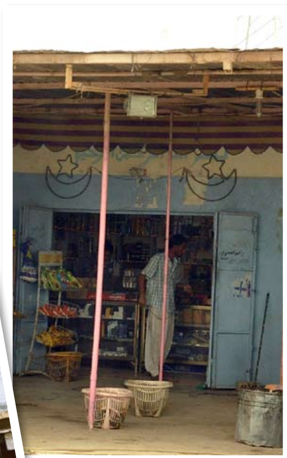
اسواق فتحت ابوابها بعد الكارثة

وصلنا بعد رفع حظر التجوال بساعات عن المنطقة والذي استمر من ليلة الأحد الماضي حتى منتصف ظهيرة الخميس،