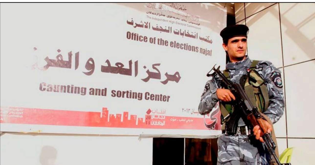
شرطي يقوم بحماية أحد المراكز الانتخابية

شمولين بالترقيات التي لا تحسب إلا بواسطات ورشا وأموال"، وكشف أن "شقيق العذاري، وهو يعمل بمكتبته، فاسد ويقوم بعملية تنقلات المنتسبين من مكان الى آخر عن طريق الأموال"، مؤكداً أن