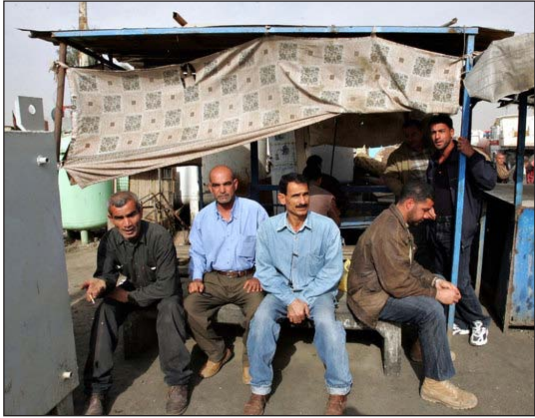
العراقيون يواجهون الصعوبات في الحصول على لمة العيش وملياراتهم تهرب إلى الخارج