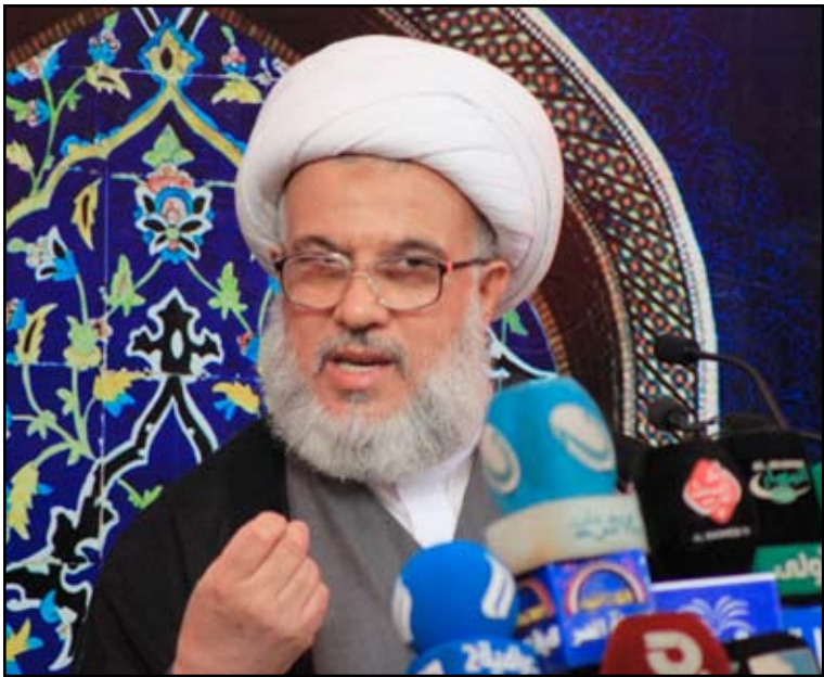
عبد المهدي الكربلائي

وأطلق القبانجي "مبادرة تشمل تسليم المؤسسة الأمنية الى منظمة بدر لانهم يمتلكون الإخلاص والتضحية والكفاءة"، موضحا أن "المؤسسة الأمنية اليوم تشهد الكثير من علامات الاستفهام وهذا ما أوصلنا الى هذه الأحداث". وعلى صعيد آخر، قال القبانجي "نحن ننتظر موقفا من وزارة الخارجية بحق نائب السفير العراقي في السعودية معد العبيدي"، معلنا رفضه أن "تمرر هذه القضية بمجرد استعفاء أم يحول العبيدي الى موقع وسفارة أفضل من السفارة الحالية"، لافتا إلى "إننا ننظر موقفا سريعا أمام الراي العام". ودعا القبانجي المسؤولين إلى "الاستماع للمتظاهرين في الجنوب بمحبة وصق بعيدا عن التسييس، وخطاب مسؤولي الدولة "استجيبوا لمطالب الشعب واعترفوا ان الشعب يعيش في مأساة".