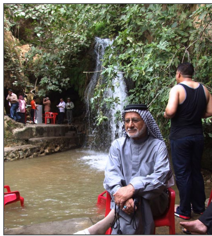
قلبه في بغداد