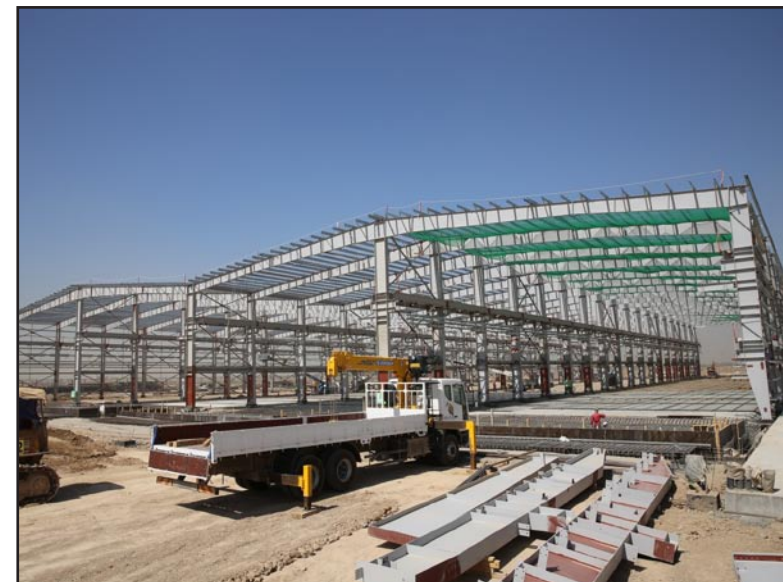
هذا المعمل مخصص لانتاج الألواح /السقوف، وقد تم استكمال تثبيت الهياكل الحديدية الآن. سيتم إنتاج الألواح خلال النصف الأول من العام القادم.

يجري حاليا العمل على بناء أكبر معمل للخرسانة مسبقة الصب PC Plant في العالم في موقع مشروع مدينة بسماية الجديدة. فقد تم تقريبا استكمال الاعمال المتعلقة بانتاج الاطارات الحديدية، والمواد اللازمة للجدران الخارجية ويجري العمل على تركيب المعدات الثقيلة مثل السائلوات والرافعات من قبل مهندسين محترفين في هذا المجال. واعتبارا من العام المقبل، سيكون معمل الخرسانة مسبقة الصب قادرا على انتاج كميات ضخمة من الجدران الخرسانية الخاصة بمباني مدينة بسماية الجديدة. كما ويجري العمل حاليا على بناء هذا المعمل من قبل شركة هانوا للهندسة والانشاءات، وهي الشركة الأشهر في مجال الصناعات الهندسية والانشائية في كوريا. وقد اجرت شركة هانوا للهندسة والانشاءات دراسة متأنية لفترة طويلة تتعلق ببناء (١٠٠٠٠) وحدة سكنية، وخلصت الى ان اسلوب الخرسانة مسبقة الصب هو الاسلوب الأمثل لبناء اعداد كبيرة من الوحدات السكنية ضمن ميزانية محددة وإطار زمني مرسوم. يعتبر أسلوب البناء الجاهز (الخرسانة مسبقة الصب) الاسلوب العصري الأكثر حداثة، إذ يتم سبك الاجزاء الكونكرتية ومعالجتها داخل المعمل ثم جمعها في موقع البناء، وهذه التكنولوجيا الحديثة تتيح انتاج ألواح وجدران لبناء (٨٠) وحدة سكنية في اليوم الواحد و(٢٠٠٠) وحدة سنويا. ومن شأن هذا المعمل ان ينتج (٦.٤٠٠) طن من الخرسانة يوميا كعمد، وهو ما يقارب الكميات التي تحملها (٤٣٠) شاحنة خباطة ويبلغ الطول الإجمالي للخرسانة المستخدمة في المشروع برتمته بحوالي (١٣٠٠٠) كم، أي ما يعادل المسافة بين بغداد وسيئول في كوريا. وفي هذا السياق، تحدث السيد "جيو لي"، المدير التنفيذي والمسؤول عن بناء معمل الخرسانة قائلا، "ان جميع موظفي شركة هانوا، وأنا من بينهم،