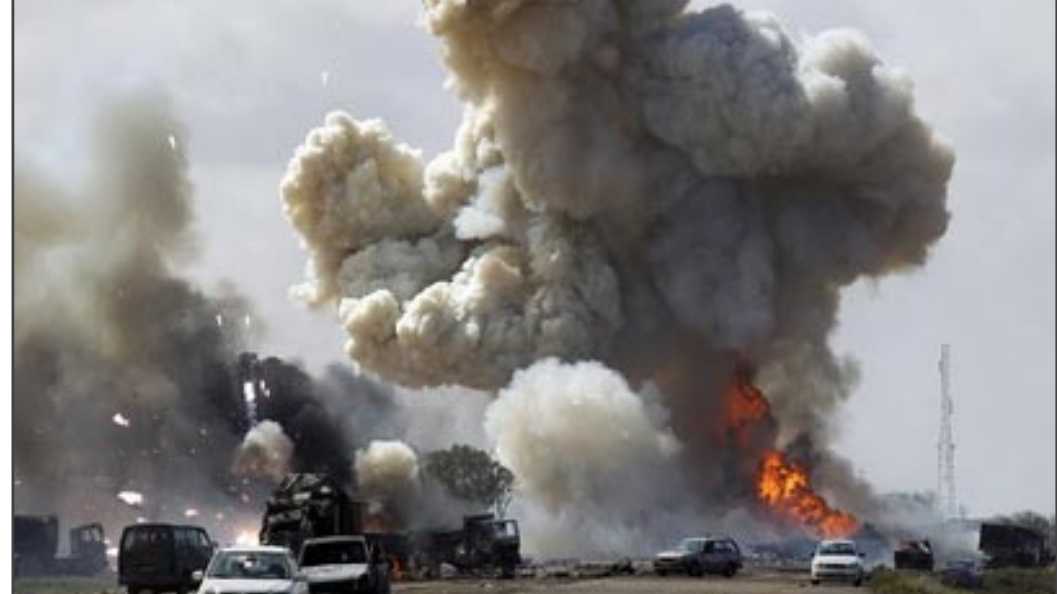
احد التفجيرات الارهابية