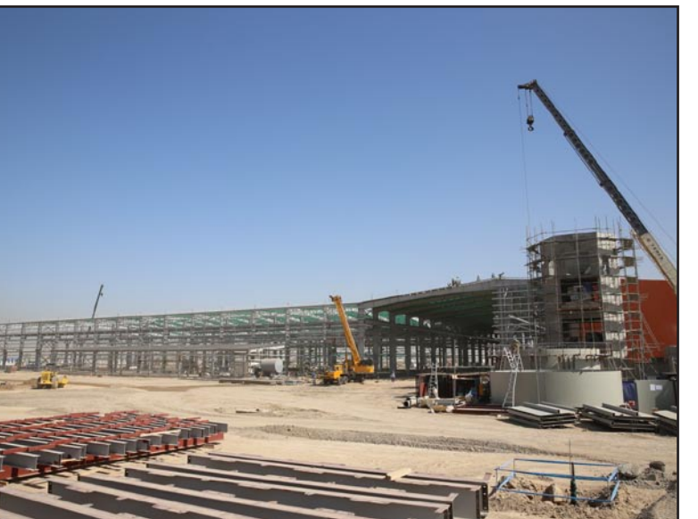
هذا المعمل مخصص لانتاج الجدران الخارجية. وتم بناء هياكله الحديدية ويجري حاليا تركيب جدرانه الخارجية، وسيكون جاهزا للعمل في النصف الأول من العام المقبل.