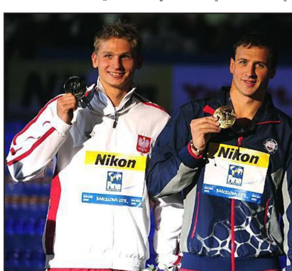
لوكتي يواصل حصد الميداليات في بطولة العالم

وتوج لوكتي بالميدالية الذهبية لسباق ١٠٠ متر ظهر كما فاز مع الفريق الأمريكي بسباق ٤ × ٢٠٠ متر تتابع حر وتأهل لنهائي سباق ١٠٠ متر فراشة. وأحرز لوكتي لقبه العالمي الثالث في سباق ٢٠٠ متر ظهر حيث فاز بالسباق اليوم قاطعا المسافة في دقيقة واحدة و٥٢,٧٩ ثانية، وكانت الفضية من نصيب البولندي رادوسلاف كافيتي الذي حل ثانياً بفارق ٠,٤٥ ثانية خلف لوكتي، بينما جاء الأمريكي الآخر تايلر كلاري ثالثاً وفاز بالميدالية البرونزية.