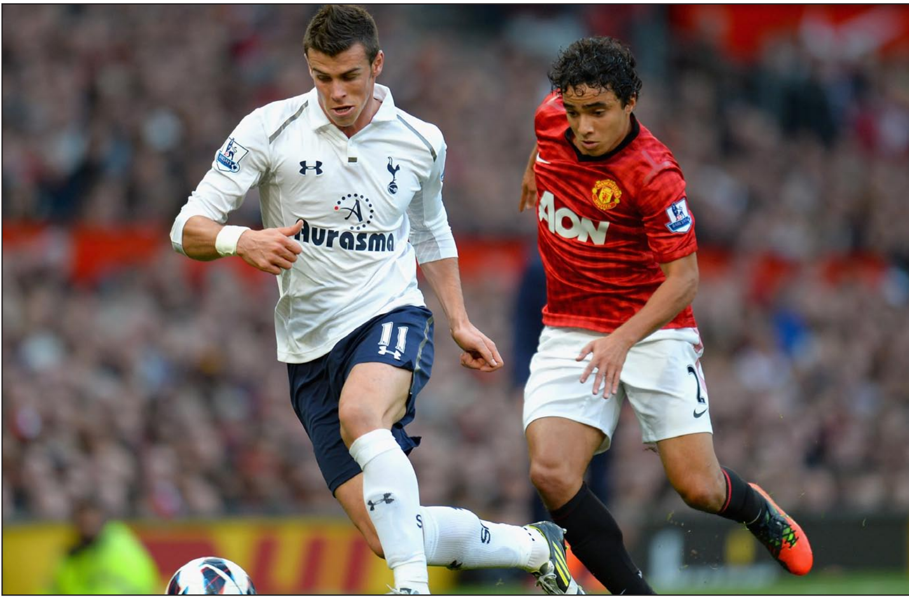
ريال مدريد يضم غاريت بيل إلى صفوفه مقابل ١٢٠ مليون يورو

ومن جهته رأى الفرنسي أرسين فينغر مدرب نادي أرسنال الإنكليزي أنه في حال توقيع الويلزي غاريت بيل لاعب