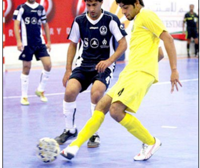
جانب من إحدى مباريات الكرخ في دوري الخماسي

بناءً للقرار المجحف الذي اتخذته لجنة خماسي الكرة في الاتحاد المركزي والقاضي بتحديد قاعة الكوفة لإقامة المباراة النهائية لدوري العراق بخماسي الكرة بين نادبي الكرخ ونظ