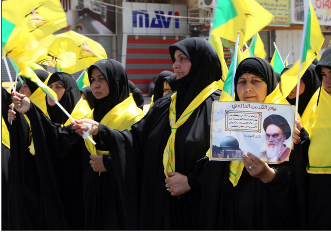
عراقيات يرفعن صور الخميني خلال تظاهرات يوم القدس.. أ.ف.ب

حمل التيار الصدري، امس السبت، حركة عصائب اهل الحق مسؤولة الاشتبكات العنيفة التي شهدتها مدينة الصدر مساء الجمعة، وعبر عن خشيته من ان يكون "افتعال الشجارات" وسيلة لجزّ تياره الى مواجهة عسكرية مع القوات الحكومية، دون ان يخفي نائب الجناح المنشق صور قيادات إيرانية في بغداد، وسط نفي لصلة ذلك بالنزاع الذي أدى الى وقوع قتيلين.