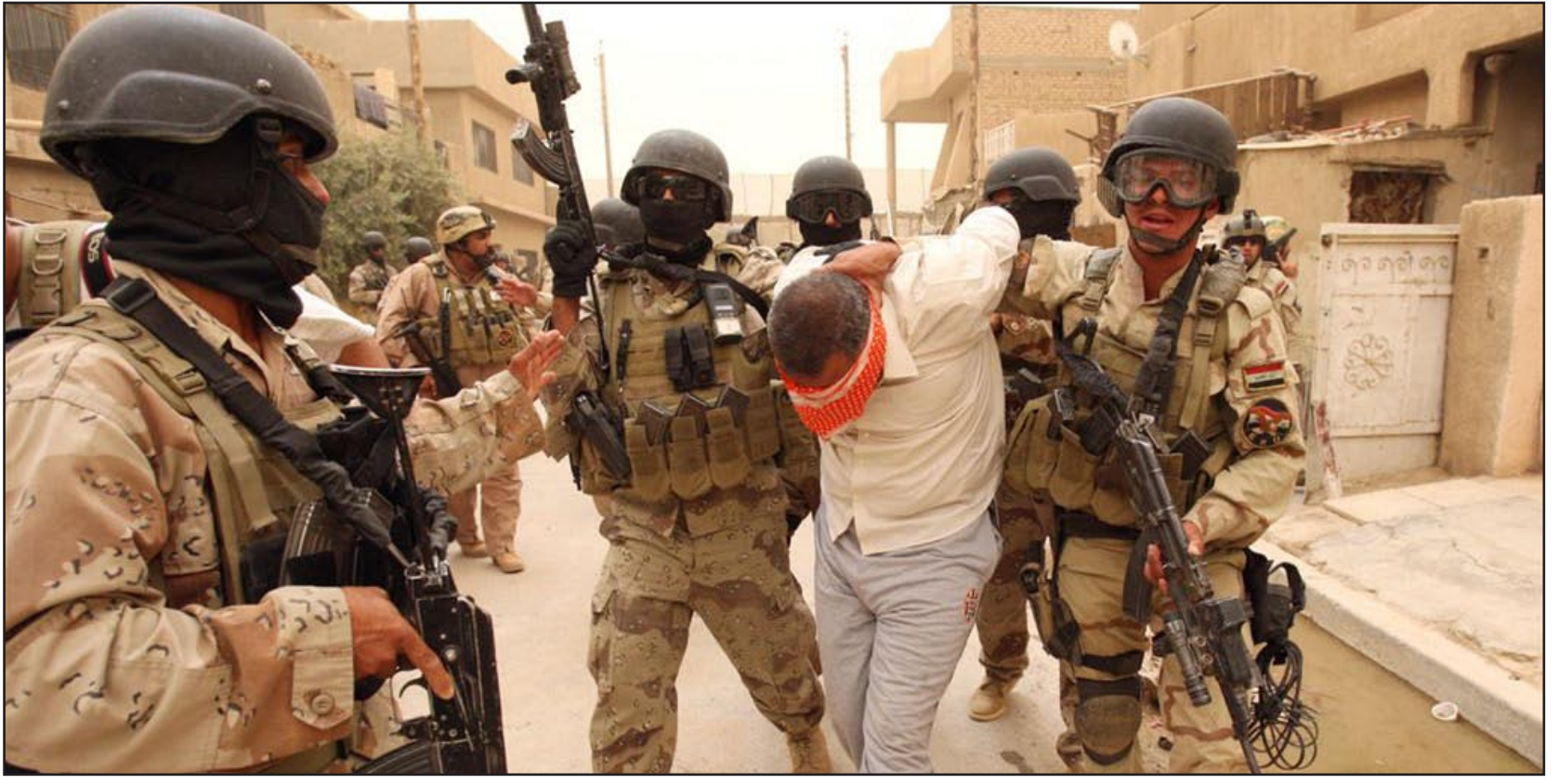
عناصر من الجيش يلقون القبض على مشتبه به في بغداد - ارشيف