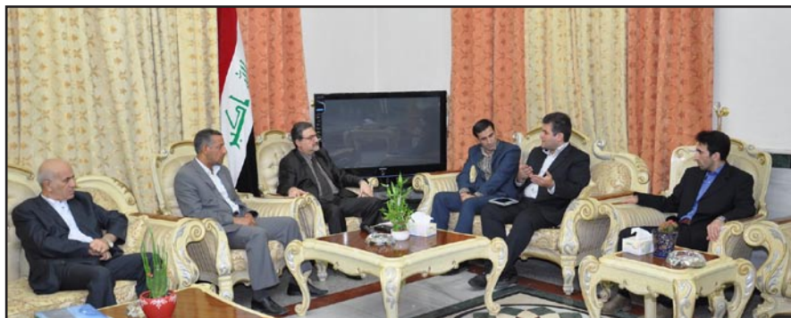
وزير الشباب يستقبل وفد اتحاد الطب الرياضي الإيراني

وستقوم الوزارة بإيفاد عدد من موظفي الوزارة من خريجي كليات التربية الرياضية/ قسم الفسلفة وايضا ايفاد عدد من الشباب والشابات من خريجي كليات التمريض ، ايفادهم جميعا الى ايران وزجهجهم في دورات الـ ١٠٠ ساعة من اجل تهيئة معالجين رياضيين.