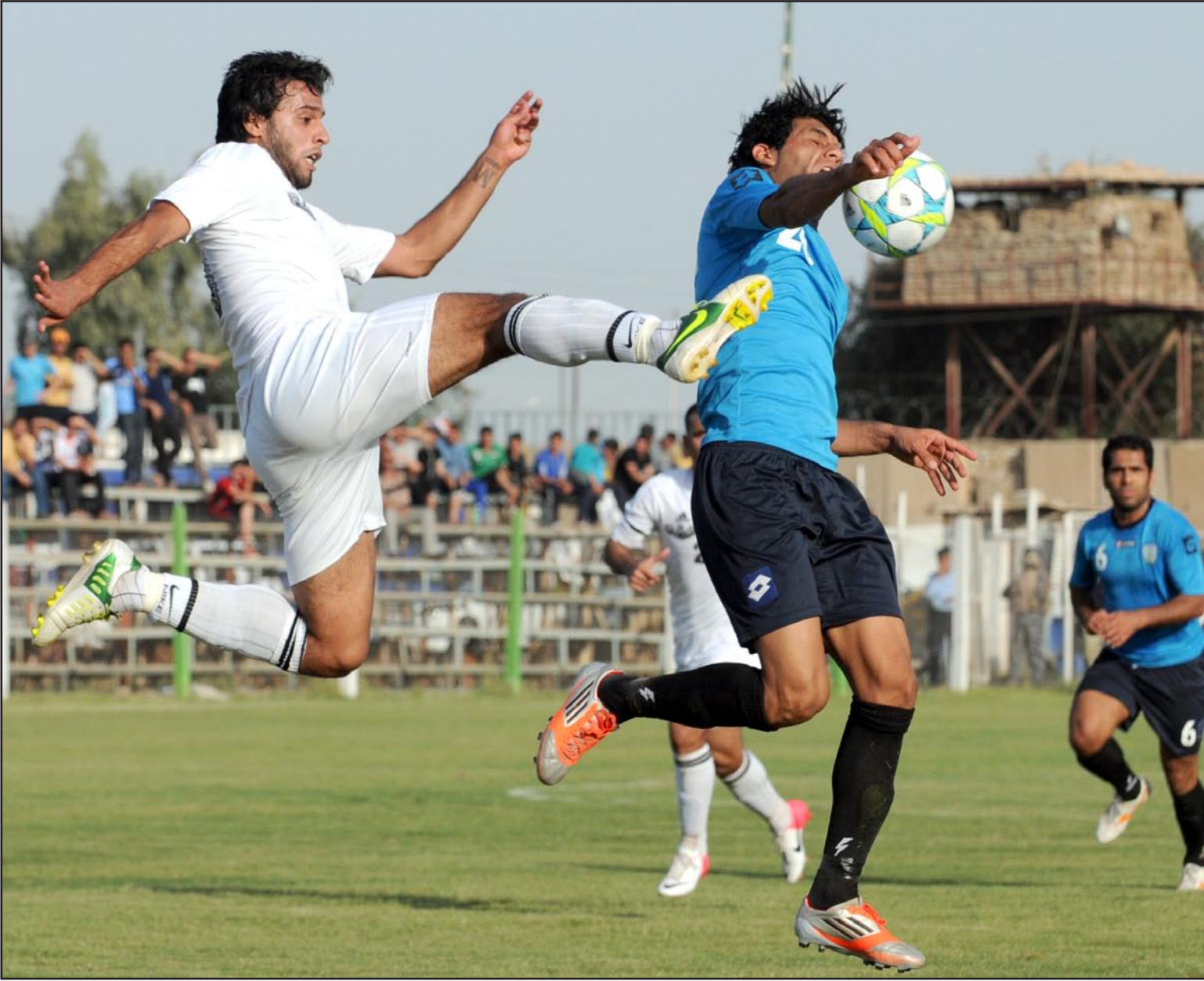
نظف الجنوب يواجه كربلاء على ملعبه في افتتاح الجولة ١٤ من المرحلة الثانية لدوري النخبة

لاعتلاء قمة النخبة باحتلاله مركز الوصافة برصيد ٦٠ نقطة يحاول جاهداً لأجل حسم المنازلة لصالحه خصوصا ان خصمه يشهد تواضع نتائجه خلال المباريات الاخيرة التي خسر آخر مباراتين امام فريقى دهوك وبغداد . ويلتقي في المباراة الثانية فريقا الجوية والنجف على ملعب الجوية ، وهذه المباراة من الممكن ان ترجح كفة صاحب الارض وبموجب نتائجه ضمن فرق المقدمة خصوصا انه حامل لقب بطولة العالم العسكرية ، فيما يحاول فريق النجف مواصلة نتائجه الايجابية الاخيرة بعد ان تجاوز محنته وان كان ضمن الفرق المهتدة بالهبوط .