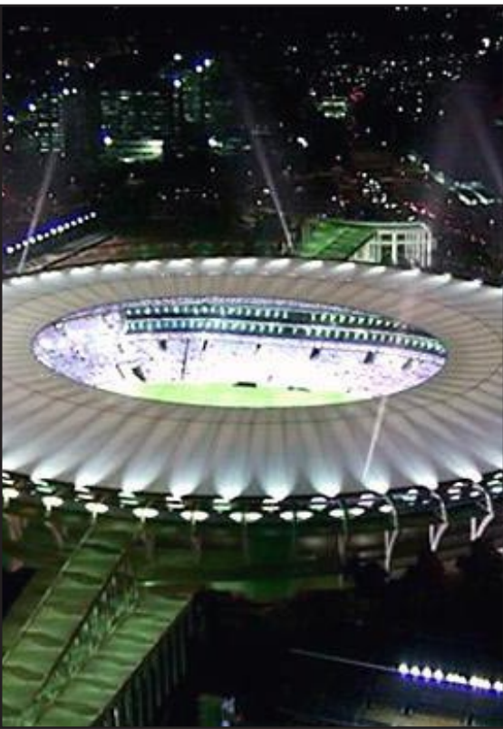
ملعب ماراكانا يحضن نهائي مونديال ٢٠١٤

التي شهدتها البرازيل خلال بطولة كأس القارات، التي أقيمت خلال الفترة من ١٥ إلى ٣٠ حزيران. ويضاف وقف هذا القرار إلى إجراءات آخرين يتطلبان تغييراً في خطط حكومة ريو دي جانيرو فيما يتعلق بالاعمال المرتبطة بأحداث رياضية كبرى تستعد البلاد لتضييفها.