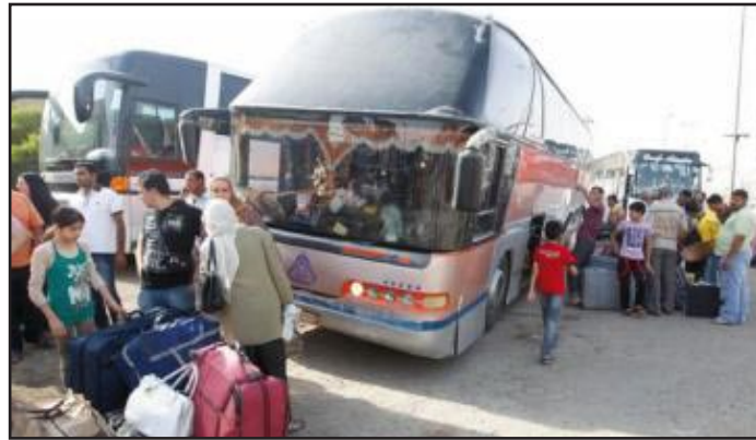
مركبة لاحد مكاتب السياحة

عيد باية حال عدت يا عيد... بما مضى أم بأثر فيك تجديدي لم يترك الدهر من قلبي ولا كبدي... شيئا تقممه عين ولا جديدي أصخرة أنا، مالي لا تحركني... هذي المدام ولاهذي الزغاريدي