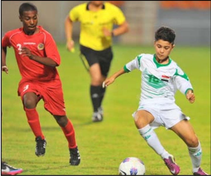
مواجهة صعبة لليوث الرافدين امام كورية الجنوبية

الاعباب الآسيوية الثانية للشباب والمؤلفة من ٩٤ شخصا بين لاعب ومدرب واداري يمثلون تسعة اتصالات هي: كرة القدم والمبارزة ورفع الأثقال والسباحة والريشة الطائرة والرماية والعباب القوى وكرة