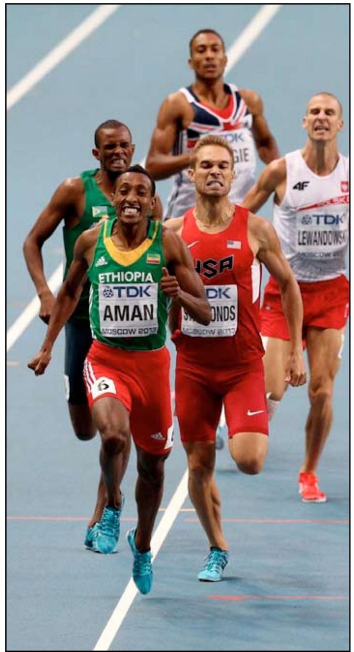
أمان يمنح إثيوبيا ميدالية ذهبية