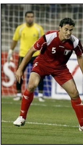
موقعة ساخنة بين الأردن وسوريا في طهران

ويتشابه حال المنتخبين بالقيادة الفنية الجديدة، فحسام حسن تولى مهمته خلفا للعراقي عدنان حمد ، في حين تسلم أنس