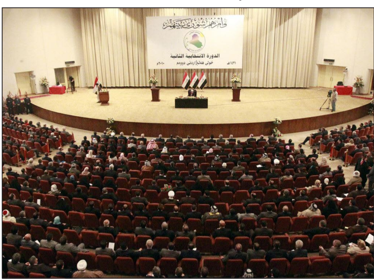
الجلسة الاولى للبرلمان في دورته التشريعية الحالية - ارشيف

واضاف أن "الامر يحتاج إلى إعادة هيكلة الحكومة لتشكيل جيش يكون مهمته حماية امن العراق لا ان تكون هناك تجاوز على الصلاحيات"، ولفت إلى أن الجميع سيقف ضد طلب اعلان حالة الطوارئ".