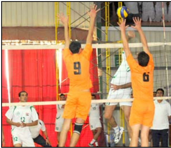
الطائرة العراقية تشارك في بطولة العرب للناشئين