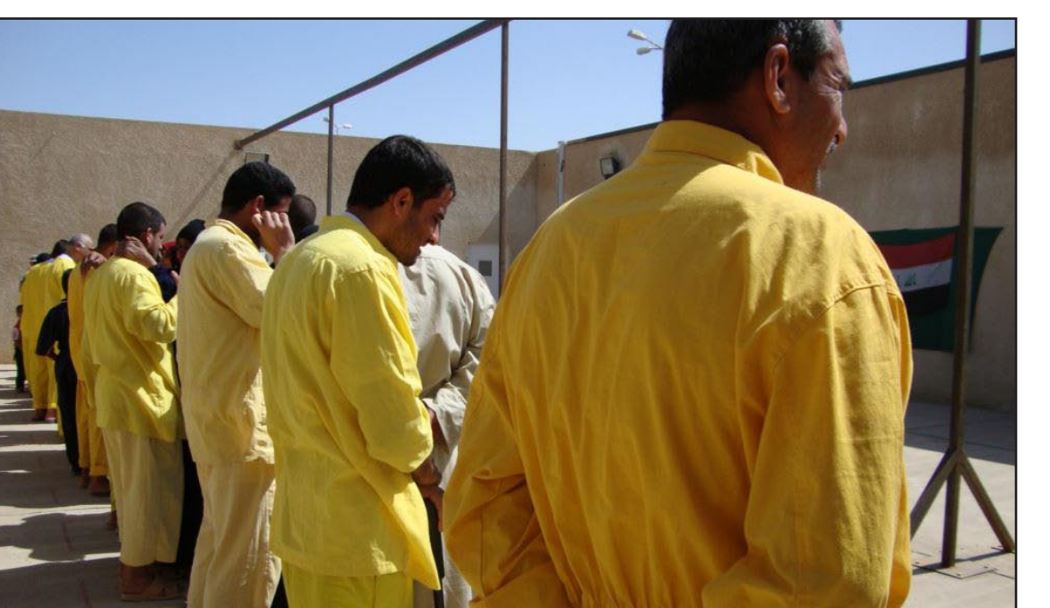
سجناء يتحدون مع نوريهم

وأضاف القيادي في الحزب الإسلامي ان "سكان الأنبار يشكون بولاء الجيش والشرطة من خلال بعض الأعمال غير الإنسانية والاعتقالات العشوائية"، ورأى ان "عمل الجيش والشرطة في الأنبار غير منضبط، وانهم لا يملكون خطة أمنية لمحاربة الإرهاب لاسبابا في المناطق الصحراوية على الحدود مع سوريا". وكان مجلس محافظة الأنبار اكد، الثلاثاء، بانه سيطلب الحكومة المركزية بإيقاف العمل بالمخبر السري وان تكون المداهمات