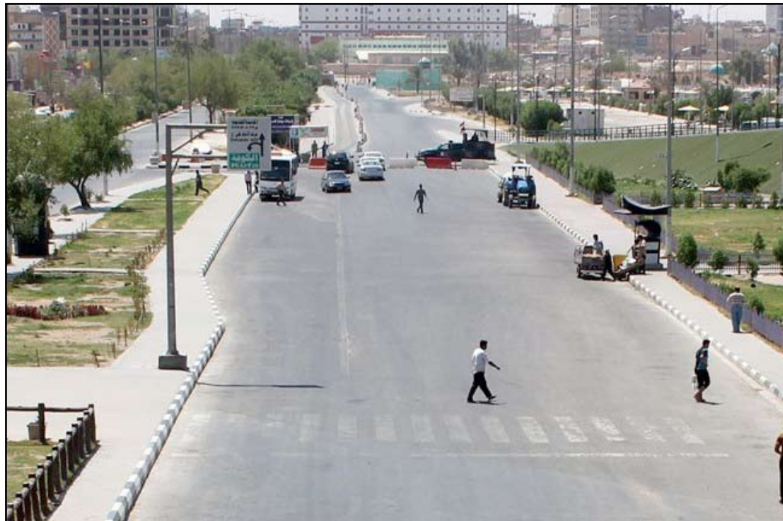
غلق الطرق المؤدية الى المدينة القديمة في محافظة النجف

قرر مجلس محافظة النجف، أمس الأربعاء، منح المواطنين من سكنة المدينة القديمة في محافظة النجف باجات خاصة لغرض السماح لهم بالدخول والخروج في سياراتهم الى المدينة خلال المناسبات الدينية، فيما أشار الى إحالة القرار لقيادة الشرطة لتنفيذه بسبب "دواع أمنية"، فيما رحب مواطنون بهذا القرار كونه "يساهم في التخفيف عن كاهلهم، مطالبين بوضع ضوابط تمنح تلك الباجات.