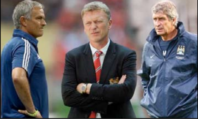
صراع ساخن بين موزير ومورينيو وبيليغريني

الإلكتروني إلى أن المان سيتي يواصل بحثه عن مدافع لتدعيم الفريق قبيل انطلاق الموسم الجديد، خاصة بعد