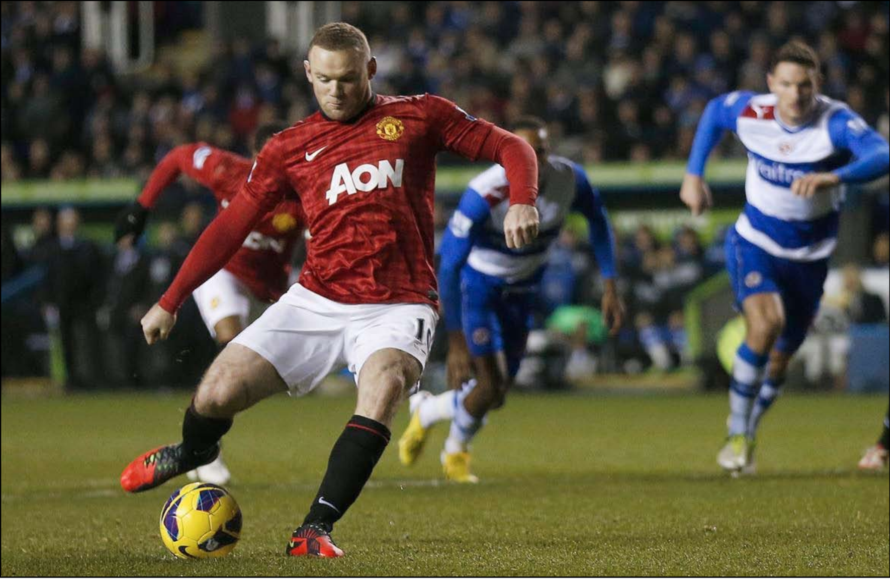
روني يثير أزمة في قلعة الشياطين الأحمر