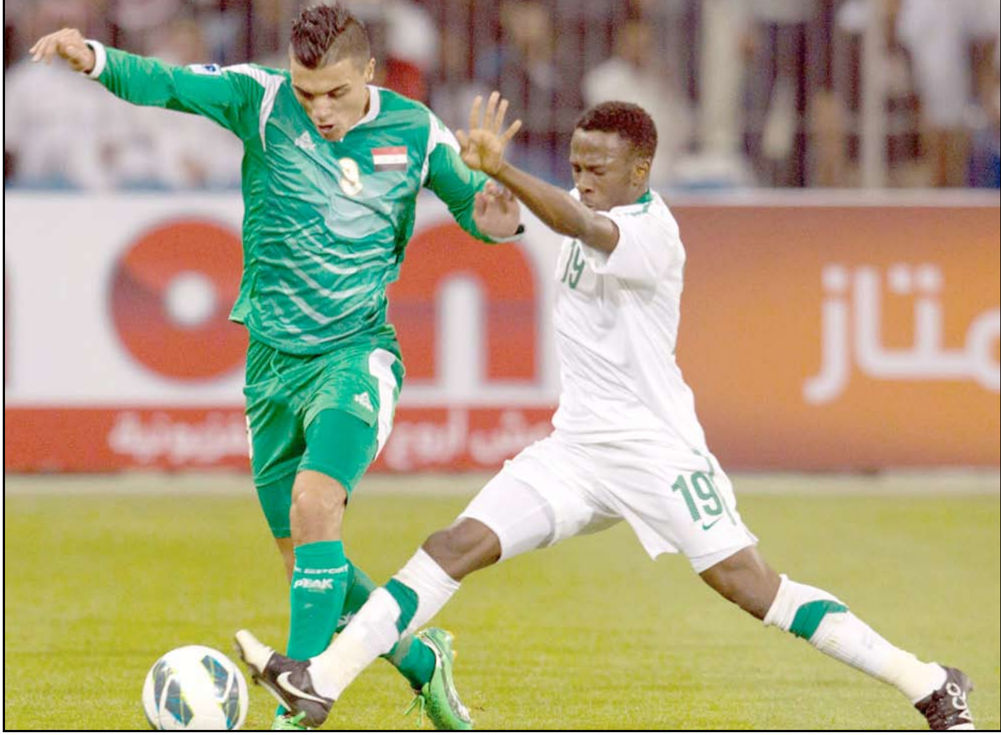
منتخبنا يستعد لمواجهة السعودية ب ٤ مباريات ودية