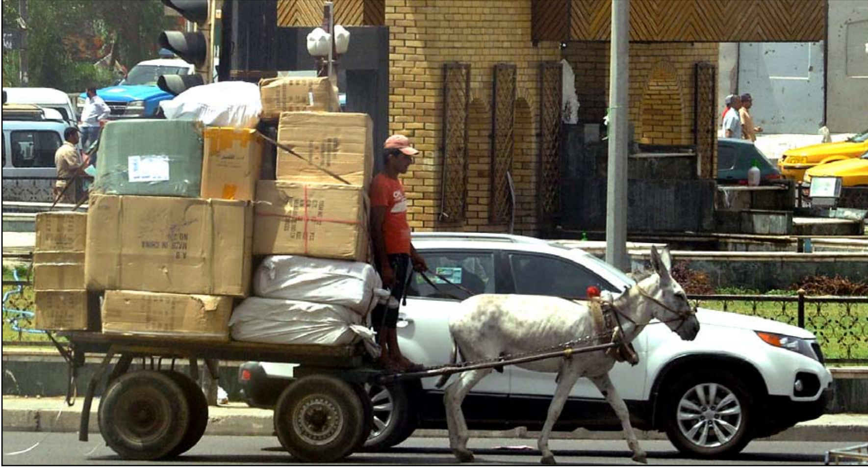
وسط العاصمة مشاهد التخلف والفقير

لا تستغرب على من فارق بغداد في سبعينات القرن الماضي ويمر وسطها الآن وفي مركزها التجاري الباب الشرقي "أن يقول هذه ليست عاصمتي، نعم أغنى عواصم العالم مالا وجاها وحضارة اليوم ترزخ بالخراب والفقر والعوز في ظل رفاه وثراء الساسة الجدد الذين جعلوا من بغداد ثكنة عسكرية تقطع أوصلها السيطرة الأمنية والحواجز الكونكريتية، وطوابير الزحامات أصبحت عنواننا دائما لشوارعها، وارصفاتها محال لبسبقيات القيين الذين لم يجدوا فرصة للعمل في دوائر الدولة بعد أن أصبحت المحسوبة والفساد هما الباب الشرعي للتعيين، (المدى) طافت بمرکز بغداد لتتقل لكل عراقى غيور على وطنه سواء من الساسة او المواطنين مأساة العاصمة وكيف يعتاش شعبها الذي يجلس وسط سفينة هائلة من الثروات ذهبت معظمها إلى أرصدة المسؤولين في الخارج وروايتهم التي شرعوها بأنفسهم دون رادع أو رقيب ليضربوا الرقم القياسي في حجم الفساد السياسي عالميا، بعد أن أثارت تقارير دولية بأن حجم ثروة السياسيين العراقيين بلغت (٧٠٠) مليار دولار!!!!!!