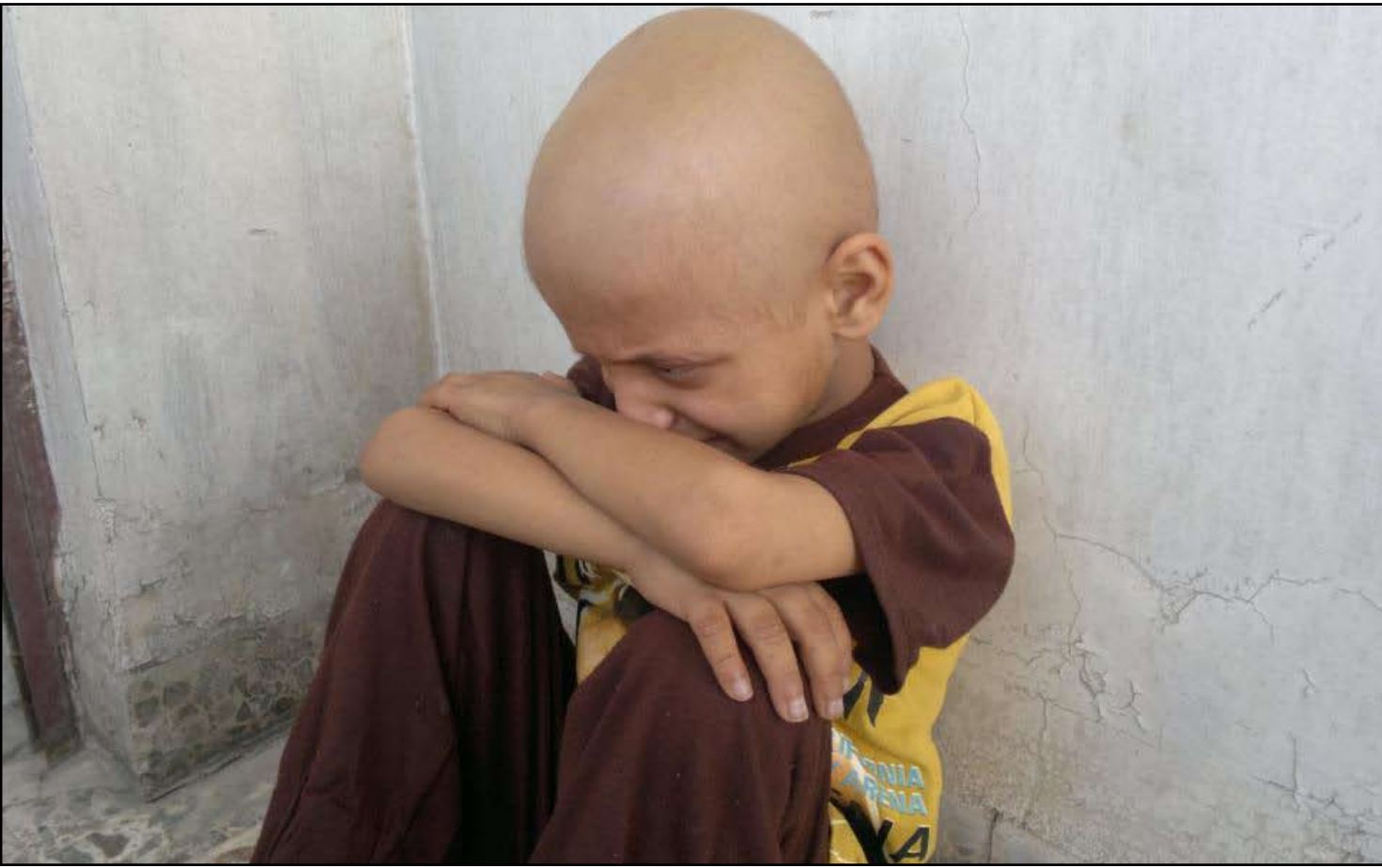
اطفال البصرة المصابون بالسرطان يحاجة لرعاية خاصة

زمن الاتحاد السوفيتي السابق، وأن ما يقامه خطر تلك الأسلحة المشعة هو ضعف قدرة العراق على معالجتها والتقاغس الدولي لاسيما الأميركي والبريطاني في هذا الشأن، وأن العراق يحتاج لنحو ٣٠ مليون دولار لتنظيف أكثر من ٣٠٠ موقع ملوث.