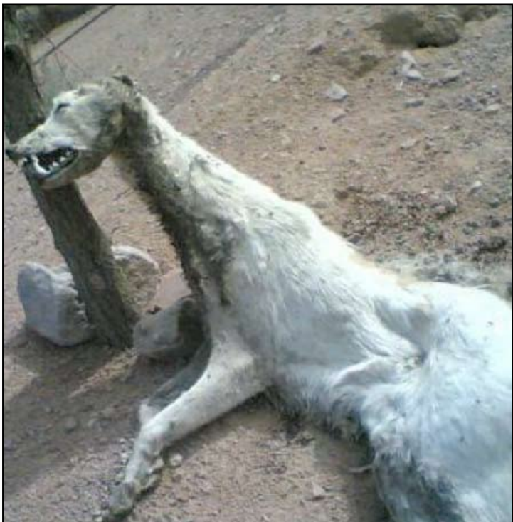
حيوان غريب ظهر في مناطق صحراوية

والأغنام، فضلاً عن توزيع بعض الأدوية بمبالغ بسيطة ومدعومة حكومياً، إلى جانب تشكيل مغازر من الأطباء البيطريين لمراقبة حقول تربية