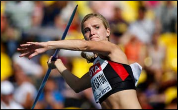
صراع ملتهب لخطف ميدالية مسابقة الرمح

الدور قبل النهائي اليوم بزمن بلغ أربع دقائق و٨٢ ث بفارق ٠١ ث أمام فيث كيبيجون التي احتلت المركز الثاني. كما تأهلت الأمريكية جينيفر سيميسون حامله اللقب إلى الدور النهائي بعدما قطعت المسافة في أربع دقائق و٥٧٩ ث لتحل المركز ١١ في الدور قبل النهائي.