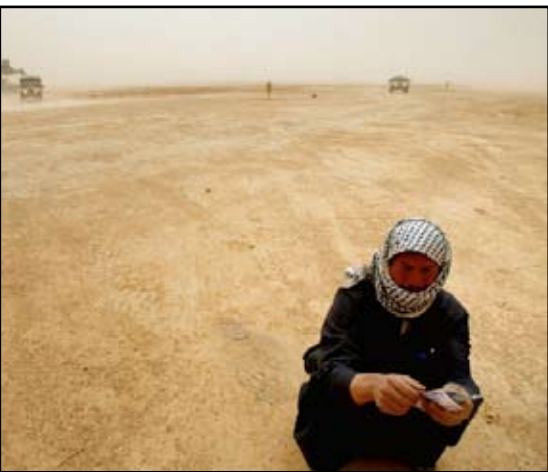
صحراء الديوانية.. أرشيف