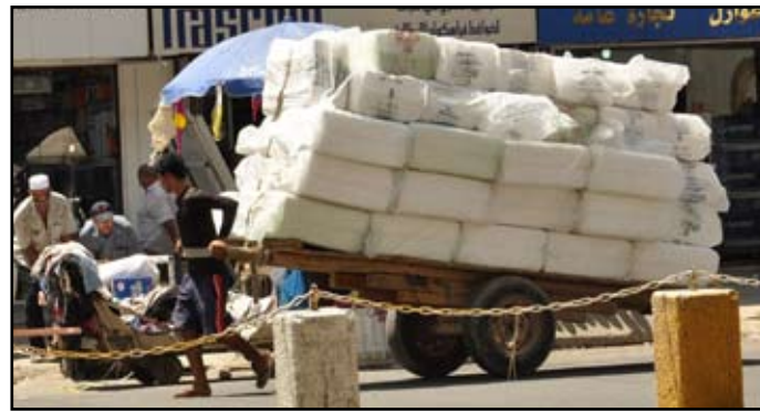
شباب عاطلون عن العمل يقودون العربات

ان الحكومة والساسة الجدد لم يفكروا بحياة المواطن وجميعهم في سباق وتنافس من اجل كسب المال اما الشعب فحصته الاهانة والبؤس