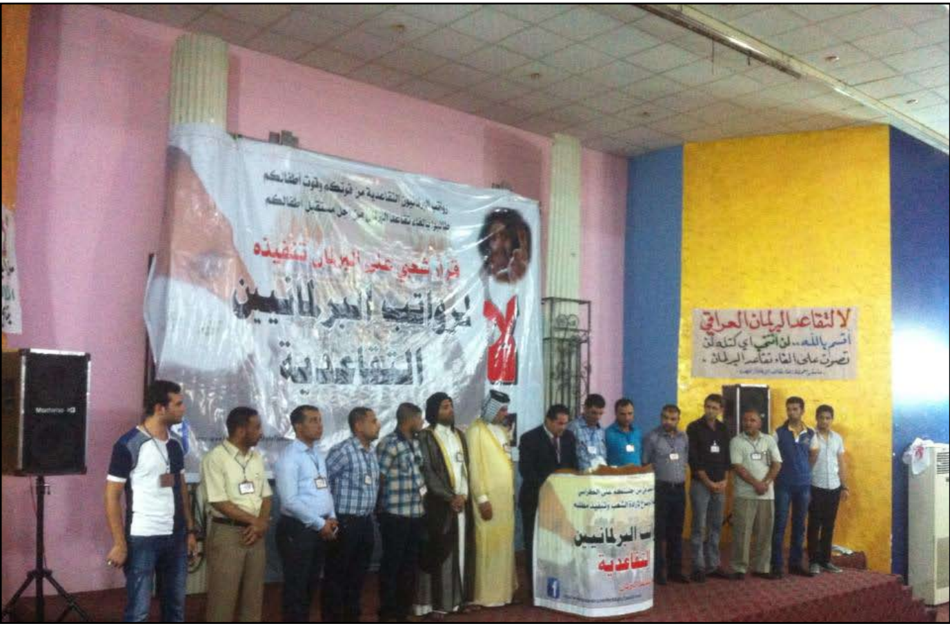
مؤتمر الهيئة التنسيقية لحملة الغاء الرواتب التقاعدية للبرلمانيين

اعلن في البصرة، عن الهيئة التنسيقية لحملة الغاء الرواتب التقاعدية لاعضاء مجلس النواب، ويقول ناشطون ان حملتهم انضم لها العشرات من الناشطين في المجتمع المدني والمثقفين ويجري التمهيد لقيام تظاهرة ٣١ آب المقبل الراضة لامتيازات النواب.