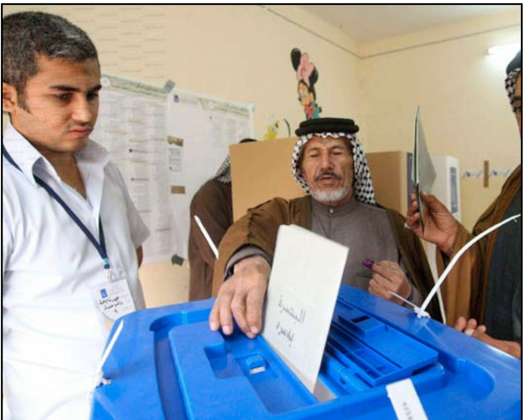
ناخبون يدلون بصوتهم في الاقتراع - ارشيف