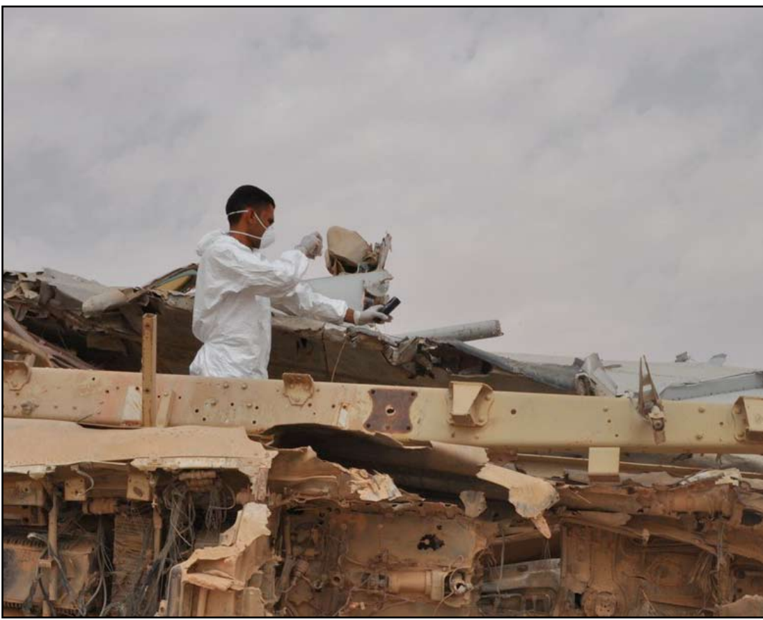
عامل في مجال التلوث يقيس نسبة الإشعاع في مناطق مقصوفة بالآبار

ويقدر العلماء والمختصون أن العمر النصفي لليورانيوم حوالي أربعة مليارات ونصف المليار عام وحتى يفقد قدرته على الإشعاع يحتاج إلى (١٠) أعوام نصفه أي حوالي (٤٠) مليار سنة. وهذا يعني أن المناطق المقصوفة بتلك الأسلحة في العراق (المنطقتين الوسطى والجنوبية خاصة)، ستبقى ملوثة مدة طويلة جداً، وأن أثارها وتأثيراتها الخطيرة على الإنسان والبيئة والحيوان ستزيد باستمرار مع مرور الزمن ما لم تتخذ الإجراءات الخاصة بدفن وردم هذه المواد المشعة والأهداف التي أصابها (وهو ما كان قد بوشر به قبل احتلال العراق من قبل الحكومة العراقية بالتعاون من منظمة الصحة العالمية ومنظمة الطاقة الذرية وجهات دولية أخرى) من خلال لجان خاصة شكلت لهذا الغرض.