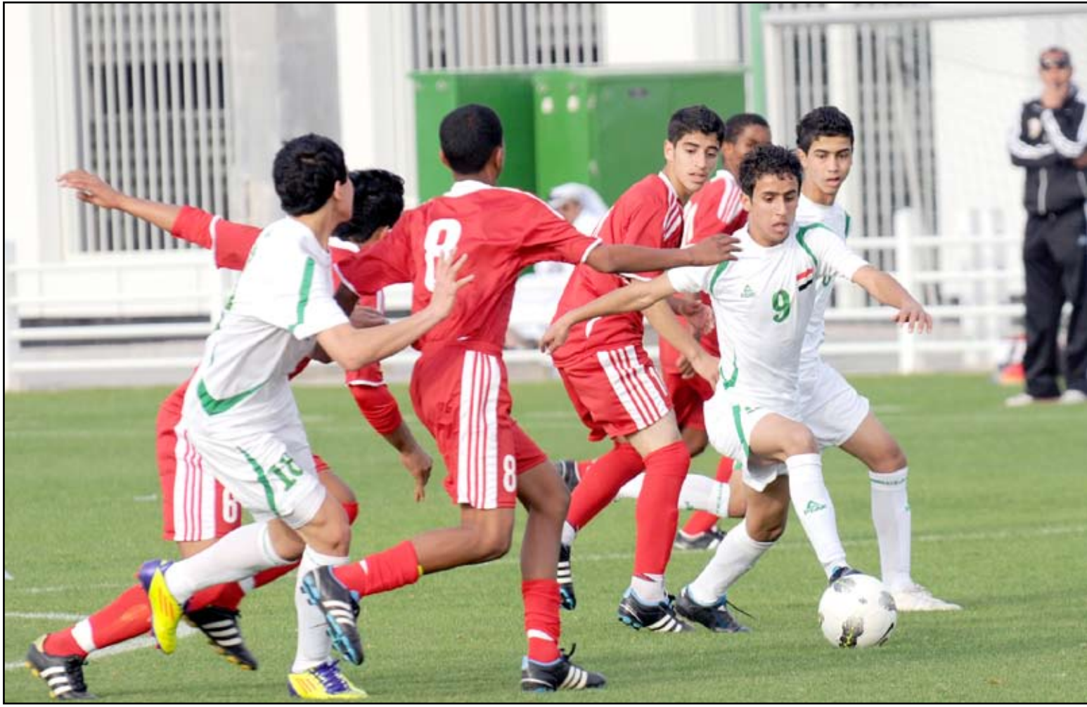
مباراة ساخنة بين منتخب الناشئين مع شقيقه الفلسطيني في رام الله