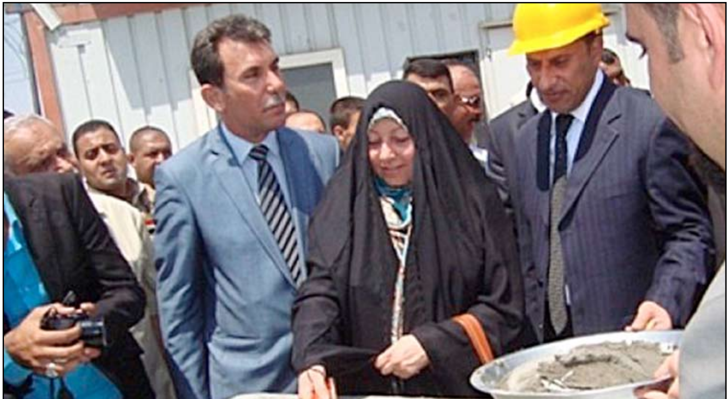
مسؤولو الحكومة المحلية في ذي قار يضعون حجر الأساس لمستشفى الشطرة

أعلنت محافظة ذي قار، امس الاحد، "وضع الحجر الأساس" لمشروع مستشفى الحوراء للولادة والأطفال في قضاء الشطرة (٤٥ كم شمال الناصرية) وسبعة ١٠٠ سرير، وبينت أنها رصدت للمشروع ٢١ مليار و ٥٠٠ مليون دينار"، ولققت الى أن مساحة المشروع تقدر بـ ١٦ دونماً ويكون المستشفى من أربعة طوابق". وقال محافظ ذي قار يحيى الناصري في حديث الى (المدى برس)، على هامش احتفالية وضع الحجر الأساس لمشروع إنشاء مستشفى الولادة والأطفال في قضاء الشطرة، إن "محافظة ذي