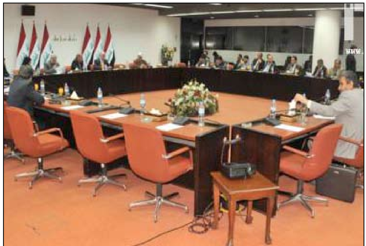
اجتماع لقادة الكتل النيابية - ارشيف

كشفت رئيس هيئة المساءلة والعدالة، امس الاحد، عن الاستعداد لتشكيل لجان فرعية تتولى تدقيق ملفات المرشحين للانتخابات البرلمانية المقبلة بشكل مبكر، بهدف ابعاد ملف المساءلة عن التسييس والتسقيط السياسي. ولفت الى ان المشمولين بإجراءات المساءلة يحق لهم الطعن لدى هيئة التمييز. لكن لجنة المساءلة البرلمانية لا تخفي خشيتها من عودة استخدام ملف الاجتثاث في استبعاد الخصوم عن البرلمان المقبل، مؤكدة انها تسعى لإجراء تعديلات على قانون المساءلة لرحايمته من التدخلات السياسية والحكومية. وكشفت عن تشكيل لجان لرسم ملفات المشمولين بإجراءات المساءلة خلال ثلاثة اشهر.