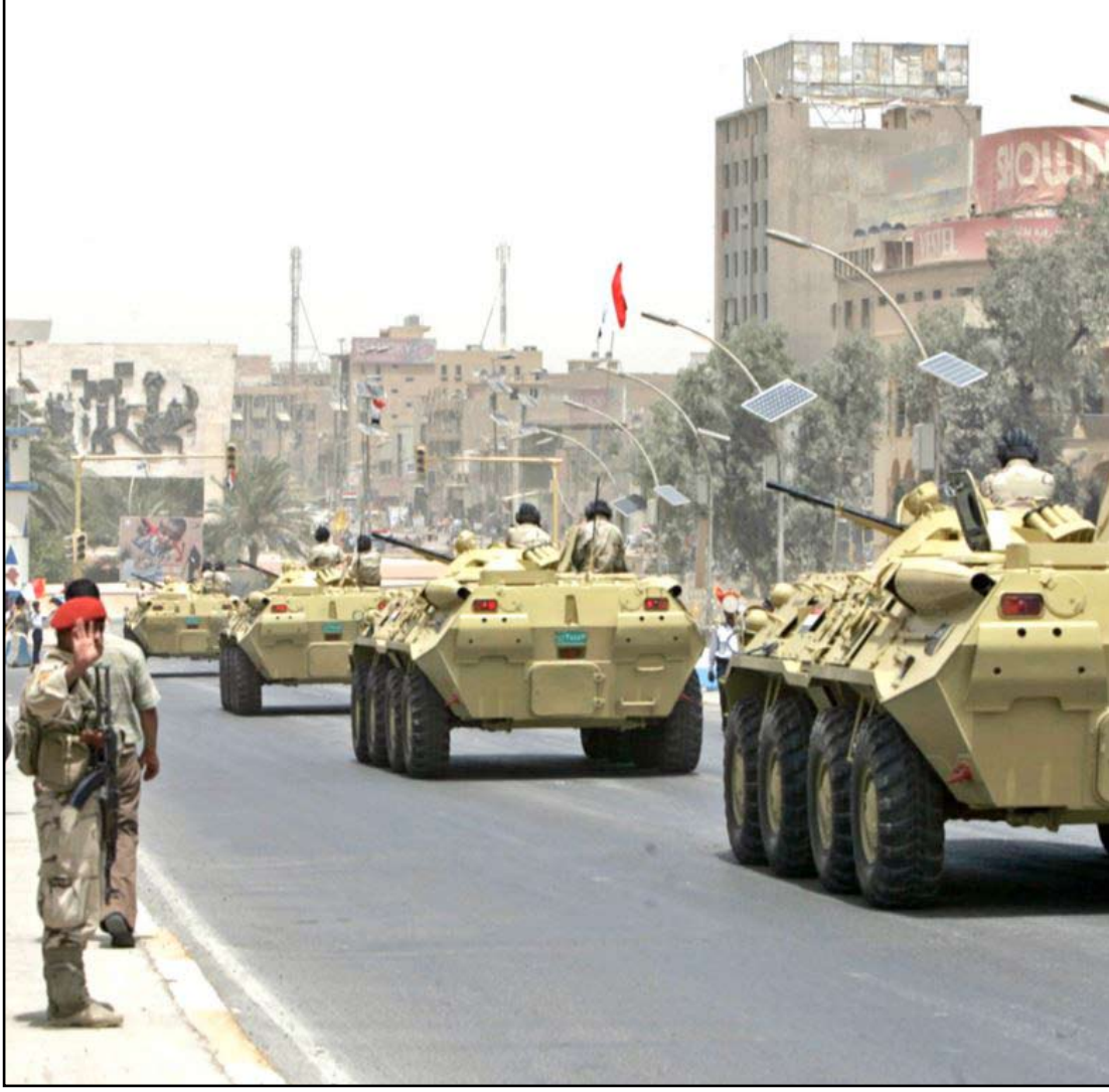
مدرعات عسكرية تعبر جسر الجمهورية في بغداد - ارسيف

وبين أنه ومجلس محافظة بغداد السابق "كان دورنا يقتصر على التنسيق بين قوات الامن والمجالس البلدية التابعة للمحافظة من أجل رفع الحواجز الكونكريتية وفتح الطرق لا غير".