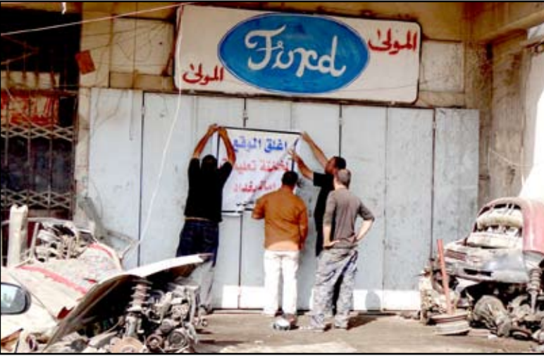
اغلاق ورشة تصليح للسيارات ضمن قاطع بلدية الشعب

جميع مناطق العاصمة بغداد ضمن قواطع الدوائر البلدية الأربعة عشر لغرض وضع حد لظاهرة انتشار مراتب ومعارض وساحات وقوف ومبيت السيارات العشوائية التي باتت تشوه جمالية وتصميم العاصمة بغداد الى جانب ما تشكله من مخاطر أمنية واحتمال استغلالها من قبل الإرهابيين لتنفيذ أعمالهم الإجرامية ضد المواطنين الأبرياء".