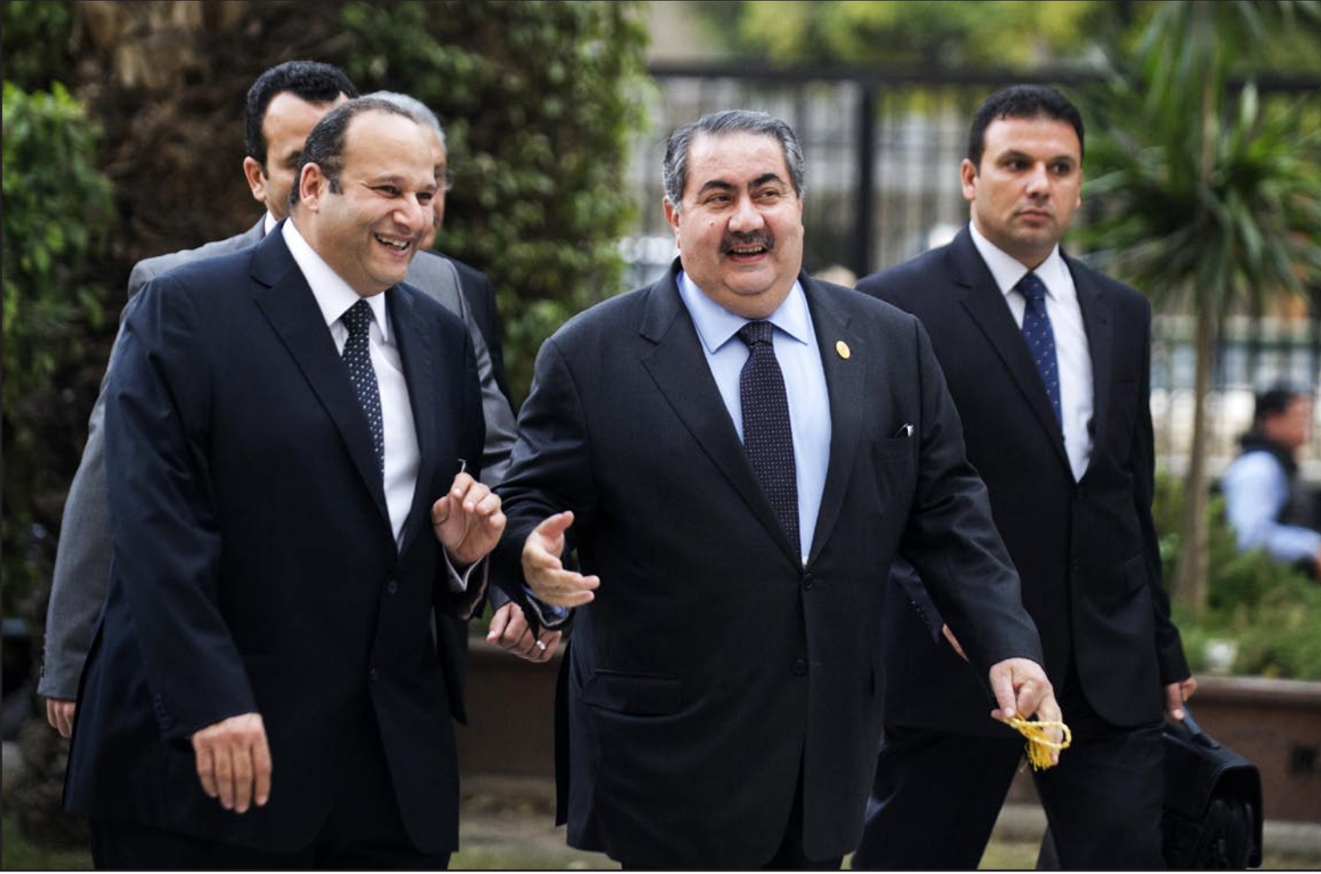
زيباري قبل دخوله لاجتماع وزراء الخارجية العرب بشأن سوريا السبت الماضي

تعرض سوريا لضربة عسكرية، معللاً على نجاح مبادرة الخزاعي في جمع الشركاء السياسيين، وقال لـ "المدى" امس ان "كل الاطراف في العراق تنظر بترقب وحذر للوضع السوري والتأثيرات التي ستعكس على العراق في حال تعرض دمشق الى ضربة عسكرية"، مؤكدا ان "الحكومة العراقية لاتزال تدعم الحل السلمي وانعقاد مؤتمر جنيف ٢". واكد النائب عن دولة القانون انه "في حالة التدخل العسكري في سوريا قد يتفجر الوضع الامني بشكل اكبر، وسيكون له تأثيرات خطيرة على الشأن الامني والاجتماعي في العراق".