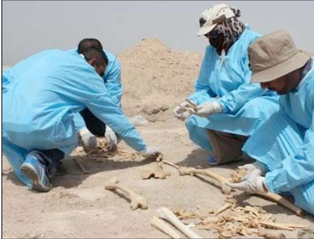
فريق البحث أثناء فحصه الأولي لرفات ضحايا مقبرة جماعية في النجف