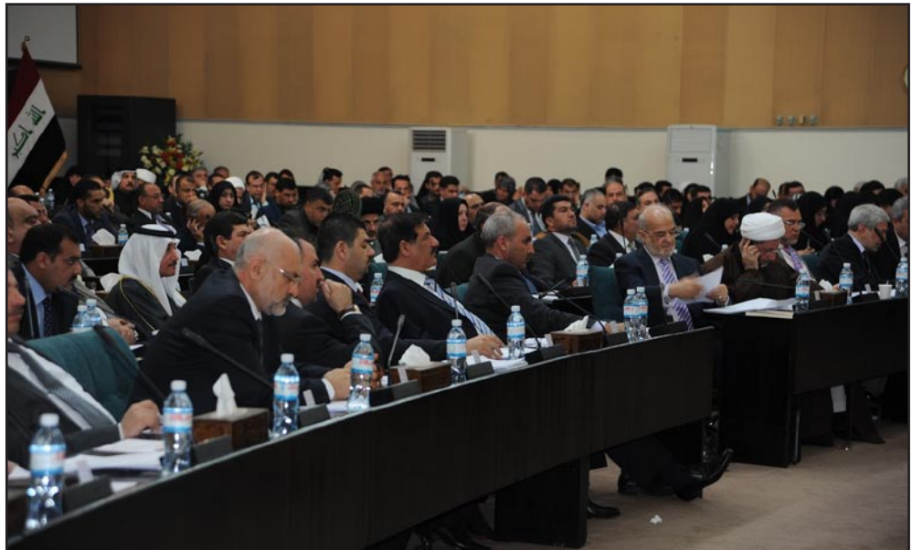
جلسة نيابية - أرشيف