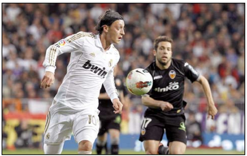
أوزيل بات قريباً من أرسنال

قالت صحيفة "الديلي ميل" البريطانية إن نادي أرسنال الإنكليزي يقترب من صفقة كبيرة قبل إغلاق باب الانتقالات الصيفية. وذكرت الصحيفة في تقرير نشرته مساء الأحد إن صفقة (المدفعية) المقبلة لن تخرج عن أحد لاعبي ريال مدريد الإسباني: مسعود أوزيل، كريم بنزيمة وأنخيل دي ماريا. ويبدو أوزيل الأقرب للانضمام إلى أرسنال، بعد أن جلس الدولي الألماني على مقاعد البدلاء في مباراة الريال وأتلتيكو بلباو عصر الأحد، وهي المباراة التي انتهت لصالح النادي الملكي 3-1. وخرج أوزيل من مباراة الريال وغرناطة الأسبوع الماضي والاستياء ظهر على وجهه بعد قرار الإيطالي كارلو أنشيلوتي المدير الفني للفريق باستبداله في الشوط الثاني من المباراة. ويبدو أن نجاح الريال في التعاقد مع الولايزي