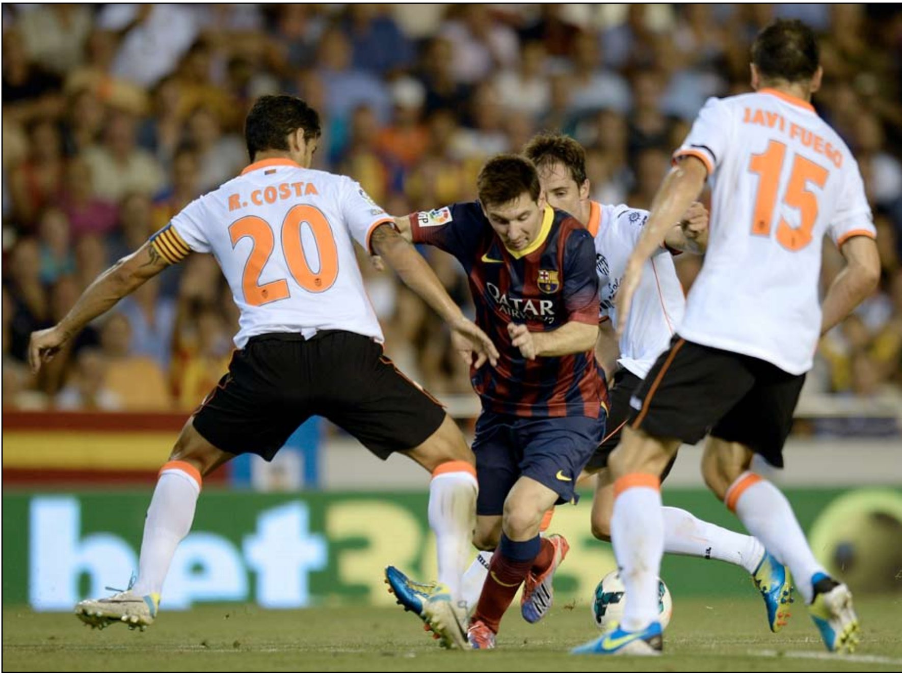
برشلونة فاز بصعوبة على فالنسيا