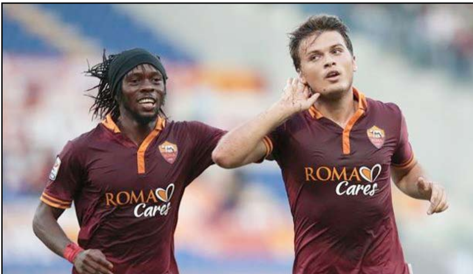
روما يلحق بفارق الصدارة

الذي يخوض مباراته الأولى بقميص "جبالوروسو" ولحق روما بنابولي ويوفنتوس إلى الصدارة ولكل من هذا الثلاثي 6 نقاط، وانضم إلى هذه الفرق إنتر ميلان بعد فوزه على مضيقه كاتانيا (3-0) وفيورنتينا على مضيقه جنوى 5-2. في المباراة الأولى، وضع الأرجنتيني رودريغو بالاسيو إنتر ميلان في المقدمة (19) وعزز الياباني يوتو ناغانومو بالهدف الثاني في الشوط الثاني (56) وأكد الأرجنتيني ريكاردو الفاريز فوز الإنتر بالهدف الثالث (80). وفي المباراة الثانية، حسم فيورنتينا نتيجة المباراة مع مضيقه جنوى في أول ربع الساعة بهدفين لألبرتو أكبولاني (11) وجوزيبي