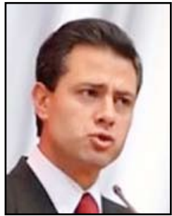
انريك بينا نيتو

ذكر برنامج إخباري برازيلي بثه تلفزيون ريو دي جانيرو، أن وكالة الأمن القومي الأمريكية تجسست على اتصالات بين رئيسي البرازيل والمكسيك، وهو كشف يمكن أن يؤدي إلى توتر علاقات الولايات المتحدة مع الدولتين الكبيرتين في أمريكا اللاتينية.