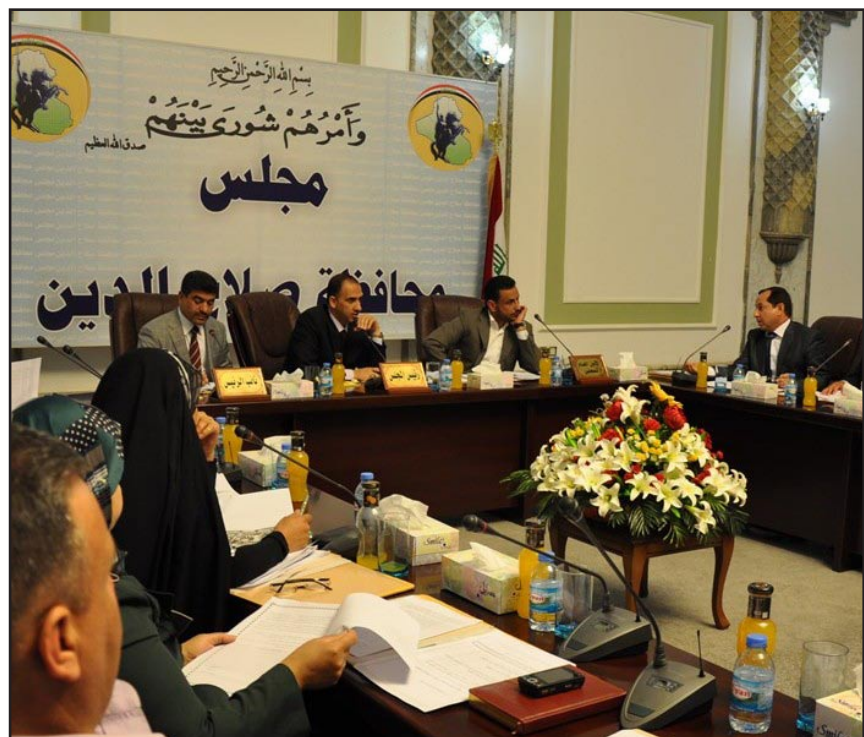
مجلس محافظة صلاح الدين..

وطالبت النائبة عن صلاح الدين، أعضاء مجلس المحافظة المعترضين بأن "يعدوا عن شكواهم