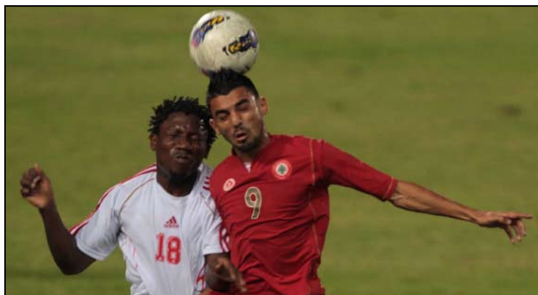
لبنان يستعد للقاء سوريا الجمعة المقبلة

وكان الاتحاد اللبناني قرر سابقاً، وبالتنسيق مع جيانيني، البحث عن المواهب اللبنانية في الخارج للإفادة