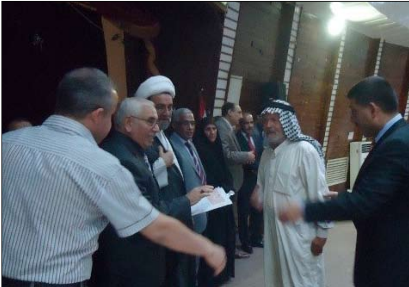
توزيع صكوك تعويضات المتضررين من الارهاب في بابل