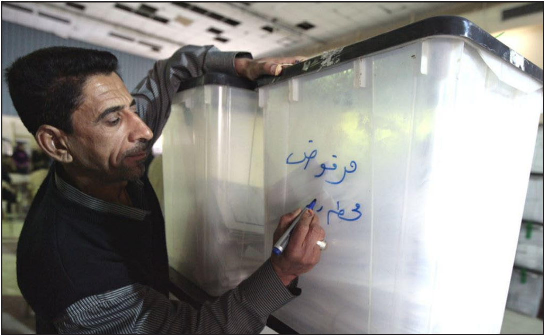
موظف في المفوضية يلقي نتائج صندوق اقتراع لخالفته الشروط

واضاف الزويبي، في تصريح صحفي اطلعت عليه "المدى"، ان مفوضية الانتخابات تؤكد اجراءها بعض التعديلات على نظام توزيع المقاعد الخاص بانتخاب مجالس المحافظات غير المنتظمة والتي جرت في العشرين من نيسان ٢٠١٣، مشيراً إلى أن "التغييرات ستشتمل بعض نتائج المرشحين الفائزين وحسب قرار المحكمة الاتحادية الخاص بتعديل نظام توزيع المقاعد". في هذه الأثناء، أكد مجلس محافظة واسط أن المحكمة الاتحادية قررت "استبدال أربعة من أعضاء المجلس بأخرين جدد"، وعد القرار بأنه "مسيب ويهدف إلى تغيير خارطة السياسة" في المحافظة، فيما