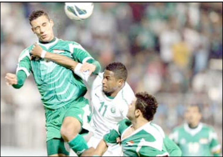
جدل بشأن لقاء السعودية لحسم مكان تصنيفه

وأضاف المحط في تصريح عبر الموقع الرسمي للاتحاد الكويتي لكرة القدم على شبكة الانترنت : إن الاتحاد الكويتي يقدم اعتذاره في الوقت ذاته عن صعوبة توفير التأشيرات اللازمة والتسهيلات لدخول الجماهير العراقية.