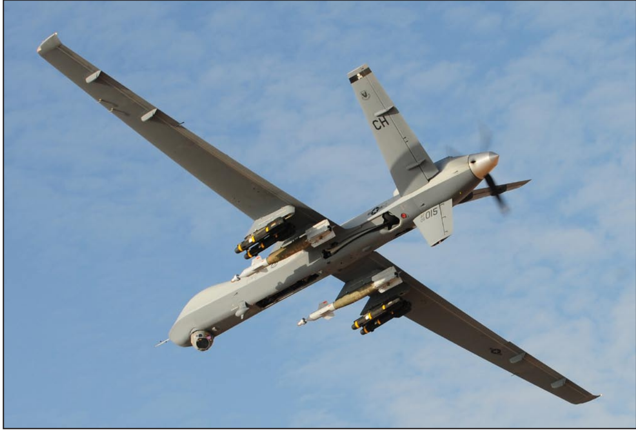
نموذج لطائرة من دون طيار..