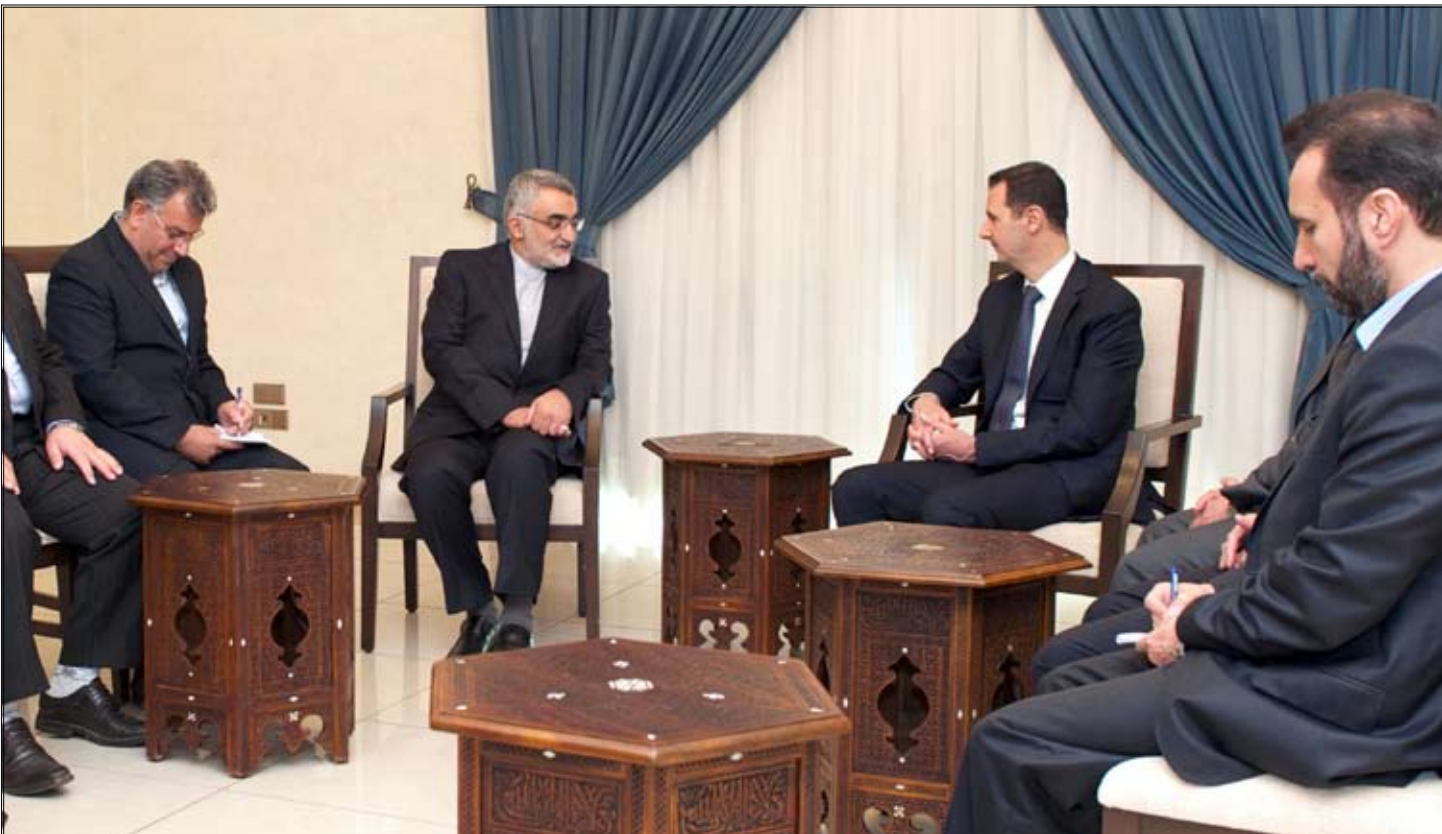
الرئيس السوري بشار الأسد مع مستشار للأمن القومي الإيراني

وأبلغ وزير الخارجية محمد جواد ظريف الأمين العام للأمم المتحدة هذه الرسالة خلال اتصال هاتفي في ساعة متأخرة الأحد، بحسب ما أكدته هيئة الإذاعة والتلفزيون الإيرانية الرسمية على موقعها على الإنترنت.