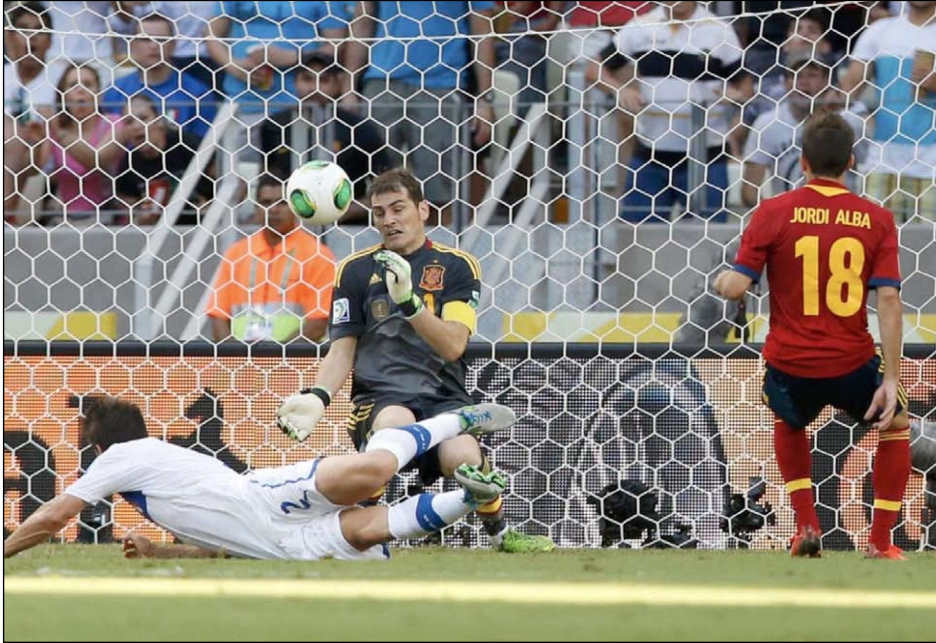
كاسياس مطلوب في المنتخب ومحروم مع الملكي

وبرغم أنه كان في ذلك الحين احتياطياً كذلك مع ريال مدريد ، وضع دل بوسكي ثقته في كاسياس كحارس أساسي في