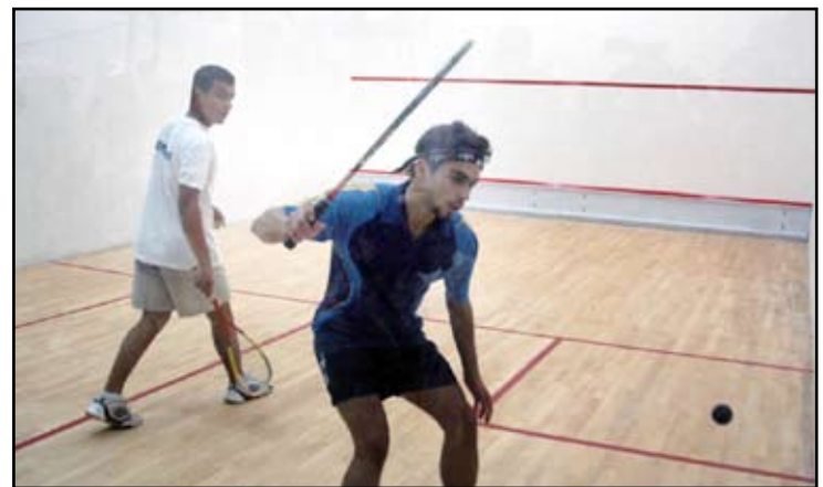
مشاركة منتخب الناشئين في بطولة آسيا

تشهد إثارة وندية كبيرتين بين المنتخبات المشاركة، مشيراً إلى أن اتحاد اللعبة لديه ثقة كبيرة باللاعبين من اجل الظهور بصورة طيبة في المنافسات القارية