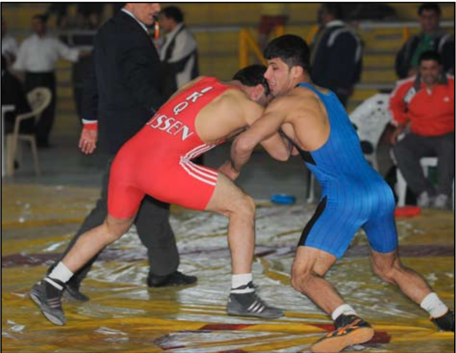
الشباب تنجح في اقامة بطولة المصارعة لعموم المحافظات

أسفرت النزالات النهائية في المصارعة الرومانية عن فوز فريق مديرية شباب ورياضة كربلاء بالمركز الأول برصيد ٧٧ نقطة وجاء فريق مديرية شباب ورياضة الصدر ثانيا برصيد ٧٠ نقطة ثم واسط بالمركز الثالث ٥٨ نقطة والرصافة ثالث مكرر ٥٢ نقطة . وفي فعالية المصارعة الحرة أحرز المركز الاول فريق مديرية شباب ورياضة الرصافة جامعا ٩٠ نقطة وجاء ثانيا فريق مديرية شباب ورياضة البصرة ٧٢ نقطة وحل ثالثا فريق مديرية شباب ورياضة صلاح الدين ٥٨ نقطة وفريق كربلاء ثالث مكرر ٥٧ نقطة .