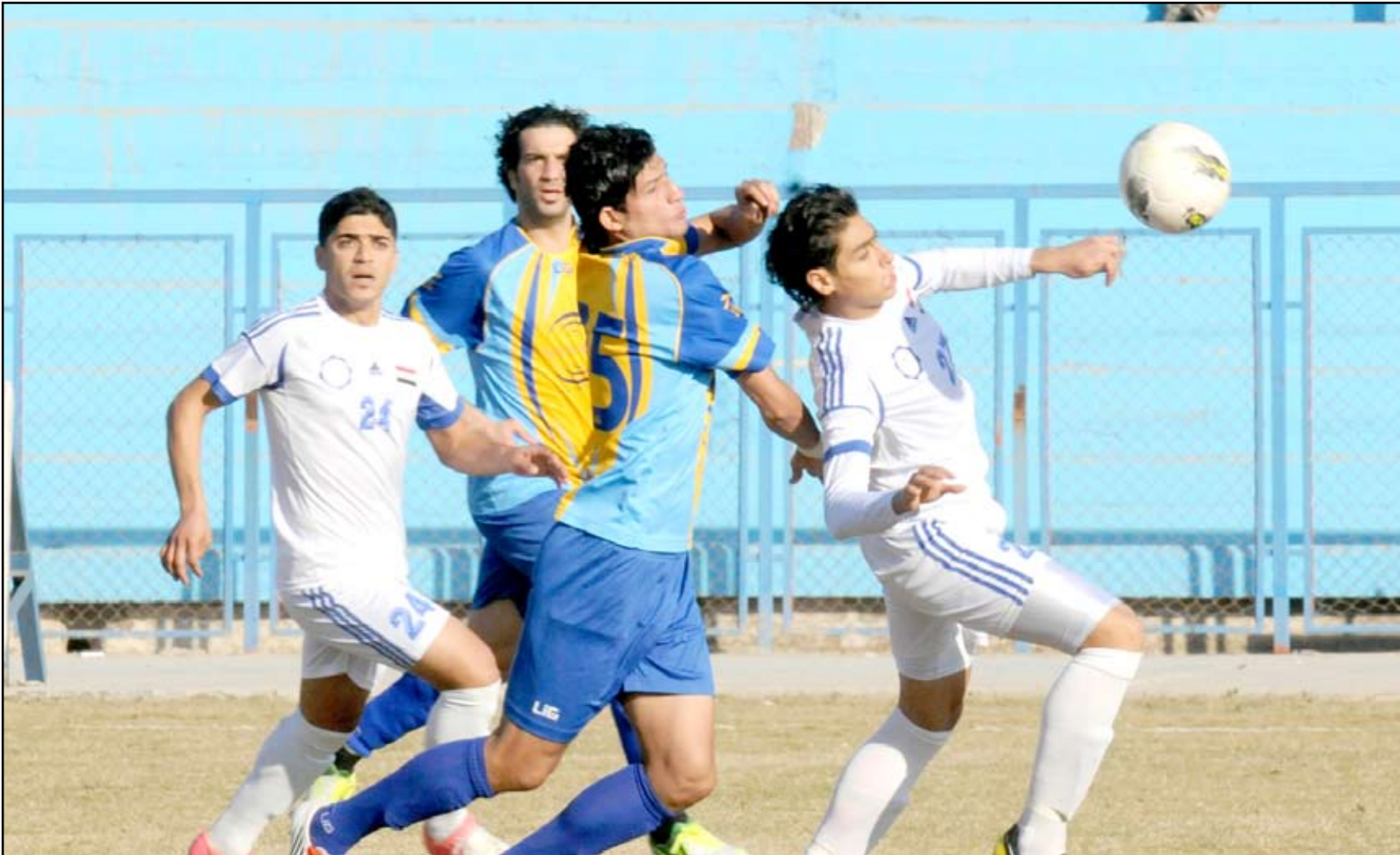
الصناعة تأكد هبوطه الى الدرجة الممتازة

ويخوض المنافس الثاني على اللقب فريق أربيل مباراته يوم غد بمواجهة فريق النجف على ملعب الأخير حيث يسعى لاعبو أربيل إلى أن يحققوا الفوز الذي وحده من يتكفل بفرضهم منافسين اشداء على اللقب ويعيونهم ترنوا صوب ملعب الشعب الذي يحتضن مباراة الطلبة والشرطة منتظرين الخدمة التي يسديها لهم فريق الطلبة عسى ان يحقق التعادل أمام الشرطة ليقتز أربيل إلى منصات التتويج كون لديه حصيلة من الاهداف تمنحه الاولوية للاحتفاظ باللقب للمرة الخامسة . وتختتم منافسات يوم غد بلقاء فريقى الجوية والمصافي على ملعب الجوية الذي بات بعيداً عن اللقب بمحض إرادته كونه فرط بفوز في متناول اليد عندما اهدر نقاط فوزه على فريق السليمانية بعد ان تعادل معه بهدف لكلا الفريقين ليفوت على نفسه فرصة لا تعوض اطلاقاً ليكون بعيد كل البعد عن اللقب محتلاً المركز الثالث برصيد ٦٦ بفارق نقطتين عن المتصدر فريق الشرطة ونقطة واحد عن فريق أربيل صاحب المركز الثاني .