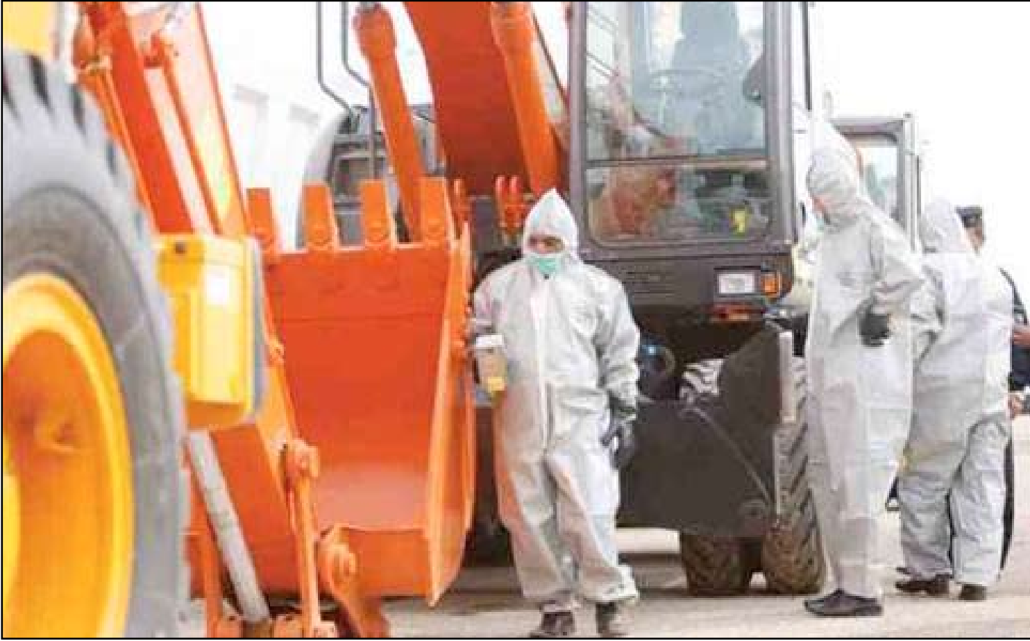
فحص اليات من قبل فرق البيئة...