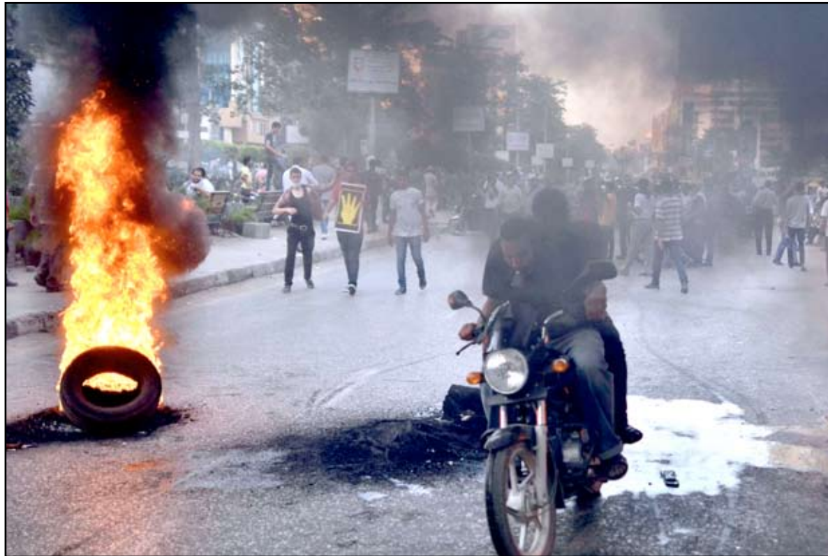
أنصار الإخوان والرئيس المخلوع محمد مرسي في اشتباكات مع قوات الأمن، في القاهرة..