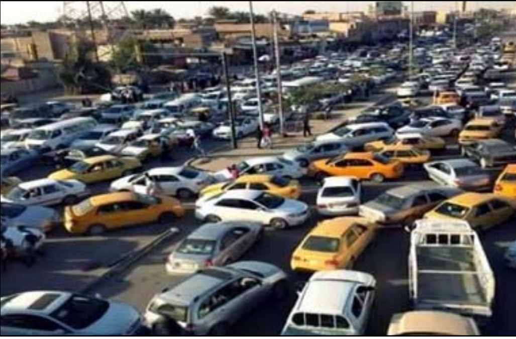
زخم مروري في احد تقاطعات بغداد... ارسيف

وأكد التميمي ان "القرار اضرب بالكثير من الاسر التي تعتنش على واردات سيارات الأجرة التكسي والباص، فضلا عن تعطيل مهام عدد كبير من موظفي الدولة الذين يتنقلون