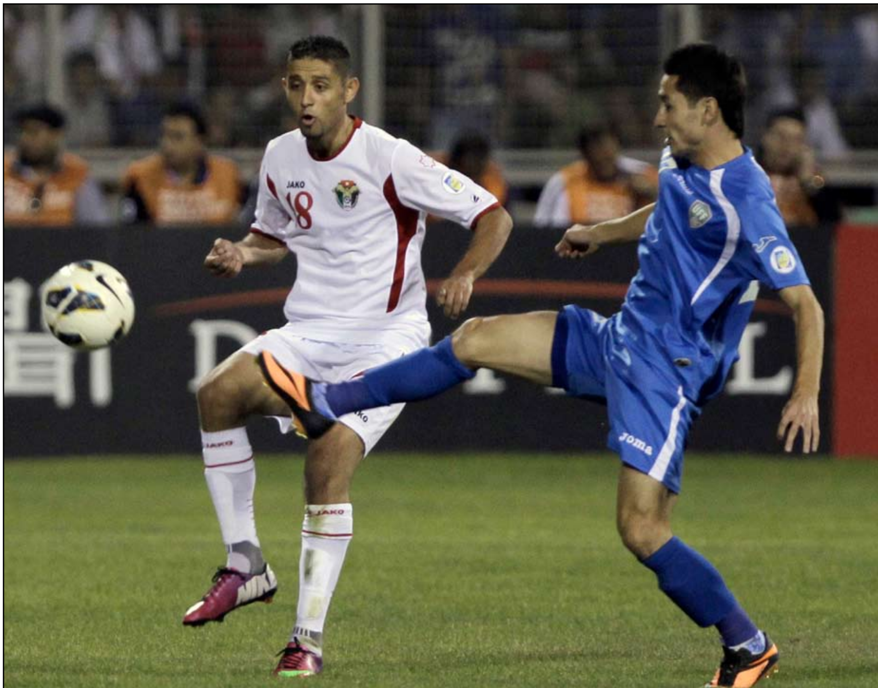
الأردن يقترب من التأهل إلى كأس العالم لأول مرة في تاريخه

على ملعب "باختاكو" في العاصمة الأوزبكية افتتح المضيف التسجيل مبكراً عبر إسماعيلوف إثر ركلة حرة (5).