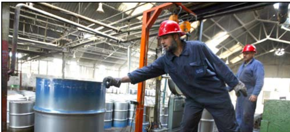
مصفى لإنتاج النفط.. ارشيف