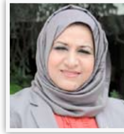
النائبة وحدة الجميلي

■ "لجنة الخدمات والإعمار والتي انا عضو فيها ستعمل على مراقبة ومتابعة جميع المشاريع المنجزة وغير المنجزة في محافظة بغداد وأمانة بغداد لوجود نسبة تلك كبيرة فيها بالإضافة إلى أن المشاريع التي هي قيد الإنجاز أو المنجزة ليست بمستوى الطموحات، إن هذه اللجنة ستشخص أسباب التلكؤ والجهة المقصرة في هذه المشاريع وإحالتها إلى هيئة الزهامة".