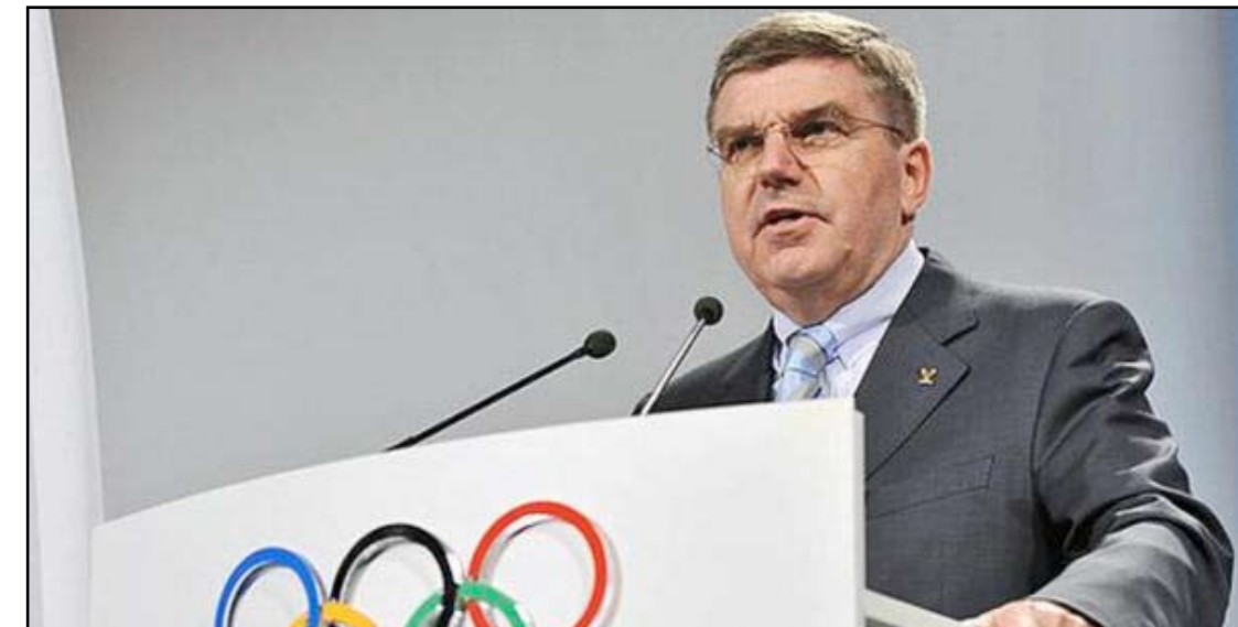
توماس باخ القائد الجديد للأولمبية الدولية

وكان باخ من أبرز مكافحي أفة المنشطات، ودعا لإيقاف الرياضيين المنتهضين لأربع سنوات بدلاً من اثنتين آنذاك في ألعاب القوى. لكن مشوار باخ نحو قمة الهرم الأولمبي