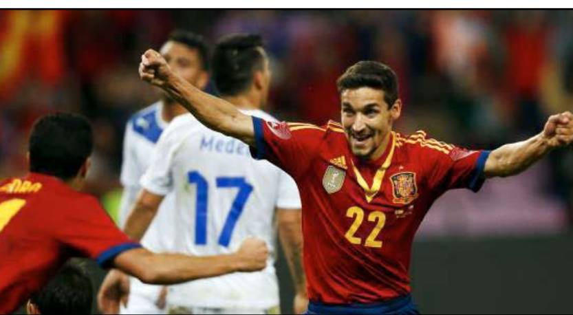
إسبانيا تنجح في إحراز التعادل مع تشيلي

وتصدى الحارس التشيلي كلاوديو برافو لكرات خطيرة من لاعبي إسبانيا، وعندما استعد منتخب تشيلي للخروج فائزاً، شارك ألفارو نيجريدو وبيرو رودريغيز في صناعة هجمة إسبانية رائعة ومرر بדרو الكرة لنافاس الذي أحرز منها هدف التعادل القاتل.