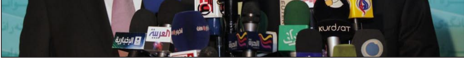
النجيفي والمالكي خلال مؤتمر صحفي في البرلمان - أرشيف

وأضاف الطرفي ان الوضع الأمني سيكون ضمن المواضيع المهمة التي ستناقش مع رئيس الوزراء عند حضوره في مجلس النواب، منوها الى ان البرلمان لم يتطرق إلى الآن حول وضع الآلية والملفات التي سيرفضها على المالكي. وأضاف الطرفي أن "هناك الكثير من الأمور ستطرح منها الخطط الأمنية ووجود القادة الأمنيين وأسباب الخروقات الأمنية التي تحصل هنا وهناك من اجل توضيحها لنواب الشعب لتكون لديهم دراية ومعرفة عما يجري في المؤسسة الأمنية، مشيراً إلى ان تحديد موعد قدوم المالكي الى مجلس النواب سبتحده خلال أيام.