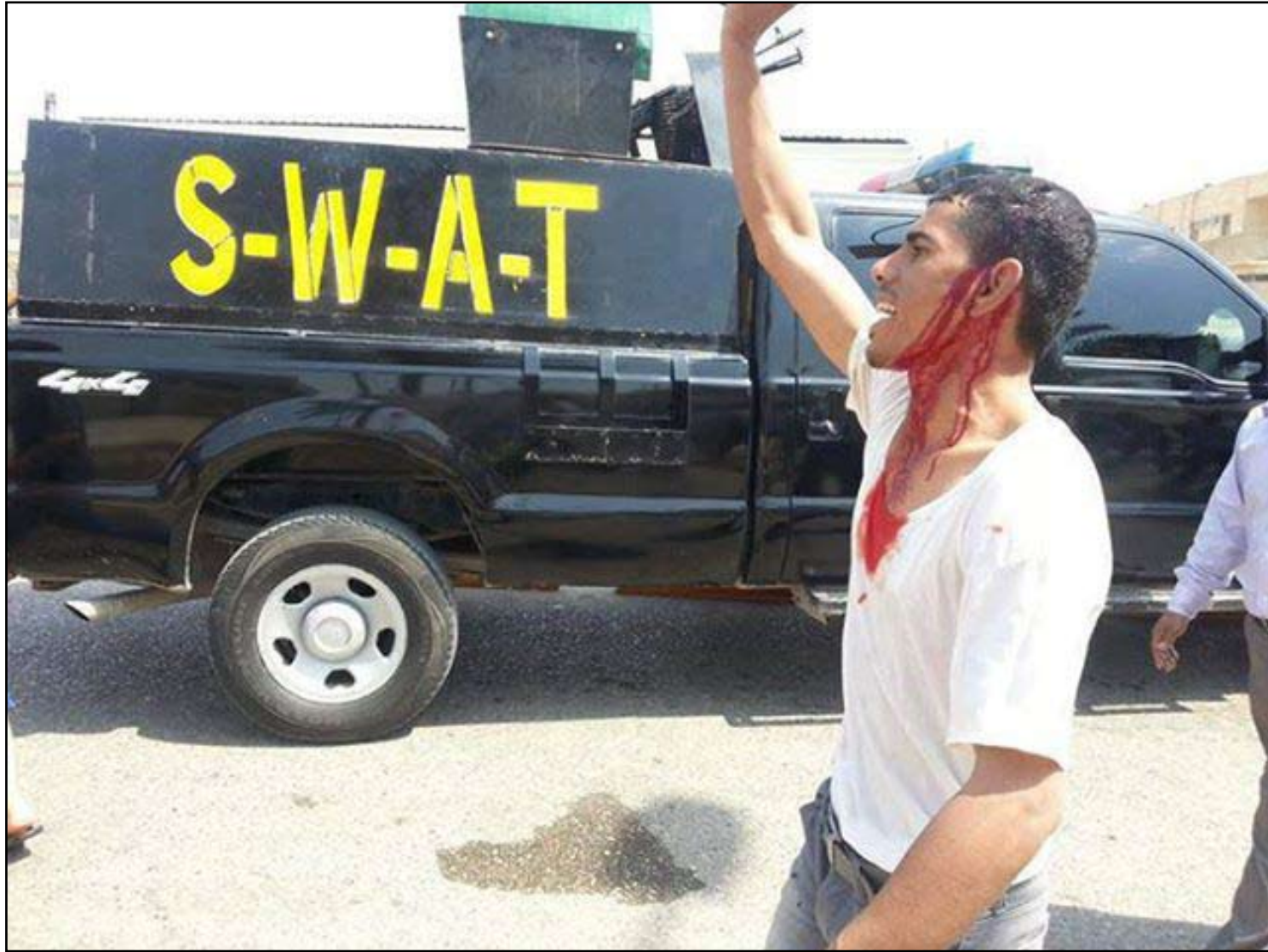
شاب من ذي قار يتعرض للضرب من قبل سوات

وكان رئيس مجلس الوزراء، نوري المالكي، طالب، خلال كلمته الأسبوعية، في وقت سابق من، الأجهزة الأمنية