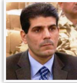
النائب جواد البزوني

■ "لجنة الخدمات والإعمار والتي انا عضو فيها ستعمل على مراقبة ومتابعة جميع المشاريع المنجزة وغير المنجزة في محافظة بغداد وأمانة بغداد لوجود نسبة تلك كبيرة فيها بالإضافة إلى أن المشاريع التي هي قيد الإنجاز أو المنجزة ليست بمستوى الطموحات، إن هذه اللجنة ستشخص أسباب التلكؤ والجهة المقصرة في هذه المشاريع وإحالتها إلى هيئة الزهامة".