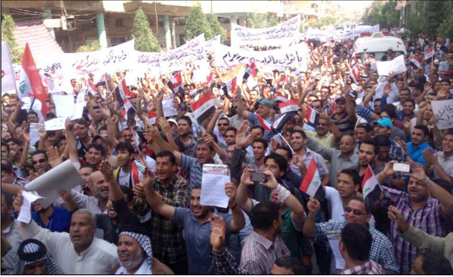
تظاهرة كبيرة طالبت بإلغاء تقاعد النواب في ٣١ آب الماضي...