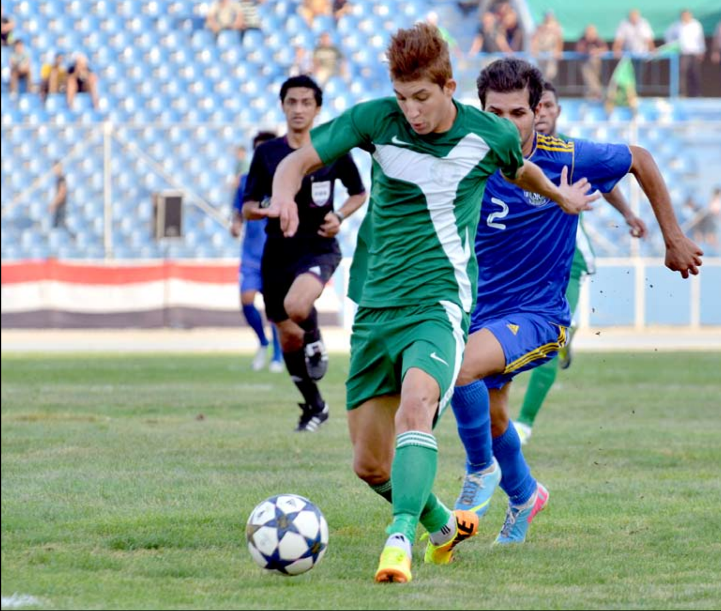
الشرطة يأمل تكرار انجازته المحي

بان الشرطة سيكون منافساً عنيدا بهذه البطولة القارية.