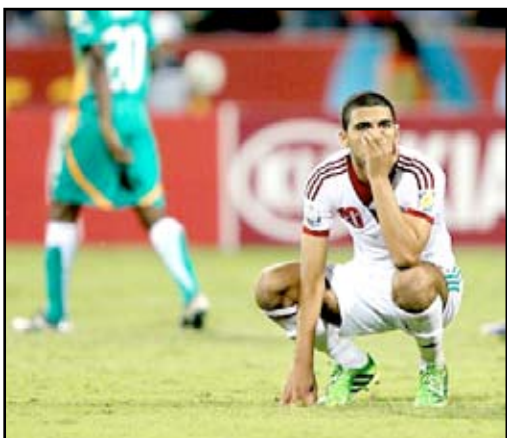
المغرب خارج المونديال

بدقيقتين ٤:٣. ومع بداية الشوط الثاني عادت الأرجنتين للتقدم بهدف يحمل لمسات الخبراء، أحرزه خواكين إيبانيز ٥٣. وحاول المنتخب العربي أن يعيد النتيجة إلى التعادل، ولكنه لم يوفق بذلك، ولأنه عندما لا تسجل فإنك أمام خطر تلقى الأهداف، جاء الهدف الثالث للمنتخب اللاتيني هذه المرة بتوقيع سياستيان تريوسي، الذي استغل سوء تغطية الدفاع التونسي وأرسل كرة قوية من داخل منطقة الجزاء ٧٣، معلناً تقدم منتخب بلاده ٣-١، وبهذه النتيجة انتهت المباراة. وبدوره نجح ممثل القارة السمراء اللاتيني نيجيريا بالتأهل إلى ربع النهائي بعد أن سحق منتخب إيران (٤-١) في المباراة التي جرت بينهما في العين. وأحرز أهداف الفائز صامويل أوكون ٢٣ وكيليني إهياناشو ٢٥ وموسى محمد ٤٢ وموسى يحيى ٧٦، فيما سجّل هدف إيران علي غولي زاده.