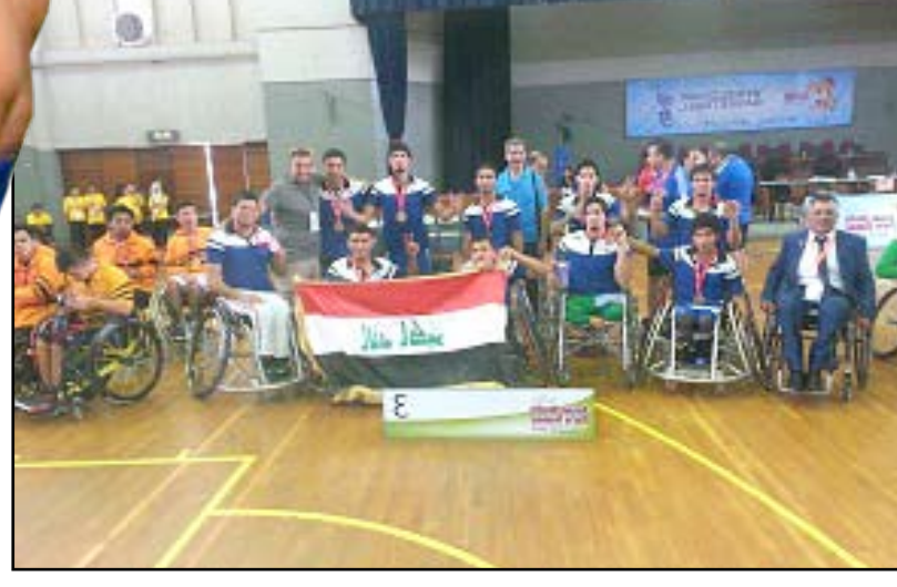
وفد البارالمبية عقب اختتام الدورة الآسيوية