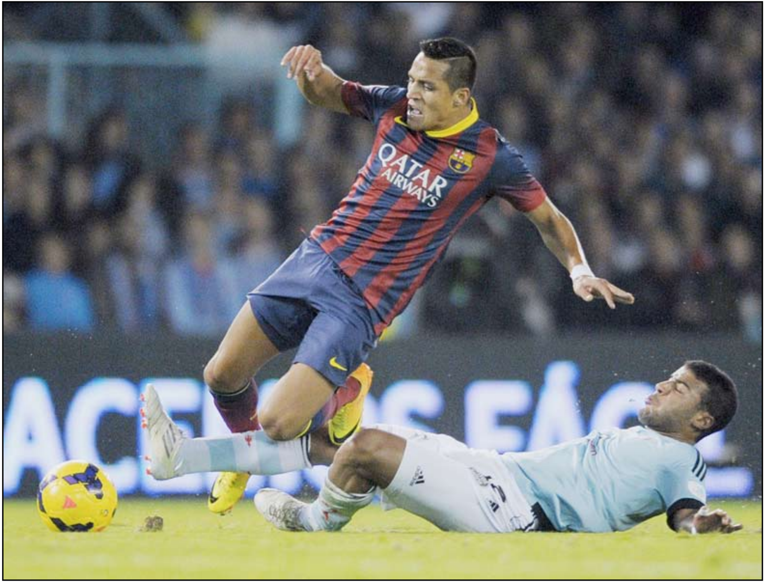
برشلونة يعزز موقعه في الصدارة

مع خينافي، وغرناطة مع ألتيتكو مدريد، وريال بيتيس مع ليفانتي، وأتلتيك بلباو مع التشني. ومن جهة أخرى أشارت صحيفة الموندو ديبورتيفو الكتالونية أن برشلونة بمن فيها من لاعبين وجماهير طالبت القديس ايكر كاسياس حارس مرمرى ريال مدريد بالتوجه صوب عرين البرسا من أجل الاحتراف هناك بعد اكتفاء أنشيلوتي بإراحته على مقاعد البدلاء لمشاهدة الكلاسيكو بقلب محروق كونه يغيب عنه للمرة الأولى.