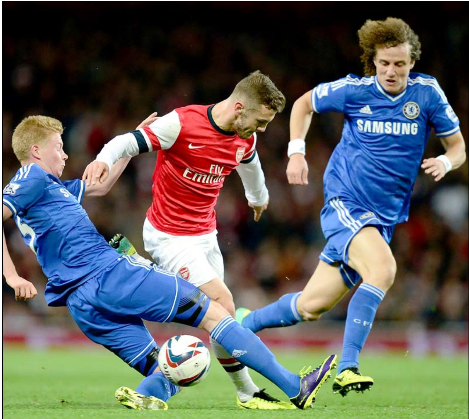
تشيلسي يتأهل الى الدور ربع النهائي لكأس الرابطة

نفسه، الذي يعتد عنه بنقطتين فقط على سلم الترتيب. وبالرغم من غياب العديد من العناصر الأساسية عن صفوف الفريقين في المسابقة التي لا تحظى بذات الأهمية التي يتمتع بها دوري أبطال أوروبا والدوري الإنكليزي، إلا أن التشكيلين لم تحل من بعض العناصر التي لا تبخل عادة في جلب المتعة للمتابعين، ولعل أبرزهم الإسباني سانتياغو كازورولا والويلزي أرون رامسي وجاك ويلشر من جانب أرسنال والبرازيلي ويليان والإسباني خوان ماتا والكاميروني صامويل إيتو من جانب تشيلسي.