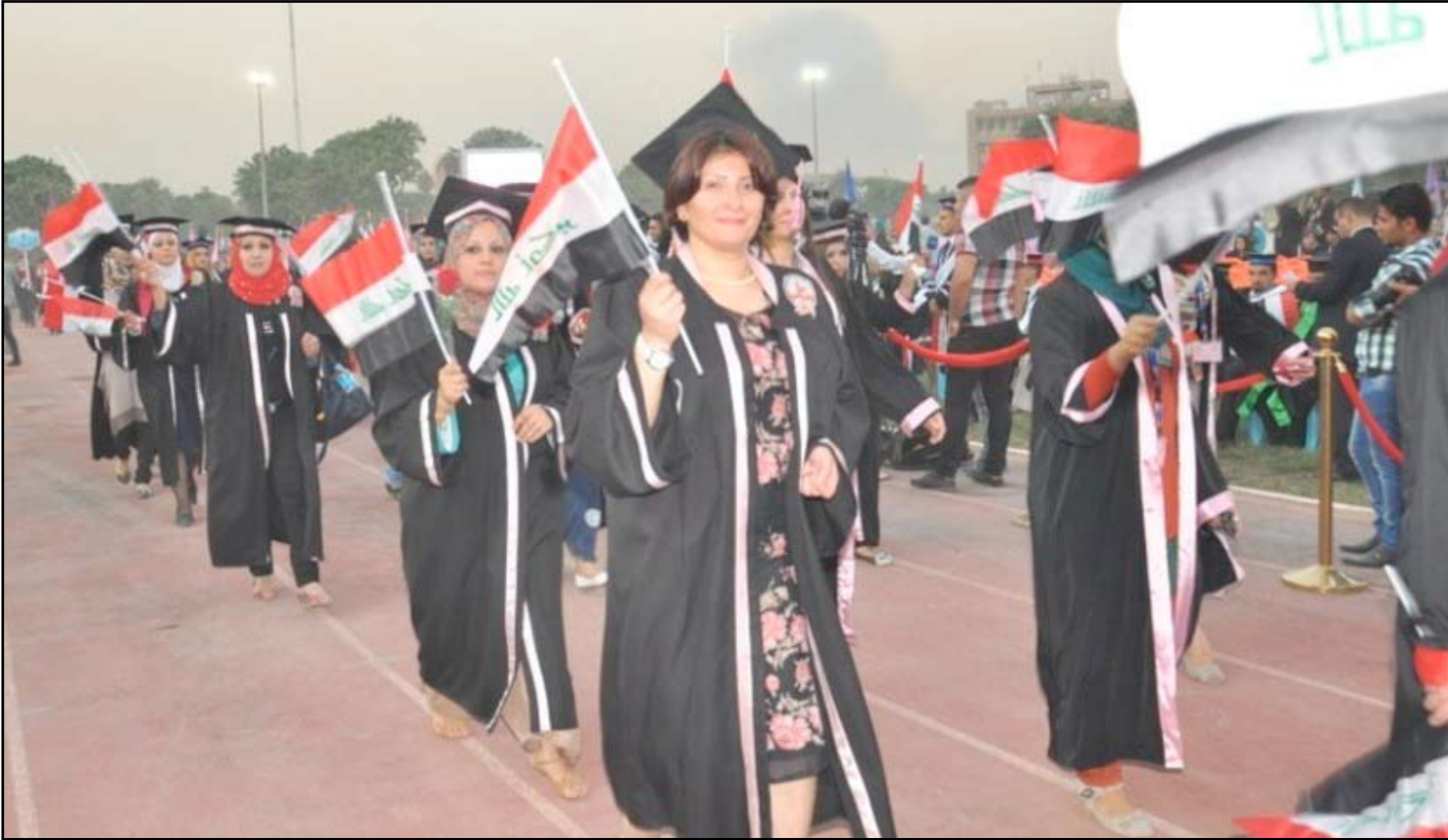
تخرج دفعة من طلبة الجامعات في بغداد... أرشيف

أعلنت كلية طب الكندي، أمس الأربعاء، أنها على أعتاب الحصول على الاعتراف الدولي بشهاداتها، مؤكدة على الاستنثار العام من أجل ذلك، وفيما أشارت إلى الحصول على الاعتراف من قبل جامعة كاليفورنيا الأمريكية، أكدت رئاسة جامعة بغداد أن لديها مشكلة في طرق التدريس الخاصة بكلية طب.