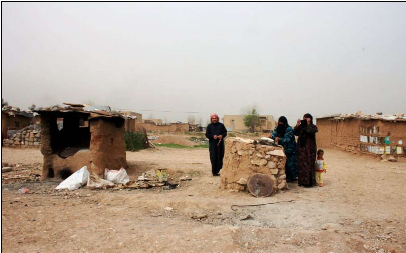
مهجرون في نينوى

ر هرف شهاب المجنون بذراعيه، وأخذ يركض بين الحشود في باب الطوب وسط الموصل متمصاً دور نورس محلق، وبعد مشاجرة صغيرة بينه وبين عمال بلدية الموصل، بسبب نبشه كومة من نفايات هدم تعب جمعها، عاد ليحيط قرب عربته الخشبية، وأخذ يصيح: أربعة بالف، الواحد بربع.