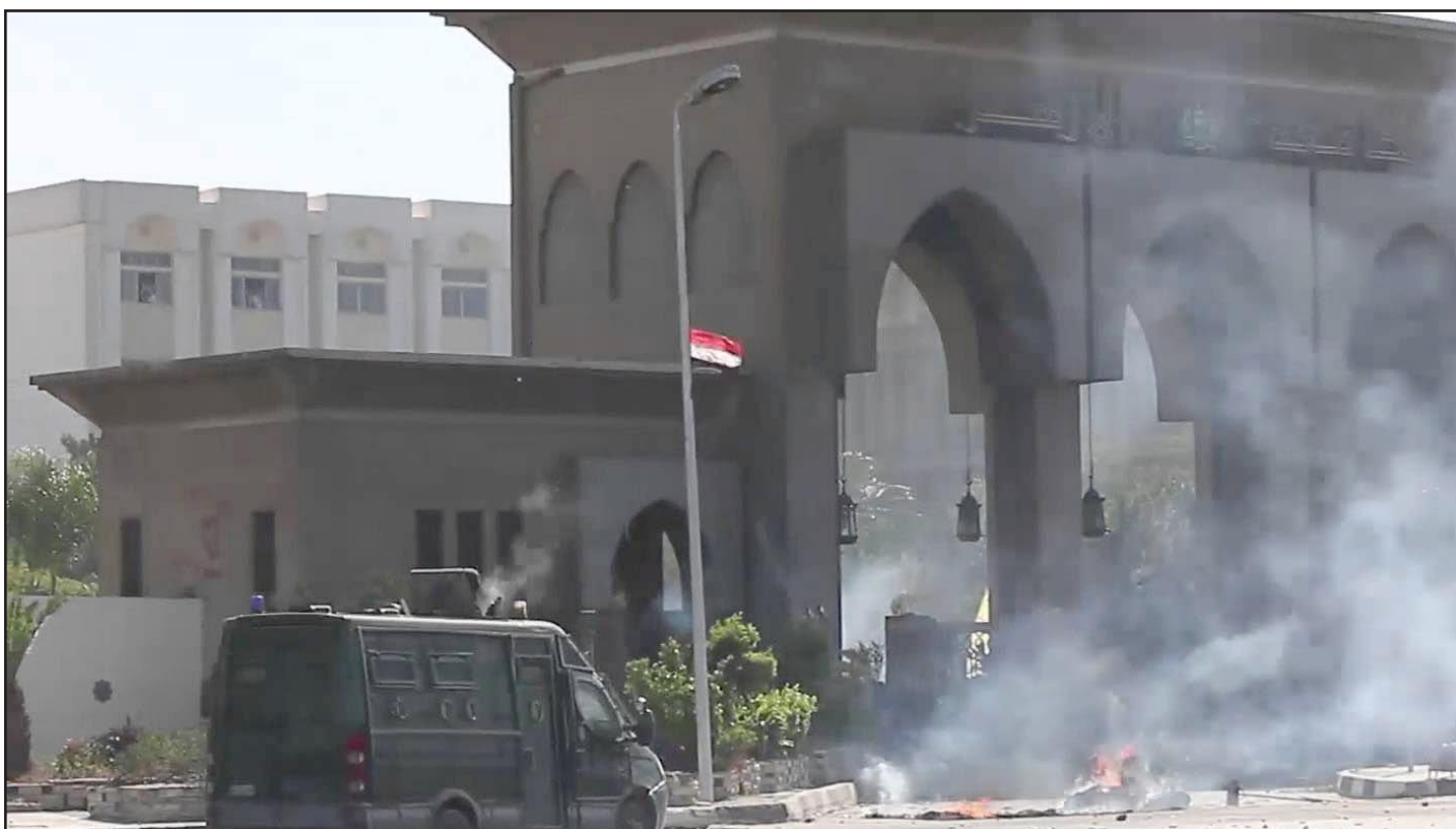
استخدام الغاز السيل لتفريق الطلبة

التي نشرها على صفحته الرسمية بموقع "تويتر"، كما نشرتها الصفحة الرسمية لحزب "الحرية والعدالة" على موقع "فيسبوك"، قائلاً لأنصار جماعته: "اطمئنا، وإلى لقاء"، ولم تتضمن الرسالة مزيداً من التفاصيل. وكانت وزارة الداخلية قد أعلنت أنها تمكنت من اعتقال القيادي الإخواني فجر الأربعاء، بعد تحديد مكان تواجد في "القاهرة الجديدة"، الأمر الذي أكدته ابنة العريان، الذي يعتبر من بين آخر كبار قيادات الجماعة المتواجدين خارج السجن، بعد عزل الرئيس مرسي.