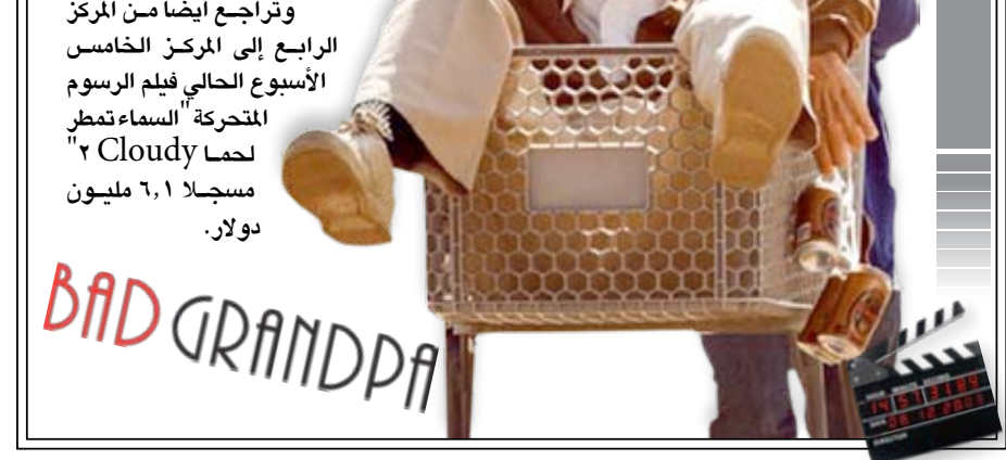
٦.١ مليون دولار.

كما تراجع فيلم الكابتن فيلبس Captain Phillips