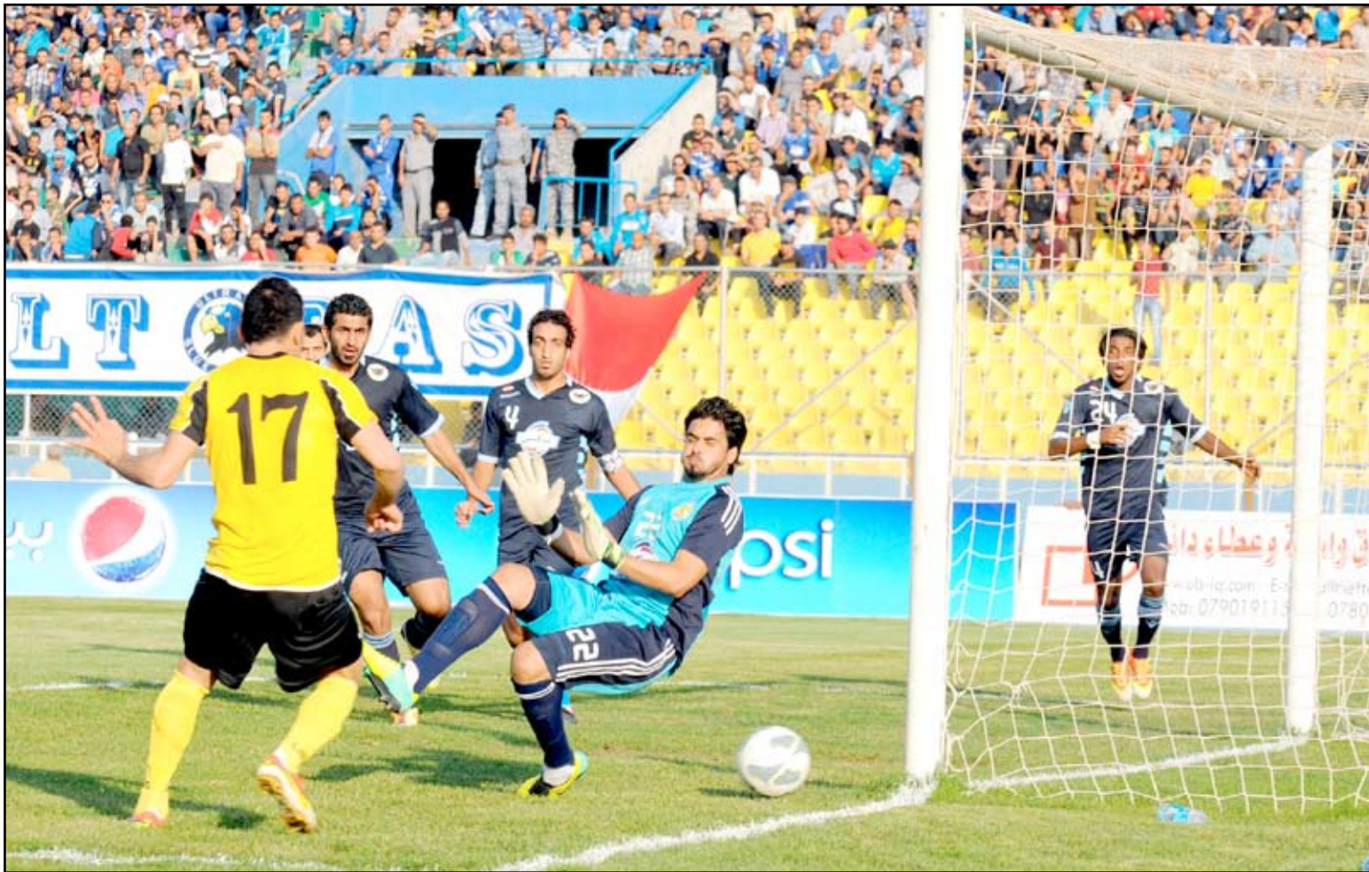
أربيل يصدم الجوية بثلاثية الجولة الأولى...

من الدور الاول قد اسفرت عن فوز الشرطة على الزوراء (١-٠) وتعادل ميسان لم يكن عادلاً لكون فريقنا كان الأفضل في المباراة وعلى مدار الشوطين.