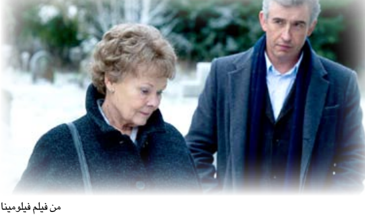
من فيلم فيلومينا