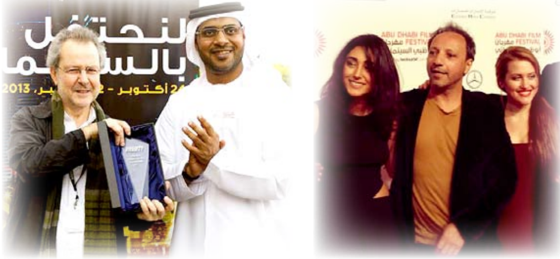
فريق عمل فيلم بلادي الحلوة.. بلادي الحادة