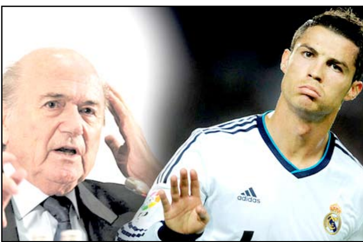
رونالدو يرد على استهزاء بلاتر به

رد البرتغالي كريستيانو رونالدو جناح ريال مدريد الإسباني بعنف على السويسري جوزيف بلاتر رئيس الاتحاد الدولي لكرة القدم الذي وصفه بـ "قائد على أرض الملعب". واستهزأ بلاتر الأسبوع الماضي لدى دعوته أمام مجموعة من طلاب جامعة أوكسفورد كون نجم ريال مدريد ينفق "أكثر" على تصفيف شعره مقارنة مع منافسه نجم برشلونة الأرجنتيني ليونيل ميسي. وقال رونالدو على صفحته الشخصية على فيسبوك: يظهر