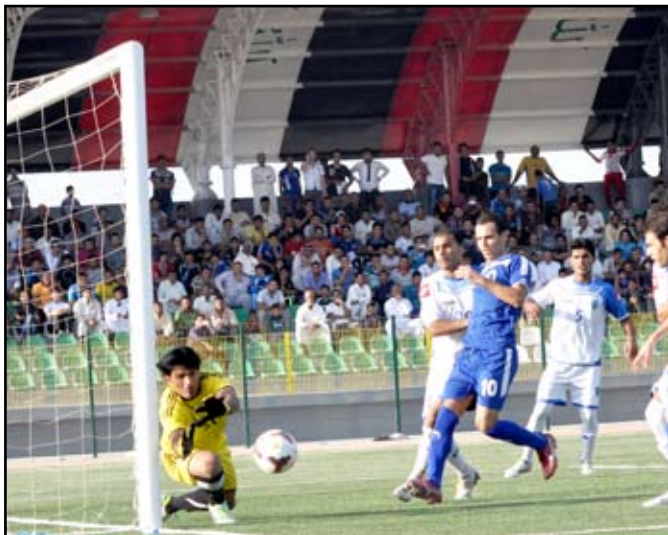
الميناء اضاع فرصاً سهلة امام نفط الجنوب

نفسه سعيد محسن برأسه إلا أنها أخطأت الرمي الى خارج الملعب بقية دقائق الشوط الأول لم تعرف فرصاً