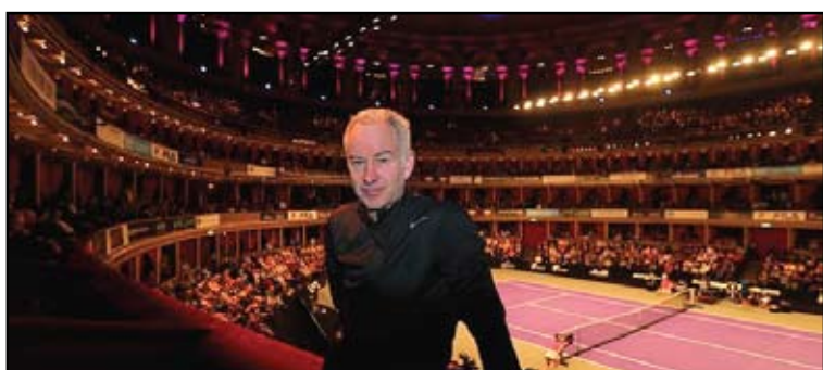
نجم التنس السابق جون ماكرو

حالياً في العاصمة البريطانية لندن بمشاركة العديد من اللاعبين البريطانيين والمشاهير. وأوضح "إذا ألغيت منافسات الزوجي