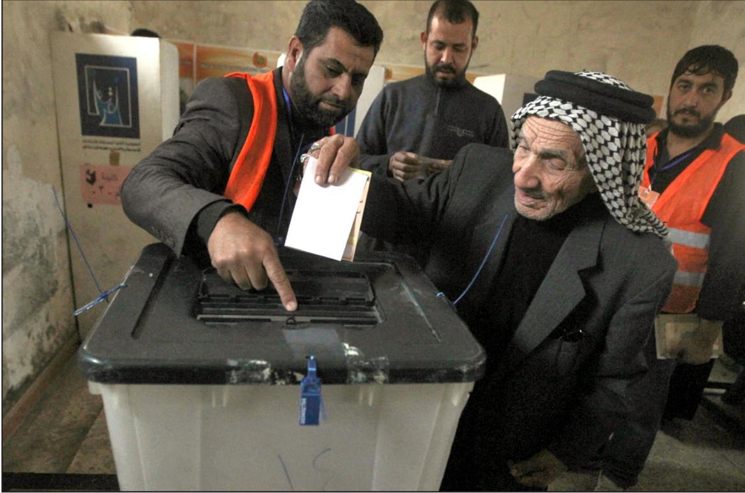
احد انصار التيار الصدري يدلي بصوته في الانتخابات التمهيدية التي يجريها التيار لانصاره قبل اقتراع البرلمان المقبل

تحالفاتها، زادت مكاسيها، مشيراً إلى أن دخول الانتخابات بقوائم صغيرة "لن يكون في مصلحتها". ويرجح الملاي في تصريح يوم امس لـ "المدى" أن نتائج الانتخابات القادمة لن تأتي بكتل جديدة، مادامت الكتل الكبيرة هي من ستحصل على الأصوات الأكثر، وتشتت أصوات الكتل المتوسطة والصغيرة، لافتاً إلى عدم قدرة الكتل السياسية على الحصول على الاكثريه وستواجه في مرحلة تشكيل الحكومة المقبلة عراقيل كثيرة للحصول على التوافق.