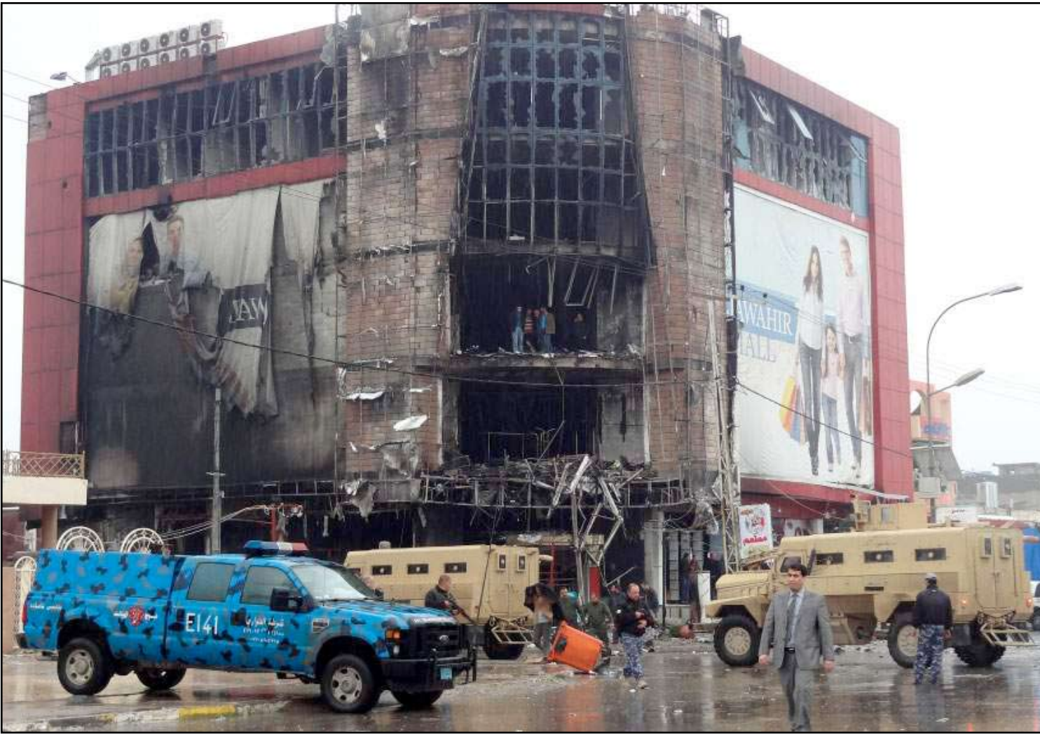
مجمع جواهر التجاري بعد الاشتباكات بين مسلحي القاعدة والقوات النظامية

ناشد أصحاب مجمع جواهر التجاري في كركوك، أمس السبت، الحكومتين الاتحادية والمحلية النظر في تعويضهم للضرر الذي لحق بمشروعهم الذي يحمل أول إجازة استثمارية بالمحافظة ويضم ٦٨ محلاً تجارياً، وفي حين بينوا أن لجنة التعويضات المركزية أدت تضرر المجمع بنسبة مئة بالمئة، وتعهدوا بإعادة إعمارهم خلال ستة أشهر.