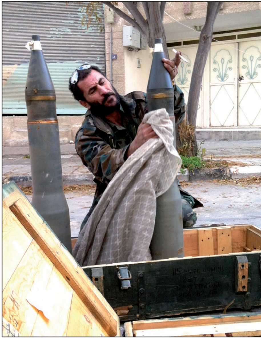
جندي سوري يقوم بتنظيف قذيفة في بلدة البك...