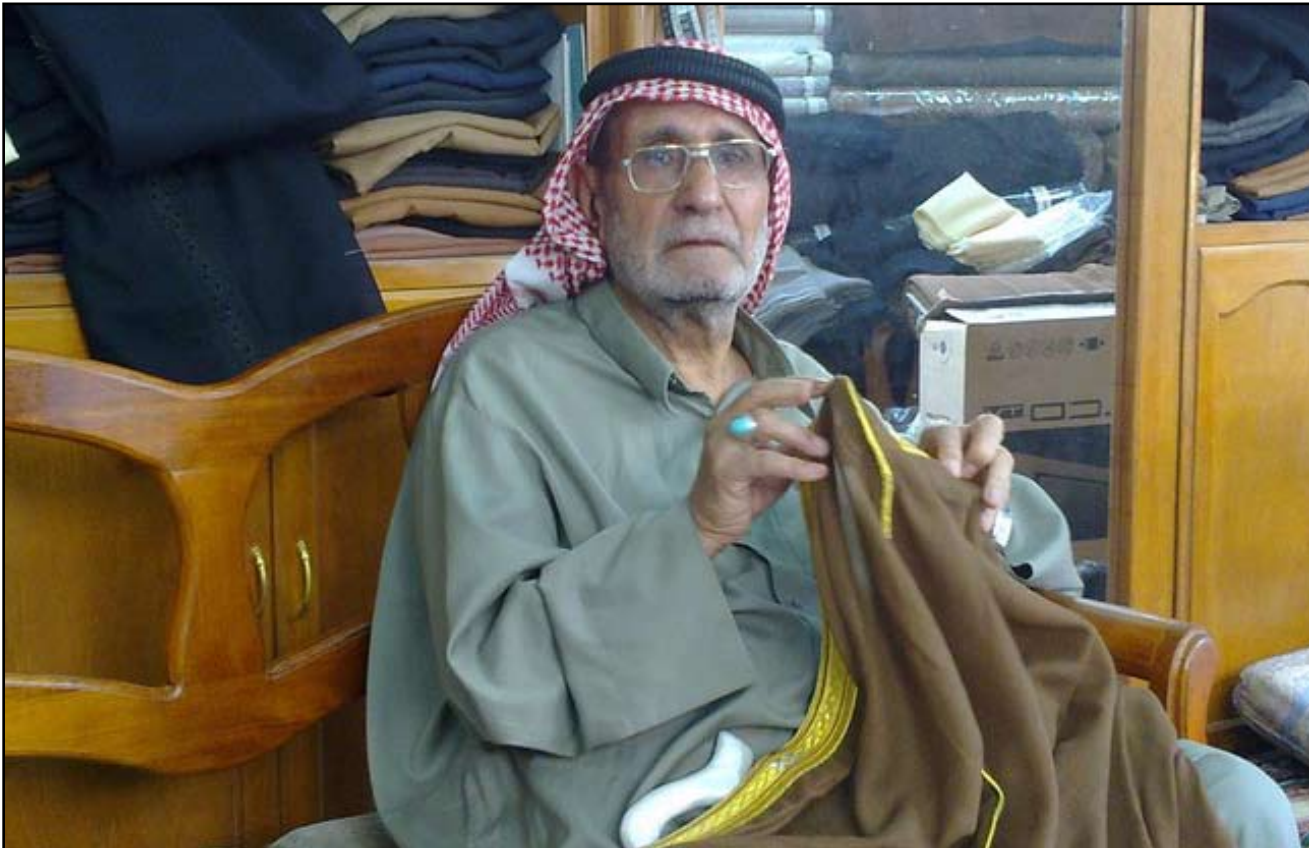
أحد رواد صناعة العباءة الرجالية في العراق.. أرشيف

طالما كانت عباءة عنواناً للعربي، وطالما اعتبرها أهالي مدينة العمارة، جزءاً من تراثهم وعنواناً للرجولة والأصالة والوجود والكرم، لذلك حافظوا عليها برغم ما تكلفه من مبالغ قد تتجاوز المليون دينار للعباءة الواحدة، وتبادل الأزياء والعادات، وانتشار الملابس الغربية".