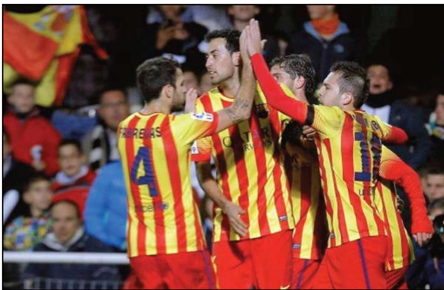
البارشا يحقق فوزاً سهلاً على قرطاجنة