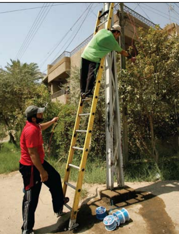
ترقيع في التأسيس

منطقة (سبع بكر) وبالتحديد المنطقة الممتدة من سوق السمجة حتى دائرة الوقف السني محلة (٣٢٢)، تعاني من انقطاع مستمر للتيار الكهربائي على الرغم من كونها تابعة لمنطقة الأعظمية التي تصلها الكهرباء على مدار اليوم من غير انقطاع.