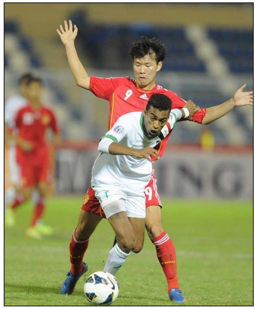
ارلمينا يحصد العلامة الكاملة