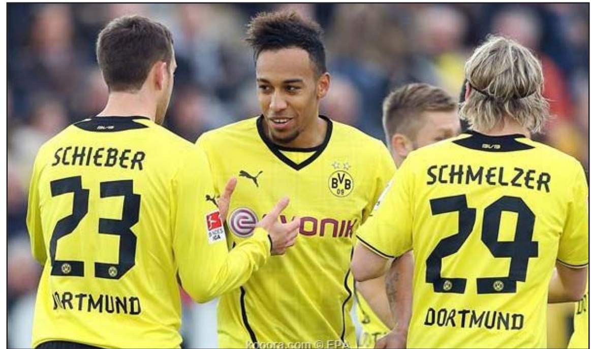
دورتموند يسعى لمواصلة الانتصارات في جولة الإياب

لاسيما في ظل تماثل لاعبي الفريق المصابين للشفاء سيؤمن تماما حصول دورتموند على أحد المراكز الثلاثة الأولى في المسابقة، ومن ثم التأهل مباشرة إلى بطولة دوري أبطال أوروبا. يحتل دورتموند حاليا المركز الرابع بالبنودسليغا، ومع اقتراب غريمه