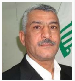
النائب عزيز المياحي

"إن بقاء الموازنة بشكلها الحالي غير المتوازن في توزيع الحقوق وإعطاء الأولوية للمحافظات المنتجة للنقط على حساب باقي المحافظات والانشغال بالمطالب الكردية كل هذه الأمور ستجعلنا نرفض التصويت على الموازنة ما لم يتم إعادة النظر فيها بالشكل الذي يحقق العدالة والمساواة بين جميع المحافظات، إن الموازنة يجب ان تراعي حقوق الشعب العراقي كاملة كونهم متساوون من حيث الحقوق والواجبات".