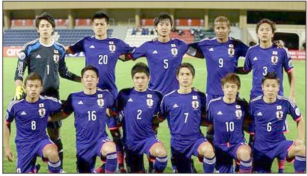
منتخب اليابان ينتظر مفاجأة عراقية

وكما هو معتاد، فإن أغلب البطولات التي يشارك بها منتخبنا الكروي، يُقدم فيها اسماً جديداً الى عالم النجومية، وما هو مروان حسين يدخل سجلات النجومية من بوابة المنتخب الاولمبي،