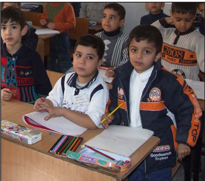
غياب الرياضة والفنية