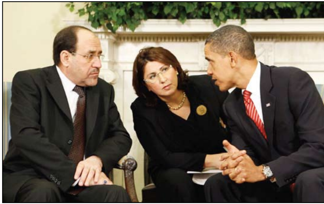
نوري المالكي وأوباما

ووقع العراق والولايات المتحدة خلال عام ٢٠٠٨، اتفاقية الإطار الاستراتيجي لدعم الولايات والوكالات العراقية في الانتقال من الشراكة الاستراتيجية مع جمهورية العراق إلى مجالات اقتصادية ودبلوماسية وثقافية وأمنية، تستند إلى تقليص عدد فرق إعادة الإعمار في المحافظات، فضلاً عن توفير مهمة مستدامة لحكم القانون بما فيه برنامج تطوير الشرطة والانتهاج من أعمال التنسيق والإشراف والتقرير لسندوق العراق للإغاثة وإعادة الإعمار.