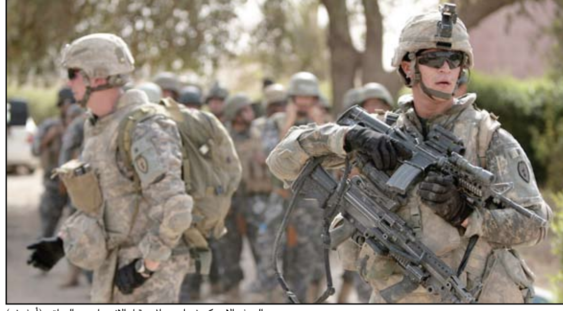
الجيش الامريكي في إحدى المدن قبل الانسحاب من العراق - (أرشيف)

وقالت الشبكة ان هذا الموقع، المعني بأخبار المشاهير والشائعات، ذكر ان لديه ٤١ صورة يعتقد أنها التقت في الفلوجة في العام ٢٠٠٤. ونشر الموقع ٨ صور منها فقط، قائلًا ان بقية الصور مثيرة جدا. وفي رد فعل على الصور المنشورة، قالت وزارة الدفاع الاميركية ان "الأفعال التي التقطتها هذه الصور ليست مما نتوقعه من أفراد قواتنا، ولا هي تمثل مليونين ونصف المليون من الشرفاء والمهنيين من قواتنا التي خدمت العراق وأفغانستان". وأضافت الوزارة ان "قوات المارينز تجري حالياً تحقيقاً بصحة تلك الصور، والظروف التي أحاطت بها، وإذا صحت، فإنها مستحقة بهوية العسكريين المتورطين. وستحدد نتائج هذه التحقيقات ما إذا ستمتكن من المضي قدماً بإجراء تحقيقات بشأن أي نرى