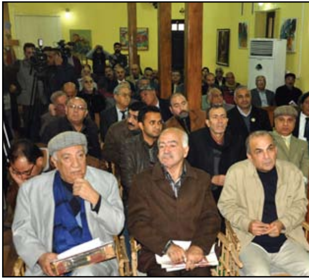
جانب من الحضور الكبير

عبد الرزاق.. ثم جاءت موجة الأفلام الدعائية أيام الحرب العراقية الإيرانية مثل فيلم (الحدود المتهدية) لصاحب نعمة وفيلم (القادسية) للمخرج المصري صلاح أبو سيف وفيلم (المسألة الكبرى) إخراج محمد شكري جميل وشارك في الإلمارة والتصوير فنانون إنجليز.. وهكذا.. ثم توقف الإنتاج السينمائي أيام الحصار.. وبعد التغيير لم تظهر أية بادرة للإنتاج السينمائي سوى في سنة ٢٠١٣ حيث قامت وزارة الثقافة بصرف مبالغ طائلة لإنتاج أفلام لم يظهر منها ولا فيلم واحد حتى الآن.. وأنا بدوري أقول: اني أشك بان للسينما العراقية مستقبلا ابدا، لأن السينما صناعة وتحتاج الى بنية تحتية وهي غير موجودة، والسينما موجودة، تحتاج الى السوق وهي غير موجودة، والسينما فن وتحتاج الى فنانين مقتدرين وهم بعدد أصابع اليد، بينما في ذلك الوقت نجح فيلم "سعيد أفندي" جماهيريا وتجاريا لأسباب منها انه تناول مشكلة أزمة السكن إذ كان بطل الفيلم يعمل مدرسا وكان يبحث عن دار يسكنها مع عائلته لكنه لم يجد ولم يجد..