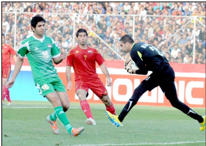
تحرك عربي واسع لرفع الحظر عن الملاعب العراقية

قدم الوفد العراقي شرحاً مفصلاً عن القضايا الرياضية والحظر المفروض على الملاعب العراقية وحرصاً من الجماهير العراقية من الجماهير الرياضية العراقية من اللبنانيين في مقر اللجنة، وجرى استعراض العلاقات بين البلدين الشقيقين وسبل تطويرها كما عرض موضوع الحظر المفروض على الملاعب العراقية واستمراره وتأثيره على الرياضة العراقية وحرصاً من جماهيرها من حق مؤازرة ومتابعة منتخباتها وأنديةها وقد تم الاتفاق على بعض الإجراءات التي تؤدي الى رفع الحظر لاسيما ان طوني يتمتع بتأثير واسع وكبير في الأوساط الاولمبية الدولية (فيفا) ووعده بمواصله المشاورات بخصوص الموضوع.