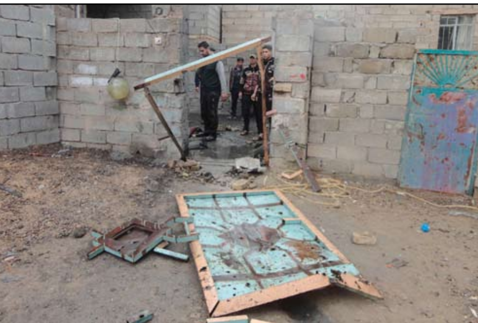
اثار الواجهات المسلحة في مدينة الفلوجة امس - ا ف ب

دعا إمام جمعة الفلوجة، الحكومة لسحب الجيش من الأنبار وإيقاف القصف العشوائي ضد منازل الأبرياء"، واعتبر جماعية بقصف المنازل بالهاونات والمدافع والطائرات منذ عشرة ايام، وطالب الأمم المتحدة والجامعة العربية بالتدخل.