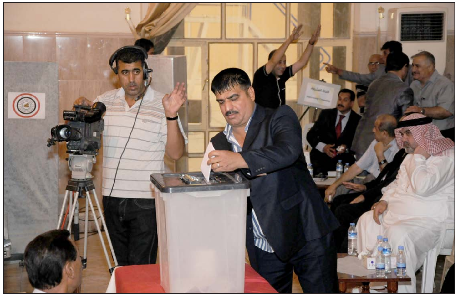
جانب من انتخابات اتحاد الكرة في حزيران ٢٠١١

وأشار المصدر إلى أن خوف عدد من أعضاء الاتحاد من الخسارة كان السبب الرئيس وراء قرار إلغاء الانتخابات في الطلب الذي تقدم به سبعة من أعضاء الاتحاد إلى الاتحاديين الدولي والآسيوي وكذلك محكمة (كاس) والتمسك بمقاعدهم لأطول فترة ممكنة لاسيما بعد أن شعروا في الأيام الأخيرة بأنهم سيكونون خارج مجلس إدارة الاتحاد الجديد في حالة إجراء تلك الانتخابات.