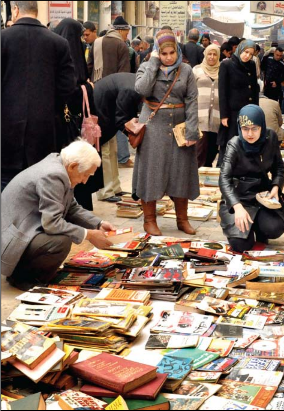
روداد شارع المتنبي عند إحدى بسطات بيع الكتب أمس...