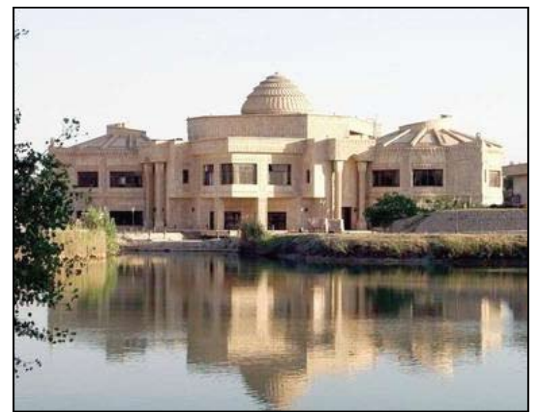
أحد القصور الرئاسية في بابل...