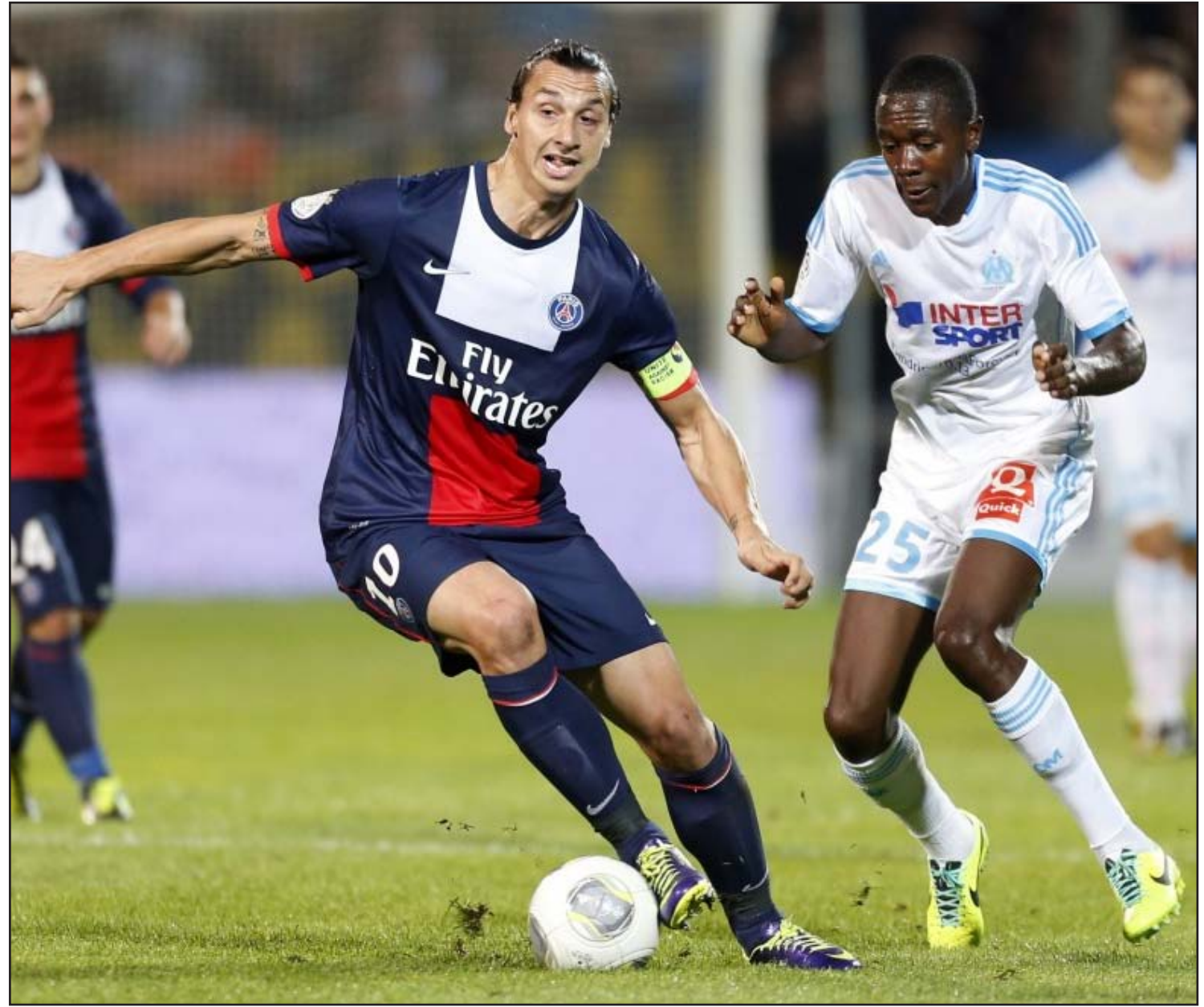
سان جيرمان يطمح المحافظة على انفراده بالصدارة

وكان بلان قادرا على تدوير تشكيلته في لقاء بوردو، فأخرج النجم السعودي زلاتان إبراهيموفيتش بين الشوطين، ومنح الأرجنتيني خافيير باستوري وبلين ماتويدي والشاب أنريان رابيو فرصة اللعب من بداية المباراة. وعن استمرار المنافسة في أربع بطولات، قال بلان: "كنت راضيا عن الأداء الفردي للاعبين، لكن خصوصا من اللعب الجماعي. تلعب على كل الجبهات، وليس لدينا أية مخاوف من إصابات حقيقية أو