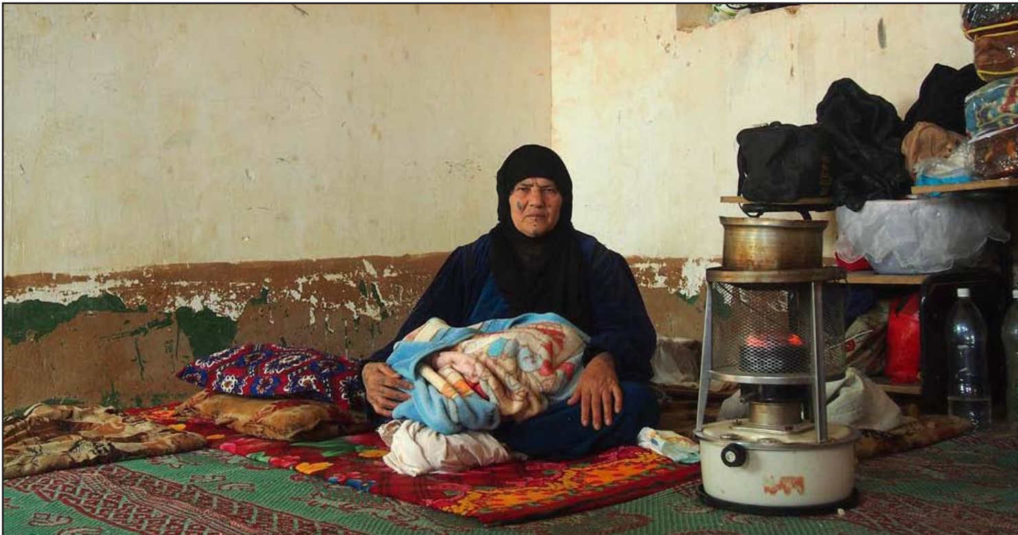
امرأة نازحة من الأنبار جراء الاقتتال بين القوات الحكومية والمسلحين.. أرشيف

أعلنت منظمة الصليب الأحمر الدولية في العراق، امس الجمعة، عن مساعدة أكثر من 12 ألف نازح من المناطق التي تشهد عمليات عسكرية في العراق، ولفتت إلى أن أهالي الأنبار يعانون ظروفًا معيشية قاسية، وهي حين دعت أطراف النزاع إلى السماح لفرقها بإيصال المساعدات، أكدت أن شبوخ العشائر والجمعيات المدنية يساعدها في إيصال المساعدات.