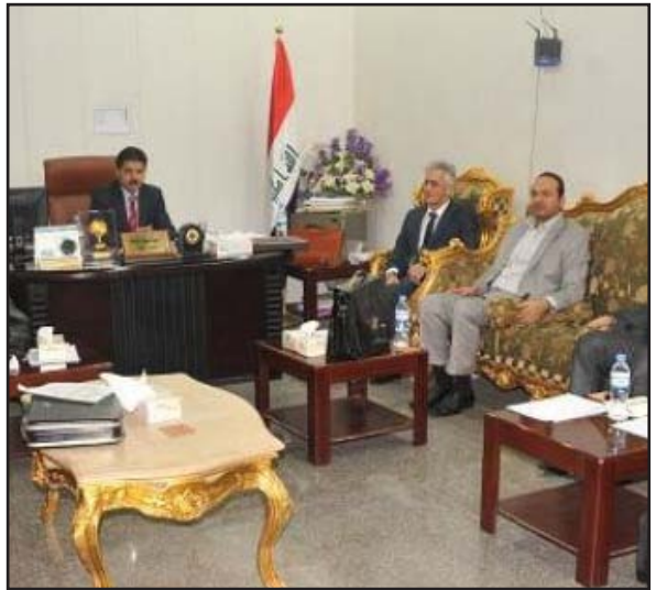
لجنة الشباب في اجتماع سابق مع اتحاد الكرة

واختتم بيان لجنة الشباب والرياضة البرلمانية أنها مع الرأي والمسورة التي أعطاها مجلس شورى الدولة المتعلقة بانتخابات اتحاد الكرة بتشكيل لجنة مؤقتة من البداية كما نطلب من الهيئة العامة للاتحاد المذكور النهوض بمسؤولياتها القانونية كأعلى سلطة في اتحاد الكرة من ناحية اختيار الأفضل والأنسب لقيادة الرياضة العراقية وتعديل النظام الداخلي ليشمل الكفاءات الرياضية في قيادة الاتحاد العراقي لكرة القدم مستقبلاً من اجل إنقاذ سمعة العراق الرياضية في دول العالم.