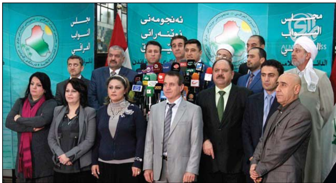
مؤتمر لكتلة التحالف الكردستاني - أرييف

أدى تمرير الحكومة لموازنة ٢٠١٤ وإرسالها إلى مجلس النواب إلى انقسام برلماني حاد يهدد بشل المؤسسة التشريعية، لا سيما بعد فشل المجلس في عقد جلسة الخميس ورفعها إلى "إشعار آخر".