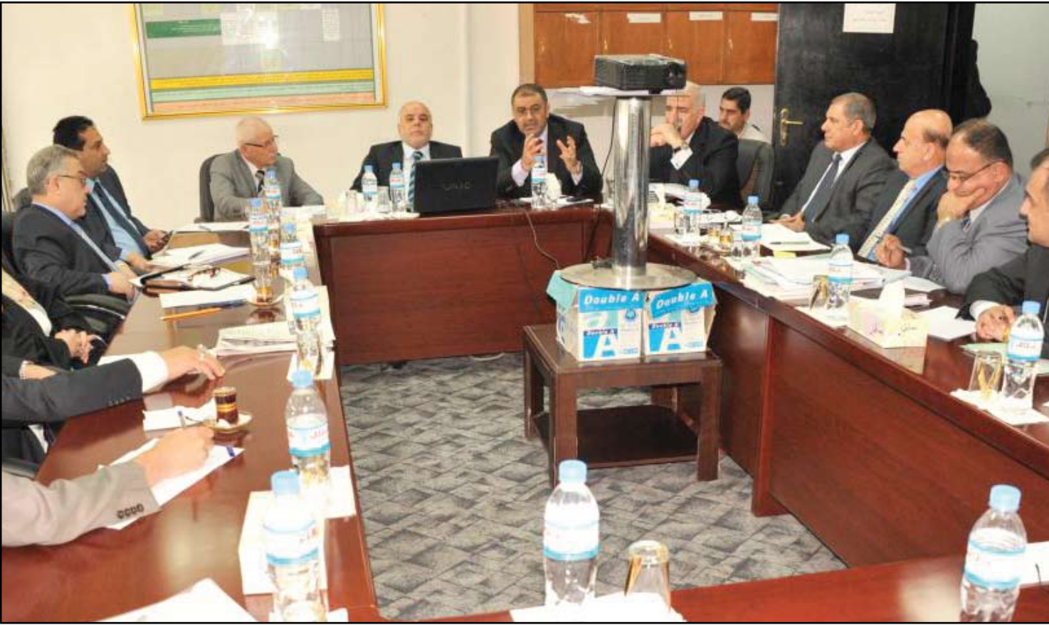
اجتماع اللجنة المالية النيابية مع محافظ البنك المركزي ومسؤولين حكوميين - أرشيف

الاتحادية لعام ٢٠١٤ سيشهد صعوبة في تمريرها وأنها تحتاج الى اضافة بعض الفقرات ومنها ما يخص مستحقات الشركات النفطية العاملة في إقليم كردستان كما تحتاج إلى مفاوضات بين الكتل السياسية التي تتطلب مزيداً من الوقت. ولفت الى ان "الفصل التشريعي الحالي سينتهي في ٤/١٤ لكن عدم تمكن البرلمان من إقرار الموازنة سيمنح لرئاسة البرلمان تمديد الفصل التشريعي الحالي شهرين، مؤكداً ان الكتل السياسية تريد إقرار الموازنة في اسرع وقت.