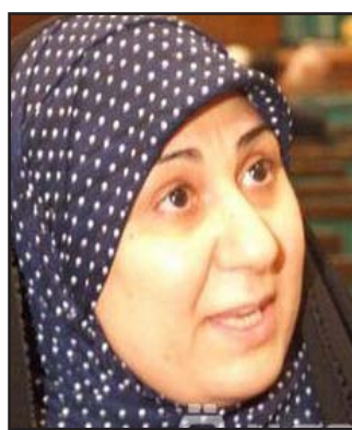
النائب ايمان جلال

ان تعدد العطل والمناسبات الدينية الرسمية وغير الرسمية تعد ظاهرة غير ايجابية حيث ان مجموع العطل في السنة الواحدة وتأثيره على الدراسة ومستوى الطلبة يكون كبيراً، وأكد عضو لجنة التعليم البرلمانية النائب جواد البرزوني في تصريح