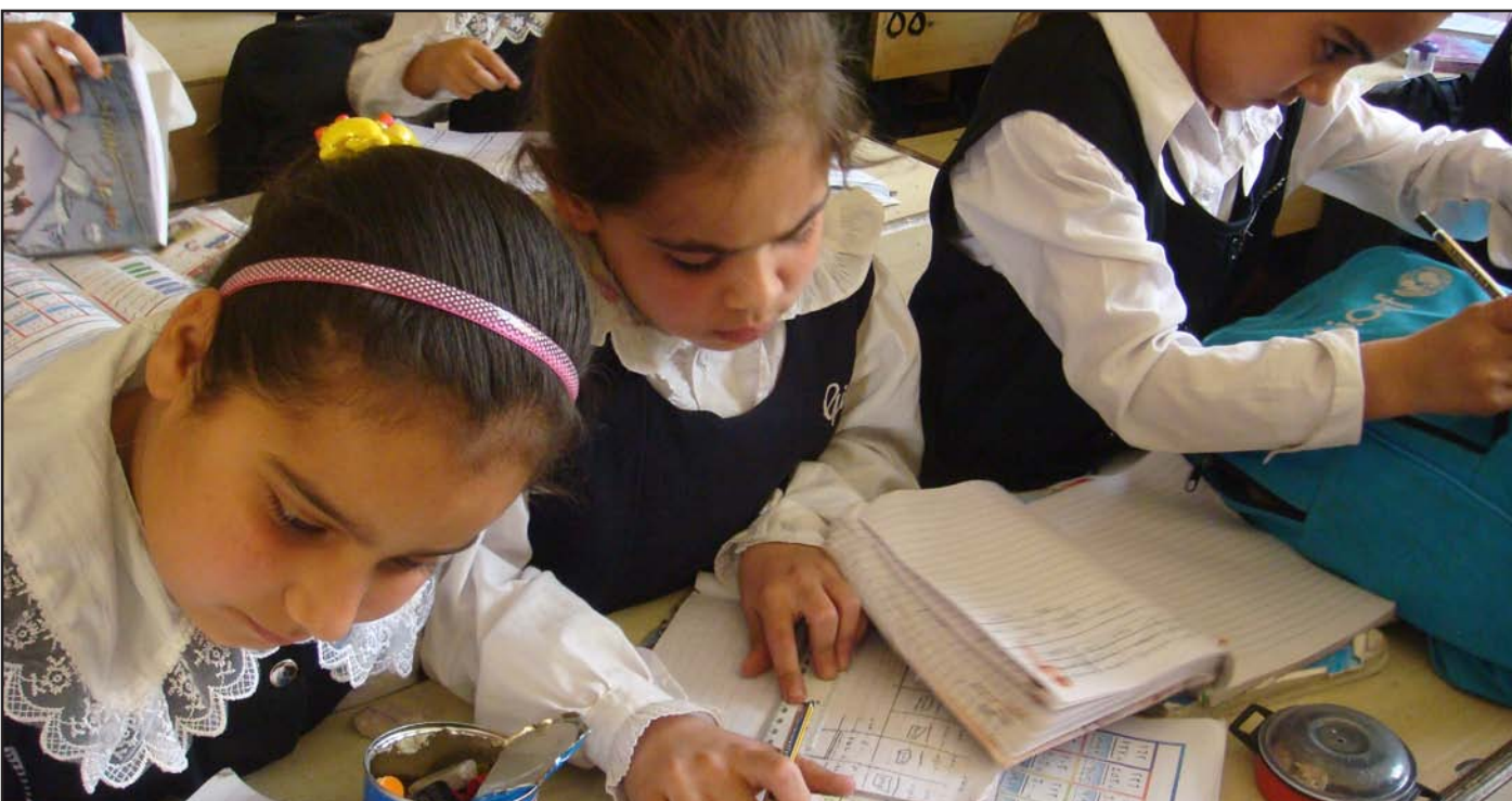
عدم اكمال النامح