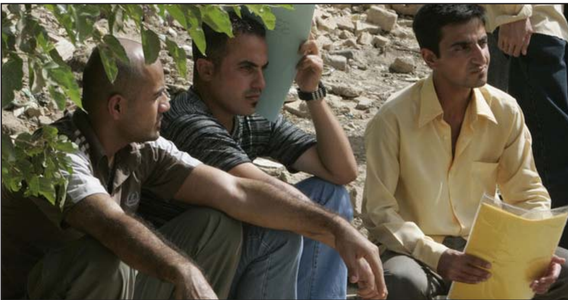
شباب يجلسون أمام أحد الدوائر الحكومية طلباً للتعيين

وبشأن حصة إقليم كردستان في الموازنة العامة، بين الصافي أن "حكومة الإقليم لم ترد على مقترح وزارة النفط حول المقترحات التي تمت مناقشتها بين رئيس مجلس الوزراء نوري المالكي وحكومة إقليم كردستان، ولهذا وجدت الحكومة أن الوقت استنفد وعليها إرسال الموازنة للبرلمان من أجل ضمان حقوق الإقليم والمركز". وكان رئيس مجلس النواب العراقي أسامة النجيفي قد قرر الخميس (١٦