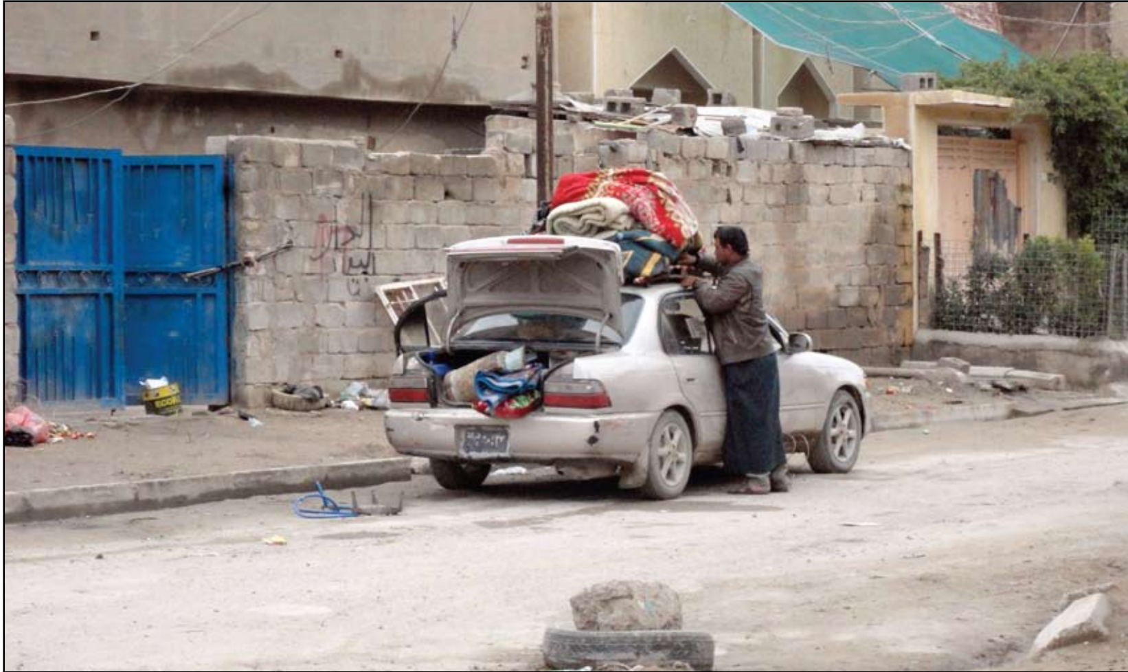
أحد سكان الأنبار يغادر منزله بسبب الاشتباكات الجارية في المدينة