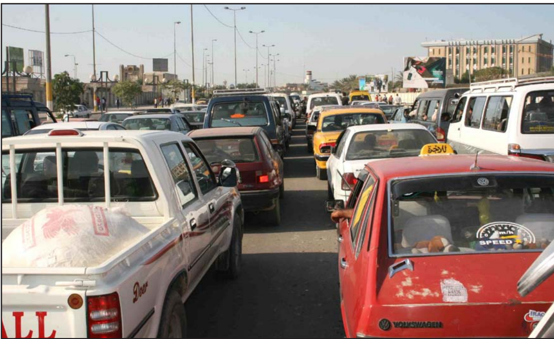
زخم مروري في منطقة العراوي.. أرشيف