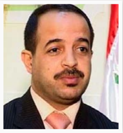
وزير التربية محمد تميم

"المجلس سيلجأ الى خطوات جديدة لتسريع وتيرة تنفيذ المشاريع التي يجري العمل فيها داخل المحافظة والتي مازال العمل فيها متلكنا على الرغم من انتهاء المدة الزمنية المحددة لها، اذ سنوقف السلف والمستحقات المالية للمقاولين والشركات او سحب العمل منها بالاتفاق مع الحكومة التنفيذية في المحافظة، أن العديد من مشاريع المجاري والطرق والخدمات الأخرى خاصة في مناطق مركز مدينة الناصرية ما زال العمل فيها متلكي".