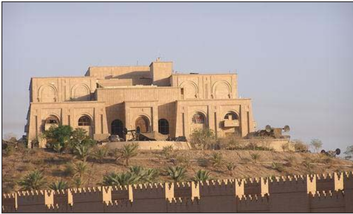
القصر الرئاسي في مدينة بابل الأثرية.. أرشيف

أعلنت لجنة السياحة والآثار في مجلس محافظة بابل، أنها ستقدم طعنا إلى رئاسة مجلس المحافظة لنقض قرار المجلس القاضي بتخصيص ٦٠٠ مليون دينار، لترميم الطابق الثالث في القصر الرئاسي لإنشاء فضائية، وعدته "بالخاطي" لأنه يضر بعودة بابل إلى التراث العالمي، وطالب بتحويل القصر إلى متحف، وفيما أكد المجلس أن قراره "صائب" دعا وزارة السياحة إلى ترميم المتاحف القديمة.