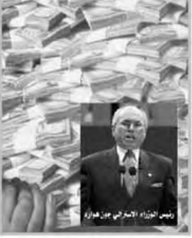
مبادرة استراتيجية في قمة أوكلاند سوق مشتركة لدول المحيط الهادي

ويقتول تقرير المراجعة "مع وجود (سلاح) خارق للأرض بشكل أكثر فاعلية، سييمكن مهاجمة الكثير من الأهداف المدفونة باستخدام سلاح أصغر قدرة بكثير من المطلوبة لسلاح يستهدف سطح الأرض، ويضيف "ستحقق القدرة التدميرية نفس الردود بينما تنتج عنها آثار أقل (بمضروب عشرون) في العشرين). ويتابع "سيبلغ الاستعانة بأسلحة اخترق ذات قدرة كبيرة لضرب منشآت عميقة جدا في باطن الأرض أو أخرى أضخم حجما".