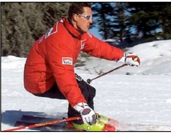
تفاقم الحالة الصحية لشوماخر

في منتجع ميريبيل في جبال الالب الفرنسية. ويرقد شوماخر منذ تعرضه لحادث التزلج في جبال الالب الفرنسية في المستشفى حيث وضع في غيبوبة مصطنعة لتخفيف الضغط عن دماغه بسبب الإصابة الخطيرة التي تعرض لها بعدما ارتطم رأسه بصخرة بعد سقوطه خلال تزلجه خارج المسار في محطة ميريبيل للتزلج. وتحطمت الخوذة التي كان يرتديها سائق فيراري السابق الى تصفيين قبل ان ينقل الى