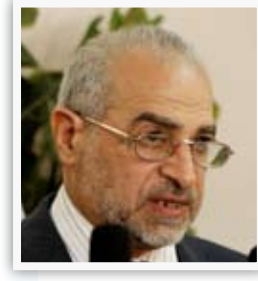
النائب عبد الهادي الحكيم

"يوماً بعد يوم تثبت الاجراءات والسياسات التي تتبعها الوزارات السيادية تجاه محافظة كربلاء انها تتصف بالإهمال واللامبالاة بصورة تتركس الظلم إزاء كربلاء والإمام الحسين [ع]، على الرغم من وضع كربلاء المحلي والدولي والإسلامي ومكانتها المميزة عن بقية المحافظات والجميع يشهد بذلك إلا ان تلك الاعتبارات لم تشكل أهمية لدى الحكومة المركزية خصوصاً على صعيد التخصيصات المالية او المشاريع التنموية الواجبة إقامتها".