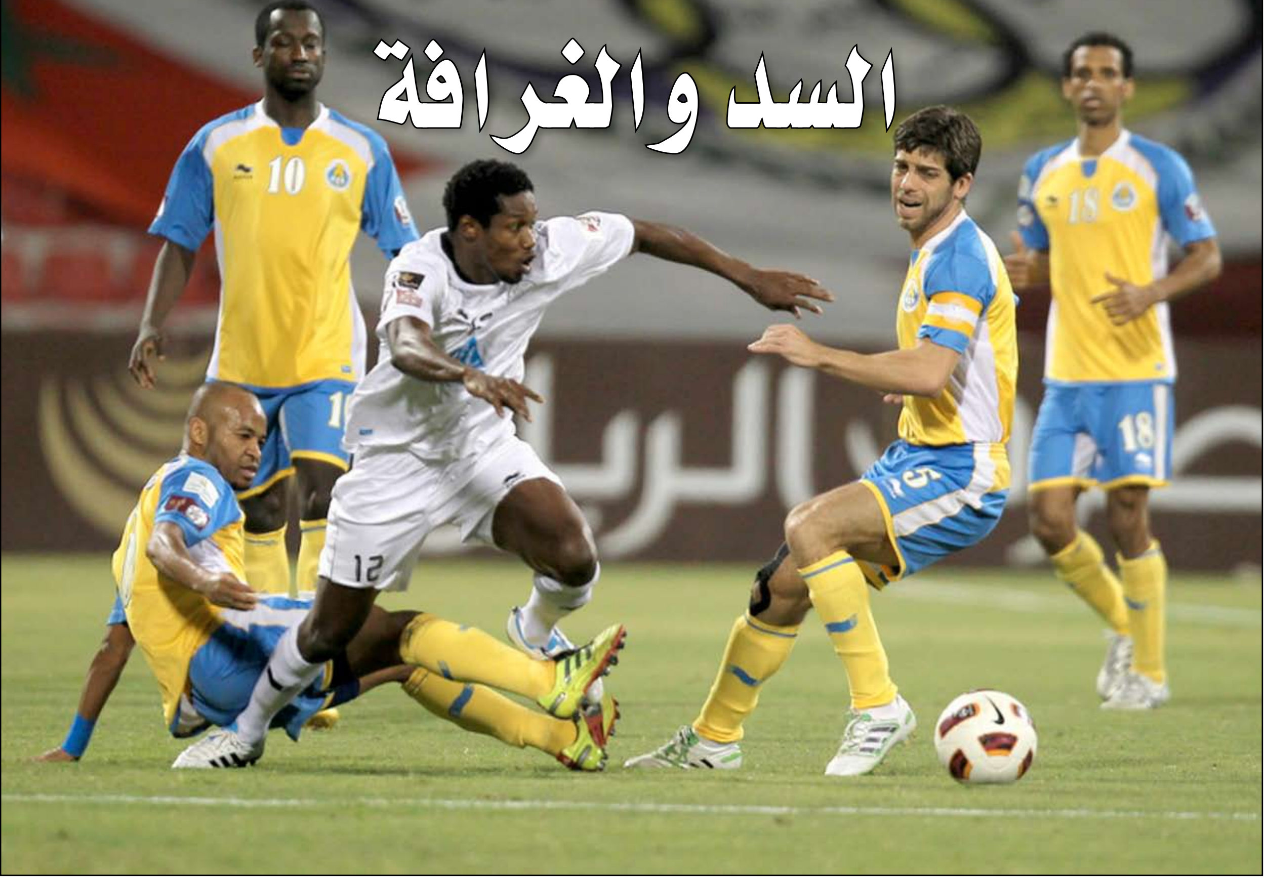
الغرافة يطمح الى تحسين مركزه في دوري نجوم قطر

من الخسارة التي سيكون ثمنها غالباً بالنسبة للجميع في القمة أو في أسفل الترتيب. وكان السيلية والوكرة قد تعادلا بهدف لكل فريق في مباراة الذهاب، وفاز معيذ على العربي (١-٠)، وتعادل أم صلال والخور من دون أهداف.. وفاز الريان على الخريطيات ٣-٢، وقطر على الأهلي (٢-٠)، وتعادل السد والغرافة بهدفين لكل منهما.