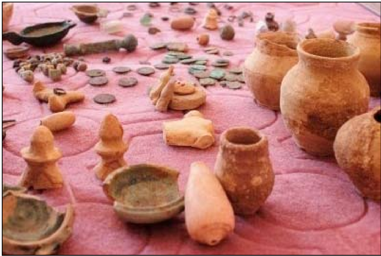
لقى أثرية عثر عليها مواطن ميسانى

أعلنت مديرية آثار ميسان، أن مواطنًا ميسانيا سلمها أكثر من ٤٠ قطعة أثرية تعود إلى العهد العباسي، وبيت أنها تضم أواني وخواتم وتمائيل، وفيما أكدت أنها "ستنقلها إلى وزارة الآثار لعرضها في المتحف الوطني"، كشف المواطن الميسانى أنه "عثر عليها بعدما جرفتها مياه الامطار من احد التلال".