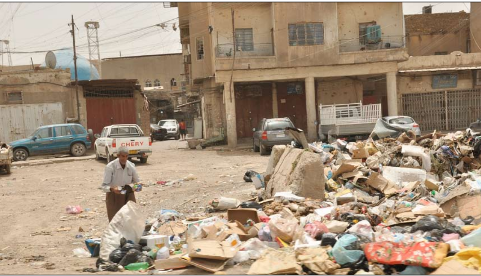
ساحة زبيدة وسط بغداد

من المشتقات البترولية، مثل اطارات السيارات والمنتجات الاستهلاكية التي تحتوي على أكاسيد كاربونية، حيث تتصاعد أبخرة سوداء كثيفة، مما يؤدي إلى موت الأشجار القريبة من مكان الحرق. وأصبح مصدراً من مصادر الأمراض الخطيرة وعلى رأسها السرطان وأمراض الجهاز التنفسي، وأضرار الحسون في حديثه إلى أن هناك تعليمات نشرتها وزارة البيئة تؤكد أن تكون مواقع الطمر الصحي خارج التصاميم الأساسية للمدن وفي المناطق الصحراوية البعيدة عن المصادر المائية بمسافة كم إضافة إلى الحد من ظاهرة انتشار الأرزبال وعدم حرقها على الأرصفة وبين الأزقة ومدخل المدن ومحاسية المخالفين.