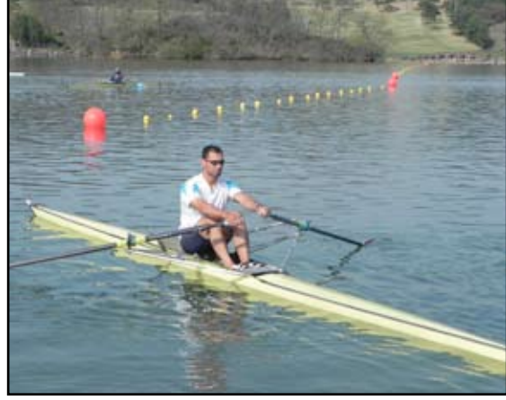
التجديف يستعد للأسياخ