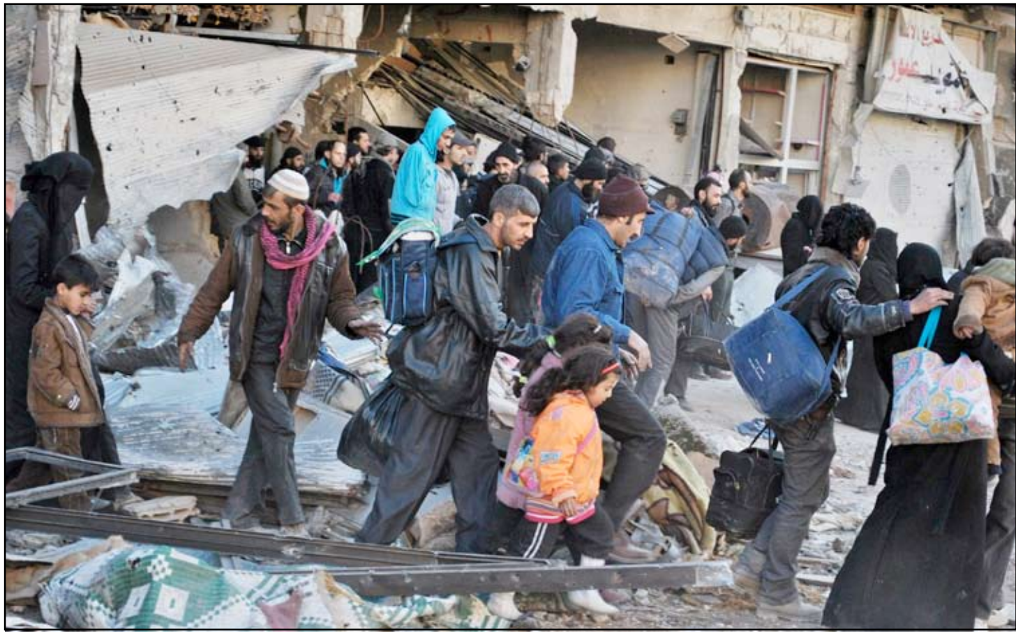
عمليات إجلاء المدنيين من حمص

علايات إجلاء المدنيين من حمص. الإئتلاف والجماعات المسلحة، ان فريقاً يضم ٧ من قادة الجماعات المسلحة والضباط المنشقين عن النظام السوري انضم إلى وفد الائتلاف المعارض في محادثات جنيف مع ممثلي الحكومة السورية تحت إشراف الأمم المتحدة. وأضافت أن عضو الائتلاف السوري المعارض المشارك في محادثات جنيف أنس العبدية أكد أن الفريق يضم أعضاء من الجبهة الثورية السورية بقيادة جمال معروف، والتي كانت في طليعة المعارك الأخيرة في شمال سوريا ضد تنظيم "داعش". وكانت الجولة الثانية من مفاوضات مؤتمر جنيف ٢، بدأت الاثنين الماضي، لوضع خريطة طريق لإحلال السلام في سوريا، لكن المبعوث الأممي والعربي إلى سوريا الأخضر الإبراهيمي أعلن أنها "لا تحضر الكثير من التقدم"، وناشد جميع الأطراف "مساعدة سوريا للخروج من الكابوس الذي يعيشه شعبها منذ نحو ثلاث سنوات".