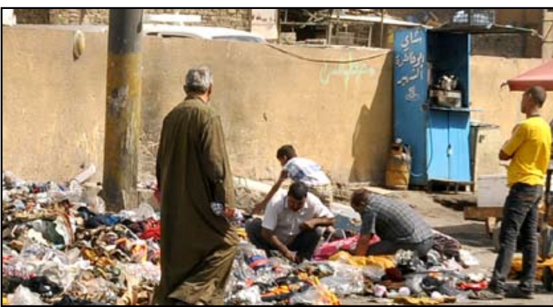
البحث بين الأنقاض