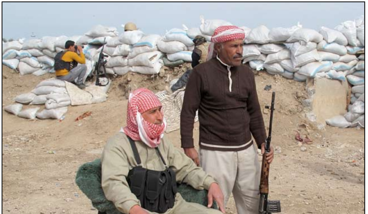
عناصر من مسلحي العشائر الذين يعملون مع القوات الامنية في الرمادي

الى ذلك اعلن رئيس الوزراء نوري المالكي في كلمته الاسبوعية امس الاربعاء عن خطة تهدف