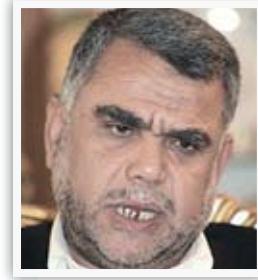
وزير النقل هادي العامري

"الكثير من البنى التحتية للأنبار تم تدميرها من قبل عصابات القاعدة وداعش في محاولة منها لإشاعة الفوضى والخراب في المدينة بعد عجزها في مواجهة القوات الأمنية وأبناء العشائر، وهو ما يتطلب تظافر كل الجهود من أجل تقديم افضل الخدمات لأبناء الرمادي الذين عانوا كثيراً من الأعمال الإرهابية، ان مجلس الوزراء كان قد أوصى الوزارات الخدمية والدوائر ذات العلاقة بضرورة التحرك بشكل عاجل لتأمين الاحتياجات الأساسية لمواطني مدينة الرمادي".