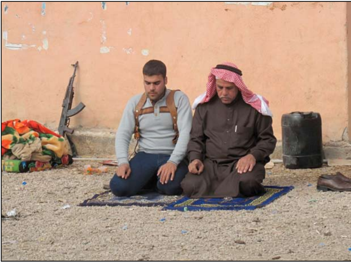
مقاتلو العشائر في الأنبار يؤدون الصلاة..

وأضاف عبد القادر في حديث لـ "المدى"، بالقول "لكن مشروع قانون الموازنة الاتحادية لعام ٢٠١٤ تأخر لدى الحكومة لـ٤ شهور تقريباً وبالتالي فإن المسؤول