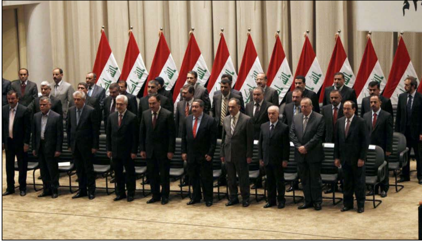
جلسة منح الثقة للحكومة الحالية عام ٢٠١٠ - ارفيف

هذا ما يريده العراقي، يا أصحاب الحكومة والنظام السياسي والدولة جميعاً.. ولا أستغني عنكم أبداً.