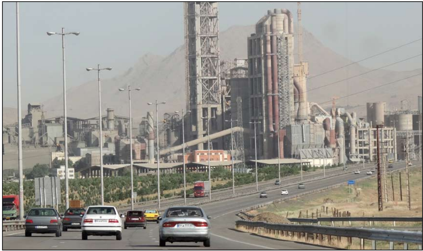
الفاعل النووي الإيراني...

على إيران، وهذه هي المرة الثانية التي تفعل واشنطن فيها ذلك منذ توصل القوى الغربية إلى اتفاق مؤقت مع طهران في نوفمبر الماضي.