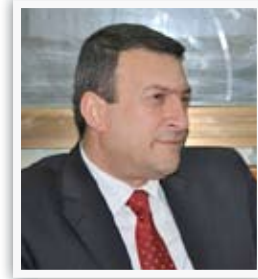
محافظ كربلاء عقيل الطريحي

"يوماً بعد يوم تثبت الاجراءات والسياسات التي تتبعها الوزارات السيادية تجاه محافظة كربلاء انها تتصف بالإهمال واللامبالاة بصورة تتركس الظلم إزاء كربلاء والإمام الحسين [ع]، على الرغم من وضع كربلاء المحلي والدولي والإسلامي ومكانتها المميزة عن بقية المحافظات والجميع يشهد بذلك إلا ان تلك الاعتبارات لم تشكل أهمية لدى الحكومة المركزية خصوصاً على صعيد التخصيصات المالية او المشاريع التنموية الواجبة إقامتها".