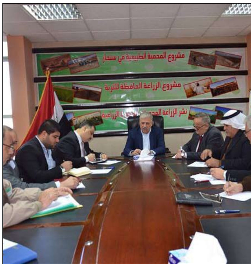
محافظ نينوى خلال اجتماع مع مدراء الدوائر

عدّ محافظ نينوى أن أهدافاً سياسية تقف وراء استهداف رئيس البرلمان، أسامة النجيفي، من قبل مليشيات وجماعات إرهابية مسلحة على مبعده أمتار قليلة من نقطة تفتيش للجيش، عاذاً أن الحادث "لا يدلل على انهيار الملف الأمني بالمحافظة".