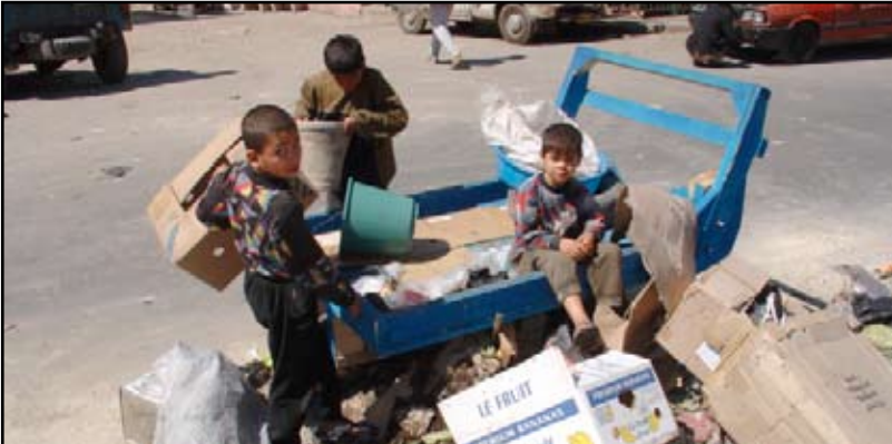
مكبات بين الأحياء