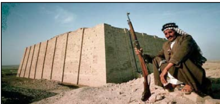
زقورة اور الأثرية

أعلنت بعثة التنقيب البريطانية في ذي قار، عن اكتشاف مواقع بابلية في أحد التلال الأثرية غرب الناصرية بمساحة تعادل مساحة ملعب كرة قدم"، في حين عدت إدارة المحافظة، أن اكتشاف دلائل الحضارة الإنسانية يكسب المحافظة أهمية كبيرة، ويجعلها "قبلة للسياحة الأثرية والدينية ومنطلقاً لحوار الأديان"، ودعت للاهتمام بتطوير القطاع الأثري من خلال توفير مستلزمات نجاح بعثات التنقيب الدولية ورج الخبرات المحلية