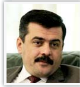
وزير البيئة سركون صليوا

"القانون الذي شرعته لجنة التعليم النيابية ينص على ان [يمنح طلبة الدراسة الجامعية الأولية والكليات التقنية والمعاهد الفنية الصباحية الرسمية مبلغاً قدره [١٠٠٠٠] دينار شهرياً لمدة تسعة أشهر ابتداء من [١٠/١] حتى [٦/٣٠] من كل عام دراسي، وسواصل رقابتي الدستورية من خلال زيارتي للجامعات وانصاتي بأبنائي وبناثي من طلاب وطلبات السنة الأولى لمتابعة تسلمهم منحتهم عن الأشهر الماضية كاملة غير منقوصة".