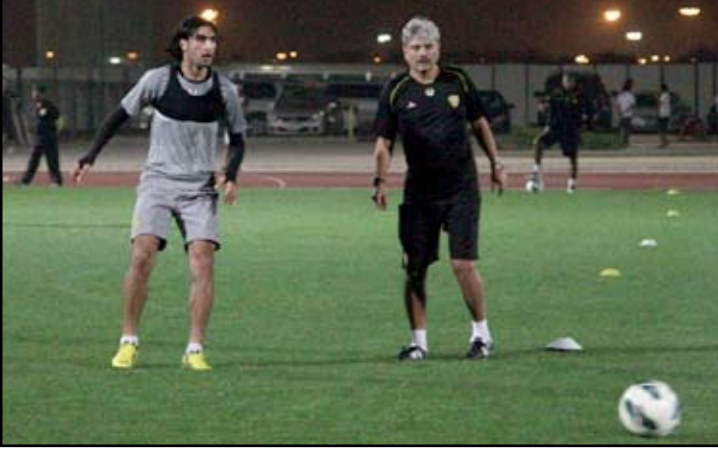
اثناء الوحدة التدريبية في ملعب عجمان