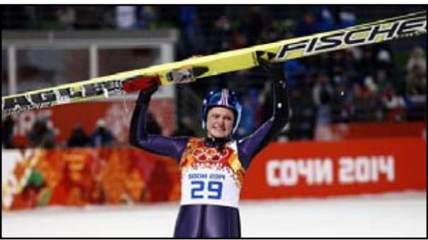
الالمانية كارينا فوجت

الذهبية برصيد ٢٤٧ر٤ نقطة، وفازت النمساوية دانييلا إيراشكو شولز ببطلة العالم ٢٠١١، بالميدالية الفضية برصيد ٢٤٦ر٢ نقطة مسجلة ١٠٤ نقطة.