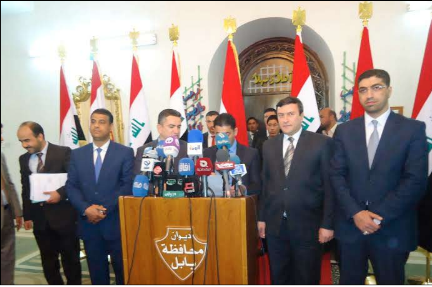
محافظو الفرات الأوسط يطالبون بصلاحيات لإدارة المشاريع

تجاه الطعون المقدمة على القانون لدى المحكمة الاتحادية. بينت أن القانون سيمنح بنقل جميع الصلاحيات من ثمانى وزارات، بعد سنتين من تاريخ تعديله.