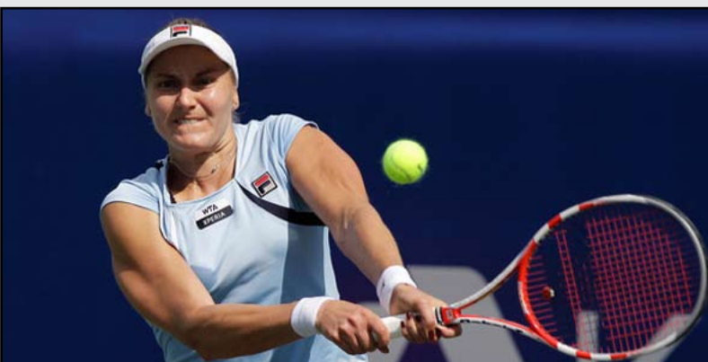
السوفافكية ماغلينا ريباريكوفا

مونيكا نيكوليسكو بفوزها على العمانية فاطمة النهاني ١-٦ و ٠-٦، والسوفافكية يانا سبييلوفا بفوزها على الفرنسية كريستينا ملادينوفيتش ٦-٤ و ٧-٦، والسويسرية ستفاني فوغله بفوزها على الفرنسية اليزيه كورنيه ٦-٧ و ٦-٤، والبلجيكية يانينا كارين كساب بفوزها على الفرنسية كارولين غارسيا ٤-٦ و ١-٦، والبلجيكية يانينا فيكامير بفوزها على الألمانية اندريا بيكوفيتش ٤-٦ و ٧-٥، و(٥-٧).