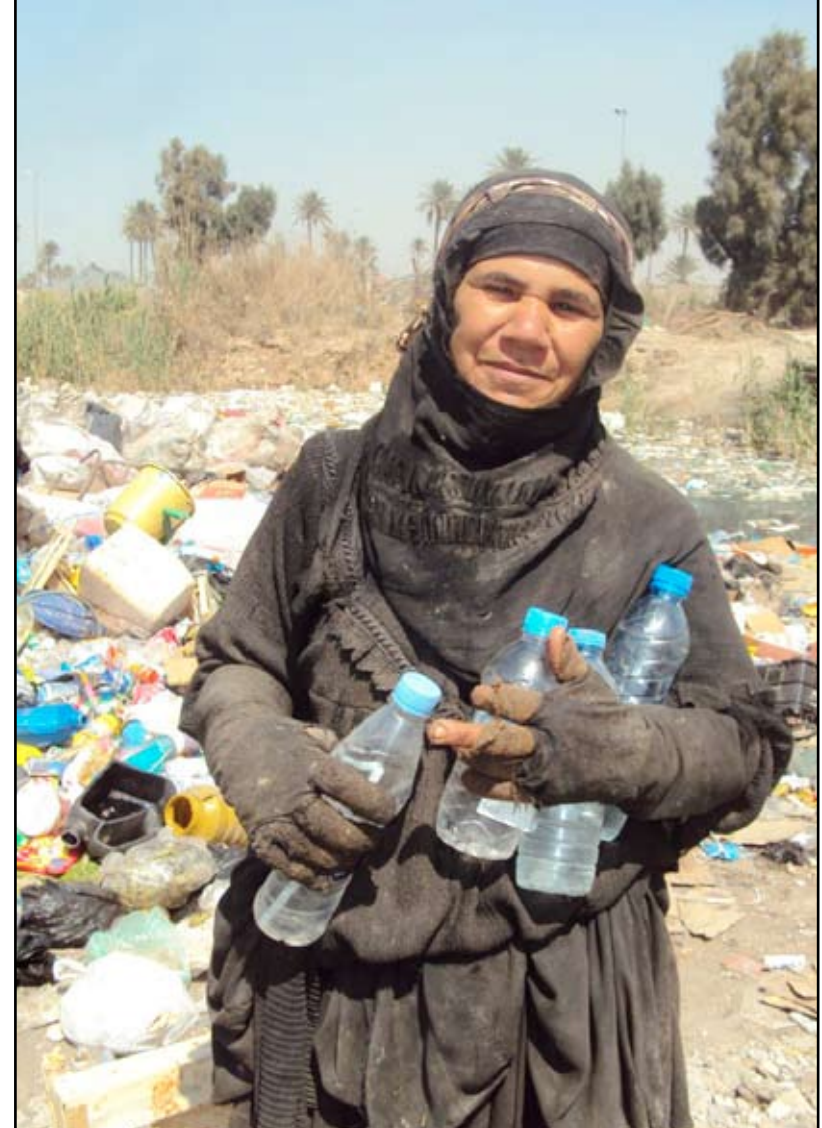
المهم الرزق فوق الصحة

وعلى الرغم من وجود عدد من مناطق تجميع النفايات إلا ان جمعها من المنازل يتم بصعوبة