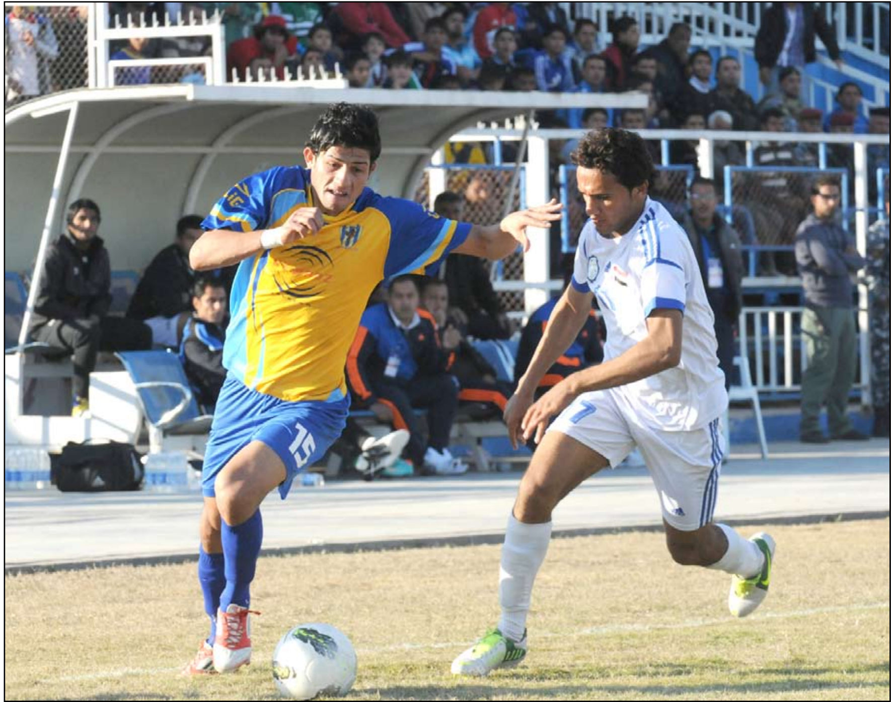
دربي كردستاني سلخن بين فريقي أربيل ودهوك

فيما تجري يوم غد الجمعة ٤ مباريات أيضاً في اطار منافسات الجولة ذاتها يستهلها اولاً فريقا زاخو والنجف على ملعب الاول الذي يسعى لاعبوه لتحسين موقعهم على خارطة الدوري باحتلالهم المركز ١٠ برصيد ١٢ نقطة لاسيما انه تمكن من العودة الى مستواه الاعتيادي