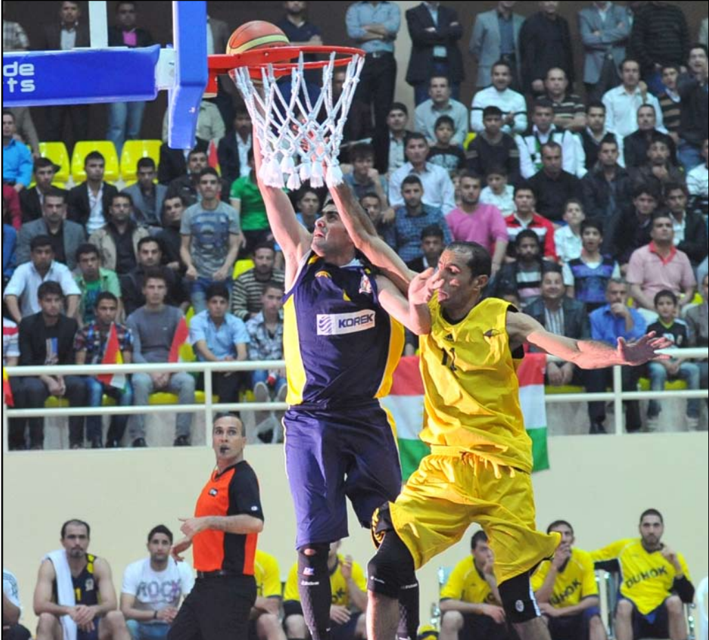
دوري الأضواء فضع الفارق في الامكانيات الفنية والمادية

- بصرحة منذ بداية الدوري أوحى أنكون دقيقا بكلامي بعد أربع مباريات في الدوري لم نكن نتدرب بصورة منتظمة، أحيانا نتدرب على قاعة نادي نطف الجنوب ، وهنا أتقدم بالشكر لهم لسماحهم لنا بالتدريب لمدة ساعة ،