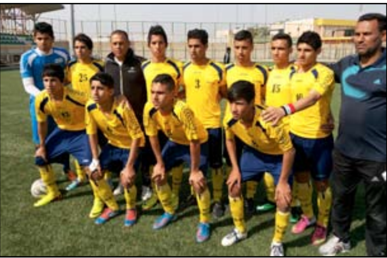
منتخب تربية الرصافة الثانية

على بطاقتي التأهل في النجف وصلاح الدين ودبالي وميسان. يذكر ان تصفيات بطولة تريات العراق بكرة القدم إعدادي (بنين) تولد ١٩٩٦ شارك فيها ١٩ منتخباً من بين ٢٠ منتخباً تمثل تريات العراق باستثناء إقليم كردستان حيث اعتذر منتخب تربية الانبار عن المشاركة في هذا العام بسبب الظروف الأمني الذي تمر به المحافظة.