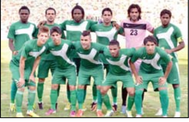
الشرطة يضيع فرصة الفوز في ملعبه البديل في الدوحة