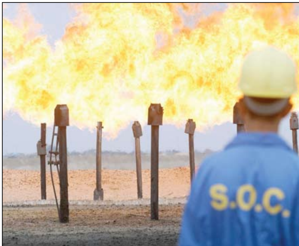
حقل الزبير النفطي في البصرة - ارشيف

كشفت عملاقة النفط الإيطالية إيني (Eni)، عن عزمها الانسحاب من العراق ما لم توقع بغداد عقود الطاقة المعقدة الخاصة بحقل الزبير جنوبي البلاد خلال الأسبوعين المقبلين، مستغربة من عدم توقيع تلك العقود منذ ستة أشهر بالرغم من عدم وجود "أي مبرر" يمنع ذلك.