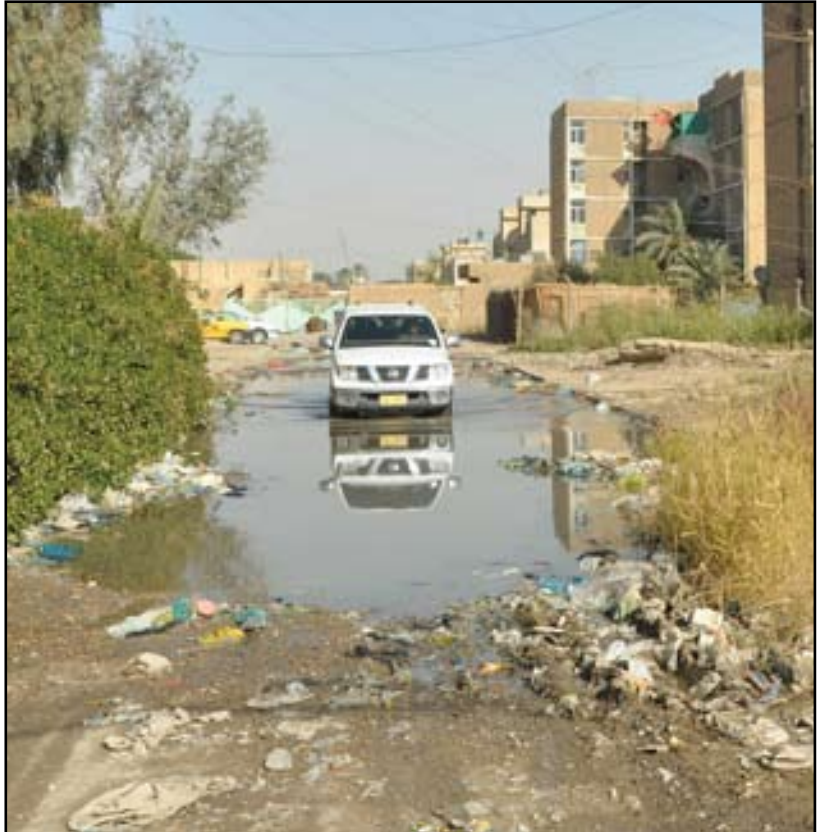
احد شوارع منطقة زويونة