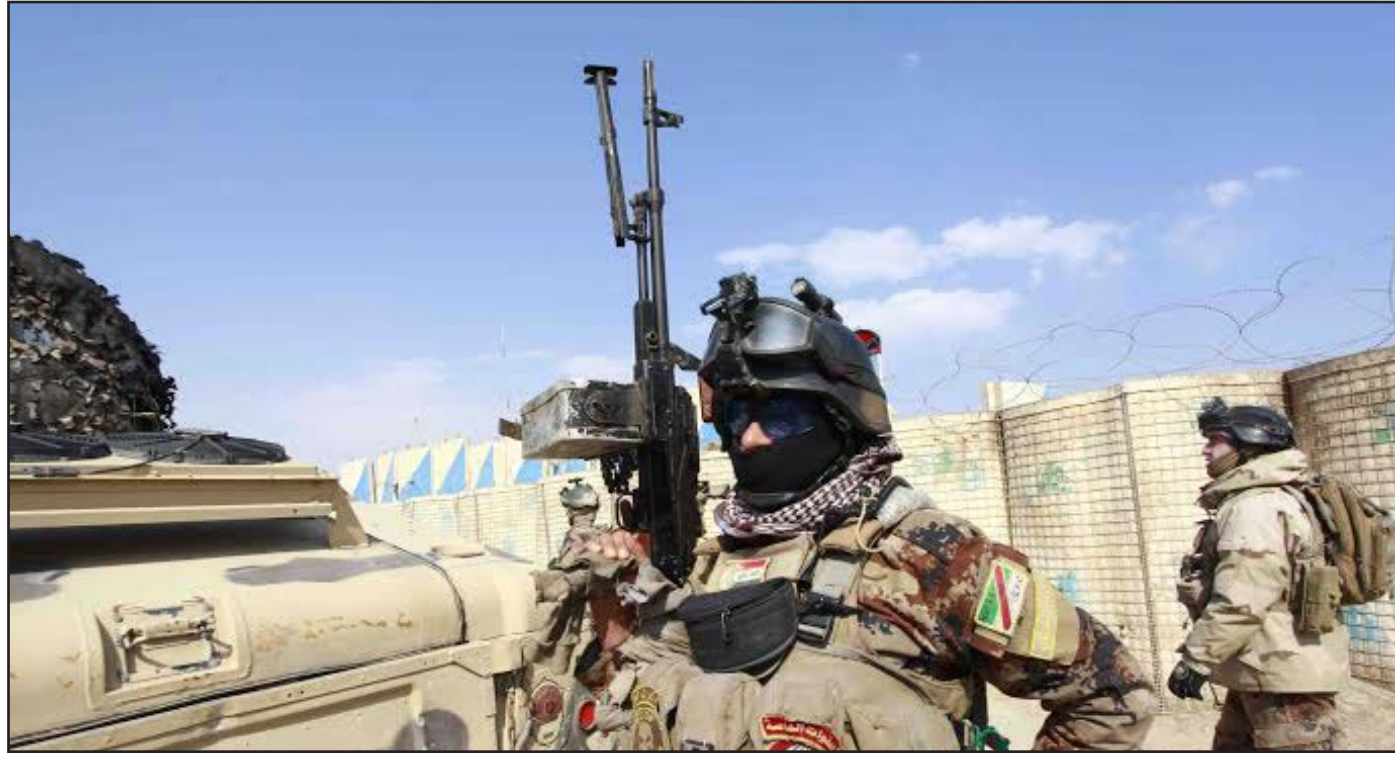
عناصر من الجيش جنوب الأنبار

وقالت الشرطة إن ثلاثة شبان آخرين قتلوا عندما فتح مسلحون النار عليهم في عقوبة عمدا محافظة ديالى.