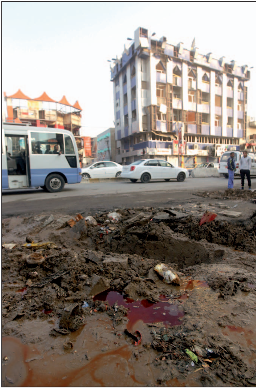
الدمار الذي خلفه تفجير سيارة ملغمة في منطقة الكرادة مساء أول من أمس... (أ.ف.ب)