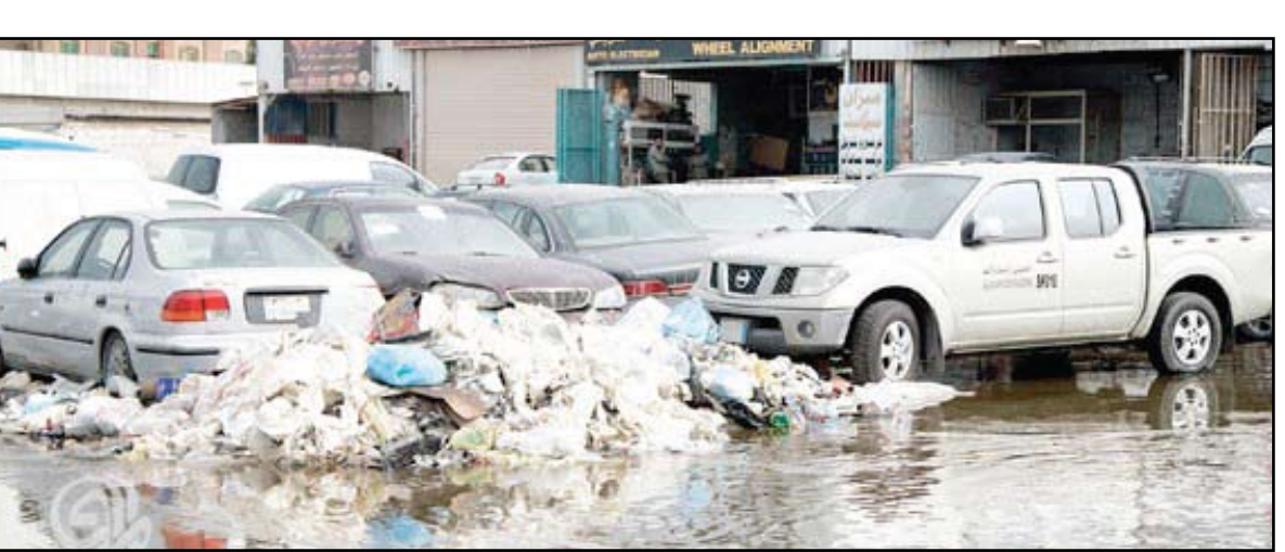
خطر التلوث يتهدد الانحاء السكنية بسبب الورش الصناعية

خطر التلوث يتهدد الانحاء السكنية بسبب الورش الصناعية العراقيةون أكدوا زيادة حالات الإصابة بالسرطان والولادات المشوهة حيث تجري منظمة الصحة العالمية تحقيقاً بهذا الأمر مع وزارة الصحة العراقية. ويقدر العلماء والمختصون أن العمر النصفى لليورانسيوم يقدر بأربعة مليارات ونصف المليار عام وحتى يقدر قدرته على الإشعاع يحتاج إلى (10) أعمار نصفه أي مايقرب من (40) مليار سنة. وهذا يعني أن المناطق المقصوفة بتلك الأسلحة في العراق (المنطقتان الوسطى والجنوبية خاصة)، سستبقى ملوثة مدة طويلة جداً، وأن أثارها وتأثيراتها الخطيرة على الإنسان والبيئة والحيوان ستستزايد باستمرار مع مرور الزمن ما لم تتخذ الإجراءات الخاصة بدفن ورم هذه المواد المشعة والأهداف التي أصابها (وهو ما كان قد يوشر به قبيل احتلال العراق من قبل الحكومة العراقية بالتعاون من منظمة الصحة العالمية ومنظمة الطاقة الذرية وجهات دولية أخرى) من خلال لجان خاصة شكلت لهذا الغرض.