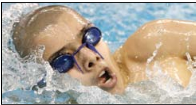
احد السباحين الشباب