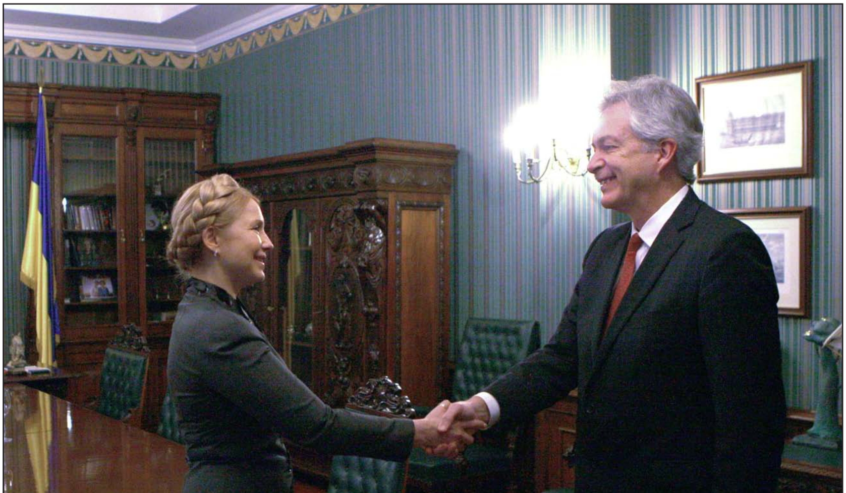
زعيم المعارضة الأوكرانية يوليا تيموشينكو تصافح نائب وزيرة الخارجية الأمريكية وليامز حر...

السلطات الجديدة تحل الشرطة الخاصة والأوكرانيون ينتظرون حكومتهم الانتقالية