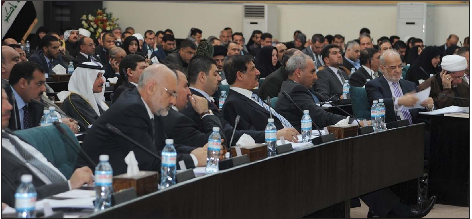
جلسة نيابية سابقة