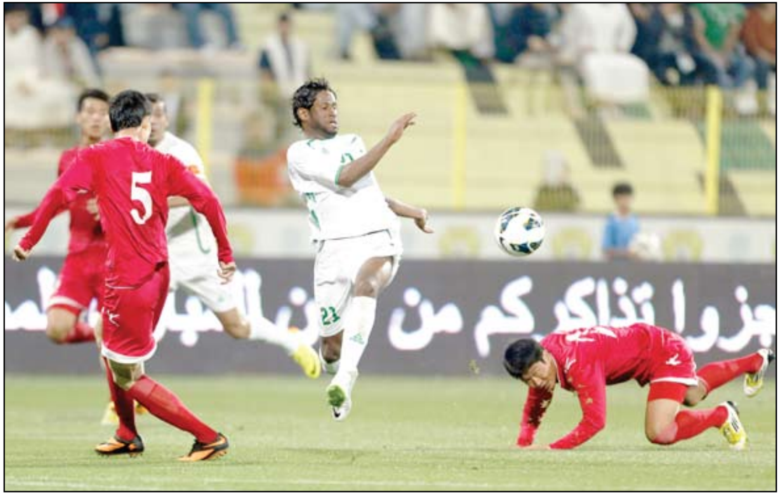
كلف بانتظار نتيجة تقرير اصابته

الاتحاد الصيني للموقع الرسمي للاتحاد الصيني لقد تم اختيار بيران مدرباً المنتخب الصيني الوطني. وسبق لبيران - ٥٧ سنة - ان اشرف على تدريب اندية مرسيليا، سوشو، ليون وسانت اتيان الفرنسية، والعين الاماراتي، ودرّب في قطر اندية الشور والغرافة ومنتخب قطر الومبي إضافة الى أم صلال الذي أقبل من تدريبه مطلع الموسم الكروي الحالي بسبب سوء النتائج. وستكون مهمة بيران الأساسية مع المنتخب الصيني قيادة الفريق للتأهل الى نهائيات كأس أمم آسيا ٢٠١٥ في أستراليا حيث يحتل المنتخب الصيني المركز الثاني برصيد ٨ نقاط متفوقاً على العراق بنقطتين .