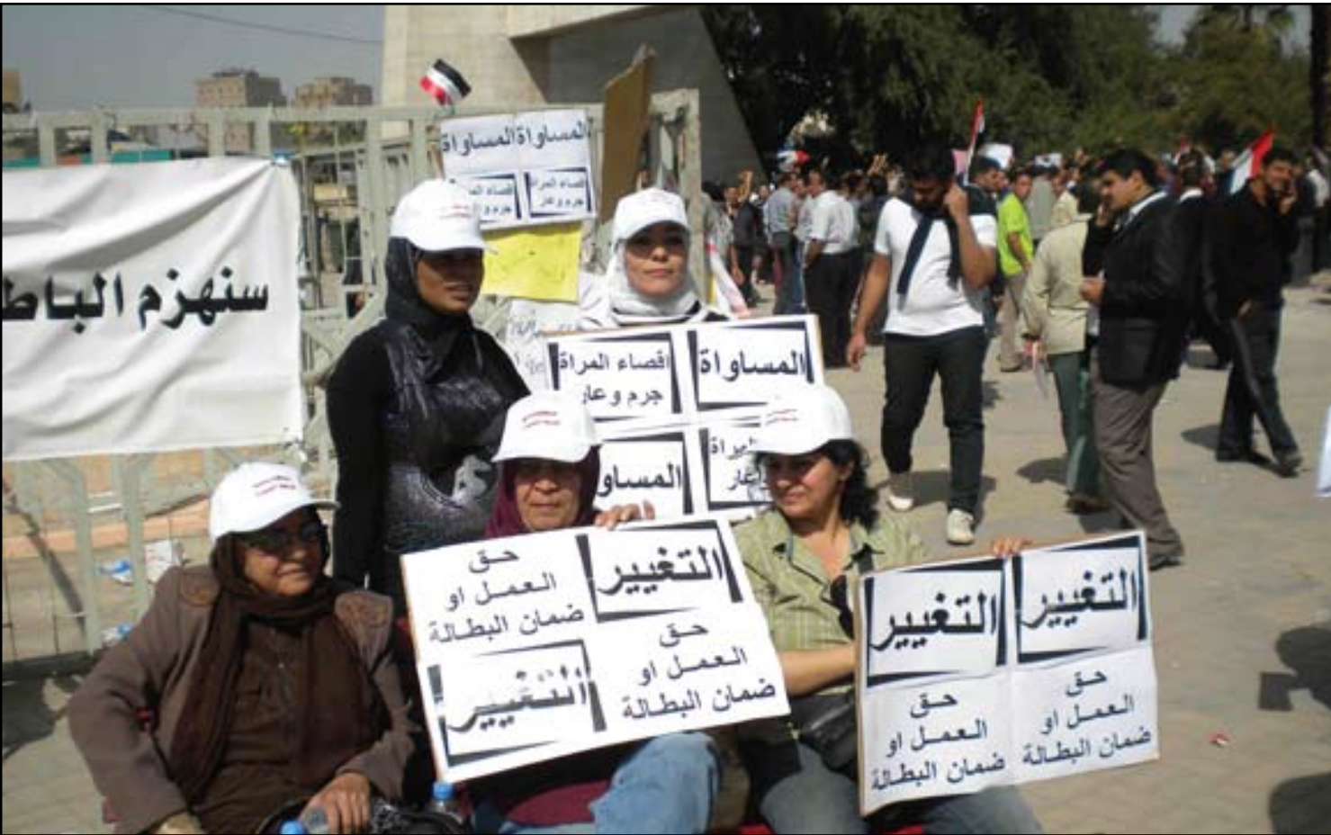
ناشطات عراقيات في تظاهرة وسط بغداد 2011... أرشيف

يكون أبرزها الدين والتقاليد والعادات والأعراف الشائعة والتي أطرت المرأة في أحيان كثيرة عن لعب دور فاعل في مجالات متعددة. ويضمن الدستور العراقي نسبة 25% من مقاعد البرلمان للنساء، فيما شرع البرلمان قانونا يقضي بنسبة ماثلة للنساء في مجالس المحافظات، لكن النساء لم يتمكن حتى الآن من انتزاع مناصب قيادية كبيرة سواء في محافظاتهن او في عموم البلاد، اذ لم تختر امرأة بمنصب رئيس وزراء او محافظ او حتى امين للعاصمة منذ تأسيس الدولة العراقية، فيما غابت النساء بشكل كبير عن التشكيلة الحكومية الحالية التي تمثل النساء فيها و وزيرة واحدة للدولة، كما ان النساء لم يتسلمن ابدا ادارة وزارات سيادية كالدخالية او الدفاع او المالية او النفط او غيرها من الوزارات المهمة.