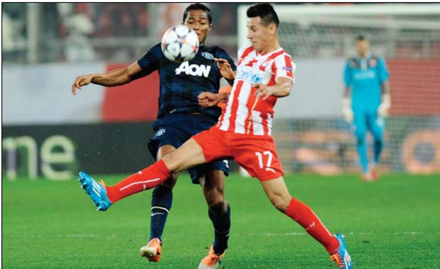
أولمبياكوس يهزم مانشستر يونايتد على أرضه ويوسع أماله الأوروبية

ومنحت الصحيفة الإنكليزية درجات ضعيفة للغاية في تقييمها للاعبين مانشستر يونايتد، وماركو ريوس مبكراً ليفاجيء زينيت الذي كان يخوض مباراته الرسمية الأولى منذ شهرين بسبب العطلة الشتوية. وشهدت فترة مثيرة في الشوط الثاني أربعة أهداف في غضون ١٤ دقيقة إذ سجل أوليج شاتوف ٦، وكاجاوا ٥،٥، ورونيتي ٦، وفان بيرسي ٥، والبلاء ويليبيك ٥،٥. وسجل بروسيا دورتموند هدفين في أول خمس دقائق وأحرز روبرت ليفاندوفسكي ثنائية في الشوط الثاني ليفوز بصيف البطل الموسم الماضي ٤-٢ على مضيفه زينيت سان بطرسبرغ في ذهاب دور الستة عشر بدوري أبطال أوروبا لكرة