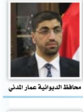
محافظ الديوانية عمار المدني