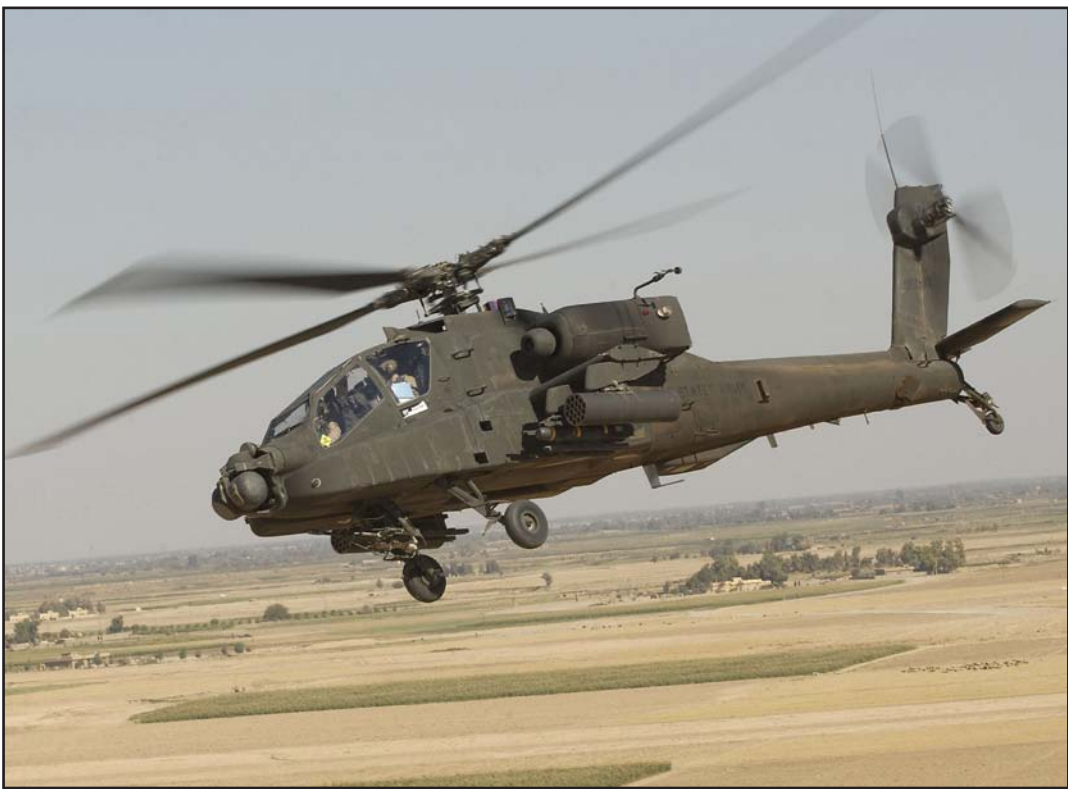
طائرة الاباتشي الاميركية