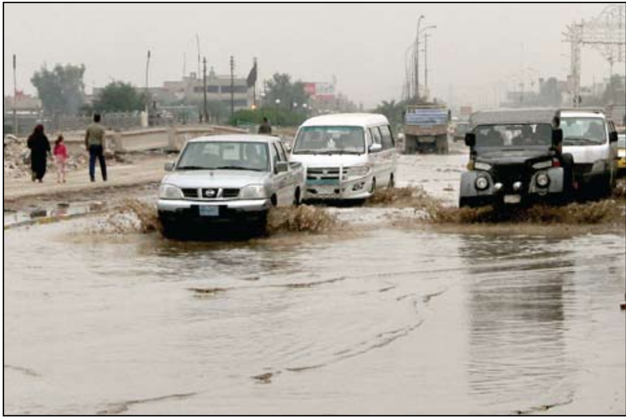
مياه الأمطار تتلغ الشوارع