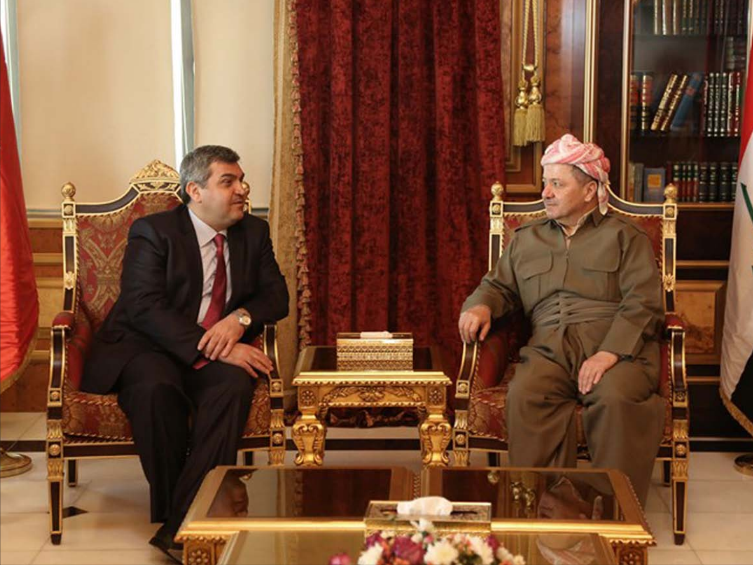
رئيس إقليم كردستان مسعود بارزاني خلال لقائه السفير التركي في البلاد اول من امس

إلى أن "الحجج والتحذيرات التي تطلقها الحكومة بشأن تأخر إقرار الموازنة وانهيار الاقتصاد العراقي غير صحيحة"، مبيّنة أن "الحكومة تريد من هذه التحذيرات إسقاط مجلس النواب"، مستدركة بالقول "لا بأس ليسقط البرلمان لكن الحكومة عليها أن تقوم بدورها بكل الأحوال".