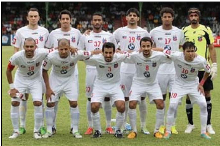
الكويت يستهل رحلة الدفاع عن لقبه بفوز صعب على النجمة