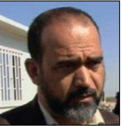
رئيس لجنة خدمات المحافظة