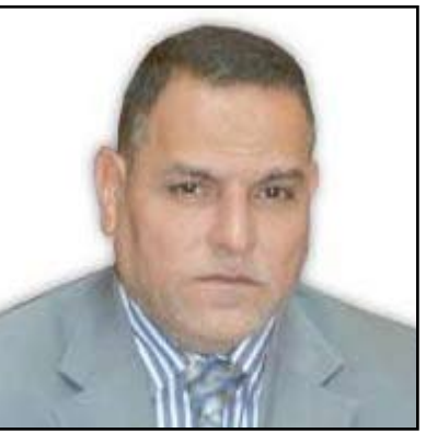
مدير عام بلدية الكرادة