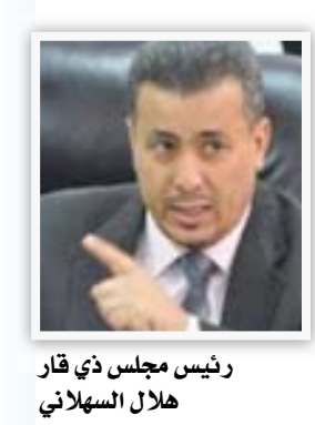
رئيس مجلس ذي قار هلال السهلاني