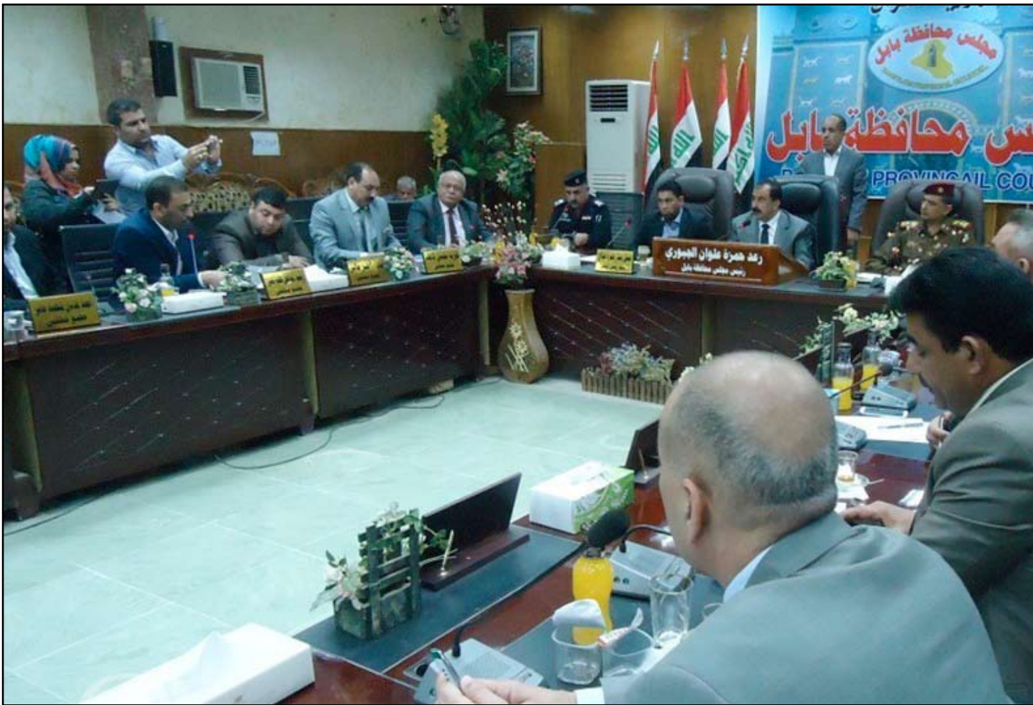
مجلس محافظة بابل

وكان مجلس قضاء المسبب شمالي بابل طالب، في ٢١ شباط ٢٠١٤، باعتبار القضاء منطقة "منكوبة" لتعرضه للهجمات "الإرهابية" بشكل مستمر ولوقوعه بمحاذاة العمليات العسكرية في جرف الصخر، وفيما دعا أيضاً الى تأمين الطوق الأمني للقضاء عن مدى الهاونات والصواريخ وتعزيز القضاء بقوات من الجيش ومكافحة الارهاب