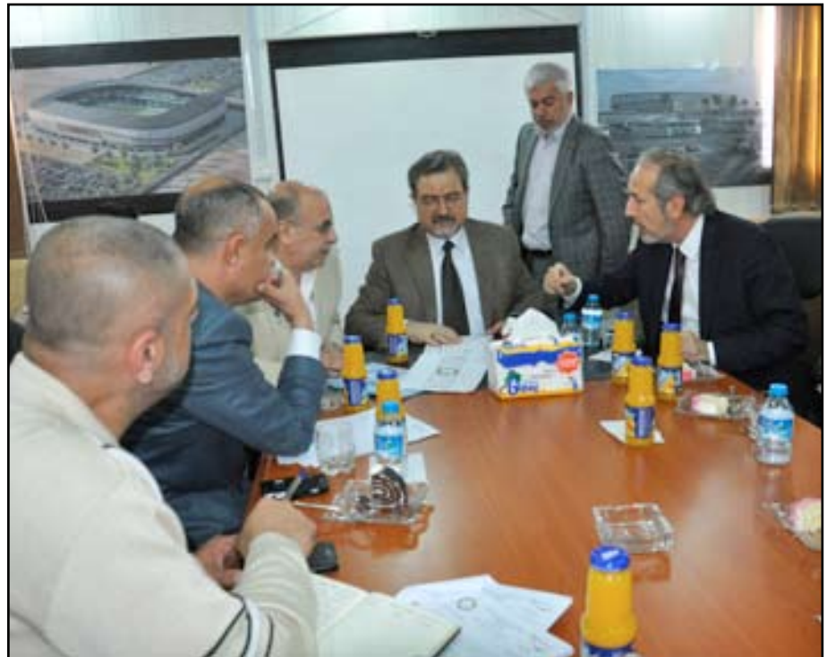
أثناء اجتماع الوزير جعفر مع مسؤولي المشروع

وأعرب الوزير عن قناعته بقدره الشركة على تجاوز الصعاب التي ظهرت مشيراً إلى أن نسب التنفيذ وصلت إلى ٥٠ ٪ للمخطط و٧٢ ٪ لأسس الركائز وهي نسب معقولة سيما وان