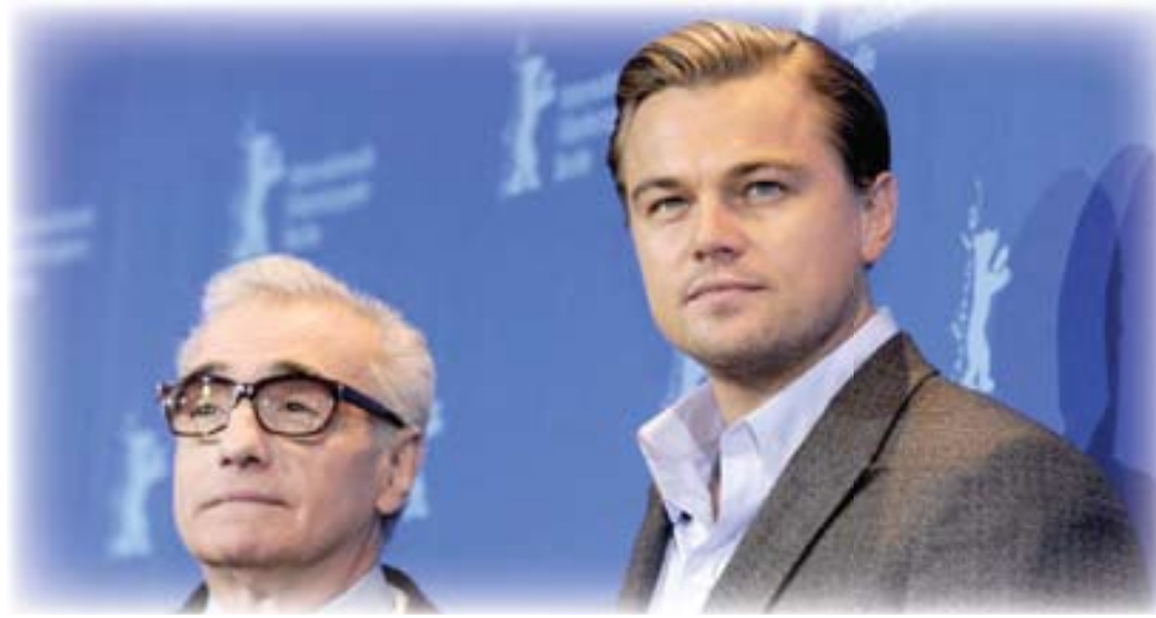
دي كابرियो وسكورسيزي

وأجهزتها البوليسية التي تدس أنفها في كل مشهد وحوار، وتعالى الكثير من الأصوات الناقدة والناقصة لنزع "لعنة" عن المخرج، الذي يوم تسلّم الأوسكار لأفضل مخرج سينمائي، كان قد بلغ عتيا من العمر وقد سلسلة طويلة من الأعمال الفنية المهمة.