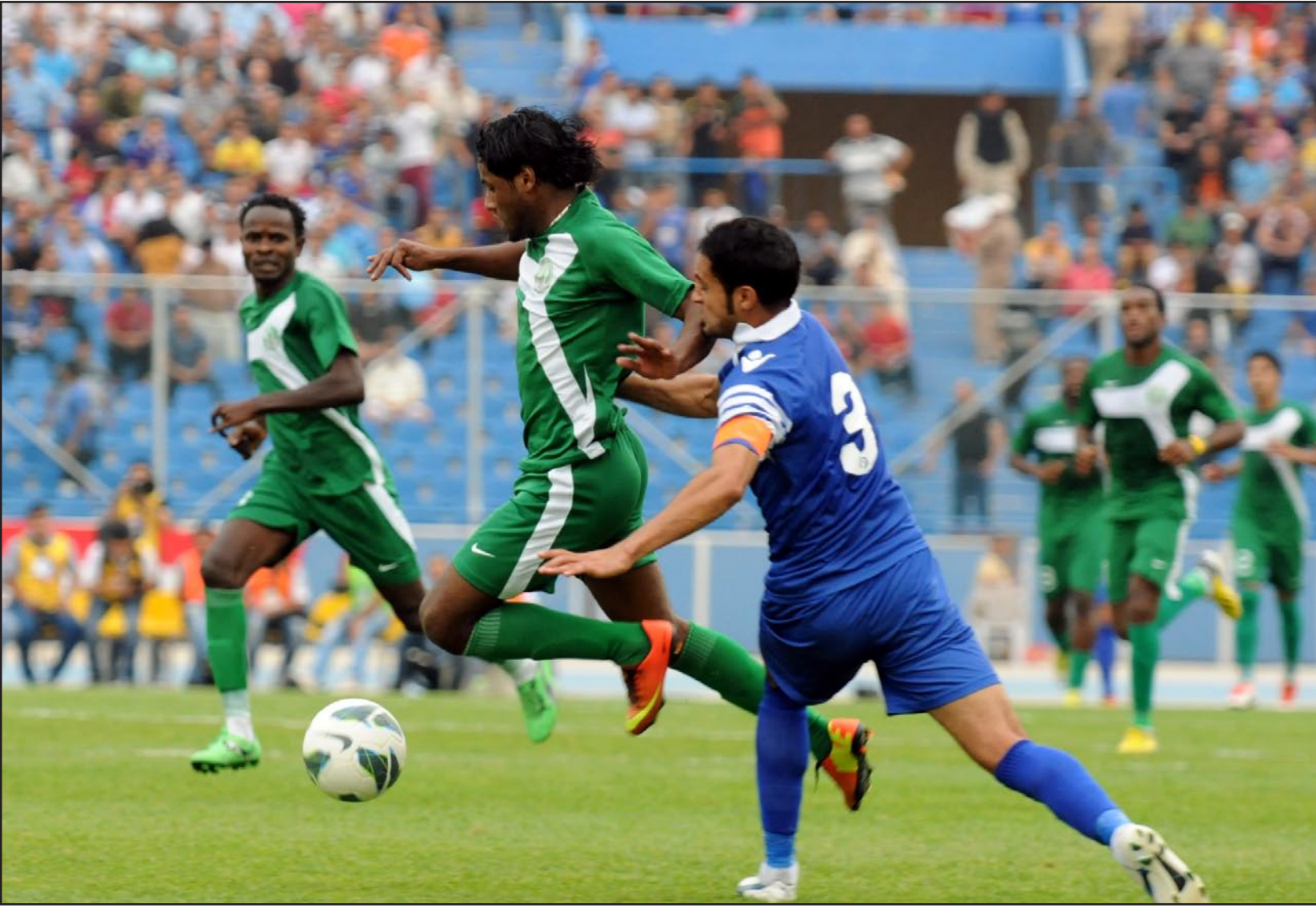
الشرطة في مواجهة مع الحد لمطاردة متصدد المجموعة

والكاميروني فليكس والبوركيني كويبا لي التي تعد خليطاً متجانساً بين الشباب والخبرة يستطيع فيها من الظفر بالنقاط الثلاث بعد تعادله مع الحد البحريني (٠-٠) في المباراة الأخيرة التي جرت بينهما على ملعب البحرين الوطني في اختتام جولة الذهاب من المجموعة الثالثة.