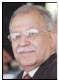
■ فخري كريم

تجاوز عمر "بشيره الشبوعي"، بسنوات، وسبقه إلى الحياة، بسنوات أيضاً، دون أن يتقصد متابعة ما يجري من حوله، لبلورة المشروع الذي أصبح هاجسه، وحلم حياته. في السنوات المبكرة التي شب فيها صبياً، ساهمت جماعة "الصحيفة" الماركسية في التمهيد الفكري، مثلما مهد الحراك العمالي والثقابي والوطني العام لإعلان التأسيس الرسمي للحزب الشبوعي العراقي في ٢١ آذار ١٩٣٤.