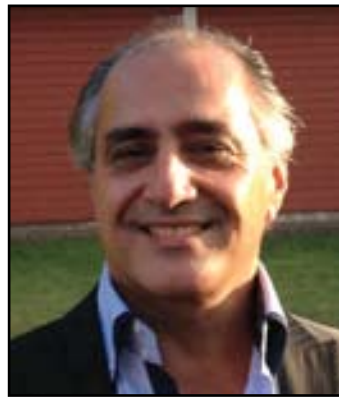
ليس كاظم كاليري ١٦٩ لبنان، بيروت وذلك يوم غد الخميس ٣/٤/٢٠١٤.