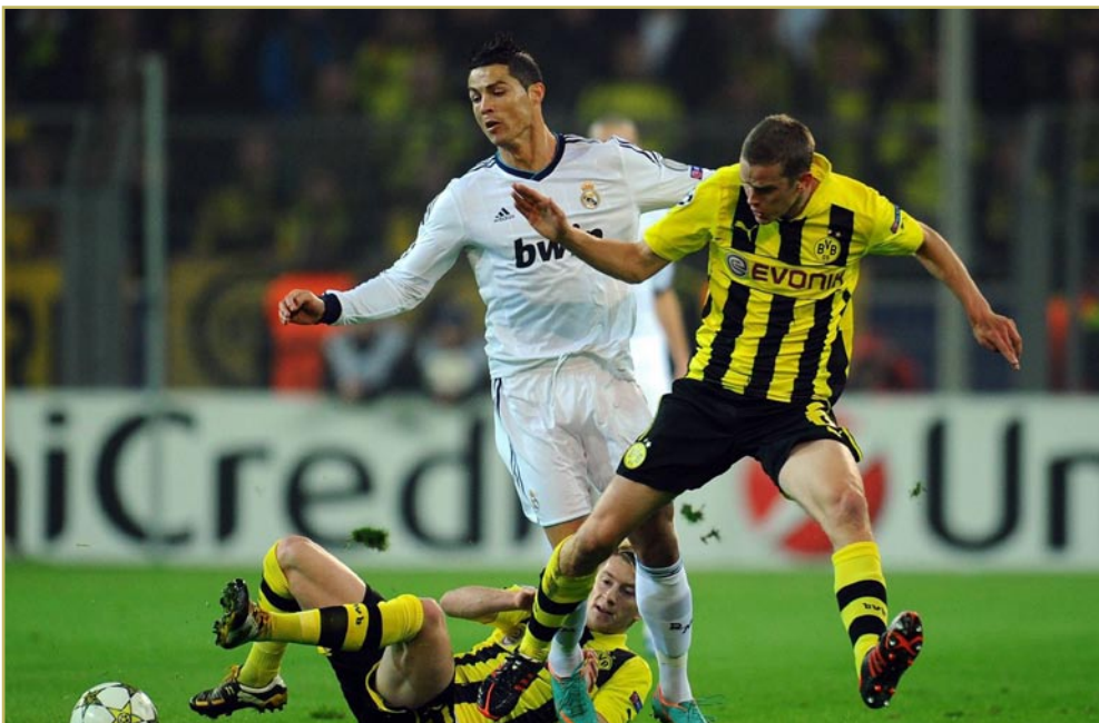
الريال يواصل رحلة البحث عن اللقب الأوروبي

بهذه الطريقة، تتطلع بقوة الى مباراة دورتموند، ونريد ان تلعب كرة القدم للمشاركة في هكذا أنواع من المباريات. ويتوقع أن يجري المدرب الإيطالي كارلو أنشيلوتي ٣ تغييرات على التشكيلة الأخيرة، فيحل الحارس الدولي إيكر كاسياس بدلاً من ديبغو لوبيز والبرازيلي مارسيلو والكرواتي لوكا مودريتش بدلاً من البرتغالي فابيو كوينترا و اسبير ايارامندي. في المقابل، يعاني المدرب يورغن كلوب من اختيار تشكيلته في ظل الإصابات المتلاحقة في ظل غياب المدافع المصري نيفين سويفو، نيتش، مارسيل شملندر، البولندي ياكوب بلانسكوفسكي، يلسكي غوندوغان وسفن بندر.. كما يغيب عن تشكيلة الفريق الأصفر هدافه البولندي ليفاندوفسكي بسبب الإيقاف، ويتوقع أن يمنح الدور الهجومي لماركو رويس أو الغابوني بيار- إيميريك أوباميانغ..