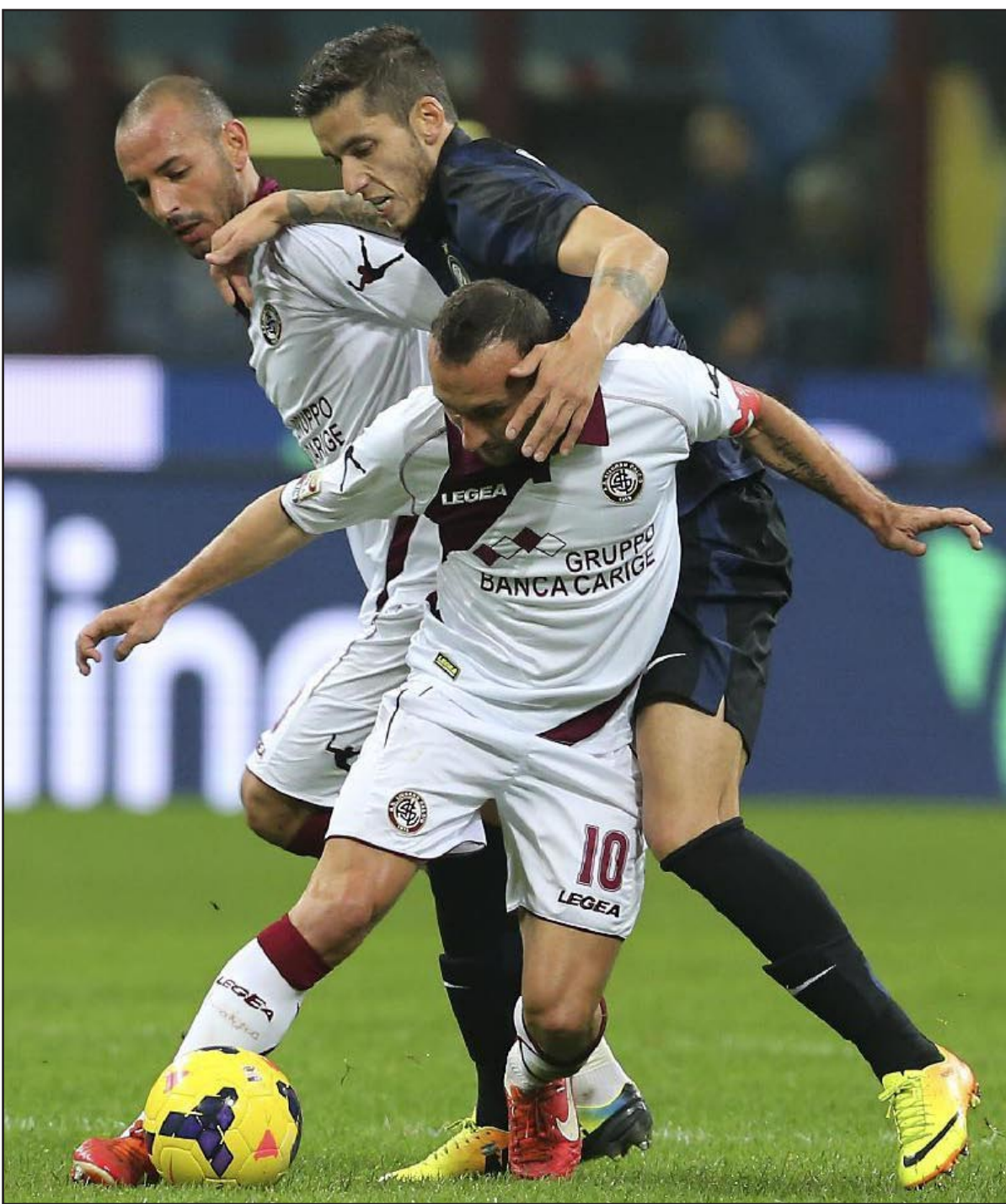
إنتر ميلان يخفق في اجتياز ليفورنو

ومن جهته توصل اللاعب البرازيلي ريكاردو كاكسا صانع ألعاب الميلان إلى اتفاق مع مسؤولي اورلاندو سيتي الأمريكي للانضمام إلى الفريق الموسم المقبل وذلك كأولى صفقات الفريق الأمريكي الذي تأكد مشاركته العام المقبل