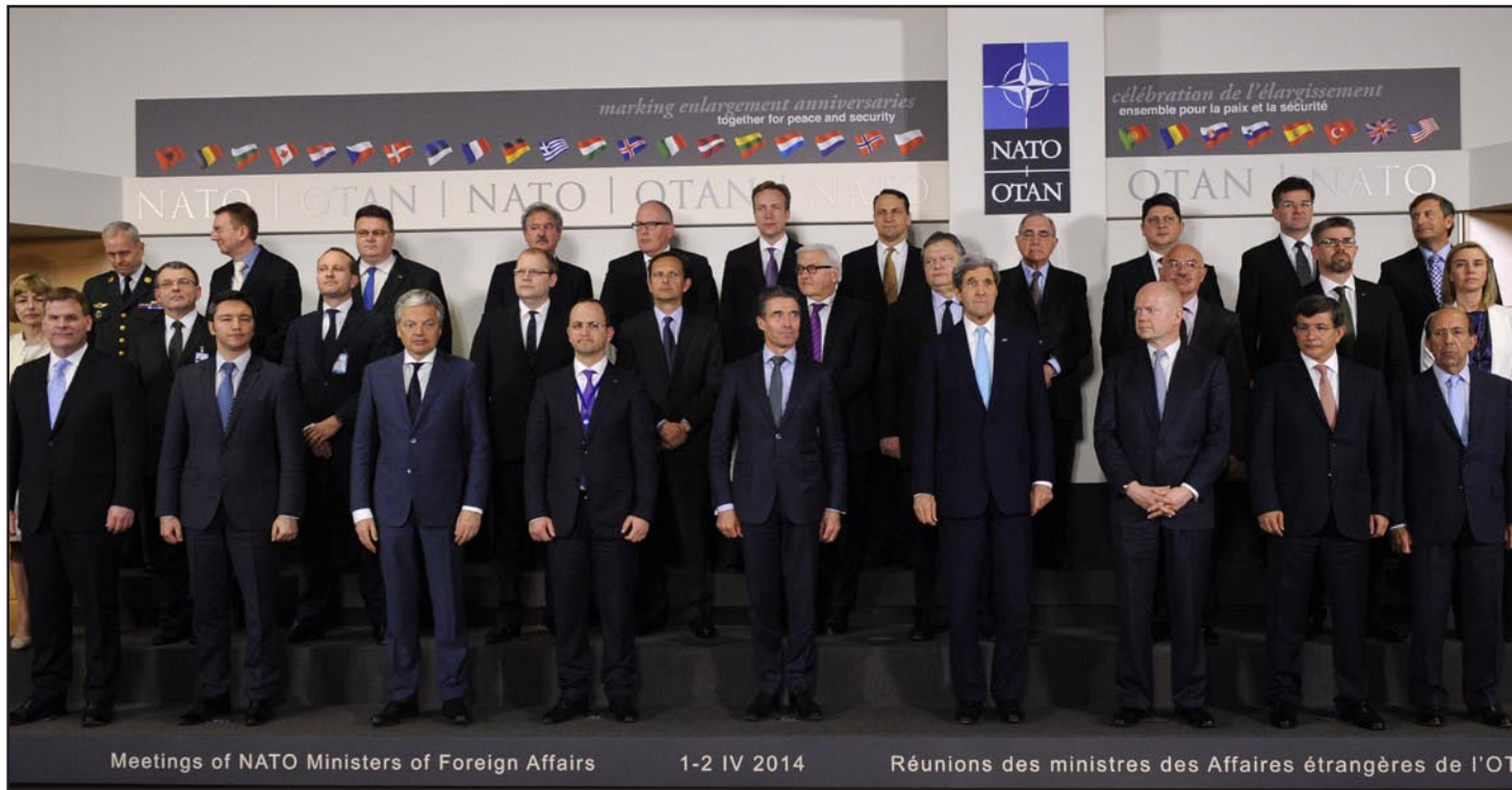
وزراء خارجية حلف الناتو

كيفية: لا يمكن للافروف وبوتين ومدفديف ان يقترحوا ما يريدون لاتحاد روسيا