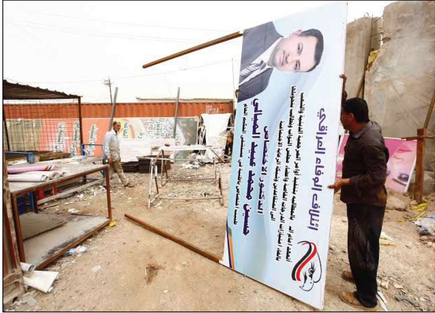
بدء وضع الملصقات الانتخابية في البلاد أمس

لكن القائمتين المتنافستين أكدتا عدم دعم المرجعية لأي كتلة في الانتخابات البرلمانية القادمة، وقالتا إنها تعمل على حث الناخبين لاختيار "الأصلح والأكفأ" وتحذّر من انتخاب السيئين.