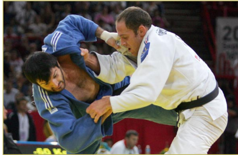
الجودو يعسكر في جورجيا استعداداً للعرب