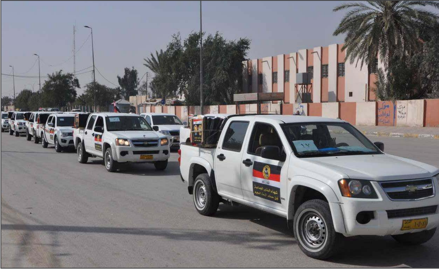
تشبيع شهداء المقابر الجماعية.. ارشيف

أعلنت مؤسسة شهداء كربلاء، تسجيل نحو (٣٩٠٨) شهيد في كربلاء جراء "إجرام النظام السابق، وفيما لفتت الى سعيها لتعويضهم عما أصابهم جراء حكم "البعث الصدامي"، أكدت أنها "غير مرغوب بها" من قبل "البعثيين" الموجودين في دوائر الدولة، نافية اقتصرها على فئة او جهة معينة ممن عارضوا النظام السابق.