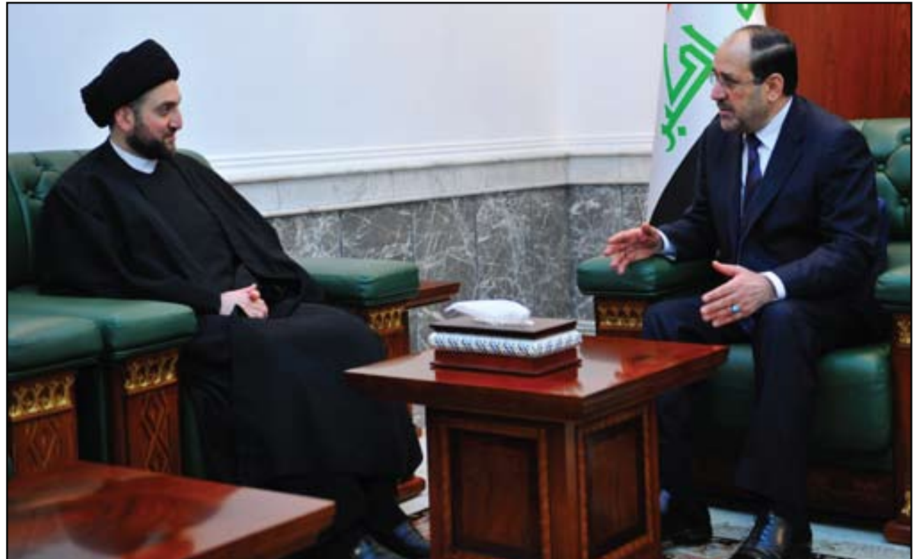
المالكي والحكيم في لقاء سابق

وتتزامن الانتخابات القادمة مع تصاعد معدلات العنف إلى أعلى مستوياتها منذ الصراع الطائفي الذي اجتاح البلاد بين عامي ٢٠٠٦ و٢٠٠٨.