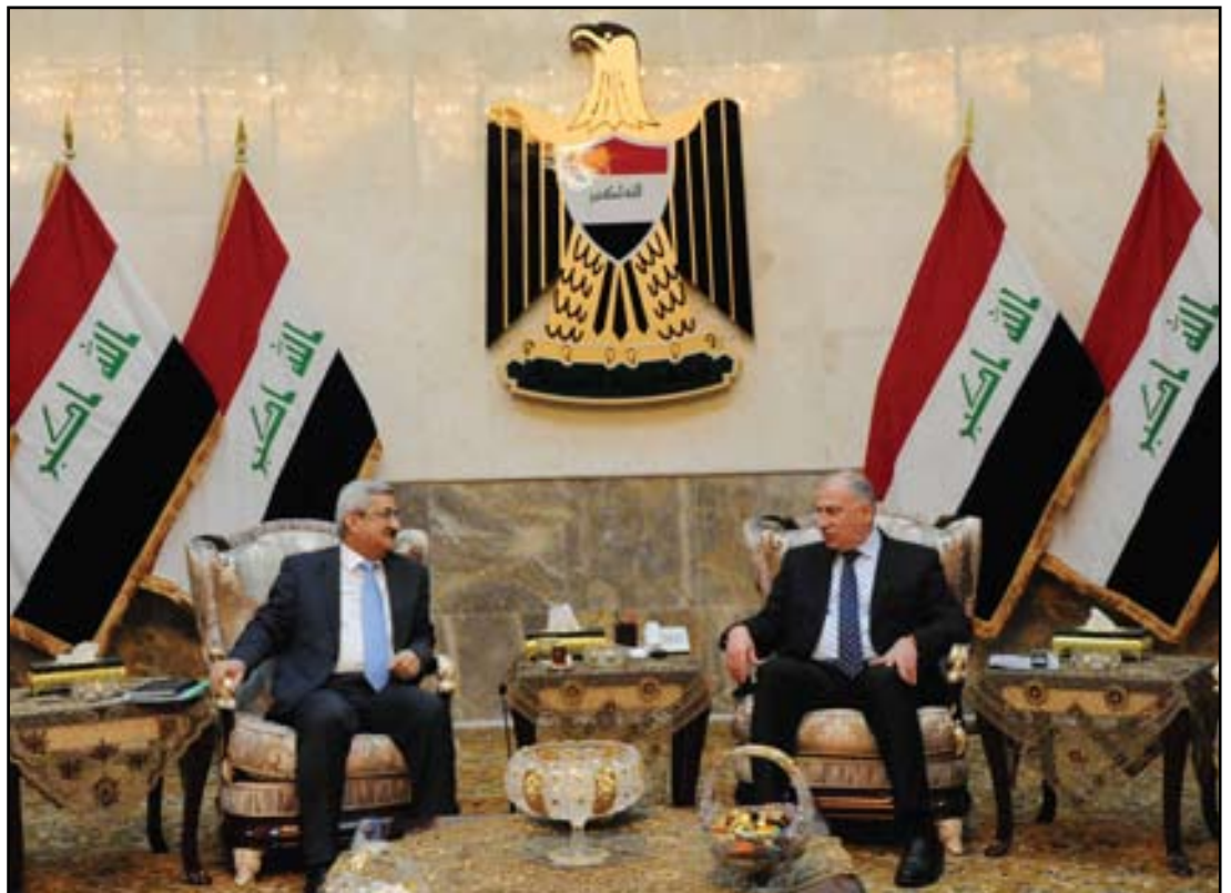
رئيس مجلس النواب خلال لقائه برئيس مجلس المفوضية سربست مصطفی

أكدت كتل نيابية، امس الثلاثاء، ان البرلمان عازم على منح مفوضية الانتخابات "حصانة قضائية" لإعادة المرشحين المستبعدين، مشيرة الى طلب عدد من النواب إدراج الموضوع على جدول جلسة الثلاثاء، لكن اختلال النصاب أرجأه الى جلسة اليوم الأربعاء.