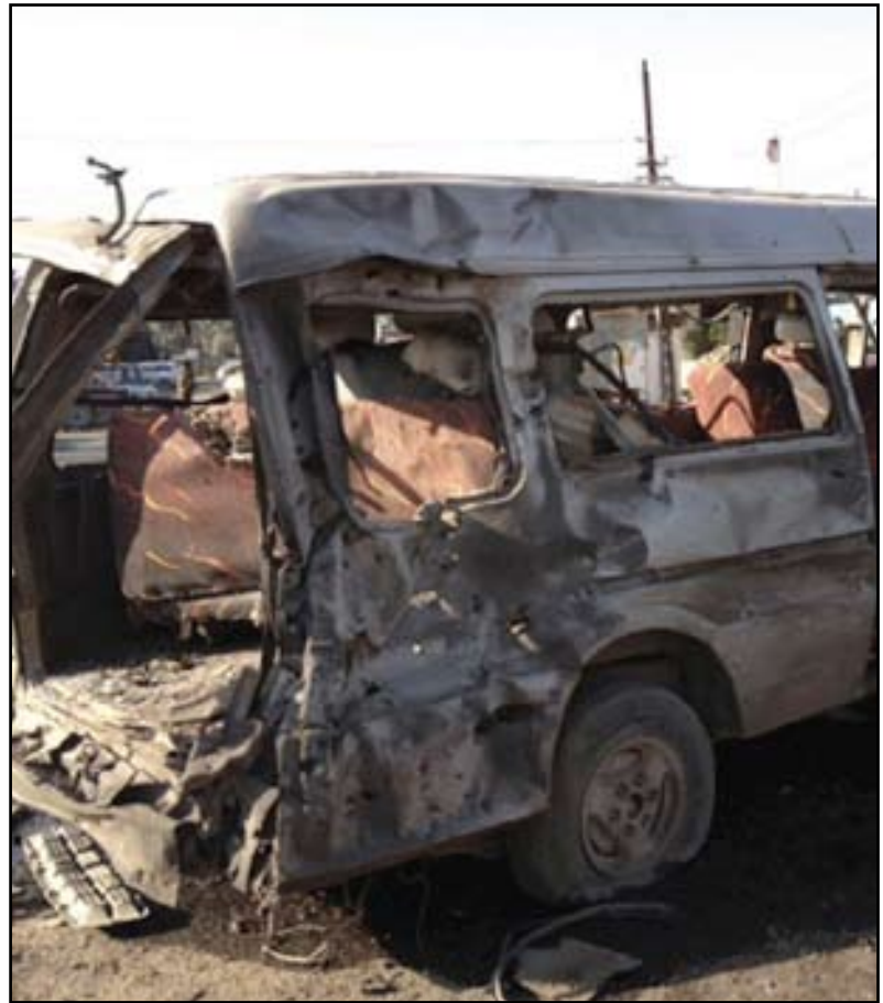
سيارة مدمرة اثر تفجير اتحاري في بغداد - أرشيف

وأضافت البعثة الأممية، أن "صلاح الدين شهدت مقتل ٩٥ شخصاً وجرح ٢٠٥ آخرون، في حين قتل ٦٣ شخصاً وجرح ١٧٥ في بابل، وشهدت نينوى مقتل ٦٧ شخصاً وجرح ٨٣ آخرون، وقتل في ديالى ٤٨ شخصاً وأصيب