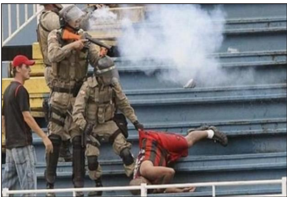
ازمة العنف في أورغواي تجبر اتحاد الكرة على الاستقالة

وقرر اتحاد أمريكا الجنوبية لكرة القدم فتح تحقيقات بشأن تلك الأحداث المؤسفة، مندداً بالسماح لمشجعي ناسيونال باستخدام الألعاب النارية خلال المباراة، حيث يُنتظر أن توقع عقوبات مالية ضخمة على الفريق الأورغواي صاحب الملعب. وعقب الإعلان النحاسي غير المتوقع، اجتمع موكبها الجمعة الماضية مع رئيس الاتحاد المحلي ومسؤولي ناديي بينيارول وناسيونال، وتوصل معها إلى اتفاق بخصوص إقامة مباريات الجولة القادمة لدوري كلاوسورا نهاية الأسبوع، على أن تؤمن الشرطة فقط المداخل والمناطق القريبة من الملعبين.