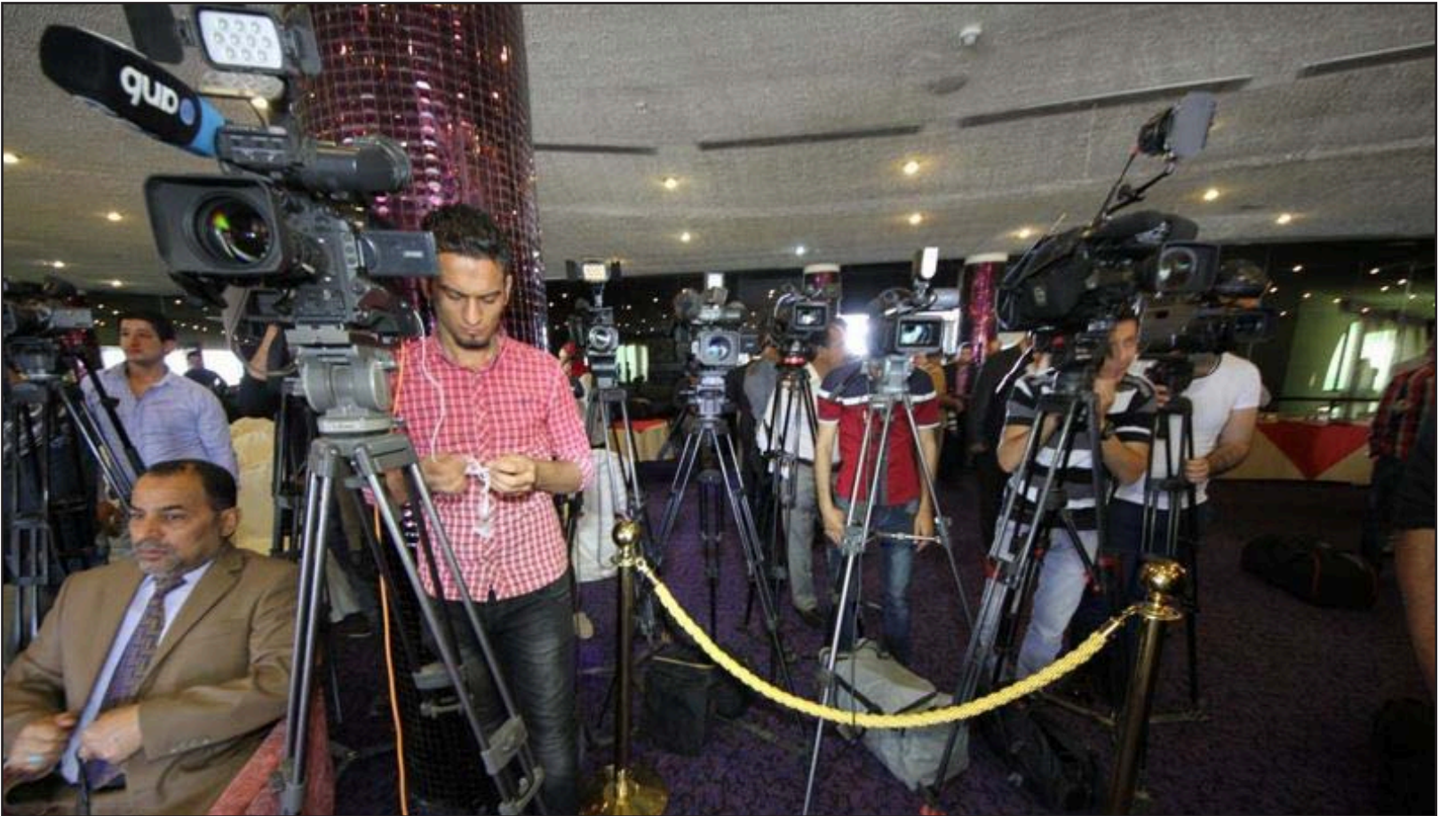
صحفيون في مؤتمر تنظيم علاقة الصحافة بالقوات الامنية

وأضاف مدير المطعم، أن الرئيس بشار من زبائننا المميزين حيث كان يزور المطعم مرتين بالأسبوع"، وتابع "عندما كان يجلس يقول ضعوا كل شيء، على جنب وأعطوني طبق البرغل مع اللحم، الذي كان المفضل بالنسبة له". يذكر أن سوريا تشهد حرباً أهلية طاحنة منذ أكثر من ثلاث سنوات، تسبب بأضرار مادية جسيمة فضلاً عن مئات الآلاف من الضحايا، وهجرة الملايين داخل البلاد أو خارجها، وأن مئات الآلاف من أولئك النازحين قدموا إلى إقليم كردستان العراق، حيث يباشر الكثيرون منهم مزاولة أعمالهم في الإقليم.