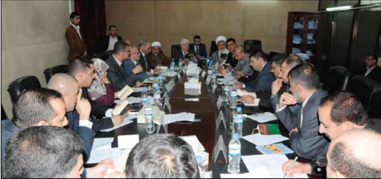
اجتماع لقادة وممثلي الكتل النيابية لمناقشة الموازنة - أرشيف

وصوت مجلس الوزراء، في (الـ١٥ من كانون الثاني ٢٠١٤)، بالموافقة على مشروع قانون الموازنة العامة الاتحادية لجمهورية العراق للسنة المالية ٢٠١٤، وإحالتها إلى مجلس النواب استناداً