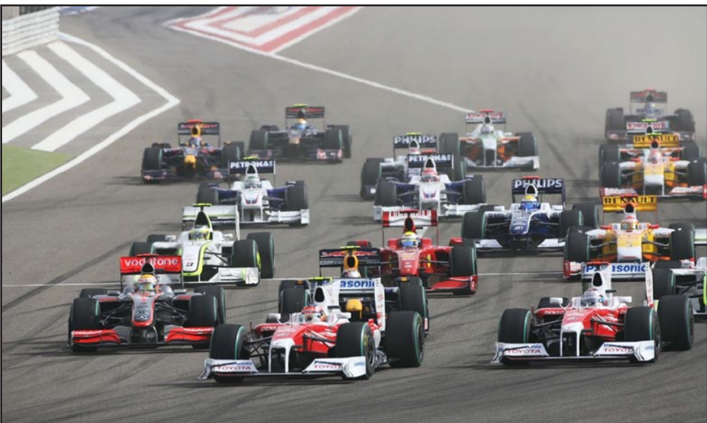
مرسيدس يواصل الصدارة بثقة كبيرة

طريقة (رد بول) في زيادة سرعته رائعة للغاية لذا فإننا نحتاج للمحافظة على سرعتنا لنظل على تفوقنا. ويتصدر روزبرج ترتيب السائقين برصيد ٤٣ نقطة متفوقاً على هاميلتون (٢٥ نقطة) وفرناندو ألونسو سائق فيراري (٢٤ نقطة).