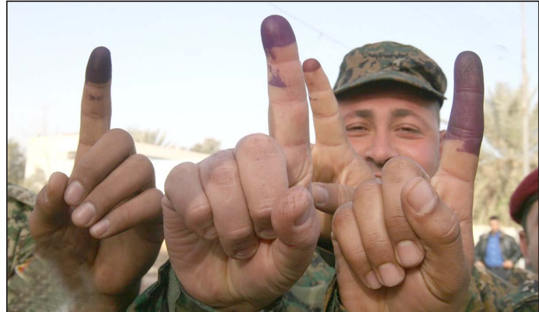
مواطنون يلوحون باصابعهم البنفسجية