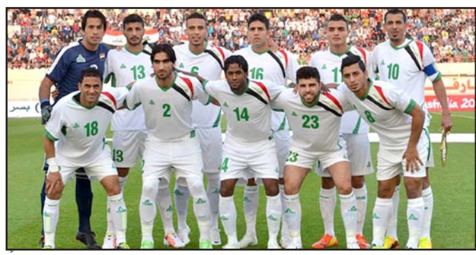
منتخبنا في المركز ١١ عربياً

تقدم منتخبنا الوطني لكرة القدم ثلاثة مراكز جديدة في التصنيف الشهر الجديد