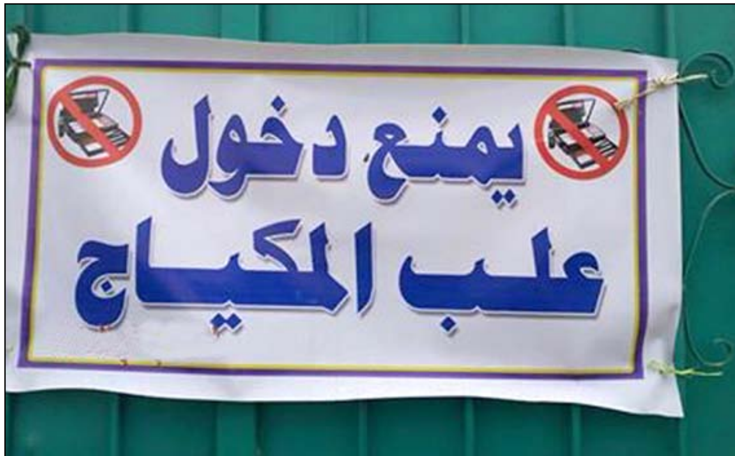
جامعة بابل تمنع دخول المكياج