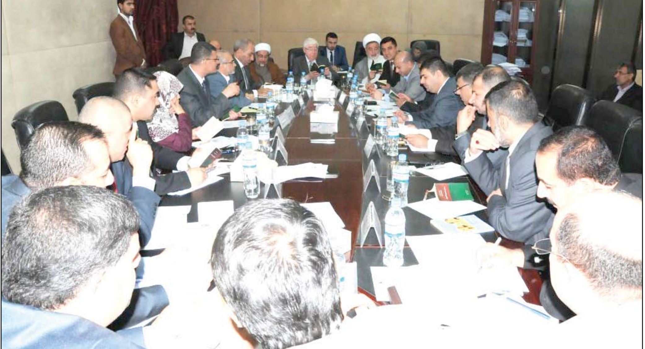
اجتماع اللجنة المالية مع قادة الكتل لمناقشة الموازنة - ارشيف

أبدت كتل سياسية مخاوفها من أنباء تتحدث عن عزم رئيس الوزراء اعلان حالة طوارئ في البلاد بعد نحو اسبوع من إرساله مسودة قانون السلامة الوطنية الى مجلس النواب. وتؤكد الكتل ان إقرار قانون السلامة او اعلان حالة الطوارئ بحاجة الى حزمة من الخطوات يصعب معها التفرد باتخاذ مثل هكذا قرار، مشيرين الى ان اقرار قانون السلامة بحاجة الى تمريره بأغلبية الثلثين، اما اعلان حالة الطوارئ فيجب ان يصوت عليه البرلمان بعد ان يقدم القائد العام عرضاً مفصلاً عن حاجة البلاد لمثل هكذا خطوة.