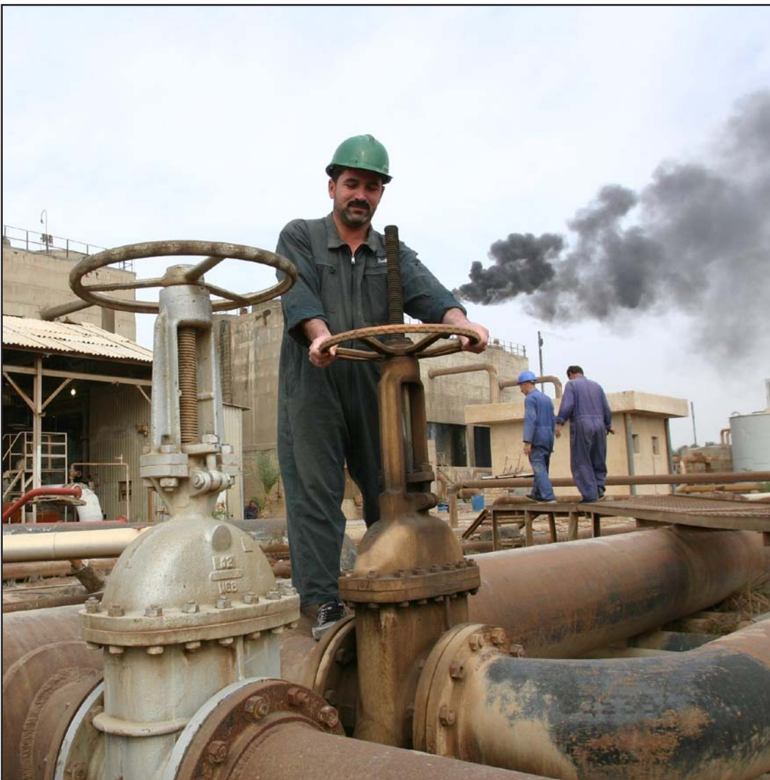
حقل الزبير في البصرة

مليار دولار نهبت من العراق بين عامي 2001 و2010 حسب ما كشفه ممثل الأمين العام للأمم المتحدة في العراق نيكولاو ملاديونوف بحسب مضامين دراسة صندوق النقد الدولي.