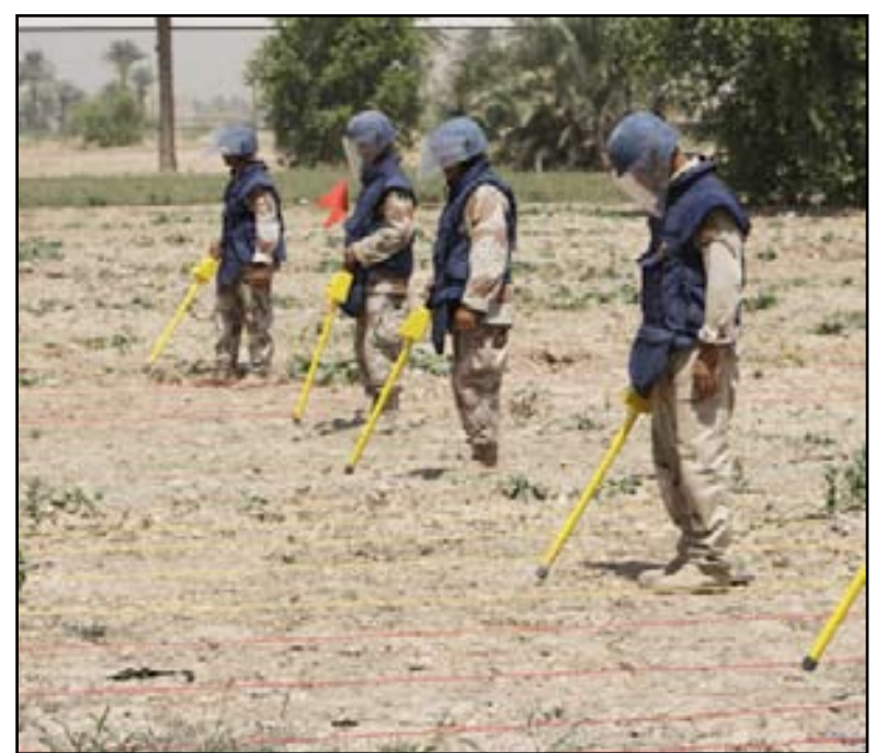
جنود يبحثون عن الاتغام.. ارشيف