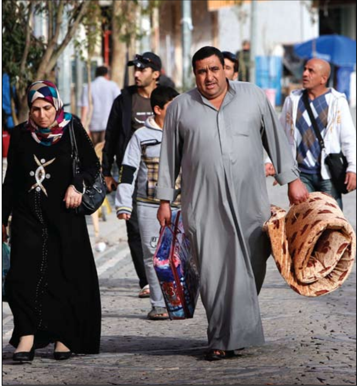
عائلة أنبارية نازحة الى اقليم كردستان

وقال العلواني في تصريح الى "المدى" امس ان "اطرافاً في الحكومة الاتحادية، من مصلحتها تأجيل الانتخابات لضمان حصول المالكي على الولاية الثالثة"، مشيراً الى ان تلك الأطراف "ارادت شحن الشارع الشيعي، وتخويفه بما يحدث في الأنبار، ليظهر المالكي بأنه المخلص والمنقذ من خلال الفوز مرة أخرى في