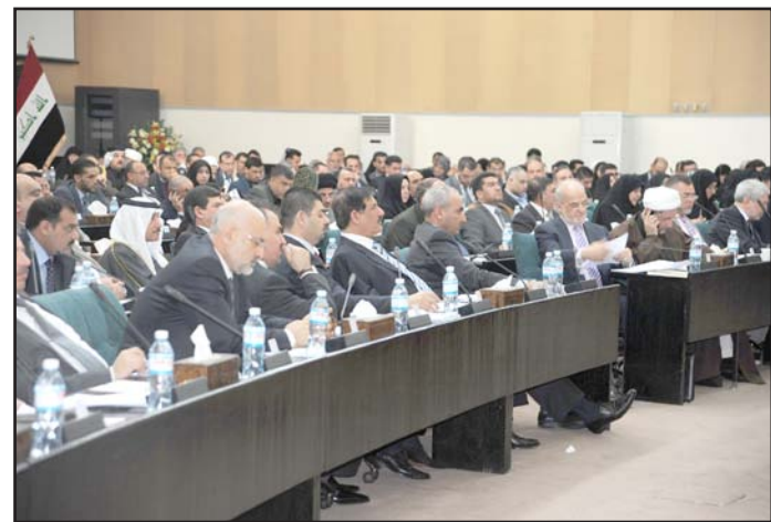
أحدى جلسات البرلمان