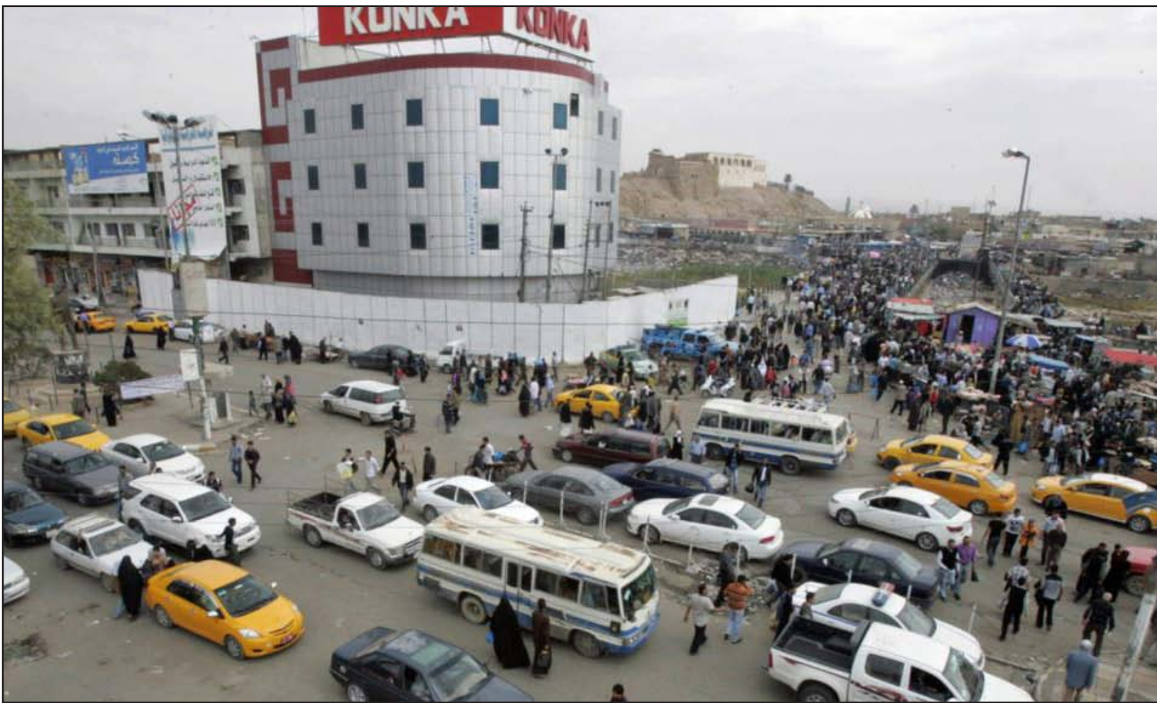
مدينة كركوك... أرشيف

مكونات كركوك منسجلة اليوم بالمنافسة في ما بينها وضد بعضها من أجل تغيير المعادلة وما يعمق المنافسة هو ان تلك