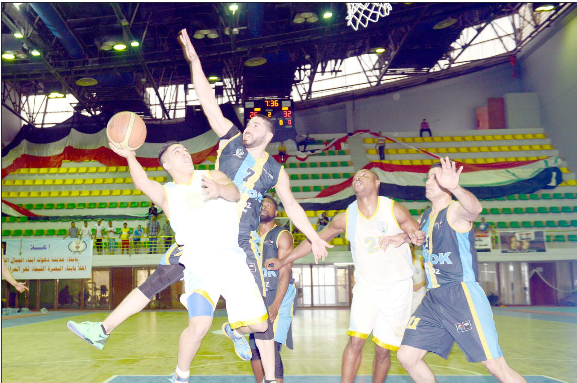
لقاء دهوك ونفط الجنوب يشهد تنافسا مثيرا في قاعة الشعب