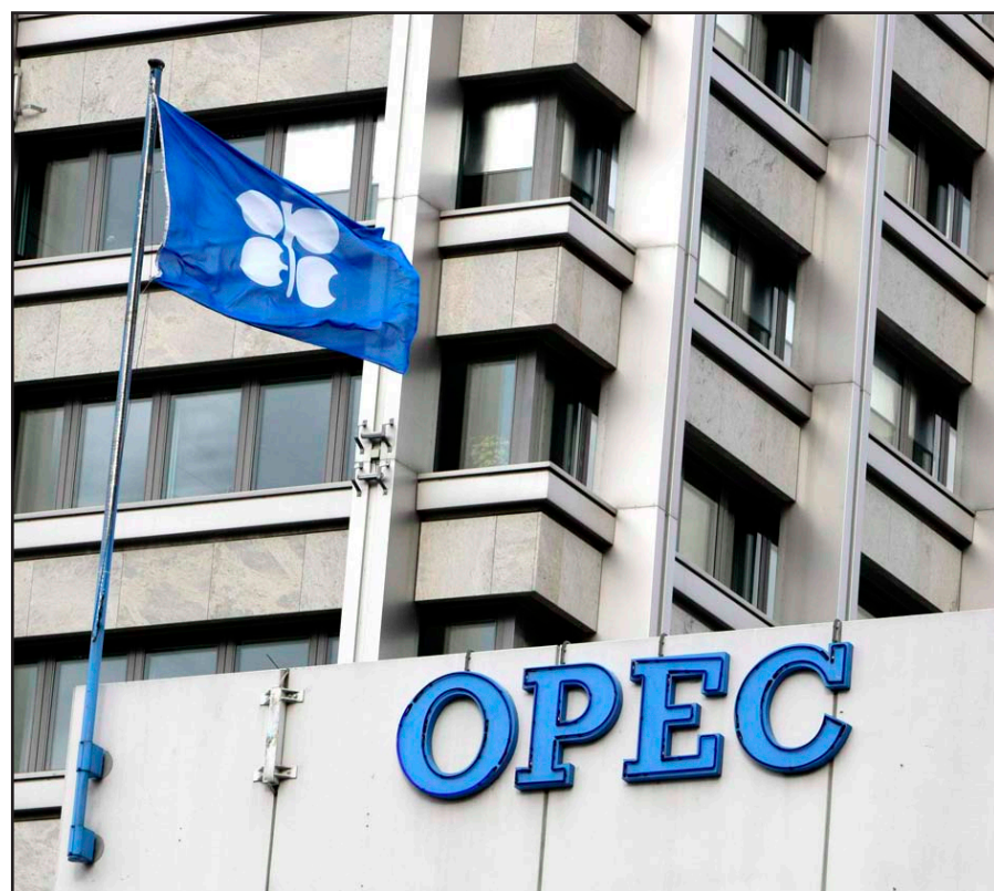
مبنى منظمة أوبك

وتخطط منظمة أوبك للاجتماع في 11 حزيران في فيينا لمراجعة سوقها الإنتاجية التي تقف الآن عند حد 30 مليون برميل باليوم.