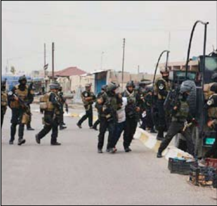
عناصر من سوات في الرمادي

وأكد المالكي أن "الوقت حان لحسم قضية الفلوجة وتحرير المياه وهذه مسؤوليتنا ندافع عن شعبنا وعن الأبرياء وندافع عن العراق والعميلة السياسية التي يريدون القضاء عليها"، مشيراً إلى أن "القاعدة والبعث وداعش، هم الوجه الأخر للسياسة التي كان يعتمدها نظام البعث في ظل سلطته السابقة حينما قام بتجفيف الأنهار و عملية غلق المياه او حينما قام بقتل الشرفاء والعلماء والمراجع".