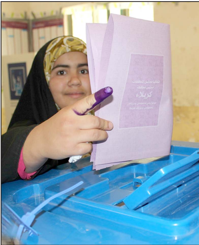
مواطنة تدلي بصوتها

ويؤكد المواطن أنه لم يزر النائب سوى في فترات الانتخابات عند نزوله إلى الشارع وحضور المجالس والندوات الشعبية والتكلم مع الشباب على أنهم هم عمود المستقبل وعليهم يقع العائق الأكبر في مسك زمام الأمور. أمور كثيرة وفوارق كبيرة وخطوط حمراء بين الشعب والمسؤولين أدت إلى انعدام ثقة البعض بهؤلاء المرشحين في الفترة الحالية فالشعب لا بد له أن ينتصر وينتخب من هو فعلا جدير بأمور حكم البلاد وليس من هو قادم للحصول على منافع شخصية لا تتفق سوى ذويه.