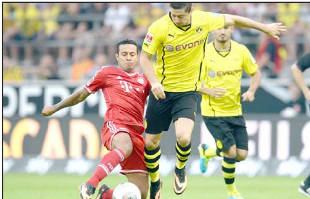
دورتموند يسعى للتأثر من البايرن

إلى الدور نصف النهائي من مسابقة دوري أبطال أوروبا للمرة الثالثة على التوالي بعد أن حوّل الاربعة خلفه امام ضيفه ماننستر يونايتد الانكليزي الي فوز ٣-٢ في اياب ربع النهائي (انتهى الذهاب ١-١) فيما فشل دورتموند في تكرار سيناريو الموسم الماضي ومواصلة مشواره حتى النهائي وذلك برغم المباراة الرائعة التي قدمها الثلاثاء الماضي أمام ريال مدريد الإسباني التي فاز بها (٢-٠) من دون أن يجنبيه ذلك الخروج