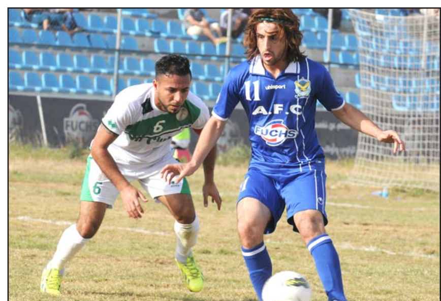
الجوية ينتزع ثلاث نقاط من النفط بصعوبة

وقال نوري ل(المدى) إن الأداء الذي ظهر به لاعبو فريق الشرطة في جميع مبارياته التي خاضها ضمن منافسات بطولة كأس الاتحاد الآسيوي بحاجة إلى مراجعة كونه لا يتلاءم