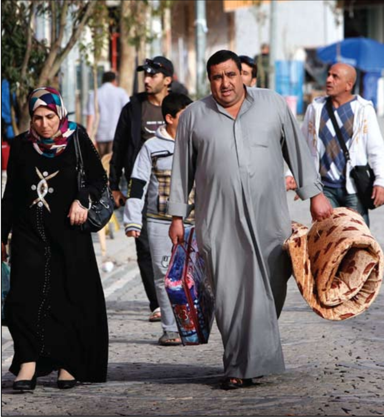
عائلة أنبارية نازحة الى اقليم كردستان

وقال العلواني في تصريح الى "المدى" امس ان "اطرافا في الحكومة الاتحادية، من مصلحتها تأجيل الانتخابات لضمان حصول المالكي على الولاية الثالثة"، مشيراً الى ان تلك الأطراف "ارادت شحن الشارع الشيعي، وتخويفه بما يحدث في الأنبار، ليظهر المالكي بأنه المخلص والمنقذ من خلال الفوز مرة أخرى في