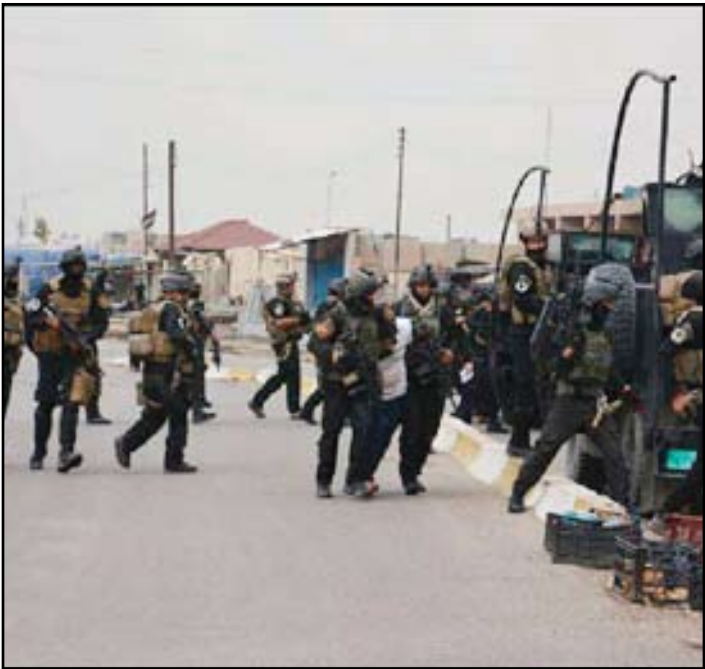
عناصر من سوات في الرمادي - أرشيف

سريعاً". إلى ذلك رأى القيادي في كتلة المواطن، حميد معلقة، أن "رئيس الحكومة، نوري المالكي، يبدو عازماً على إنهاء ملف معركة الأنبار من خلال إشراك المجتمع الدولي والأمم المتحدة"، مؤكداً أن "المالكي يريد ان يضع الجميع بالصورة ويوضح لهم أن الوضع بالمحافظة لم يعد محتملاً، إذا وصلت التجاوزات حداً يتعلق بحياة الإنسان من خلال قطع المياه". وعد معلقة في حديث الى (المدى برس)، أن من "الطبيعي أن تتصدى الحكومة لتلك الأعمال الإرهابية الإجرامية، ولا أحد يمكن أن يلومها او يقف ضدها في