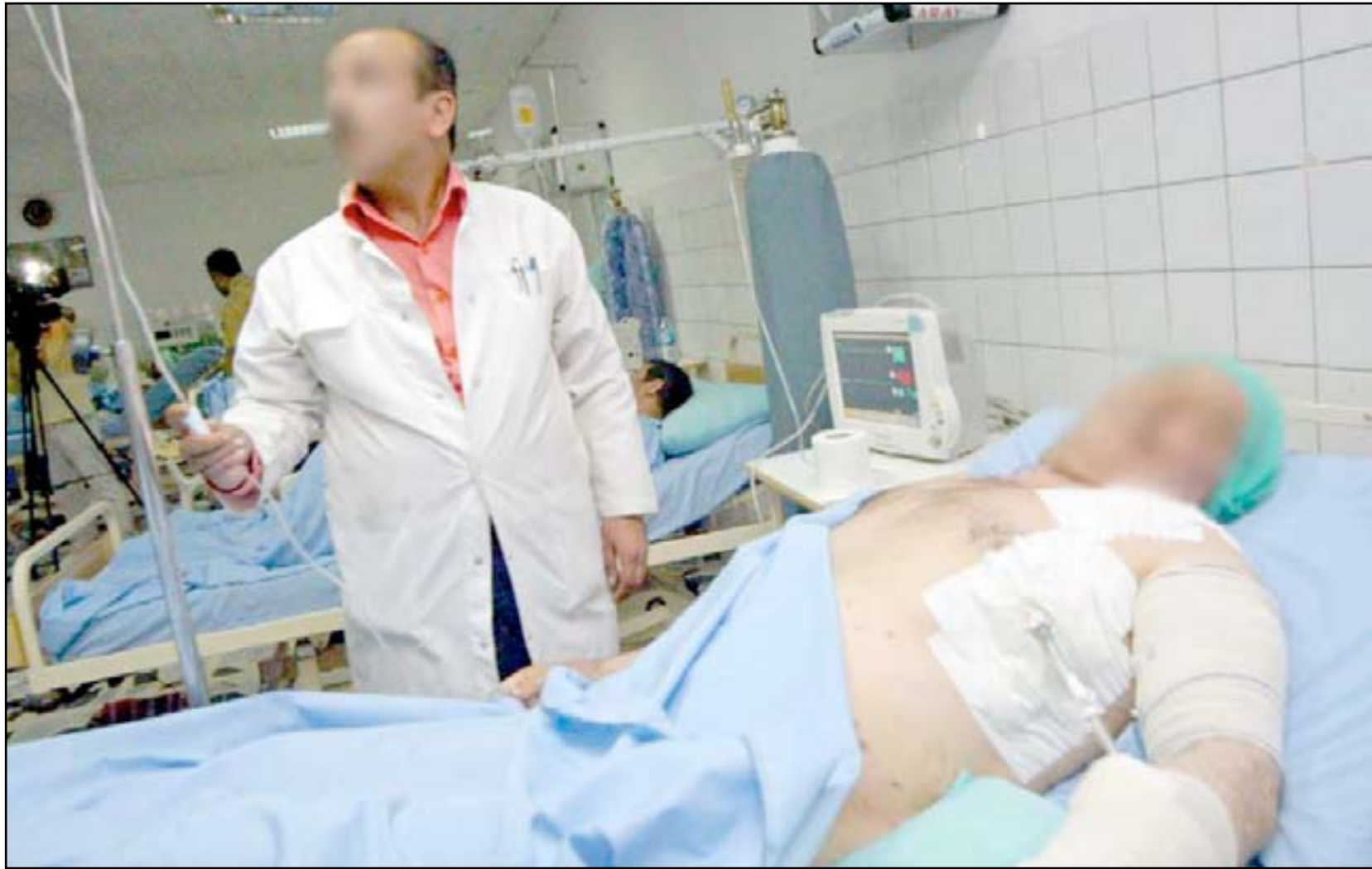
ممرض يراقب تطور صحة جريح في إحدى مستشفيات العراق.. أرشيف

من سوء حظ الكثير من الأطباء، والعاملين في صالات طوارئ العمليات بمستشفيات بغداد، أن يتوفى أحد مرضاهم خلال محاولة إنقاذ حياته، حتى وإن كانت حالته ميؤوساً منها أو يكون قد توفي قبل وصوله المستشفى، إذ تنهال عليهم شتى أنواع "الإهانات واللكمات والرفسات" ليتحول "القدر الإلهي" إلى "جريمة قتل" يتوجب على الطبيب ومساعديه دفع ثمنها وفقاً للقانون العشائري، مما اضطر الكثيرين إلى ترك العمل أو الهجرة.