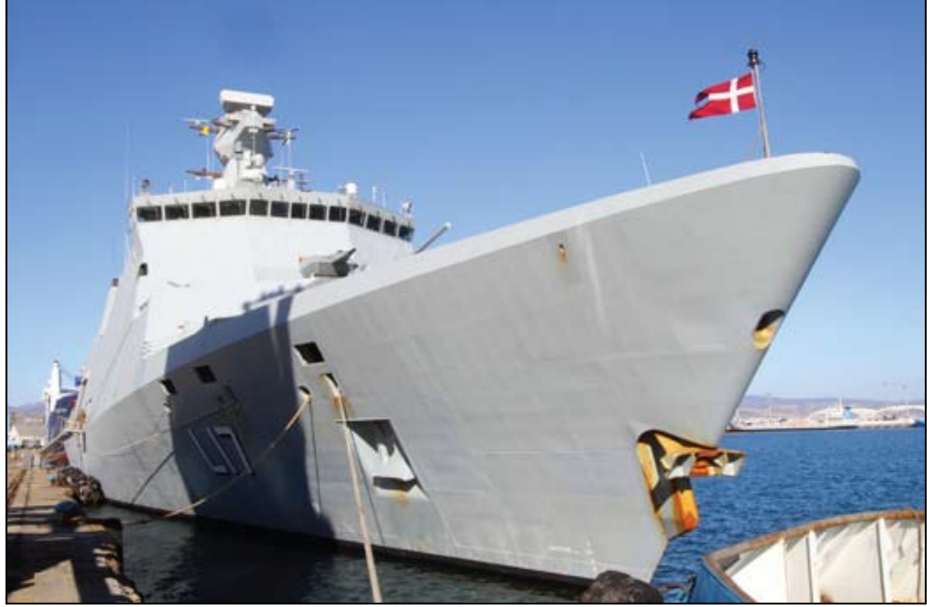
عودة سفينتي نقل الكيميائي السوري إلى قبرص بسبب تأخر مهمة الانتعاف...

دمشق/ أ. ف. ب وأضاف أن "الوضع الأمني اعتبر جيداً بدرجة كافية" لاستئناف عمليات الشحن، مشيراً إلى أن ١٤ حاوية تم تحميلها منذ الرابع