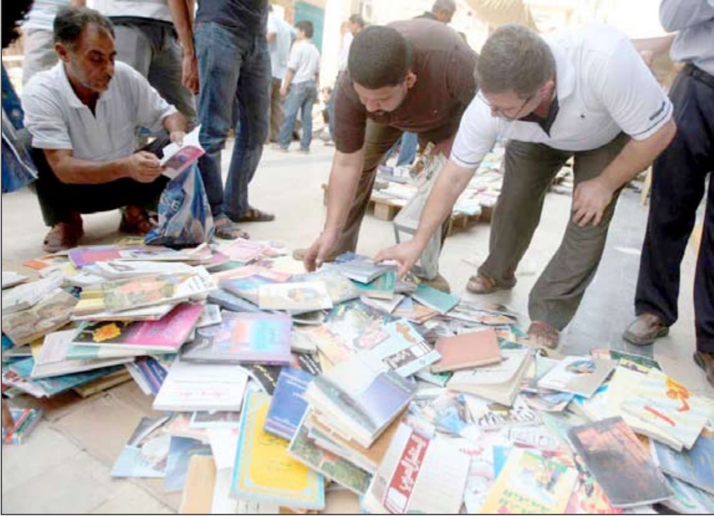
شبان يتسوقون الكتاب في شارع المتنبي .. أرشيف