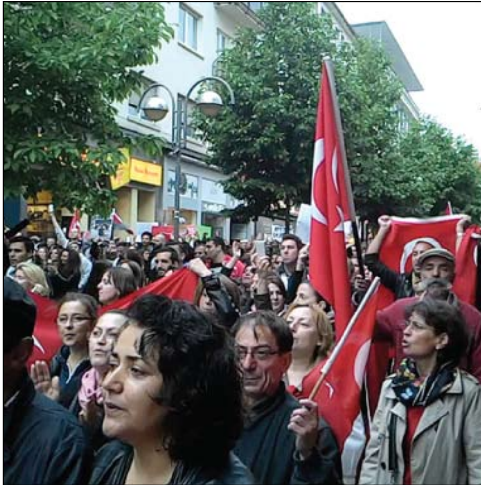
تظاهرات تركيا.. (أرشيف)

ان القرار شمل أيضا قناة "المنار" وكانت "المنار" استضافت قبل أيام وزير الإعلام السوري عمران الزعي الذي قال: "إننا نحترم قناة المنار لأنها قناة مقاومة، وكذلك قناة الميادين لأنها قناة قومية، ولكن المسألة تنظيمية بحتة". يذكر ان صحيفة "الأخبار" الغربية من "حزب الله" نشرت في ٤ نيسان (أبريل) الجاري افتتاحية جاء فيها: "ما يكسر الظهر، هو ما حصل قبل أيام، عندما قرر احد ما، معلوم الاسم والإقامة والموقع، ان الإدارة الإعلامية للمعركة في وجه العصابات المسلحة، لا تكون إلا كما يرى هو، وان كل محاولة لتظهير المعركة بغير ما يطابق صورة الإعلام الرسمي، سيجري التعامل معها على أساس انها اعتداء على السيادة في سوريا. وما لبث القرار ان تُرجم إقصاء لوسائل إعلامية من بينها "الميادين" و"المنار" تقود من مواقع متواضعة مادياً وتقنياً، اقسى معركة مع طواحين امبراطوريات الإعلام المعادي لسوريا، ونجحت في تحطيم كذبة إعلام القتل ومموليهم، لكن يبدو ان في دمشق، وفي موقع القرار، من لديه رأي آخر. وهو طبعاً حرّ في رأيه".