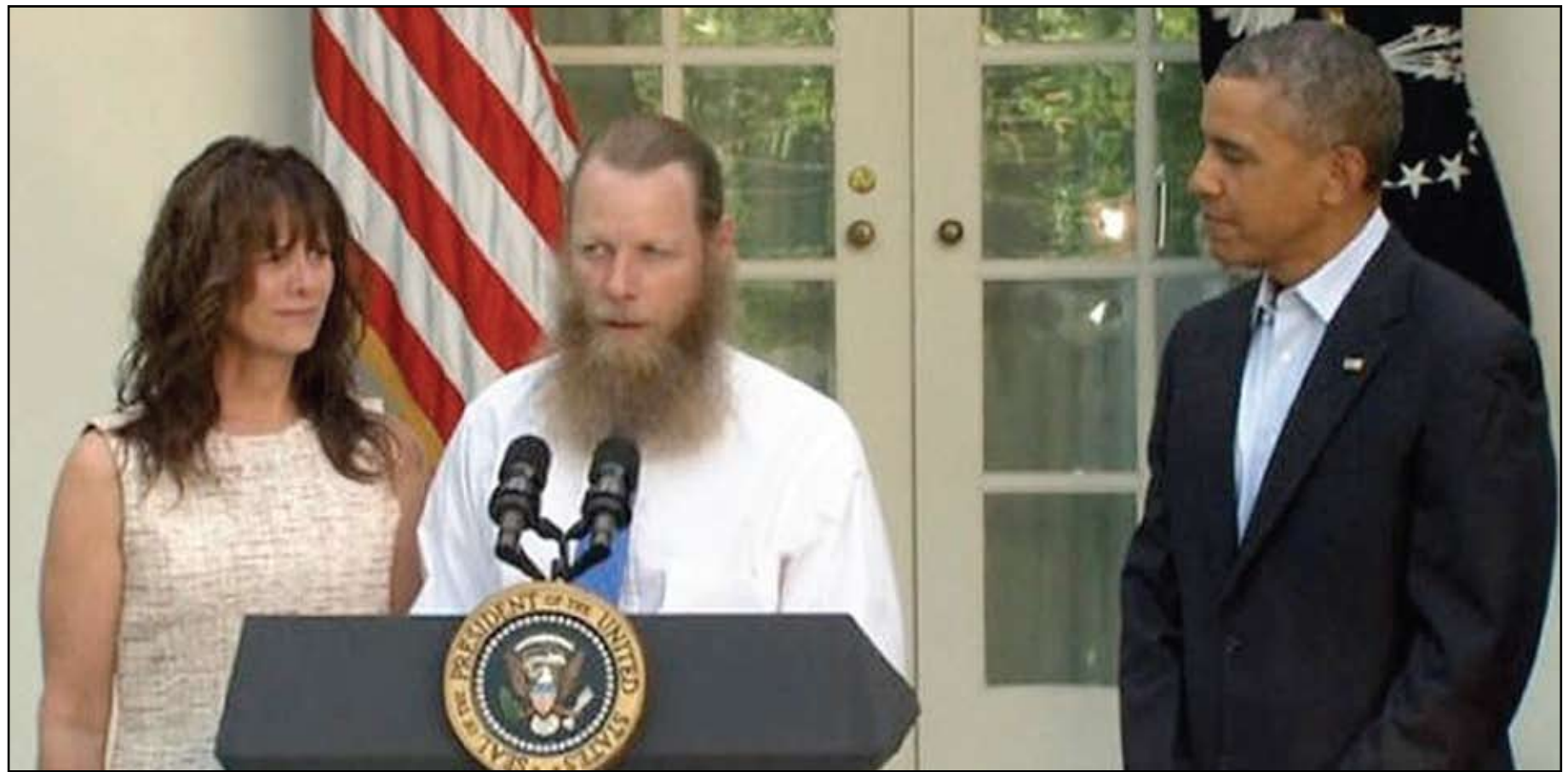
أوباما مع الجندي المطلق سراحه..

■ من هم قادة طالبان الخمسة الذين تم الإفراج عنهم