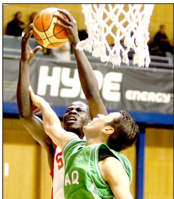
تدني مستوى منتخبنا بكرة السلة في غرب آسيا

لقد حل المنتخب الإيراني بعناصره الشبابية المركز الثاني في البطولة وقد فاز على منتخبات فلسطين واليمن وسوريا والعراق وخسر مباراة واحدة أمام الأردن وجاء المنتخب السوري بالمركز الثالث بعد ان فاز على منتخبات العراق وفلسطين واليمن وخسر مباراتين أمام منتخبي الأردن وإيران.