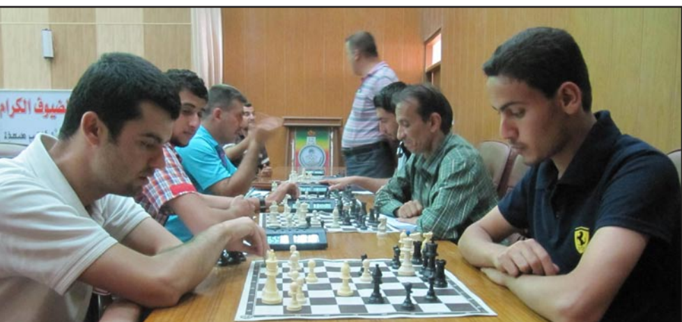
اتحاد الشطرنج يستعين بالخبرة المصرية لتدريب منتخباته

إن الاتحاد وافق على التعاقد مع الخبرة المصرية نتيجة التطور الحاصل فيها إضافة إلى أن قيمة التعاقد المالية هي جيدة مقارنة بقيمة العقد السابق مع المدربين الأجانب إضافة إلى سهولة التفاهم مع المدرب المصري بسبب اللغة، فيما كانت هناك صعوبات مع المدربين الأجانب هذه الأمور وغيرها جعلت الاتحاد يستقطب الخبرات التدريبية المصرية على حساب الخبرات الأخرى