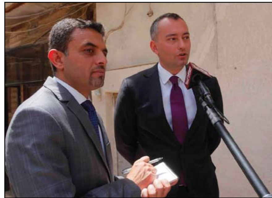
المبعوث الاسمي خلال المؤتمر الصحفي الذي عقده بعد لقائه المرجعية الدينية في النجف امس