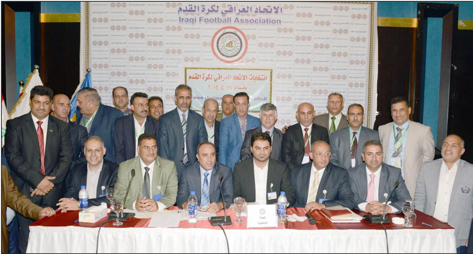
الأولمبية تبارك انتخاب مجلس ادارة جديد لاتحاد كرة القدم

بروح الفريق الواحد والتعاون مع الجميع من داخل الهيئة العامة وخارجها لتجاوز ما حدث من تجاذبات وتقاطعات أثرت بشكل أو بآخر على مستقبل اللعبة والتطلع بقوة لما ينتظرها من مشاركات رسمية مهمة خلال المرحلة المقبلة . ومن جهته أكد أمين سر اتحاد كرة القدم