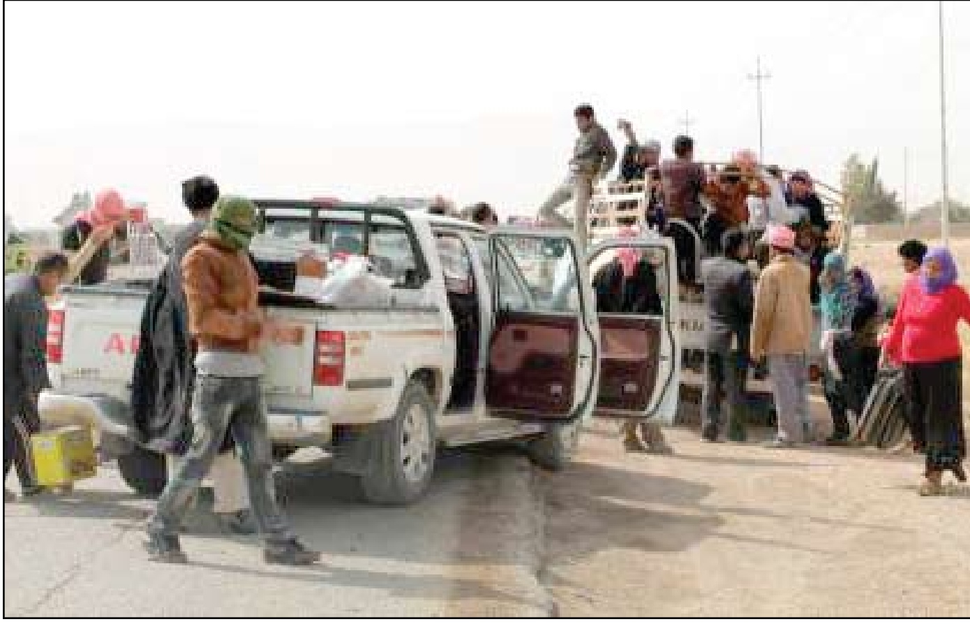
مزارعون أيزيديون في سنجار

ورغم ذلك فإن أفراد عشيرة شمر وفروا الأسلحة للأيزيديين وأمنوا إيصالهم إلى منطقتهم بعد الهجمات التي استهدفتمهم. ويزيديو سنجار هم اليوم في مأزق ففي السنوات الماضية اشتغل العديد منهم في صناعة الخدمات في كردستان العراق المستقرة والأمنة نسبياً، لكن على مدى السنوات القليلة الماضية كان هناك تدفق للسوريين - والكرد السوريين بشكل خاص - إلى كردستان العراق ولذلك فقد اشتدت المنافسة على هذه الأنواع من الوظائف اليوم. وكان يزيديو سنجار في العام الماضي قادرين على العودة في موسم الحصاد في ضاحية ربيعة بجيوب مليئة بالنقود، "كان صالون أختي مشغول دائماً، وهذه هي علامة تدل على أوقات اقتصادية جيدة لأنها تعني أن هناك الكثير من العرائس والحفلات التحضيرية استعداداً لحفلات الزفاف، مما يعني أن لدى السكان المحليين ما يكفي من المال للزواج لكن ربما لن يتمكن أحد من الزواج هذا العام". يقول أحد سكان سنجار، ومنذ الهجمات الأخيرة، عاد معظم