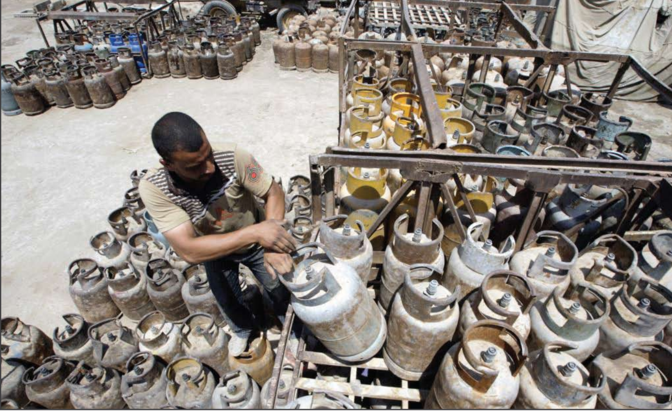
العراقيون يشكون من اسطوانات الغاز الإيرانية.. أرشيف

حذرت لجنة الصحة والبيئة في مجلس النواب، من اسطوانات غاز غير مطابقة للشروط البيئية وخالية من شروط السلامة والأمان، وفيما اتهمت شعبة السيطرة النوعية التابعة لوزارة التجارة بـ"غير الكفاءة"، أكدت وزارة النفط دخول عدد من اسطوانات الغاز الى العراق بطريقة غير قانونية وقد تعرض حياة المواطنين للخطر.