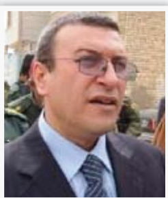
محافظ كربلاء عقيل الطريحي

"ان الاحتفال بمهرجان يوم كربلاء هو محطة من محطات استذكار أمجاد المدينة ومن خلاله نستطيع ان نتعاون ونتعاقد ونعمل كفريق واحد خدمة للصالح العام، مبينا ان يوم كربلاء ليس احتفالاً فقط وانما هو نقطة انطلاق باتجاه رقي وازدهار كربلاء، ان المهرجان هو استعراض لما تستطيع القوى المخلصه تنفيذه خلال العام الواحد وتبيان ما انجز خلالها وما تريد انجزه في الأعوام المقبلة".