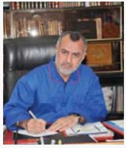
محافظ ميسان علي دواي

"جري اليوم (أمس) افتتاح عدد من القاعات الامتحانية التي تم إنجازها ضمن مشروع انشاء ٥٠ قاعة امتحانية وأبعاد (٢٥ × ١٠ م) بواقع ٢٣ قاعة في الأضوية و٢٧ قاعة في المركز حيث تم اكتمالها وهي مهيأة لأداء الامتحانات النهائية حيث تم اكتمال تغليفها بجدار عازل وإكمال أعمال نصب أجهزة التبريد بواقع ١٠ سبيل بطاقة ٥ طن لكل قاعة، إن الامتحانات العامة للدراسة الإعدادية بفرعها العلمي والأدبي جرت في القاعات المنجزة حيث حرصت إدارة المحافظة على إنجازها من أجل تأدية الامتحانات النهائية فيها سعياً لتوفير أجواء ملائمة للطلبة".