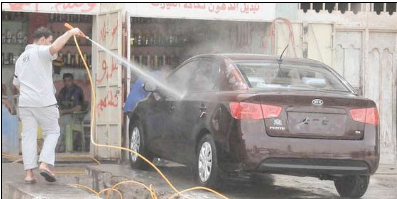
أمانة بغداد تحذر من هدر الماء الصافي.. أرشيف

أعلنت أمانة بغداد، امس الاحد، عن حملة توعية تحت لحد من هدر الماء الصافي وتثبيت استعماله والمحافظة على هذه الثروة الوطنية.