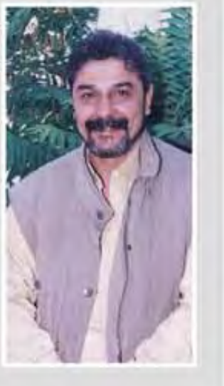
مشاهد يومية من الشارع

استطاع الفنان كنعان علي ان يكون اسمه الفني من خلال اسهامه بعدد من المسلسلات والبرامج التلفزيونية، التقينا في هذا الحوار: