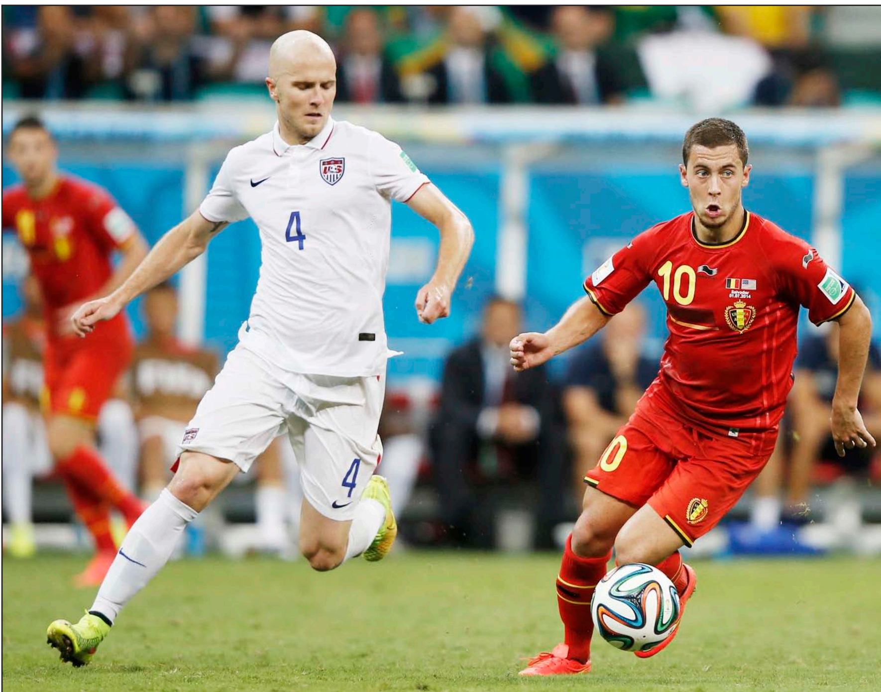
هازارد لم يرتق إلى مستواه في بطولة كأس العالم

دور المجموعات طبقاً للأحصاءات. ويقترب تعاقده مع بايرن ميونخ من الانتهاء، لكن برغم تقدمه في السن فانه ربما يكون قد خطف انظار العديد