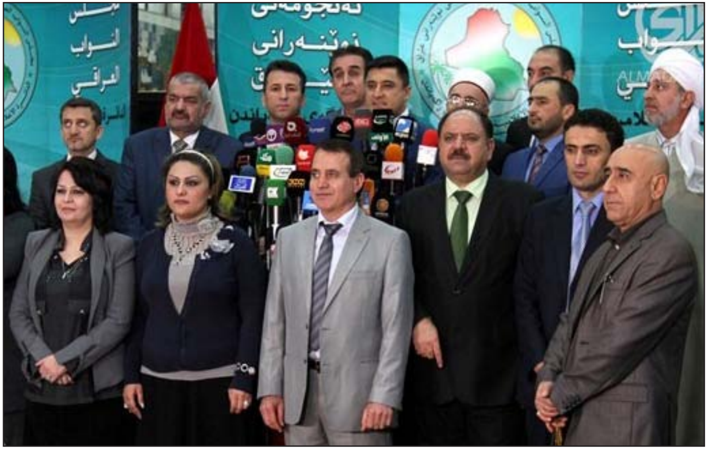
كتلة التحالف الكرديستاني خلال مؤتمر صحفي - أريشيف

أكد التحالف الكرديستاني، أمس الأحد، أنه "لن يقدم" مرشحاً لرئاسة الجمهورية في حال أصر ائتلاف دولة القانون على ترشيح زعيمه نوري المالكي لرئاسة الوزراء، وفيما أوضح أنه "لا يريد تكرار التجربة الفاشلة"، بيّن أنه "لا يوجد مبرر" لعقد جلسة للبرلمان إذا لم يتم انتخاب رئيسي البرلمان والجمهورية.