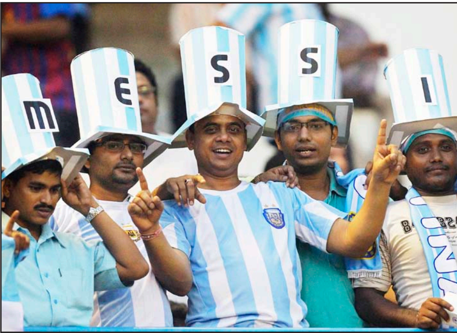
احتفال الأرجنتين بمناسبة التأهل الى نصف النهائي

واعلنت الشركة عن ١٠ رحلات اضافية لمشاهدة نصف نهائي الأربعة امام هولندا.