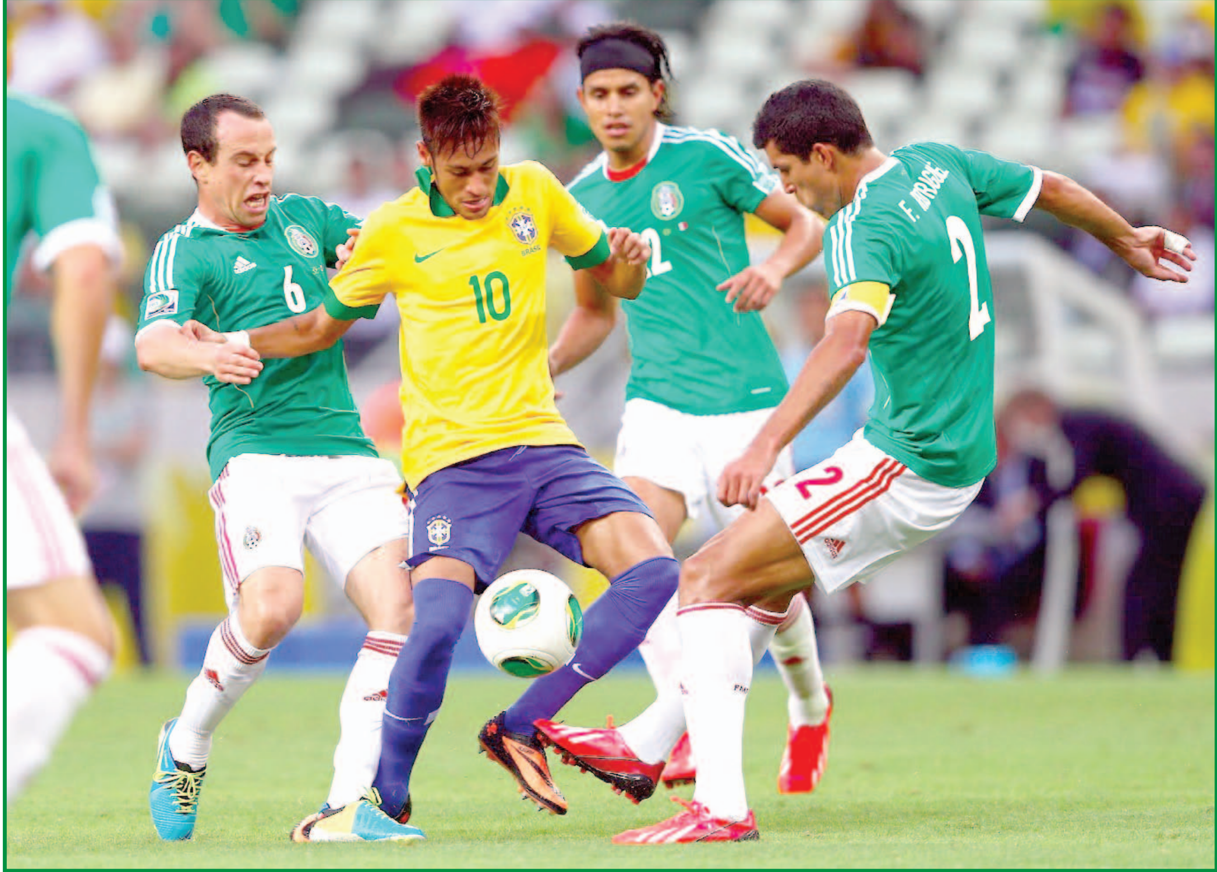
نيمار يؤازر منتخب بلاده خارج المستطيل الأخضر

"سيليساو" من أجل اكمال "الحلم" باحراز لقب مونديال 2014 الذي يقام على ارضهم. "انها لحظة صعبة علي ومن غير السهل معرفة ما يجب قوله، حلمي لم ينته، بل تعرقل"، هذا ما قاله نيماز بتأثير في شريط فيديو نشره الاتحاد البرازيلي قبل ان يرسل نجم برشلونه عن مقر المنتخب. وواصل "الحياة تتواصل، انا واثق من ان زملائي سيقومون بكل ما هو ممكن لكي نحقق حلمنا بان نكون نجوم برشلونه في دور الثمانية بالمونديال (1-2) لصالح السيليساو يغيب على إثرها عن باقي منافسات البطولة. وخرج نجم برشلونه الاسباني والمنتخب البرازيلي نيماز بخطاب مؤثر حاول ان يجيب دموعه خلاله وهو يواجه دعوة الى زملائه في