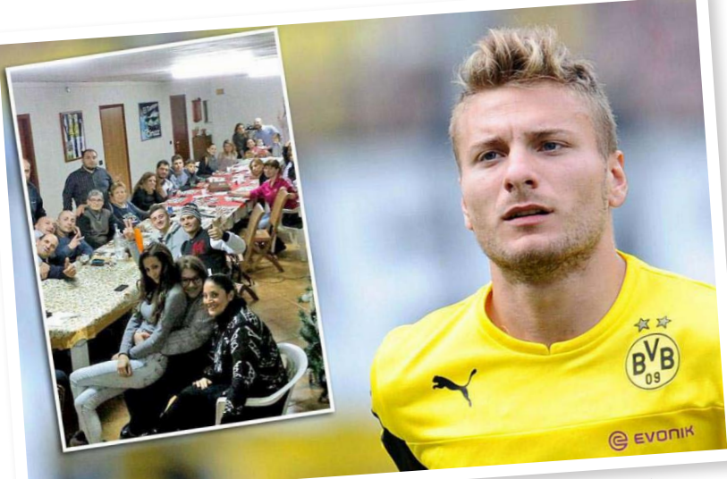
شيرو وسط اقربائه وأبناء عمومته

صحفية "خلال هذه المرحلة، فالكاو لاعب بفرينا، وهو معنا بنسبة مئة بالمئة، لن نسمح له بالرحيل". وأضاف "من المؤسف أننا فقدنا جيمس رودريغيز ولكن يمكننا الاعتماد على بقاء فالكاو، بصرف النظر عما يُقال، ولكنه لاعبنا". واختتم مدرب موناكو حديثه بالقول "إنه في المراحل النهائية من برنامج التعافي وسيكون معنا هذا الموسم". وانتقل فالكاو إلى موناكو الصيف الماضي قادماً من أتلتيكو مدريد الإسباني مقابل ٦٠ مليون يورو، بعدد يمتد حتى ٢٠١٨.