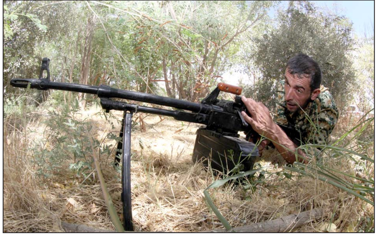
■ احد المتطوعين مع الجيش العراقي يقاتل ضد مسلحي "داعش" في ناحية العظيم التابعة لديالى..