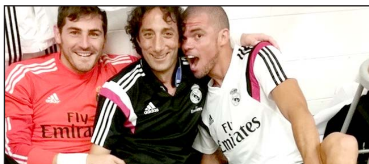
بيبي يقلد عضّة سواريز