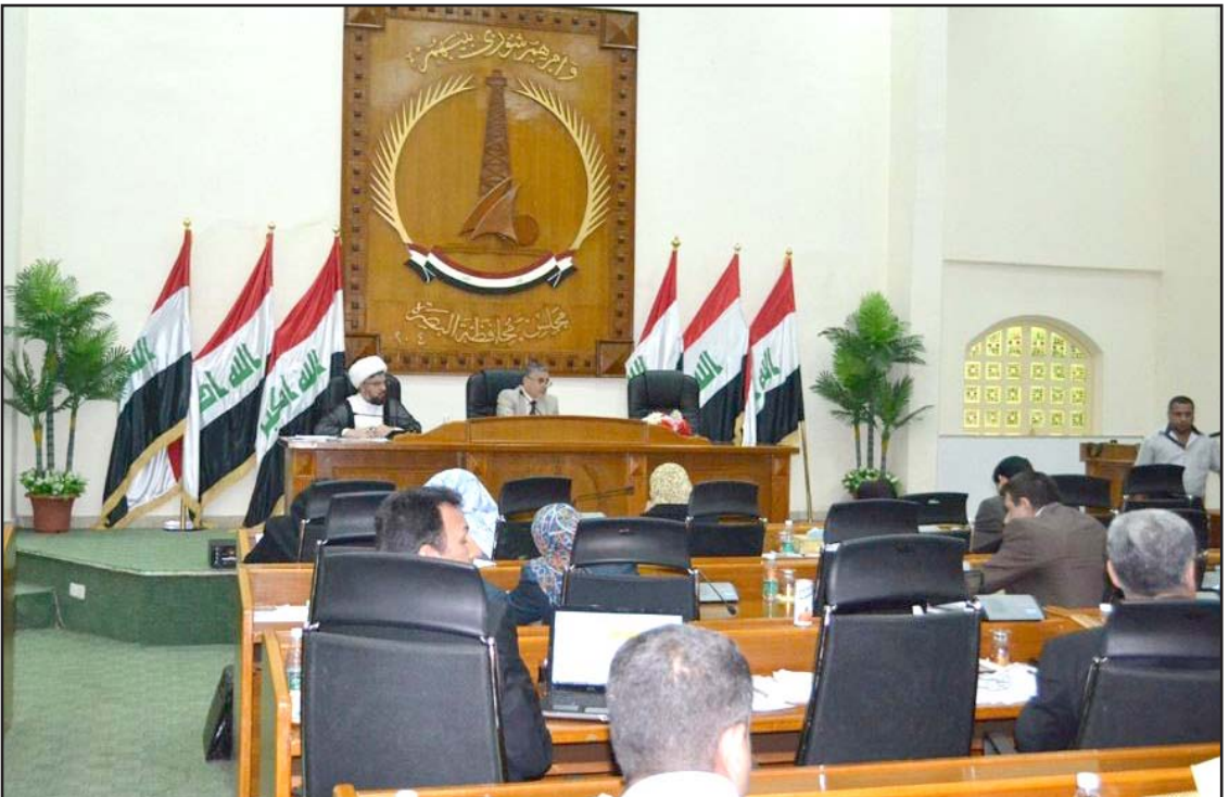
مجلس محافظة البصرة