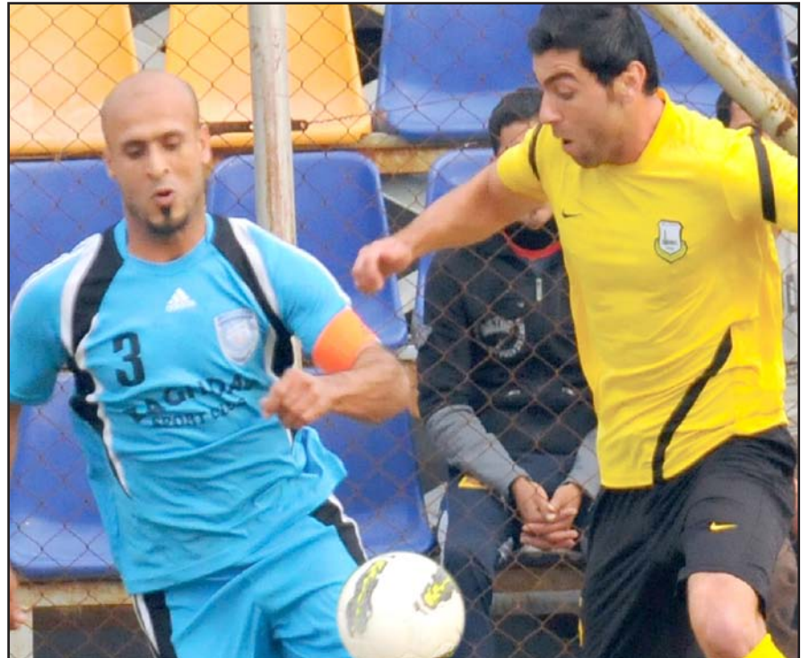
اتحاد الكرة يثقف الاندية عن نظام انتقالات اللاعبين

المقبل آخر موعد للتسجيل والانتقالات الصيفية للاعبين للموسم الكروي المقبل التي انطلقت يوم ١ تموز الماضي حيث لا يتم تصديق عقود