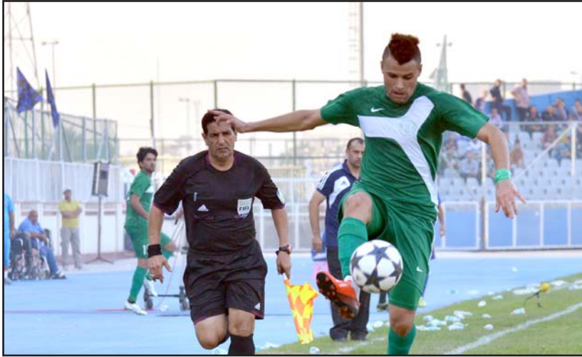
وليد خارج اهتمام بغداد

فريقنا ظهر بصورة ملفتة للنظر في الموسم المنصرم وكان منافسا شرسا لإحراز اللقب أسوة بفريقي الشرطة وأربيل صاحبي المركزين الأول والثاني، مؤكداً أننا أبقينا على معظم لاعبي الفريق والاحتفاظ بهم لتمثيل الفريق