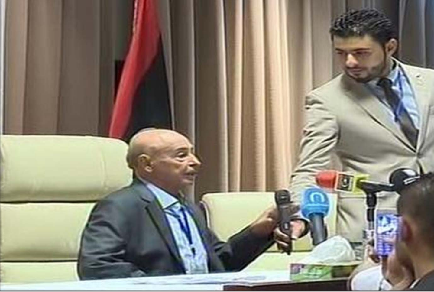
صورة لرئيس البرلمان

انتخب عقيلة صالح عيسى العبيدي رئيساً لمجلس النواب الليبي، بعد حصوله على 77 صوتاً، وبطارق ضنيل عن منافسه أبو بكر مصطفى بعيرة الذي حصل بدوره على 74 صوتاً، وكان مجموع النواب الذين صوتوا لانتخاب رئيس المجلس 158 نائباً.