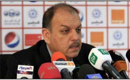
بغداد