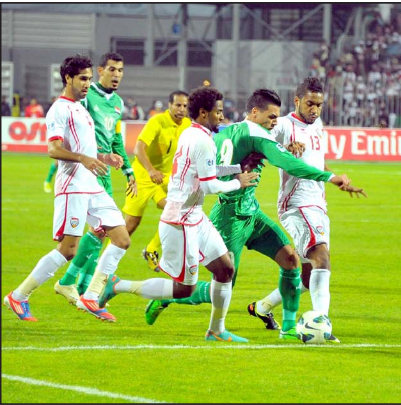
من لقاء العراق والإمارات في نهائي دورة ٢١ في النامة

حسب تصنيف الاتحاد الدولي لكرة القدم في الشهر الذي تقام فيه القرعة بواقع منتخبين في كل فئة وتخصص الأرقام من (٢) إلى (٤) لكل مجموعة . ويتنظر أن يتم السحب بالقرعة : المنتخب الذي يتم سحبه أولاً من الفئة الثالثة يوضع في المجموعة (أ) مع سحب رقم يخصه له في مجموعته، المنتخب الذي يتم سحبه ثانياً من الفئة الثالثة يوضع في المجموعة (ب) مع سحب رقم يخصه له في مجموعته، المنتخب الذي يتم سحبه أولاً من الفئة الثانية يوضع في المجموعة (ب) مع سحب رقم يخصه له في مجموعته، المنتخب الذي يتم سحبه ثانياً من الفئة الثانية يوضع في المجموعة (أ) مع سحب رقم يخصه له في مجموعته، المنتخب الذي يتم سحبه أولاً من الفئة الأولى يوضع