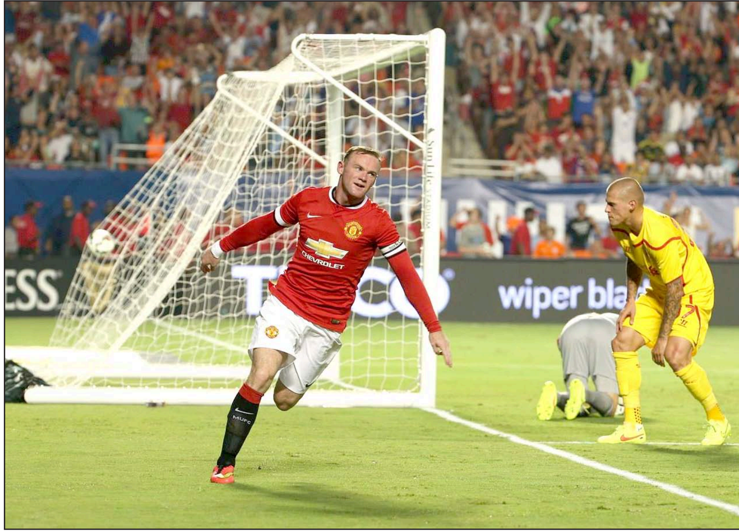
مانشستر يونايتد ينهي استعداداته للدوري باحران لقب ميامي

ماتا الجيدة من عند حافة منطقة الجزاء بمدافع ليفربول مامادو ساكو وأبدلت اتجاهها قليلاً لتسكن شبك الحارس سيمون مينويليه.