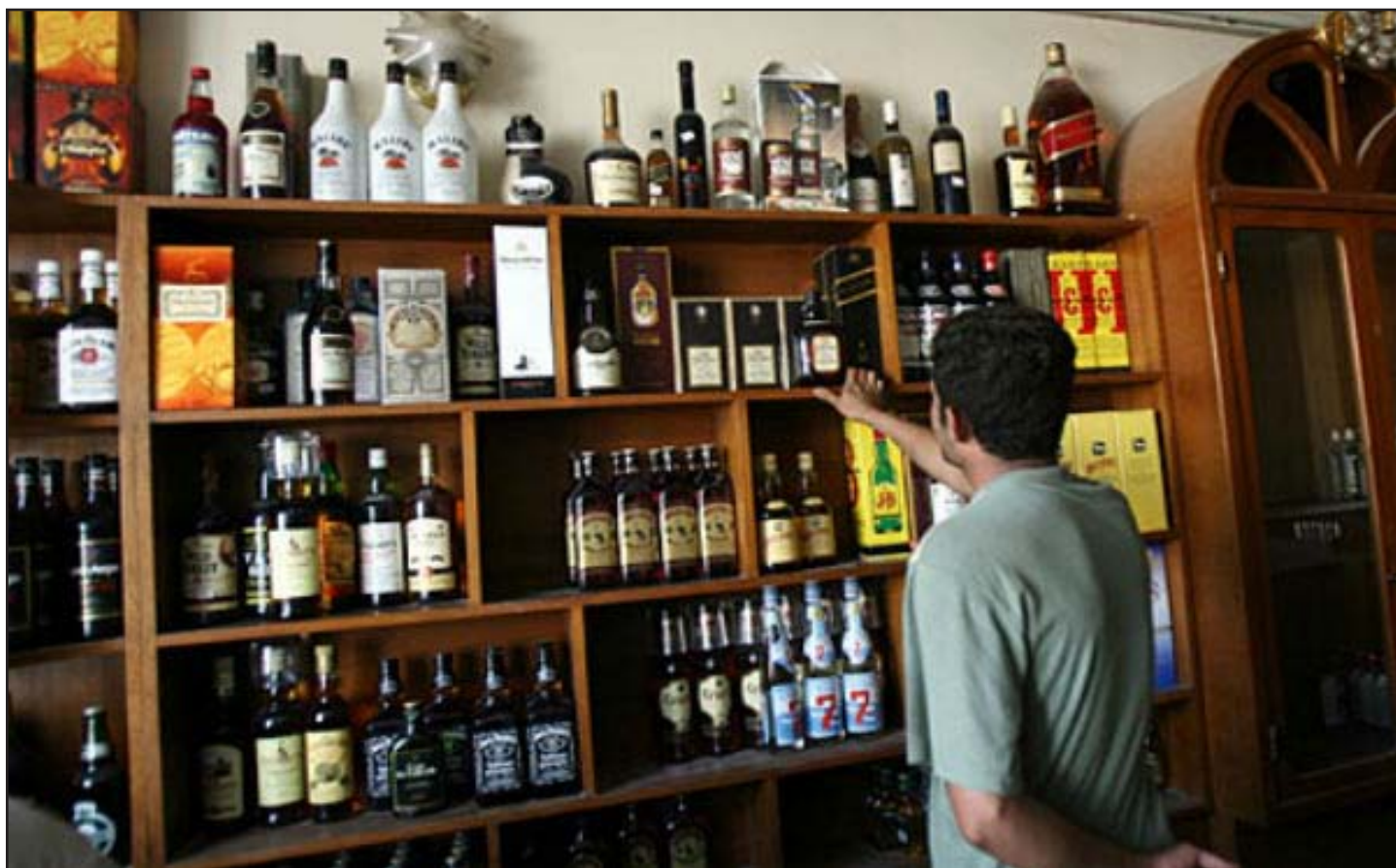
صاحب محل لبيع المشروبات الكحولية في بغداد

الحكومة لكننا نلتزم به حتى تلقى إشعار حكومي باستئنافه".