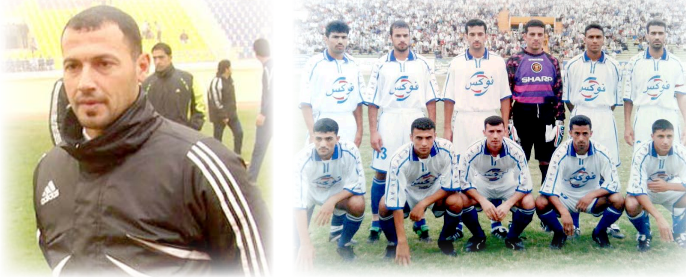
الجوية شهد نقطة التحول في مسيرته