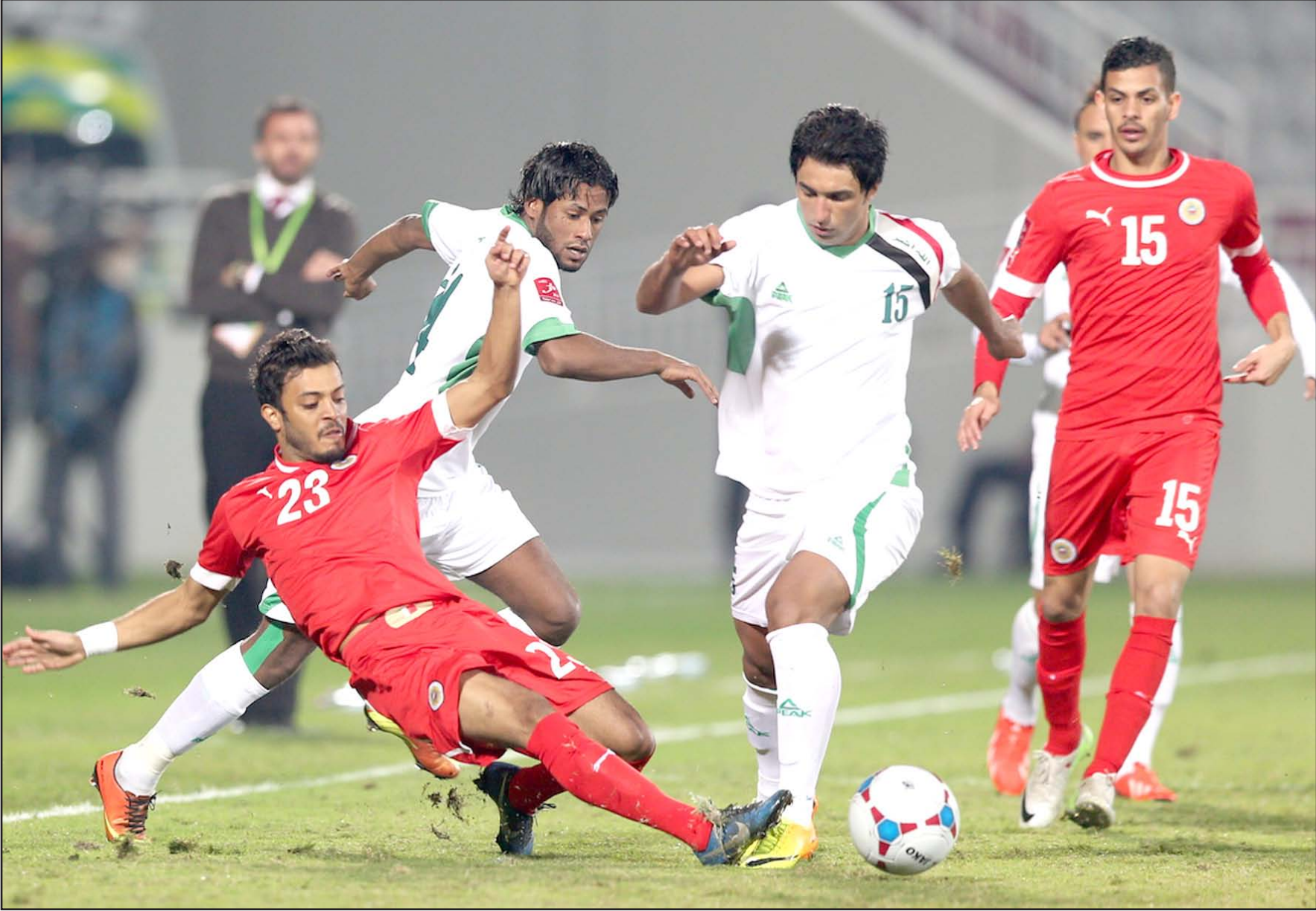
الاولمبي يسعى لاستعداد متكامل قبل المشاركة الآسيوية