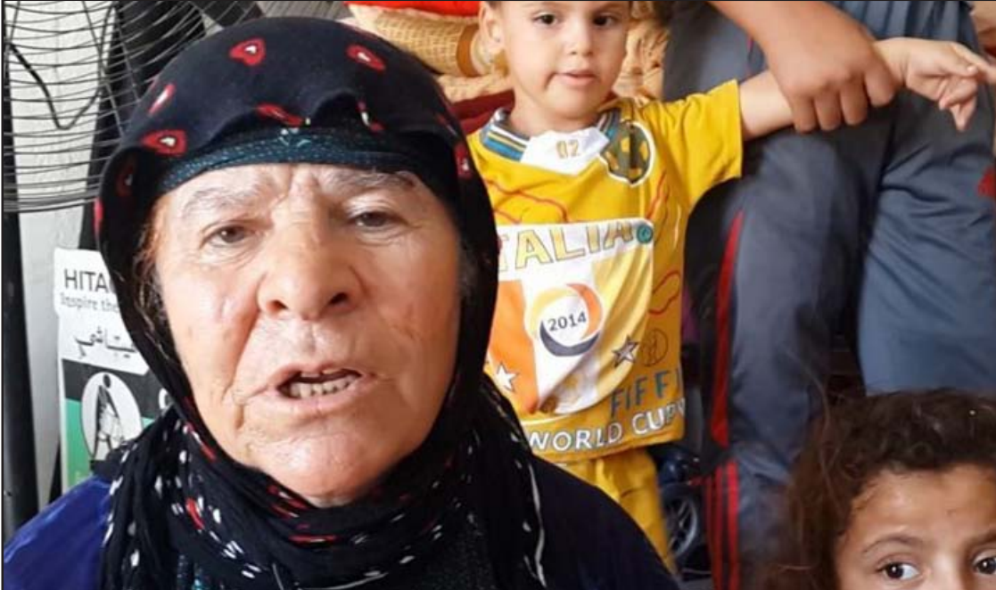
نازحو تلعفر تجسدي حي للعناية والاهمال

ويتابع المحافظ، أن "إدارة المحافظة سعت إلى تنسيق مشترك مع حكومة المركز، واقترحت نقل ملف وظائف النازحين وبطاقاتهم التموينية، إضافة إلى المطالبة بمبلغ المنحة الطارئة لتأمين ظروف مناسبة لإسكان المهجرين". ويشير المدني إلى أن "تنسيقاً عالي المستوى تم فتح قنواته مع المنظمات الدولية لتأمين السكن المناسب للنازحين، في مخيمات أو كرفانات أو إقامة مجمع سكني ببناء واطى الكلفة أو إسكانهم في