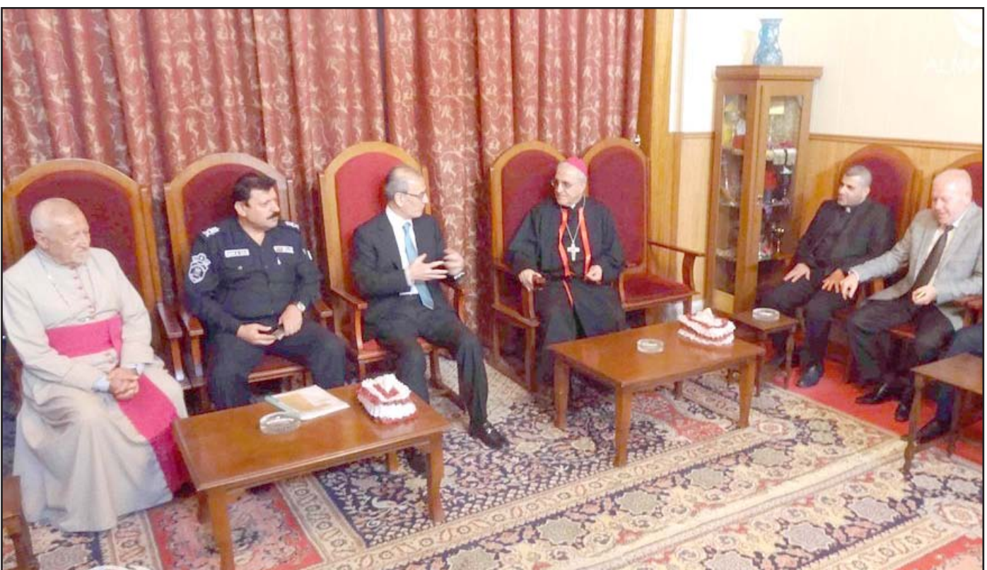
محافظ كركوك مع رجال دين مسيحيين