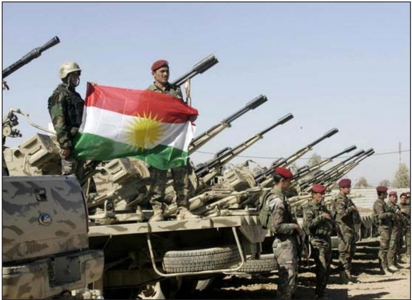
قوات البيشمركة