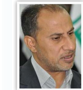
مهافظ ذي قار يحيى الناصري

"محافظة ذي قار بكل مدنها اليوم بحاجة إلى توسيع في تصميمها الأساسي كونها لم تشهد أي تحديث أو توسيع منذ مدة طويلة رغم الزيادة الكبيرة الحاصلة في أعداد السكان والانفراج المالي والاقتصادي وتحسن الأوضاع الاقتصادية، أن الحاجة باتت ملحة إلى أرض جديدة تدخل ضمن التصميم الأساسي للمدن ولهذا وفقاً للصلاحيات الممنوحة لنا بموجب القانون رقم ٨٠ صادفنا على تحديث التصميم الأساسي الجديد لقضاء الرفاعي ما ينعكس إيجاباً على خدمة المواطن وتوفير قطع أرض جديدة".