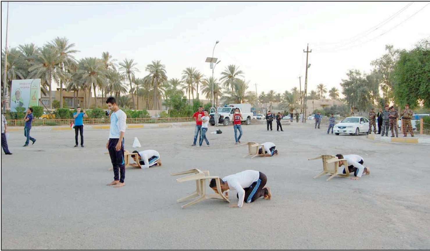
مجموعة شباب في ديالى يقدمون عرض مسرحي في إحدى الساحات العامة

ناشطون قدموا أنشطة مختلفة لكسر الروتين الأمني في المحافظة