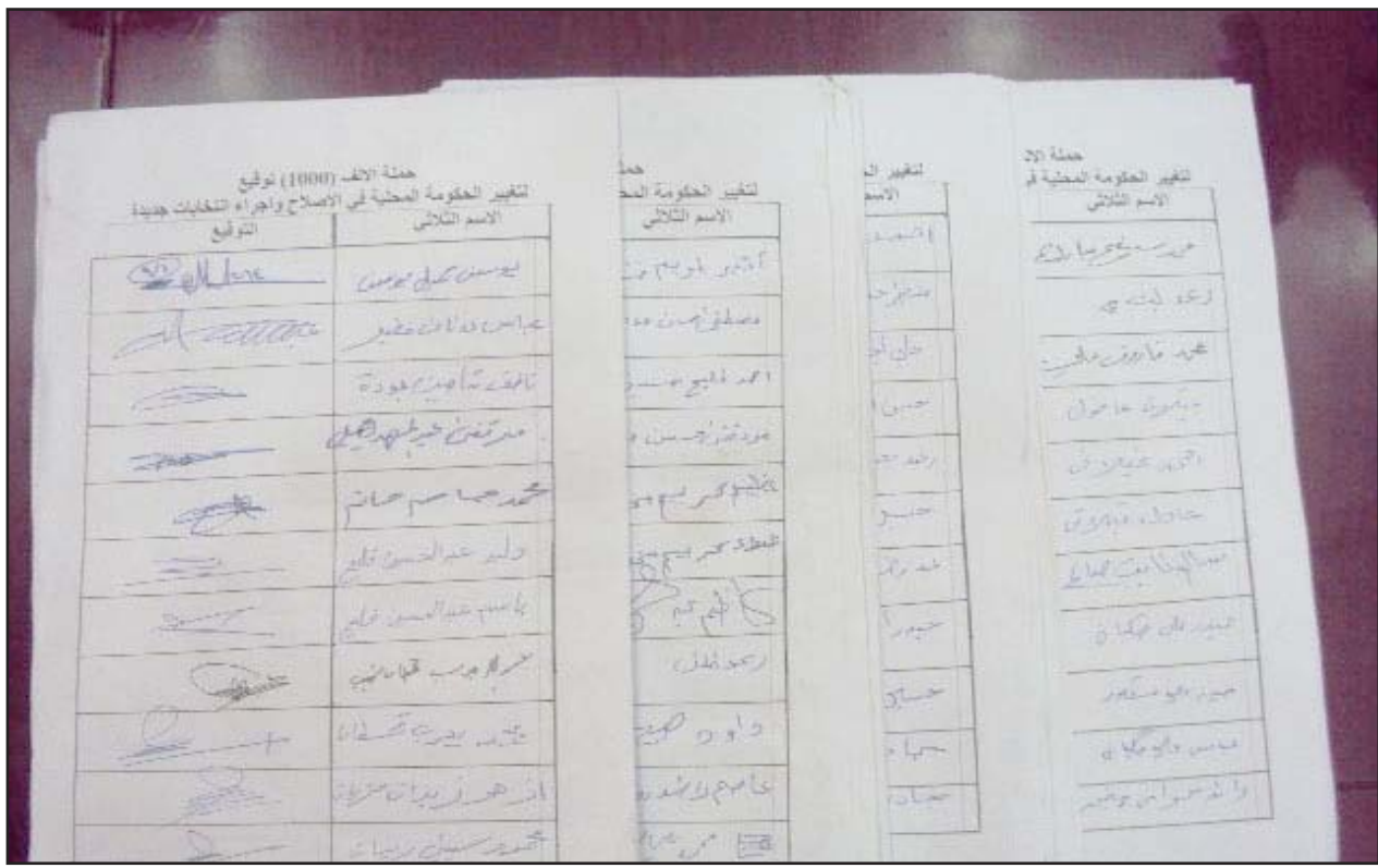
ألف مواطن بقضاء الإصلاح بذى قار يطالبون بإقالة المجلس البلدي

بدوره ذكر محافظ ذي قار، يحيى محمد باقر الناصري، في حديث إلى (المدى برس)، أن "وفداً من أهالي قضاء الإصلاح حضروا، اليوم (أمس)، إلى ديوان المحافظة لعرض مطالبهم المتعلقة بتوزيع تخصيصات القضاء على المناطق السكنية والية عمل إدارة المحلية"، مضيفاً أن "الوفد عرض كذلك الإشكاليات الحاصلة مع قائممقام الإصلاح والمجلس البلدي، لاعتقاده بوجود فساد في توزيع المبالغ المخصصة للقضاء". وأكد الناصري، أن "إدارة المحافظة قررت تشكيل لجنة