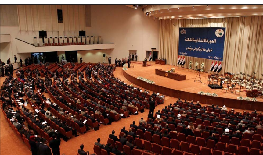
قاعة مجلس النواب خلال جلسته الأولى