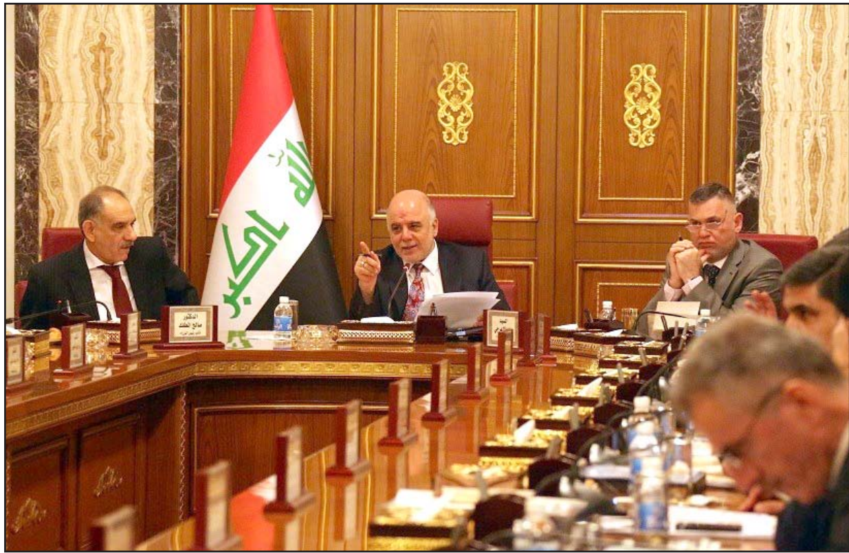
جلسة مجلس الوزراء أمس

بغداد/ محمد صباح وقرر رئيس مجلس النواب سليم الجبوري رفع جلسة البرلمان الى يوم الخميس المقبل، بعد أداء اليمين الدستوري لعدد من النواب والوزراء، وفشله في منح الثقة للمرشحين لحقبيتي الداخلية والدفاع. وفي حديث لـ "المدى" قال نائب بارز في الائتلاف الوطني، وهو الكتلة المنافسة لدولة القانون داخل الكتلة الشيعية "رياض غريب في تقدير نواب الاحرار والمواطن واخرين من شركائنا في الكتل الاخرى، ليس لديه خبرة ادارية كافية لمهمة عسيرة في الملف الأمني". وأضاف طالباً عدم نكر اسمه، ان "غريب ايضاً، محسوب على فريق نوري المالكي السابق، ويدافع عن سياساته التي نرفضها، ووجوده داخل الملف الأمني سيقدم رسالة خاطئة في ظرف عصيب، ونحن نريد تشجيع العبادي على اعداد فريق