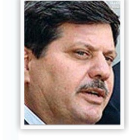
وكيل وزارة النفط معتصم اكرم

"المنظفات المحلية والدولية سجلت ارتفاعاً في نسب البطالة بين الشباب دون الـ٢٥ سنة ومن أصحاب المؤهلات العلمية التي تؤهلهم للمشاركة في بناء بلدهم وتوفير وضع اقتصادي جيد لعوائلهم، أن كثيراً من المعامل الأهلية والشركات في القطاع الخاص قد أفلتت أبوابها بسبب غياب الدعم الحكومي و منافسة البضائع الأجنبية لها مضافاً إليها عدم وجود سياسة حكومية واضحة تضع الضرائب على أنواع البضاعة الداخلة ومن مختلف المناشئ، أن كتلة المواطن تعمل على وضع آلية وخطط اقتصادية في مجلس محافظة بابل وضمن الصلاحيات التي أقرها القانون العراقي لإنعاش القطاع الخاص".