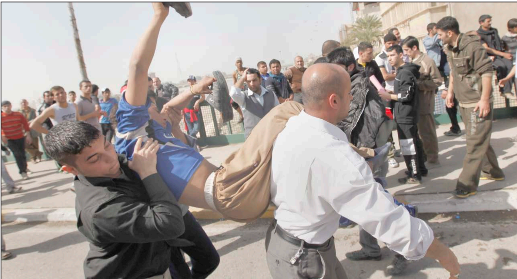
متظاهرون ضد حكومة المالكي يحملون مصاب برصاص الجيش في بغداد... ارشيف