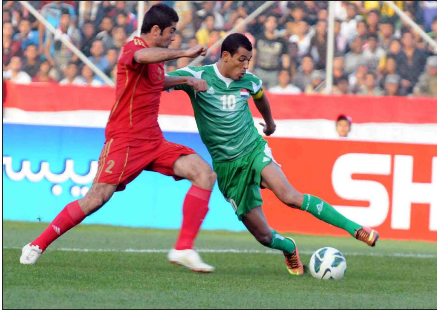
استعدادات متوترة للمنتخب بسبب تأخر حسم عقد المدرب

وأوضح إن منتخبنا سيغادر يوم ٦ تشرين الثاني المقبل الى مدينة دبي الإماراتية للدخول في معسكر تدريبي يقام هناك في إطار تحضيراته النهائية لخليجي ٢٢ يتخلله خوضه مباراتين دوليتين وديتين يومي ٧ و ١٠ من الشهر ذاته مع المنتخب السوري الشقيق بدلا من المنتخب الليبي الذي قدم اتحادنا اعتذاراً عن خوض المباراتين الوديعتين مع منتخبنا يومي ٤ و ٧ منه مشيراً إلى ان الاتحاد قرر صرف النظر عن إقامة معسكر تدريبي بالعاصمة البحرينية المنامة لانتفاء الحاجة إليه بعد التأشور مع الملاك التدريبي لمنتخبنا الذي يسعى الى خلال مباريات سوريا الى زيادة درجة