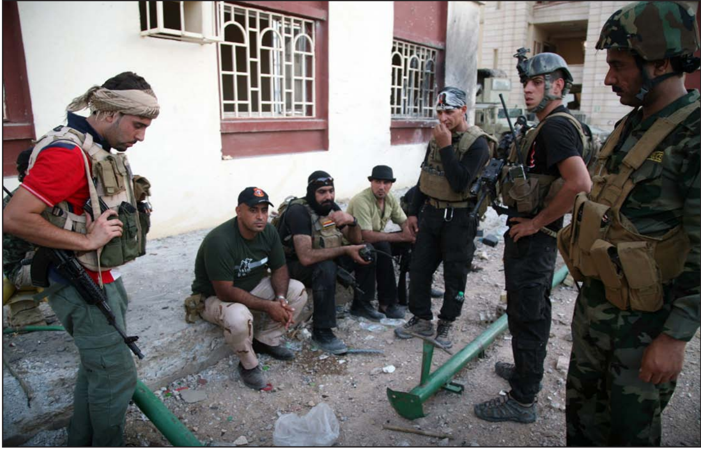
عناصر من الجيش ومقاتل العشائر في الأنبار .. أرشيف

رسم ضابط برتبة ملازم من قوات الشرطة العراقية في محافظة الأنبار، وهو يتحدث من قاعدة الأسد المحاصرة في الأنبار من قبل مقاتلي "داعش"، صورة قاتمة عن تعثر الحكومة العراقية في السيطرة على هذه المحافظة المضطربة، وتوقع ان تقترب هذه المجموعة ضمن مدى إطلاق النار في أي لحظة.