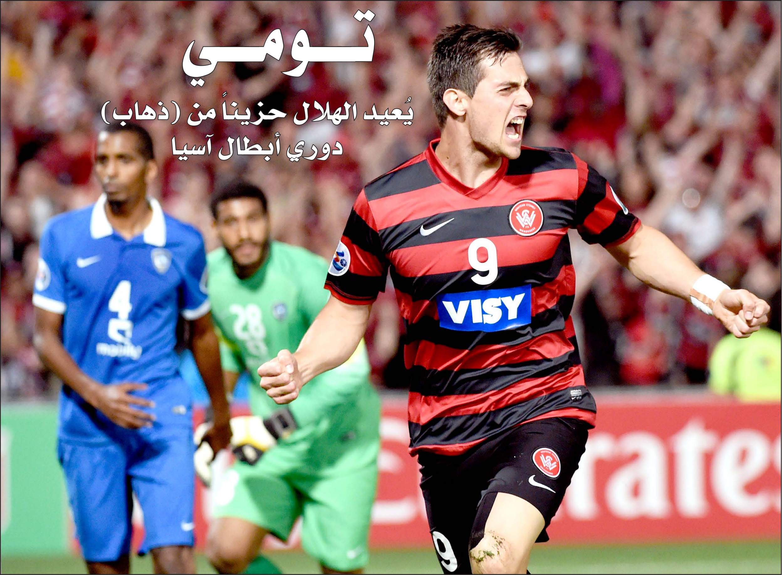
هدف تومي يقرب سيديني من لقب أبطال آسيا ... أف ب

يُعيد الهلال حزيناً من (ذهاب) دوري أبطال آسيا