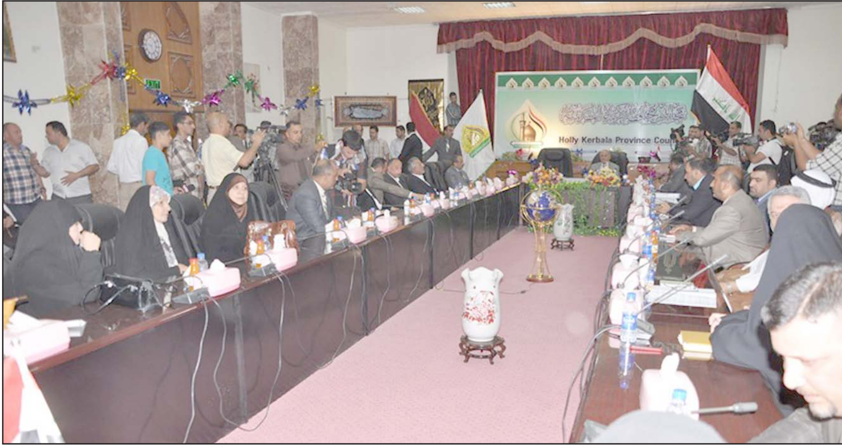
جلسة لمجلس محافظة كربلاء

وشهدت اجتماعات مجلس محافظة كربلاء الاسبوع الماضي احداثا "دراماتيكية"، فبينما رفض "الطريحي" طلب الاستجواب لاسباب "قانونية"، فشل المجلس في اكمال النصاب لجلسة كانت قد خصصت بشكل "غير علني" لإقالة المحافظ حيث تخلف عنها اغلب الاعضاء بعد اتفاق "سياسي" جرى على مستوى "بغداد" لتقوية "التحالف الوطني" داخل كربلاء، والتريث في قرار الإطاحة بالمحافظ نظرا للظروف الامنية الاستثنائية التي تعيشها البلاد وقرب حلول مناسبة "عاشوراء" التي