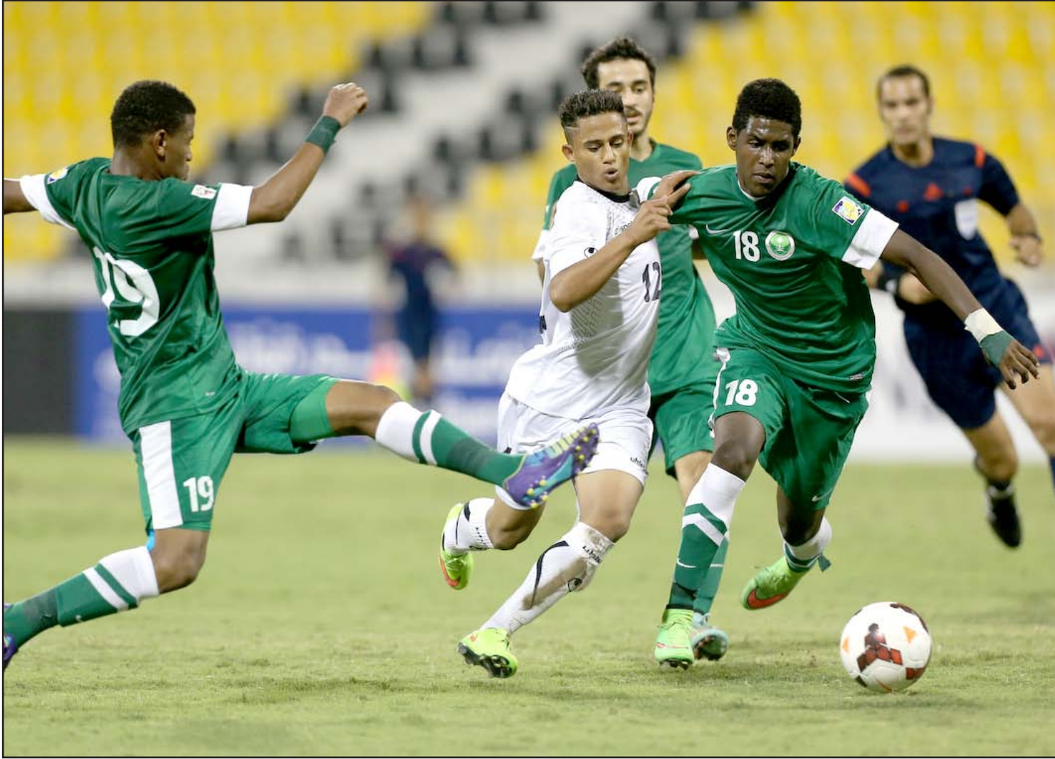
منتخب الناشئين واصل نديته أمام السعودية برغم النقص العددي

أثار قرار الحكم الجزائري غريبال مصطفى بإشهاره البطاقة الصفراء