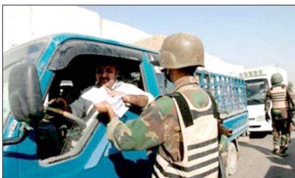
نقطة تفيتش في بغداد