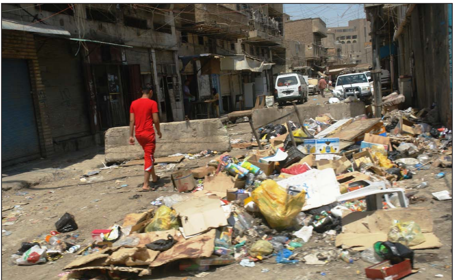
متى ستنتهر أزمة النفايات ...