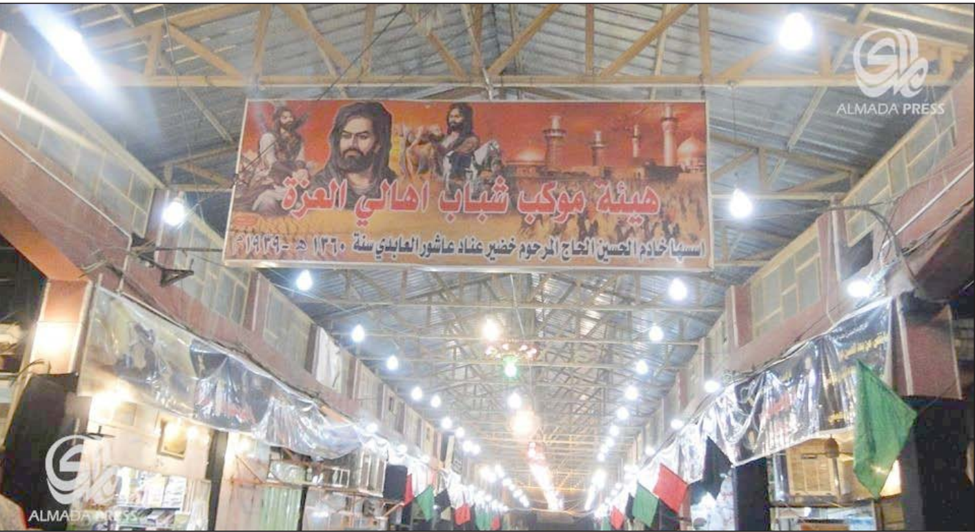
اسواق واسط تستقبل شهر محرم

يذكر أن تنظيم (داعش) فرض سيطرته على مدينة الموصل، مركز محافظة نينوى، (٤٠٥ كم شمال العاصمة بغداد)، في، (العاشر من حزيران ٢٠١٤)، كما امتد نشاطه بعدها إلى محافظات أخرى بينها صلاح الدين وكركوك وديالى وأربيل ودهوك ومناطق قريبة من العاصمة بغداد، ما أدى إلى موجة جديدة من الهجرة في البلاد.