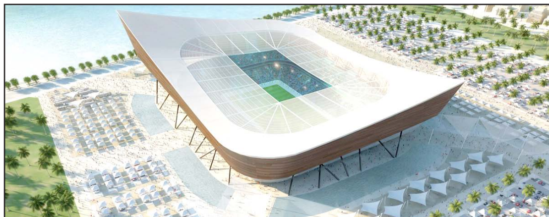
تناقض الموقف الأوروبي حيال مونديال قطر

بينها الدوريات: الإنكليزي والإسباني والألماني أن إقامة النهائيات في الشتاء سيضر بالبطولات الأوروبية.