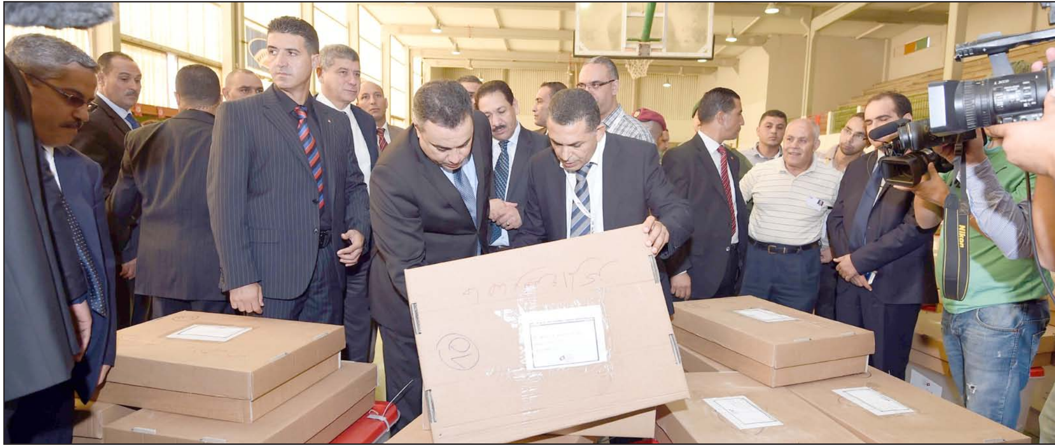
رئيس الوزراء التونسي يتابع التحضيرات للانتخابات التشريعية