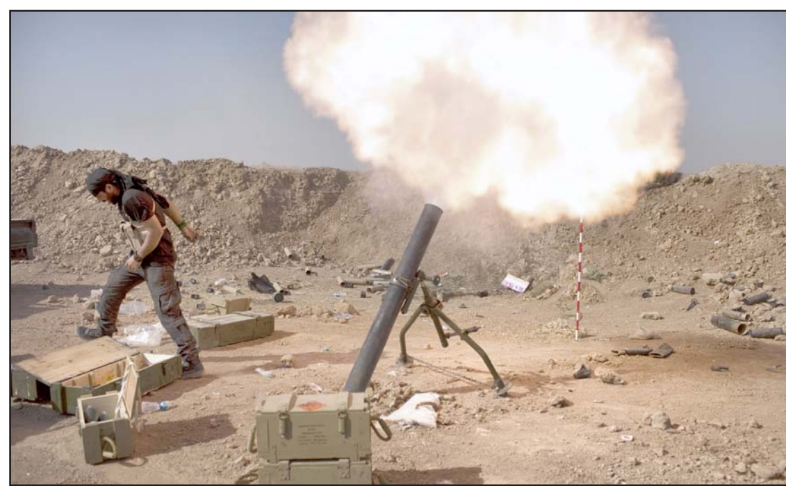
معاركة تحرير امرلي