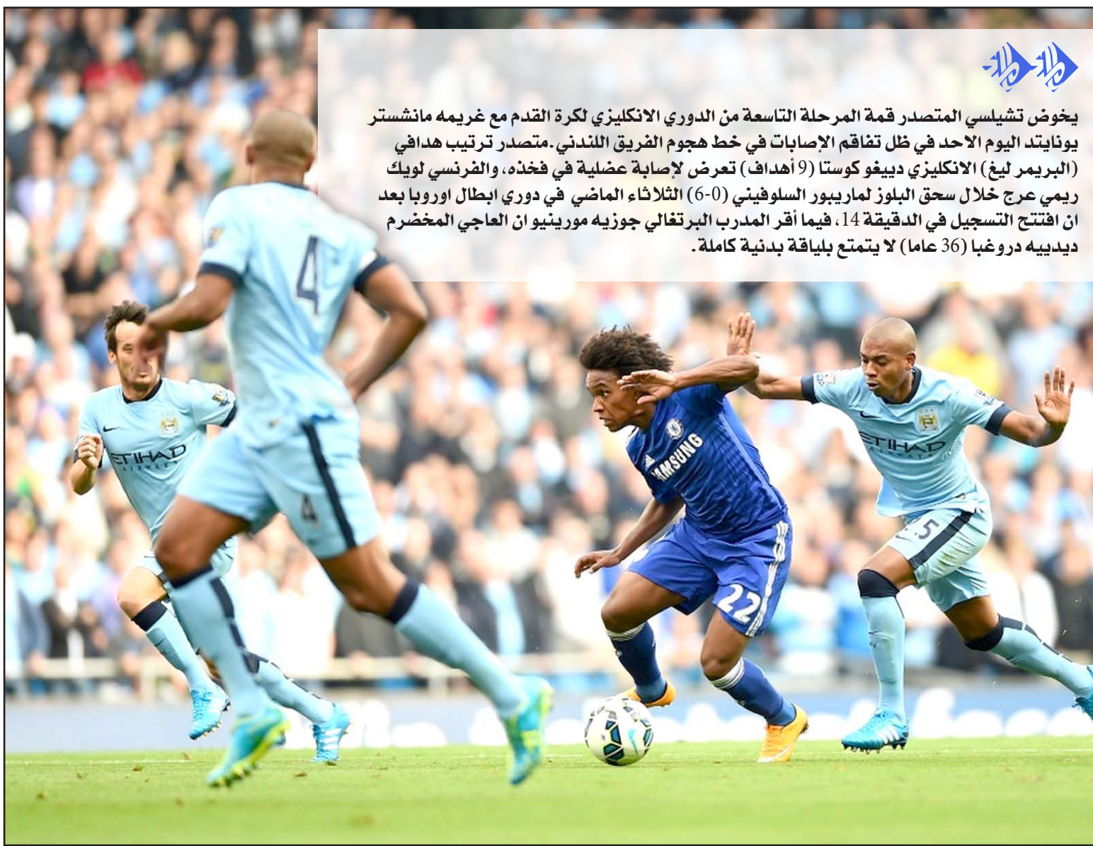
تشيلسي يأمل في مواصلة نتائجه الإيجابية في المنافسة

ومن جهة أخرى أشارت تقارير صحفية إلى أن نادي أنتليكو مدريد الإسباني لم يحصل إلا على ١٤ مليون جنيه إسترليني من صفقة انتقال مهاجمه ديبغو كوستا لنادي تشيلسي الإنكليزي خلال فترة الانتقالات الصيفية الماضية، وأشارت صحيفة التليغراف إلى أن النادي الإسباني لم يحصل إلا على ١٤ مليون من أصل ٣٢ مليون جنيه إسترليني، وذلك لم يكن بالاستثمار الجيد لبطل إسبانيا. وأضاف التقرير: أن الجميع يعرف بأن هناك طرفاً ثالثاً معنياً بالأمر، مما يعني أن أنتليكو مدريد لم يكن صاحب الحصة الأكبر من صفقة انتقال كوستا لنادي تشيلسي، مما دفع الجريدة إلى القول بأن الإدارة الروسية لـ(البلورز) تسير بشكل جيد، وأن الأموال هناك تنفق بشكل جيد أيضاً. يذكر أن ديبغو كوستا قد شارك مع نادي تشيلسي في ٧ مباريات وأحرز ٩ أهداف، خلال منافسات ١٤ ل لمو سم الحالي.