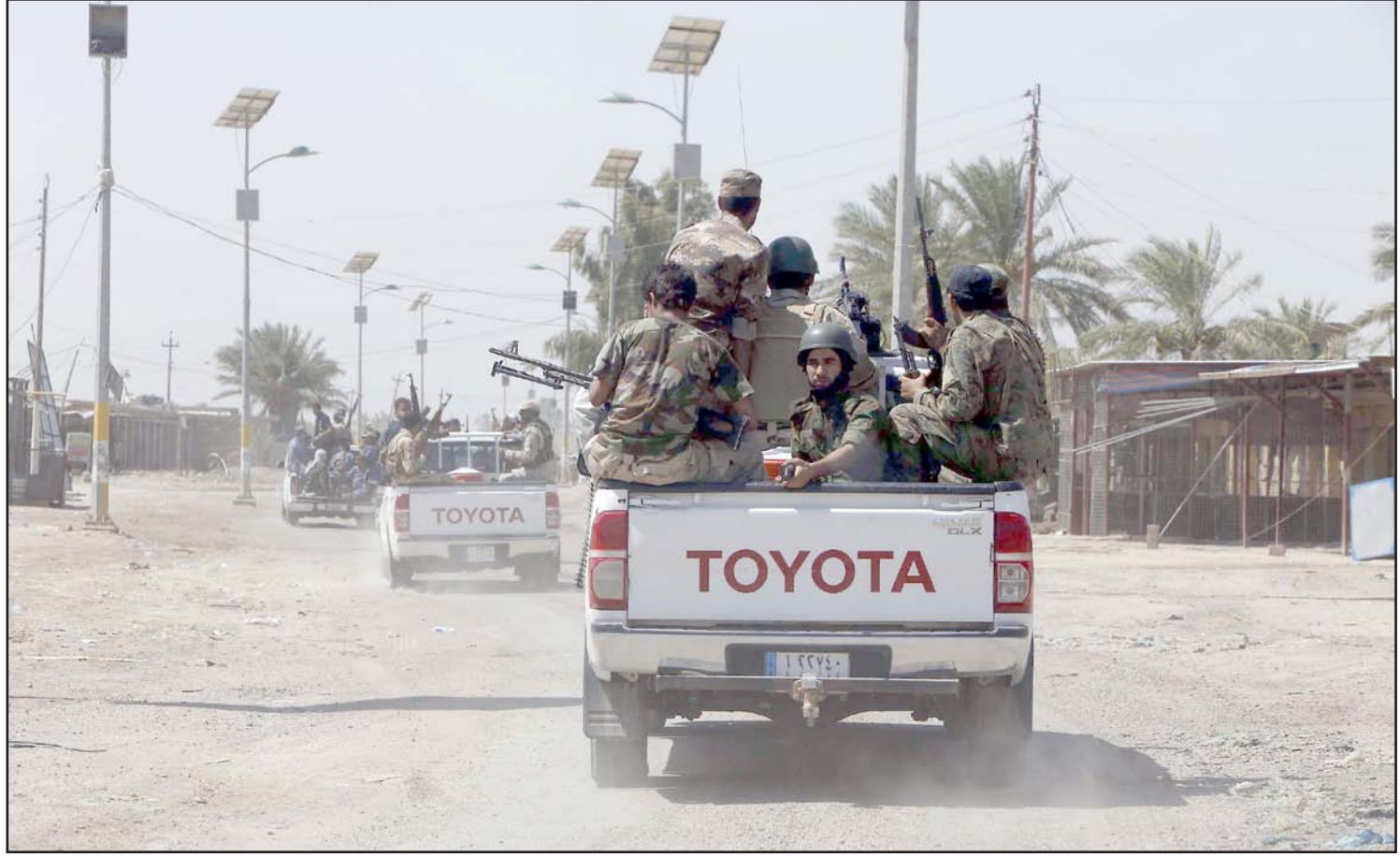
متطوعو الحشد الشعبي في جرف الصخر

قالت لجنة الأمن والدفاع في مجلس النواب، انها عقدت اجتماعاً مع وزير الدفاع خالد العبيدي، ناقش التقدم الاخير لقطعات الجيش والحشد الشعبي جنوب بغداد، والاستاد الفوري للعشائر في الانبار وصلاح الدين، بوصفه "شحنة معنوية" ستمهد لتطويق عناصر داعش في قواطع العمليات الاخرى، مؤكدة ان تخطي الانتكاسات السابقة سيرافقه اصلاح اداري وتشريعي للمؤسستين العسكرية والامنية، حيث كشفت انها ستخاطب مجلس الوزراء لتطالب بضرورة الإسراع في إرسال أسماء قيادات الفرق ورئيس جهاز المخابرات والاجهزة الحساسة، من أجل التصويت عليهم داخل مجلس النواب، طبقاً لما يفرضه الدستور، وهو امر ماضل بشأنه رئيس الحكومة السابق طوال أعوام.