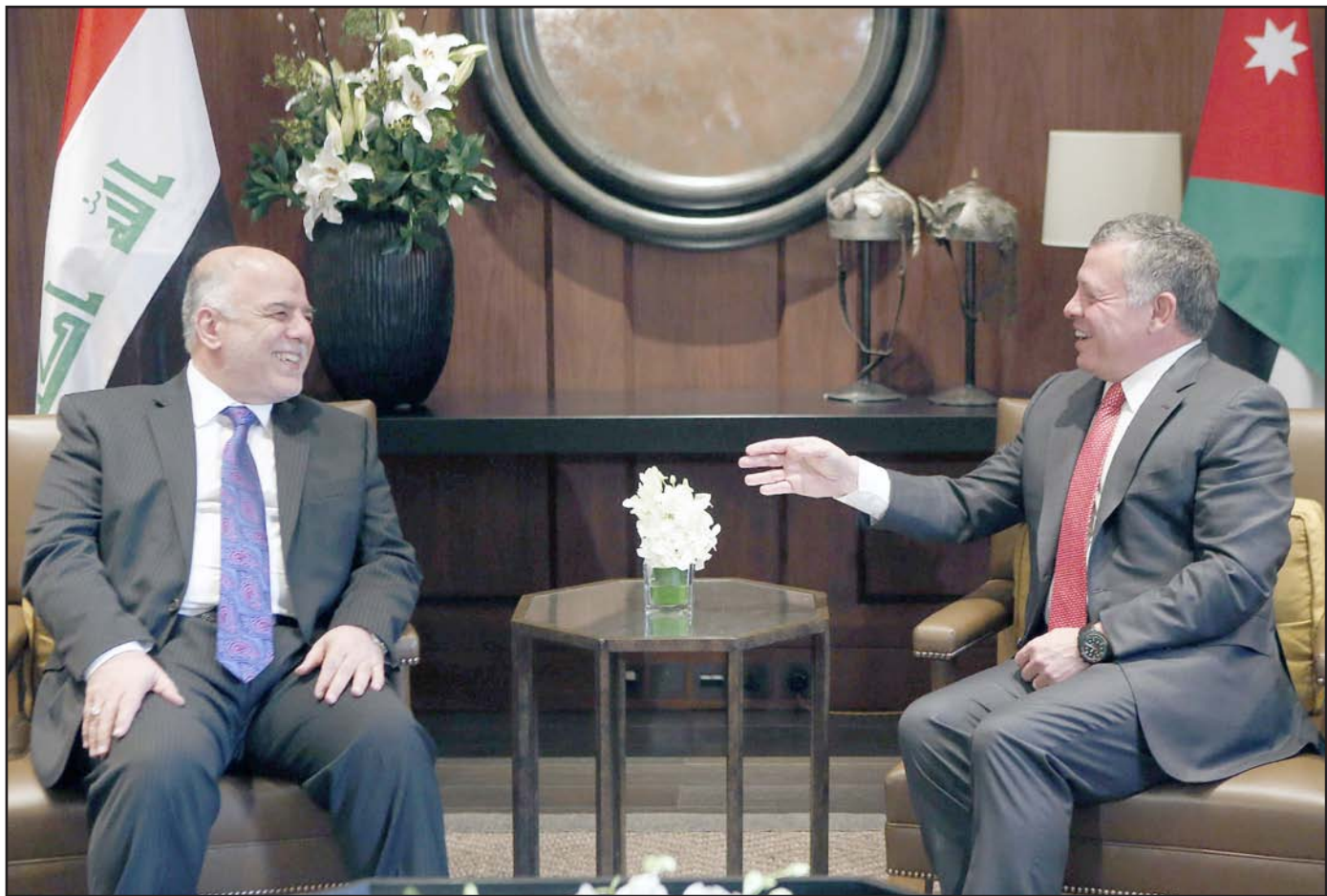
العبادي خلال اجتماعه مع ملك الأردن