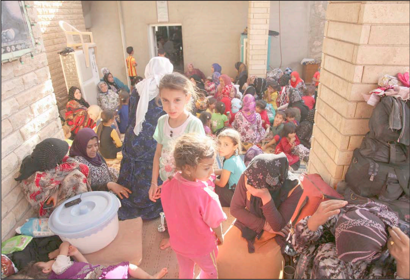
نازحون تركمان في إحدى الحسينيات جنوب شرقي بغداد... أرشيف

□ عددهم تجاوز الـ ١٢٠ ألف موزعين في الوسط والجنوب