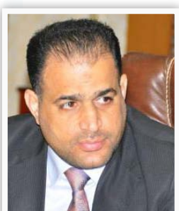
محافظ بغداد / علي التميمي

"سيتم افتتاح مراكز صحية في جانبي الكرخ والرصافة إلى جانب الانتهاء من جميع الإجراءات والتصاميم والمتعلقات الإدارية للمستشفيات الثلاثة المؤمل المباشرة بها حال انطلاق الموازنة، ان المحافظة وضعت خطة شاملة لدعم القطاع الصحي في العاصمة حيث تم افتتاح خلال الفترة القليلة الماضية عدد من المشاريع الصحية في مختلف مناطق وأحياء بغداد إلى جانب دعم القطاع الصحي".