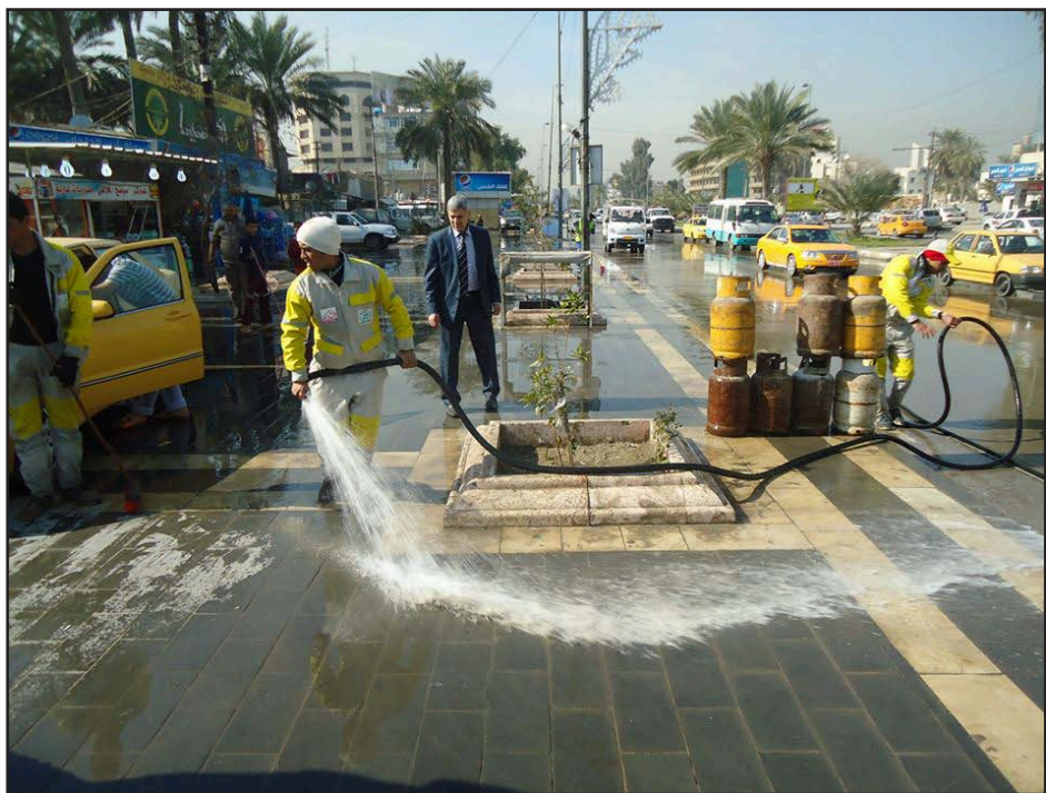
عمال ينظفون أرصفة الجادرية ببغداد... أرشيف

□ يهدفون إلى نشر الوعي البيئي في إحياء المناسبات الدينية