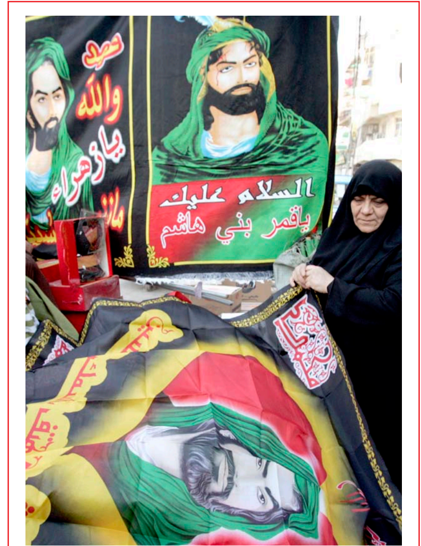
بغدادية في محل لبيع الرايات الحسينية.. تصوير/ محمود رؤوف

واشنطن تواجه حرباً رابعة في العراق 3 متطروصون يوزعون أكياس النفايات على مواكب عاشوراء 6