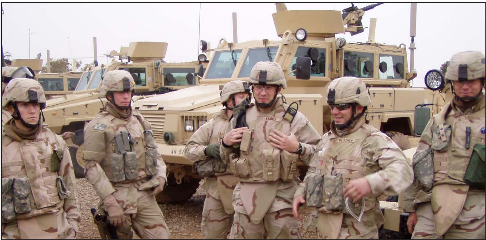
قوات أميركية في العراق

أوباما منصب الرئاسة، رفض نصيحة وزير الدفاع ليون بانيتا ووزير الخارجية هيلاري كلينتون وبترايوس في إبقاء جزء من القوات في العراق، وبدلاً من ذلك اختار الإيفاء بالوعد الذي أعطاه خلال حملته الانتخابية بإنهاء الحرب في العراق خلال ولايته الأولى، وتخلي عن البلد الذي قاتل فيه الأميركيون لأكثر من ٢٠ عاماً بهدف بناء دولة مستقرة.