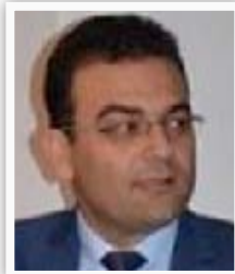
وزير الهجرة جاسم محمد

استطاعت أمانة بغداد خلال السنوات الماضية تنفيذ خطوط عملاقة لنقل وتصريف مياه المجاري والأمطار، في جاني الكرخ والرصافة بطول (١٠٢) كم متجاوزة الأطوال السابقة للخطوط التي أنشأت للمدة الممتدة من ستينيات القرن الماضي بإغاية عام ٢٠٠٣ وبالمالعة (٤٧) كم، وأن أقطار بعض الخطوط يصل إلى (٤) أمتار.