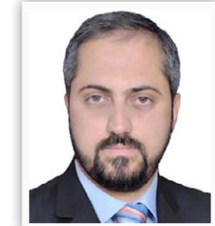
وزير العدل حيدر الزامل

الحكومة العراقية طالبت باجتماع بروكسل التحالف الدولي، بفتح صندوق لإعادة وأعمار المدن بعد تحريرها من زمر الإرهاب، كون هذه المناطق تعرضت إلى تدمير شمل كل البنى التحتية مما يستوجب بذل جهوداً كبيرة لإعادة أعمارها والعمل على عودة النازحين إلى مناطقهم بعد تأهيلها.