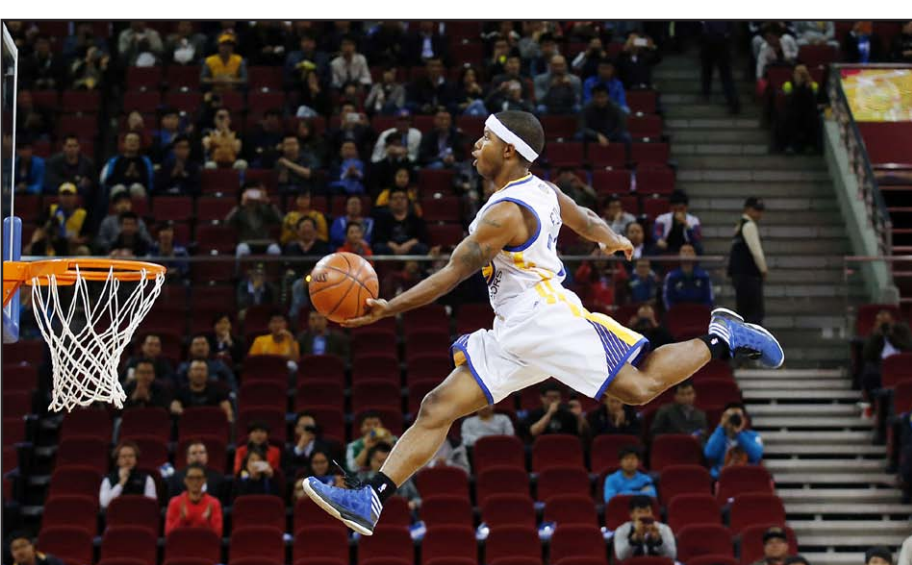
جرين يحرز ٣١ نقطة لفريقه

مرة متتالية في موسم ١٩٧٢. وفي مباراة ثانية قاد بليك جريفيين فريقه لوس أنجليس كليبرز الى الفوز على ضيفه نيو اورليانز بليكناز ١٢٠-١٠٠ عندما أحرز له ٣٠ نقطة. وحقق كليبرز الفوز السابع على التوالي بعد ان سيطر على النصف الثاني من المباراة إثر تعادل الفريقين بعد نهاية النصف الأول. وكان أنطوني ديفيز افضل هدافي نيو اورليانز برصيد ٢٦ نقطة. وهذه هي الهزيمة الخامسة لنيو اورليانز في آخر ٦ مباريات. وبرغم غياب لاعبيه البارزين توني باركر ومانو جينوبلي