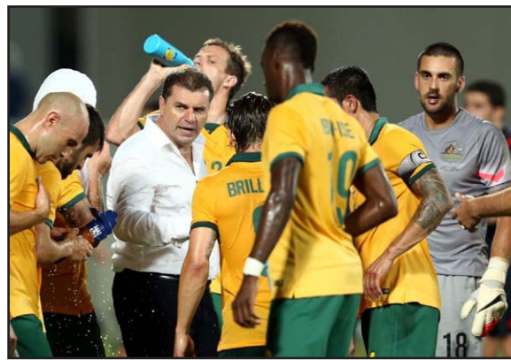
استراليا تحدث صفوها