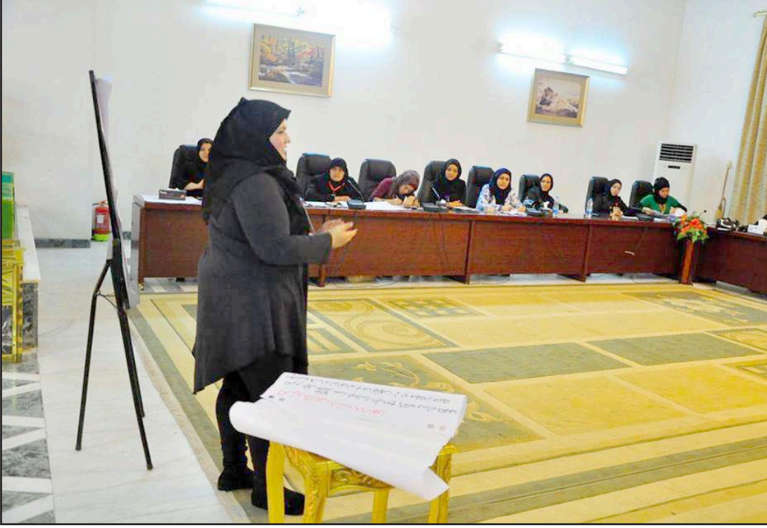
بابليات يطالبن بتمثيلهن في السلطة التنفيذية

□ دعوا إلى منحهنّ كوتا في "السلطة التنفيذية"