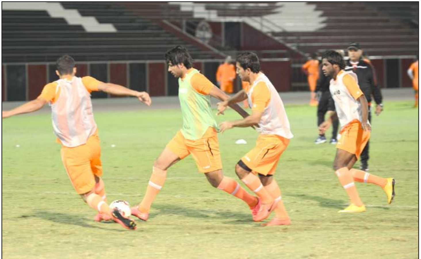
منتخبنا في إحدى الوحدات التدريبية