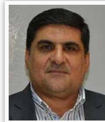
وزير البلديات عبد الكريم الأنصاري

أعلنت وزارة العدل تنفيذ الأمر الديواني الذي يخص تشكيل المركز الإلكتروني الخاص بالمعتقلين تحت تسمية (منظمة الإبلاغ عن المعتقلين)، وسيتم عرضها على مجلس وزراء واستخضع لإدارة وزارة العدل، ويكون تخصيصه المالي من رئاسة الوزراء، وستولى هذه المنظمة عملية تنظيم عمليات القا، القبض وإطلاق السراح، إضافة إلى دوره كمصدر معلومات عن أماكن احتجاز المعتقلين.