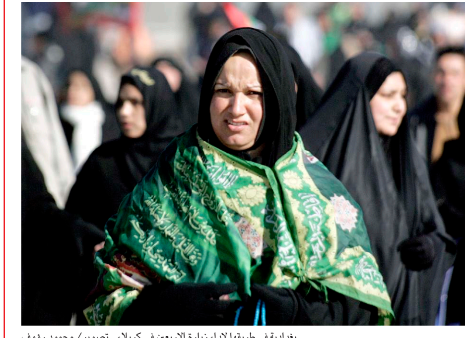
بغدادية في طريقها لاداء زيارة الاربعين في كربلاء...

أفادت مصادر محلية في كركوك، بأن "داعش" طالب أهالي المناطق التي يسيطر عليها جنوبي المحافظة وغربها، بالتبرع بما يمتلكون من أموال وذهب