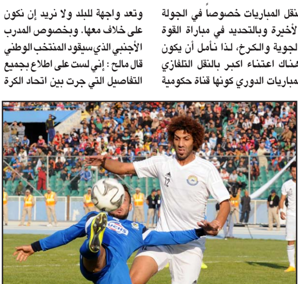
اتحاد الكرة يبدى استياءه من نقل الدوري