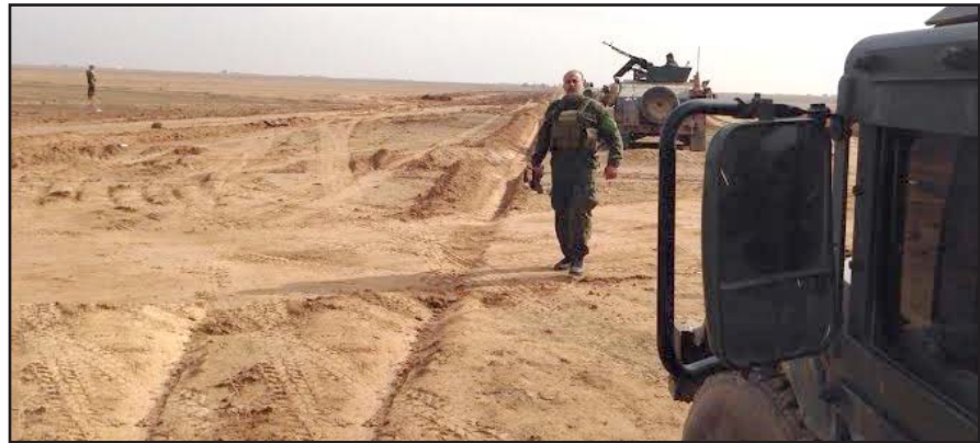
جانب من طريق العسكريين

وقال المصدر في حديث إلى (المدى برس)، إن "قوات الحشد الشعبي باشرت منذ أيام قليلة وبإشراف المسؤول على عمليات ديالى والأسمن العام منطلة بدر هادي العامري بإنشاء طريق (العسكريين)، مبيناً أن "الطريق الذي سيكون من مرين، سيربط قضاء الخالص شمالي بعقوبة