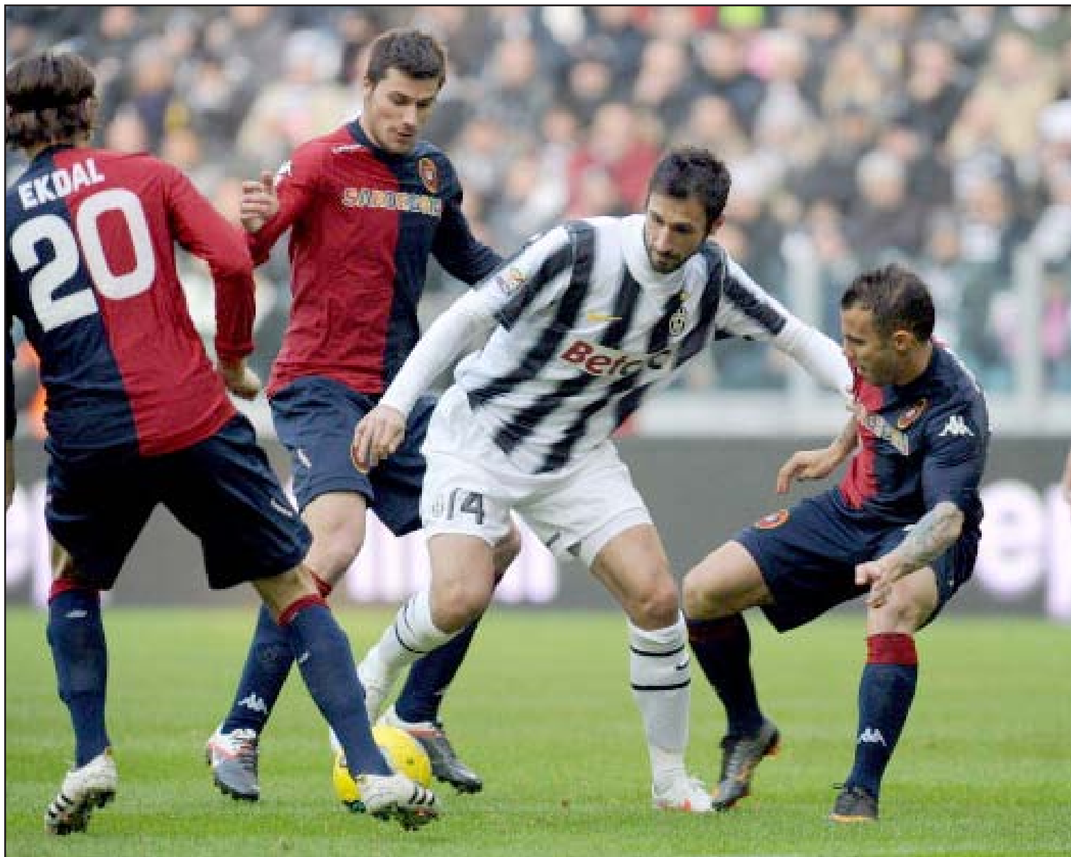
اليوفي يواصل تقدمه في الكالتشيو

وسيرفع الانتصار من معنويات لاعبي يوفنتوس قبل مباراة (كأس السوبر) بعد غد الإثنين