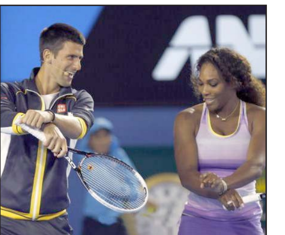
سيرينا و ديوكوفيتش الافضل في عالم التنس

□ باريس / ا ف ب وقع اختار الاتحاد الدولي للتنس على الصربي نوفاك ديوكوفيتش كأفضل لاعب في ٢٠١٤ بينما اختيرت الأمريكية سيرينا وليامز كأفضل لاعبة. ويتحدد الاختيار وفقا لمستوى اللاعبين خلال بطولات جولة المحترفين والبطولات الأربع الكبرى. ونال ديوكوفيتش بطل ويمبلدون للجائزة للمرة الرابعة بعدما أحرز سبعة ألقاب خلال العام الحالي وأنهى الموسم في صدارة التصنيف العالمي للمرة الثالثة في أربع سنوات. وتوجت سيرينا بالجائزة للمرة الخامسة في مشوارها الذي شهد نجاحها في إحراز ١٨ لقباً في البطولات الأربع الكبرى خرها لقب بطولة أمريكا المفتوحة في العام الحالي. وقالت سيرينا "أنا فخورة باختيار أفضل لاعبة تنس للمرة الخامسة، كان هذا عام التحديات والانتصارات بالنسبة لي في ظل رغبتني في الفوز بلقب جديد في البطولات الأربع الكبرى واستعادة صدارة التصنيف العالمي ولقد حققت ذلك بالفعل". واختير التوأمان بوب ومايك برايان كأفضل زوجي للرجال خلال العام الجاري بينما وقع الاختيار على الإيطاليين سارة إيراني وروبرتتا فينشي كأفضل زوجي في منافسات السيدات.