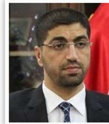
محافظ الديوانية عمار المدني

"أن المواد الملوثة بالإشعاع تشكل عبأً على المواطنين والحكومة المحلية وقد تم تشكيل عدة لجان مشتركة من وزارتي البيئة والعلوم والتكنولوجيا والدوائر المعنية في المحافظة لغرض معالجتها والحد من أضرارها، ولغرض نقل المواد المشعة لقد استحصلنا موافقة وزارة العلوم على نقل المواد المشعة إلى المحجر البيئي في منطقة صليبيات جنوب غربي الناصرية".