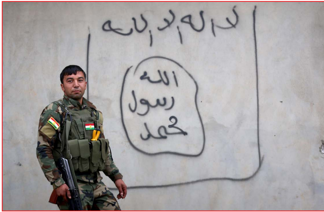
عنصر من البيشمركة في اطراف سنجار امس..