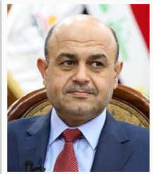
محافظ البصرة ماجد التصراوي

"بناء هذه المدينة الصناعية المتكاملة سيضفي طابعاً مميزاً على المحافظة ويميزها عن باقي محافظات العراق بوصفها الأولى من نوعها على مستوى البلد، أن مساحة المدينة الصناعية تقدر بـ ٢٥٠٠ دونم، باتجاه الشمال الشرقي لمركز مدينة الديوانية بموازاة طريق الرور السريع الدولي الذي يربط جنوب العراق بشماله وغربه".