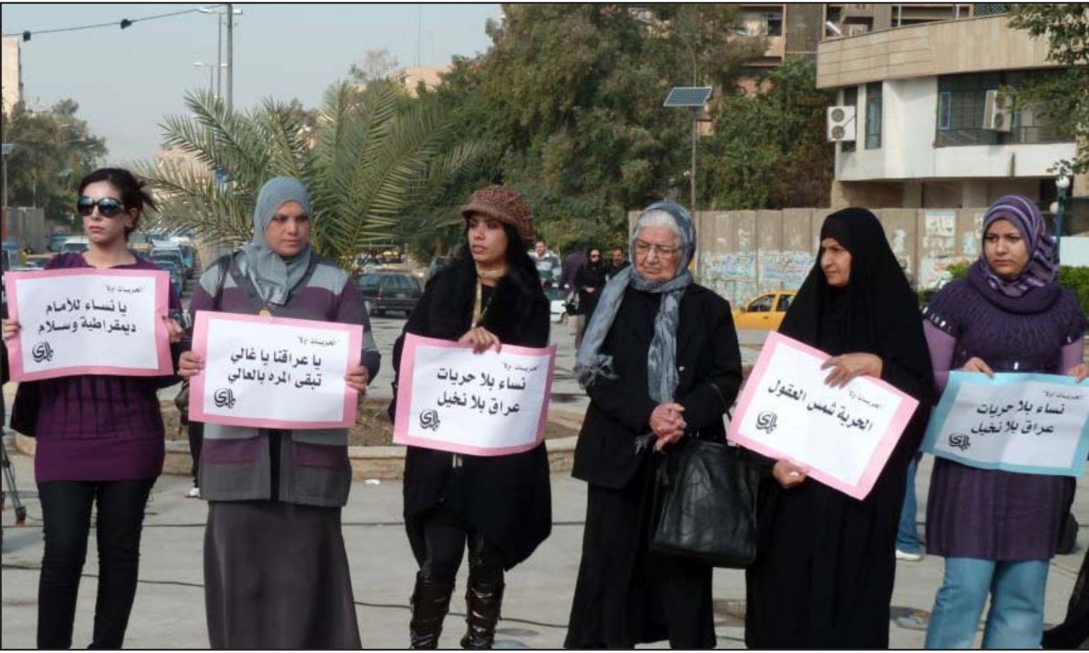
ناشطات يتظاهرن في بغداد ضد قانون الجغرية

وعندما تُركب مثل تلك الجرائم خلال النزاعات المسلحة في جميع أنحاء العالم فإن معالجتها لن تكون سهلة"، نافية عدم علم الوزارة بعدد المختطفات الدقيق "فكل طرف لديه عدد مختلف، إذ لم يتم إجراء إحصاء دقيق وعلني". وبيّنت "تم الحديث مع المنظمات الدولية لمساعدة المحررات من قبل داعش من الناحية النفسية والصحية والسكنية وهناك مشروع قرار لتعويضهم بمبلغ ١٠ مليون دينار من قبل مجلس الوزراء"، مشيرة إلى عدم وجود معلومات دقيقة حتى اليوم بشأن عدد النساء المقتولات، ولكن هناك مشروع نادر بين وزارة الداخلية وبرنامح الأمم المتحدة الإنمائي (يو أن دي بي) لوضع قاعدة بيانات متينة لعام ٢٠١٥ يمكن من طريقها معرفة عدد القتلى جراء أعمال العنف بسهولة".