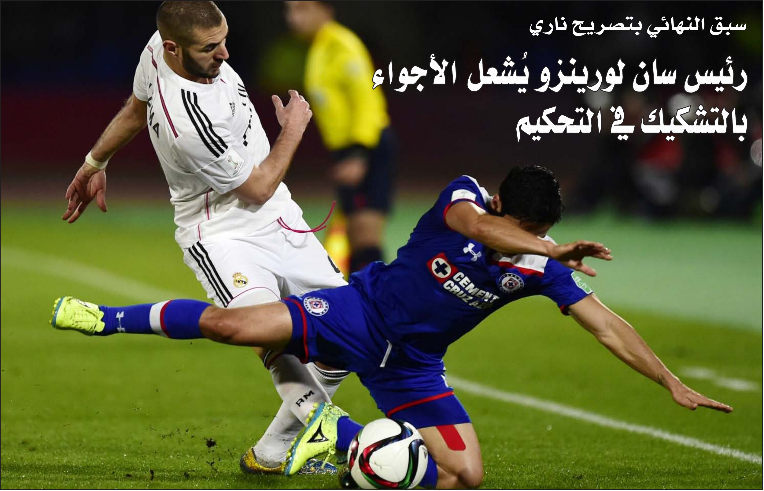
حملة انتقادات عنيفة تواجه حكم المباراة النهائية بين ريال مدريد وسان لورينزو

لورينزو الأرجنتيني. ولم يتوقع اللاعبون هذا الكم الهائل من المشجعين الذين تكدسوا أمام المسرح الذي أقيم على شكل ملعب صغير أمام المتجر حيث تجمعت الجماهير على طول شارع محمد الخامس من أجل التقاط الصور للاعب النادي الملكي. وأكد اللاعب الفرنسي كريم بنزيمة خلال الحدث الإعلامي القصير الذي تم في ظل تواجد أممي مكثف لتجنب أية أعمال الشغب سيكون النهائي صعباً، هذه اللقاءات عادة ما تكون معقدة.