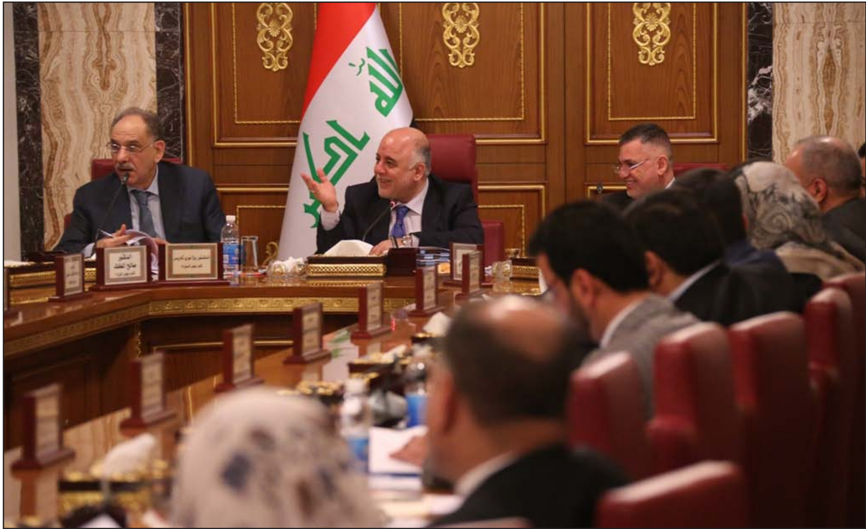
اجتماع مجلس الوزراء