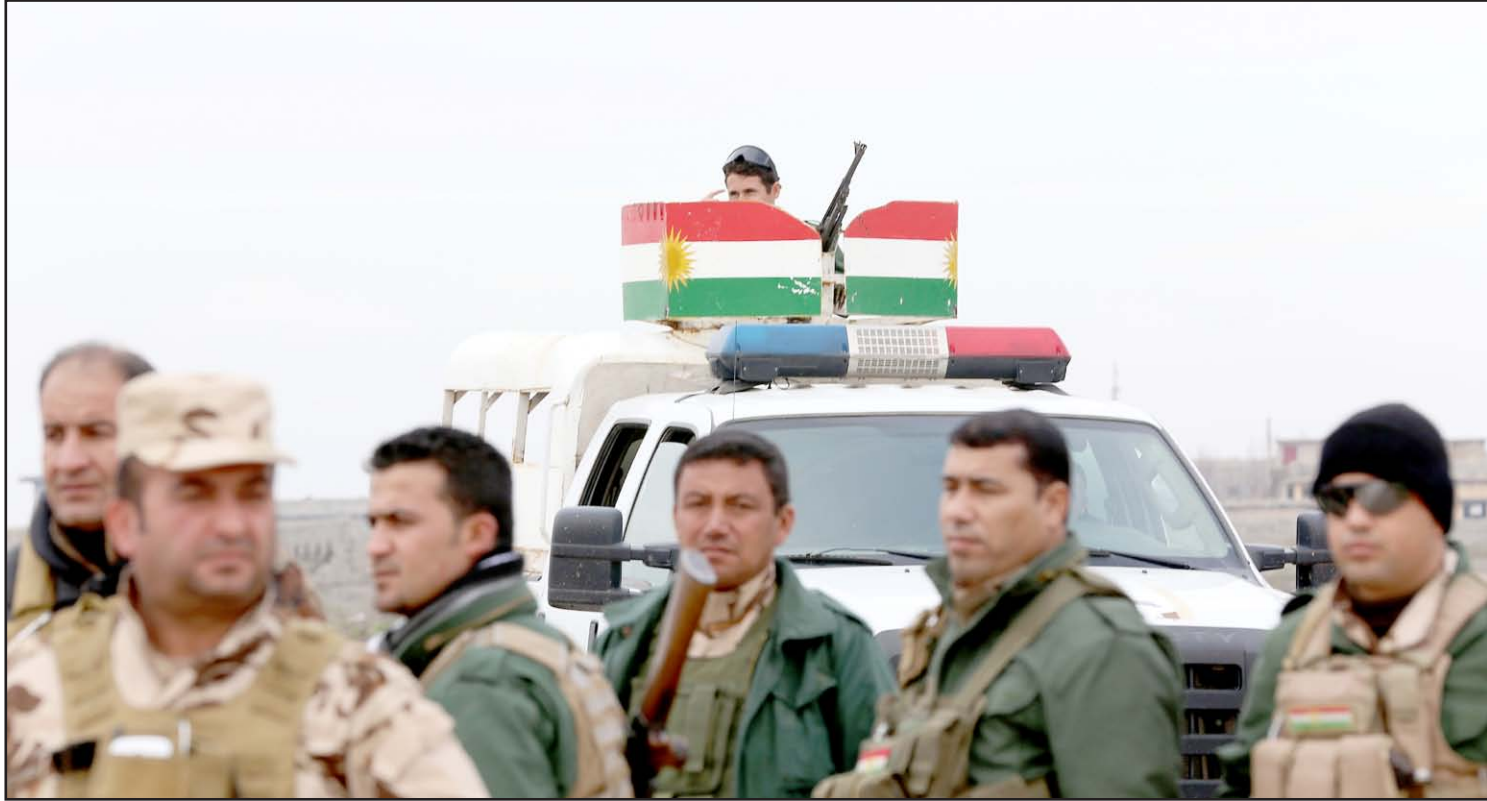
مقاتلو البيشمركة في سنجار

وأشار المسؤول الكردي الى ان "البيشمركة قطعت إمدادات المسلحين من ناحية ربيعة الى الموصل، كما قطعت الممر الرابط بين سنجار والموصل"، لافتاً الى ان القوات الكردية سيطرت على منطقة "سنوني"، خلف جبل سنجار، واستطاعت إجلاء مئات العوائل الإيزيدية المحاصرة منذ أربعة اشهر، ونقلهم الى مخيمات