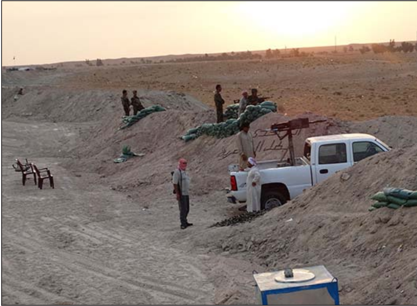
مقاتل العشرات السنة

وأضاف العيسوي "كما أوصى المؤتمر بقيام كل محافظة بعقد مؤتمرها الخاص بها بهدف الإنفتاح على جميع المكونات فيها وبحث خصوصية كل محافظة للوصول الى الأهداف المتفق عليها".