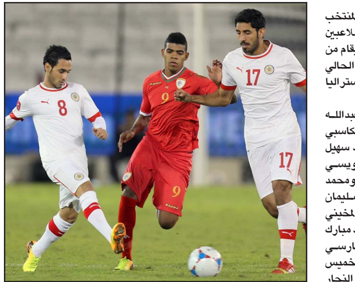
عُمان يسكر في سيدني استعدادا لآسيا