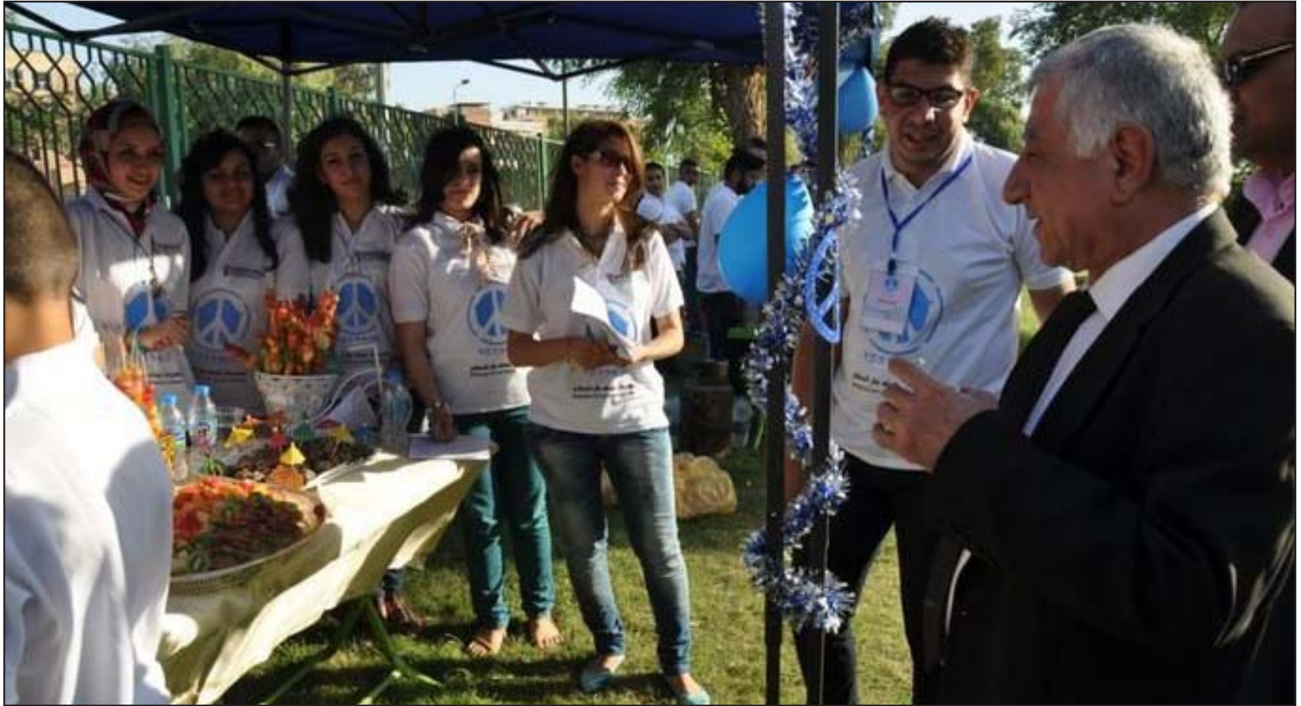
ناشطون في يوم السلام ببغداد... ارشيف

تمت قراءتها في الدورات السابقة لكنها ركزت في أدرج المجلس بسبب عدم حصول التوافق السياسية عليها". ونكر نصيف، أن من تلك "القوانين ما يقع ضمن مطالبات أولئك الشباب، ومنها ذلك الذي يجرم التمييز"، مطالبة الكتل السياسية والنواب بضرورة "تشريعه عليها في العراق".