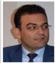
وزير الهجرة جاسم محمد

"نحن ماضون في توزيع قطع الأراضي، تم على اتخاذ قرار بإيصال الخدمات لكل الأراضي التي وزعت لتشجيع المواطنين على البناء، إن الحكومة المحلية في البصرة وبعد التنسيق فيما بينها ستخذ مباداً الاستثمار وفق قانون (٢١) المعدل وسيكون الاستثمار من خلال النفط والزراعة والموانئ".