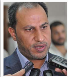
محافظ ذي قار يحيى الناصري

"أن الوزارة بالتنسيق مع مستشارين من وزارة الإعمار والإسكان نفذت فحص ٤٥٠ كرفاناً لغاية الآن في محافظة ديالى والتجف وسيتم فحص جميع الكرفانات في المحافظات الأمانة خلال الأيام القليلة المقبلة، أن من ضمن الشروط المتفق عليها أن تكون هناك أعمال بنى تحتية للكرفانات التي تنصب في الأقضية والنواحي وتمتثل وجود شبكات كهرباء والصرف الصحي وشبكات الماء الصالح للشرب".