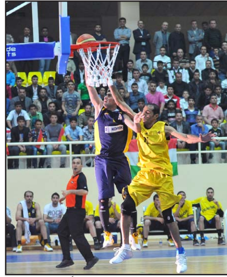
دوري سلة الممتاز يشهد لقاءً مثيراً بين دهوك والنطف

تستكمل غدًا الأحد منافسات الدور الثامن من المرحلة الاولى لدوري السلة الممتاز للموسم الحالي ٢٠١٤-٢٠١٥ بإقامة مباراتين على ملاعب المحافظات وقال الناطق الاعلامي لاتحاد السلة احسان الموسوي لـ(المدى): ان المباراة الاولى بين فريقي دهوك والنطف على ملعب دهوك ، والثانية بين فريقي نطف الجنوب والكرخ على ملعب الأول في محافظة البصرة .