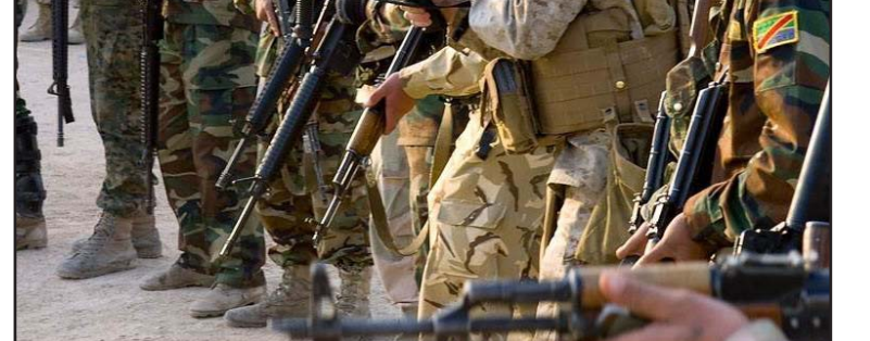
جندي أميركي خلال مهمة تأهيل الجيش

وركز المستشارون الأميركيون، في تدريب القوات العراقية، على تكتيكات المشاة أثناء الاقتحام وكيفية الحفاظ على العتاد والماء والغذاء في حال قطع الاتصال بالوحدات