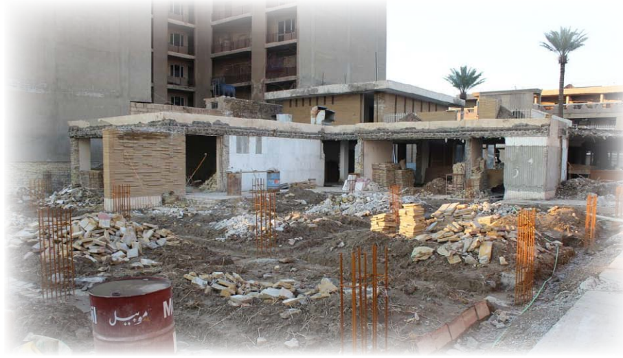
دائرة المنصور، المعمار إبراهيم علاوي، منظر عام (أثناء البناء)

مبناه الطابوق السمتي الملون، وذا الأبعاد الميزية، الذي ظهر فجأة عند إجاب المصممين العراقيين. حرص إبراهيم علاوي على أن تكون ثمة مداخلة تشكيلية في التكوين المتبدع للدائرة، وهو ما تحقق فعلاً في فضاء الفناء الواسع من وجود "جداريتين" خزفتين، لم أهدت إلى اسم فنانها، وباتت الآن في خيايا المهجول، مثلما أسست الدار ذاتها في طي النسيان.