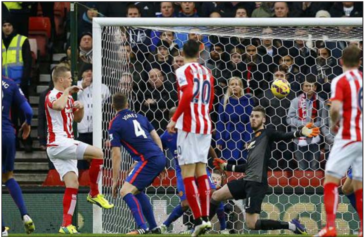
ترجع نتائج الشياطين الحمر في دورين متتاليين

والخسارة هي الثانية لتشيلسي هذا الموسم بعد الاولى على ارض نيوكاسل 1-2 في المرحلة الخامسة عشرة.