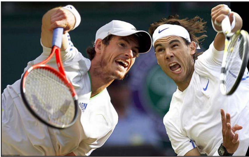
مواجهة مثيرة تجمع موراي بنادال

خسارته، فإنه أبدى مؤشرات على احتفاظه بالمستوى الجيد الذي ظهر به الموسم الماضي. ويقول الإسباني المصنف 14