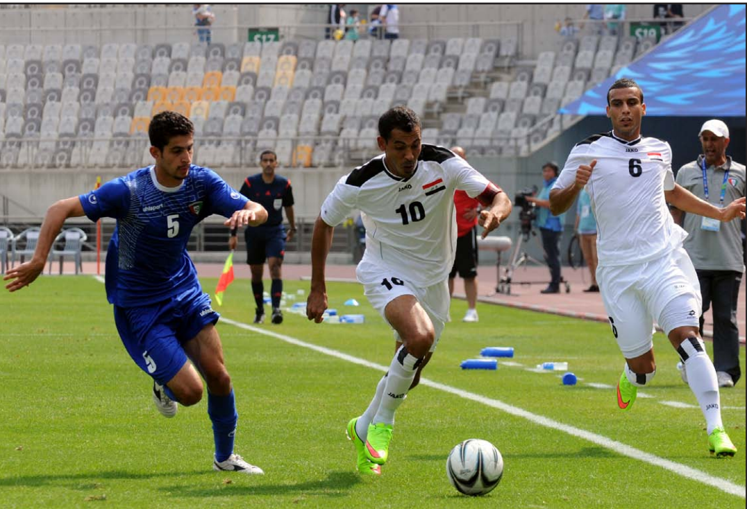
الكرة العراقية امام تطلعات جديدة نحو مونديال ٢٠١٨

أخطاء العام الماضي بالنسبة لمباريات الدوري المحلي حيث تسببت أخطاؤه في عام ٢٠١٤ بإلغاء مباريات الدوري ومصادرة جهد إدارات الأندية وملاقاتها التدريبية ولاعبها ، لذلك لا بد للاتحاد أن يضع منهاجها صحيحاً وملزماً له ولفرق الدوري بأن تنتهي مباريات الموسم الحالي في موعد لا يتجاوز منتصف أيار المقبل، لأن أي تمديد بعد الوقت المنكورت سيقفل مباريات الدوري ومثل هذا القتل سيمتد شتناً أم أبيناً إلى المنتخبات الوطنية.