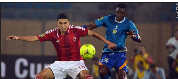
جدو في طريقة للاستشفاء،

ابتعد ديل بوترو عن الملاعب منذ انسحابه من الدور الأول في بطولة دبي في شباط 2014 وخضع لجراحة في معصم اليد اليسرى أواخر آذار الماضي. وأعلنت الجهة المنظمة لبطولة بريسن غياب الأرجنتيني، الذي قرر أن يعود للملاعب في 12 من الشهر الحالي في سيدني حيث سيدافع عن لقبه الذي أحرزه العام الماضي بعدما تغلب في النهائي على الاسترالي