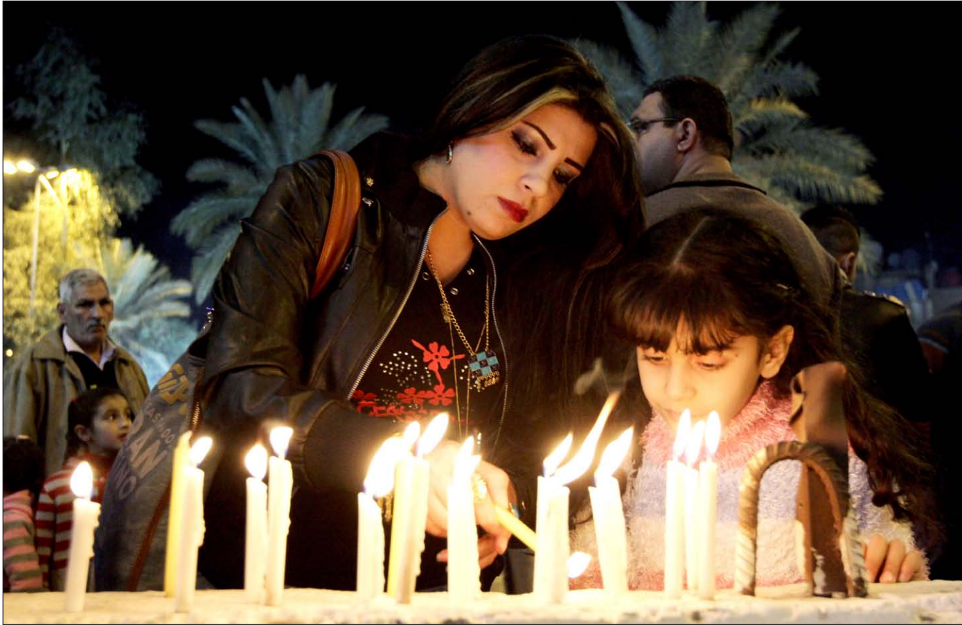
بغدادية تشعل الشموع في الاعظمية خلال الاحتفال بالمولد النبوي الشريف...

تضمن الانتصارات الأخيرة التي حققها الجيش والمتطوعون وأبناء العشائر ضد الإرهاب في بعض مناطق البلاد"، داعيا إلى "أخذ الحيطة والحذر لمنع العدو من فتح جبهات من محاور ومناطق أخرى لتعويض خسائره". وأضاف الصافي ان "على قوات الجيش والحشد الشعبي وأبناء العشائر ضبط النفس والحذر الشديد من استهداف المدنيين العزل والمساس بممتلكاتهم"، مطالبا "المؤسسات الحكومية بالعمل على تثبيت ثقافة المواطنة وخلق جو العيش المشترك من خلال الوسائل المتاحة إعلاميا