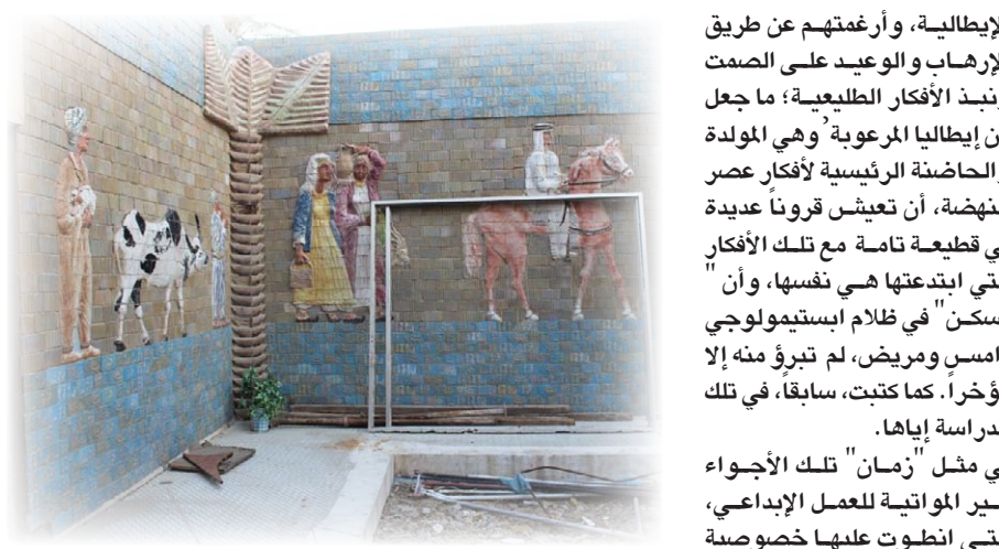
لوحة خزفية في فناء الدائرة، تفصيل

تلك القرارات التي أجبروا على اتخاذها. فالوقت المتاح لهم وله للعمل المهني لم يكن متسعاً بما فيه الكفاية، وبالتالي لم تكن إبداعاتهم مؤثرة أو معروفة على نطاق واسع. على أن ما اجترحه إبراهيم علاوي وهو مدار اهتمام مقالنا، على نسحه، يعكس بعضاً من تلك الإمكانيات التي كان يمكن لها أن تحفز المشهد المعماري المحلي بتصاميم لافتة. ليس المكان، هنا موافياً كثيراً، بحكم طبيعة المقال، أن نشير إلى جميع المباني التي صممها إبراهيم علاوي، لكن إحداهما، التي أقرت، شخصياً، عمارتها عالياً جديرة بالذكر هنا بسببين. أولهما، مقاربة العمارة التي طبعت منتج إبراهيم علاوي؛ والسبب الآخر، لجهة المصير الفاجع والمأساوي الذي لحق بهذا المبنى. إذ تم، مع الأسف، إزالته بالكامل؛ وبقيت منه صورة، قدر لي التقاطها