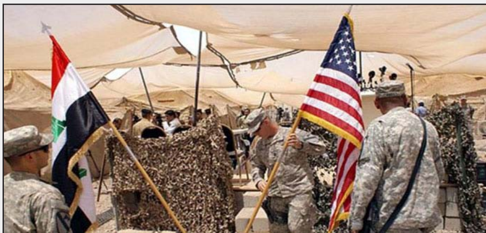
جنود اميركان في العراق - ارشيف

يتفق البنتاغون وجنرالات أميركا على ان الضربات الجوية لوحدها غير كافية لهزيمة داعش، كما ان الحلفاء الإقليميين - باستثناء الكرد - لم يظهروا أية إشارة على توفير قوات برية بديلة سواء في العراق أو سوريا التي تضم معازل داعش، وان مظاهر التطرف - المتنتظة بمجموعات مثل جبهة النصرة المرتبطة بالقاعدة - تهدد بزعة الاستقرار في لبنان والأردن وتركيا، وتعميق الأزمة الأمنية في ليبيا واليمن والصومال. اذا قامت الولايات المتحدة بتصعيد تدخلها العسكري