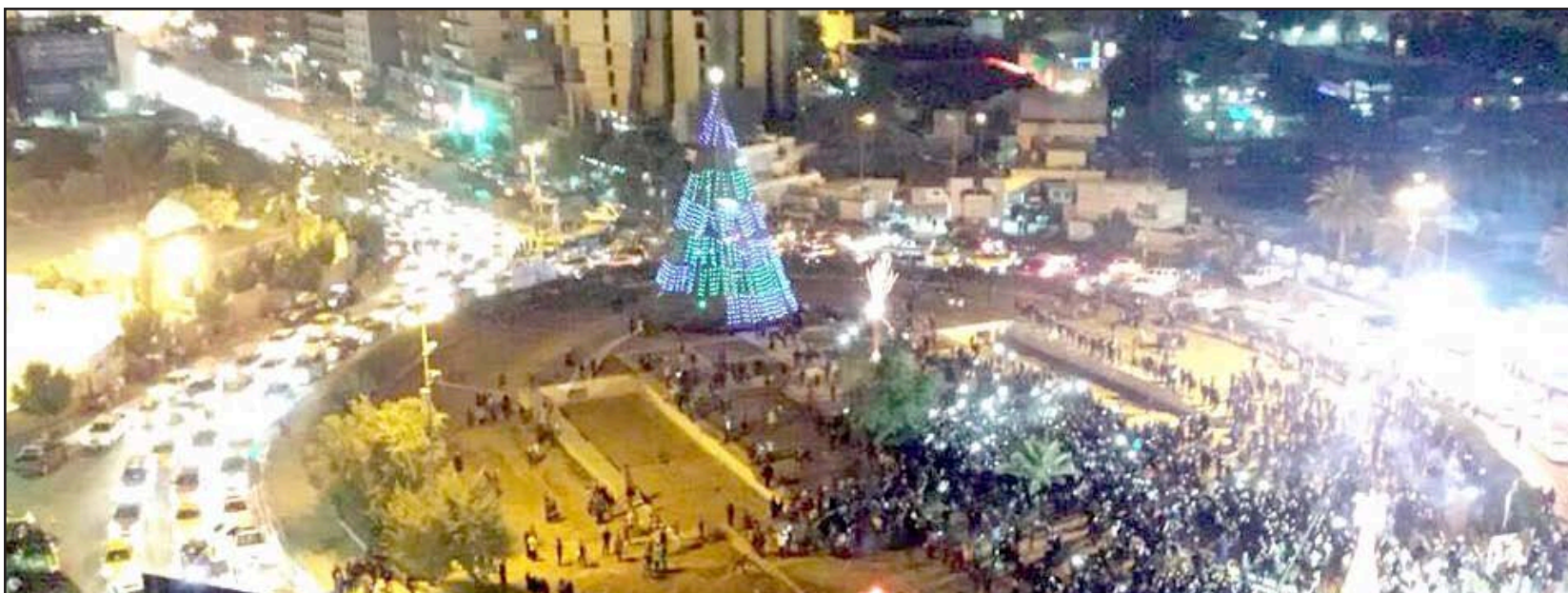
ساحة الفردوس وسط بغداد تحتضن المحتفلين باعياد رأس السنة ٢٠١٥..

ويحتفل العالم في كل عام من ليلة الـ٣١ من كانون الأول، بقدم رأس السنة الميلادية الجديدة، وتتنوع أشكال وطقوس الاحتفاء ما بين بلد وآخر ولكنها تتشابه في مراسيم الاحتفال كعروض الألعاب النارية وإقامة الحفلات وإطلاق الأعمية.