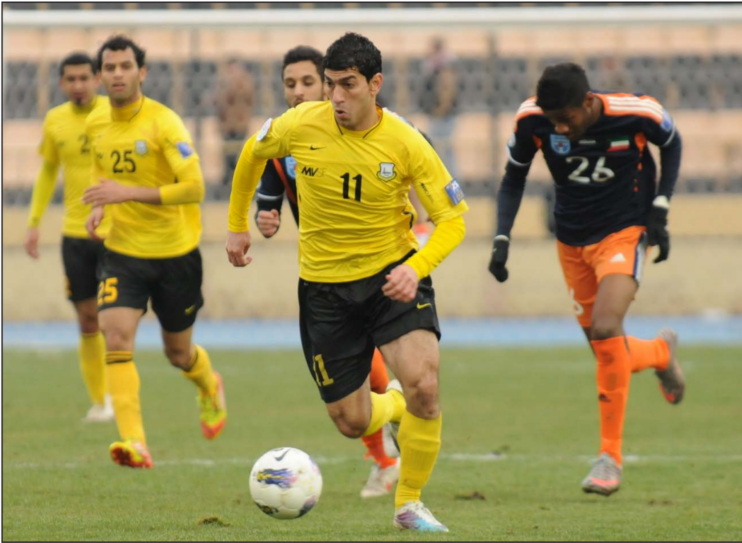
معلم اربيل يتربق رفع الحظر عنه لإقامة المباريات الدولية