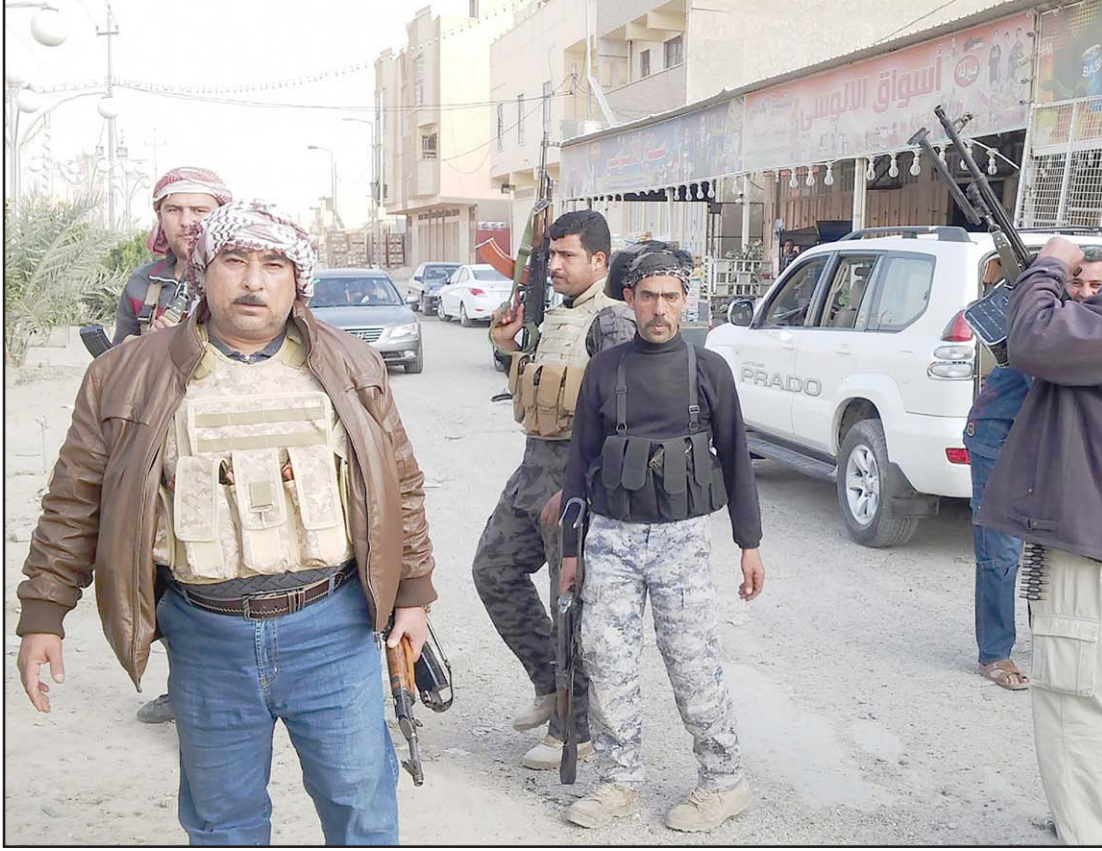
مقاتلو العشائر في الأنبار

ويلفت عضو لجنة الأمن والدفاع البرلمانية الى ان "قاعدة عين الأسد العسكرية ومركز الحبانية خرجا الكثير من الدورات العسكرية في الأيام القليلة