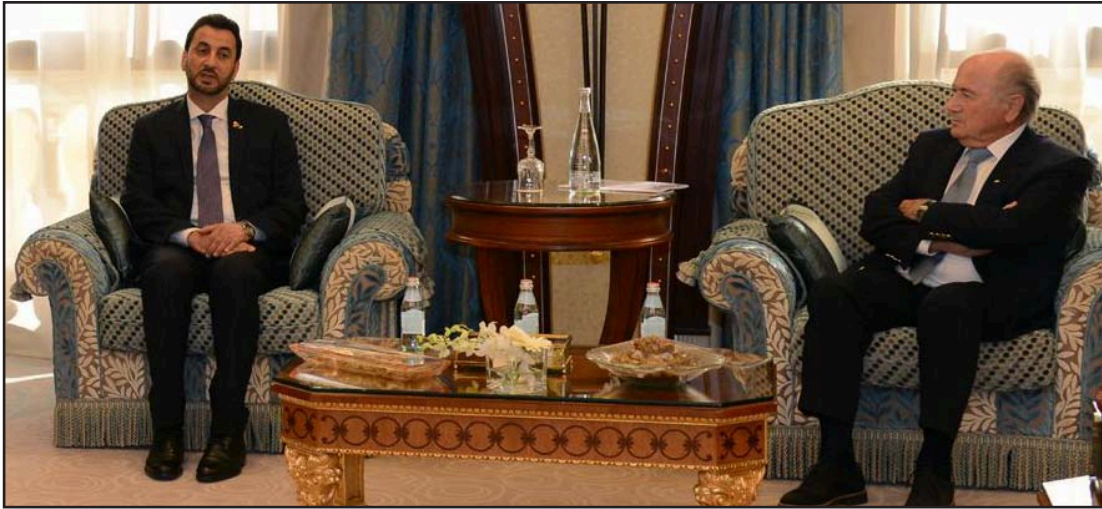
اتناء لقاء وزير الشباب برئيس الاتحاد الدولي (فيغا)

المفروض على الملاعب العراقية. وأكد عبطان للإعلام "أننا ابتدأنا الخطوة الأولى لرفع الحظر المفروض على الملاعب"، وأشار إلى أن "بلا تر أوعز بتشكيل لجنة ستزور العراق بداية العام المقبل لإطلاع على المنشآت الرياضية العراقية وتطلع على جاهزيتها".