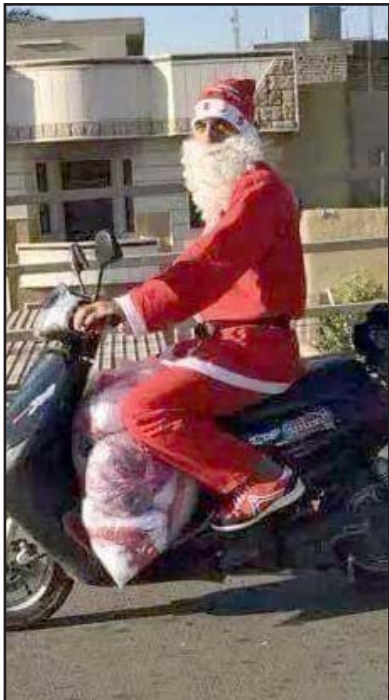
سانتا كلوز بغداد على دراجة نارية..