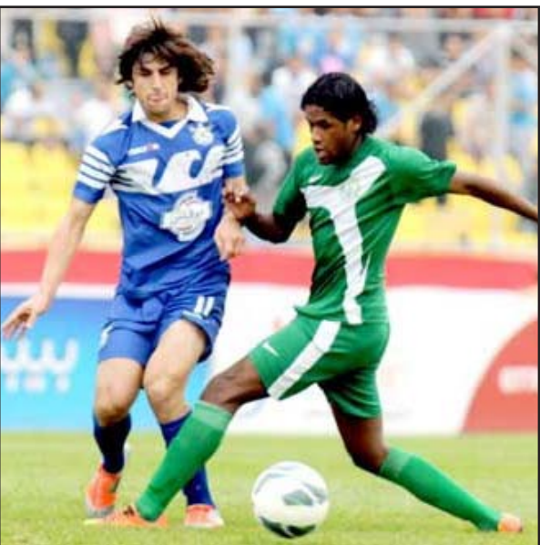
البناء يبحث عن مدرب جديد

اليوم السبت أو غداً الأحد بعد دراسة ملفات ٥ مرشحين على طاولاة الهيئة الإدارية من أجل المفاضلة بينهم وإختيار أحدهم للإشراف على تدريب الفريق . وأوضح أن المرشحين هم: