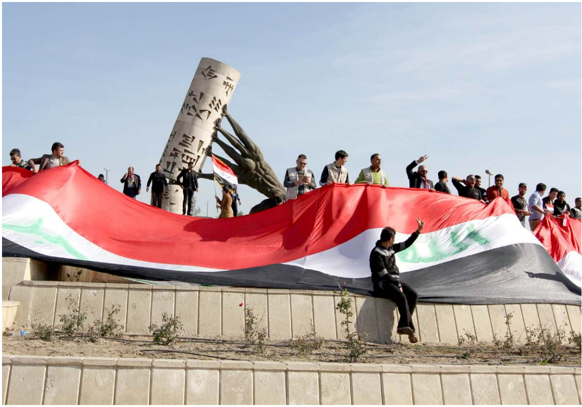
ناشطون بغداديون يرفعون العلم العراقي قرب نصب "انقاذ العراق" .. تصوير/ محمود رؤوف