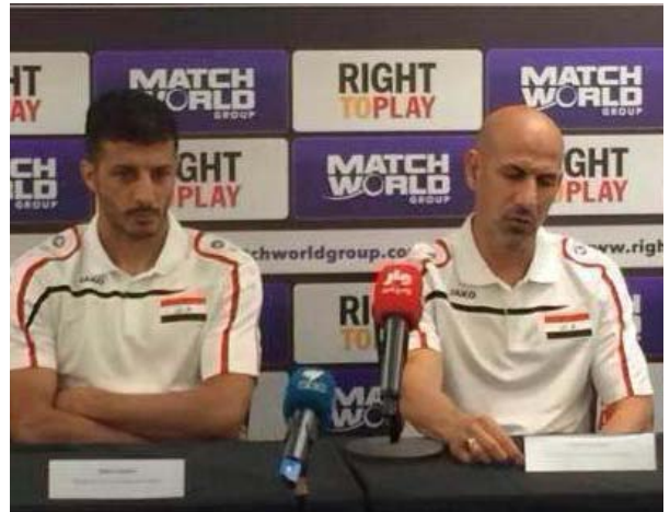
شنيشل وشاكر في المؤتمر الصحفي