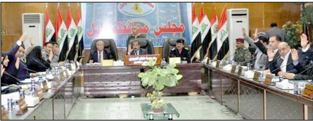
مجلس محافظة بابل

وكان مجلس الوزراء، قرر في (الثلاثين من كانون الأول ٢٠١٤)، سحب الطعن الحكومي عن قانون تعديل قانون المحافظات غير المنتظمة بإقليم، وفي حين دعا إلى إعادة دراسته خلال ثلاثين يوماً، أكد على ضرورة تحقيق "الانسجام والانسجامية" بين الحكومة الاتحادية والحكومات المحلية. وكان رئيس مجلس الوزراء، حيدر العبادي، تعهد خلال ترؤس اجتماع الهيئة العليا للتنسيق بين المحافظات غير المنتظمة بإقليم، الذي عقد في (٢٩ من كانون الثاني ٢٠١٤)، في البصرة، بمشاركة ١١ محافظة عراقية، بالمضي بنقل الصلاحيات المركزية إلى المحافظات، وفي حين أكد على ضرورة توزيع الثروة بنحو عادل على الشعب العراقي، عد أن تشكيل الأقاليم "حق دستوري".