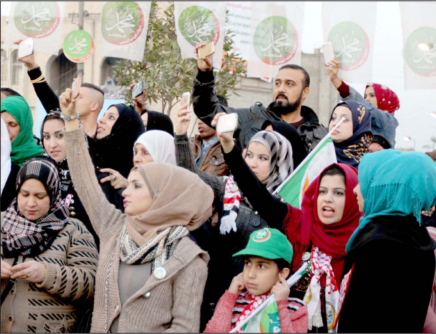
زوار قرب مرقد ابو حنيفة النعمان يحيون المولد النبوي.. بعدسة محمود رؤوف

□ نازحو ديالى يطالبون بالسماح لعودتهم الى ديارهم