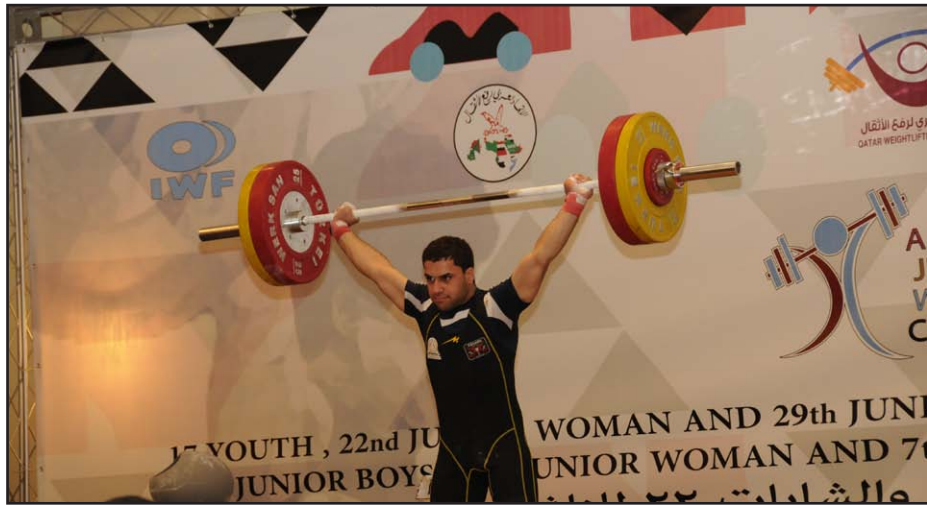
نتائجه متميزة للأثقال في الدوحة