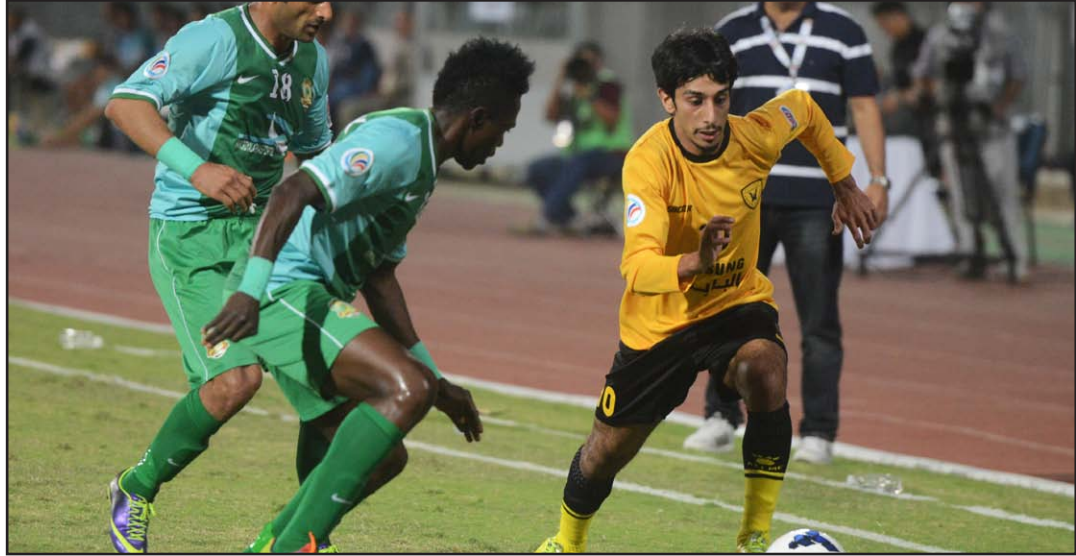
اتحاد قطر يوافق على احتضان الشرطة للكأس الآسيوية