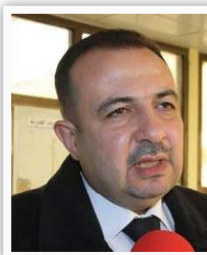
محافظ البصرة ماجد النصاروي

"ان الملاكات الهندسية والفنية العاملة في المديرية العامة لنقل الطاقة الكهربائية في الفرات الأعلى، وبإسناد رجال شرطة الكهرباء، تمتكث من إعادة خطي الضغط الفائق [مسبب حرجية، جنوب بغداد] ٤٠٠ ك.ف، و[مسيب غازية - جنوب بغداد] ٤٠٠ ك.ف، الى الخدمة بعد نصب واصلاح البرج ٤٦، الذي يربط بينهما، والذي استهدف بعمل إرهابي في منطقة [الويلحة] بحرف النصر في محافظة بابل فجر الاثنين الماضي".