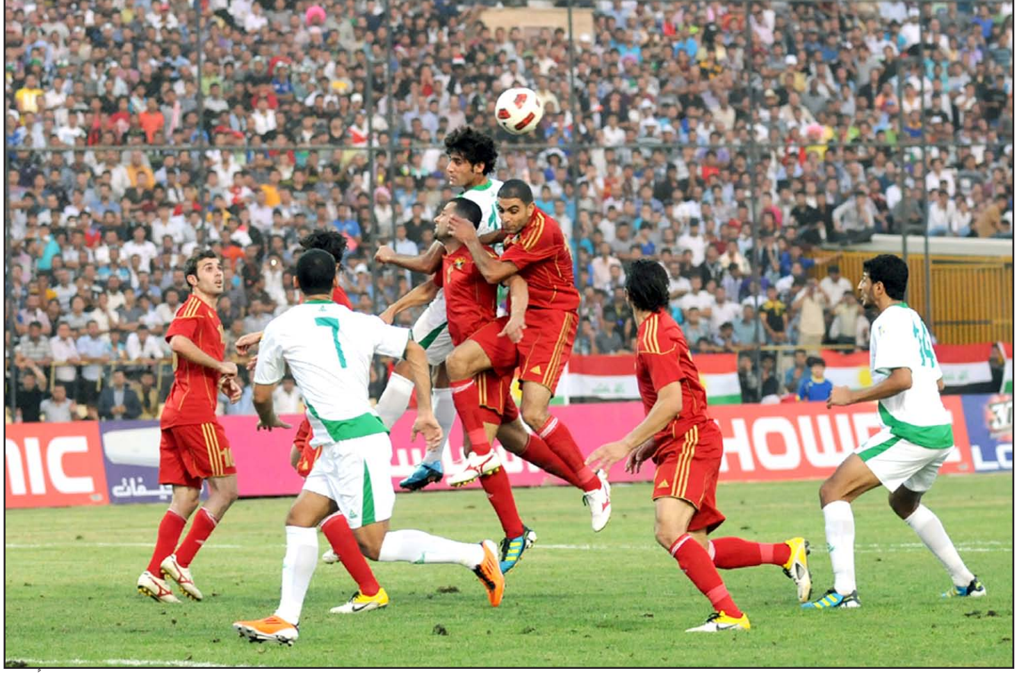
لقاء مشير يجمع منتخبنا مع إيران استعداداً لآسيا

الأمم، مشيداً بالروح المعنوية العالية والاصرار الكبير لدى جميع اللاعبين في تطبيق المفردات التدريبية والاسلوب الخططي الذي يضعه الملاك التدريبي للمنتخب في الوحدات التدريبية التي تقام بمعدل وحدتين صباحية ومسائية في معسكر (ولونغونغ) الذي يحظى بمتابعة جماهيرية كبيرة من قبل الجالية العراقية المتواجدة في مدينة سيدني في رؤية اللاعبين سواء من خلال الزيارة المستمرة الى فندق (ذاجينلي) مقر سكن وفد منتخبنا وكذلك ملعب (ون) الذي يحتضن الوحدات التدريبية للمنتخب من اجل اعطاء اللاعبين دفعة معنوية كبيرة بتحقيق آمالهم بضرورة التواجد في دور النصف النهائي للبطولة الذي سيكون دافعا نحو التقدم الى الادوار الأخرى.