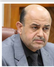
رئيس مجلس نيثوى بشار كيكي

"أنا في الوقت الذي نشيد بزيارة رئيس مجلس الوزراء الى محافظة البصرة واستجابته الى مطالب المحافظات غير النظمة بإقليم، نشدد على أهمية البدء بنقل الصلاحيات من الحكومة الاتحادية الى الحكومات المحلية بشكل تدريجي بعد سحب الطعن بقانون ٢١، كما ندعو الى إقرار قانون البصرة عاصمة العراق الاقتصادية، ان مهدين الأملين جديران بالانتماء حتى نحصل على الصلاحيات من اجل إدارة المحافظة وتقديم الخدمات".