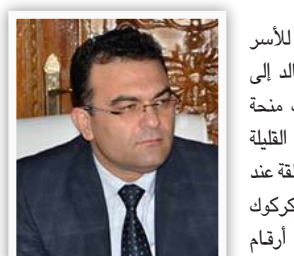
وزير الهجرة جاسم محمد

"إن مجلس المحافظة أقر مشروع توزيع سيارات البصات خدمة للعاطلين عن العمل في بغداد، إن المشروع يتضمن توزيع عشرة آلاف من سيارات خدمة صغيرة على العاطلين التي تشمل النساء أيضاً وتسد بأقساط شهرية، وإن أحد المصارف الحكومية سيقيم بتمويل المشروع الذي تبلغ كلفته ٥٠ مليون دولار، إن سعر السيارة الواحدة سيبلغ خمسة ملايين دينار وسيتم إعفاء المستفيدين من الأقساط لمدة ثلاثة أشهر".