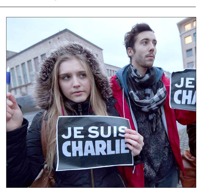
متضامنون مع ضحايا مجزرة الصحيفة الفرنسية في باريس..

رجح المجلس البلدي في المقدادية بمحافظة ديالى، استمرار تعطيل الدوام الرسمي لغالبية الدوائر الرسمية، نتيجة استمرار قصف تنظيم (داعش) للقضاء، وفيما أكدت مديرية التربية أن توقف الدراسة تسبب بحرمان أكثر من 18 ألف طالب من التعليم لأول مرة منذ عشرات السنين. إلى ذلك طالب المسؤولون والاهالي بضرورة اطلاق عملية عسكرية عاجلة وموسعة لتطهير المنطقة