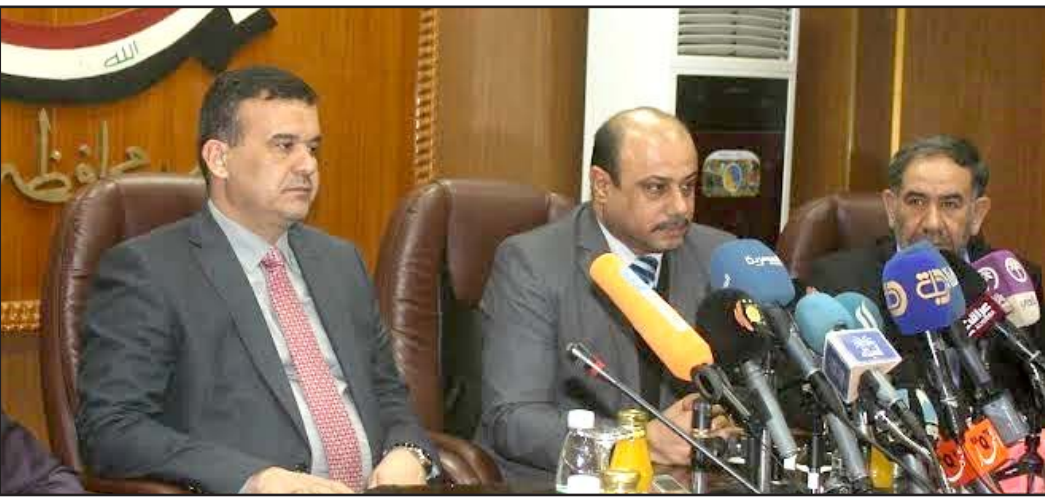
وزير الموارد المائية محسن الشمري في البصرة

وقال وزير الموارد المائية محسن الشمري خلال اجتماع عقده بمجلس محافظة البصرة، أمس، وحضرته (المدى برس)، إن "محافظة البصرة هي المتضرر الأكبر من وصول إطلاقات كميات المياه إليها من ناحية كمية المياه ونوعيتها"، مبيناً أن "السنوات المقبلة ستعكرس الجهود للوصول كميات المياه ونوعيتها المطلوبة إلى آخر نقطة في العراق". وأضاف الشمري "لدينا قوانين وتشريعات معطلة يجب تفعيلها للحفاظ على وصول كميات المياه التي تليق بمحافظاتنا، ومنها البصرة"، مشيراً إلى أن "البصرة هي آخر الحصب العام تصل إليها مياه رديئة ولا بد من إعادة النظر فيها". وأكد الشمري أن وزارة الموارد المائية