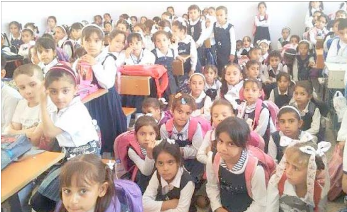
زخم في احد الصفوف المدرسية ببغداد بسبب قلة الأبنية التعليمية.. ارشيف

□ إقبال: العراق بحاجة الى ١٠ آلاف بناية لمعالجة الدوام الثنائي والثلاثي