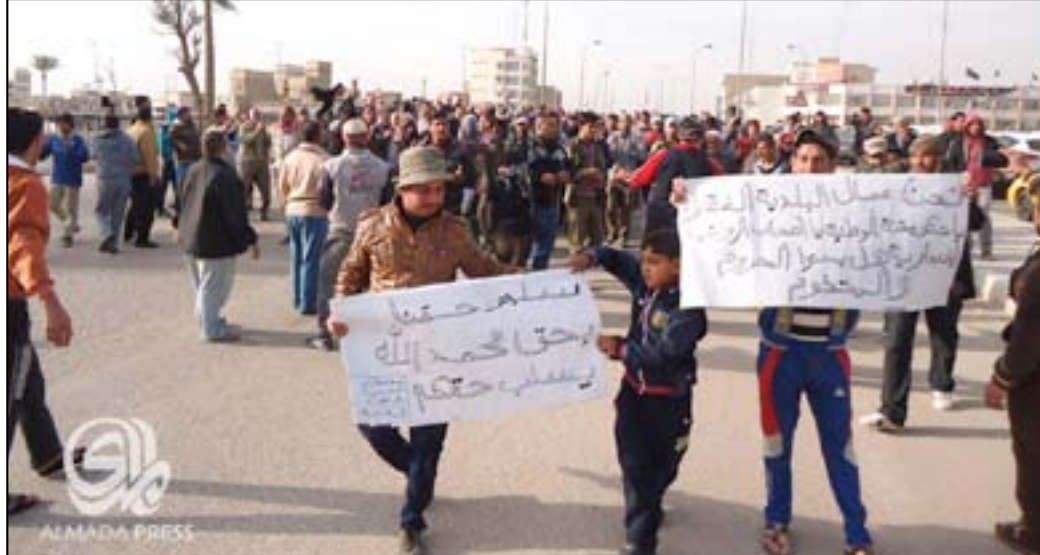
جانب من تظاهرات عمال بلدية الحلة

السياسية قبيل الانتخابات قام البعض من المسؤولين بتعيين الكثيرين من الخريجين بأجور يومية على ملاك المحافظة". ويتابع السلطاني، أن "المحافظة اليوم