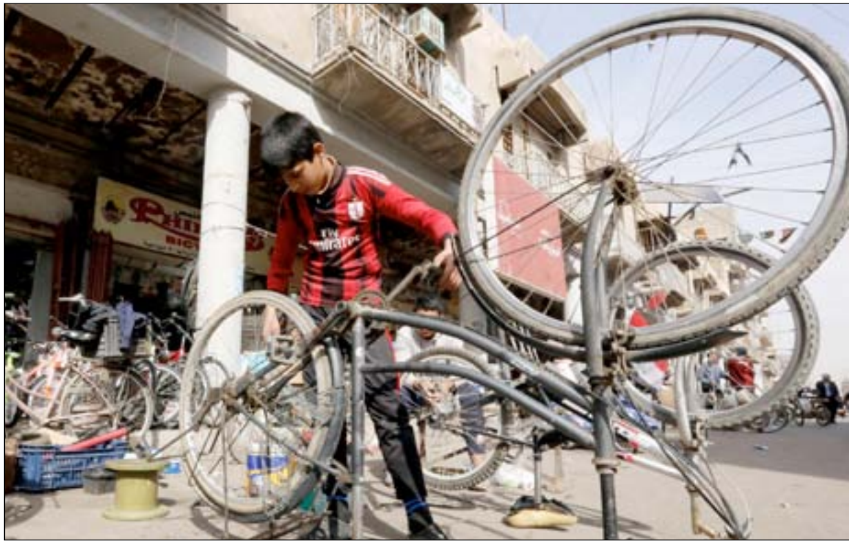
مصلح دراجات هوائية في منطقة الصدرية وسط بغداد...