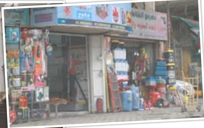
فقدان هوية الشارع