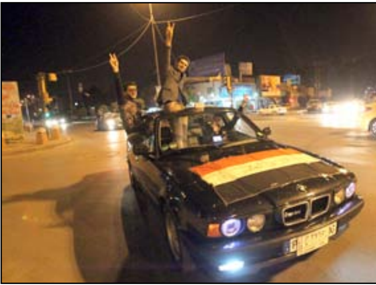
شباب يحتفلون برفع الحظر عن بغداد..