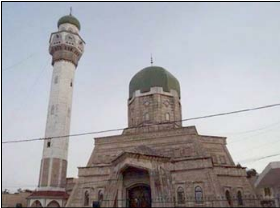
ضريح الإمام المحسن قبل تهديمه