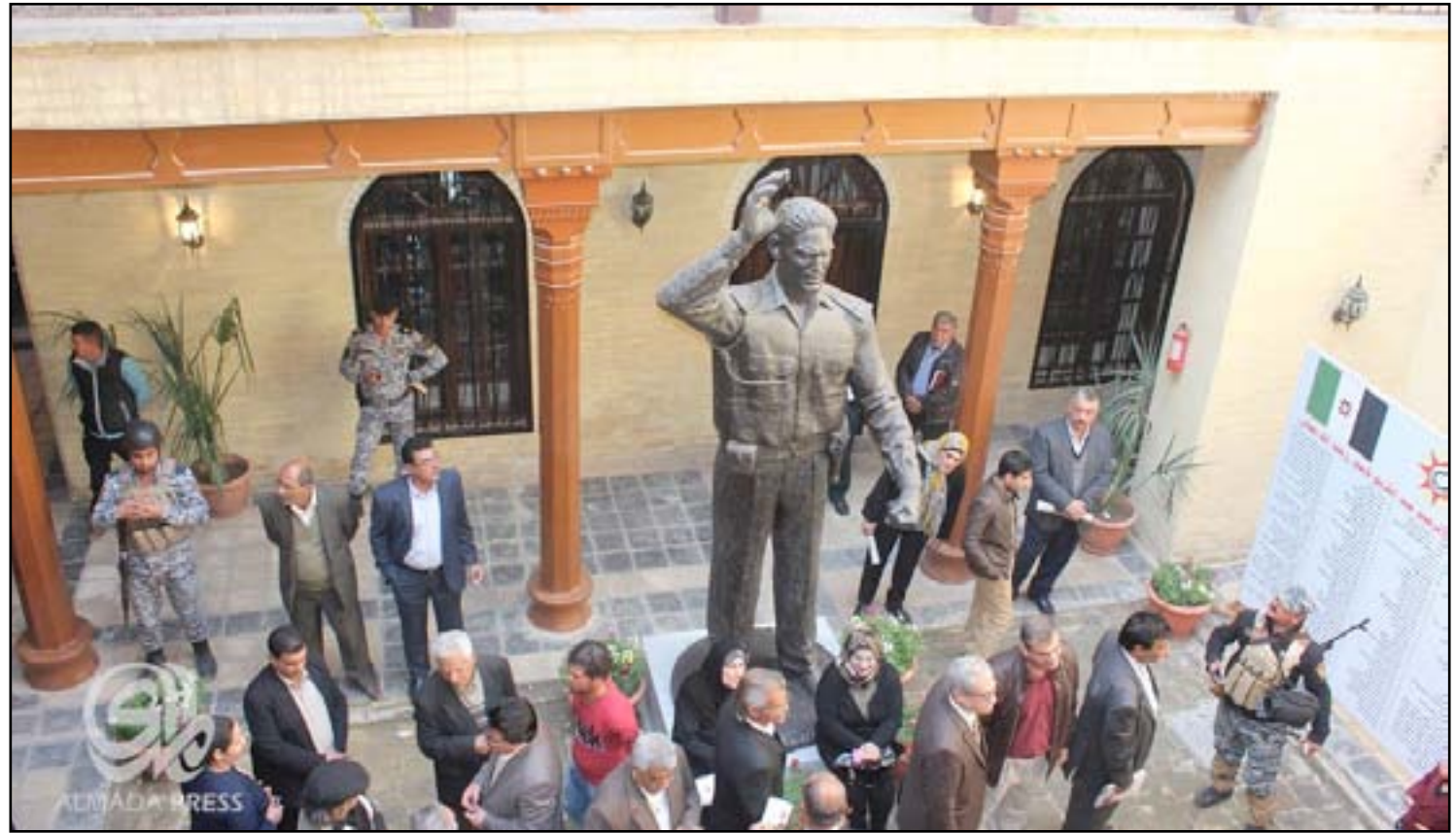
بغداد / مهتد جواد

افتتحت وزارة السياحة والآثار، امس الأحد، متحف مؤسس الجمهورية العراقية عبد الكريم قاسم، وأكدت أن الأيام المقبلة ستشهد افتتاح متحف الشاعر الكبير بدر شاكر السياب، وفيما أشارت إدارة المتحف إلى أنه سيكون مفتوحاً باستمرار وسيقبل أية هدايا تذكارية أو أي نصب خاص بـ"الزعيم"، دعا شعراء وإعلاميون المسؤوليين العراقيين إلى الاقتداء بـ"الزعيم" وإبراز شخصيته عربياً وعالمياً.