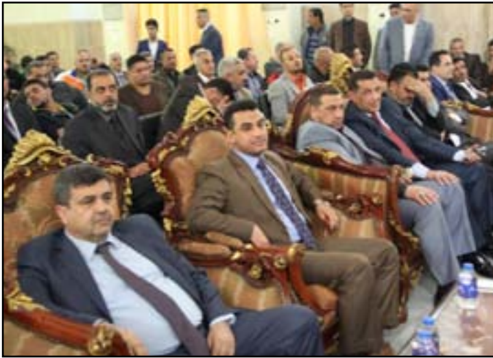
لقطات من مؤتمر الشرطة الانتخابي أمس الأول السبت