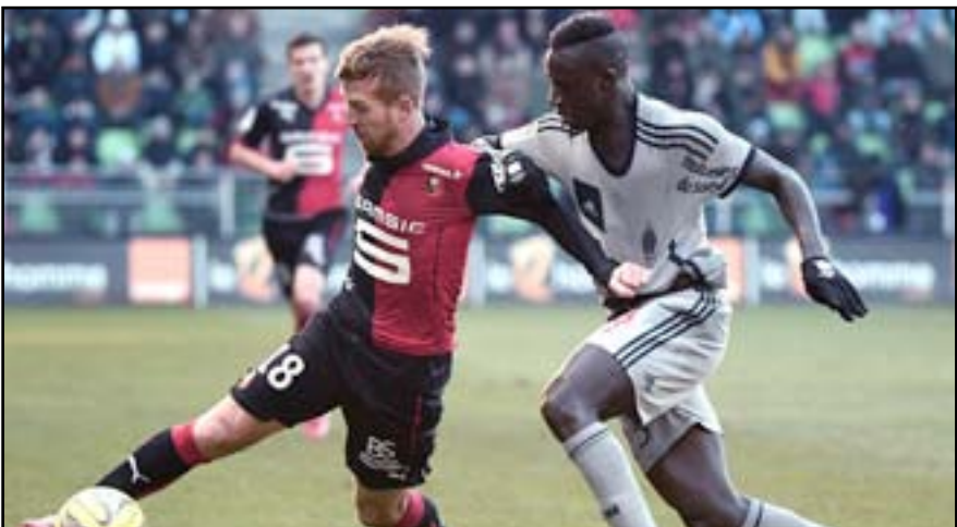
مرسيليا يسقط في فخ التعادل