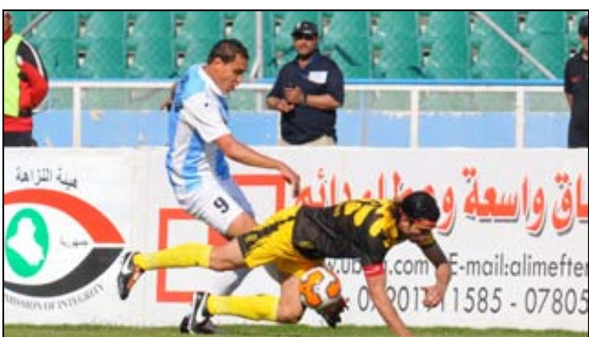
الطلبة يسعى لرد الدين في لقاء دهوك