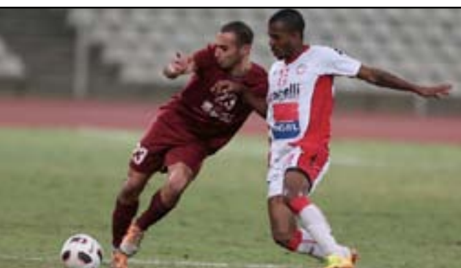
النجمة يتعد عن مستواه المعهود