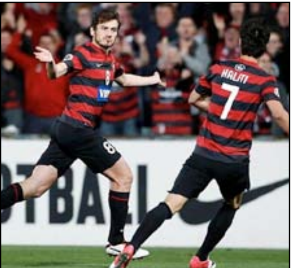
واندرارز يسجل فوزاً مستحقاً