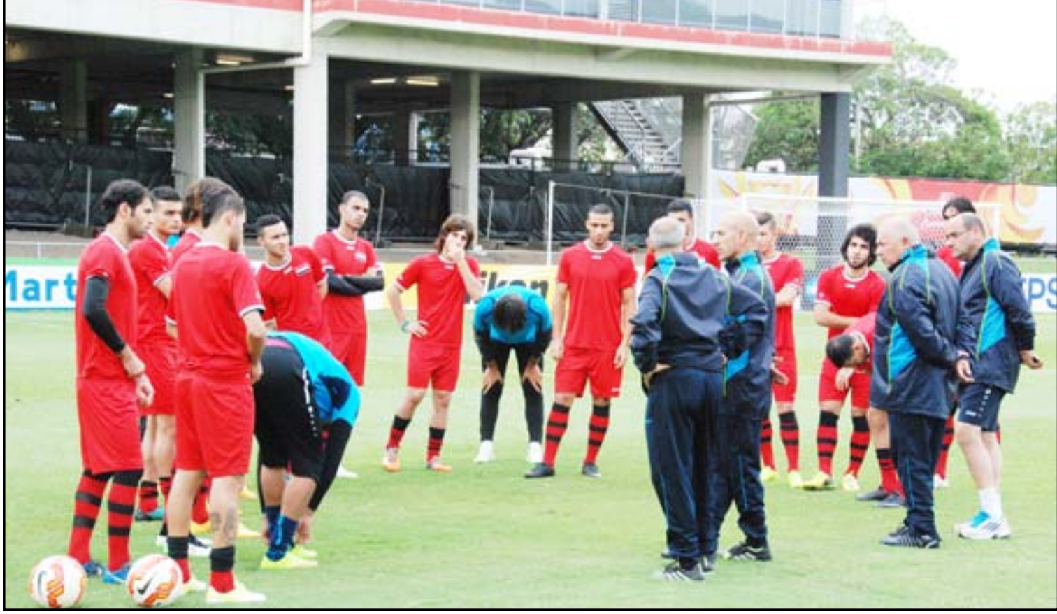
مناهج تدريب المنتخب الوطني على طاولة اتحاد الكرة