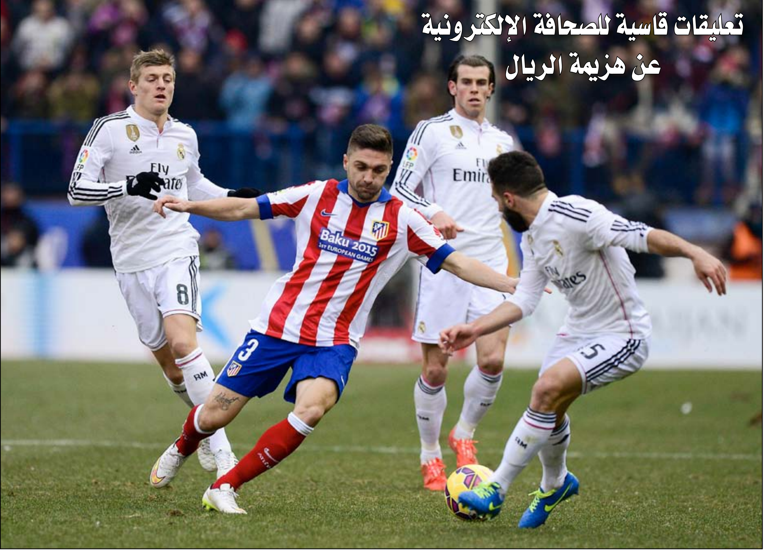
ريال مدريد يسقط برباعية نظيفة أمام غريمه أتلتيكو مدريد

وسط غيابات وكوينتراو وناتشو عانيا خلال اللقاء، فيما ذكرت (كلارين) الأرجنتينية "أتلتيكو سيميوني يسحق ريال مدريد ويعتس أماله في الاحتفاظ بلقب الليغا". وكان آخر انتصار مماثل لأتلتيكو على غريمه بالعاصمة الإسبانية، بأربعة أهداف نظيفة، يعود إلى ٣٨ عاماً، وتحديداً في الثاني من كانون الثاني ١٩٧٧.