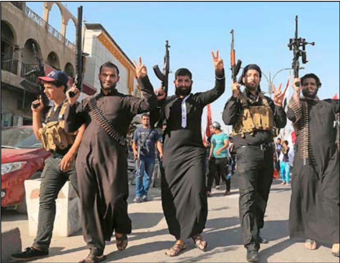
رجال عشائر البصرة يحملون السلاح