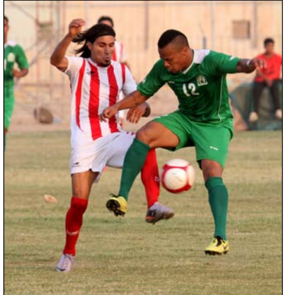
كربلاء في مواجهة صعبة مع القوة الجوية