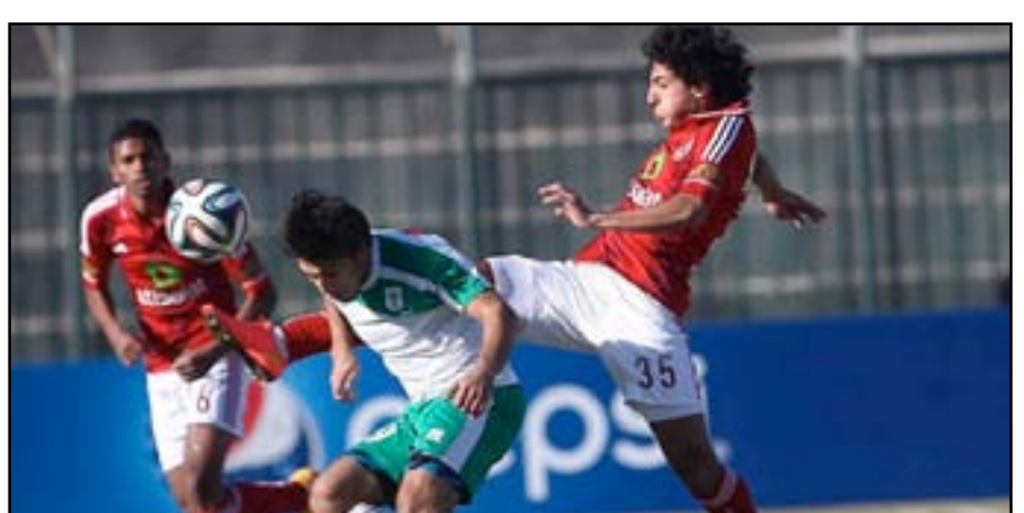
الأهلي يضيف ثلاث نقاط لرصيده

الشرطة نانا بوكو ويسدد الكرة حولها اكرامي الى ركنيه (١٩). وتعددت هجمات الأهلي بفضل تحركات الشريط مؤمن زكريا الذي