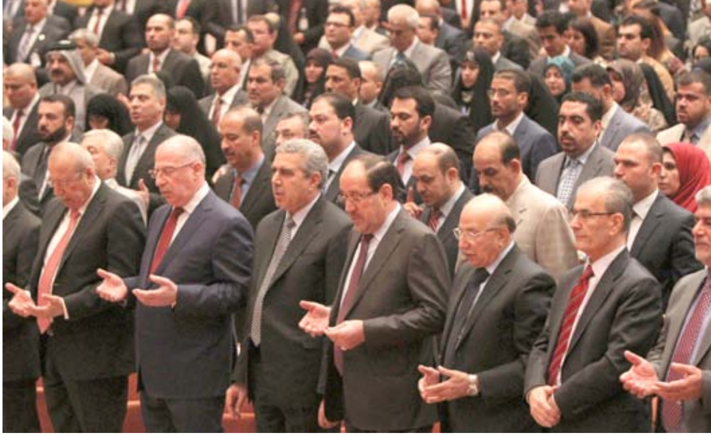
قادة الكتل السياسية خلال جلسة منح الثقة للحكومة.. أرشيف