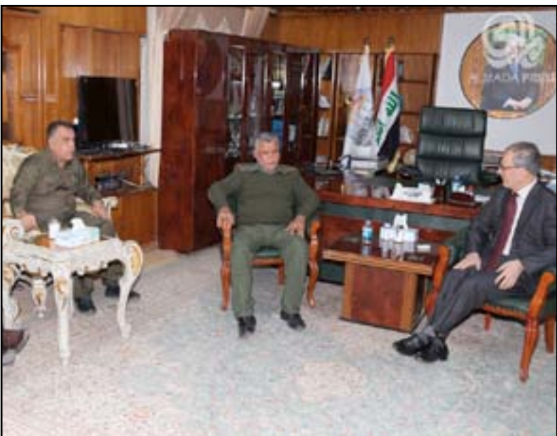
جانب من لقاء العامري ومحافظ كركوك أمس

وأضاف العامري أن "خطر عناصر التنظيم على كل من الكرد والعرب والتركمان والكلدان والأشوريين"، مشيرا إلى أنه "كان هناك اعتقاد لدى البعض بأن داعش يدافع عن السنة لكن جدا لتنضم كركوك إلى المدن الحرة الأكبر هم السنة أنفسهم فلديهم أكثر من مليوني ونصف مهاجر ومنازلهم دمرت".