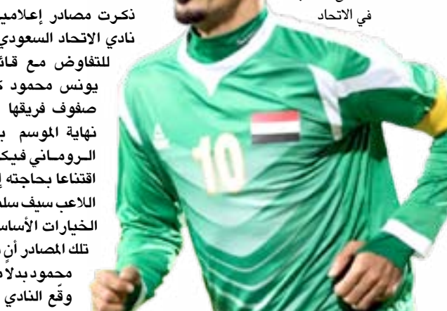
السفاح مطلوب في الاتحاد

الانتقالات الشتوية بان أثرها وأصدائها الإيجابية لدى جماهير الاتحاد التي عبرت عن استيائها وغضبها من المستوى الهزيل الذي ظهر عليه الفريق في مباراته أمام الفتح في دوري عبدلطيف جميل للحترفين، التي كاد يخرج منها خاسراً، بعدما تخلف في أول عشر دقائق بهدفين بلا مقابل. وطالبت الجماهير الإدارة بالاتجاه مع المدرب فيكتور بيتوركا واللاعبين لمناقشتهم في أسباب استمرار الفريق في التفريط بشكل عجيب في النقاط، إذ جمع ثلاث نقاط فقط من ست مباريات خاضها بإشراف المدرب الروماني فيكتور بيتوركا الذي لم يتدقّق الاتحاديون طعم الانتصارات معه حتى الآن إلا في المباريات الودية فقط.