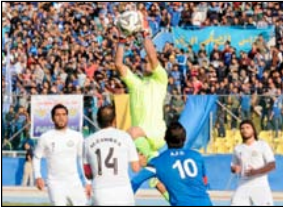
الزوراء بحاجة الى اعادة نظر في مستواه

من شاهد آخر لقاء لنادي الزوراء مع الكهرياء المحجّب وكيف كان أداءه باهتا وضعيفا ومجردا من كل لمسات الجديلية والقوة يشعّر ان هناك خلا واضحا وفتنلا نزيحا في الحفاظ على هيبه اسم كبير بات اليوم بلا مخالب ويستعطف الفوز بأي شكل حتى وإن كان بضربة حظ في الوقت بدل الضائع كما حصل في فوزه بهدف على الكهرياء تجسد بشكل لا يقبل الشك في نخول مدربه وملاكه الإداري بطريقة غريبة الى الملعب لمعانقة من سجل الهدف: تلك اللفظة المعيرة لا يمكن ان تندرج ضمن حق الاحتفال بقدر ما هي تعبير واضح على عمق المعضلة الفنية التي تواجه الفريق.. عغوا الإدارة الزورانية لا بد لها من الوقوف طويلا امام الحالة التي وصل اليها النادي وتستقري الذات وتعترف بأن الحلول الحقيقية القادم بكل شفافية ومصارحة مع الذات وتعترف بأن الحلول الحقيقية لابد ان تبدأ اولاً بمحاسبة أدائها الذي يبدو انه لا زال بعيدا عن حجم مهمة اسمها إدارة الزوراء.