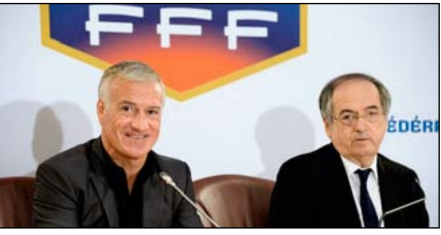
الاتحاد الفرنسي يجدد ثقته بديشامب ١٠ حزيران. وتابع قائد المنتخب الذي أحرز لقب المونديال ١٩٩٨ وكأس

أوروبا ٢٠٠٠ "لكن يسعدني أن أتابع المشوار مع المنتخب الفرنسي". وحصل ديشامب على الإشادة جراء السلوك المنضبط للاعبه بعد مشاكل العصيان في جنوب أفريقيا ٢٠١٠. وقال لوغريت: بالنسبة لي حققت كأس العالم في البرازيل نجاحاً نسبياً. وأضاف "شاهدت كيف نظم ديبديه ديشامب عمل الفريق في البرازيل وسنستفيد من هذه الخبرة في روسيا. من المهم أن نحصل على الاستقرار ولدينا الرغبة ذاتها.