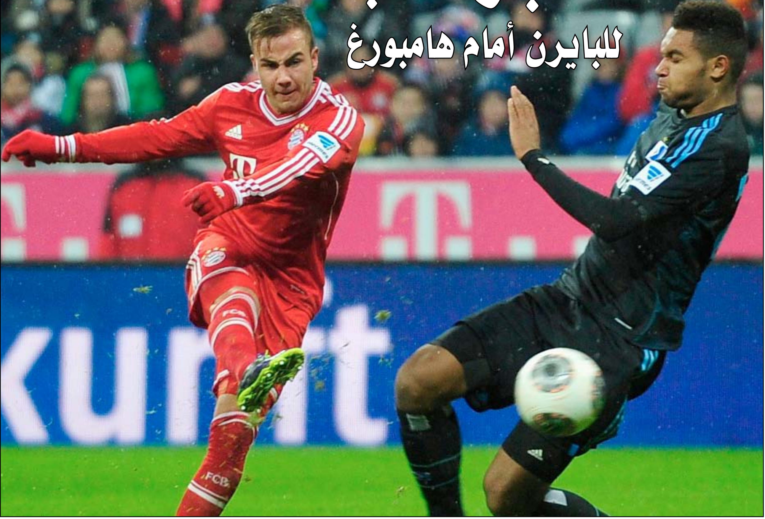
الفريق البافاري يأمل أن يواصل حصد النقاط بمواجهة صعبة مع هامبورغ

المهزوزة لدى لاعبي اينتراخت فرانكفورت، فبعد البداية المدوية التي حققوها مطلع الموسم الحالي، تراجع نتائج الفريق بشكل رهيب حتى بات يشغل المركز التاسع علماً بأنه لم يذق طعم الفوز في المباريات الست الاخيرة (٤ تعادلات وخسارتان). وتعد المباراة بروفة لشالكة قبل تضييفه لريال مدريد الاسباني الأربعاء المقبل في نهاب الدور ثمن النهائي للمسابقة القارية العريقة.