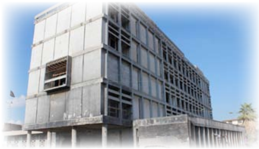
المصرف العقاري في جديد حسن باشا، بغداد، (منتصف الخمسينات)، منظر عام