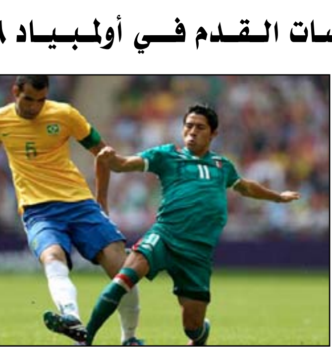
استعدادات برازيلية مبكرة لتصنيف منافسات الكرة الأولمبية

وتابع: الاستقرار الأمني في المدينة خلال المونديال لاقي استحسان الجميع.. شعب الأمازون أثبت أنه مضيف أكثر من غيره.. وفي ما يتعلق بالناحية المالية النتائج التي حققها الإقليم في هذا الشأن كانت الأفضل. وأفادت الصحافه البرازيلية أن مندماً مثل ساو باولو وبيلو هوريزونتي وسلفادور دي باهيا وبرازيليا إضافة إلى ريو دي جانيرو وماناوس ستستقبل منافسات كرة القدم خلال دورة الألعاب الأولمبية المقبلة.