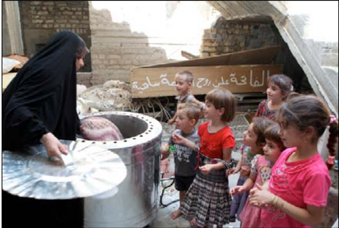
نازحون في إحدى المؤسسات الدينية ببغداد.. أرشيف

وأعربت المفوضية العليا لحقوق الإنسان، في (المدى برس) عن تشيبن الأول ٢٠١٤ (الحالي)، عن "قلقها البالغ" من الأوضاع الصعبة التي تواجه أكثر من مليوني نازح، وما نجم عنها من موت ١٥٠٠ طفل وإجهاض ١٣٨ سيدة حتى الآن، فيما طالبت بضرورة الإسراع بإقامة مخيمات كرفانية لهم، وتحويل المبالغ المرصودة لإغاثتهم للمحافظات التي تستضيفهم.