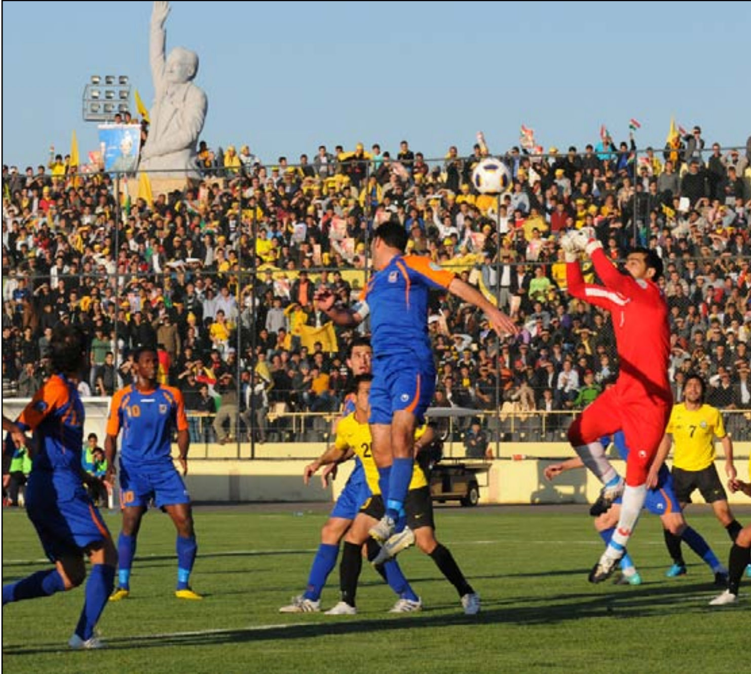
ملعب فرانسو حريزي شهد تضييف مباريات دولية كبيرة