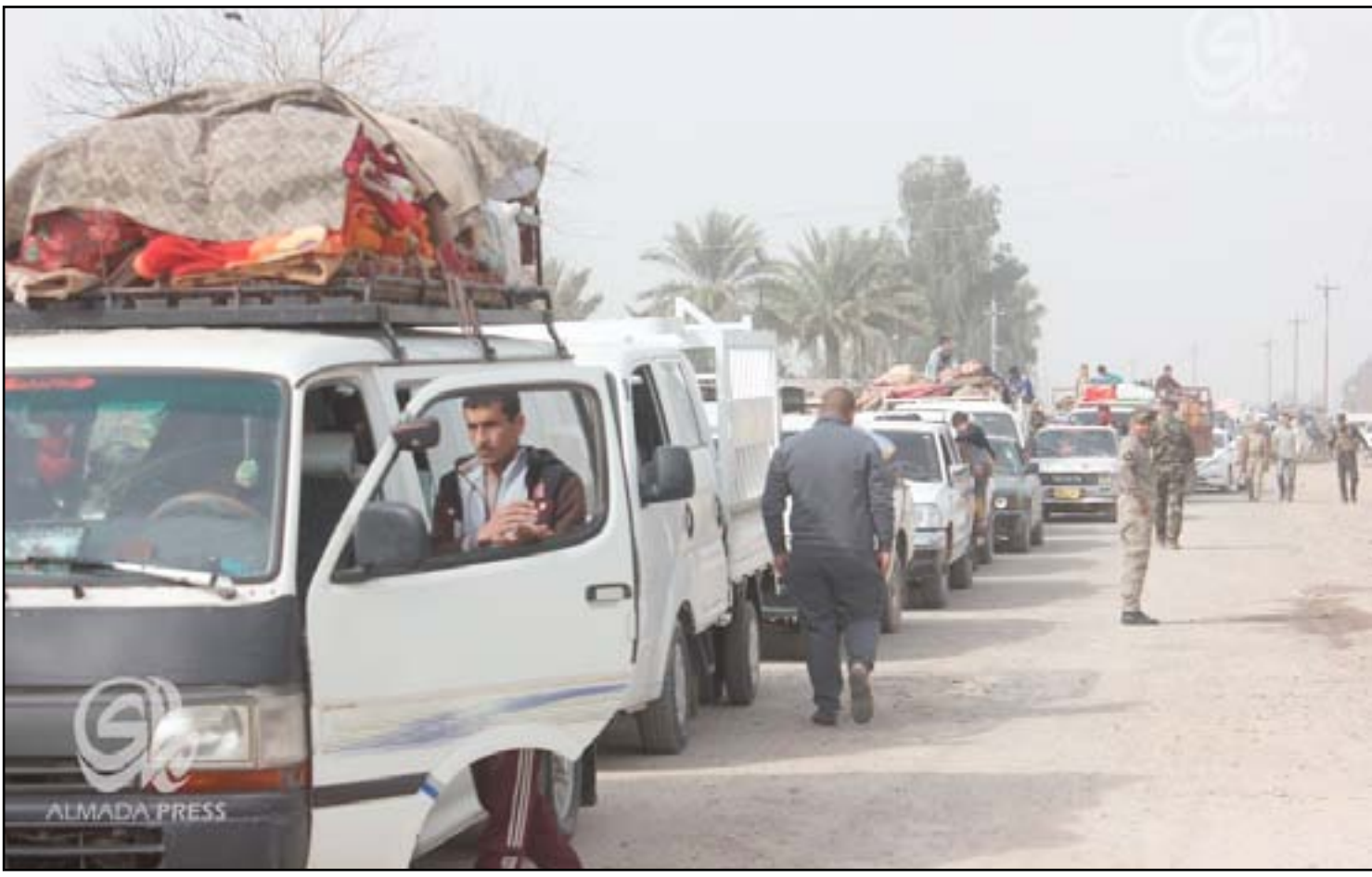
نازحون عائدون إلى المقدادية