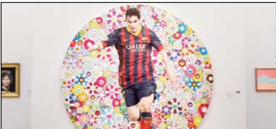
لوحة ميسي من إبداع الفنان البريطاني ميرست

بيعت لوحة نجم كرة القدم الأرجنتيني ليونيل ميسي من إبداعات الفنان البريطاني دامين (ساوتبايز) بالعاصمة البريطانية لندن مقابل ٣٦٥ ألف جنيه استرليني (٤٩٤ ألف يورو). يظهر النجم الأرجنتيني في اللوحة التي تحمل اسم (beautiful messi spin painting for one in eleven) في مركز درجات الأزرق إلى جانب كرتين