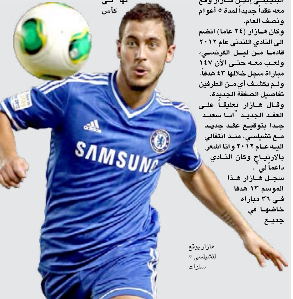
هازار يوقع لتشييلسي ٥ سنوات

□ لندن / أ ف ب أكد نادي تشيلسي متصدر الدوري الإنجليزي أن مهاجمه البلجيكي إدين هازار وقع معه عقداً جديداً لمدة ٥ أعوام ونصف العام. وكان هازار (٢٤ عاماً) انضم إلى النادي اللندني عام ٢٠١٢ قادماً من ليل الفرنسي، ولعب معه حتى الآن ١٤٧ مباراة سجل خلالها ٤٣ هدفاً. ولم يكشف أي من الطرفين تفاصيل الصفقة الجديدة. وقال هازار تعليقاً على العقد الجديد "أنا سعيد جداً بتوقيع عقد جديد مع تشيلسي. منذ انتقالني إليه عام ٢٠١٢ وأنا أشعر بالارتياح وكان النادي داعماً لي". سجل هازار هذا الموسم ١٣ هدفاً في ٣٦ مباراة خاضها في جميع المسابقات، وأسهم في تصدق فريقه للدوري المحلي بفارق ٧ نقاط عن مطارده مانشستر سيتي حامل اللقب، وفي بلوغها نهائي دوري أبطال أوروبا حيث سيواجه باريس سان جيرمان ذهاباً وإياباً.