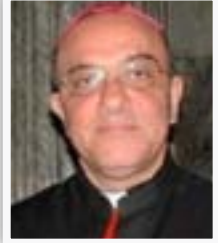
رئيس الطائفة الكلدانية اللبنانية ميشال قصارجي

"أوضاع العراقيين في لبنان يرثى لها، وهم بالنسبة الى الدولة سياح ولا يتمتعون بصفة اللجوء كما هو متعارف على مضمونها في دول العالم، لذلك فهم يعانون الأزميين ريثما يتم ترحيلهم الى الدول الغربية المضيفة بواسطة مفوضية الأمم المتحدة، إن تم لهم ذلك".