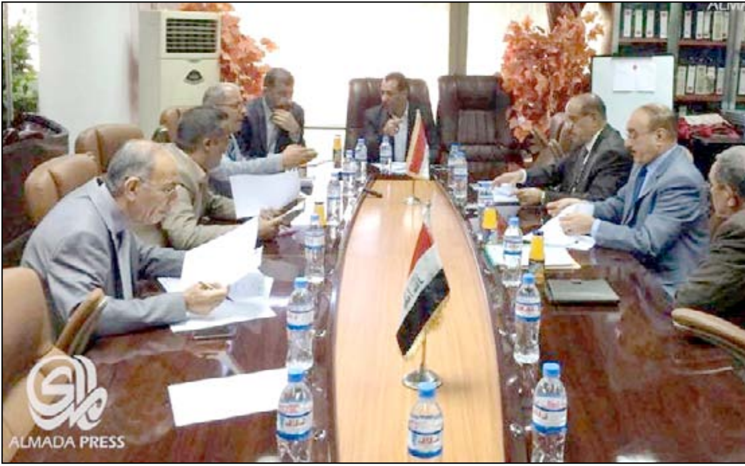
لجنة التحقيق بسقوط الموصل

وتابع عضو اللجنة التحقيقية قانلاً أن الاستدعاء سيتمثل كل من له علاقة بالانهيار الأمني الذي حصل في مدينة نينوى. وستستدعي بعض القيادات الأمنية التي ستسبق حضور قائد عمليان نينوى