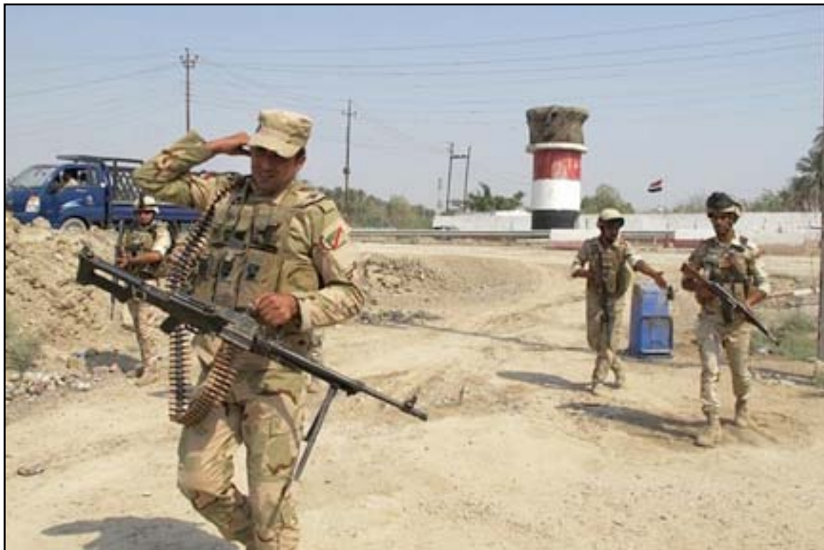
أفراد الجيش في محافظة الأنبار