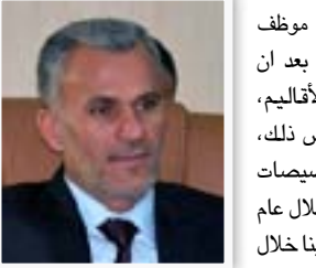
محافظ واسط مالك خلف

"لانا بوزير الصناعة والمعادن كان مشراً من عدة جوانب أهمها ان الوزير أوعز بصرف رواتب العاملين في شركات التمويل الذاتي التي تأخرت أربعة أشهر، إضافة إلى توجيه الوزارات والمؤسسات الحكومية لشراء إنتاج هذه الشركات، ان الوزارة أعدت مقترحات لضما ضمن موازنة ٢٠١٥ لتحافظ على الإنتاج الوطني وتشجيعه لضمان استمرار جميع الصانع والعمال".