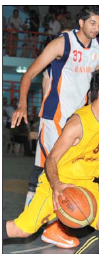
اتحاد الكرة يسرق الأنظار في عمله التنظيمي