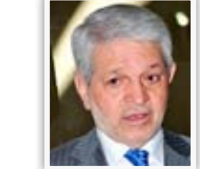
وزير النقل باقر الزبيدي

"العراق حكومة وشعباً حريص على زيادة التعاون ودعوة الشركات الإماراتية المشهود لها بالخبرة والكفاءة للاستثمار في ميناء الفاو وتأهيل المطارات والوانئ، نحن مستعدون لتقديم كافة التسهيلات لهبوط الطائرات في بغداد والنجف والبصرة وكافة مطارات العراق، أن موضوع حادث الطائرة الإماراتية هو عرضي ولا يوجد اي استهداف".