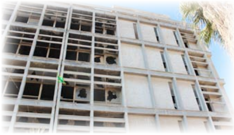
المصرف العقاري في جديد حسن باشا، بغداد، (منتصف الخمسينات)، تفصيل

مناحي الحياة في العراق. (إذ إن مبعوثي تلك الدائرة وهم انكي أنكياء البلاذ، شكلوا عند رجوعهم وإتمامهم دراستهم في ارقى الجامعات العالمية وأكثرها رصانة، طبقة منتورة، أخذت على عاتقها النهوض بالوطن نحو الإنماء والتقدم). كما لا يغيب عن البال الحضور المكثف للسكن في تلك المنطقة المعروفة.