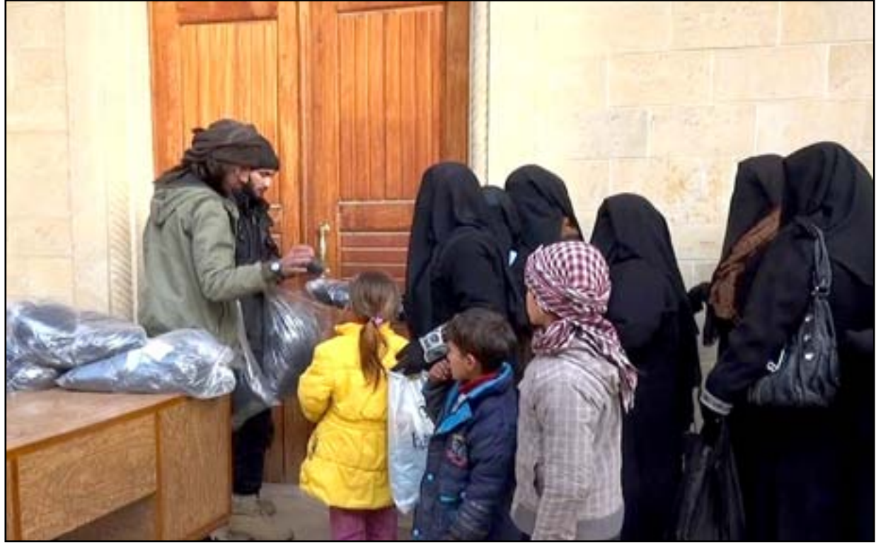
عناصر الحسبة التابعون لتنظيم داعش المتطرف يجبر الموصليات على ارتداء النقاب

الاسلامية". هذا الاستفزاز تتعرض اليه النسوة في الأماكن العامة، سيما بعد انتشار "ظاهرة التثنية بالعصا"، اذ لا يجوز لمس المرأة باليد مباشرة حسب عقديتهم. فمة كثيرات أعلن رفضهن أوامر الحسبة، وعندما اعترض احداهم امرأة خمسينية، انتهبت اليه فعرقت شهيدة!