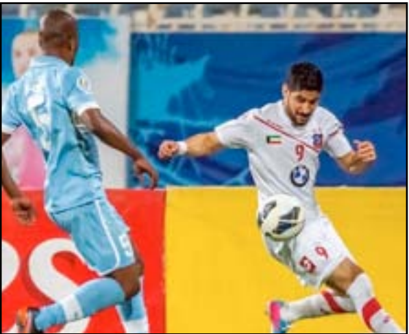
المنامة يتصدر منافسات دوري البحرين ختام المرحلة، فيما تجمد رصيد المالكية عند ٧ نقاط في المركز التاسع قبل الأخير.