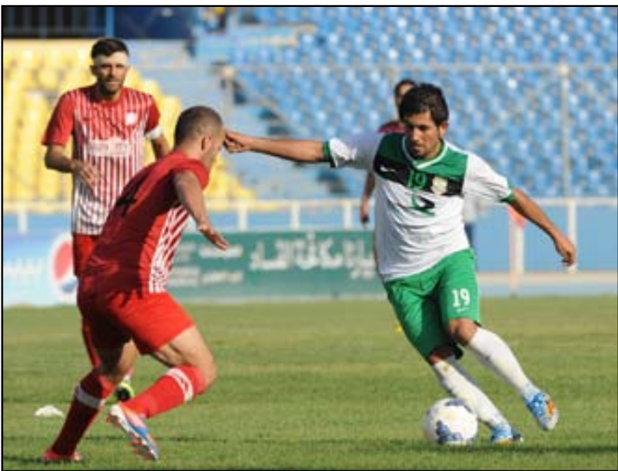
الشرطة يلتقي بغداد لتعزيز انتصارات