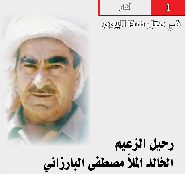
رحيل الزعيم الخالد الملا مصطفى البارزاني

عدد من الشخصيات التي قادت التحرك الكردي للمطالبة بالحقوق القومية، كالشيخ عبد السلام البارزاني. وقد بدأت القيادة البارزانية للثورة الكردية من أوائل الثلاثينات على يد الشيخ أحمد البارزاني بعد انتهاء العهد بحركات الشيخ محمود الحفيد. وفي منتصف ذلك العقد تمكنت السلطة من إخماد الحركة البارزانية الأولى ونفي قائدها وأخوه مصطفى البارزاني إلى خارج منطقتهم، ولم يعودوا إليها إلا في عام ١٩٤١ ليستأنفا الثورة التي شملت مناطق واسعة من كردستان