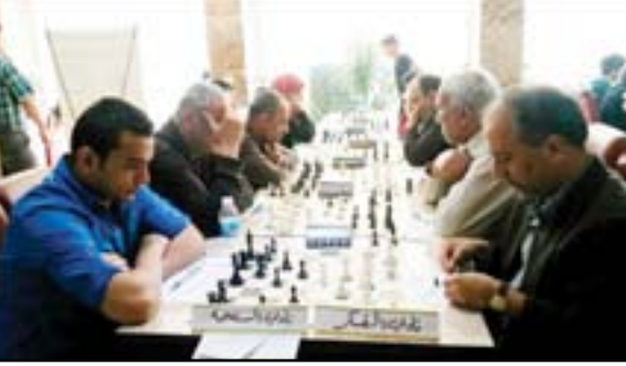
اتحاد الشطرنج يستعد لافتتاح دوري الممتاز

وقال رئيس اتحاد الشطرنج ظافر عبدالامير لـ(المدى): إن المنافسات ستقام على ثلاثة