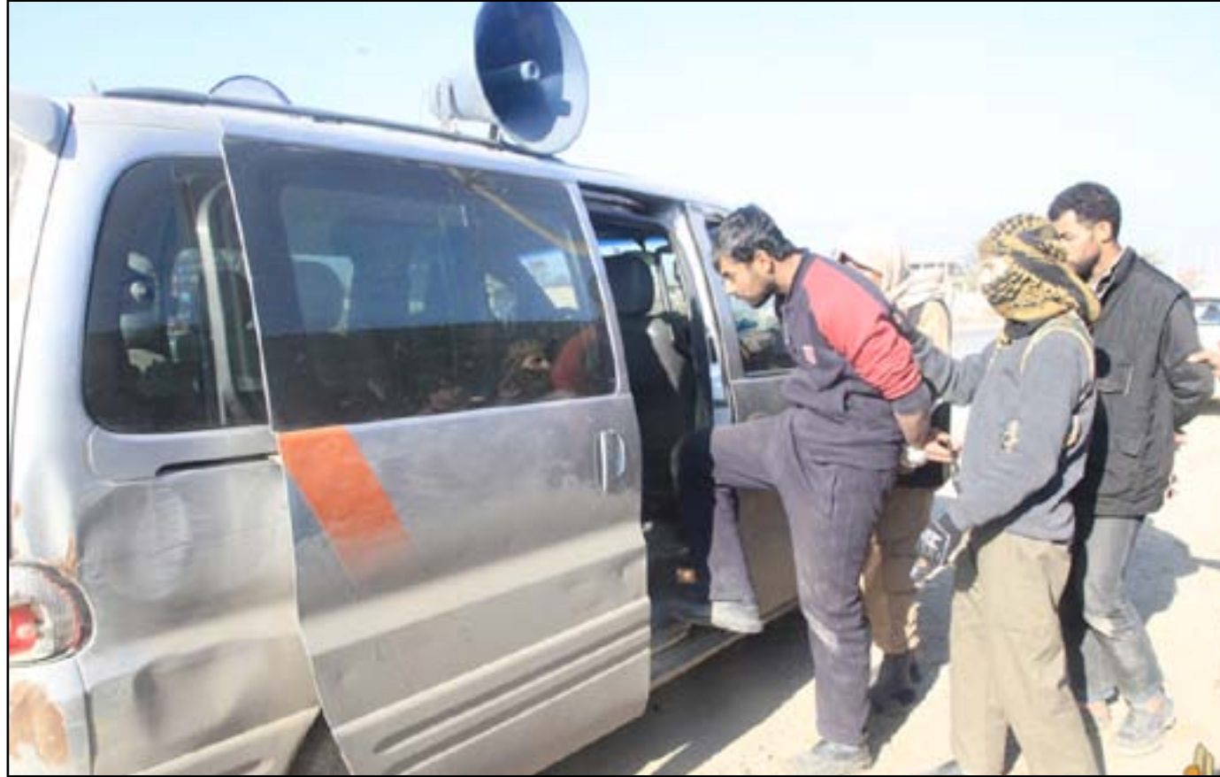
جماعة الحسبة التابعة لتنظيم داعش تعتقل شابا موصليا.. أرشيف

الحاجة إلى وقود للطبخ والتدفئة والاستعمالات الأخرى في هذا الشتاء القاسي البرد تضطر العديد من أهالي مدينة الموصل ولاسيما الفقراء منهم للبحث عن مواد قابلة للاشتعال كالحطب واغصان الأشجار والمخلفات والمواد المتروكة وغيرها بعد أن عجزوا عن شراء المشتقات النفطية التي شحت وارتفعت أسعارها بسبب ظروف مدينة الموصل المعروفة، وفي الوقت الذي يطالب فيه الأهالي الحكومة العراقية والمجتمع الدولي بتوفير الخدمات الحياتية الضرورية بعد التدهور الذي لحقها، يحذر مهتمون من كارثة إنسانية وتلوث بيئي يصيب مدينة الموصل بسبب انعدام وتوقف الخدمات الضرورية ومنها توفر المشتقات النفطية.