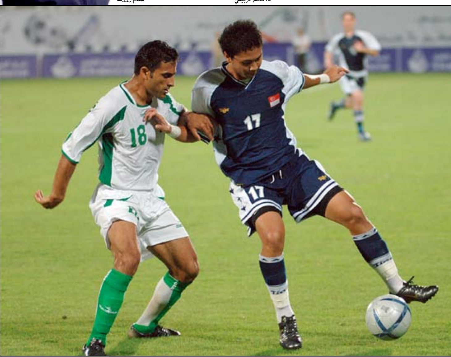
منتخبنا يتربص بانتها أزمة سلمان لبدء رحلة الاعداد