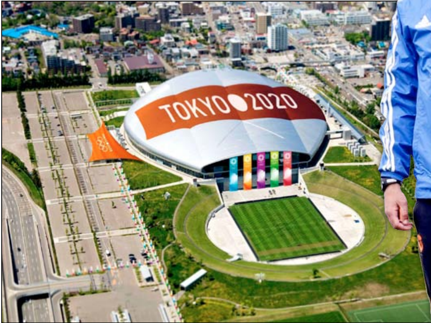
أولمبياد ٢٠٢٠ يشهد تغييرات استراتيجية في ملاعبه