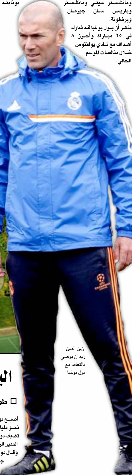
زين الدين زيدان يوصى بالتعاقد مع بول بوغبا

مانشستر سيتي ومانشستر يونايتد وباريس سان جيرمان وبرشلونة. يذكر أن بول بوغبا قد شارك في ٢٥ مباراة وأحرز ٨ أهداف مع نادي يوفنتوس خلال منافسات الموسم الحالي.