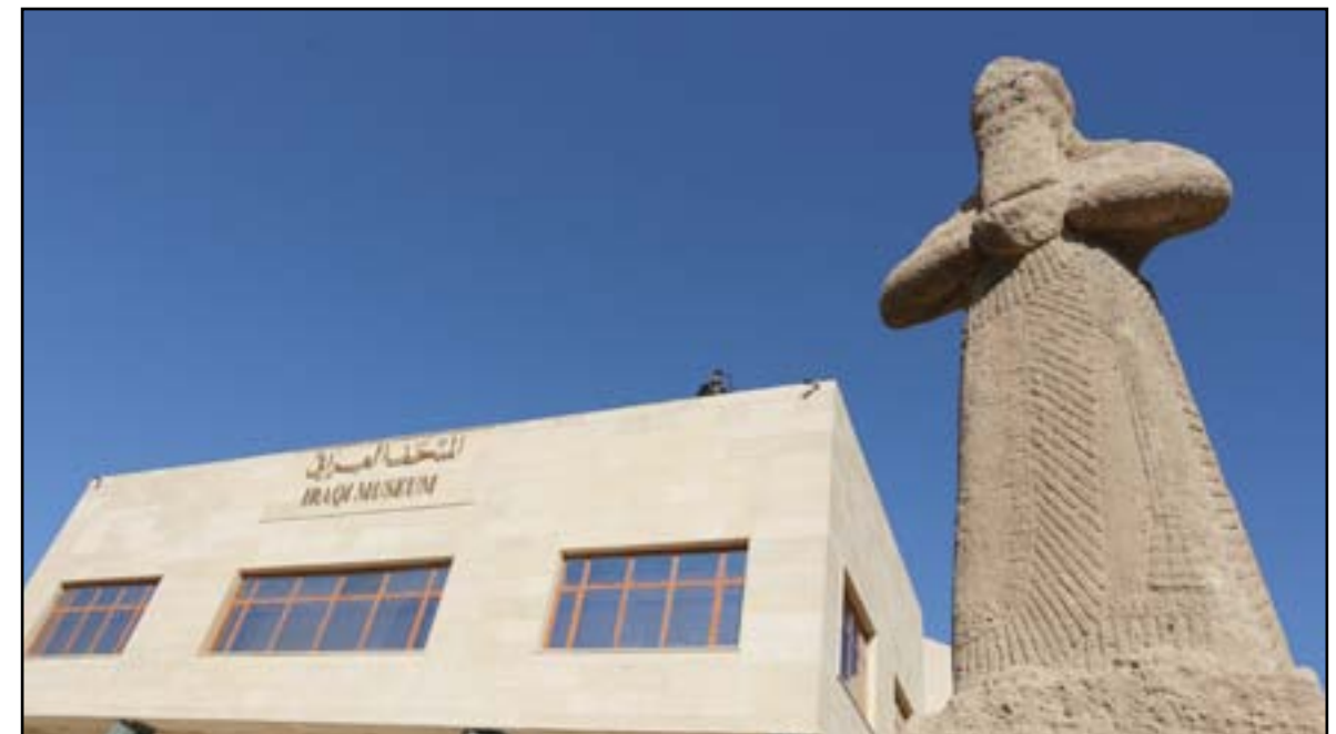
السياحة تفتتح متحف الآثار الوطني ببغداد للزائرين..