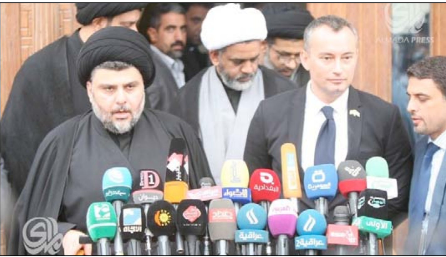
الصدر وميلادينوف في مؤتمر صحفي .. أرشيف

لقرار مجلس الأمن المرقم ٢١٩٩. وكان علماء تنقيب وخبراء آثاريون قد وصفوا حادث تدمير الآثار العراقية بمثابة كارثة كالتى حصلت في العام ٢٠٠١ عندما فجر مقاتلو طالبان تماثيل الباميان بوذا في أفغانستان باستخدام الديناميت. وكان تنظيم (داعش) قد بحث، الخميس، شريطاً مصوراً يظهر تدمير عناصره الآثار الموجودة في متحف الموصل التاريخي، وسط المدينة، (٤٠٥ كم شمال بغداد)، كما يظهر التسجيل تدمير ثور مجنح أضر موجود في "بوابة نركال" الأثرية في مدينة الموصل. ويعد الثور المجنح رمز الحضارة الآشورية التي ازدهرت في العراق وامتدت سلطتها حتى وادي النيل. يذكر أن تنظيم (داعش) قد فرض سيطرته على مدينة الموصل، مركز محافظة نينوى، (٤٠٥ كم شمال العاصمة بغداد)، في (العاشر من حزيران ٢٠١٤ المنصرم)، كما امتد نشاطه بعدها، إلى محافظات صلاح الدين وكركوك وديالى، ومناطق أخرى واسعة من العراق.