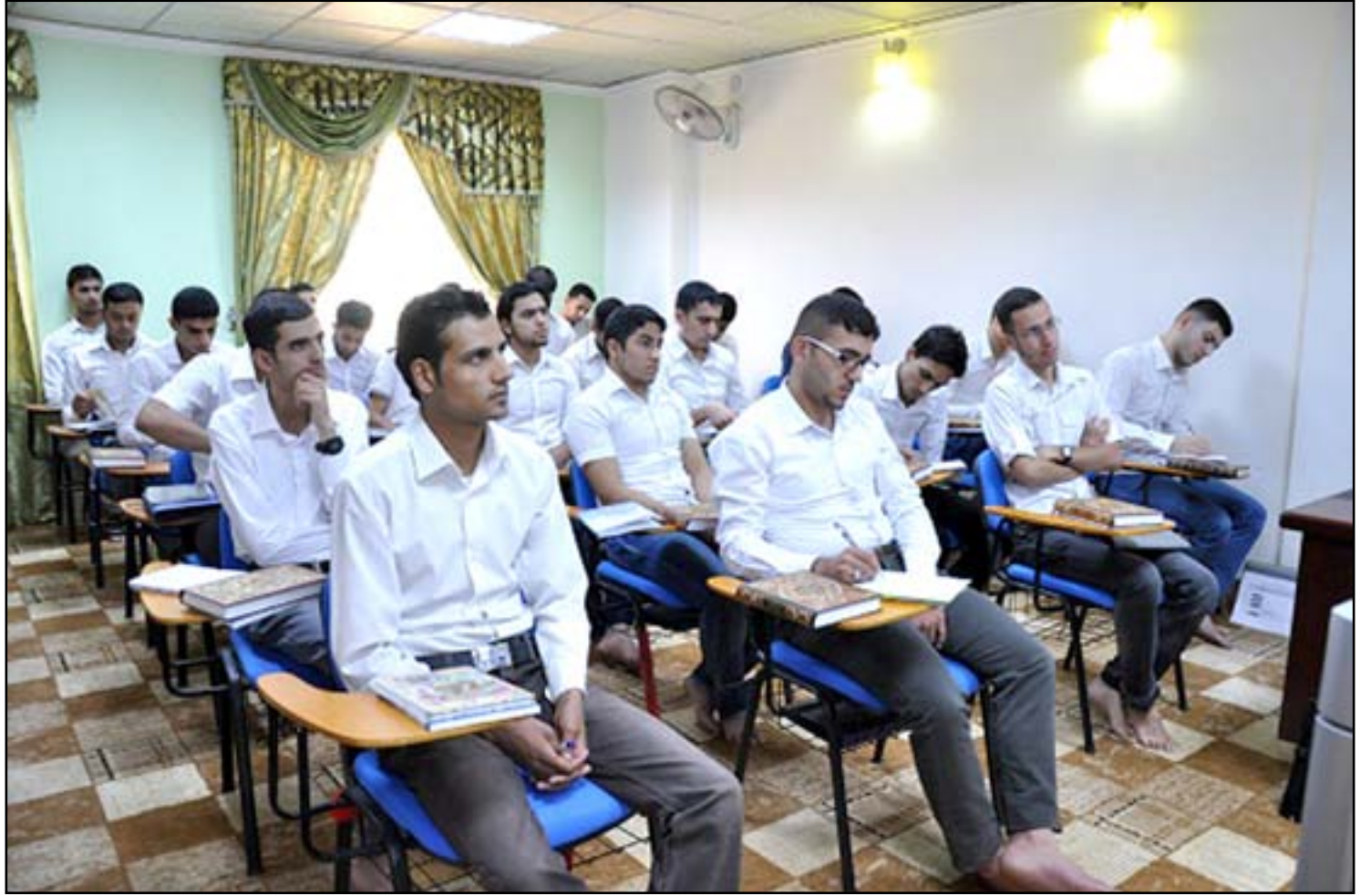
طلبة جامعيون في إحدى جامعات بغداد... ارشيف

ابدى عدد من الاكاديميين وطلبة الجامعات امتعاضهم من "قدم المناهج التدريسية في الكليات"، داعين الى اتباع الطرق الحديثة وادخال المناهج التطبيقية الى الجامعات، وفيما اوضحت لجنة التعليم النيابية ان الاقسام في الجامعات هي التي يجب ان تأخذ على عاتقها تلك المسؤولية، اكدت وزارة التعليم العالي انها شكلت لجنة تحت مسمى (لجنة استحداث المناهج) لتحديث مناهج الدراسات الاولية والدراسات العليا.