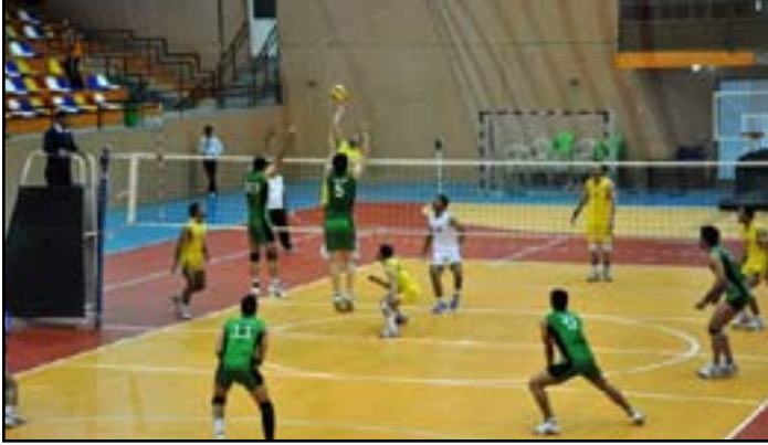
الاتحاد العربي يوقع غرامة على طائفة الشرطة

أخطر الاتحاد المصري للكرة الطائرة نظيره الاتحاد العربي بأسماء الفرق السبعة التي اعتذرت عن المشاركة في البطولة العربية للكرة الطائرة المغامة حالياً بالصلاات المغطاة للمعب القاهرة الدولي يقوم الأخير بتوقيع العقوبات التي تنص عليها اللائحة على هذه الفرق. وقال نور زكي عضو مجلس