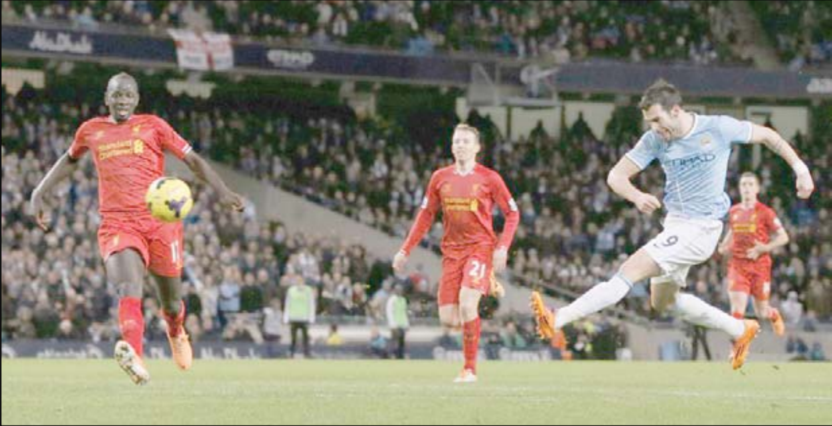
حامل اللقب في مهمة صعبة أمام ليفربول

ومن المؤكد أن مهمة حامل اللقب لن تكون سهلة أمام ليفربول خصوصا أن الأخير يقدم أداء جيدا في الدوري في الأونة الأخيرة وتجسد ذلك بفوزه في المرحلة السابقة على مضيفه ساوثمبتون (٢-٠)، محققا فوزه