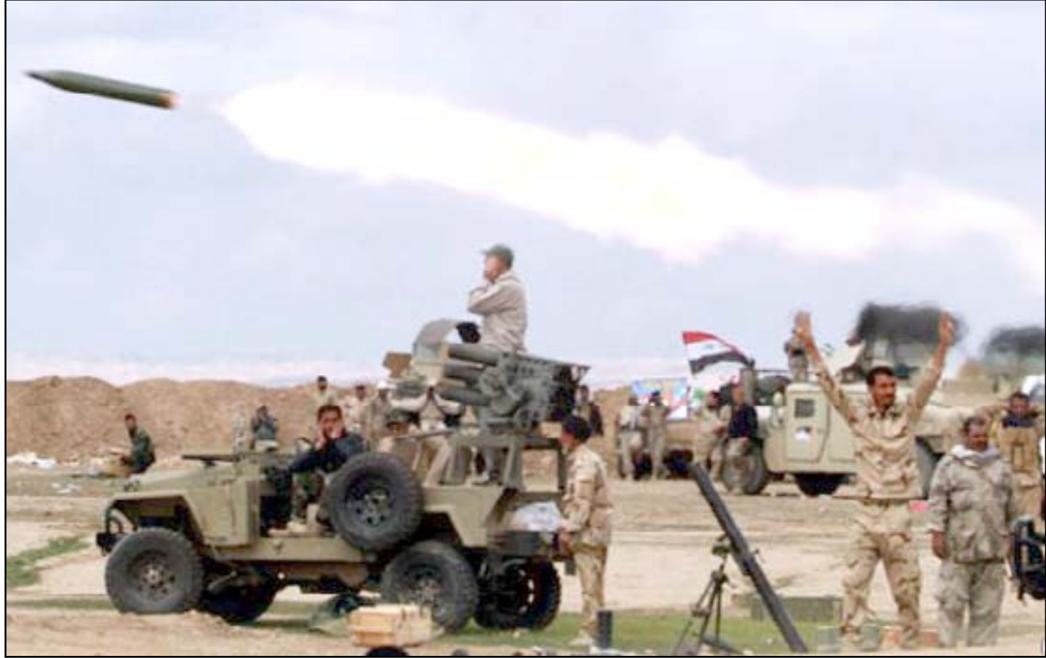
القوات المشتركة قرب تكريت

ويقول وزير الدولة إن "القطعات العسكرية تستعد، خلال الساعات المقبلة، للبدء بتنفيذ الخطة الثانية