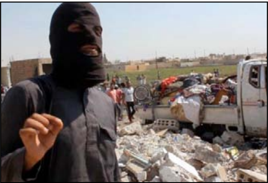
عنصر من داعش في الحويجة

بحق "سارقين"، بحسب ما تقرره محكمته. كما اعدم تنظيم داعش ٢٠ شخصاً مناهضين له في محافظة كركوك في شمال العراق، لنبهتهم الانضمام الى الفصائل التي تقاتل التنظيم، بحسب ما افاد مسؤولون عراقيون يوم الاثنين. ووضح ضابط في استخبارات الشرطة ومسؤولان محليان، ان هؤلاء اعدموا في بلدة الحويجة التي يسيطر عليها التنظيم جنوب غرب مدينة كركوك. وأضافت المصادر ان الذين اعدموا كانوا يعترضون