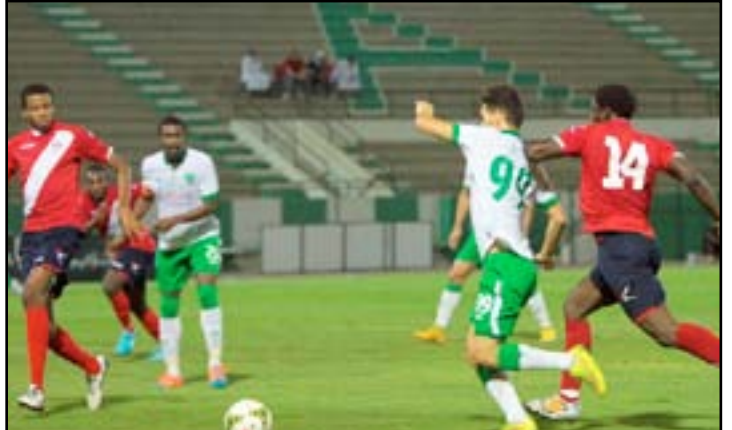
الأهلي يسعى للمحافظة على سجل انتصاراته