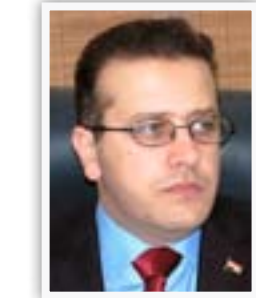
وزير التربية محمد اقبال

أما إذا كان الموظف ضحية اعتداء من موظف آخر، فقال القاضي إن "هناك سياقات إدارية في دائرته،