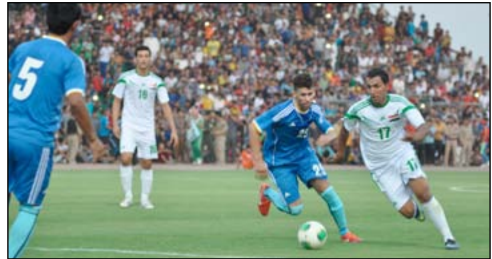
رفع الحظر الدولي أولى مهام اللجنة العليا

والرياضة تلقت (المدى) نسخة منه: أن الوزير استعرض خلال الاجتماع الأخطاء والمعوقات التي رافقت اعمال اللجنة السابقة كما تم مناقشة جملة من القضايا التي تتعلق بمهام كل وزارة من الوزارات.