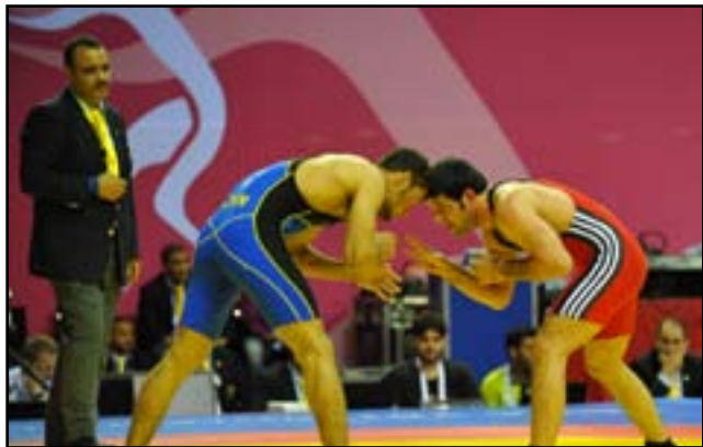
بغداد تحتضن منافسات المصارعة الحرة

انطلقت امس الثلاثاء منافسات بطولة الاندية بالمصارعة الحرة والرومانية للمتقدمين التي تحتضن فعالياتها العاصمة بغداد بمشاركة اغلب اندية المحافظات. وقال عضو اتحاد المصارعة صلاح جبار (المدى): إن انطلاق بطولة العراق للمصارعة الحرة والرومانية للمتقدمين في هذه الفترة تأتي استعدادا وتحضيراً للمشاركة في بطولة آسيا القادمة التي ستقام