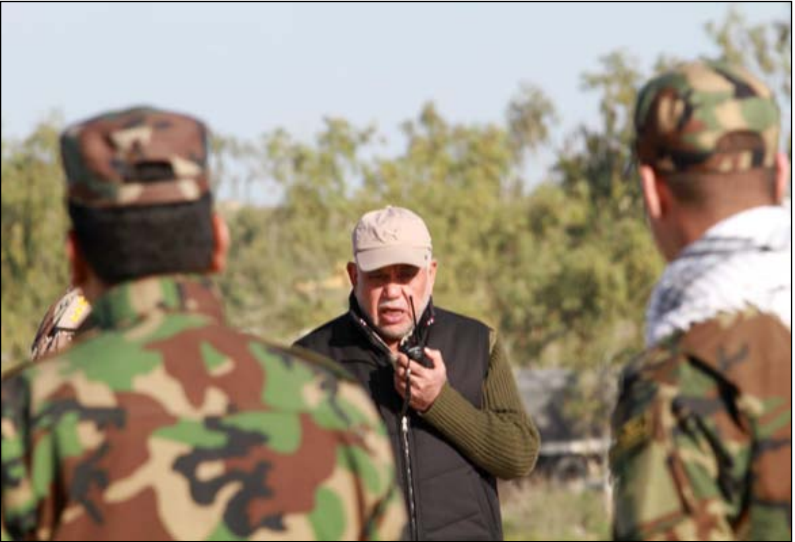
العامري على مشارف ناحية العلم.. (المدى)

وتابع زعيم منظمة بدر "أنا أدافع عن بلدي في ساحات المعركة، وأقول لهم إنني لن أترك ساحات المعركة حتى تحرير آخر شبر من أرض العراق وسأقدم استقالتي إذا كان القانون