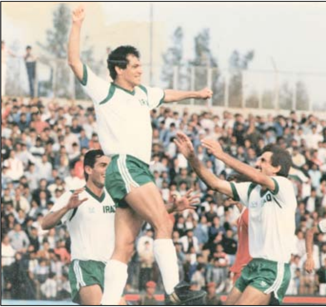
أرشيف تاريخ اللعبة أهم من منجزات المنشئ

سألته عن سر قلقة؟ قال إنه منذ ربع قرن يكتب ويدون ويورخ لإصدار موسوعة عن كرة القدم العراقية منذ دخوله العراق