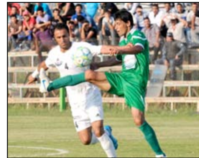
الجولة السادسة تشهد تأجيل اربع مباريات

القوة الجوية والطلبة مع الميناء وأربيل مع الكهراء) مبيناً إن يوم ١٤ آذار الحالي سيشهد اقامة مباراة واحدة بين فريقيه دهوك ونفط