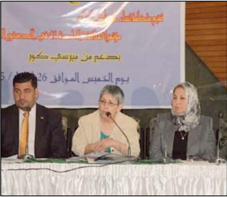
ناشطات يطالبن بتعديل المادة ٤١ من الدستور

وأعلنت وزارة العدل العراقية، الأربعاء ٢٢/١٠/٢٠١٣، عن إنجاز قانوني الأحوال الشخصية الجغرافية والقضاء الشرعي الجعفري وإجالتهمها إلى مجلس شورى الدولة، وأكدت أن المجلس اقتنع بإجالتهمها إلى الأمانة العامة لمجلس الوزراء، وفيما أشارت إلى أنها لم تتطرق من التعصب للعقيدة والمذهب في صياغة القانونين، دعت مجلس الوزراء والكتل السياسية إلى "التعاطي مع القانونين بإيجابية عالية وروحية منفتحة على تقبل الرأي الآخر".