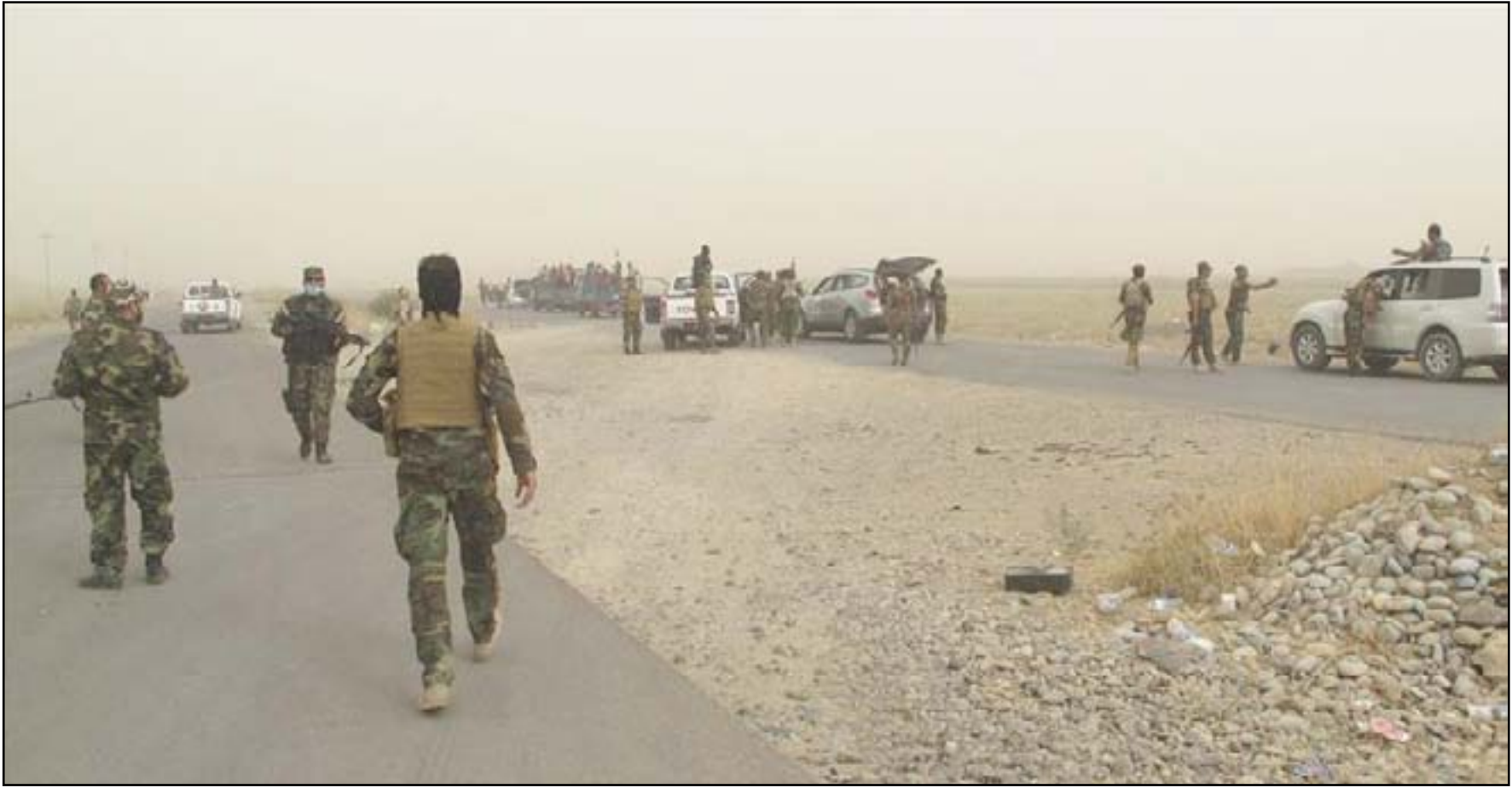
مقاتلون من سرايا السلام في سامراء... أرشيف

سيبعدها الامين العام لمنظمة "بدر" هادي العامري مع عدد من الفصائل لبحث "تدخل التحالف الدولي في الهجوم على تكريت". وأكدت المصادر انه "إذا اصر التحالف والحكومة على هذه المشاركة فإن الفصائل ستسحب من اقتحام تكريت وتوكل المهمة الي الشرطة والجيش دون تعاونها معهم". يأتي هذا في وقت قال جنرال أميركي كبير للكونغرس إن الولايات المتحدة اشتربت من أجل مشاركتها في معركة العراق لاستعادة مدينة تكريت من تنظيم داعش أن تنسحب الجماعات الشيعية المسلحة المدعومة من إيران من عملية التطهير وإن تلك الجماعات لم تعد جزءاً من العملية. وجاءت تصريحات الجنرال لويد أوستن قائد القيادة المركزية للجيش الأميركي التي تشرف على القوات الأمريكية في الشرق الأوسط بعد يوم من بدء التحالف الذي تقوده الولايات المتحدة ضربات في تكريت بعد أسابيع من بقائه على الهامش. ولكن أوستن قال خلال جلسة استماع للكونغرس إن قوات التطهير في المدينة مؤلفة بالكامل الآن من جنود عراقيين وشرطة اتحادية وليس الجماعات الشيعية.