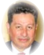
□ د. سيار الجميل

، ومنها ما بطن .. وسيكشف المستقبل عوامل التاريخ الصعب ومدى جناية الآخرين بحق الموصل وبعثهم بها وضرب مجتمعتها وتفريق انسجامه المتميز بتنوعاته وتعددياته .. ومدى جناية البعض من سكانها والنازحين إليها على الموصل وأهلها .. وكيف سقطت المدينة وتشرد أهلها أو هجر الآلاف من أبنائها المسيحيين ظلما وعدوانا ، وكيف هرب الناس من أهلها على حساب هيمنة قوة إرهابية لا يُعرف عنها شيء .. أسقطت الموصل وبددت قوتها وسحقت نفسية رجالها ونسائها والقضاء على خصوصياتهم ونهب أموالهم والسيطرة على مواردهم وقتل رموزهم وسحق آثارهم وتفجير معابدهم وحرق مكباتهم وموجوداتهم ورموز حضارتهم .. ناهيك عما جرى لأبناء المحافظة الكرام من العرب والکرد والترکمان والمسيحيين والإيزيدية والشبك والأرمن وغيرهم من الولايات ..