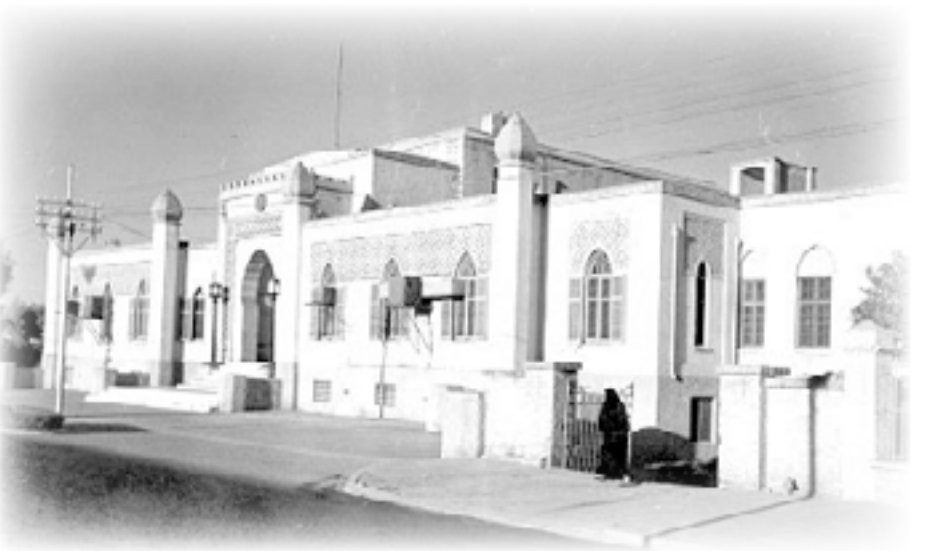
المعرض الصناعي الزراعي باب المظم

كل المهتمين بالعمارة البغدادية في مجال التعاطي مع الظروف البيئية والمناخية والمواد والاستغلال الأمثل لجغرافية المكان حيث الموقع الفريد عند منعرجات نهر دجلة. لقد انتهت تلك الفترة المعمارية إلى مآل حزين وحل محل صرحها المركزي ضريح الملك، كما لو أن القدر أراد أن يقدم درسا في العلاقة بين نهايات الأشياء ونهايات أصحابها.