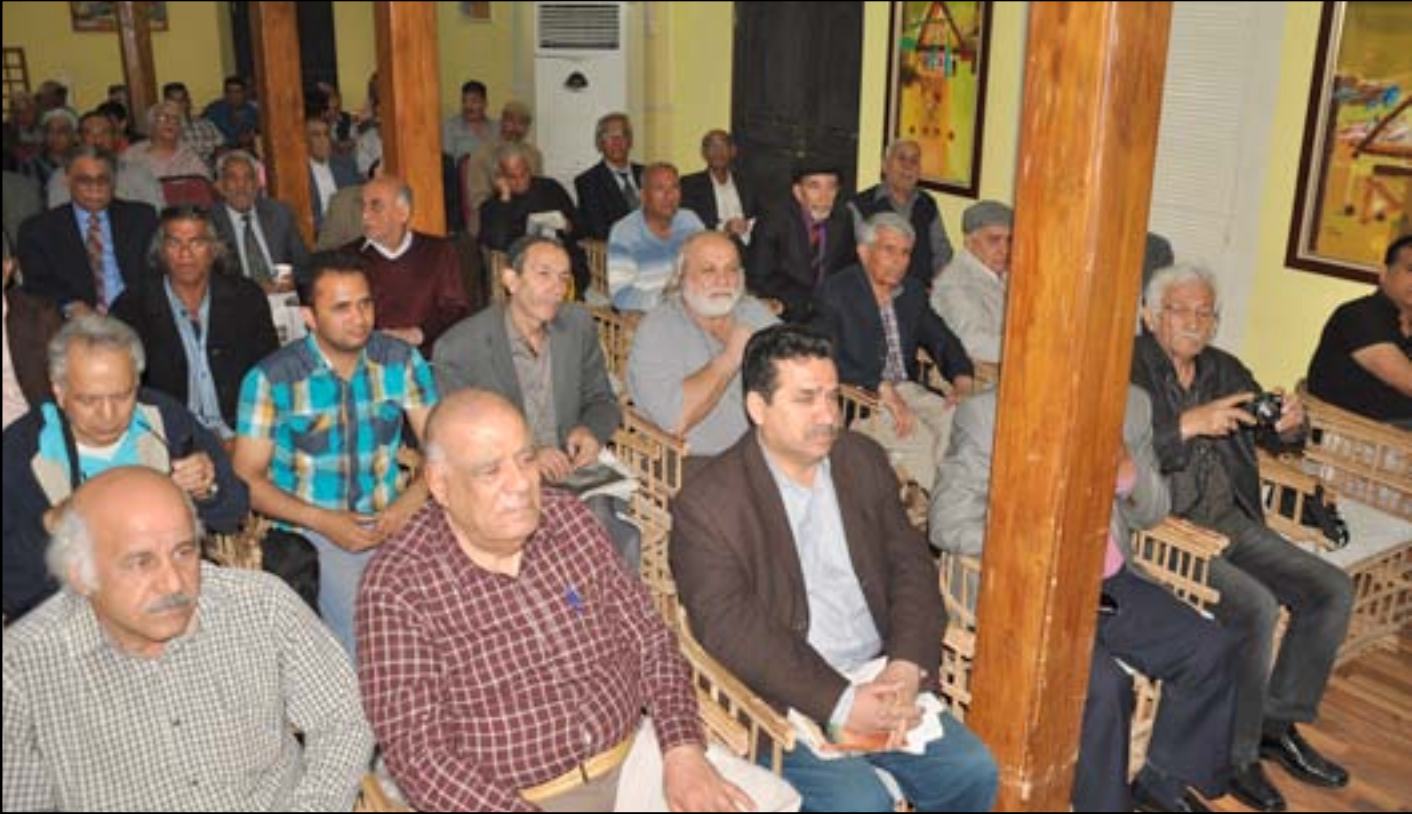
مجموعة من المشاركين في الجلسة