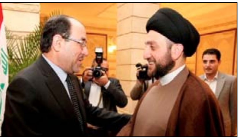
الحكيم والمالكي في لقاء سابق