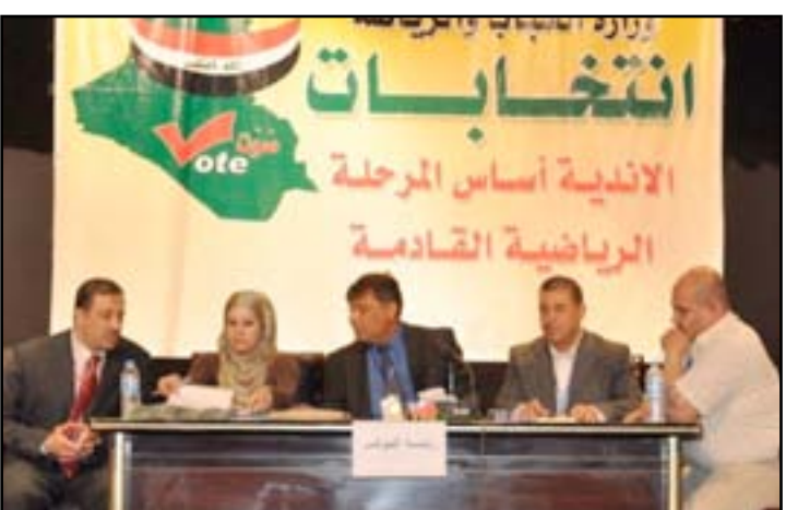
انتخابات حاسمة لاختيار ادارة جديدة لنادي النجف