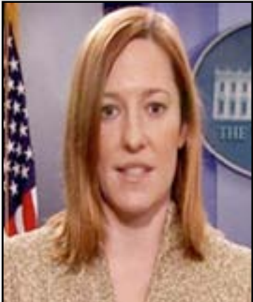
بساكي النفط والغاز وهي البنى التحتية المسؤولة عن تمويل إرهاب داعش، مبيّنة أن "مدربي التحالف شرعوا

ولفتت بساكي إلى أن "التحالف الدولي شن ٢,٩٦٧ ضربة جوية ضد إرهابيي داعش حتى اليوم، منها ١,٦٧٨ ضربة في العراق و١,٢٨٩ ضربة في سوريا"، مشددة على أن "الضربات الجوية كان لها تأثير كبير على داعش، إذ أهلكت الآلاف من مقاتلي التنظيم والعديد من قادتهم، وتدمير ما يقرب من ١,٥٠٠ دبابة وعجلة، وأكثر من ١٠٠ موقع لسلاح المدفعية والهاون، وما يقرب من ٣,٤٠٠ من المواقع القتالية، ومعسكرات للتدريب، ومخابئ في العراق وسوريا". وأضافت بساكي إن "الغارات الجوية دمّرت أيضاً ما يقرب من ٢٠٠ من منشآت