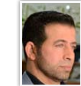
وزير السياحة عادل الشراش