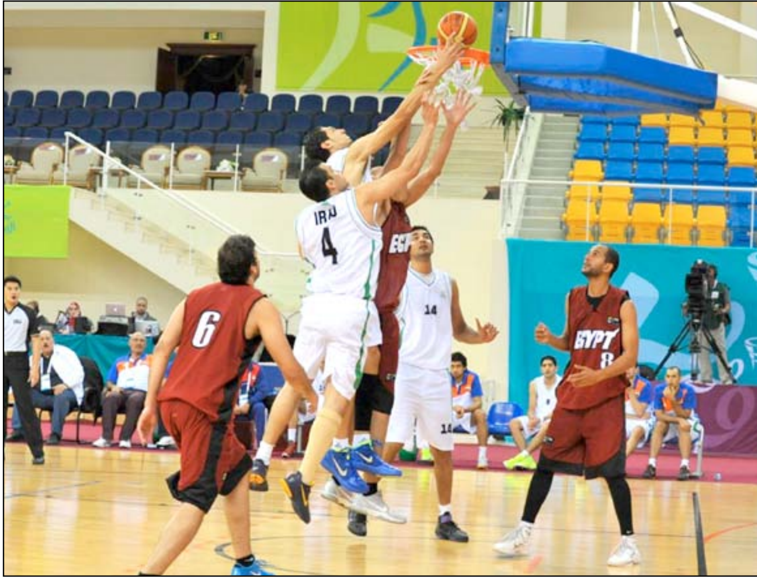
المنتخب الوطني يجني ثمار سكة الممتاز

حددت لجنة المسابقات المركزية في اتحاد الكرة مواعيد ٦ مباريات مؤجلة من الادوار السابعة من المرحلة الثانية للدوري الممتاز حيث ستنطلق في ٦ نيسان باقامة مباراة سر لجنة المسابقات المركزية في اتحاد الكرة فهى العامري لـ(المدى) : ان اللجنة اصدرت مواعيد ٦ مباريات مؤجلة من الادوار الماضية حيث ستقام ٣ منها في ٤ نيسان المقبل ومباراة واحدة في ٥ منه ومباراة واحدة في ٦ وسبتمبر يوم ٩ منه اقامة مباراة واحدة . وأضاف: ان اللجنة قررت اقامة مباراة الشرطة ونقط ميسان واربيل والكهرباء ومصافي الوسط والقوة الجوية في ٤ من نيسان المقبل وبعدها بيوم تقام مباراة الزوراء وكربلاء فيما حددت ٦ نيسان موعداً لإقامة مباراة الطلبة والميناء في حين ستكون أخر المباريات المؤجلة في ٩ من الشهر ذاته بين دهوك وضيعة الشرطة. وأشار العامري الى ان اللجنة حددت مواعيد مباريات الجولة السابعة من المرحلة الثانية للدوري الممتاز حيث ستنطلق في ٦ نيسان باقامة مباراة واحدة بين دهوك وضيعة النفط على ملعب الاول ويعقبه بعد يومين اقامة ٣ مباريات الاولى تجمع نطق الجنوب ونطق الوسط في ملعب الزبيرفي محافظة البصرة والثانية بين زاخو والكهرباء على ملعب دلال والثالثة بين الشرطة والحدود على ملعب الشعب الدولي . وأوضح: ان يوم ٩ نيسان المقبل سيشهد اقامة ٣ مباريات ايضا الاولى تجمع الزوراء مع القوة الجوية على ملعب الشعب الدولي والثانية طرفاها الكهرباء والكرخ والثالثة بين أربيل والمصافي في ملعب فرانسو حرييري .