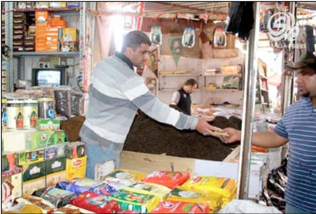
محل في سوق الشورجة