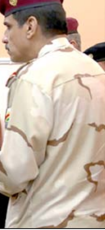
البيادي يتابع تطورات معركة تكريت من سامراء... أ.ف.ب.

ويشير عضو مجلس محافظة صلاح الدين الى ان طيران التحالف قصف عددا من الاهداف المنتخبة، وان الحشد الشعبي لم ينسحب لكن توجد مواقف متباينة لدى