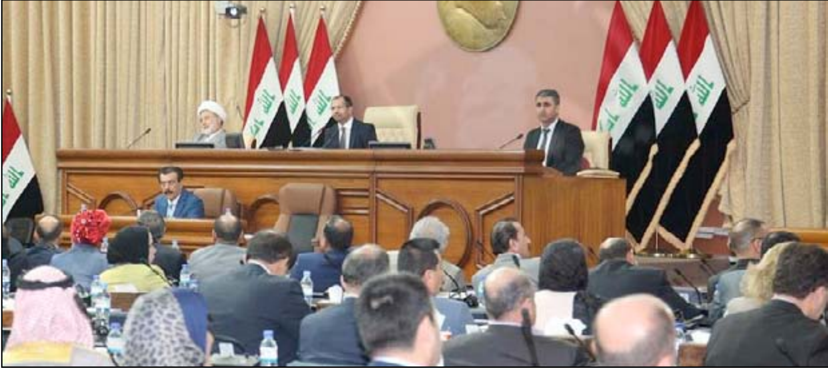
مجلس النواب العراقي

ويؤكد عضو اللجنة المالية البرلمانية ان الموازنة العامة دخلت حيز التنفيذ مباشرة