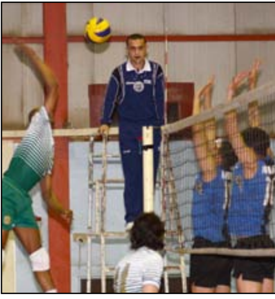
دوري الطائرة الممتاز يدخل المرحلة الأخيرة لمنافساته

ترتيب الدوري الممتاز برصيد ٢٥ نقطة يليه فريق الشرطة في المركز الثاني برصيد ١٨ نقطة