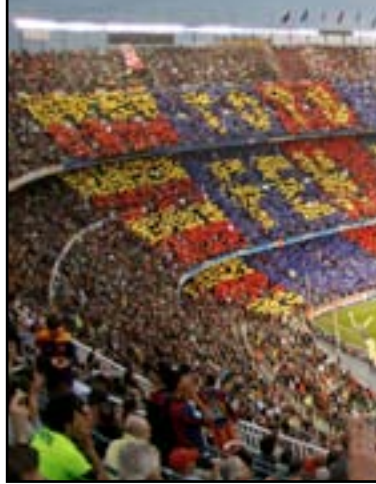
ملعب كامب نو يضيف مباراة برشلونة وبيلباو

ونال الشياخي البطاقة الحمراء مباشرة في واقعة تحدث لأول مرة منذ انتقاله إلى زيورخ منذ ٨ سنوات. ويغيب الشياخي عن لقاء لويزين وبال في الدوري يومي ٤ و١٢ نيسان المقبل وأيضاً أمام سيون في مباراة دور الأربعة ببطولة كأس سويسرا يوم ٧ من الشهر ذاته.