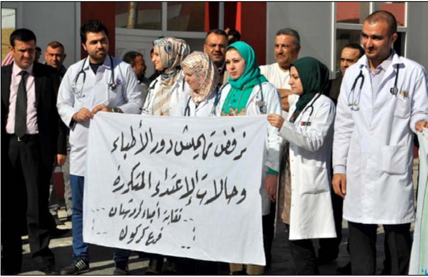
اطبا، يتظاهرون في كركوك ضد الاعتداءات المتكررة... أوشيف

وشدد القانون على عدم جواز "إلقاء القبض أو توقيف الطبيب المقدمة ضده شكوى لأسباب مهنية طبية إلا بعد إجراء تحقيق مهني من قبل لجنة وزارية مختصة"، وعلى معاقبة كل من يدعي بمطالبة عشائرية أو غير قانونية ضد طبيب "بالحبس مدة لا تقل عن ثلاث سنوات وبغرامة لا تقل عن عشرة ملايين دينار"، وعلى تشجيع الأطباء المهاجرين على العودة للوطن.