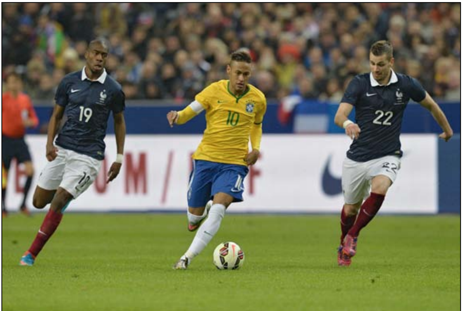
منتخب البرازيل يكتسح فرنسا بثلاثية

منح فاران التقدم لأصحاب الأرض في الدقيقة ٢١ حين تابع برأسه كرة من فالويونا في الزاوية اليمنى لمرمي جيفرسون، ضغط البرازيليون وسنحت لهم بعض الفرص عبر نيمار وفيرمينيو، إلى أن نجحوا في إبرك التعادل حين مرر الأخير كرة إلى أوسكار الذي تابعها بقدمه اليسرى في الشباك قبل نهاية الشوط الأول بخمس دقائق.