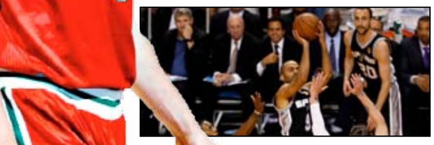
أحرز إرسان إلياسوفا أفضل رصيد نقاط في مباراة طيلة مسيرته، حيث سجل ٣٤ نقطة لفريقه ميلووكي باكس، لينجح في قيادته لفوز ثانٍ على التوالي للمرة الأولى منذ أكثر من شهر بانتصاره ١١١-١٠٧ على خصمه إنديانا بيسرز في دوري كرة السلة الأمريكي للمحترفين . أحرز إلياسوفا ٥ رميات ثلاثية

ونجح في ١٢ من أصل ١٤ رمية ثنائية واستحوذ على ٦ كرات مرتدة ومررتين حاسمتين . والفوز هو رقم ٣٦ لباكس هذا الموسم مقابل عدد الهزائم نفسها ليجتدل المركز السادس في القسم الشرقي بينما خسرت بيسرز للمرة ٤٠ مقابل ٣١ انتصارا للبتعد عن المركز الثمانية المؤهلة للأدوار الإقصائية.