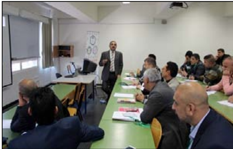
اتحاد القادة يناقش شمول الصحفيين بقانون الرواد

يُقيم الاتحاد العراقي لإعداد القادة الرياضيين بالتعاون مع اتحاد الصحافة الرياضية في الساعة ١١ من صباح اليوم السبت في فندق بغداد ورشة عمل لمناقشة تشريع تعديل جديد لقانون الرياضيين الإبطال والرواد يسمح بضم رواد وشهداء الصحافة الرياضية وشمولهم بقانون رعاية الرياضيين الإبطال والرواد الذي يتضمن المنح والامتيازات، وتم توجيه الدعوات الى مسؤولين في المؤسسات الرياضية وبرلمانيين وخبراء ومشاورين قانونيين بهدف اغناء الورشة بالمعلومة القيمة والفائدة المرجوة التي ستمنح الزملاء الصحفيين فسحة من أجل المناقشة والاستفسار وطرح الاسئلة لاسيما وان الصحفي والإعلامي الرياضي ضمن المنظومة الرياضية التي تم انصافها بقانون رقم ٦ الخاص بمنح الإبطال الرياضيين والرواد. ووضع اتحاد القادة الرياضيين برنامج عمل لتطبيق اتفاقية التعاون المبرم مع الاتحاد العراقي للصحافة الرياضية ودخولها حيز