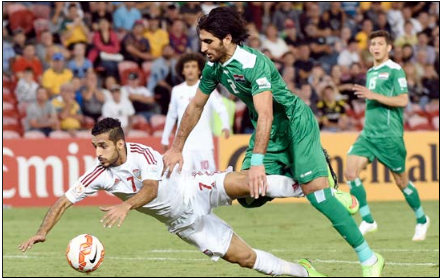
منتخبنا يتطلع لتحقيق فوز معنوي على الكونغو الديمقراطية