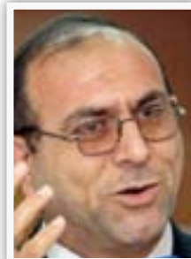
وزير حقوق الانسان محمد البياتي

"إن موازنة ٢٠١٥ التي تم التصويت عليها، تضمنت تخصيص الوزارات نسبة ٥٪ من مجمل درجاتها الوظيفية لحملة الشهادات العليا الماجستير، والدكتوراه، والدبلوم العالي)، نشدد على ضرورة الالتزام بالنسبة التي تم تحديدها في بنود موازنة هذا العام ووضع ضوابط تحقق مبدأ تكافؤ الفرص لهذه الشريحة المهمة".