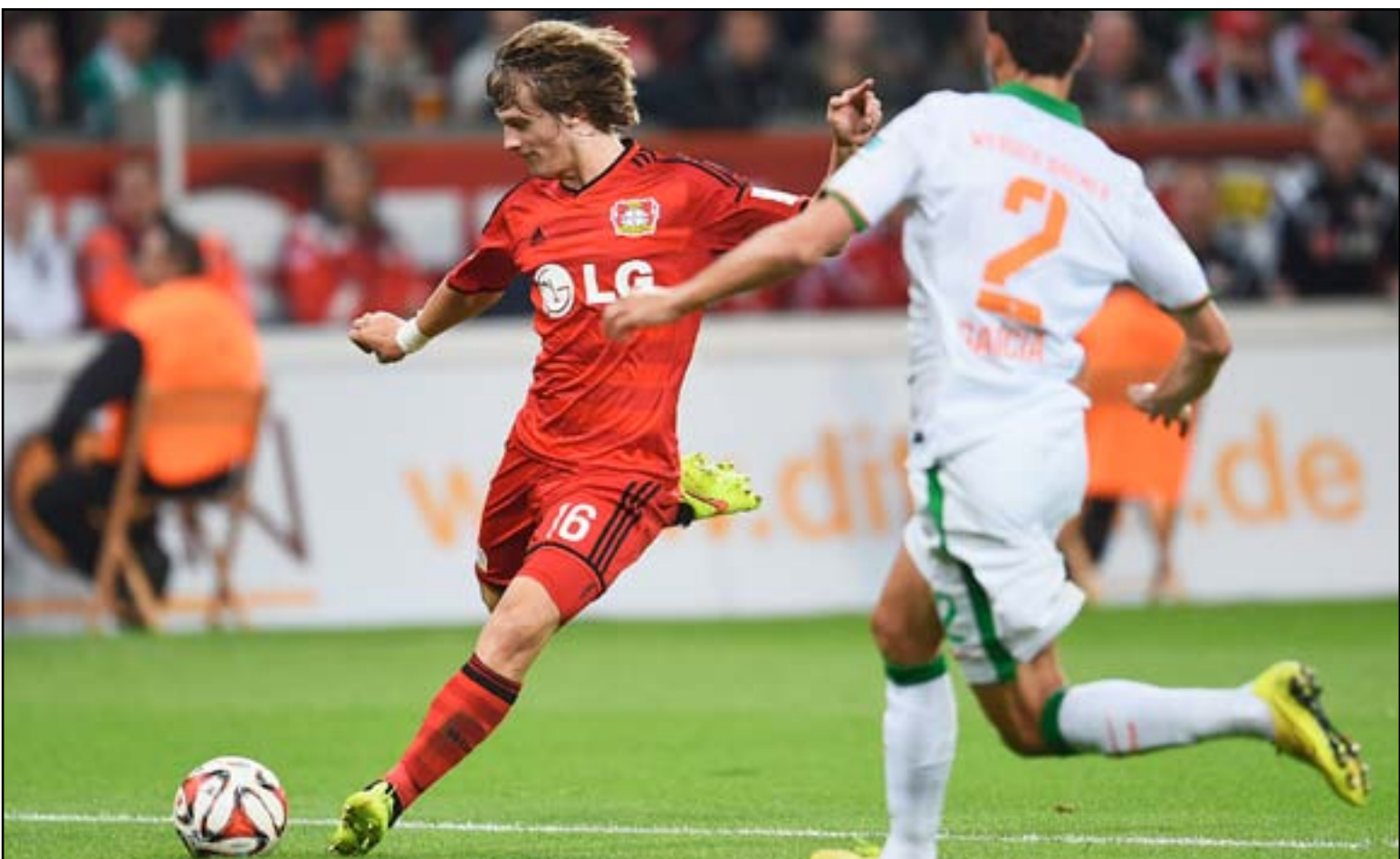
مواجهة ثأرية لليفركوزن مع البايرن رداً لخسارته في البوندسليغا

ويطلع اليوم الأربعاء بوروسيا مونشنغلاذباخ ثالث الدوري مع مضيفه أرمينيا بيليفيلد من الدرجة الثالثة الذي أقصى فيرير بريرمن من ثمن النهائي بفوزه عليه ٣-١. وتبدو كفة بوروسيا مونشنغلاذباخ راجحة لتحقيق الفوز بالنظر إلى الفوارق الكبيرة بين الفريقين وكذلك إلى كونه فاز على مضيفه ٧ مرات في المباريات الثمان الأخيرة بينهما