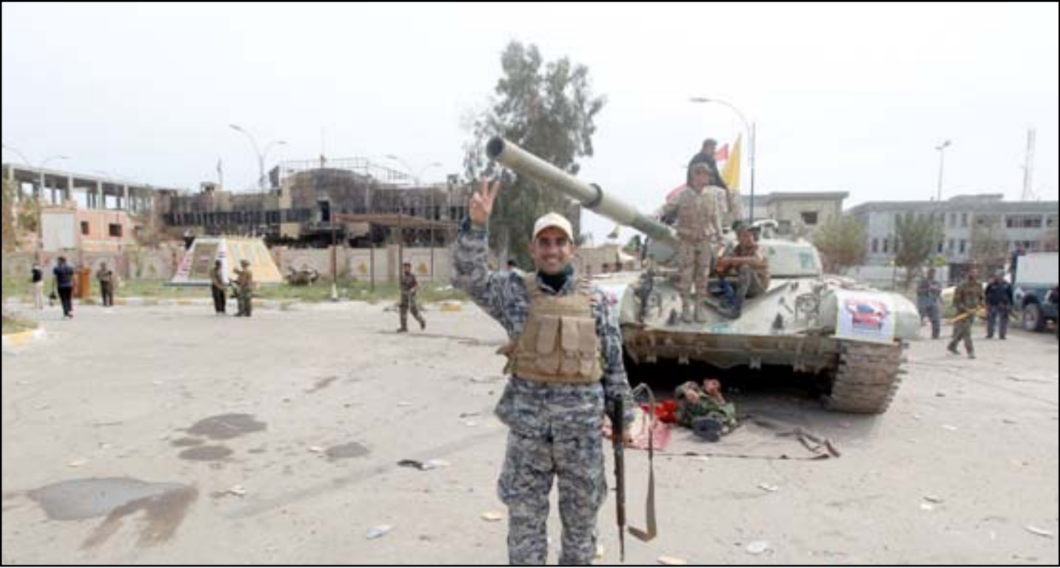
الحشد الشعبي في تكريت

تقول النخب السياسية في تكريت، مركز محافظة صلاح الدين، اليوم انها تجد معنى جديداً لـ"توسيع صلاحيات" الحكومة المحلية والمشاركة في صنع القرار السياسي والامني مع المركز، بعد ان اكتشفت ان "العناد السياسي" والتجاهل الذي مارسته الحكومة السابقة ضدها، قد تسبب في سقوط اغلب بلدات المحافظة خلال ساعات بيد "داعش" في حزيران الماضي، قبل ان يعاد تحريرها قبل اسبوع.