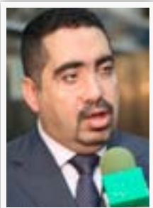
وزير البيئة قتيبة الجبوري

"إن لجنة حقوق الانسان النيابية استمعت الى مهام الدائرة ونشاطاتها المتغلطة بحق الانسان والشكاوى والخروقات التي تؤثر على العراقيين خارج العراق فضلاً عن الأجنبي داخله، ان أعضاء اللجنة اكورا على ضرورة متابعة نشاطات حقوق الانسان مع السفارات والوزارات المعنية، كوزارة حقوق الانسان والفوضية العليا لحقوق الانسان ولجنة حقوق الانسان في مجلس النواب".