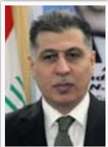
النائب أرشد الصايحي

"إن لجنة حقوق الانسان النيابية استمعت الى مهام الدائرة ونشاطاتها المتغلطة بحق الانسان والشكاوى والخروقات التي تؤثر على العراقيين خارج العراق فضلاً عن الأجنبي داخله، ان أعضاء اللجنة اكورا على ضرورة متابعة نشاطات حقوق الانسان مع السفارات والوزارات المعنية، كوزارة حقوق الانسان والفوضية العليا لحقوق الانسان ولجنة حقوق الانسان في مجلس النواب".