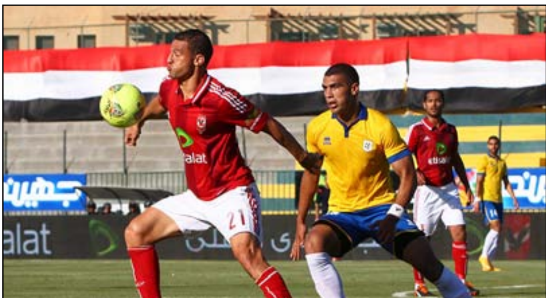
عودة المباريات المثيرة في الدوري المصري

تشهد المرحلة الرابعة والعشرين من الدوري المصري قمة نارية بين الإسماعيلي السابع والأهلي الثالث وحامل اللقب اليوم الأربعاء على ملعب الجونة. يعود الدوري من جديد بعد توقفه لمشاركة أندية الأهلي والزمالك وتبروجيت وسموحة في مسابقتي دوري أبطال أفريقيا وكأس الاتحاد الأفريقي. وتكتسي مباراة الإسماعيلي والأهلي أهمية كبيرة حيث يسعى دراويش الكرة المصرية (٣٢ نقطة) لحصد نقاط الفوز التي ستؤمن لهم العودة إلى المربع الذهبي والمنافسة على اللعب في إحدى المسابقتين القاريتين، فيما يبحث الأهلي (٣٩ نقطة) عن المحافظة على حظوظه بالاستمرار في الدفاع عن اللقب.