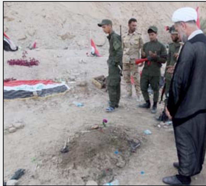
مقبرة تضم رفات قتلى سبايكر في تكريت.

ويذكر أن المفوضية العليا لحقوق الإنسان أعلنت، الأحد، أن قوة أمنية مشتركة اكتشفت أربع مقابر جماعية في منطقة القصور الرئاسية في تكريت، مبيّنة أن