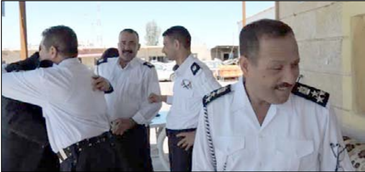
منتسبو المرور يعيدون لتكريت لزاولة وظيفتهم

الدائرة واصلوا العمل من اجل تمشية أمور المواطنين وأنجزنا اكثر من ٦٠٠ معاملة نقل ملكية إضافة إلى مباشرة المفارن عملها في مناطق الدور والعلم وتكريت".