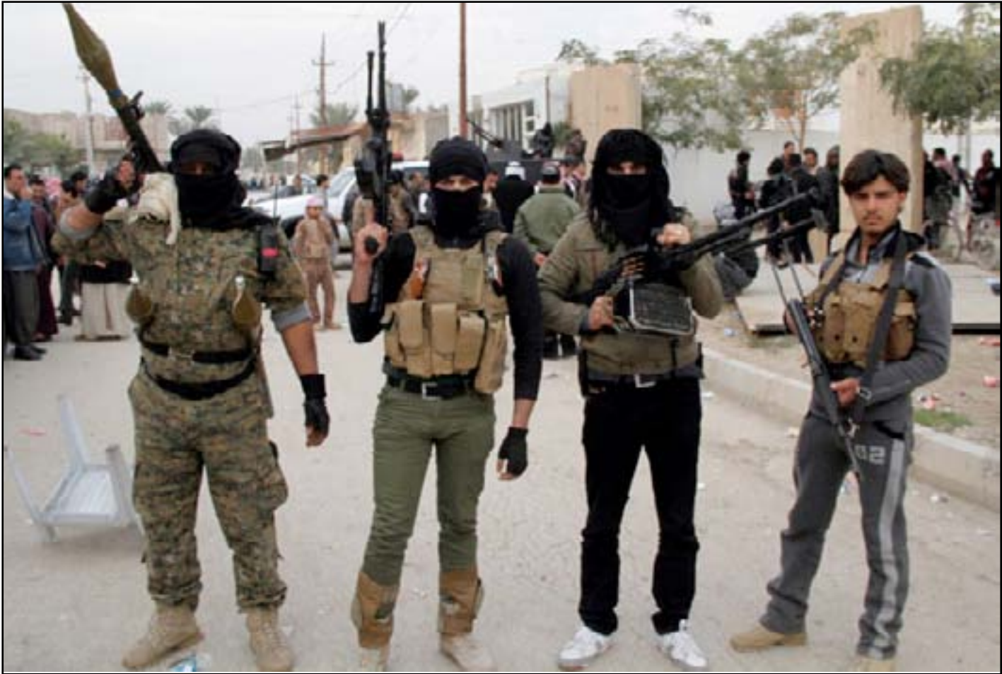
مقاتلو العشائر في الأنبار.. أرشيف

ويعتقد المحللون أن أعضاء في حزب البعث قد ساعدوا المتطرفين. أما العشائر السنية القليلة التي تصدّت لداعش فقد دفعت ثمنها باهظاً، حيث ضُمت مقبرة جماعية في بلدة الدولية في محافظة صلاح الدين رفات 150