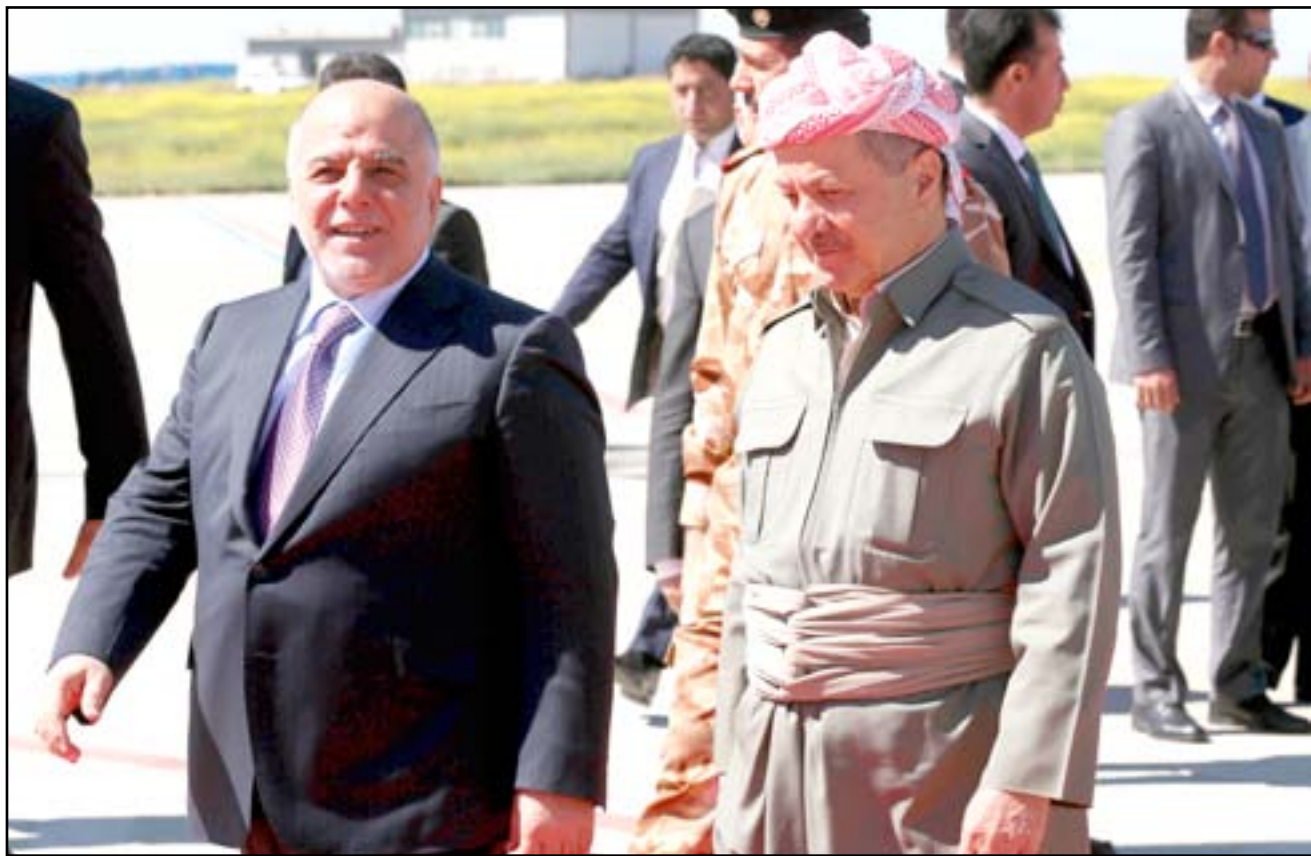
العبادي وبارزاني في مطار أربيل الدولي.

ويؤكد السعدون بأن "الله الكبير الذي يشغل كل الاطراف في الظروف الراهنة يتمثل بتحرير جميع المحافظات الغربية من