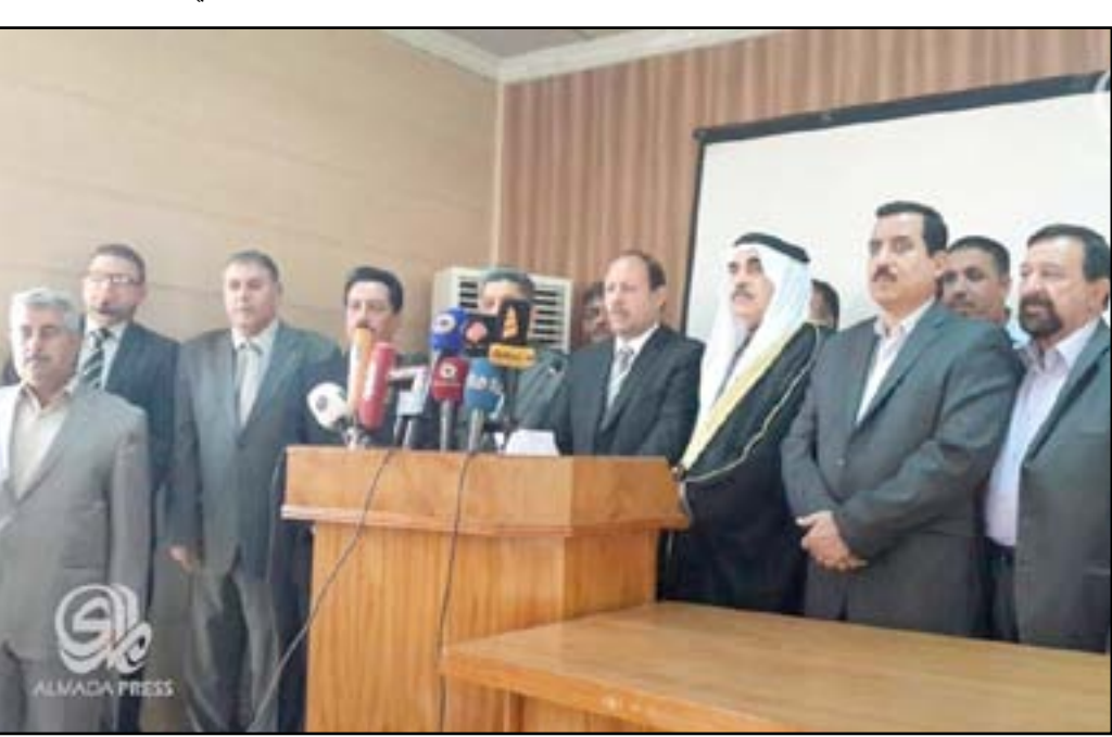
مسؤولو صلاح الدين خلال مؤتمر صحفي

وكانت وسائل إعلام محلية وعالمية، تناولت في تقاريرها مؤخراً، حدوث عمليات "سلب ونهب" في مدينة تكريت بعد تحريرها من قبل بعض عناصر القوات الأمنية والحشد الشعبي، فيما عزت هيئة الحشد الشعبي وحركة (أهل الحق)، تلك الاعمال إلى "قارات" عشائرية.