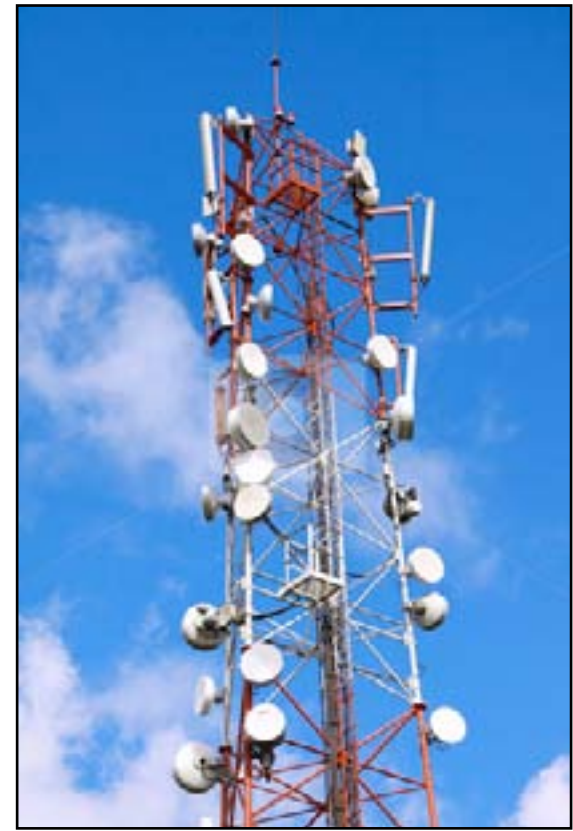
البيئة تحذر من نصب الابراج اللاسلكية عشوائياً.. ارشيف