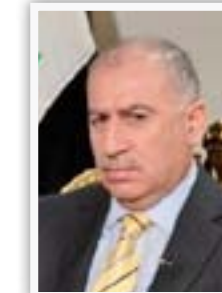
نائب رئيس الجمهورية أسامة النجيبى

"بحثنا مع محافظ ذي قار عدداً من المواضيع التي تخص مؤسسات الوزارة في المحافظة حيث ناقشنا مع المحافظ موضوع منح صلاحيات إدارية لقيادة شرطة المحافظة، كما شيد بالتنسيق العالي بين المحافظة وقيادة الشرطة التي أسهمت في جعل الناصرية من المحافظات المستقرة أمنياً. إن الداخلية لم تغفل دورها الخدمي في خدمة المواطنين في دوائر المرور والجنسية والحوارات ومشروع البطاقة الوطنية".