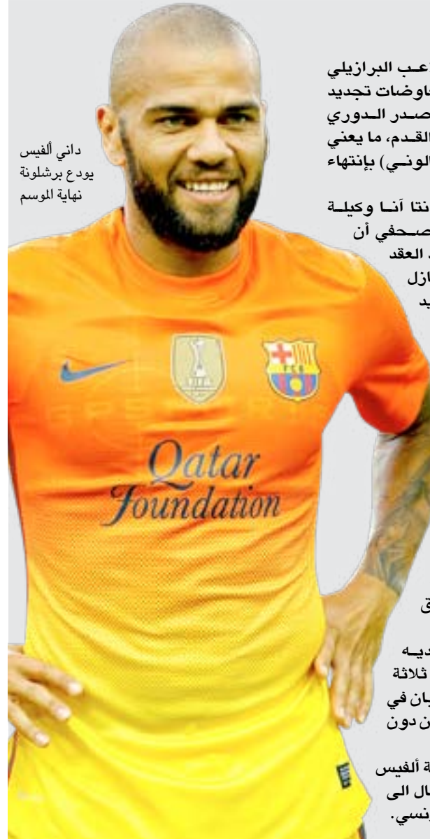
داني ألفيس يودع برشلونة نهاية الموسم

وشارت دينورا الى أن "ألفيس يشعر بالحنن، لأن النادي لو عرض عليه التجديد لموسمين مع احتمالية البقاء لموسم ثالث لوافق على الفور". كما أكدت أن "ألفيس لديه عرضان، مدة كل منهما ثلاثة مواسم، من نايمين يلعبان في دوري ابطال أوروبا" ، من دون الإفصاح عن اسميهما. وربطت التقارير الصحفية ألفيس في الآونة الاخيرة بالانتقال الى باريس سان جيرمان الفرنسي.