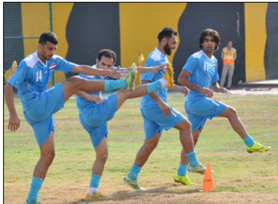
الأسود بحاجة الى التجانس والعمل الجمعي

يجب ان يعلم الجميع بأن الهدف من الممكن تحقيقه اذا كانت هناك ارادة واصرار واخلاص ونيات صافية وتفان في العمل من دون التركيز كثيراً على المشوار الطويل من التصفيات والمباريات وعلى قوة ومكانة الفرق التي سنلاعبة ويجب على الملك التدريبي دراسة وتحليل كل السيناريوهات المتاحة والمتوقعة والظروف الصحاحية للفرق المنافسة التي بالنهاية قد تخدم طموحات الفريق وتطلعاته ومستقبله وان يكون ملماً بالكثير