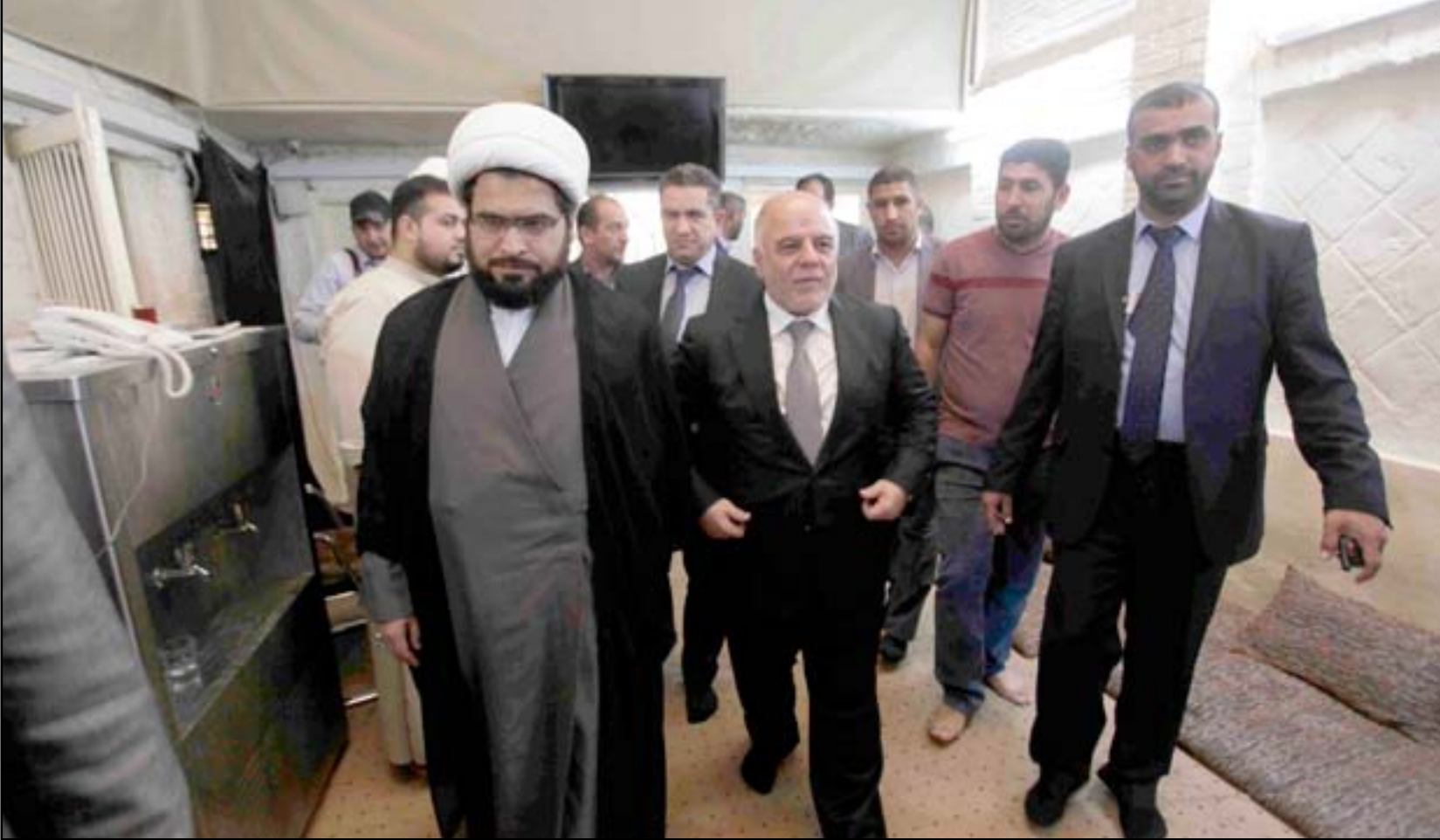
العبادي والشيخ النجفي أمس

وأشار العبادي إلى أن "الهيئات المستقلة هي هيئات مستقلة عن الحكومة والبرلمان وتدير نفسها بنفسها ضمن قواعد معينة"، مشدداً على ضرورة أن "تبقى هذه الهيئات مستقلة وبعيدة عن