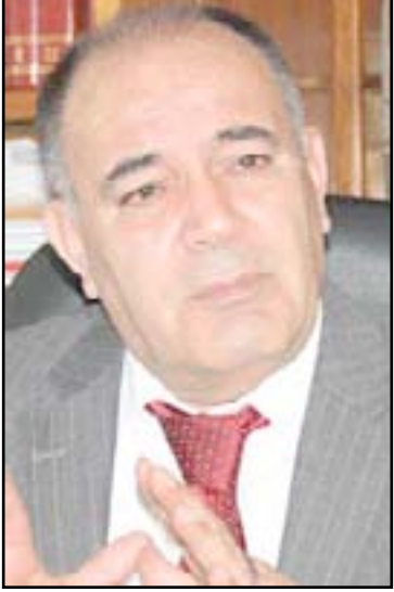
سعدى أحمد بيره

من بين الشخصيات السياسية والاجتماعية التي زارت معرض أربيل الدولي للكتاب واطلعت على ما معروض من اصدارات حديثة لكتب ودراسات وبمختلف اللغات عضو المكتب السياسي للاتحاد الوطني الكردستاني سعدى احمد بيره، الذي أثنى على جهود مؤسسة المدى في الاستمرار باقائه وتنظيم المعرض، مبدياً إعجاب به بزيارات طلاب المدارس للمعرض، كما عرج الى خسارته مكتبته الأولى في أحداث ١٩٩١ والثانية في أوروبا، وقال بيره ان أربيل أصبحت مركزاً مهماً للمعارض ومعرض الكتاب خاصة، وان إقامة المعرض في ظل هذه الظروف خطوة مهمة وموفقة، شاكرًا مؤسسة المدى على حرصها الدائم في تنظيم هذا الكرنفال الثقافي.