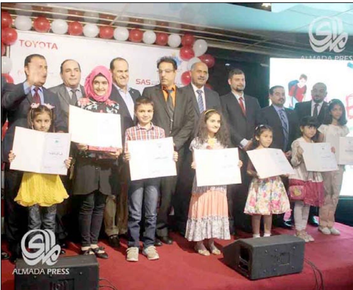
اطفال عراقيون شاركوا في رسم التصميم الجديد لسيارة تويوتا

أعلنت وزارة التربية عن مشاركة أطفال عراقيين في تصميم الشكل الجديد لسيارة تويوتا للعام المقبل عبر رسوماتهم الخاصة، وفيما بينت أن هذه التجربة تعد الأولى مع الشركة اليابانية، أكدت شركة تويوتا أن الاطفال العراقيين سيشاركون مع أطفال 80 بلداً آخر لاختيار التصميم الجديد لسيارتها على أن تجري التصفيات النهائية في طوكيو، فيما أيدت طفلة عراقية فازت في الرسومات الأولى للسيارة رغبته في صناعة سيارة تتحمل "وزن الفيل".