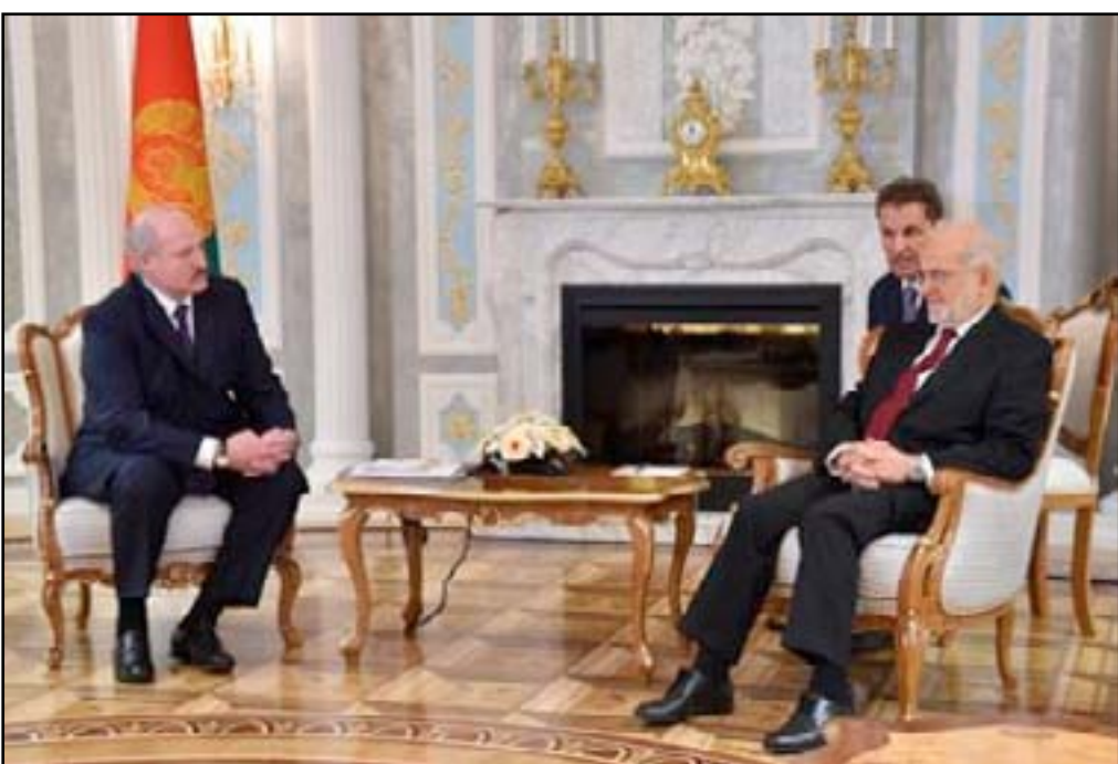
لقاء الرئيس البيلاروسي والجعفري

وذكرت وكالة بيلتا أن "وزارة الشباب والرياضة العراقية وقعت منذرة تفاهم مع وزارة الرياضة والسياحة البيلاروسية للتعاون في المجال الرياضي". وكان وزير الخارجية، إبراهيم الجعفري، قد وصل العاصمة