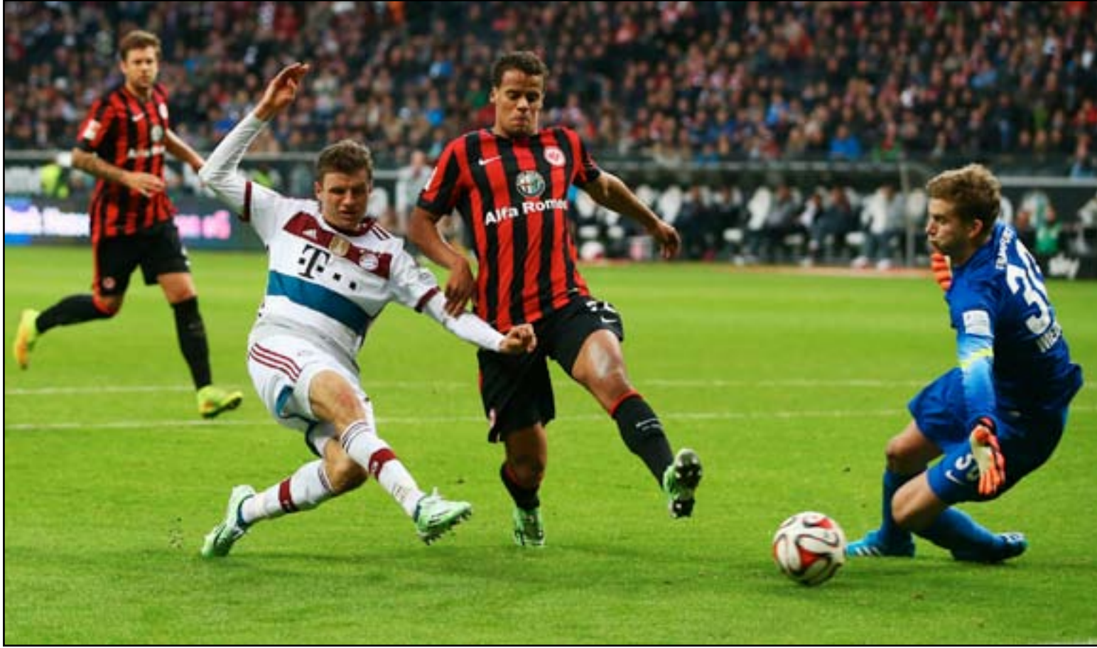
بايرن ميونخ يقترب من منصة التتويج الثالثة على التوالي

وخاض بايرن الذي يتنافس على ثلاث جبهات كونه وصل الى الدور نصف النهائي من مسابقة الكأس المحلية وربع نهائي دوري ابطال أوروبا حيث يواجه بورنو البرتغالي في ١٥ نيسان الحالي ذهاباً على ملعب الأخضر و ٢١ منه اياباً، لقاء الاربعة بغياب الثلاثي المصاب الهولندي أرين