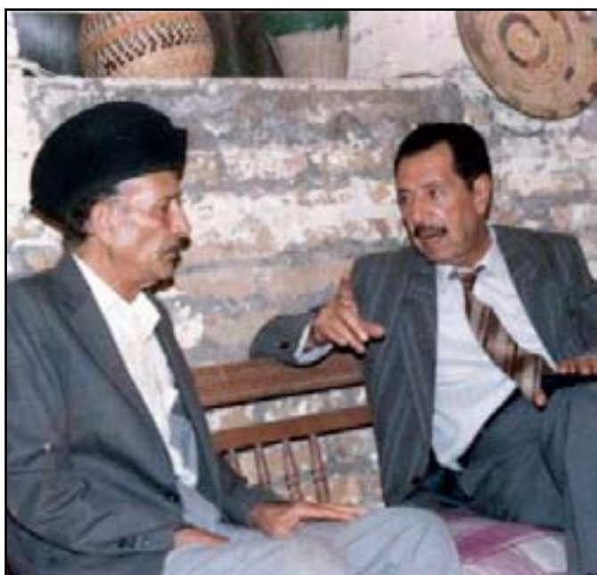
مع الراحل سليم البصري