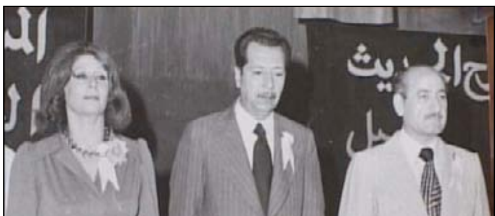
مع يوسف العاني والرحلة زينب

الإخراج والتمثيل وغطى نشاطه مجالات المسرح والفنون السمعية والمرئية. لقد كانت بدايته مع المسرح وكان من مؤسسي الفرقة الشعبية للتمثيل في عام ١٩٤٧، ولم تقدم الفرقة المذكورة آنذاك سوى مسرحية واحدة شارك فيها ممثلاً وكانت تحمل عنوان "شهداء الوطنية" أخرجها إبراهيم جلال. وفي عام ١٩٦٤ شكل جماعة المسرح الفني بعد أن كانت اجازات الفرق المسرحية (ومنها فرقة المسرح الحديث التي كان ينتمي إليها) قد الغيت في عام ١٩٦٣، وقد اقتصر نشاط الجماعة المذكورة على الإذاعة والتلفزيون. وكان ضمن الهيئة المؤسسية التي أعادت في عام ١٩٦٥ تأسيس فرقة المسرح الحديث تسمية "فرقة المسرح الفني الحديث" وانتخب سكرتيراً لهيئتها الإدارية. وعمل في الفرقة ممثلاً ومخرجاً وإدارياً وظل مرتبطاً بها إلى أن توقفت عن العمل. لقد أخرج للفرقة مسرحية "الحلم" عام ١٩٦٥، وهي من أعداد الفنان قاسم محمد. ومن أشهر أدواره "الذي أخرجته صاحب حداد"، و"أبو سعيد" في فيلم "يوم أضر" الذي أخرجته صاحب حداد، كما شارك في فيلم "شيء من القوة" الذي كتبه صباح عطوان وأخرجه كارلو هارتيون. وفي مجال التأليف السينمائي كتب سيناريو فيلم "البيت" الذي أخرجته عبد الهادي الراوي في عام ١٩٨٨ والذي قال عنه الفنان يوسف العاني: "انني وأنا أشاهد