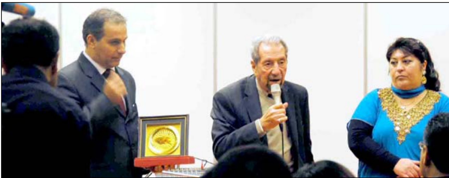
الراحل في حفل تكريمه ببولندا

تحتفظ ذاكرة الشعوب بأسماء ومآثر كبار مبدعيها ممن أسهموا في إرساء أسس الثقافة الوطنية لبلدانهم وبناء هذه الثقافة، وتظل هذه الأسماء والمآثر وشماً مضيئاً محفوراً في الذاكرة لا يمكن انتزاعه منها بيسر. غير أن شمة ما يدعو إلى تنشيط هذه الذاكرة بين حين وآخر من خلال إعادة إلقاء الضوء على هؤلاء المبدعين، بهدف التذكير بهم واتاحة الفرصة أمام الذين لم يجاليلوهم للتعرف عليهم وعلى مآثرهم الإبداعية. في ذاكرة الثقافة العراقية أسماء نخبة ممن كرسوا جهودهم للإسهام في بناء صرح ثقافتنا الوطنية نجد أن من حقهم علينا الوقوف باحترام أمام سيرهم الشخصية والإبداعية وإعادة التعريف بهم، من رحل منهم أو من اختار منهم حياة الغربية مكرها،