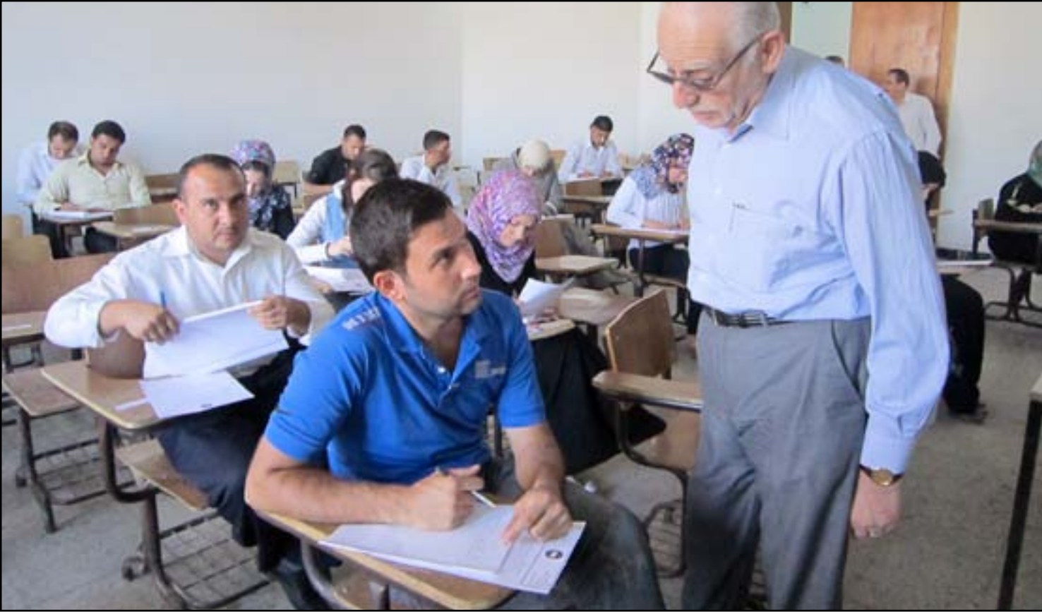
استاذ جامعي يراقب أداء طالبه الامتحاني.. ارشيف

وليس القديمة" وكان عدد من مسؤولي الدوائر الحكومية في محافظة صلاح الدين، طالبوا الثلاثاء (٧ نيسان ٢٠١٥)، رئيس مجلس الوزراء حيدر العبادي بإطلاق رواتب الموظفين وعدم تأخيرها، وهددوا باتخاذ مواقف "لا تحمد عقباه"، فيما عدوا قرار قطع رواتب الموظفين بعد عمليات التحرير "قطعاً للأرزاق".