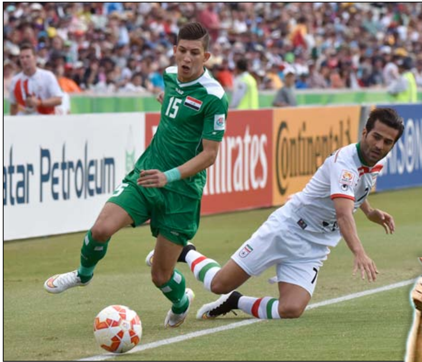
منتخبنا يحقق تقدماً في تصنيف المنتخبات الآسيوية

المباريات من ١١ حزيران ولغاية ٢٩ آذار المقبلين حيث سيتأهل صاحب المركز الأول في كل مجموعة إلى جانب أفضل أربعة منتخبات