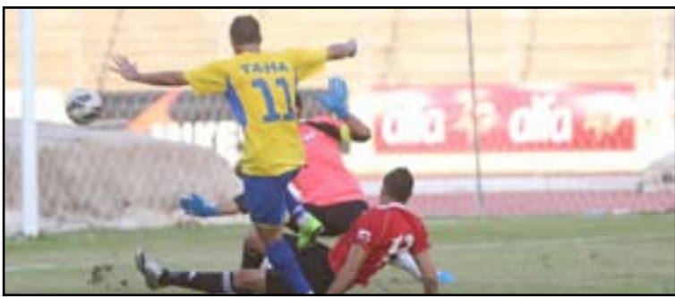
العهد في مهمة صعبة