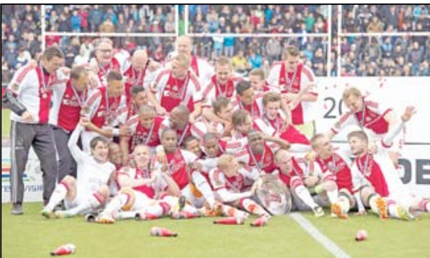
أيندهوفن يختم الموسم برباعية

وقلص خوي فان دي بيرغ والفارق بهدف لهيرنغين قبل أن يعيد دي يونغ فارق الهدافين لأيندهوفن قبل نهاية الشوط الأول. وأكمل لوسيانو نارسينغ الرباعية قبل نهاية المباراة.