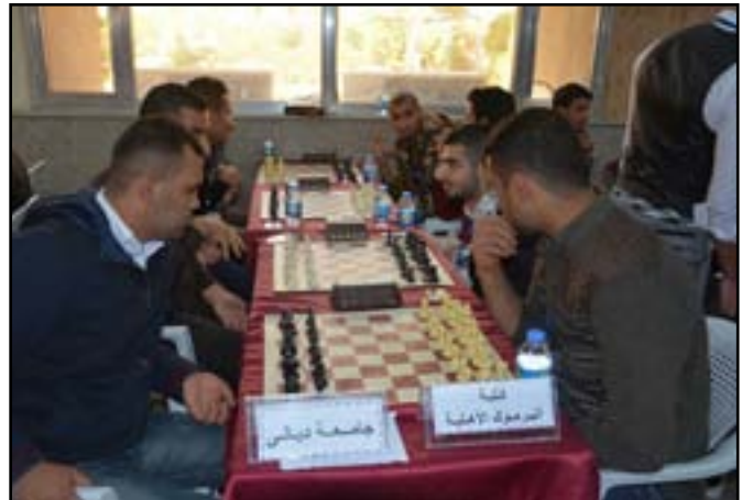
بغداد يتوج بلقب الجامعات بالشطرنج