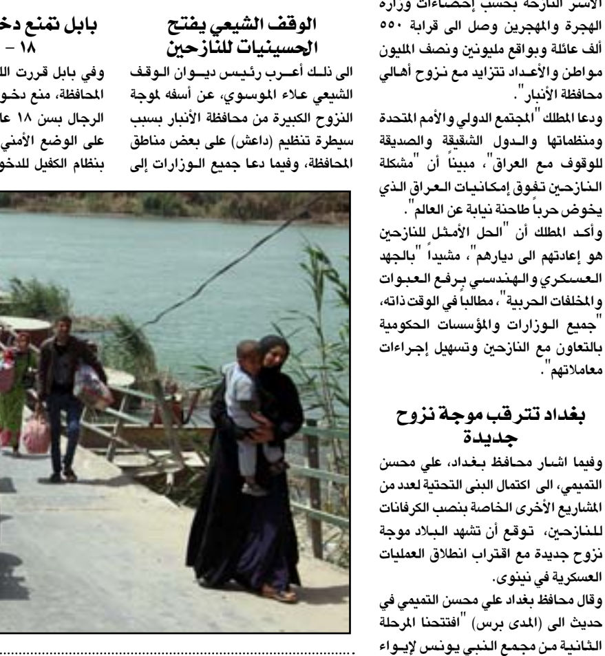
نازحون من الرمادي على جسر بزيين.. تصوير محمود رؤف