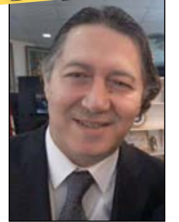
بغداد / المدى

حلقات برنامجه، مشيرا إلى أن كين بيرنز وأندرسون كوبر كانا ضيفين في البرنامج، وكان أجدادهم يمتلكون عبيدا. وتابع غيتس "في حلقة أفليك، قرنا تناول قصة جده الراهنة التي أصبح فيها مشعوذا في أعقاب الحرب الأهلية. قصة هذا الرجل كانت غير عادية تماما، ولم يسبق لنا الكشف عن شخص مثل هذا من قبل". ويبدل مخرج فيلمي "عود ويل هانتنج، وأرغو جهودا في العمل الإنساني بإفريقيا.