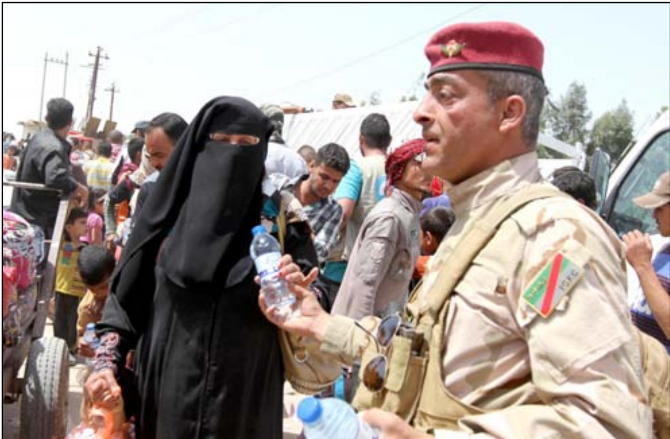
جندي يقدم المياه لنازحة عند جسر بزبير

وكانت المصفاة في السابق تنتج نحو ٣٠٠ الف برميل من المشتقات النفطية يومياً، ما كان يلبي زهاء نصف حاجة البلاد. وتقع المصفاة على مسافة ٢٠٠ كلم شمال بغداد، على مقربة من مدينة يبجي التي يسيطر عليها التنظيم في هجوم حزيران الماضي، قبل ان تتمكن القوات الامنية من استعادة السيطرة عليها في تشرين الثاني الماضي، بدعم من التحالف الذي بدأ منذ اب ٢٠١٤ بتنفيذ ضربات جوية ضد التنظيم. الا ان المسلحين اوردوا في وقت لاحق مهاجمة المدينة واستعادة بعض مناطقها، ولا تزال تدور فيها وفي محيطها معارك بين الطرفين.