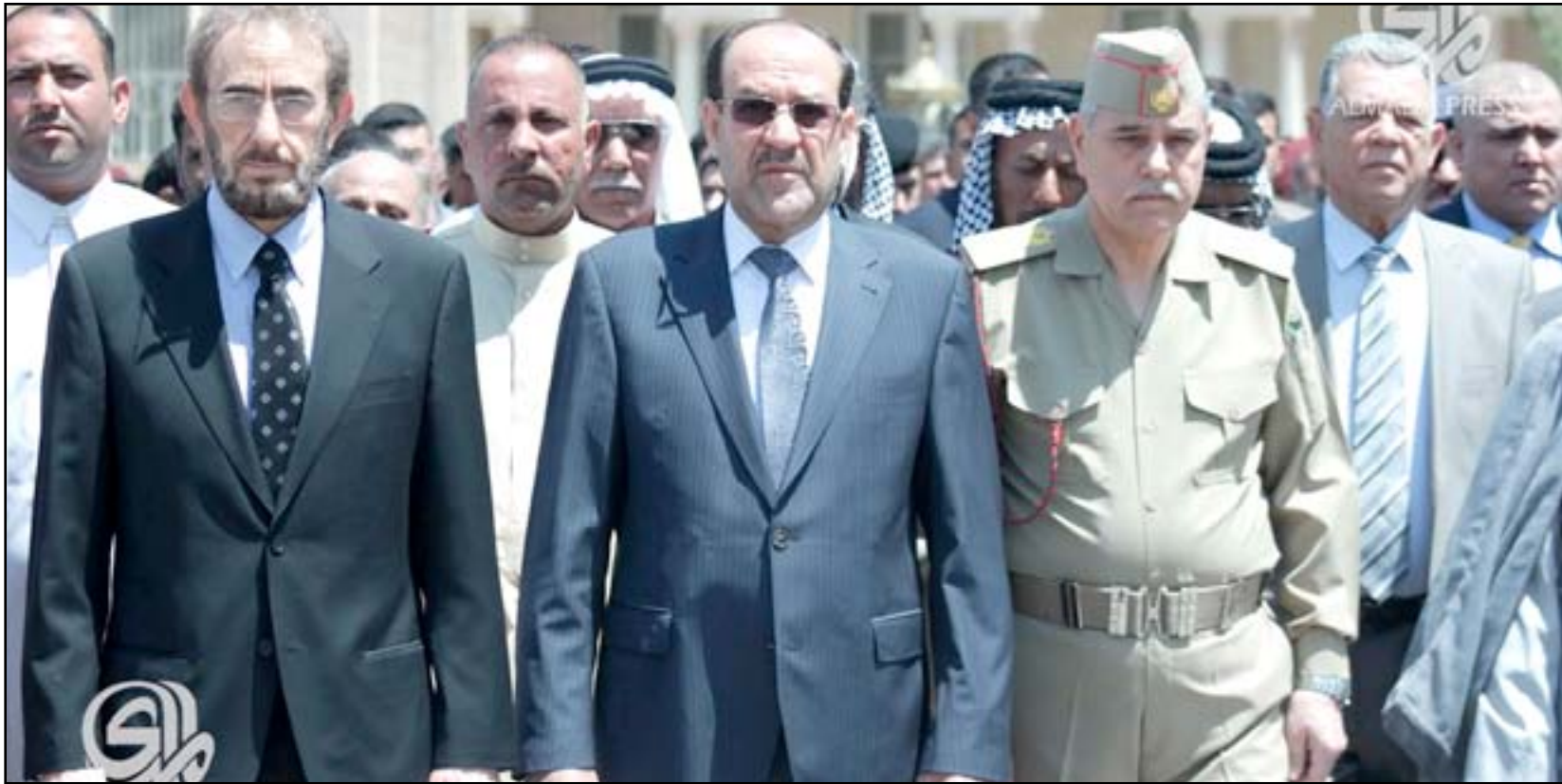
الملك والدليمي خلال مراسم تشيع جنود عراقيين...

وقال عباس الخزاعي، عضو اللجنة التحقيقية لـ"المدى"، إن "إفادة وزير الدفاع السابق سعدون الدليمي كانت مختصرة ولم تأت بشيء جديد بعدما بين أن أسباب سقوط مدينة الموصل كانت لتداعيات سياسية واجتماعية فضلاً عن وجود خلافات بين الحكومة الاتحادية وحكومة نينوى المحلية"، مبيناً أن "الدليمي أشار في إفادته إلى أن قوات الجيش لم تقاات عناصر داعش عند دخولها المدينة" وأضاف الخزاعي أن "سعدون الدليمي أقر أمام اللجنة بوصول معلومات استخباراتية