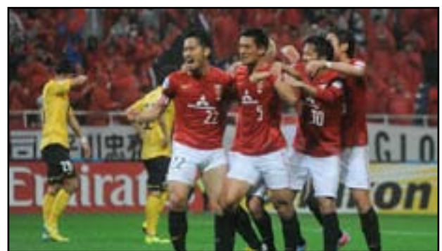
ريدز ينغرد بالصدارة