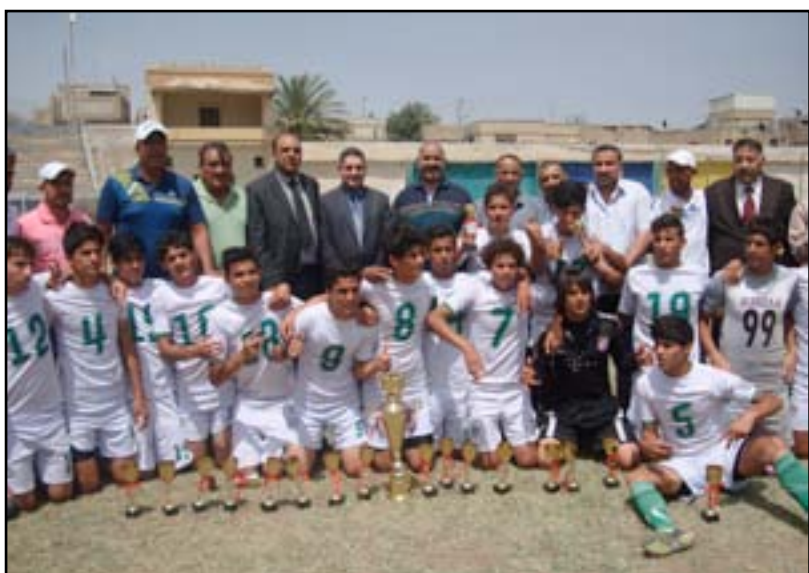
ذي قار يحصد لقب المدرسي