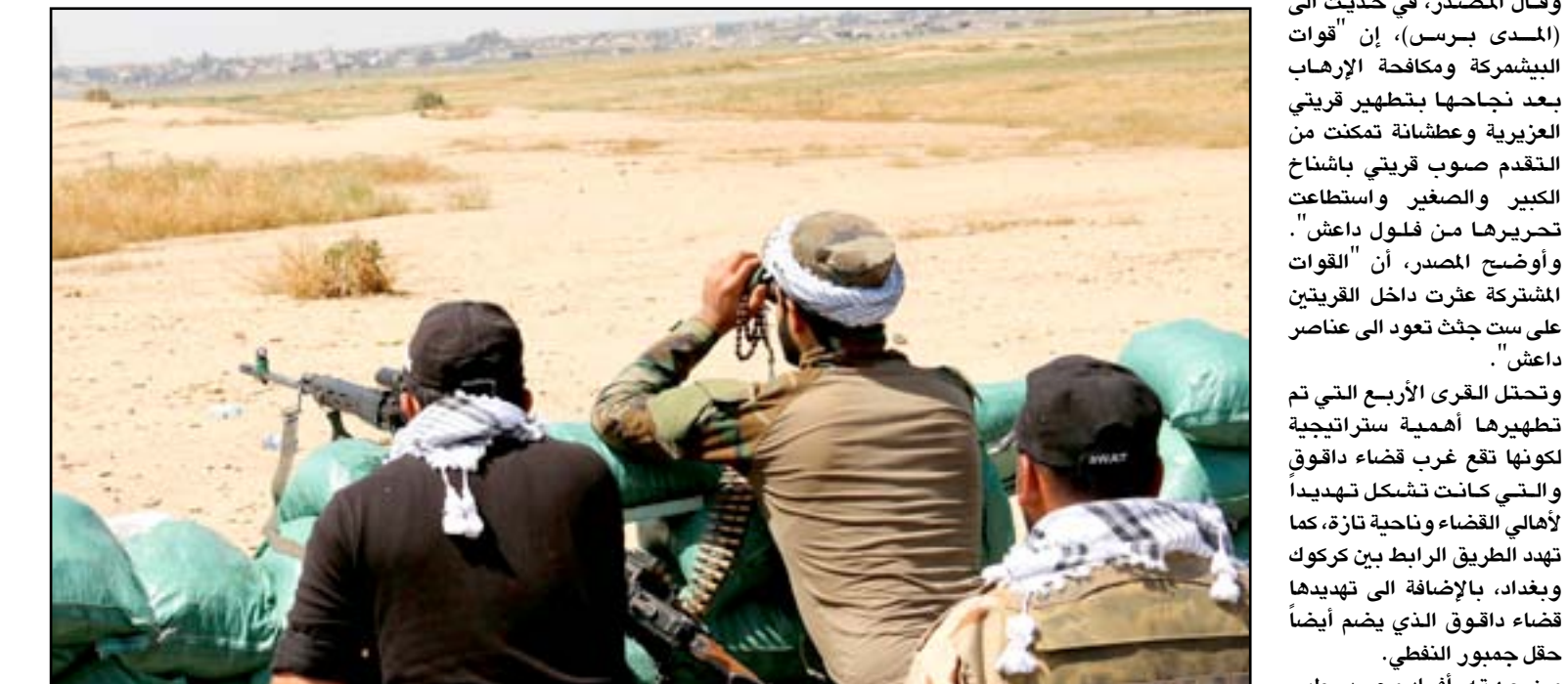
مقاتلو الحشد الشعبي في قسبة البشير...

□ كركوك / المدى برس فاد مصدر في قوات البيشمركة بمحافظة كركوك، بتطهير قريتي باشناخ الكبير والصغير (٤٠ كم جنوبي كركوك)، خلال عملية أمنية نفذتها قوات البيشمركة ومكافحة الإرهاب، فيما أشار إلى العثور على ست جثث تعود لعناصر تنظيم داعش. فيما بلغت حصيلة المعارك التي انطلقت لتطهير عدد من قري جنوب كركوك بلغت ٩ قتلى و ٦٠ مصاباً من قوات البيشمركة والحشد الشعبي. وقال المصدر، في حديث إلى (المدى برس)، أن "حصيلة حملة التطهير التي نفذتها قوات البيشمركة والحشد الشعبي ضد تنظيم داعش جنوبي كركوك، هي تسعة قتلى، بينهم خمسة من عناصر البيشمركة، وأربعة من عناصر الحشد، فيما أصيب ٦٠ آخرون من البيشمركة والحشد الشعبي