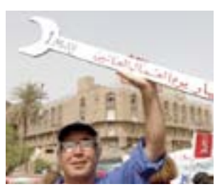
عمال العراق في عيدهم؛ مصانع معطلة ورواتب مؤجلة

يستعد العراق لنشر مقاتلين شيعية في مناطق سنية إلى الغرب من بغداد في خطوة يقول مؤيدوها إنها ضرورية لإلحاق الهزيمة بمتشددى تنظيم داعش، بينما يقول المعارضون إنها يمكن أن