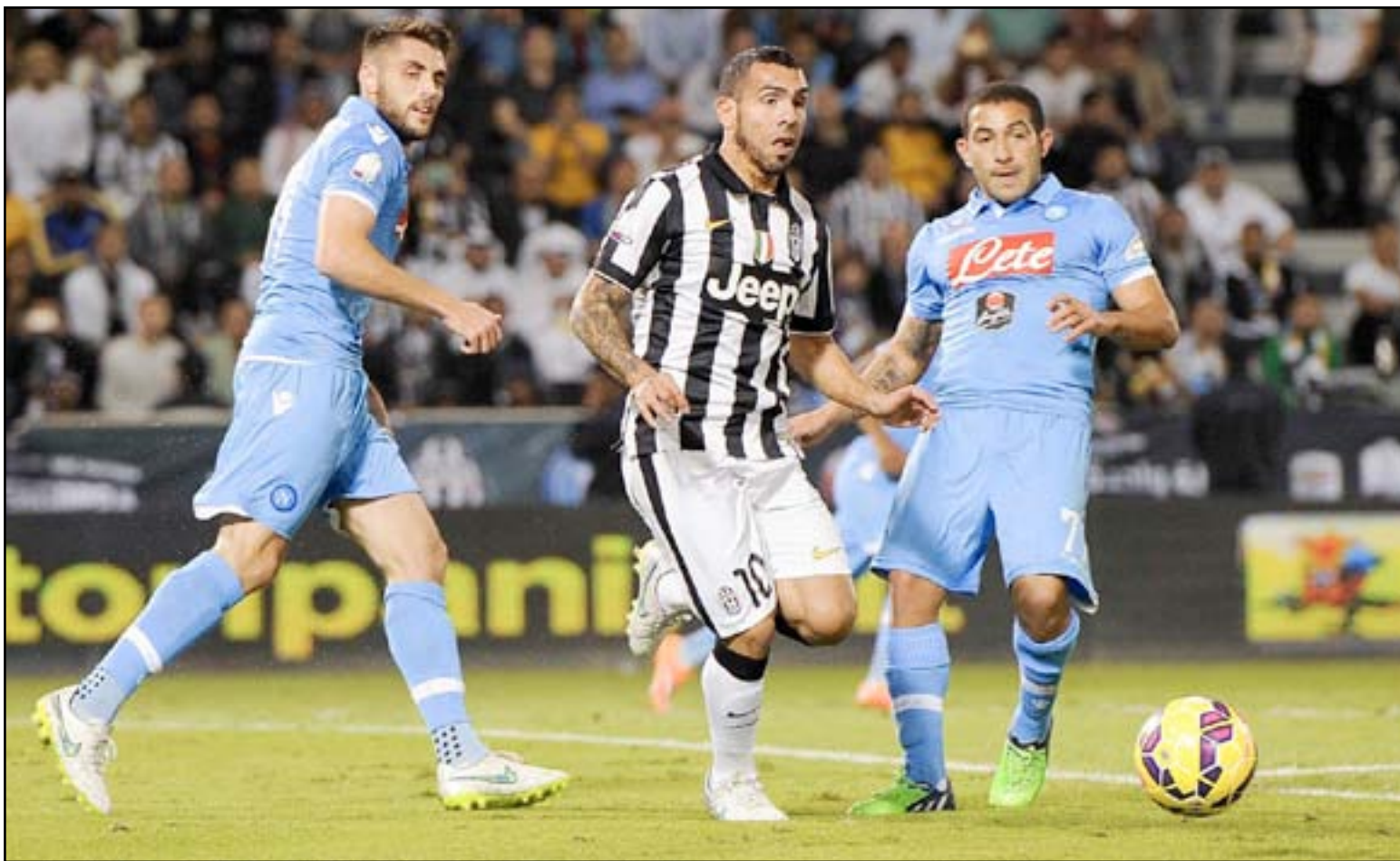
نقطة واحدة تكفي اليوفي للتويج باللقب

بيولي مدرب لاتسيو عقب فوزه فريقه الكبير (٤-٠) على ضيفه بارما الأربعة الماضي "إننا لم نحقق أي شيء حتى الآن، مازالت هناك خمس مباريات بانتظارنا، وينبغي علينا مواصلة السير على النهج ذاته". وستكون المواجهتان الأخيرتان للاتسيو في البطولة حاسمتين في تحديد مصيره، حيث يُضيف روما في المرحلة قبل الأخيرة، ثم يختم مبارياته في المسابقة بمواجهة مضيفه نابولي، قبل أن يواجه يوفنتوس في نهائي كأس