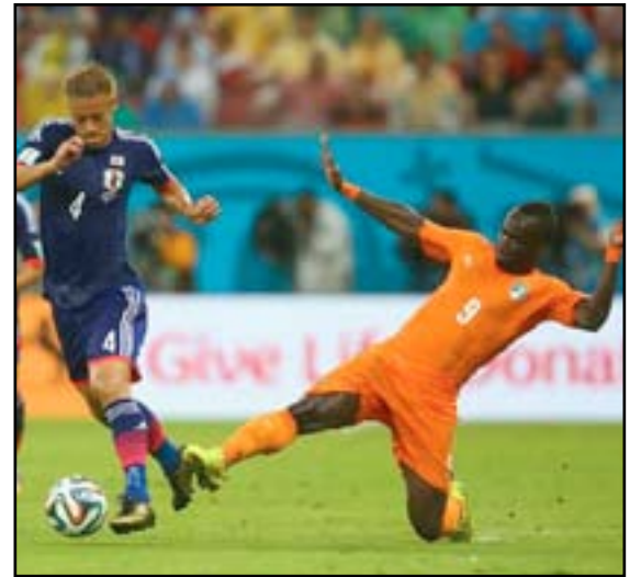
آسيا تلح بطاقة خامسة

كشف رئيس المجلس الأولمبي الآسيوي، رئيس اتحاد اللجان الأولمبية الوطنية (أنوك) أحمد الفهد أن ما وصفه بالتضامن الذي أظهرته الجمعية العمومية للإتحاد الآسيوي لكرة القدم سينعكس إيجاباً على كرة القدم الآسيوية وقد يؤدي إلى حصول القارة على خمس بطاقات مباشرة في نهائيات كأس العالم، وخمسة مقاعد أيضاً في اللجنة التنفيذية ل(فيفا).