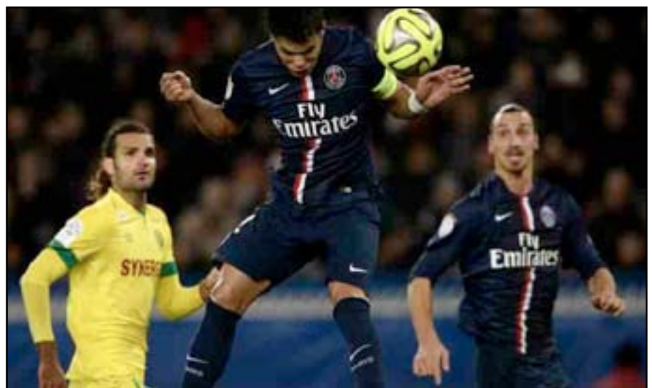
مواجهة صعبة لجيرمان مع نانت

واستفاد سان جيرمان الثلاثاء الماضي على اكمل وجه من مبارياته المؤجلة من المرحلة الثانية والثلاثين مع ضيفه