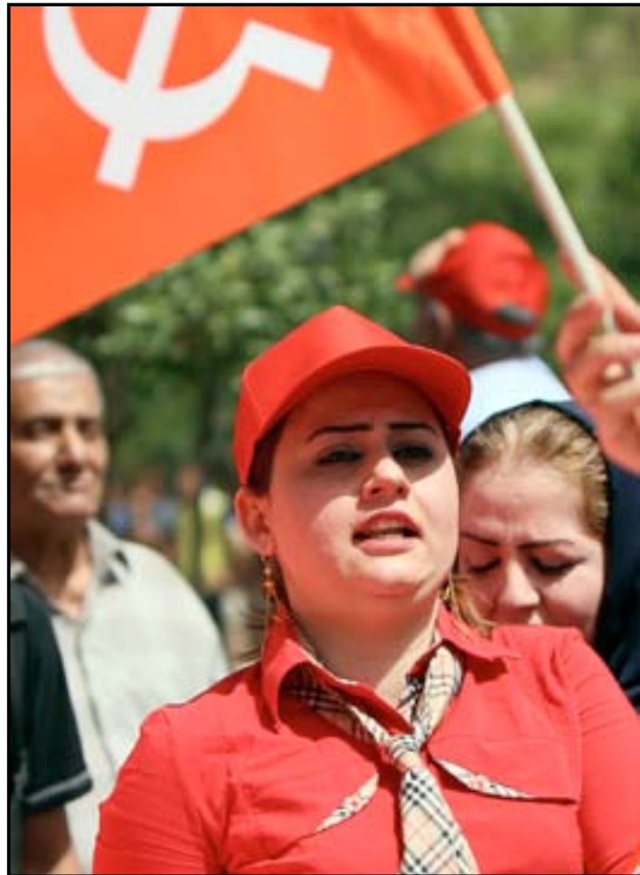
شابة شيوعية تتظاهر في بغداد امس الجمعة.. ا ف ب

في مختلف المشاريع المدنية في البلاد". ولفت الى أن "هناك المئات من العمال يتعرضون لمختلف الانتهاكات من قبل تلك الشركات التي ترفض التعاون أو التعامل معنا بنزيرية أن قانون الاستثمار لم يتضمن بين فقراته حق التمثيل النقابي وهذا الامر فيه تهميش واقصاء واضح للطبقة العاملة". وأوضح أن "الاتحاد علق هذا العام احتفالاته بذكرى عيد العمال العالمي وذلك حدادا على أرواح شهداء العراق من رجال القوات المسلحة اليوأسل وغيارى الحشد الشعبي الذين يقاتلون عصابات داعش الإرهابية مؤكداً أن "المدة المقلبة ستشهد حراكا قويا على مختلف الشركات العاملة في المحافظة وحدها على ضمان حقوق العاملين فيها بعد ورود شكوى كثيرة تتعلق بوجود انتهاكات حصلت ضد العمال من قبل أرباب العمل وهذا ما