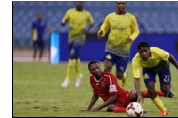
النصر يكمل عقد المتأهلين في الكأس