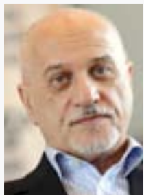
وزير التعليم حسين الشهرستاني

وعرب عضو مجلس محافظة ديالى عن التحالف الكردستاني، عن "امله باستجابة القيادات الامنية لطلبه هذاً توفيراً للجهد والمال والراحة لسلكي الطريق وتخفيف الزخم الحاصل مؤخراً على طريق بلدروز مندلي- نطف خانة خانقين" .