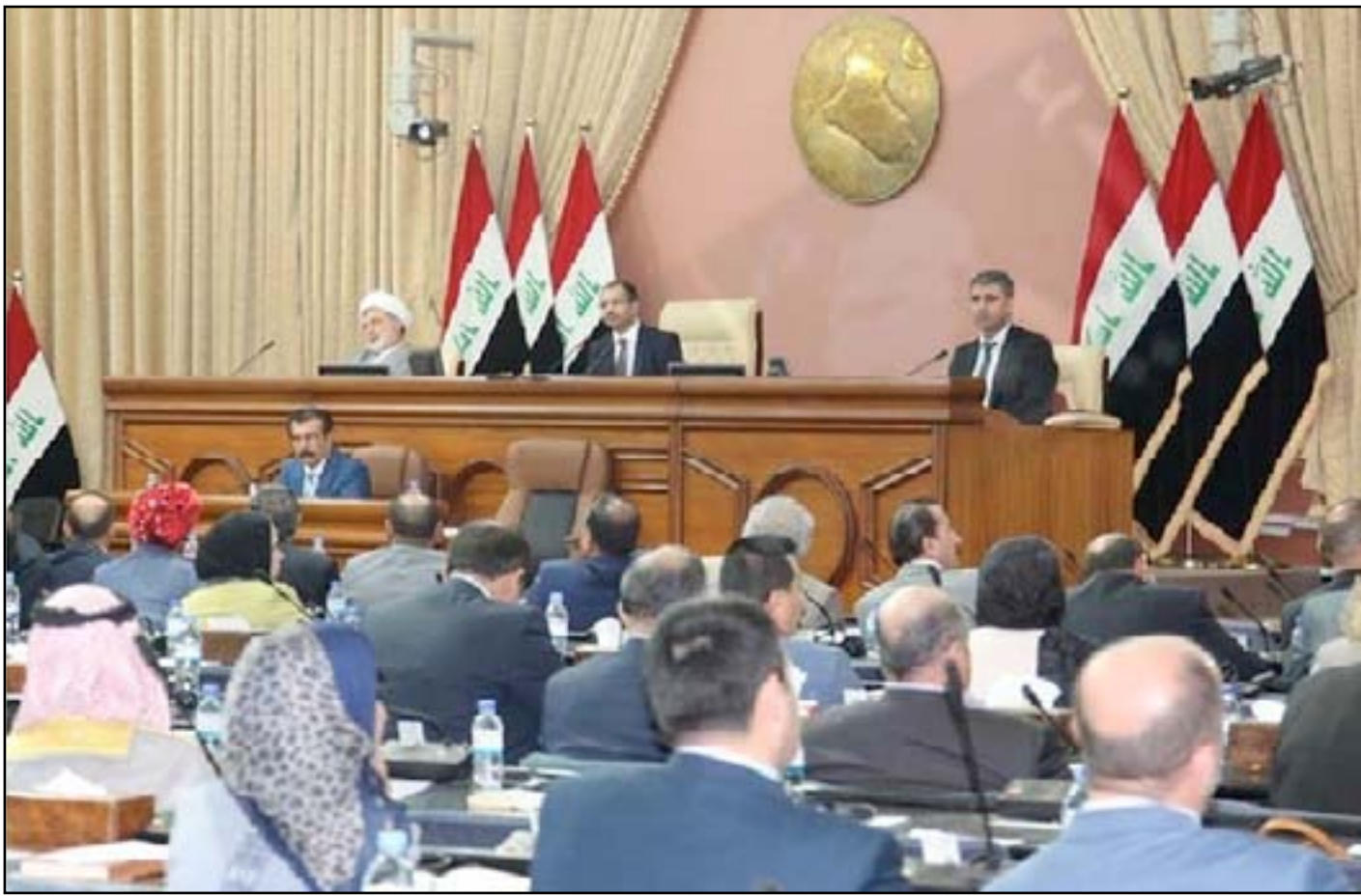
جلسة مجلس النواب

وأضاف البيان ان "العراق حريص على الاستمرار ببناء علاقة تعاون ستراتيجية مع الولايات المتحدة خصوصاً في مجال مكافحة الارهاب"، عاداً ان "تفاصيل مشروع القانون المطروح في الكونغرس تسيء الى ثوابت بناء هذه العلاقة". وكان رئيس مجلس الوزراء حيدر العبادي رفض، الأربعاء، مشروع القرار الاميركي الذي يدعو لتسليح