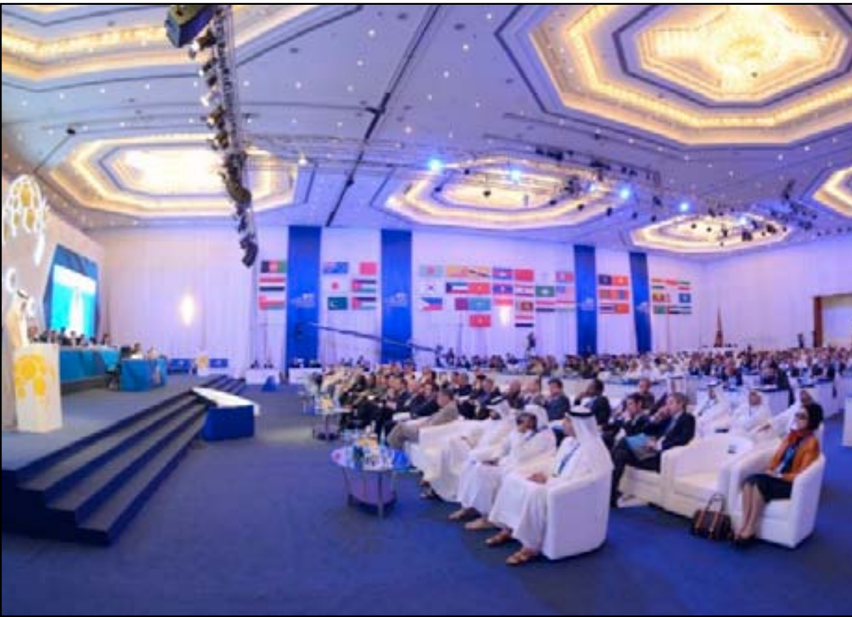
الجمعية العمومية للإتحاد الآسيوي تصادف على فعاليات عامي ٢٠١٣ و ٢٠١٤

من الأولويات للفترة المقبلة، وقال: يتفق الجميع في قارة آسيا على أهمية تقليص الفارق مع بقية العالم، وفي السنوات الأربع المقبلة وما بعدها سيكون تركيز