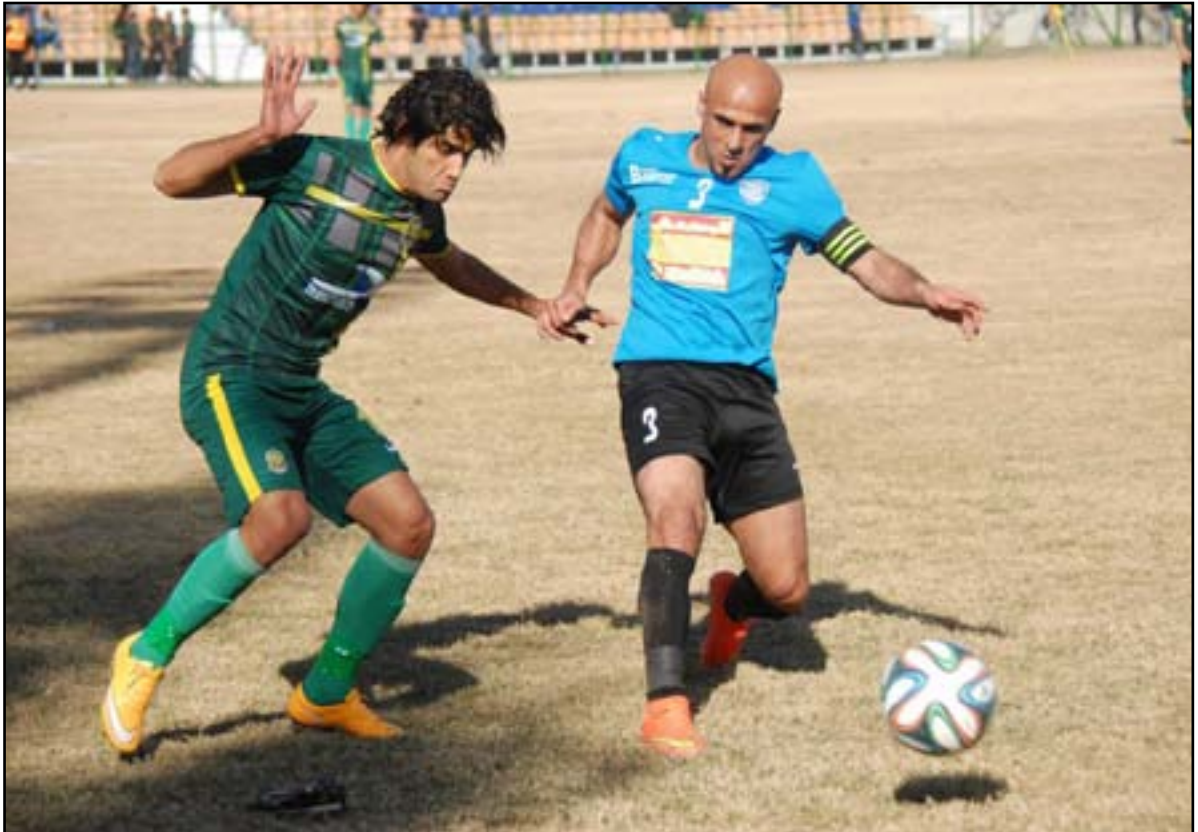
فريق بغداد يحقق مسعاه بين الكبار

وقال فرحان ل(المدي) : إن ادارة النادي والملاك التدريبي للفريق وضعت بالحسبان مسألة اعداد الفريق في فترة ايام الزيارة لوفاء الامام