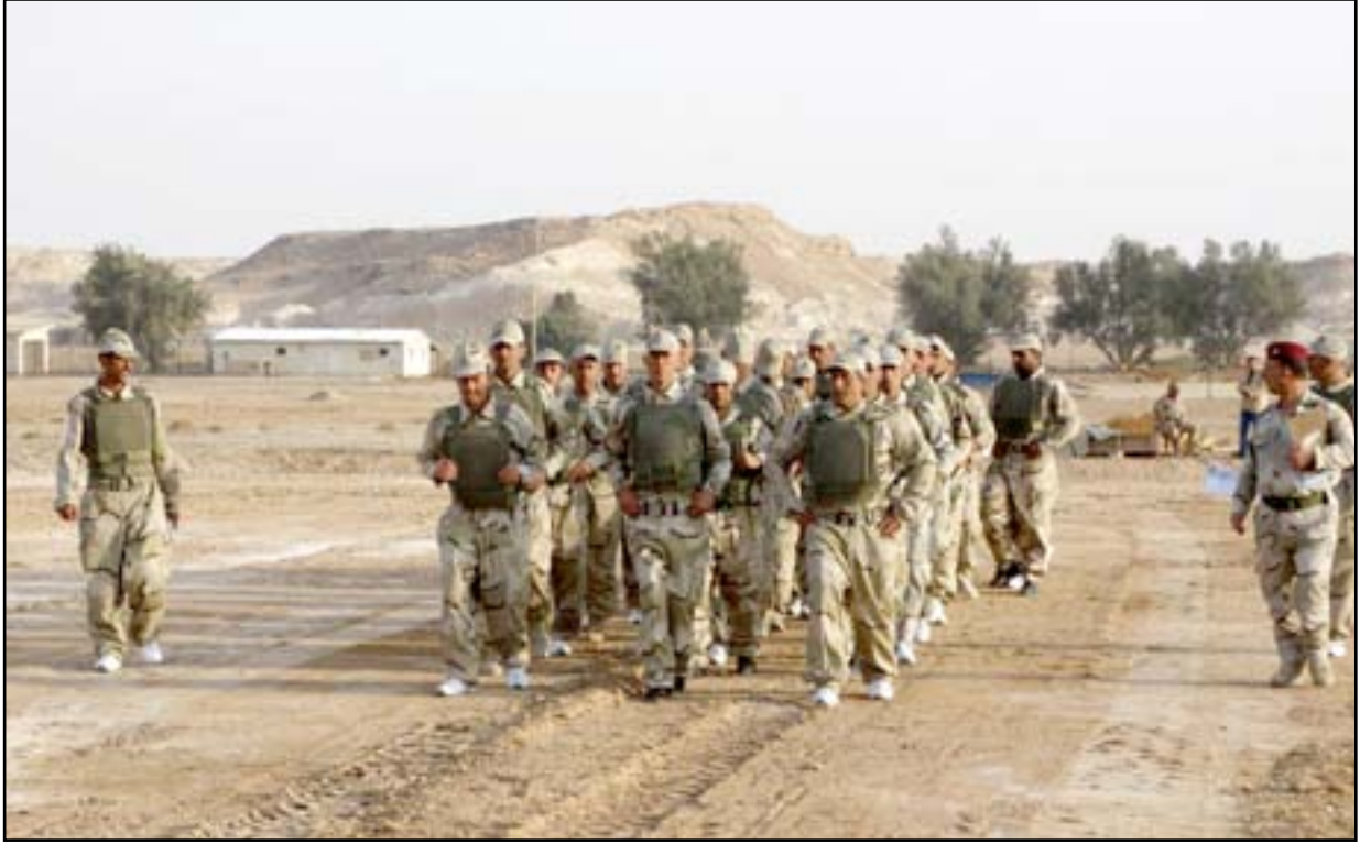
مقاتلون سنة اثناء التدريب في قاعدة عين الأسد..أرشيف

ويعد قانون الحرس احد ابرز البنود التي حملتها الورقة الوطنية، التي كانت بمثابة خارطة طريق لتشكيل حكومة حيدر العبادي. القرار الاميركي على الرغم من انه مقدم من مجلس النواب الاميركي، لكنه يعبر، بحسب جهات سنية، عن قلق واشنطن من عدم وجود رعاية كافية ومتساوية للطرف التي تقاثل "داعش" على الارض، وهو جاء مزامنا مع ماكشفته لجنة الامن والدفاع في البرلمان العراقي عن مناقشة جدية ستجري خلال اليومين المقبلين لمشروع قانون "الحرس الوطني" ومحاولة ارضاء كل الاطراف لدفعه الى البرلمان للتصويت عليه، على الرغم من ان اللجنة تؤكد بان قرار "المناقشة" قد اتخذ قبل المشروع الاميركي (المثير للجدل) باسابيع، كما تزامن مع تسريبات بوجود مشروع عراقي اميركي لتدريب اكثر من ٥ الاف من متطوعي الانبار ضمن تشكيل شبيبة بالحشد الشعبي تحت اشراف المارينز.