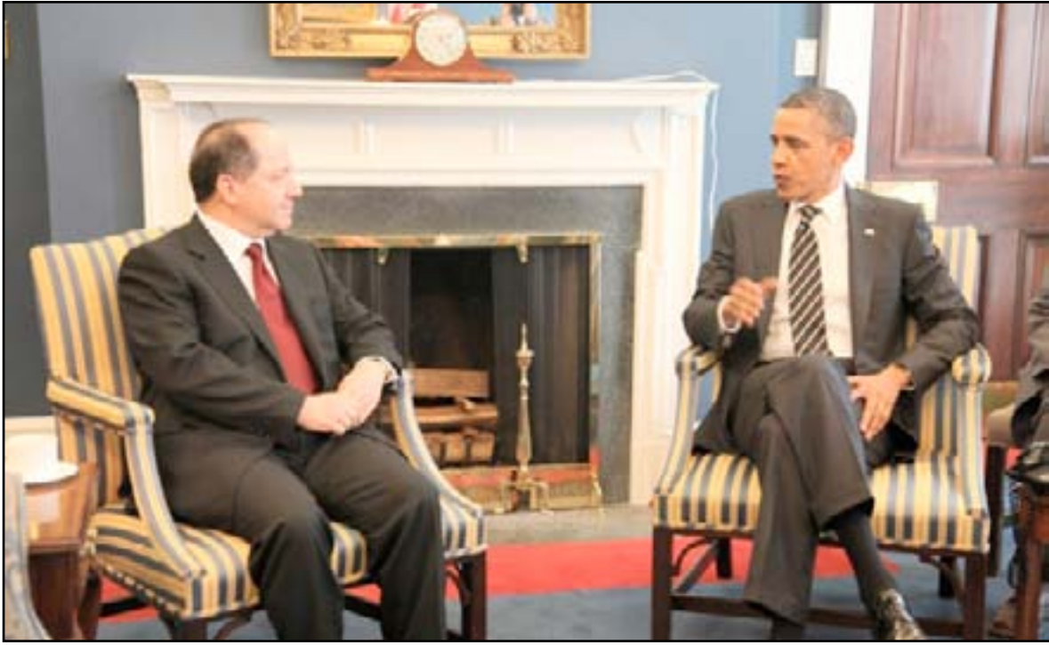
بارزاني وأوباما في لقاء سابق

سياسة دولة عراقية موحدة فدرالية وتعددية" هي عبر التنسيق من خلال حكومة مركزية. وأضافت للصحافيين "لقد شهدنا بالتأكيد مستوى غير مسبوق من التنسيق والتعاون" من جانب آخر صادق رئيس إقليم كردستان