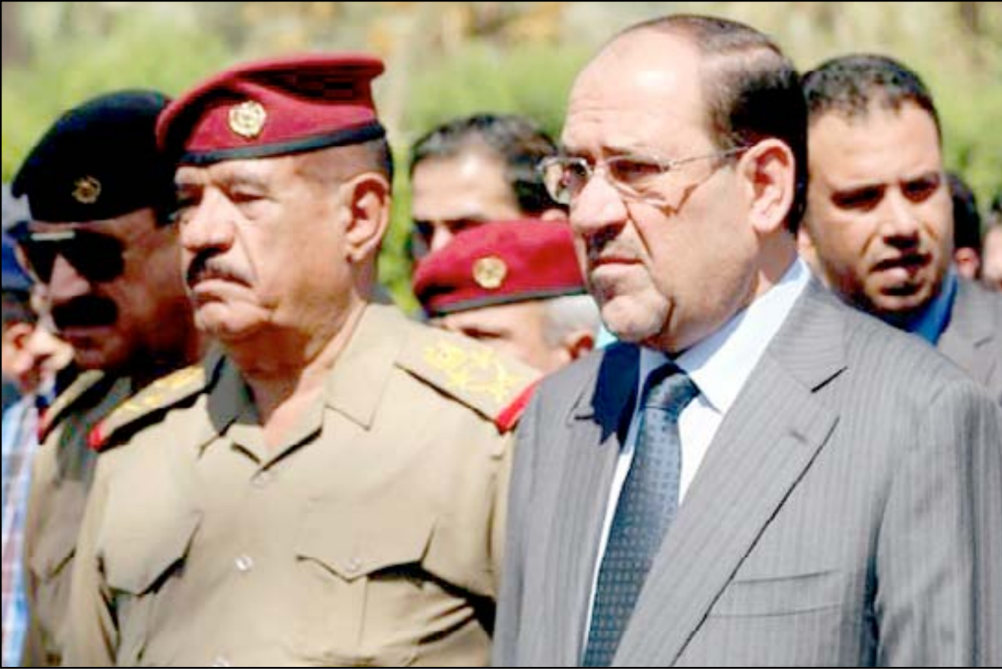
المالكي وكثير في لقاء سابق

سبايكر وكذلك تمدد عناصر داعش في محافظات ومناطق اخرى . ويضيف عضو اللجنة التحقيقية بان التقرير النهائي سيكون شاملا لجميع هذه الاحداث التي راقت سقوط الموصل بيد تنظيم داعش، مشددا على ان الذين تسببوا في سقوط نينوى سيقدمون إلى القضاء للخصاص منهم .