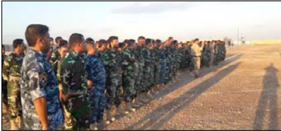
مقاتلون في معسكر تحرير نيوى... أربيل