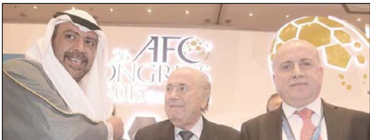
مؤتمر المنامة يرفع رصيد بلاتر الانتخابي

زادت نتائج الانتخابات الآسيوية من رصيد السويسري جوزيف بلاتر الساعي إلى ولاية خامسة على التوالي في رئاسة الإتحاد الدولي لكرة القدم في ٢٩ أيار الحالي، إذ إنها أكدت تماسك القارة الآسيوية بمعظم اتحاداتها والتزامها بالقرارات التي اتخذتها في الأيام الماضية ما يؤشر بقوة إلى تأكيد وقوفها مع بلاتر كما سبق أن أعلنت في جمعيات عمومية سابقة.