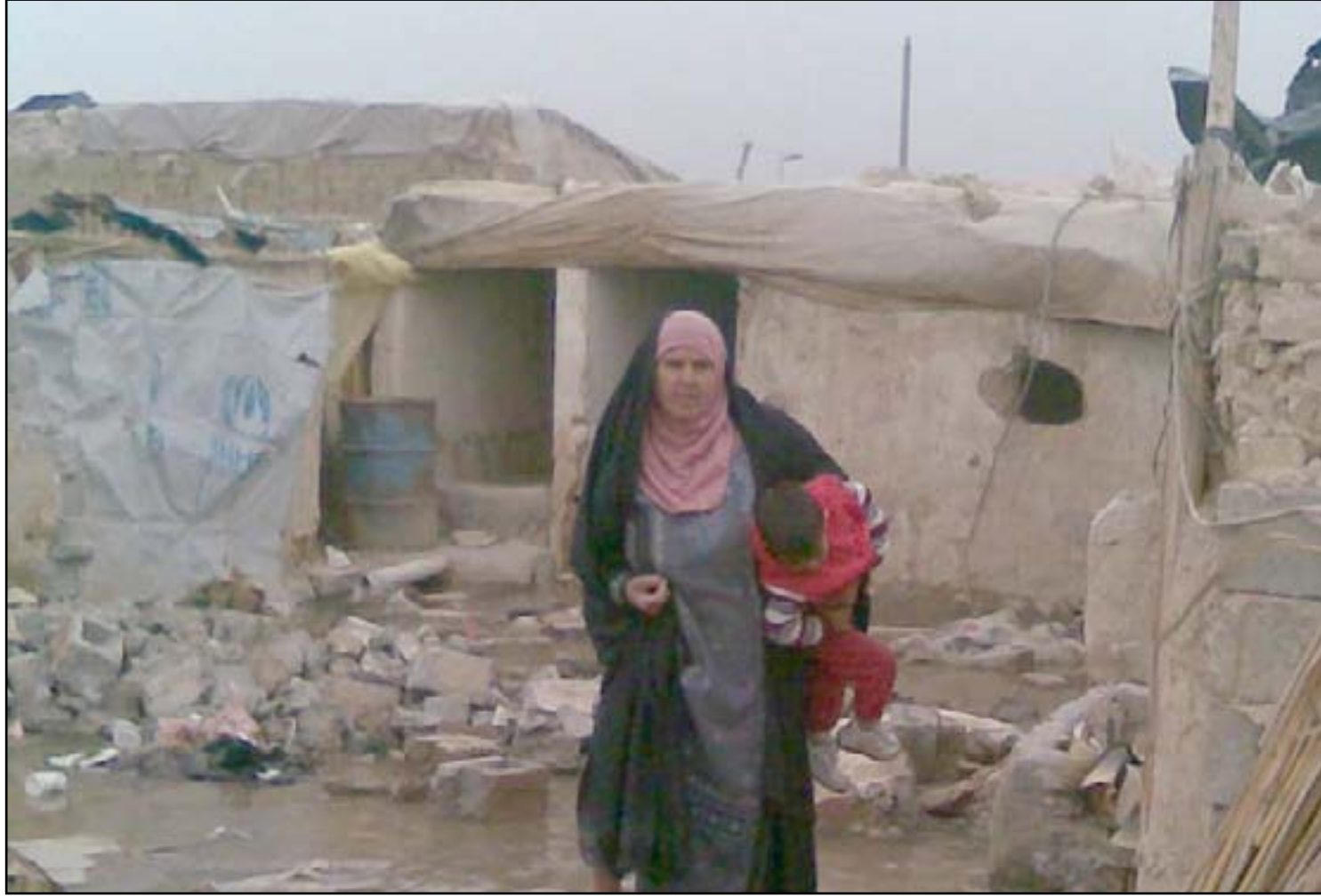
لحدى النساء في بغداد تسكن بحي عشوائي.. ارشيف