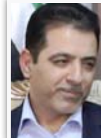
وزير الداخلية محمد الفبان

"ان شريحة العمال في العراق كان لها دور مهم ومشرف في الاحداث التاريخية المهمة التي مر بها العراق، إلا انها وللأسف تعرضت للغبن شأنها شأن بقية شرائح المجتمع منذ أواخر القرن الماضي اثر الأزمات التي تعرضت لها معظم القطاعات في العراق وأولها القطاع الصناعي، ان واقع العمال اليوم يتطلب المزيد من الجهود التي من شأنها تحسين ظروفهم المعيشية والاجتماعية بما ينسجم مع دورهم ومكائاتهم كعنصر اساسي في المجتمع" .