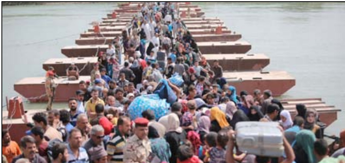
نازحون انباريون على جسر بزيبز قرب عامرية الفلوجة.. ارشيف

للنازحين، مبيها ان "اللجنة العليا لايواء النازحين التي خصصت قبل عام بمبلغ عشرة مليارات دينار للنازحين عادت وخفضت المبلغ الى خمسة مليارات دينار وهو مبلغ قليل ولم