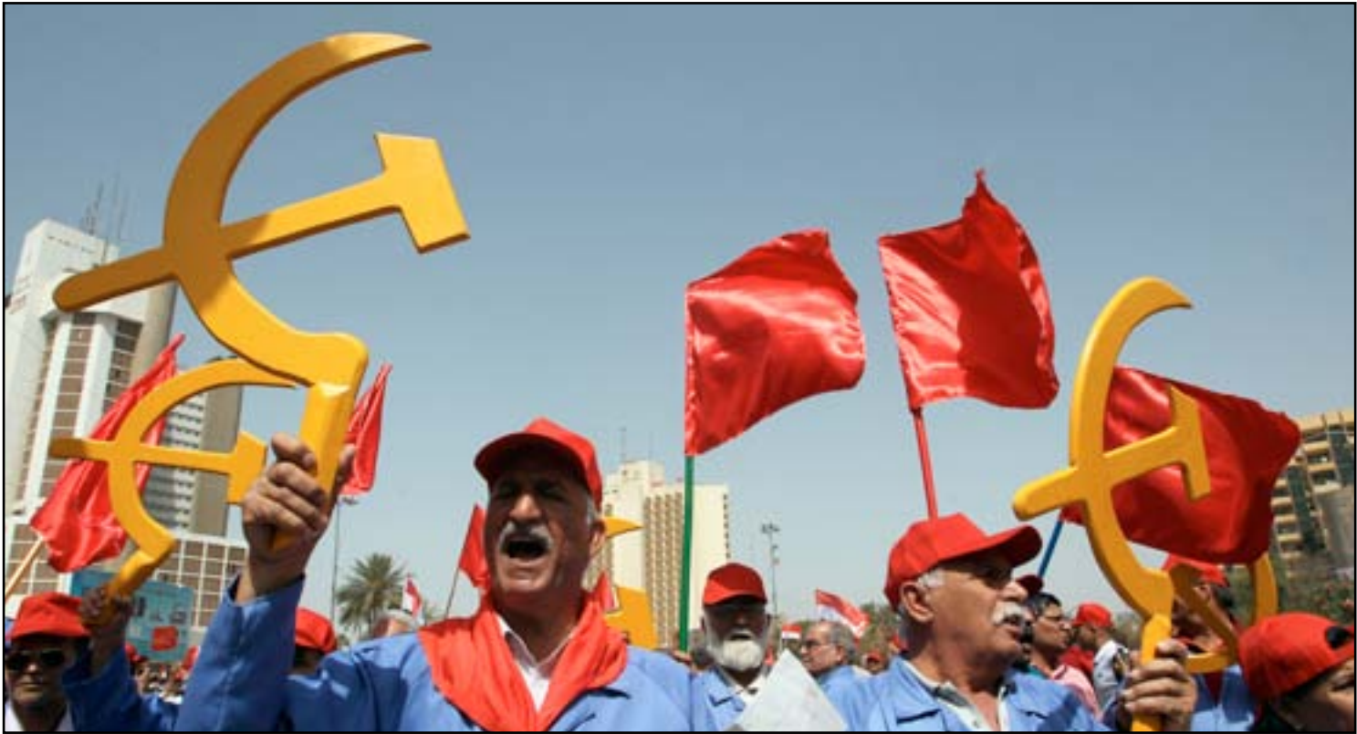
شبيوعيون يتظاهرون في بغداد بمناسبة يوم العمال امس الجمعة..

دعا رئيس الجمهورية فؤاد معصوم، امس الجمعة، الى السعي من أجل تحسين الظروف المهنية والمعيشية والتشريعية للعمال، وفيما أكد على ضرورة إعادة بناء المؤسسات التصنيعية وتحديثها وتشجيع القطاع الصناعي الوطني الخاص، اشار رئيس مجلس الوزراء العراقي حيدر العبادي الى ان الحكومة وضعت في برنامجها الاهتمام بشريحة العمال وتبذل قصارى جهودها لضمان حقوقها وان ترقل هذه الطبقة بحياة كريمة.