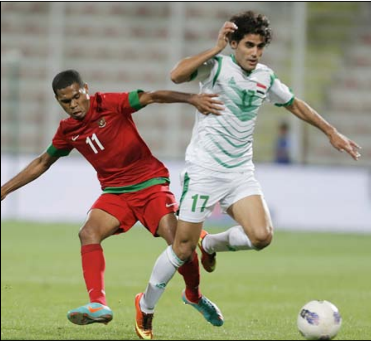
اندونيسيا تستعين بلعب جديد للقاء الأسود

واضاف سلمان لـ(المدى): ان هذه المباراة أعدها غاية في الهمية لنا باعتبار ان المنتخب الاندونيسي اصبح من المنتخبات التي استطاع اتحاده ان يدعمه بالعديد من اللاعبين المحسنين من قارتي أفريقيا وأوروبا كان لهم دور كبير في تطويره بشكل كبير خلال السنوات الاخيرة فضلا عن نظام الاحتراف الذي أدخله الى دوريه المحلي حيث اصبح رقما صعبا امام العديد من المنتخبات الأخرى في القارة التي تواجه ضمن البطولات القارية والاقليمية الموجودة على اجندا الاتحاد الدولي باللعبة ويعمل على استغلال عوامل الطقس لصالحه، لذلك فإننا يجب ان نحترمه ونعمل على وضع إعداد مثالي قبل مواجهته بشكل جيد. وأوضح انه طالب اتحاد الكرة بضرورة ارسال عضويين من لجنة المنتخبات الوطنية واللجنة