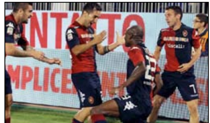
كالياري يسبق بارما

أركز في لحظات معينة، ومن الناحية الجسدية ينبغي أن أكون أكثر قوة، علي أن أخوض اسبوعين قاسيين مثلما يحدث في (الفراند سلام)". ولم يسبق لأي لاعب ياباني الفوز بلقب إحدى بطولات (الفراند سلام) الأربع الكبرى.