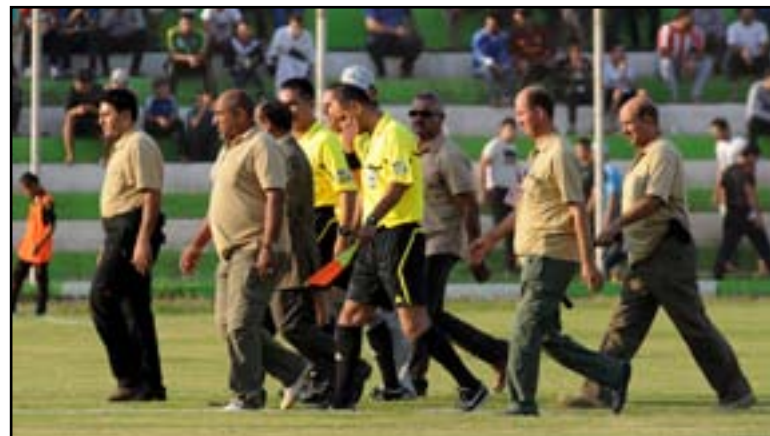
الملاعب بحاجة الى اعادة تنظّم استعداداً لتطبيق رفع الحظر الجزئي

السعيدة الواردة من زيورخ أقدمت وزارة الداخلية بشخص وزيرها محمد سالم الغبان على تفعيل دورها الإيجابي بتوجيه أجهزة الشرطة في عموم المحافظات العراقية لتوفير اقصى اجراءات الحماية والأمن للمنشآت الرياضية والجمهور خصوصاً المدينة الرياضية في البصرة في حين اشار بيان الداخلية الى استعداد الوزارة لتأمين الملاعب العراقية وفق معايير اتحاد كرة القدم الدولي(فيفا) مما يضمن رفع الحظر عن الملاعب العراقية. الأمر في صورته التوجيهية يُشكل ضرورة لا بد