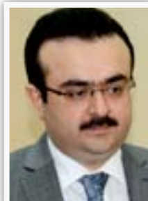
وزير التجارة ملاس محمد عبد الكريم

ادارة المحافظة جادة في تأمين قطع الأراضي السكنية اللازمة لغرض توزيعها على أسر شهداء الحشد الشعبي وشمولهم بكامل الامتيازات، وان اجتماعا خاصا عقد بديوان المحافظة لتخصيص قطع اراضي لشهداء الحشد الشعبي، وحتاج الى دعم كافة الدوائر المعنية للحصول على الأراضي، ويوم الأحد القادم يمكن لعوائل شهداء الشعبي ترويح معاملات قطع اراضي ابنايتا عن طريق البلديات.