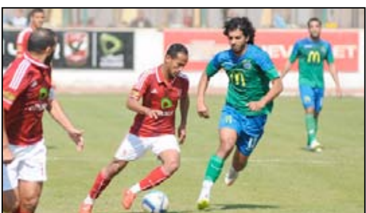
جولة سهلة للاهلي مع النصر

أبطال أفريقيا بركات الترجيح أمام المغرب التطواني المغربي. ويأمل الأهلي الذي يحتل المركز الثالث برصيد ٤٦ نقطة وفارق ١١ نقطة عن الزمالك المتصدر، الحصول على النقاط الثلاث واستعادة طريق الانتصارات، أملاً في الوقت ذاته تعثر الزمالك للعودة إلى المنافسة على الصدارة من جديد. أما النصر الثامن عشر (٢٠ نقطة)، فيأمل استغلال الحالة المهيوزة للأهلي من أجل تحقيق المفاجأة وتحسين موقفه في الترتيب.