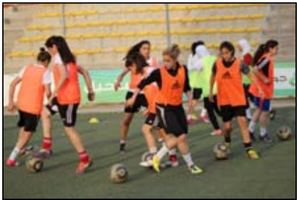
استعداد وزاري لاطلاق اول نسخة من الدوري النسوي