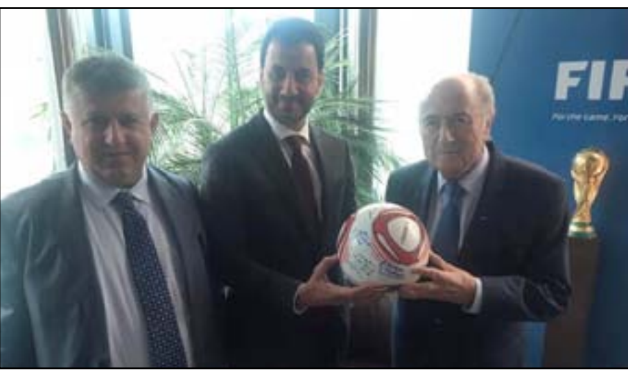
اثناء لقاء عبطان ومسعود مع بلاتر

اجتماع عبطان ومسعود مع بلاتر جهود رفع الحظر. وأبدى عبطان شكره وتقديره للإعلام الرياضي وقال: نعوّل كثيراً على الإعلام في دعم البرلمانية التي كانت داعمة