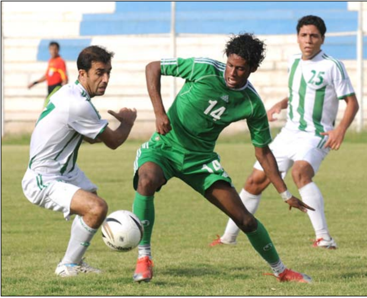
الشرطة يكسب ثلاث نقاط بعد اعتذار دهوك عن مواجهته

عندما واجه فريق أربيل في الجولة ذاتها على ملعب فرانسو حريري واكتفى بالتعادل الإيجابي بهدفٍ لثلاثة الذي جعله خارج دائرة المنافسة كونه كان بحاجة إلى فوز لا غير بفارق هدفين ليكون ضمن الأربعة الكبار التي تتاهل إلى دوري النخبة لكنه بهذه النتيجة فسح المجال أمام فريق نفط الوسط الذي تاهل برغم الخسارة من القوة الجوية بهدفين تغليبين.