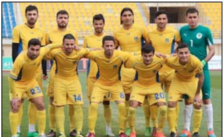
خسارة دهوك امام الشرطة لعدم حضوره