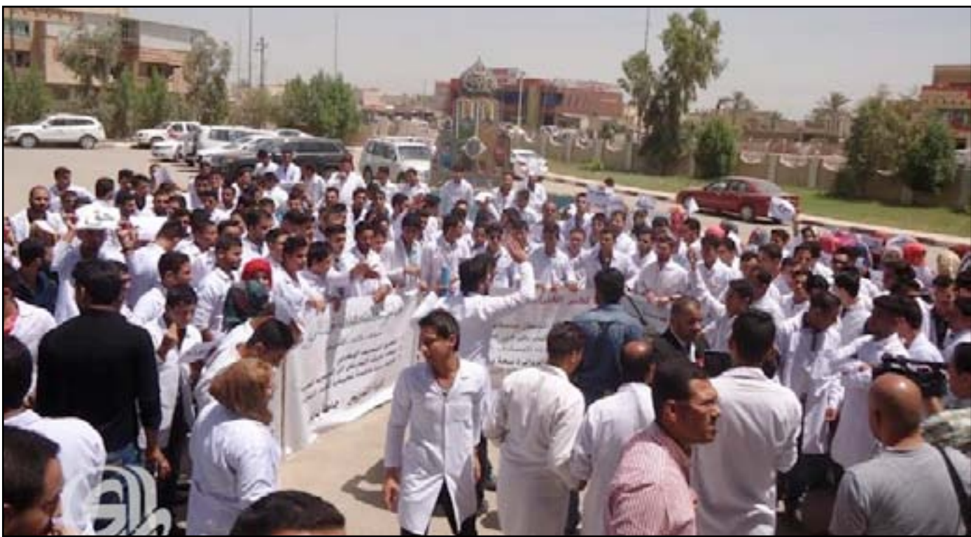
جانب من التظاهرة

تظاهر العشرات من طلبة كلية التمريض في بابل، أمس الثلاثاء، للمطالبة بضم كليتهم إلى المجموعة الطبية وإضافة سنة خامسة، وهددوا بالاعتصام في حالة عدم الاستجابة لهم يوم الثلاثاء القادم، فيما أكدت مديرية صحة المحافظة أن الجهة المسؤولة عنهم هي وزارة التعليم العالي وليس وزارة الصحة.