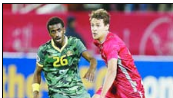
اختبار صعب للنصر امام لخويا

□ دبي / رويترز سيكون النصر السعودي مطالباً بالفوز وحده أمام ضيفه لخويا القطري من أجل التأهل لدور الستة عشر في دوري أبطال آسيا لكرة القدم فيما سيحاول العين الإماراتي التثبيت بصدارة مجموعته في مواجهة ضيفه نطق طهران الإيراني اليوم الأربعاء. ويتعد النصر صاحب المركز الثالث في المجموعة الأولى بفارق نقطتين عن لخويا المتصدر والمتوج حديثاً بالثنائية المحلية في قطر وسيرغب في الفوز للابتعاد