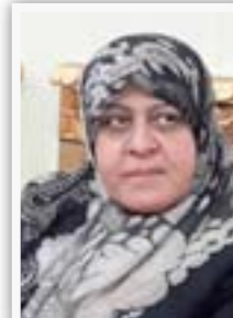
عديلة حمود وزيرة الصحة

الوزارة قررت ارسال المساعدات العاجلة الى المناطق المحررة لجميع مفردات الحصة التموينية والتنسيق مع الأجهزة الأمنية لغرض إيصال هذه المساعدات بشكل سريع وعاجل كذلك إمكانية قيام اسطول الوزارة والشركات الساندة من خلال التعاقد بهدف الاسراع وتجاوز حلقات الروتين، وان شركات الوزارة نفذت حملات كبيرة لانغاة النازحين والمناطق المحررة عبر قوافل وطائرات وايصال كميات كبيرة من المواد الغذائية الى تلك المناطق.