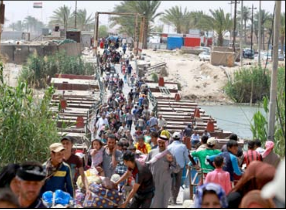
نازحو الأنبار على جسر بزيمر، أربشيف

بغداد خلال الأيام القليلة الماضية عدة تفجيرات بسيارات مفخخة وعبوات ناسفة، فضلا عن حالات قتل وخطف وسطو مسلح، ما أدى إلى مقتل أو إصابة العشرات من المواطنين. وأعلن تنظيم داعش في الأول من أيار الحالي، مسؤوليته عن تفجير ست سيارات مفخخة في العاصمة بغداد، فأرا لنازحي الأنبار، بحسب بيان للتنظيم. يذكر أن الأوضاع الامنية في العاصمة بغداد، تشهد توتراً منذ منتصف العام 2012، إذ ذكرت بعثة الأمم المتحدة في العراق، في الثاني من ايار الجاري، أن شهر نيسان الماضي، شهد مقتل وإصابة 2538 عراقيا بعمليات عنف شنتها مناطق متفرقة من البلاد، فيما أكدت استمرار تدهور الوضع الأمني يجعل الحاجة للمصالحة الوطنية "أكثر إلحاحاً".