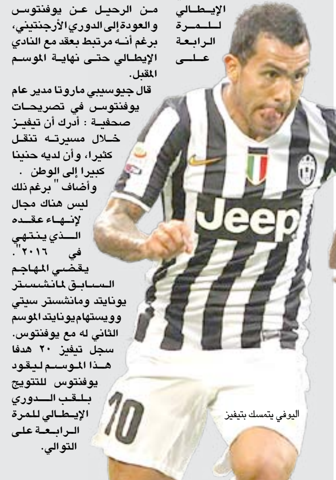
اليوفي يتمسك بتيفيز

قال جيوسيبى ماروتا مدير عام يوفنتوس في تصريحات صحفية: "أدرك أن تيفيز خلال مسيرته تنقل كثيرا، وأن لديه حنيئا كبيرا إلى الوطن". وأضاف "برغم ذلك ليس هناك مجال لإنهاء عقده الذي ينتهي في ٢٠١٦". يقضي المهاجم السابق لمانشستر يونايتد ومانشستر سيتي وويستهام يونايتد الموسم الثاني مع يوفنتوس. سجل تيفيز ٢٠ هدفا هذا الموسم ليقود يوفنتوس للتتويج بلقب الدوري الإيطالي للمرة الرابعة على التوالي.