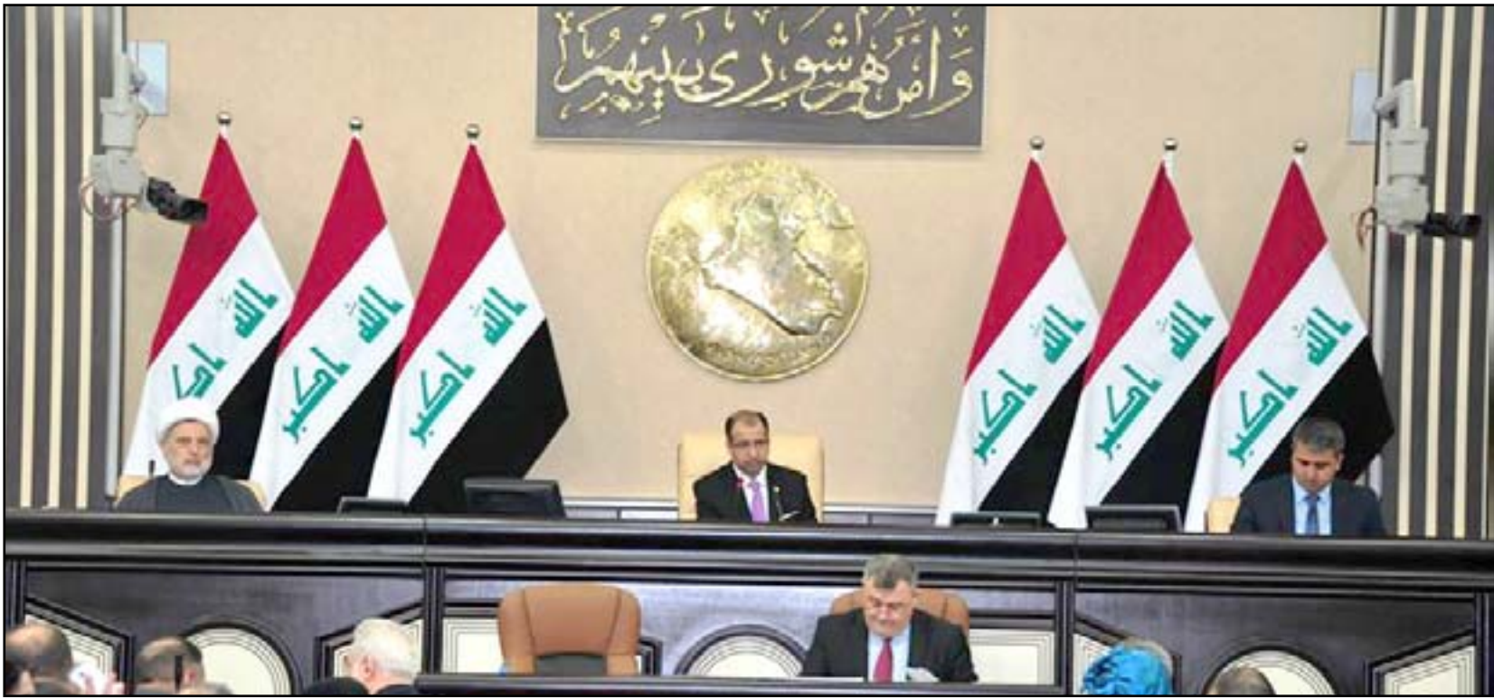
مجلس النواب العراقي

على وقع مخاوف من ان يؤدي تمرير مجلس الاتحاد الى فرض وصاية كاملة على شقيقه مجلس النواب والاكل من جرف صلاحياته التشريعية، اندفعت الكتل السياسية الى رفض مسودة القانون المطروح وحمل رئاسة البرلمان على سحبها من جدول اعمال الجلسة السابقة. وقبل عشر سنوات اقر الدستور العراقي انشاء برلمان بفرقتين، الاول مجلس النواب الذي يعمل بشكل طبيعي، والثاني مجلس الاتحاد بنحو 60 عضوا، والذي لم يتأسس بعد ولم يقر قانونه وظل مجمدا طوال عقد.