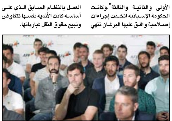
أزمة حقوق النقل التلفزيوني تعود من جديد في الليغا

الأولى والثانية والثالثة". وكانت الحكومة الإسبانية اتخذت إجراءات إصلاحية وافق عليها البرلمان تنهي