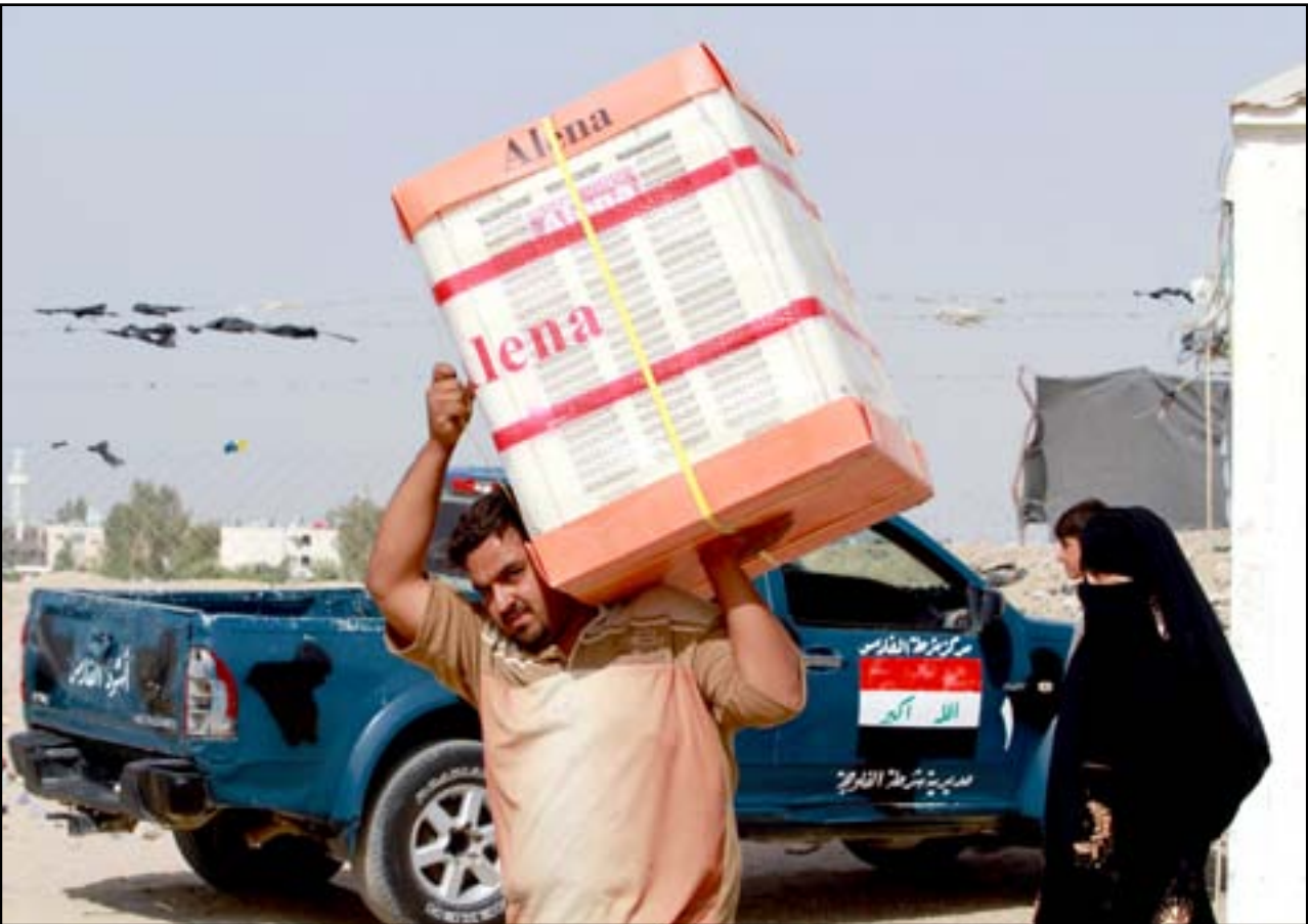
نازح من الرمادي يتسلم مساعدات المرجعية البنيةية.. تصوير محمود رؤوف