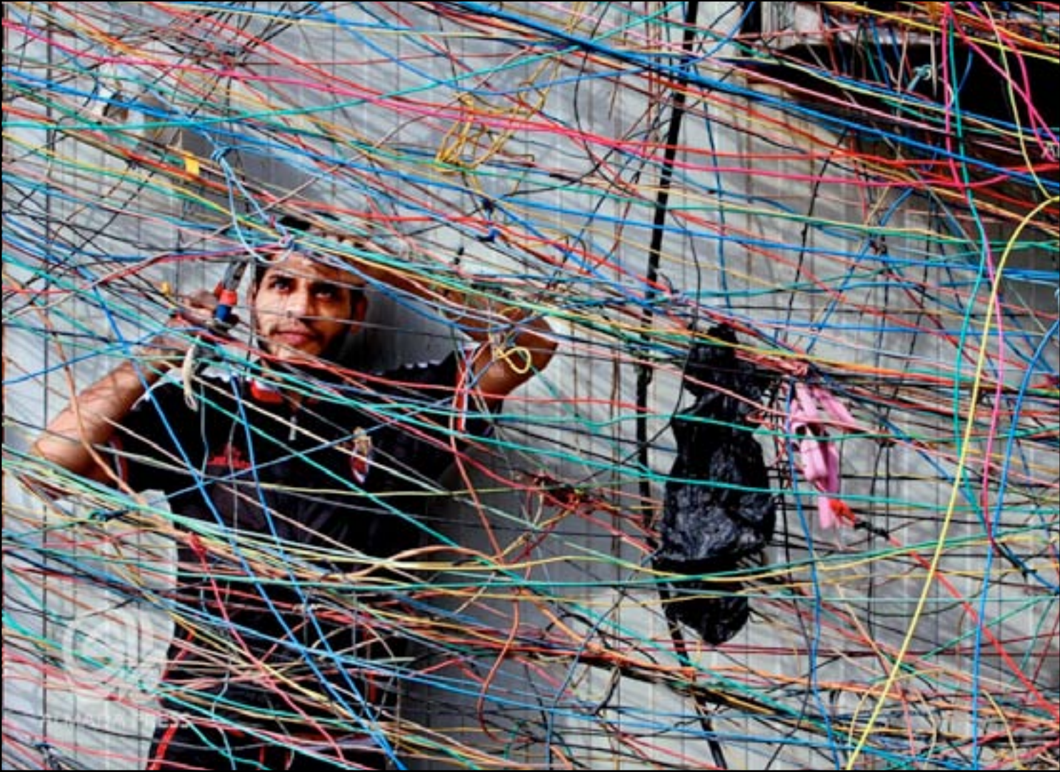
اسلاك المولدات الكهربائية الأهلية تغطي شوارع المدن في العراق

أعلن محافظ بغداد علي التميمي، أمس الأحد، تشكيل لجنة من القوات الأمنية لمتابعة عمل المولدات الأهلية وتفصيل الإجراءات "الرابعة" بحق المخالفين من أصحابها، وأكد أن عقوبة المخالفين قد تصل إلى الحبس لمدة عام وغرامة مليون دينار على أصحاب المولدات الأهلية المخالفة لشروط التشغيل، فيما أشار إلى أن المحافظة ستجري زيارات مكثفة لمجلس القضاء الأعلى لإصدار قرارات تمنع "استغلال" المواطنين.