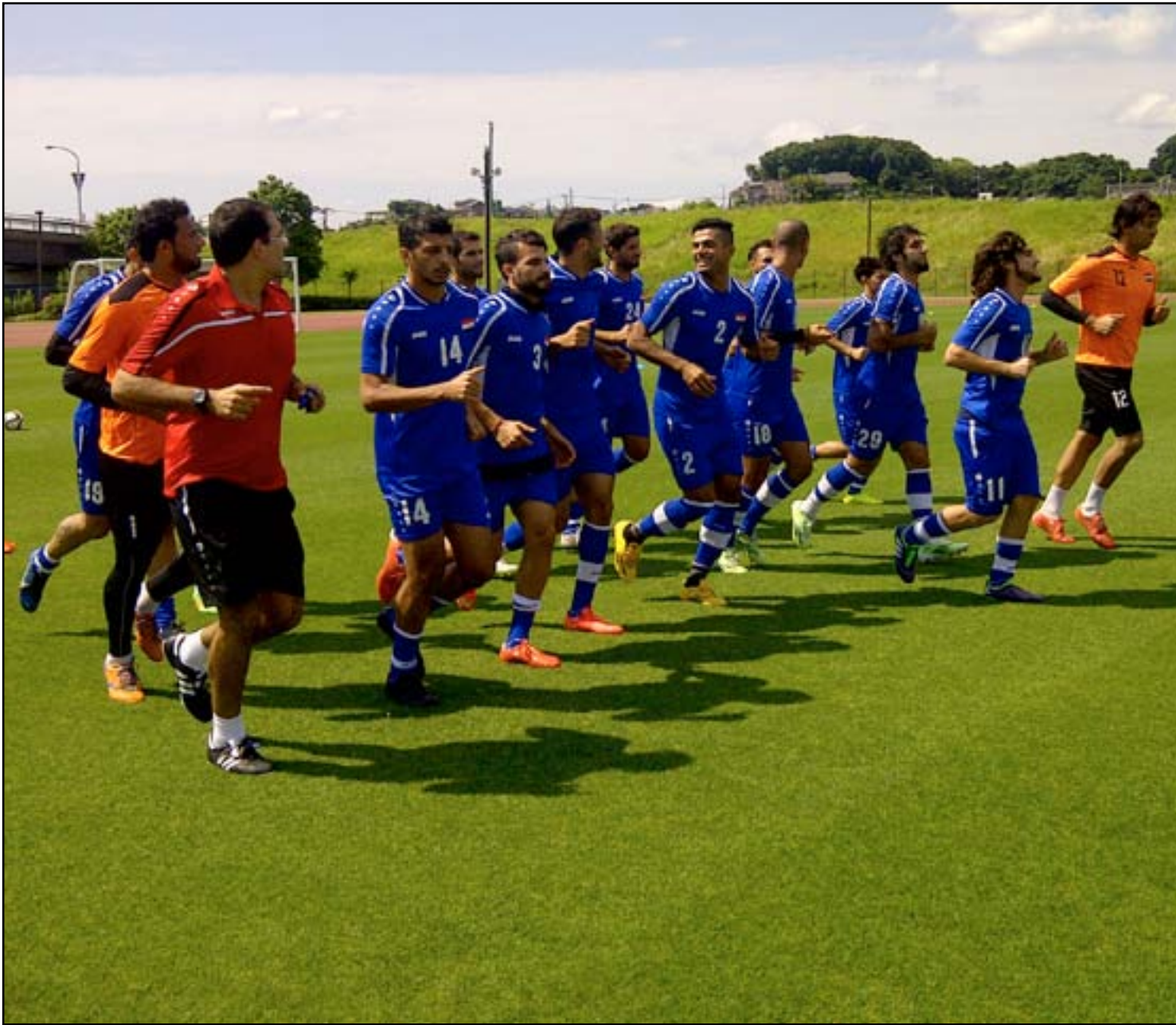
لاعبو المنتخب أثناء الوحدة التدريبية ليوم أمس