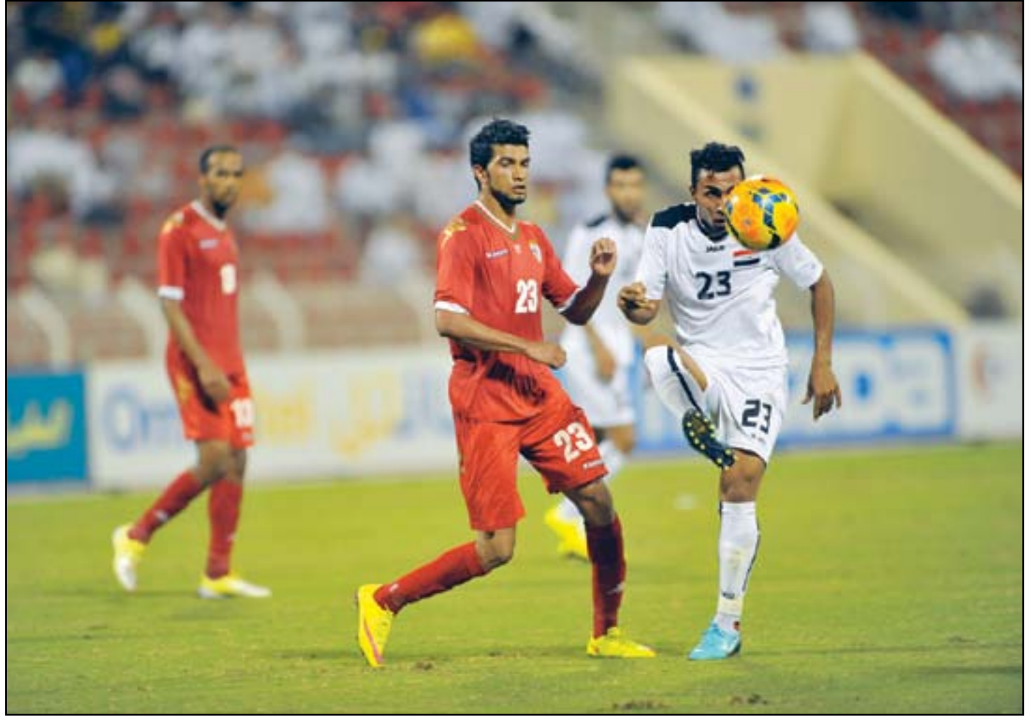
مدرب الأولمبي يسعى لاستقلال عناصر المنتخب

اتمنى ألا يُضخَّ الموضوع لبدأ أكثر من الواقع ، فالجميع عراقيون يعيشون الكرة العراقية ولا يمكن التشكيك في وطنية أي منهم وان الجميع استنكر الأفعال غير المنضبطة إذ سارعت وزارة ثقافة الإقليم الى الاستنكار. وجدد القول ان ملاعبنا في كل بقعة من الوطن تبقى مثالا للتشجيع النظيف المتمسك بسيادة الروح الرياضية لاسيما ان اتحاد الكرة ووزارة الشباب والرياضة والجميع يسعون الى رفع الحظر عن ملاعبنا. وتكشف مسعود ان اتحاد الكرة سيعاقب