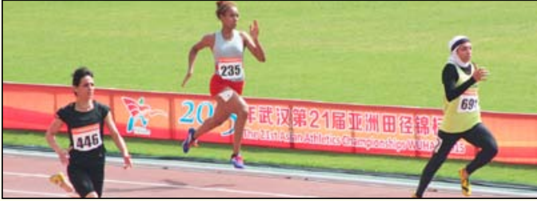
دانة تحقّق في تحقيق مركز متقدم

العالمي الاسطورة للقفز بالزانة سيرجي بوبكا من اجل الاتفاق بشكل نهائي على المعسكر الطويل الأمد للاعب الأولمبي منتظر فالح وقد ابدي الطرفين تعاونهما لإقامة المعسكر أما في المانيا او فرنسا. × المنسق الاعلامي لاتحاد العاب القوى