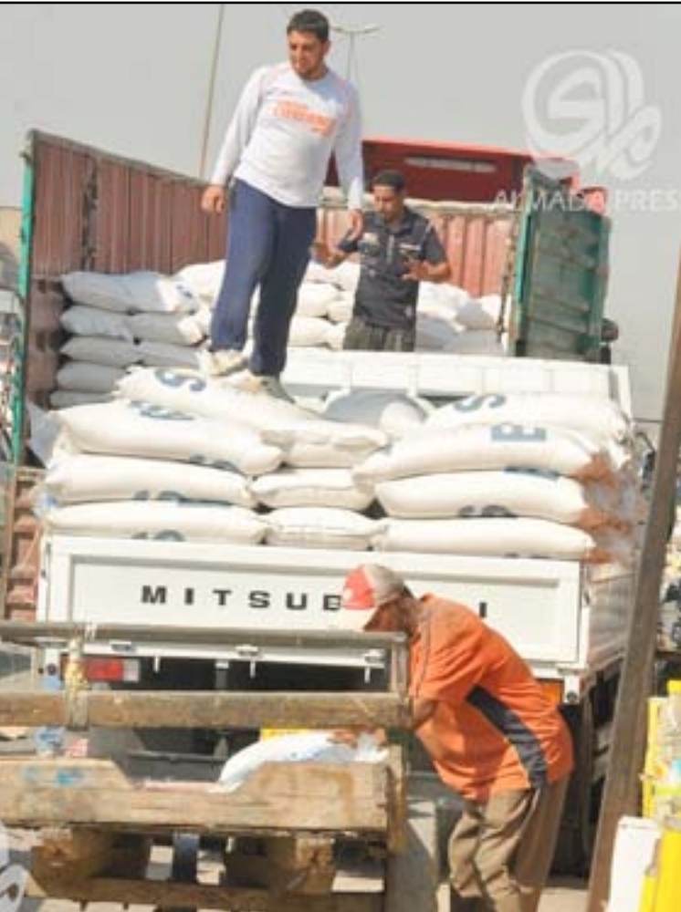
عمال يقومون بتفريغ إحدى شاحنات المواد الغذائية

وأضاف عبد الكريم، إن "مخازن الوزارة ومراكز التسليم دعت وكلاء المواد الغذائية لإستلام كامل حصصهم من المفردات التي تشمل السكر والرز والزيت والطحين وإعداد جدول بالاستلام في هذه