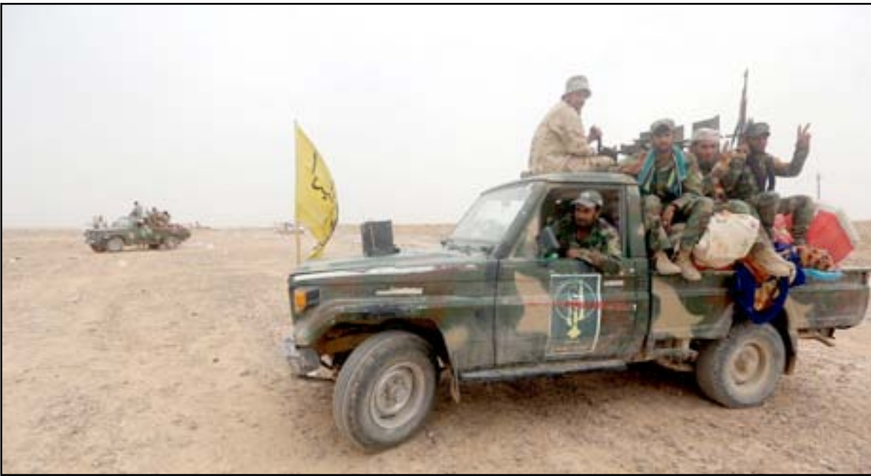
قوات الحشد الشعبي في الثرثار.. ا.ف.ب

أعلن قائد فرقة الرد السريع في وزارة الداخلية، امس الأحد، تحرير مركز قضاء بيجي شمالي تكريت (170 كم شمال بغداد) ورفع العلم العراقي فوق مبنى القائم مقامية القضاء - وفيما أشار إلى أن القوات المشتركة مستمرة بتقدمها لتطهير جيوب داعش في القضاء، أكد أن عناصر داعش بدأوا بالانسحاب إلى مدينة الموصل بعد تكبيدهم "خسائر كبيرة".