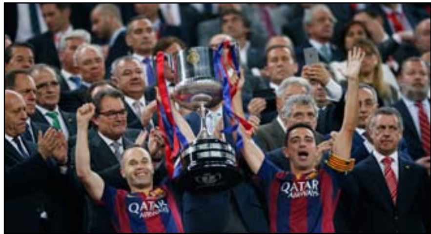
تشافي واينيستا يحملان الكأس الخامسة

راوول غونزاليز المركز الثالث في عدد المباريات بالبطولة (١٤٢)، ويأتي الويلزي راين