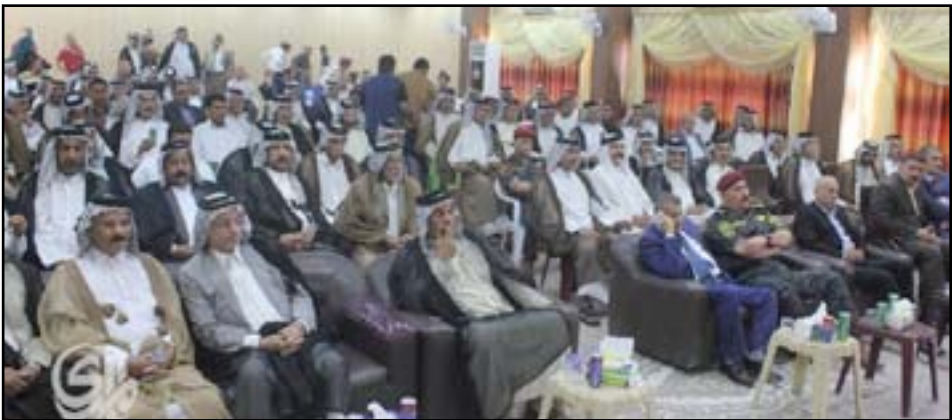
وجاء الديوانية ونشاطها خلال المؤتمر

وبعد البدر "رجال الدين ونشطاء المجتمع المدني والسلطات التشريعية والتنفيذية إلى الوقوف بحزم تجاه النيل من كرامة المرأة وتفعيل القوانين الرادعة التي تضمن لها حرية اختيار المصير"، مطالباً بـ"ترك ظاهرتي (الفصلية) و(النفوة) العشائريتين، من قاموس العقوبات العشائرية واللجوء إلى القانون بما يعزز هيبة الدولة وفرض النظام والقانون،