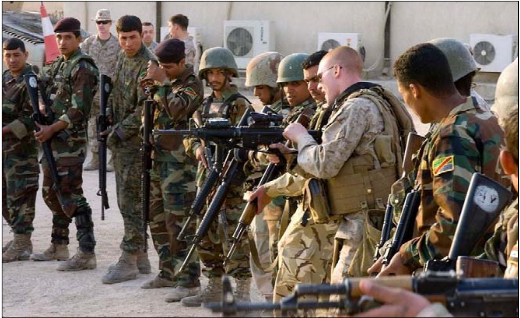
أميركي يدرّب جنوداً عراقيين على استخدام السلاح..

يقرب أسبوعين بأسرع ما يمكن. وخلال اجتماع باريس هذا الأسبوع، أعرب رئيس الوزراء حيدر العبادي عن إعجابته قائلاً إن بغداد لم تتسلم أي شيء من المساعدة الدولية الموعودة. وقال دوغلاس أوليفانت المستشار السابق في إدارة أوباما وبوش