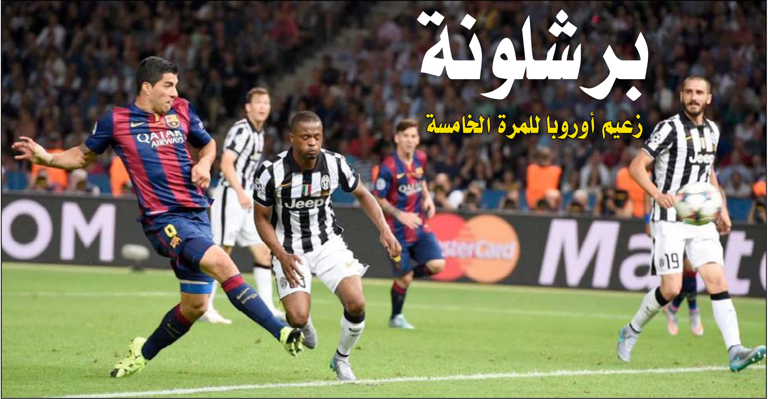
لويس سواريز ينهي آمال السيدة العجوز في موقعة الإبطال

حول نفسه وسدها من مسافة قريبة ارتدت من تير شتيغن إلى مورانا الذي تابعها إلى داخل الرمي الخالي (٥٥). وكاد تيفيز يفعلها من تسديدة قوية من خارج المنطقة فوق الرمي شتيغن (٦٥).