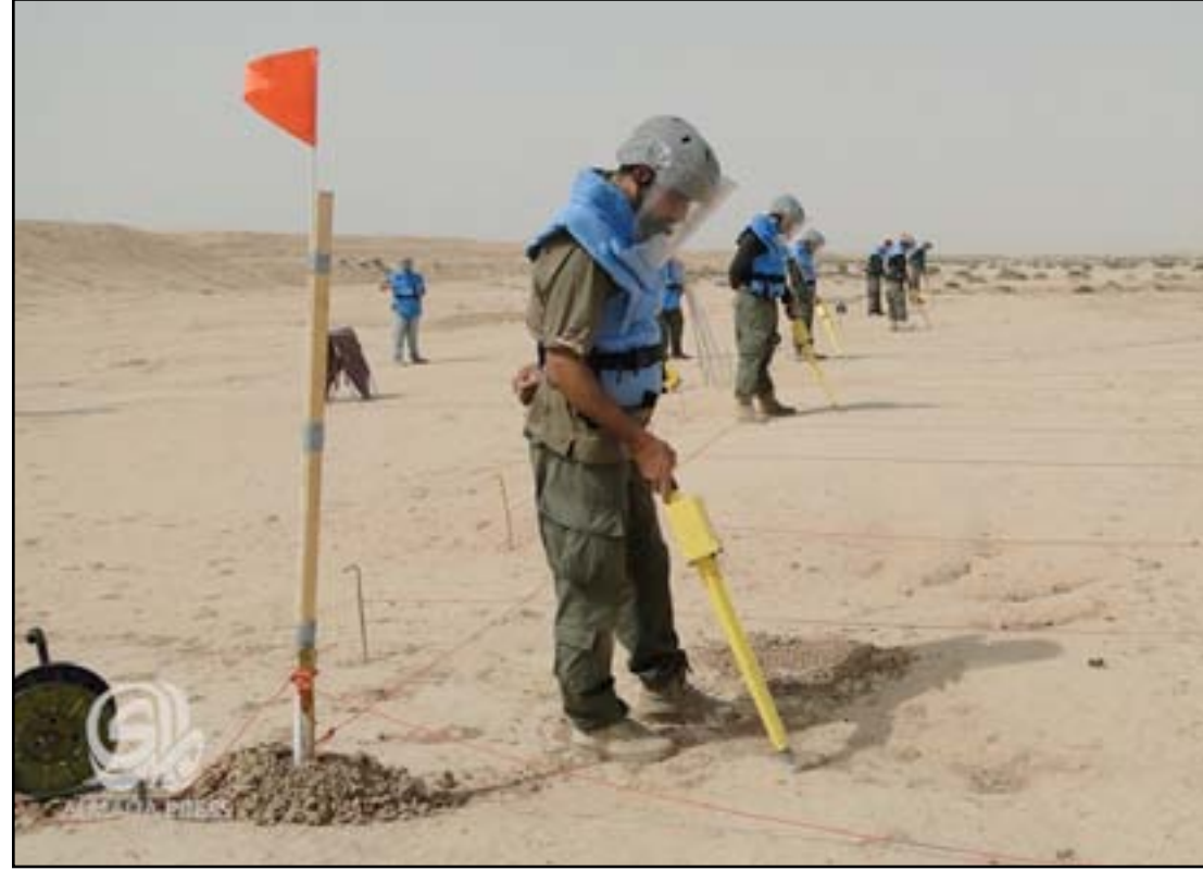
فرق ميدانية متخصصة للتحرير عن الألغام في مناطق الشريط الحدودي بمحافظة واسط مع ايران

وتنص اتفاقية أوتواو، التي وقعت عليها أكثر من ١٥٥ دولة عضواً في الأمم المتحدة وبخلت حيز التنفيذ في عام ١٩٩٩، على حظر استخدام وتصنيع ونقل وتخزين الألغام المضادة للأفراد والاتجار بها مع مساعدة الناجين من وياتلها.