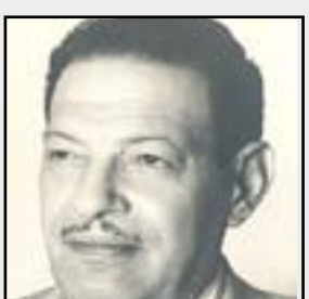
وفاة شارلي شابلن العرب