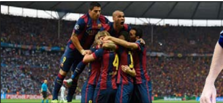
برشلونة يسدد عقد فيرمالين

وكان برشلونة الإسباني فاز في النهائي على يوفنتوس الإيطالي بثلاثة أهداف لهدف، ليتوج ببطولته الرابعة في السنين ١٠ الأخيرة، والخامسة بشكل إجمالي.