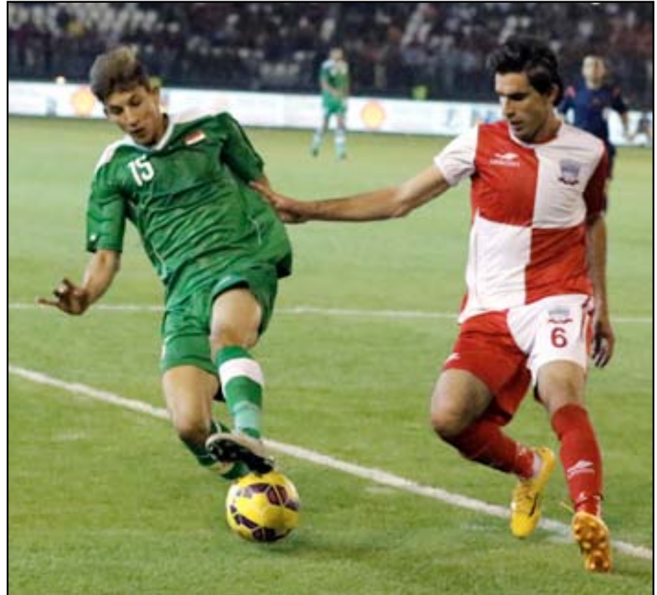
الشباب يبدي عدم رضاه لما حدث في ملعب زاخو الدولي

أبدت وزارة الشباب والرياضة عدم رضاهم من تصرفات بعض المحسوبين على الجمهور الرياضي أثناء لقاء منتخبنا الوطني مع فريق نادي زاخو. وجاء في بيان صادر عن المكتب الإعلامي للوزارة تلقت (المدى) نسخة منه إن الوزارة تابعت باهتمام بالغ جميع الملاحظات التي تودت بخصوص الأحداث التي راقت المباراة الودية التي