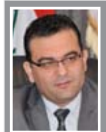
وزير الهجرة جاسم محمد

الترهل الوظيفي وهدر الوقت في مؤسسات الدولة يكلفان البلد أموالاً طائلة مشدداً على ضرورة اجراء مراجعة شاملة ومقارنة بين ساعات العمل ومقدار الانتاج والانجاز، وان الدوام الرسمي بحسب القانون يجب ان يكون ٨ ساعات كونه نظاماً عالمياً، ان الوقت في الدوائر الحكومية العراقية ليست له قيمة والموظف يتقاضى راتبه لكونه موظفاً فقط، باستثناء بعض الوزارات والدوائر التي تقدم خدمة مباشرة للمواطن.