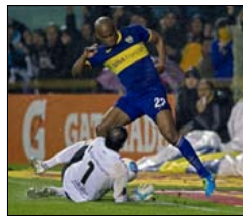
جونيورز يحقق الانتصار من دون جمهوره

عاد بوكا جونيورز إلى طريق الانتصارات بعدما سحق نيويلز اولد بويز ٤-٠ في الدوري الأرجنتيني لكرة القدم برغم أن مشجعيه لم يحضروا لمشاهدة انتصاره.