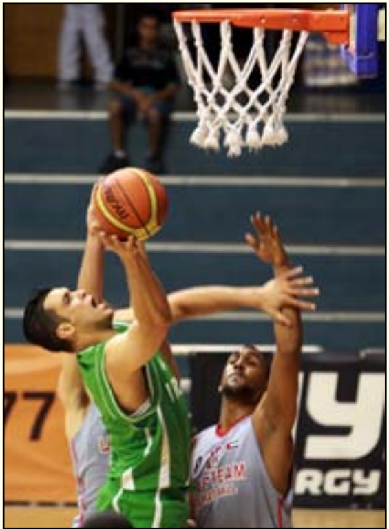
اتحاد كرة السلة يعيد النظر بادارة اللعبة