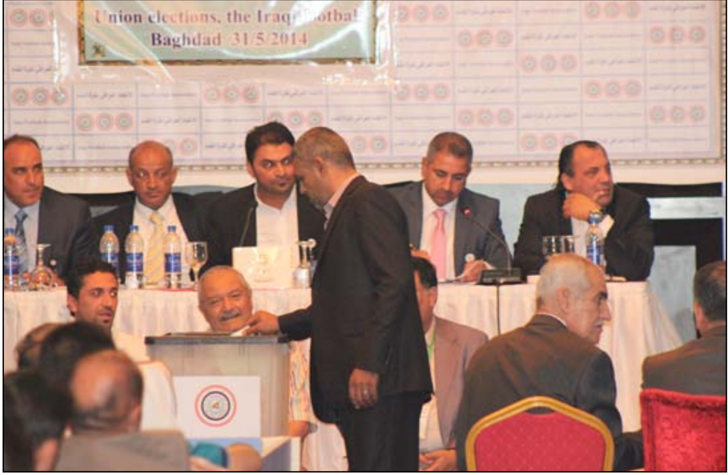
مخالفة مالية تضع الأولمبية بمأزق أمام اتحاد الكرة

استثنائياً يوم ٤ آذار الماضي بعد تسلمه إشعاراً رسمياً من محكمة التحكيم الرياضي بوجوب دفع حصته من المصاريف بخصوص قضية المعارضين على اتحاد الكرة التي تم حسمها بإلغاء انتخابات يوم ١٨ حزيران ٢٠١١ خلال ١٠ أيام قبل ان تتم مضاعفة المبلغ في حالة التسديد وتمت الموافقة بان يتم التسديد عن طريق الايمن المالي كامل عداي الذي بعته بعد ذلك الى المحكمة من اجل اغلاق الملف بشكل نهائي وتم اشعار الامة المالية للجنة الاولمبية بذلك.