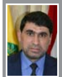
النائب حسن خلاطي البرزوني

ابلق وزير العدل حيدر الزامل القنصل العراقي في جدة خلال مشاركته بأعمال المكتب التنفيذي لمجلس وزراء العدل العرب استعداد الوزارة لتبادل السجناء مع السعودية، وتمت مناقشة مسألة التمييز بين السجناء السعوديين والحكوميين في قضايا ارباب عن القضايا المدنية، وابدى الزامل استعداد الوزارة لتفعيل اتفاقيات تبادل السجناء مع استثناء الحكوميين في قضايا اربابية.