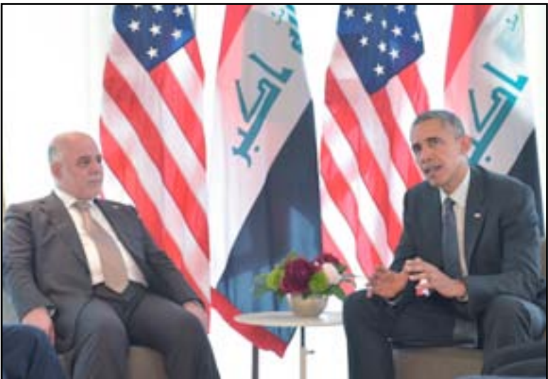
العبادي وأوباما خلال اجتماع أمس

واضاف أوباما "لقد قمنا بإحراز تقدم كبير ضد داعش ودفعناه من المناطق التي سيطر عليها"، مشيرا إلى أن "داعش تراجع بشكل كبير من المناطق التي سيطر عليها في العراق".