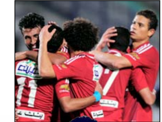
الأهلي يتأهل الى دور الثمانية

العالم لسباقات سيارات فورمولا 1. وانطلق هاميلتون بطل العالم من المركز الأول في السباق وحافظ على تقدمه أمام زميله الألماني نيكو روزبيرغ حتى النهاية، ليحتكر أول مركزين لصالح فريق مرسيدس، للسباق الرابع هذا الموسم. وحافظ هاميلتون، الذي توج للمرة الأولى في مسيرته على المضمار نفسه في أول