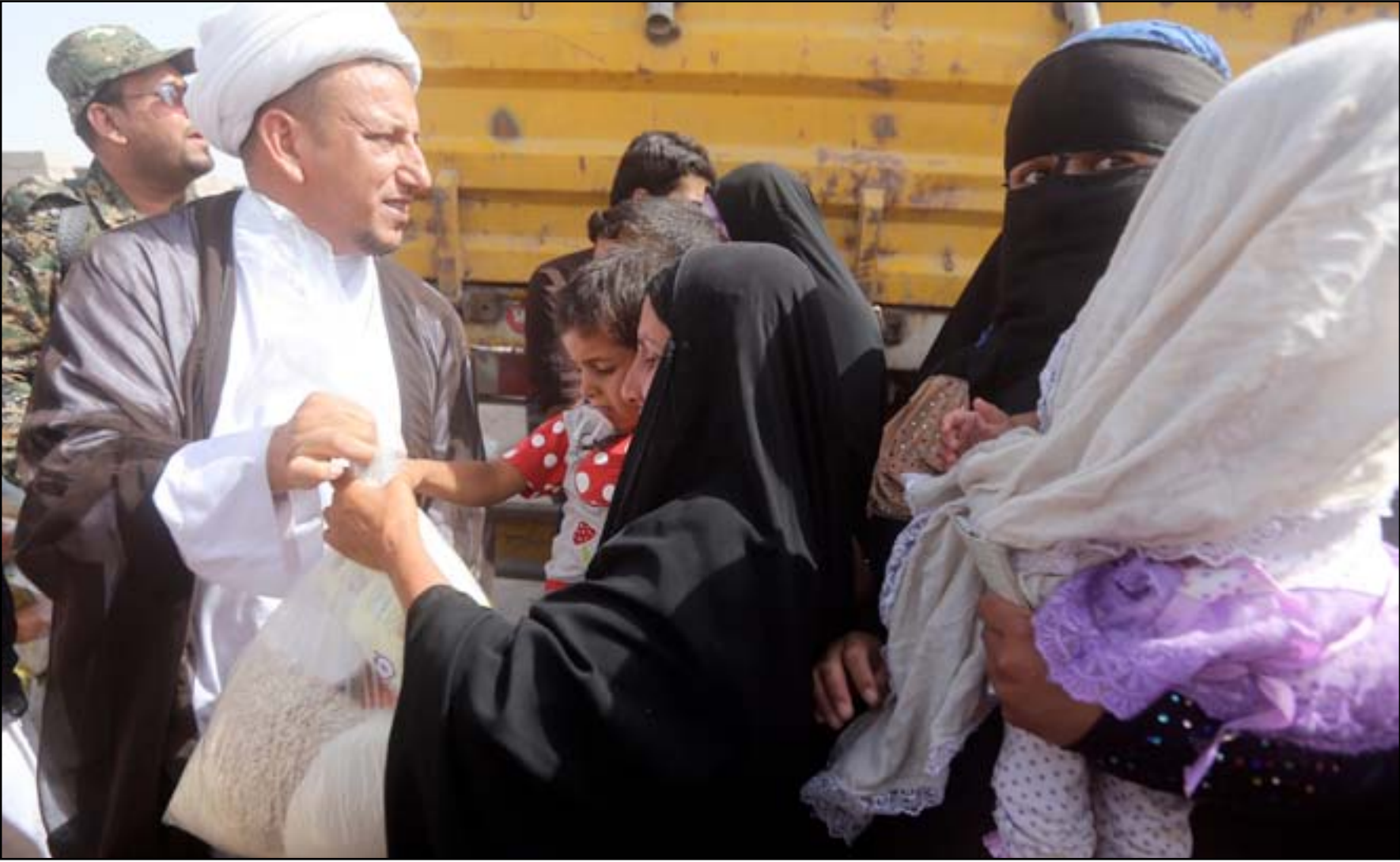
وفد المرجعية يوزع المساعدات على النازحين.

أكد شيخو عشائر ناحية عامرية الفلوجة، أن زيارة ممثل عن المرجع الديني الأعلى السيد علي السيستاني وشيوخ عشائر الوسط والجنوب أثبتت للذين يحاولون الترويج للطائفية بأن العراق ينعم بوحدته. وفيما أشاروا إلى أن عامرية الفلوجة استقبلت أكثر من ٣٠ ألف نازح، طالب نازحون وضع حل لمعاناتهم والسماح لهم بالدخول إلى بغداد والمحافظات الأخرى قبل شهر رمضان.