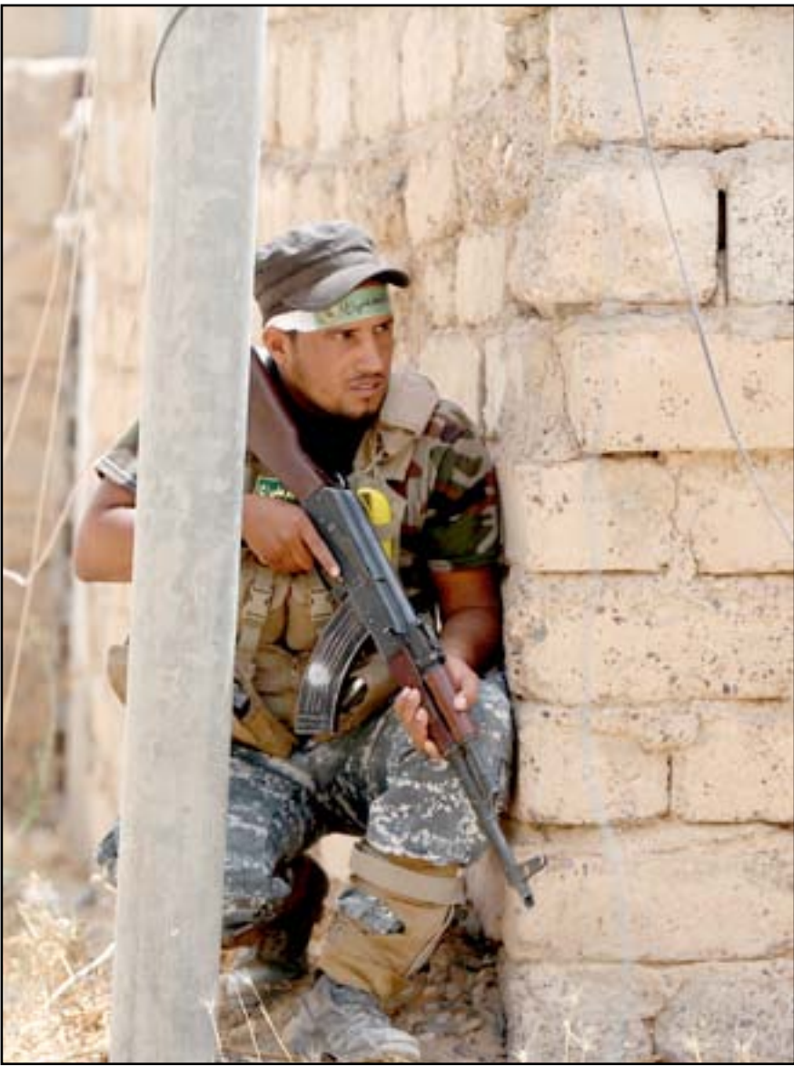
جندي خلال عمليات تطهير قضاء بيجي امس ..

«العدالة والتنمية» يخسر الغالبية المطلقة.. وأردوغان يدعو للحفاظ على الاستقرار