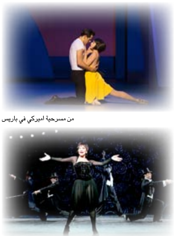
من مسرحية اميريكي في باريس

شيتا ريفيرا في احدى المسرحيات الاقرب للفوز بجائزة أفضل ممثلة عن تأديتها لدور الملكة اليزابيث الثانية بمسرحية (الجمهور) متفوقة على كاري موليجان و اليزابيث موس . وفي فئة أفضل ممثل بعمل موسيقي توقع معظم الخبراء ان تكون المنافسة قوية بين مايكل سيرفيريس ورافص الباليه وروبرت فيرشايلد . وفي فئة أفضل ممثلة بعمل موسيقي تنحصر المنافسة بين شينويث وكيلي اوهارا والمخضرمة شيتا ريفيرا .