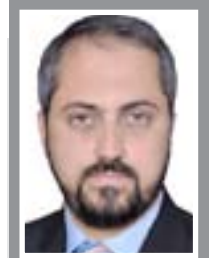
وزير العدل حيدر الزامل

ابلق وزير العدل حيدر الزامل القنصل العراقي في جدة خلال مشاركته بأعمال المكتب التنفيذي لمجلس وزراء العدل العرب استعداد الوزارة لتبادل السجناء مع السعودية، وتمت مناقشة مسألة التمييز بين السجناء السعوديين والحكوميين في قضايا ارباب عن القضايا المدنية، وابدى الزامل استعداد الوزارة لتفعيل اتفاقيات تبادل السجناء مع استثناء الحكوميين في قضايا اربابية.