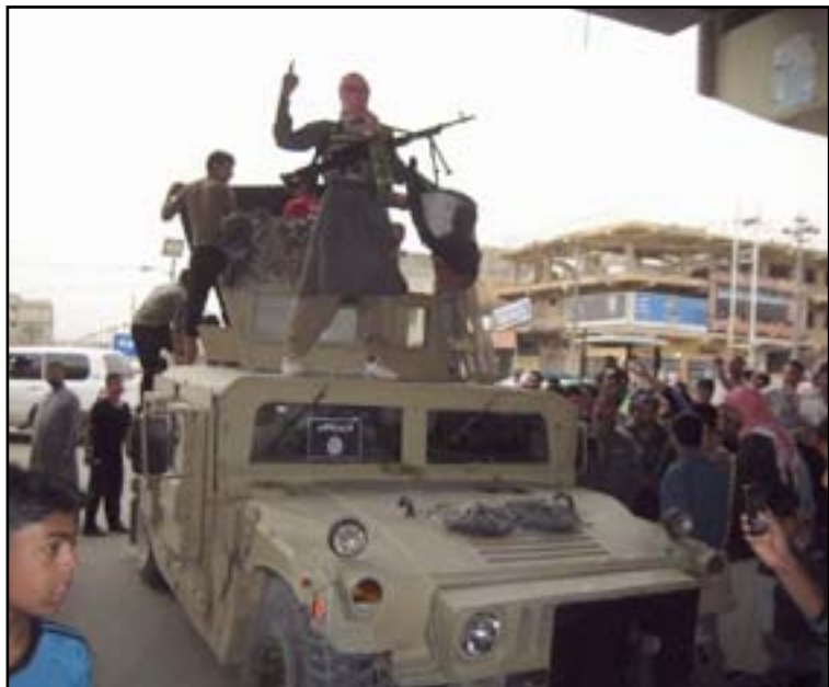
داعش يستولي على آلية عسكرية

وطالبت عضو المفوضية الادعاء العام بضرورة "التحرك فوراً وفتح قضية"،