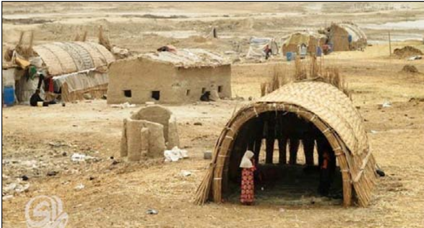
جفاف اهورا الناصرية