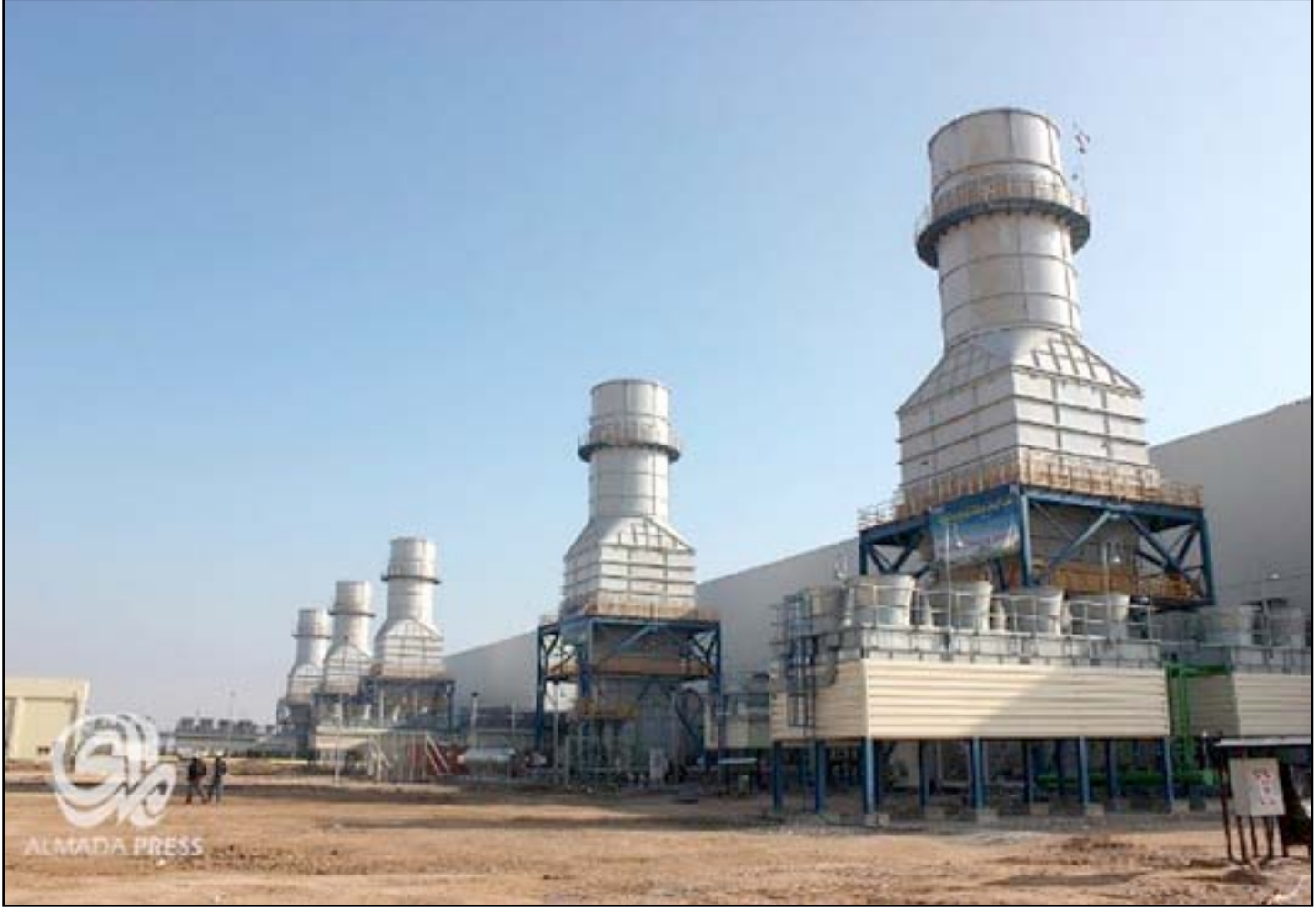
محطة الرملة الغازية في البصرة