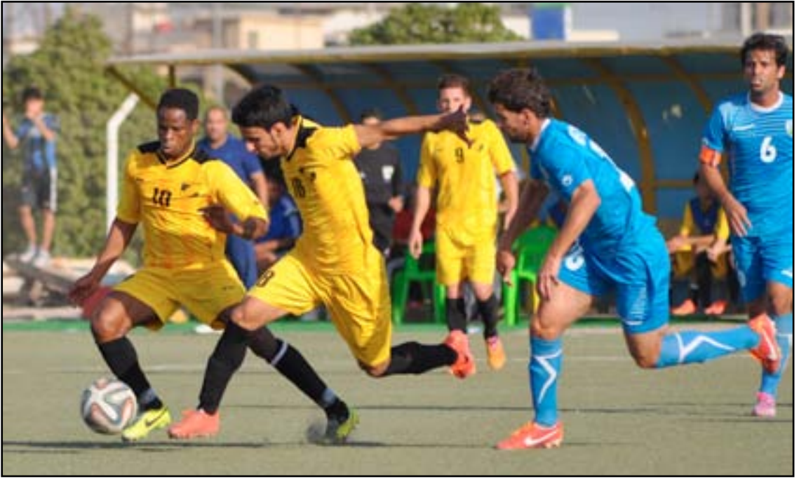
نط الجنوب يواصل مبارياته الودية في بيروت

وتابع: ان المرحلة القادمة من الدوري الممتاز تتطلب جهوداً كبيرة من الجميع كونها مرحلة حاسمة ولا تتحمل أي تعويض وما نتمناه من اللاعبين ان يكونوا على قدر المسؤولية لتحقيق إنجاز طال انتظاره.