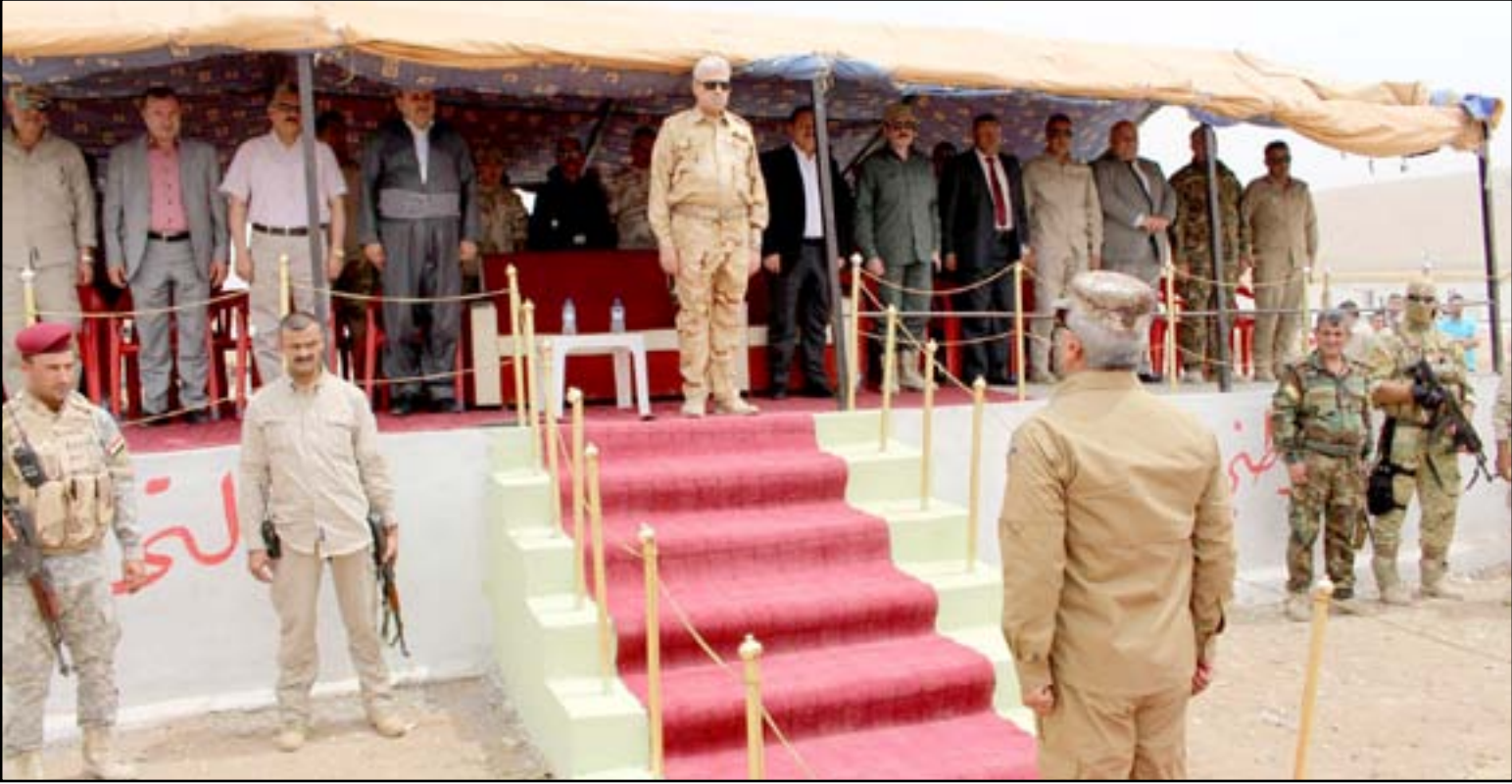
اقبال النجيفي في معسكر تحرير نينوى

منذ ستة اشهر يترقب سكان الموصل لحظة اعلان ساعة الصفر لتحرير المدينة التي سقطت قبل عام بيد تنظيم "داعش". في هذا الوقت يتحدث القادة العسكريون عن وصول طائرات امريكية متطورة ومتخصصة بقتال المدن، واكتمال الاستعدادات للحرب هناك. لكن لا تبدو تلك الاجراءات "مقنعة" لبعض المسؤولين المحليين في نينوى نظرا لقرهيم من الاحداث.