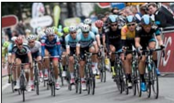
جانب من سباق لندن

أضاف البريطاني برادلي ويغينز الرقم القياسي العالمي لسباق الساعة الواحدة الى حصيلته الرائعة من الانقلاب في رياضة الدراجات على مدار مسيرته بعدما حطم الرقم الذي كان سجله مواطنه اليكس دوسيت الشهر الماضي بقطع ٥٤,٥٦٦ كيلومتر في المضمار الاولمبي في لندن. وبدا ويغينز- الفائز بسباق فرنسا