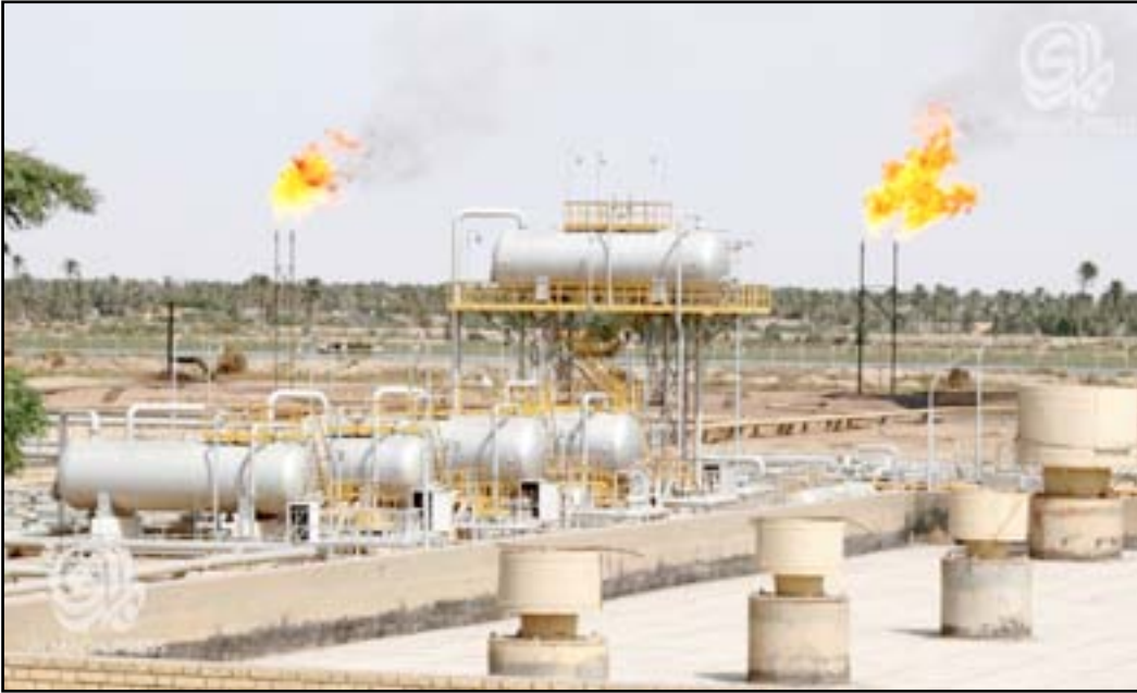
مرفق تخزين النفط في العراق، حيث تم تخزين 14 مليون برميل نفط إضافي.

يذكر ان وزارة النفط العراقية أكدت، يوم الاثنين، (الأول من حزيران ٢٠١٥)، أن موقفاً سيكون "مشجعاً" مع باقي أعضاء منظمة الدول المصدرة للنفط (أوبك) خلال الاجتماع الذي سيعقد نهاية الأسبوع الحالي في العاصمة النمساوية فيينا، وفي حين بين أن العراق يسعى دائماً لتحقيق الاستقرار في أسعار النفط وحل حالة توازن بين العرض والطلب في السوق العالمية، رجحت الإبقاء على سقف الإنتاج الحالي للمنظمة.