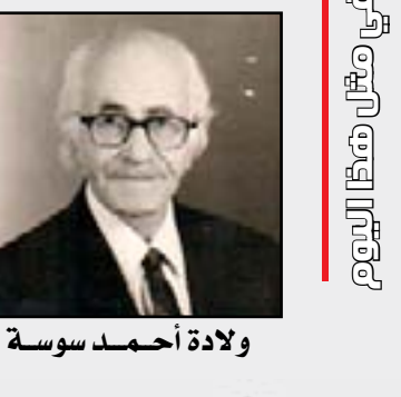
ولادة أحمد سوسة

في مثل هذا اليوم التاسع من حزيران من عام ١٩٠٠ شهد النور احمد سوسة المهندس والمؤرخ العراقي الكبير ، وصاحب المؤلفات التاريخية الشهيرة . وأحد أركان النهضة الفكرية في العراق الحديث . ولد الدكتور أحمد نسيم سوسة في مدينة الحلة في أسرة يهودية معروفة بثرائها ، وأنتم دراسته الإعدادية (الثانوية العامة) في الجامعة الأمريكية ببغروت عام ١٩٢٤م، ثم حصل على شهادة البكالوريوس في الهندسة المدنية عام ١٩٢٨ من كلية كولورادو في الولايات المتحدة. وواصل بعد ذلك دراسته العليا فنال شهادة الدكتوراه بشرف من جامعة جون هوبكنز الأمريكية عام ١٩٣٠، ويعد الدكتور