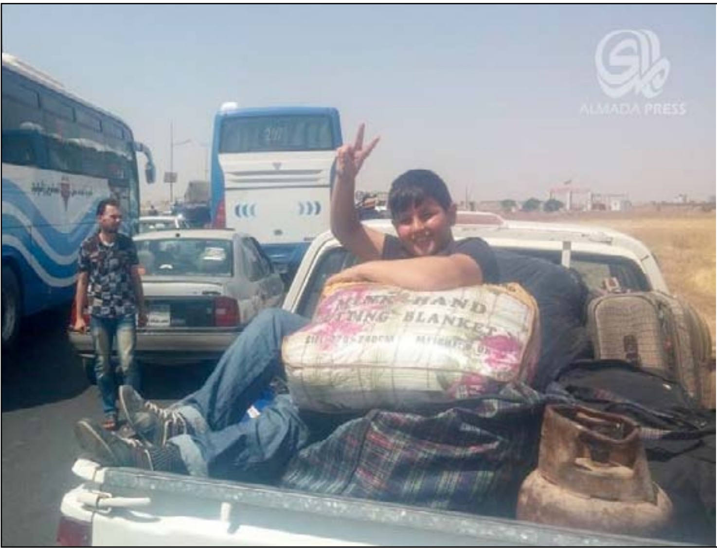
نازحون في طريق عودتهم إلى صلاح الدين

أعرب نازحون في صلاح الدين، أمس السبت، عن أسفهم من عدم الاهتمام الحكومي لهم "وشطبهم من قوائم العراق"، رغم تحرير مناطقهم منذ أربعة أشهر، مشيرين إلى أن مخيم الحردانية جنوبي تكريت يقتصر إلى كل مقومات الحياة سيما خلال شهر رمضان، فيما دعوا المرجعية الدينية إلى المساهمة بإعادتهم إلى منازلهم.