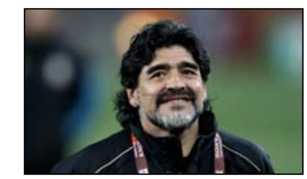
دييغو أرماندو مارادونا

وكان تيفيز بدأ مشواره مع بوكا جونيورز ببلوغه