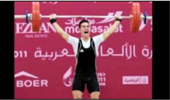
إخفاق كرار على طاوله الاتحاد