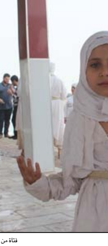
فتاة من الطائفة المندائية في عيد الخليفة.

من يتوقع تحقيقاً في قضية غزوة اتحاد الادباء عليه أن يفشش في نتائج ملفات اللجان التحقيقية التي شكلتها الدوائر الامنية نتيجة الخروق الدستورية والقانونية في عموم مدن العراق، وعلى مدى أكثر من عقد. ومن يبحث عن نهايات معلومة لتجاوزات المسلحين غير المسّين في سجلات الدوائر الامنية على الحريات الشخصية علينا ان نوظف من غفوة هذه. هناك شعور بالخيبة يمارسه الجميع. أرفع الهاتف عقيب كل غزوة وحادث قتل في البصرة واتكلم مع ضباط كبار في الشرطة، استعلم منهم عن يقوم بذلك، ومن يقف وراء الحوادث هذه فأسمع اجابات باردة، تقليدية، لا تعني أحداً، هكذا مثلما يجيبني أحد حين أسأله عن شارع لا يعرفه، مثل اجابته عندما إذا كان بإمكانه أن يدلني على وجود محل لبيع الثياب المستعملة لا يعرفه هو. وإذا لم ألق أجابني الإجابة الأكثر تقليدية: أنت تعرفهم، هم نفسهم، المسلحون المجهولون، نحن الشرطة سنحقق في الموضوع، لا شيء بأيدينا. بالأمس ضيف مجلس محافظة البصرة المحافظ. ماجد النصاروي، وتطابرت أرقام مليارية خرافية: ٢٦٠٠ مليار تمت اعبائها للخزينة منذ ٢٠١٣ و ١٧٠٠ مليار مصروفة بأوجه غير معلومة، ولم يصادق على مظهره المجلس، ومثل الأرقام هذه صرفت في مشاريع وهمية، لا يرى المواطن منها شيئاً على الواقع. في مدينة خربة، تتراجع فيها الخدمات وتفقوض فيها الحريات. المحافظ يجيب عن أسئلة المجلس، التي يُعتقد أنها سياسية، أكثر مما هي اقتصادية- استثمارية، والمجلس يتهم المحافظ بصرف المبادرات دونما نتائج ملموسة ولجنة الزائلة التي حركت الموضوع، لم نسمع أنها جرت لجنة، أو ساقطت مقاولاً لصلى الى القضاء. منذ وجودها كعصب قضائي في المجلس ... عن أي بلاد نتحدث ترى؟