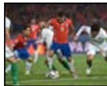
تشيلي تقسو على بوليفيا بخماسية