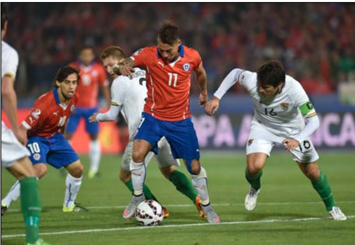
تشيلي يقيم مهرجان أهداف في مرمى بوليفيا

بدأت المباراة بإيقاع لعب سريع وأشعل المنتخب التشيلي المدرجات مبكراً عندما استغل