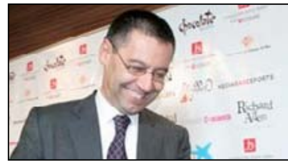
غوسيب ماريا بارتوميو

طموح حقق نجاحاً هائلاً. برشلونة أول ناد في العالم تبلغ عائداته ٦٠٠ مليون يورو". وبرغم تصدده استطلاعات الرأي التي تشير إلى حصوله على أكبر نسبة من أصوات أعضاء الجمعية العمومية للنادي في الانتخابات المقبلة، يحرص بارتوميو على استعادة شريط إنجازاته مع النادي ومن بينها فوز الفريق بالثلاثية (دوري وكأس إسبانيا ودوري أبطال أوروبا) في الموسم المنقضي بقيادة المدرب لويس إنريكي.