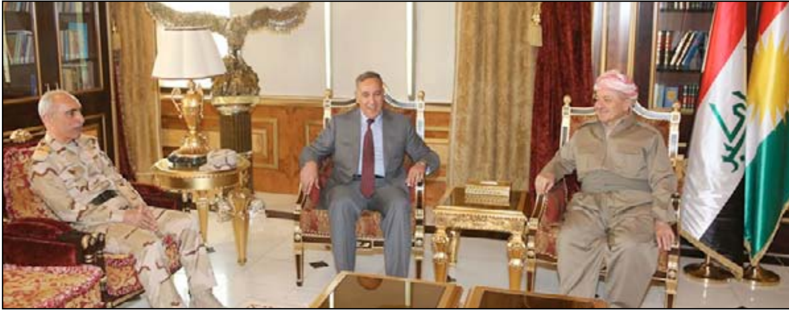
بارزاني خلال استقبال العبيدي وياكر زيباري