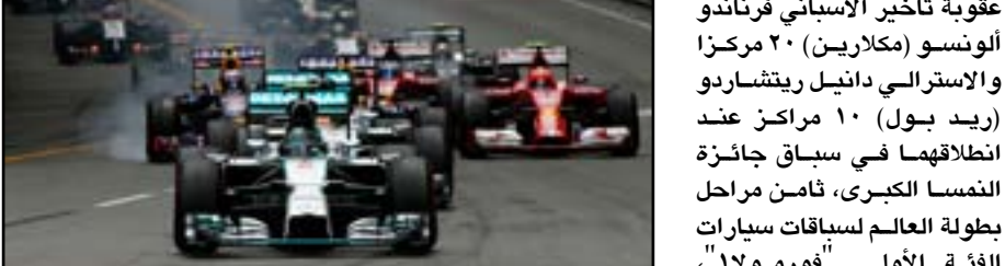
معاينة ألونسو ٢٠ مركزاً

المقررة بأربع مرات، وتبلغ عقوبتها التأخير عشرة مراكز. وقام ألونسو أيضاً بتغيير عنصرين من وحدة الطاقة الداخلية الخامس خلال هذا الموسم.