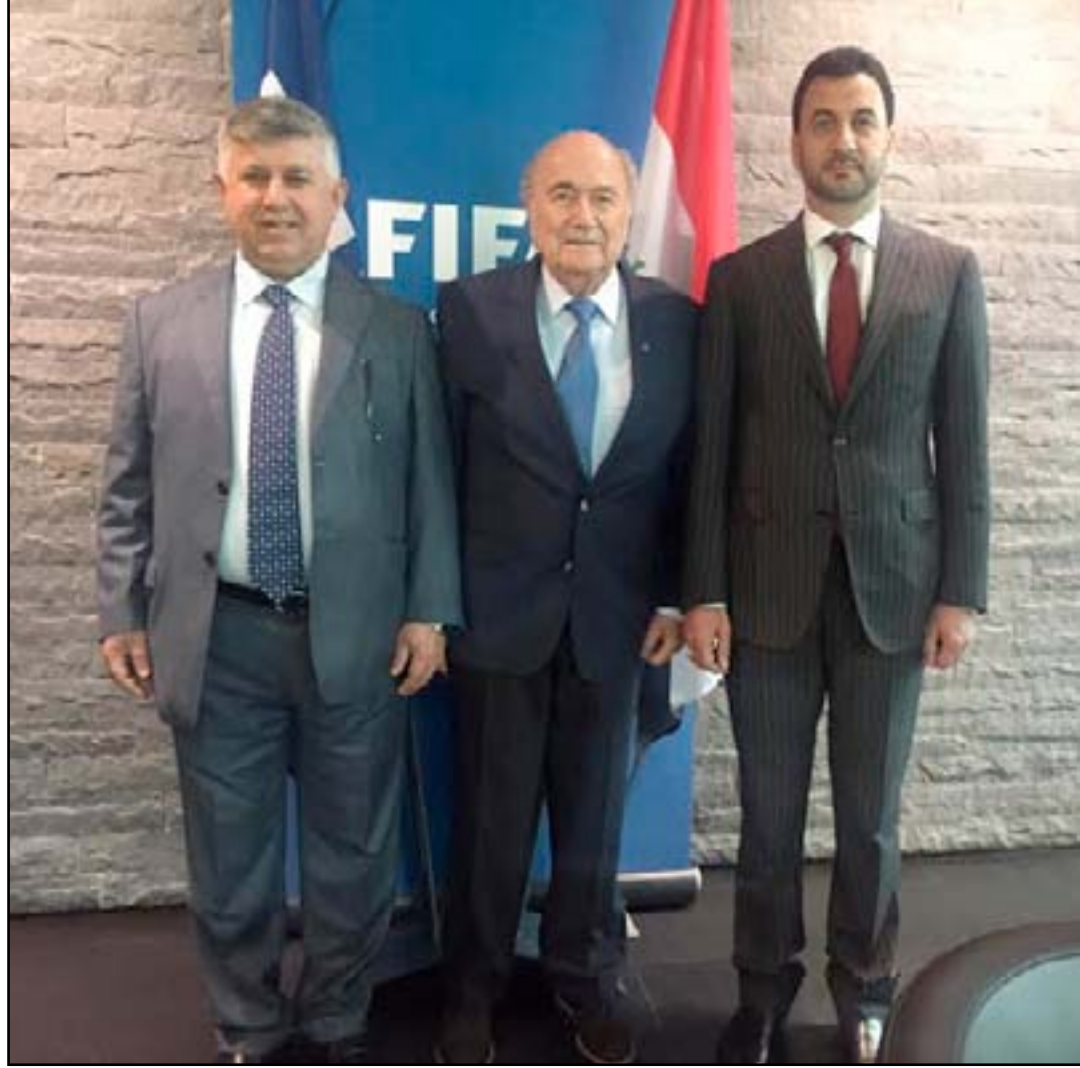
اثناء استقبال بلاتر لبطان ومسعود الدولي والاسيوي الحضور الى البصرة، لا يمكن وصف هذه الخطوة سوى أنها إهانة للعراق . وقال رئيس لجنة الشباب والرياضة

أعرب النائب جاسم محمد جعفر البياتي رئيس لجنة الشباب والرياضة النيابية عن أسفه من إعلان الاتحاد الدولي بكرة القدم إلغاء مباراة منتخبنا وسوريا الودية التي كان من المزمع إقامتها في البصرة في السابع والعشرين من هذا الشهر بحضور ممثلي الاتحاد الدولي (فيفا) والاتحاد الآسيوي، بحجة عدم وجود الأمن والاستقرار في البصرة. وتساءل النائب البياتي في تصريح نقله مكتبته الإعلامي تلقت (المدى) نسخة منه: هل حدث اختراق أمني خاص من يوم موافقة رئيس الاتحاد الدولي السويسري جوزيف بلاتر بعد لقائه وزير الشباب والرياضة عبد الحسين عبطان ورئيس الاتحاد العراقي عبد الخالق مسعود ، حتى يلجأ (فيفا) لإلغاء هذه المباراة أم كانت خدعة خدع بها بلاتر الوفد العراقي وأخذ صوت العراق وترجع على كرسي الرئاسة وترك العراق بلا معين في