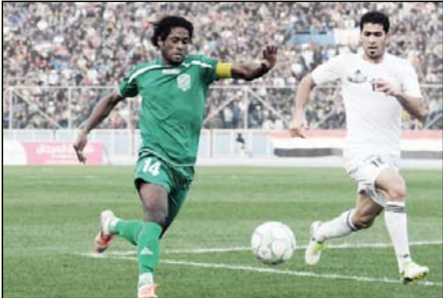
الشرطة يواجه الزوراء لتعويض الخسارة السابقة

العودة بقوة الى المنافسة بتحقيق الفوز على الشرطة يجعلنا نتساوى معه بالنقاط وبالتالي يعود الزوراء الى دائرة المنافسة خصوصاً اذا