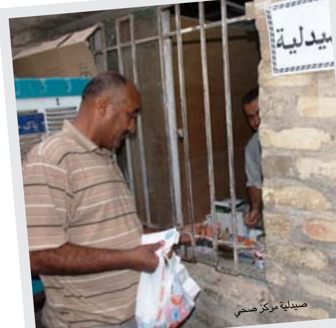
صيدلية مركز صحي