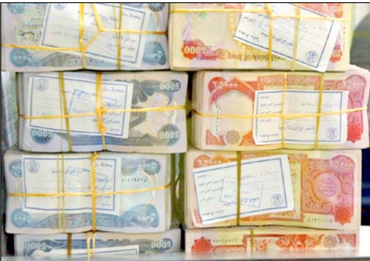
السوق المحلية تشهد انخفاض سعر صرف الدولار بعد اتخاذ المركزي مجموعة اجراءات

اتهمت اللجنة المالية النيابية، أمس الاحد، تجارا بالتحايل على المصارف بتقديمهم مستندات استيراد وهمية لاستيفاء مبالغ مالية، وفي حين طالب ائتلاف الوطنية بزعامه نائب رئيس الجمهورية اباد علاوي باستبدال مسؤولي البنك المركزي واختيار شخصيات من اصحاب الخبرة والكفاءة بعيدا عن المحاصصة واتهمهم بالتسبب في انهيار سعر الصرف وفقدان الثقة بالعملية المحلية، وانتقد خبراء اقتصاد قيام البنك المركزي استقطاع الضريبة الكمركية داعيا الهيئة العامة للضرائب والهيئة العامة للكمارك الى استيفاء الضرائب.