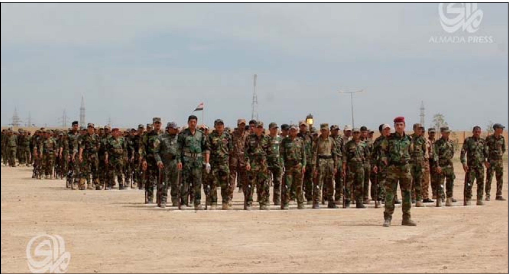
مقاتلون سنة في معسكر للتدريب في عامرية الفلوجة. أ.رشيف

خلال الأسبوع الحالي أصدرت كل من إدارة أوياما ومجموعة داعش تصريحات رسمية حول المعركة في العراق. أيهما كان الأقوى؟ خطة الولايات المتحدة هي إضافة ٤٥٠ مستشارا عسكريا سيقومون بتدريب مقاتلي العشائر السنية في قاعدة جوية في محافظة الأنبار. إنها خطوة متقدمة ومتأنيبة، حيث لن تشارك القوات الأميركية العراقية في القتال، ولن تطلب الضربات الجوية، لكنها في الغالب ستبقى داخل المجمع المحمي على أمل تجنيد السنة لدعم الحكومة التي يعارضها الكثير منهم.