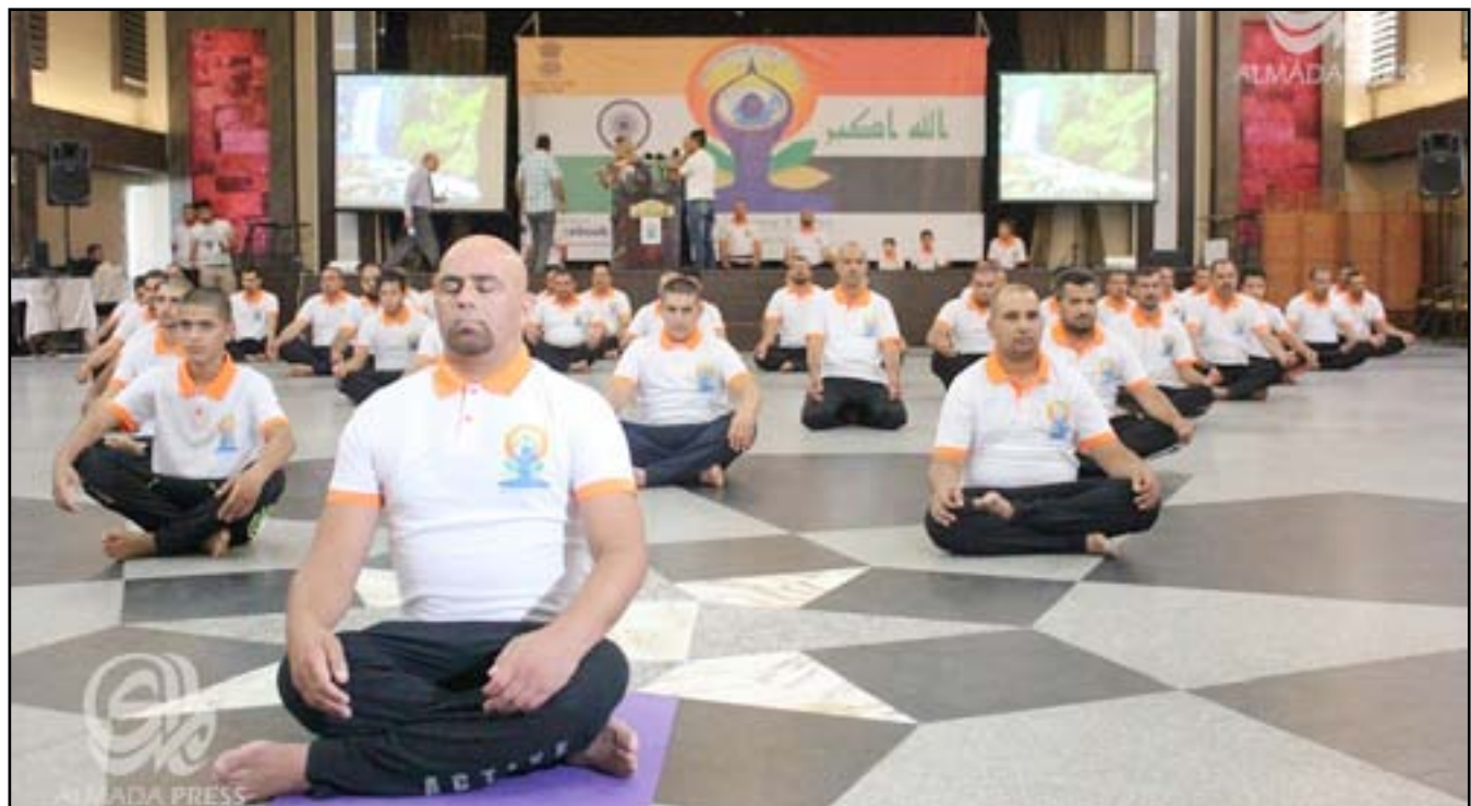
جانب من احتفال السفارة الهندية باليوم العالمي لليوغا

وتجرى احتفالات في أنحاء العالم باليوم العالمي لليوغا، ومن المتوقع مشاركة مئات الملايين في تمارين اليوغا اليوم الأحد، (٢١ حزيران ٢٠١٥). وتحول قلب نيولهي، اليوم الأحد، إلى فسيفساء من السجادات الملونة التي ستستضيف الآلاف من أتباع اليوغا بمناسبة اليوم العالمي لهذه الممارسة، وبقيادة رئيس الوزراء الهندي ناريندرا مودي، وسيلتقي ممارسو اليوغا أيضاً في دول أخرى للاحتفال بهذا التقليد الهندي القديم، ولاسيما في بريطانيا على ضفاف نهر التايمز.