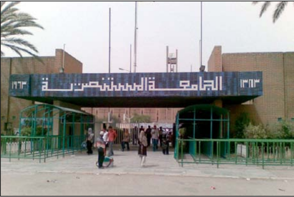
الجامعة المستنصرية.. (أرشيف)

□ نعمل على خلق كوادر جديدة من الموظفين.. ونسعى لـ "إنعاش التعليم"