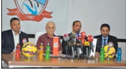
اثناء المؤتمر الصحفي في زاخو

مديراً لنادي زاخو من أجل ان يكون إضافة كبيرة للفريق لكونه من المدربين الشباب الذين عملوا في مجال التحليل لفترات طوال، لذا نتمنى أن يكرس خبراته لصالح فريق زاخو من أجل تحقيق الهدف في الموسم المقبل من الدوري الكروي الممتاز.