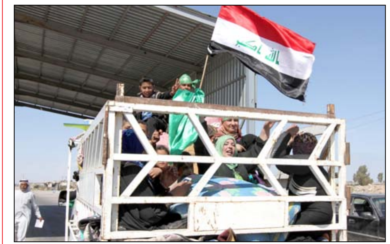
أسرة نازحة تعود الى تكريت