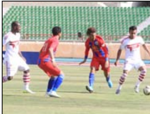
تبدي يسرق نقطة من الزمالك

داخل منطقة الجزاء قابلهما باسم مرسى بضربة رأس سكنت شبك بتروجيت. وشهدت الدقائق الأخيرة