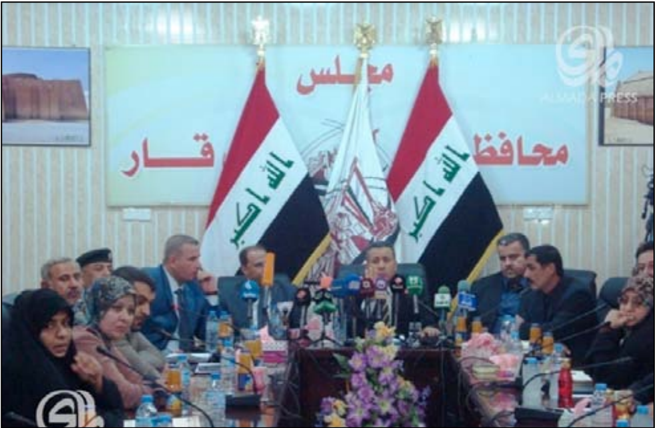
اجتماع مجلس ذي قار

جميع اللجان الفرعية بعد إقرار عدد من التعديلات على النظام الداخلي، إذ تم تغيير رؤساء خمس لجان أبرزها "الصحة، والقانونية، والنقط والموارد الطبيعية"، فيما تم استحداث لجنتي الحشد الشعبي والمتابعة.