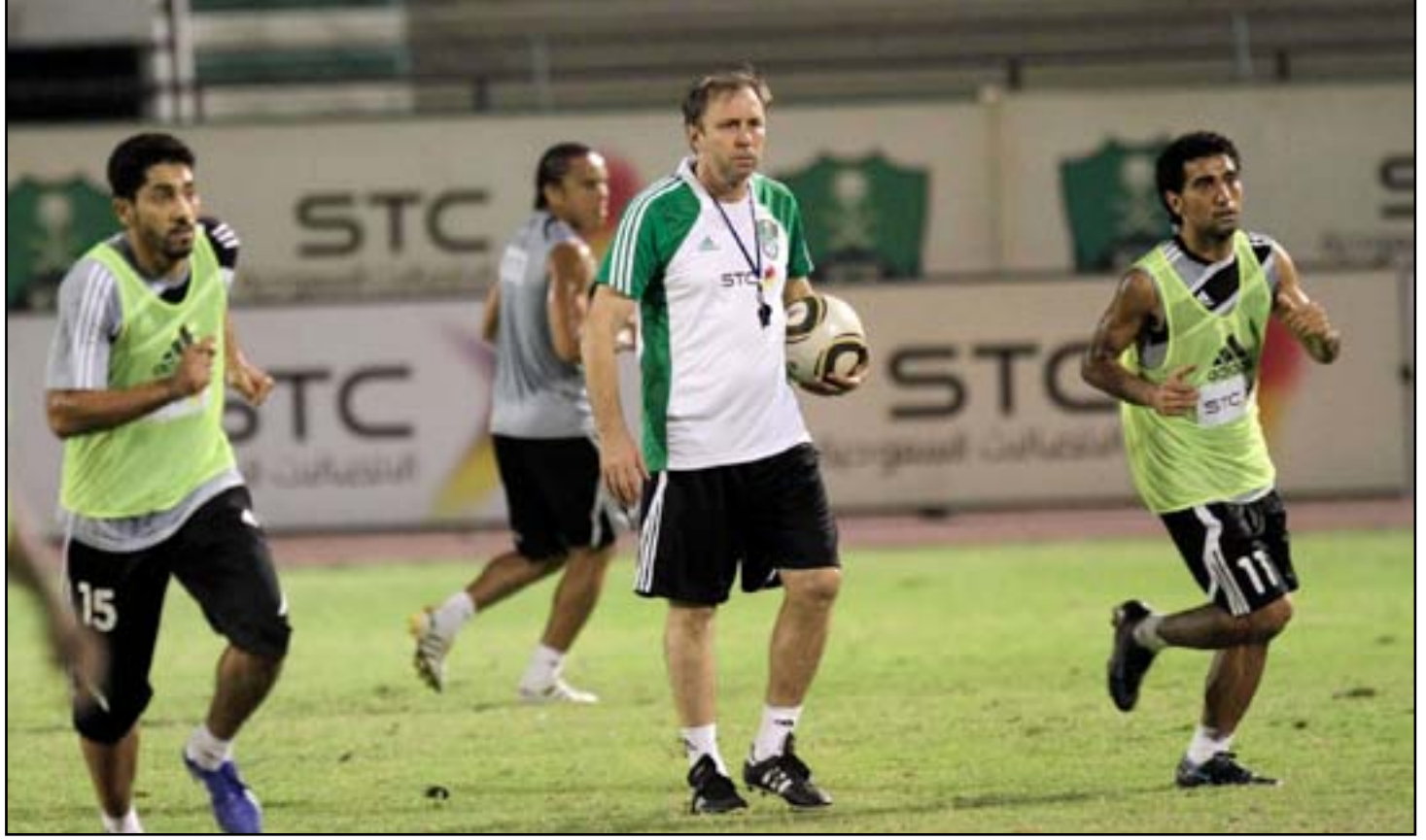
ميلوفان مرشح ساحن لتولي مهمة تدريب الأسود

التدريب الذي سيضعه بعد تسميته رسمياً مدرباً لمنتخبنا الوطني فضلاً عن أن يبلغ عقده بنمائي مع الميزانية التي سيضعها اتحاد الكرة لعقده . وأضاف المصدر ان ميلوفان حصل على دعم واستناد معظم اعضاء اللجنة الخاصة التي شكلها الاتحاد في اجتماعه الأخير برئاسة الرئيس عبد الخالق مسعود لتقييم واختيار المدرب الاجنبي الجديد بعد مناقشة جميع السير المطروحة على جدول اعمالها بعد الاطلاع مسيرته التدريبية