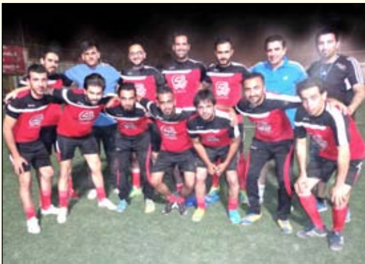
فريق المدى في بطولة (لبيك يا عراق)