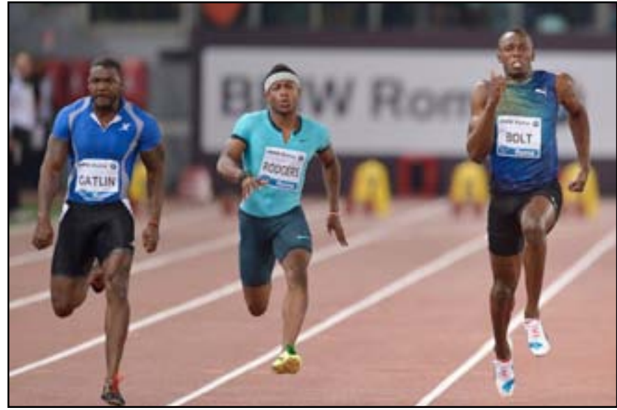
انسحاب بولت قبل شهرين من بطولة بكين

وعانى بولت، الحاصل على ٦ ميداليات ذهبية أولمبية، هذا العام وسجل زمناً قدره ١٠،١٢ ثانية في سباق ١٠٠ متر و ٢٠،١٣ ثانية في سباق ٢٠٠ متر. ولم يُبدِ العداء الجاميكي سعادته بالأداء الذي يقدمه برغم فوزه بسباق ٢٠٠