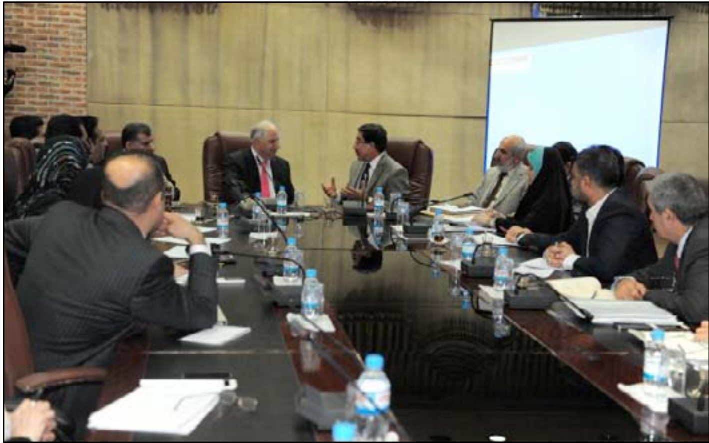
اجتماع سابق للجنة المالية البرلمانية مع رئيس البنك المركزي

وأعلن محافظ البنك المركزي علي العلق، في آذار الماضي، عن تقديم طعن إلى الحكومة بالفقرة ٥٠ من قانون الموازنة المالية للعام الحالي ٢٠١٥، والتي تلتزمه ببيع ٧٥ مليون دولار يوميا، ووصف هذه الفقرة "بالغريبة والخطرة" كونها تخضع البنك المركزي لتوجهات الحكومة. وشهد سعر الدينار امام الدولار انتكاسة سريعة منذ منتصف ايار الماضي. وارتفع سعر صرف الدينار، في السوق المحلية، من ١١٢١ دينار الى ١٤٠٠، رغم استمرار البنك المركزي اعتماد سعره الرسمي ١١١٩ دينار للدولار الواحد. وسمحت الحكومة العراقية للبنك المركزي بكميات من الدولار أكثر