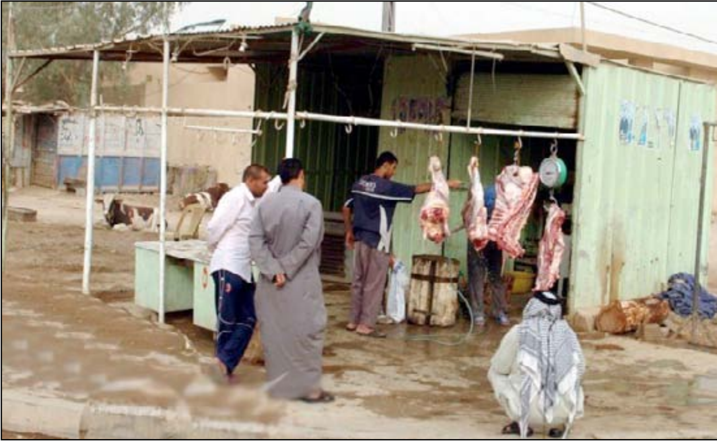
أرصعة المناطق الشعبية تشهد انتشار ظاهرة الجزر العشوائي

□ مجلس المحافظة يطالب الأمانة بتحديد الأماكن التي تقدم التسهيلات لمربي الحيوانات