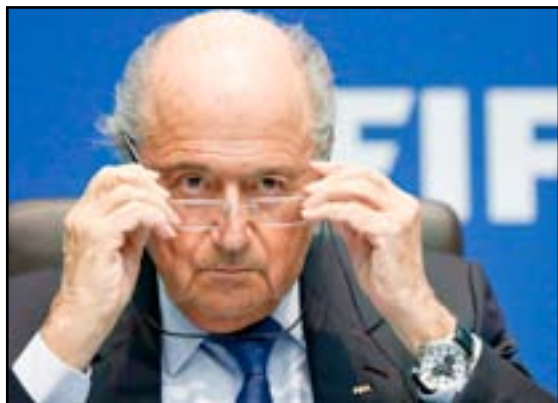
سيب بلا تر

استقالتي، ولكنني وضعت ولايتي رهن إشارة مؤتمراً استثنائياً لـ(فيفا)". يذكر أن تقارير إعلامية سويسرية