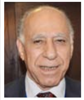
اجراءات المركزي اسهمت بخفض سعر صرف الدولار مقابل الدينار