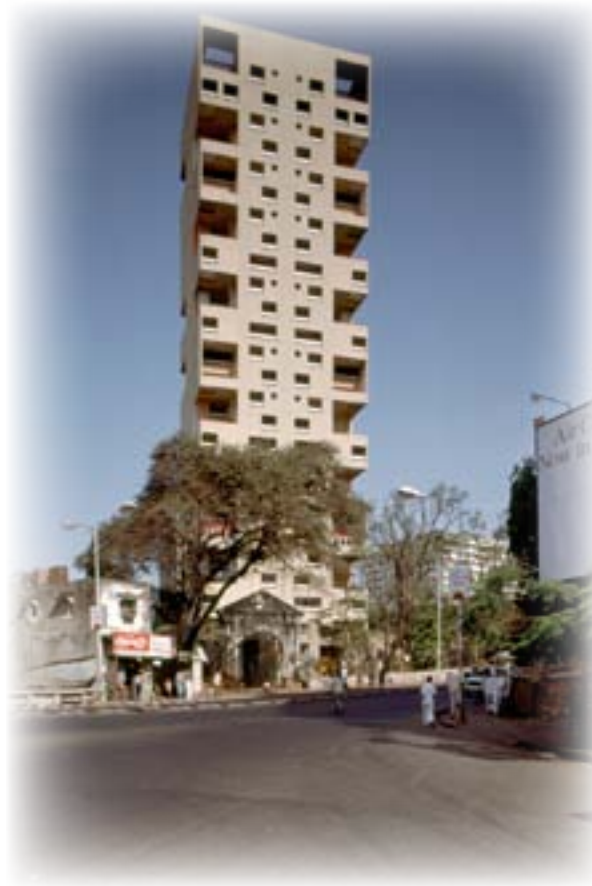
مبنى "كانجانجونا" السكني، مومباي، ١٩٧٠-١٩٨٢، المعمار: جارلس كوريا. منظر عام

وغير اقتراح هذه الخلايا وتمازجها فإنها تخلق فضاءات صغيرة وكبيرة مفتوحة ومغلقة تستخدم كصالات للعرض وقاعات وأرشيف لتكويناتها، على تأثيرات منجز العمارة الإسلامية، وابتانت، باجتهد نادر، عن نمط المعمار لقراءة ذكية لذلك "التناقض" المعرفي، ذلك لأن تلك العمارة المعتبرة، اتكتت في اجترح بعض عناصر