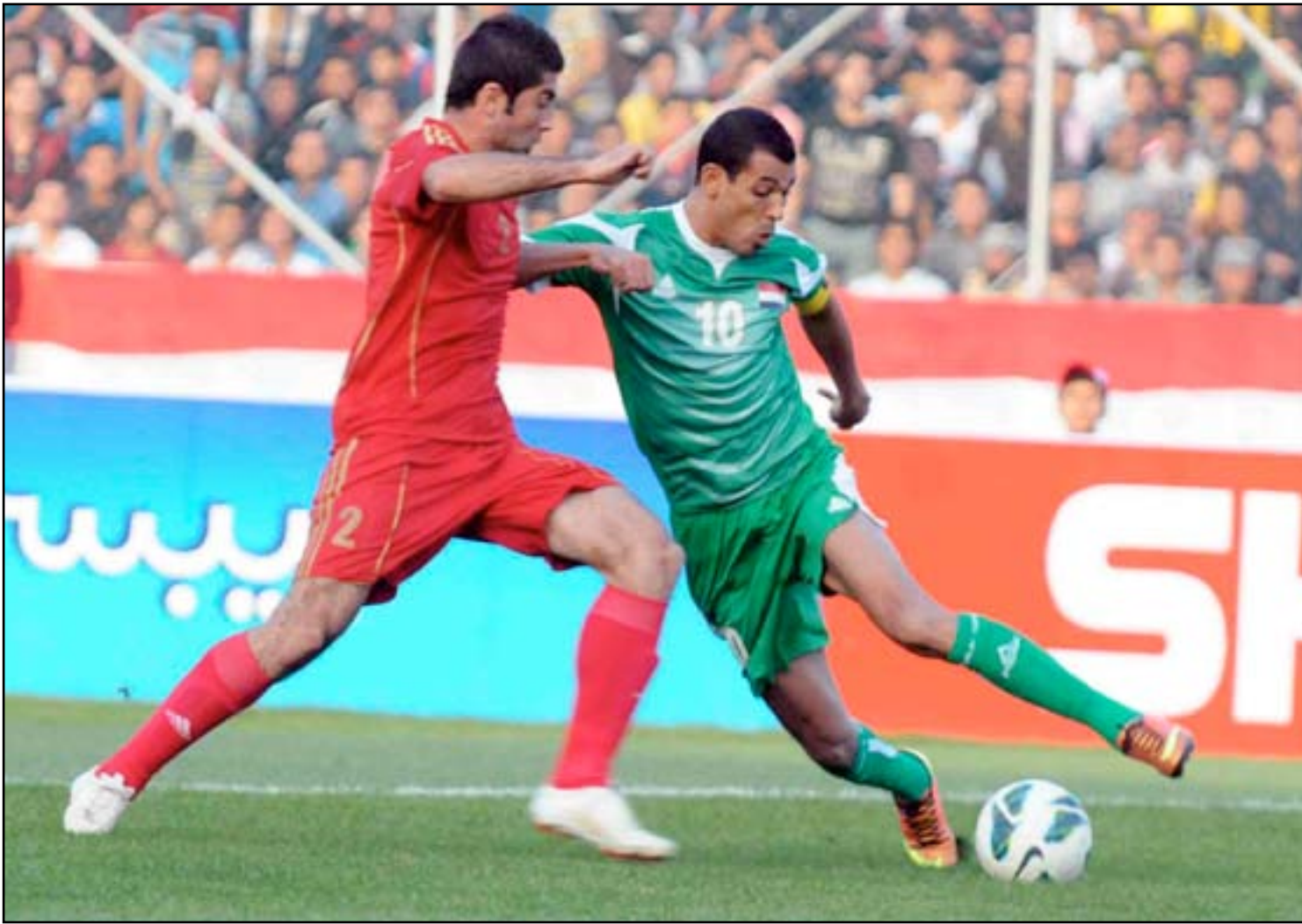
الغاء مباراة سوريا تضع الاتحاد أمام مسؤولية كبيرة لاقناع (فيفا)

الاتحاد الآسيوي مع العلم أن علاقتنا مع اغلبهم ليست على ما يرام وإن ادعى بعض الشيوخ والأمرء أنهم مع العراق ولو كان الكلام واقعياً لأسندت اليها دورة الخليج بنسخة واحدة، مضيفاً أن سوء التصرف وبيختم حديثه بمناسدة وسائل الإعلام إلى تبني حملة كبيرة من أجل العراق وجمهوره ه ورياضته لأجل التأخيرين، لأن الاتحاد الآسيوي دور الإعلام اليوم كبير جداً وقادر على كشف الزيف وإظهار الحقائق.