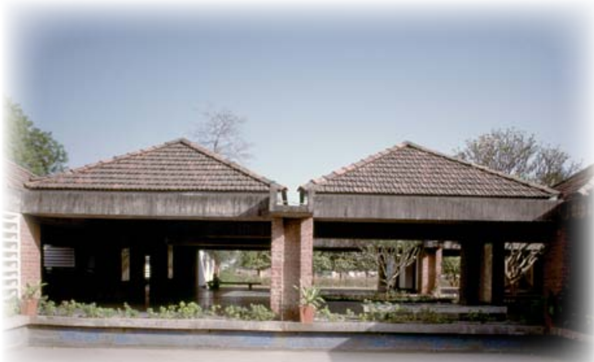
مزار "غاندي سمارك سانغرا هاليا". احمد آباد، الهند (١٩٥٨-١٩٦٣)، المعمار: جارلس كوريا. منظر داخلي

في جميع أعمال "جارلس كوريا"، هذا المعمار المهم لإقليم مومباي – احمد آباد وعموم الهند – يوجد ثمة تناغم وانسجام بين نشاطه المهني ورؤياه الديمقراطية فقد ظل عازفاً عن دعوات كثيرة ومغرية، قانعاً بإيجاد حلول ملائمة لمشاكل تخطيط مدينة "مومباي" الصحاحية والمزدحمة. ولقد استمر في هذا العمل الحسني والمكلف لمدة عشر سنوات يعمل مجاناً. أملاً بأن تصاميمه سوف تقلل وتخفف من وطأة ظروف الحياة القاسية التي يعاني منها مواطنو مدينة "مومباي" البسطاء. إن عمارته – الذكية والمعاصرة، تثبتت مرة أخرى بأن تقصي السمات الوطنية وتوظفها في الممارسات التصميمية لا يقر، (بل ولا يمكن له أن يقر) – عبر طريق الاستنساخات النصية للأشكال التقليدية المعمارية أو في محاولة إضفاء القدسية لهذه الأشكال وتمجيدها، والتنجح بأنها – وحدها – ملائمة ومناسبة لكل العصور والأزمنة. فجارلس كوريا يطمح أن تكون عمارته مرتبهة ببيئتها، من خلال تشكيل تكويني، يجتهد لأن تنلمس فيه حضور واع للمكان، واقتران هذا الحضور بسمات حداثة للغة التعبير الفني له. وبهذه الصيغة الإبداعية فإن عمارته تظل تضيف شيئاً جديداً وطازجاً لمجرى العمارة العالمية مثرية بذلك الحضارة الإنسانية في هذا الخصوص.