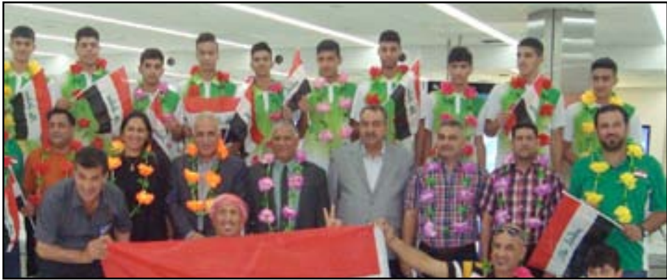
إثناء استقبال منتخب الناشئين في المطار

تفوق عن جدارة واستحقاق وحقق المركز الاول في بطولة غرب آسيا.