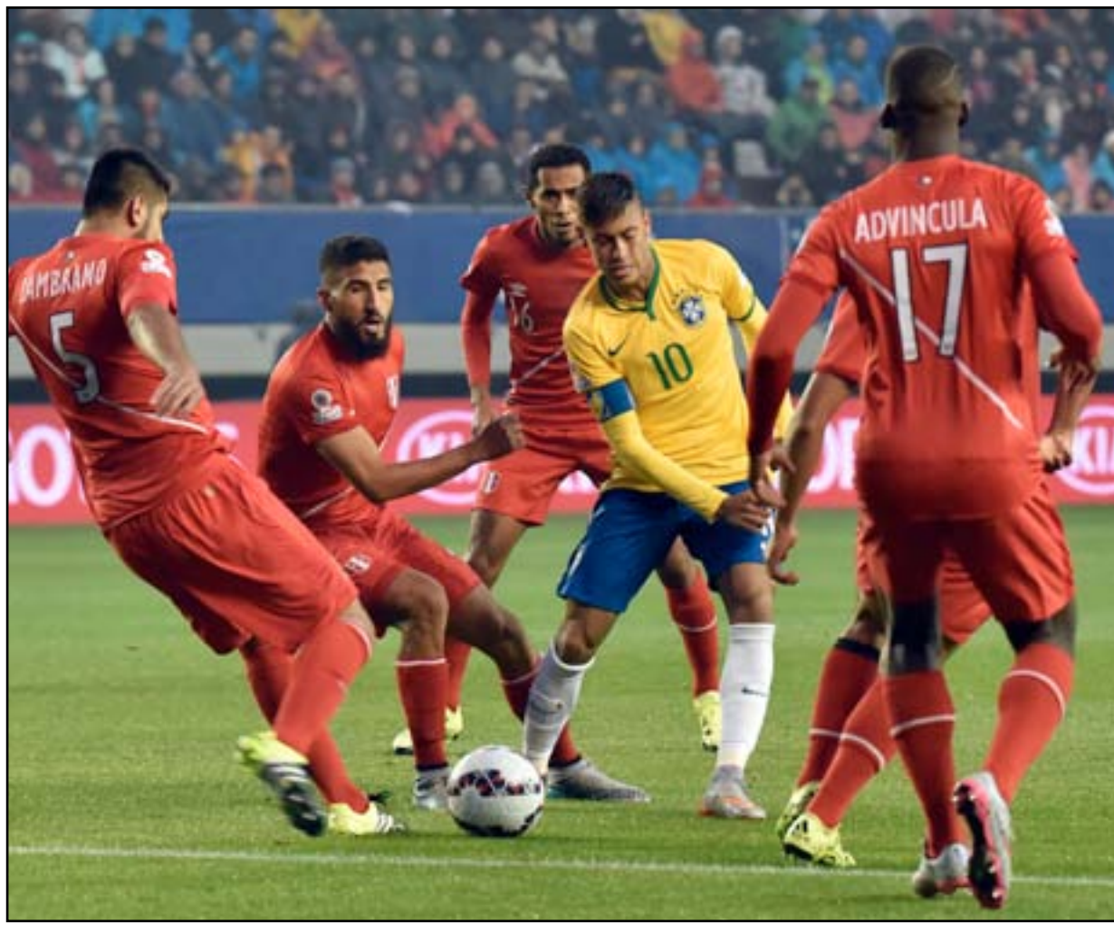
البرازيل يسعى لتعويض غياب نيمار امام البارغواي

ومن المؤكد ان الجمهور البرازيلي لن يتحمل مشاركة مخيبة اخرى لمنتخب "أوريفيردي" الذي ظهر بمستوى متواضع بعض الشيء في مبارياته الثلاث في الدور الاول الذي شهد خسارته الاولى بقيادة مدربه الجديد-القديم كارلوس دونغا على يد كولومبيا (١-٠) في الجولة الثانية. ويمنى المنتخب البرازيلي، الباحث عن استعادة اللقب الذي تنازل عنه عام ٢٠١١ ورفع رصيده الى ٩ القاب في البطولة القارية، بتحقيق تأخره من البارغواي التي جردته من اللقب في النسخة الماضية بعدما اطلحت به من الدور