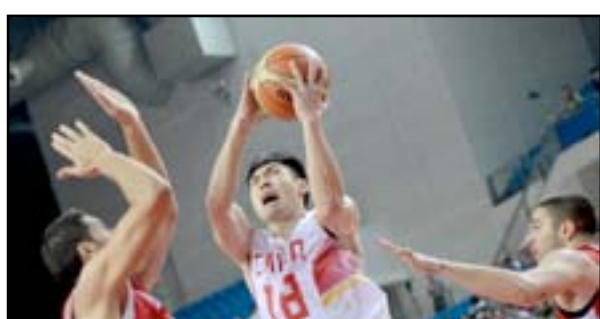
الفساد يضرب السلة الصينية

الاميركية سلون ستيفنز، كما تأملت البطلة السابقة كارولين فوزنياكي إلى قبل نهائي البطولة بفوزها ٧-٥ و٦-١ على الألمانية اندريا بكتوفيتش أمس الأول الخميس.وقدمت اللاعبة الدنماركية أول ثلاثة أشواط والإرسال في حوزتها لكنها ردت بكسر إرسال بكتوفيتش في المرات الثلاث وتقدمت ٥-٣ قبل أن تتراجع لتسمح لمنافستها الألمانية بالتعادل ٥-٥. وبمجرد أن انتزعت المصنفة