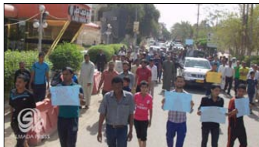
تظاهرة في الناصرية احتجاجا على تردي الكهرباء