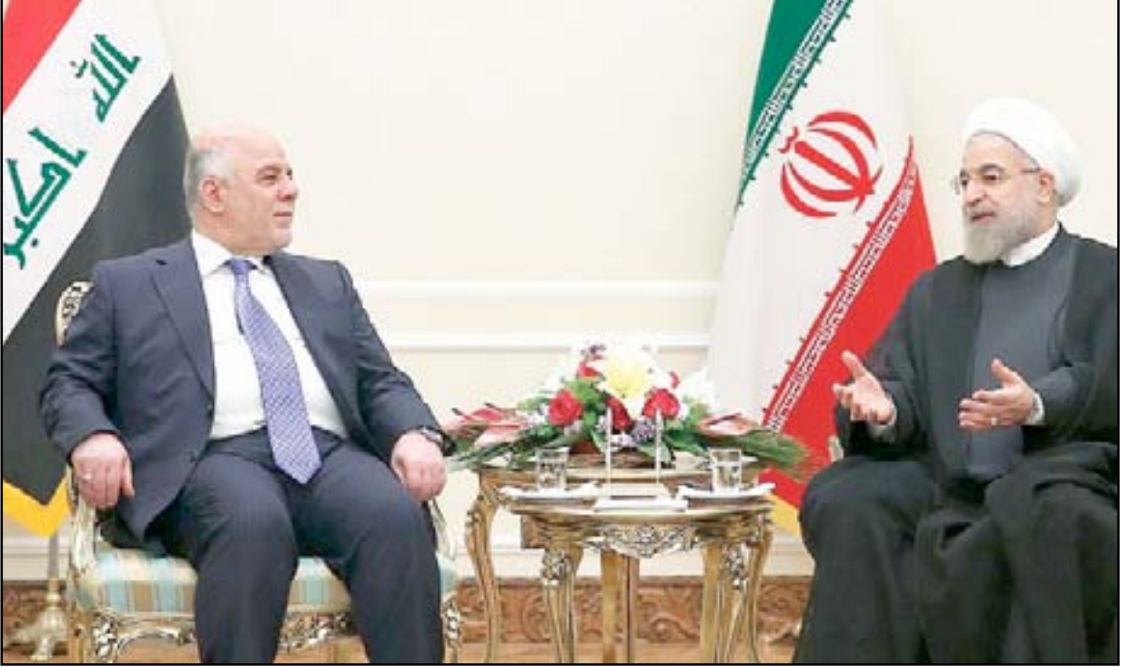
العبادي وروحاني في لقاء سابق