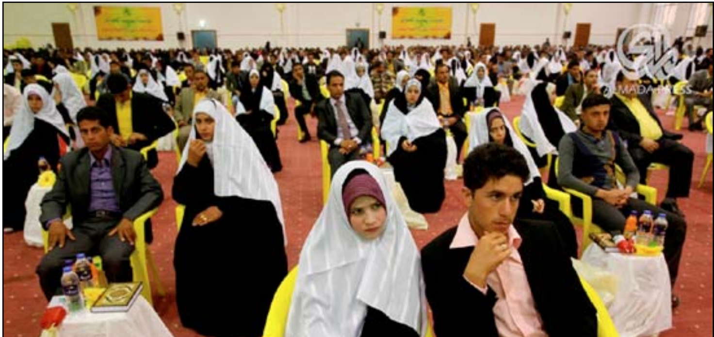
زواج جماعي في النجف... أرشف

طبي يؤيد سلامة الزوجين من الأمراض السارية والموانع الصحية وبالوثائق الأخرى التي يشترطها القانون، ويدون ما تضمنه البيان في السجل ويوقع بإمضاء العقادين أو بصمة إيهامهما بحضور القاضي ويوثق من قبله وتعطى للزوجين حجة بالزواج، ويعمل بمضمون الحجج المسجلة وفق أصولها بلا بينة، وتكون قابلة للتنفيذ فيما يتعلق بالمهر، ما لم يعترض عليها لدى المحكمة المختصة.