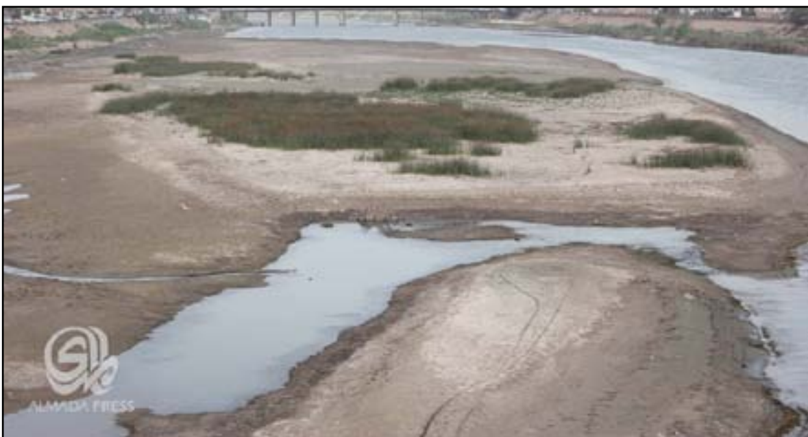
آثار قطع المياه عن نهر الفرات في قضاء الهندية شرق مدينة كربلاء

وأضاف الوزير، أن "الوزارة اتخذت إجراءات بالتعاون مع مجلس الوزراء، حيث تم اطلاق مبلغ ٢٠ مليار دينار من موازنحتها للقيام بعمليات كبرى وتنظيف وتبطين الجداول وشراء الوقود والحفارات