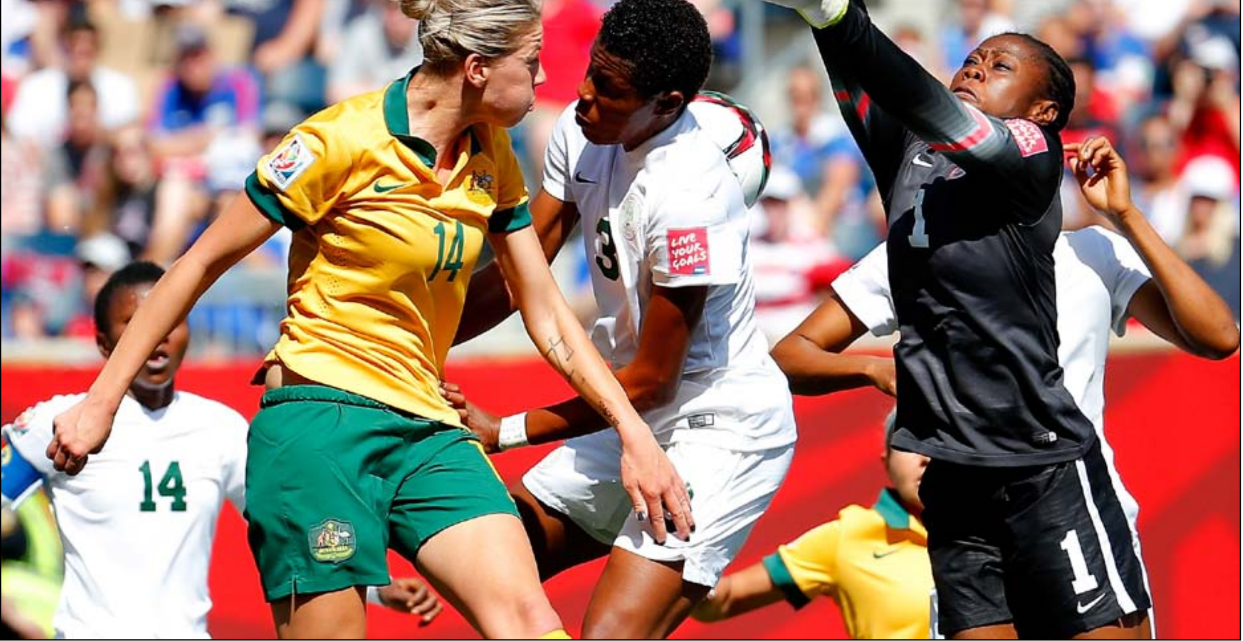
الحالة البدنية لسيدات أستراليا كفيلة بحسم الموقعة مع اليابان

في كل مباراة كما أن حالتنا البدنية جيدة حقاً. وأثار الفوز على البرازيل اهتماما كبيرا بالفريق في أستراليا، وأشارت كاتلي إلى أن ذلك سيسجل اللعاب أكثر حماسة وامتلاكاً للدافع. وأضاف: كنا نتوق لمساندة الجماهير في أستراليا ولا يوجد أفضل من معرفة أن بلدك تقف خلفك.