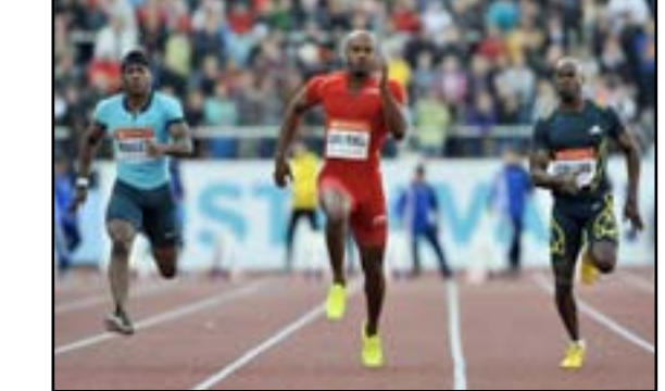
باول يؤكد تأمله لبطولة العالم

□ واشنطن / رويترز تألق اساقا باول في التصفيات الجامايكية المؤهلة لبطولة العالم لألعاب القوى بعدما سجل ٩,٩٨ ثانية ليأهله إلى قبل نهائي سباق ١٠٠ متر. وانطلق باول بقوة من الحارة الخامسة وتقدم بفارق كبير في منتصف السباق قبل أن يبلغ خط النهاية متقدماً بخمسة أمتار على يوهان بليك. وقال باول إن مدربه طلب منه الانطلاق بقوة في أول ٤٠ متراً ثم السيطرة على السباق بعد ذلك. وأبلغ باول رويترز: "أنا في حالة جيدة جداً". وأضاف باول الذي يبلغ أفضل رقمه هذا العام ٩,٨٤ ثانية ولا يتفوق عليه فقط سوى