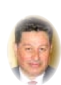
□ د. سيار الجميل*

إن المشكلة ليست دينية أو عقدية بقدر ما هي مذهبية وتاريخية ، فربما يخالفني الآخرون في قلوي ان كل الاديان والمذاهب والطوائف والفرق هي منتجات تاريخية ، فمن يعيش في خضمها يعيش تشاكل التاريخ ، ومن له قطيعة تاريخية مع الماضي ، فهو يعيش الحاضر بشكل سوي ويفهم الماضي ويحترمه كونه قد انقطع عنه ؛ إن أي استخدام او توظيف للتاريخ يمثل هذا التشاكل سيخلق انقساماً في المجتمع الواحد .. وقد غدت المشكلة اليوم في العراق طائفية بامتياز " أي استخدام اجنذة تاريخية ليس للشحن الطائفي كما اسيماه قبل سنوات ، وانما للاستئصال الطائفي بين من يؤمن بالخلفاء والامراء ضد من يؤمن بالائمة والفقهاء . ويعتقد كل من الطرفين ان هؤلاء جميعا لهم قدسيتهم وبراءتهم وملائكتهم وانهم ليسوا بشرا عاديين ، علما بأن القرآن وصف الرسول وصفا طبيعيا ، فما هو إلا بشر ، أفان مات او قتل انقلبتم على اعقابكم؛ ولعل اقرب الناس الى حقيقة الحياة هم الخلفاء الذين لا يبههم ابدأ لا السلاطين والخلعاء ولا الائمة والفقهاء ؛ ولا يهجم إنهم