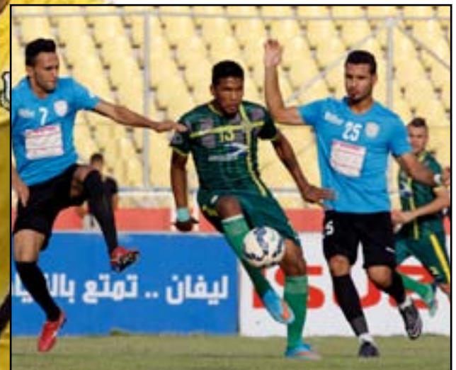
لقاء مثير يجمع الشرطة وأمانة بغداد