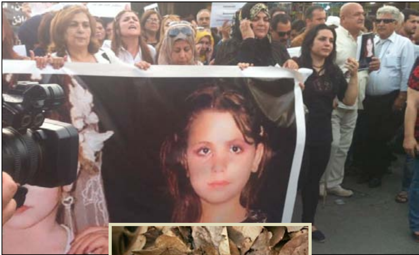
جانب من تظاهرات ضد العنف الاسري