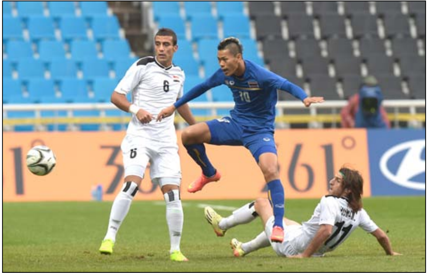
اتحاد الكرة يقترح من تسمية مدرب المنتخب في التصفيات