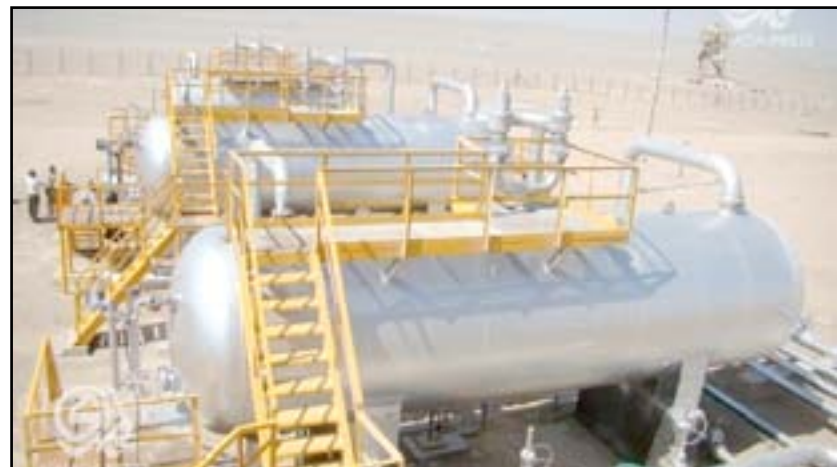
لحد المصافي التي اشادت حديثاً في العراق

المحافظة"، مبيّنة أن "اتفاقاً من أربع شركات كورية جنوبية تقوم ببناؤه وتترأسها شركة هونداي للمشاريع الهندسية والإنشائية". وأضافت الشركة، ان "جزءاً من شروط الاتفاقية أن تقوم الشركة بتصنيع وتجهيز وتوفير ما مقداره ٣,٥٠٠ كم من كابلات الفولتية الواطئة للمشروع المزودة بأغلفة PVC الاوربية للمساعدة في سد الاحتياجات المحلية المتزايدة". وكانت وزارة النفط العراقية قد وقعت في (٢٢) من شباط (٢٠١٤)، عقداً لإقامة مصفى كربلاء النفطي مع ائتلاف يضم أربع شركات كورية بقيمة إجمالية تتجاوز السنة مليارات دولار.