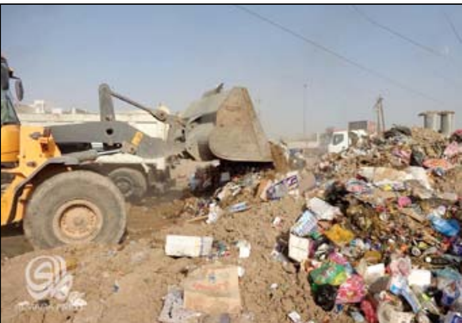
إدارة بابل تعد خطة لتنظيف مناطق الحلة بعد تراكم النفايات فيها

وتعاني محافظة بابل انتشار النفايات في الشوارع والأسواق بسبب قلة العاملين في مجال التنظيف وعدم وجود تخصصات مالية نتيجة الأزمة المالية التي يمر بها العراق.