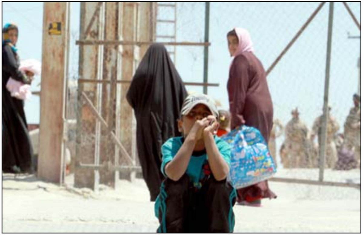
صبي نازح يجلس أمام بوابة معبر بزييز..