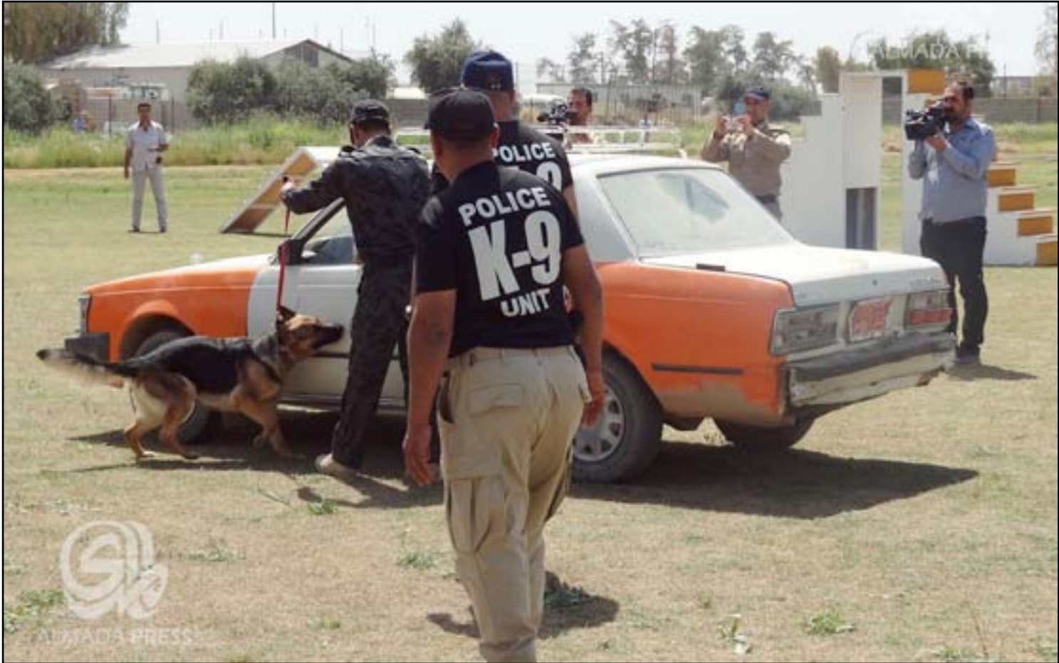
مجموعة من عناصر الامن خلال قيامهم بتدريبات على استخدام الكلاب البوليسية في كشف المتفجرات