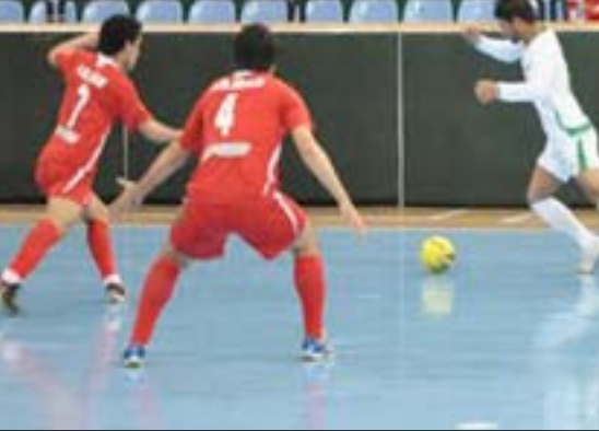
نفط الوسط يعسك في اصفهان لنهايات الصالات