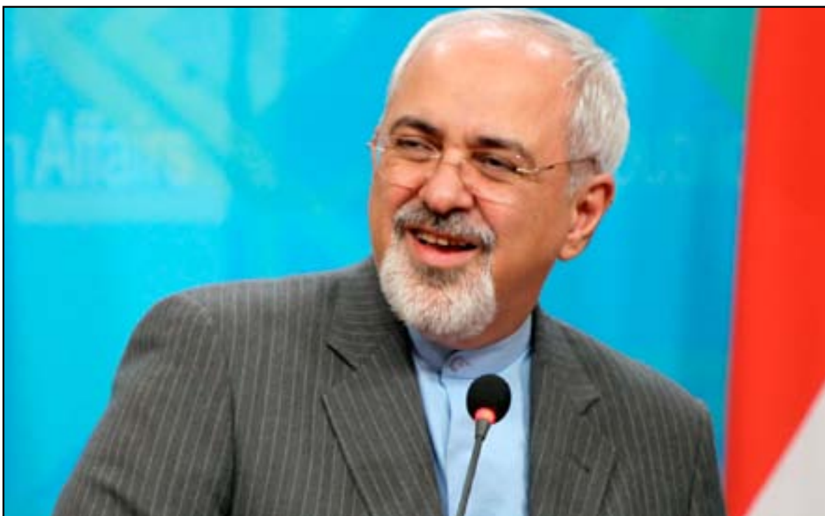
□ الكويت/ رويترز - سكاى نيوز

ورد الرئيس الإيراني حسن روحاني هذه الرسالة في خطاب ألقاه يوم أمس