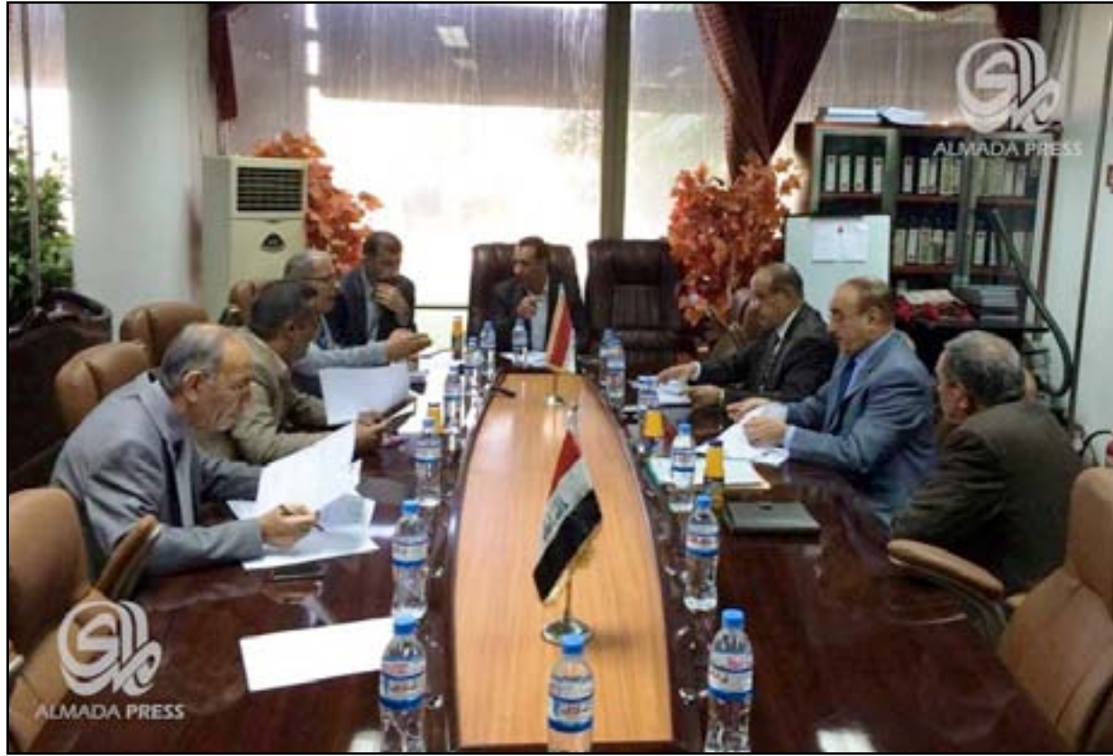
لجنة التحقيق بسقوط الموصل

إداات لشخصيات سياسية وعسكرية رفيعة المستوى تضمنها تقرير لجنة الموصل التحقيقية التي تعكف على كتابة توصياتها واستنتاجاتها النهائية خلال الاسبوع الجاري لتقديدها لرئاسة البرلمان . الاحداث والمعطيات التي افرزتها عملية سيطرة تنظيمات داعش على مدينة الموصل هي من حتم على اللجنة أن توخر اعلان نتائجها، لاسيما وأنها تعتزم كشف الحقائق فعلياً بحسب برلمانيين .