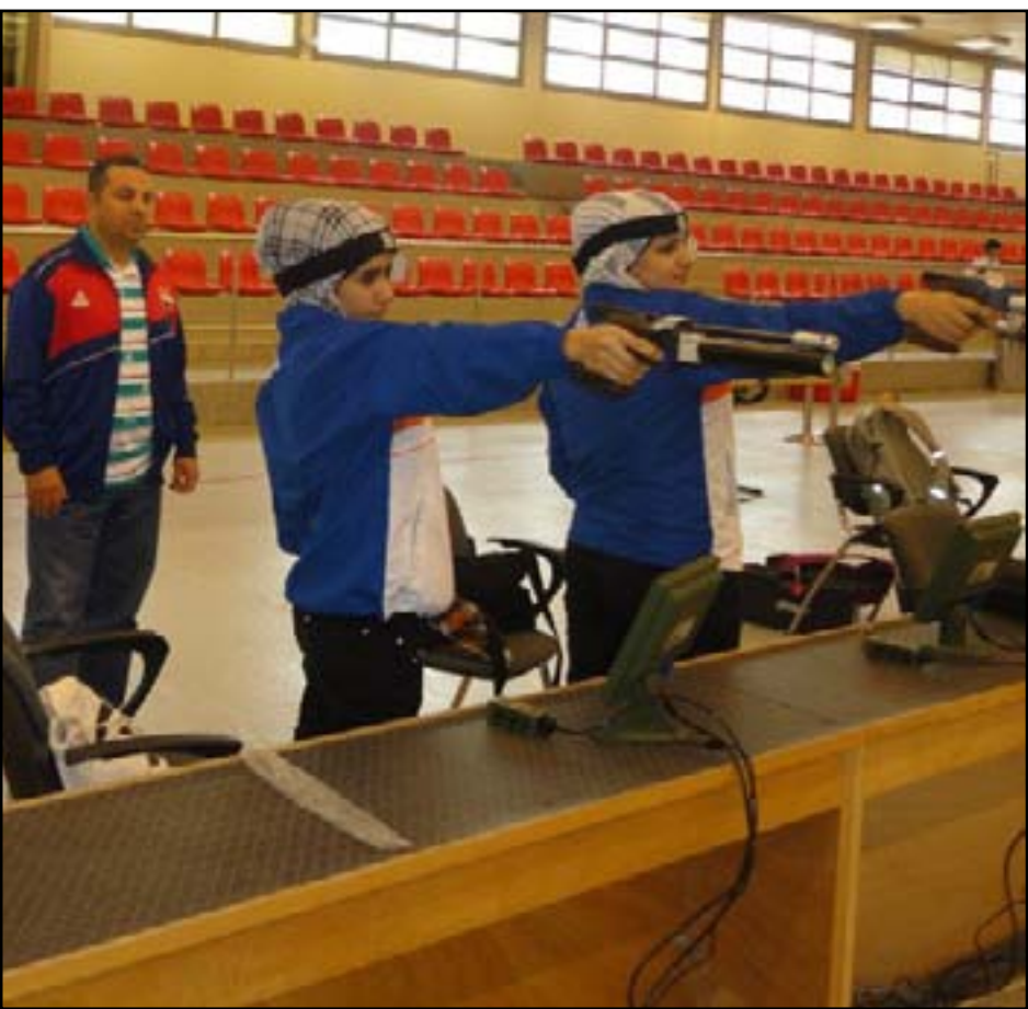
منتخبنا بالرمية يواصل الاستعداد لبطولة العالم

كبيرة وهذا كان واضحاً في جميع مشاركاتهما الخارجية التي تحققت فيها نتائج طيبة وكانت محط احترام الجميع ما جعل الاتحاد يعول عليهما كثيراً في تحقيق الطموح وتسجيل أعلى الأرقام في بطولة العالم بأذربيجان ونحن على يقين بأنهما قادرتان على تحمل المهمة الوطنية ورفع سمعة الرياضة العراقية في المحفل العالمي بشكل عام ورياضة الرماية بشكل خاص.