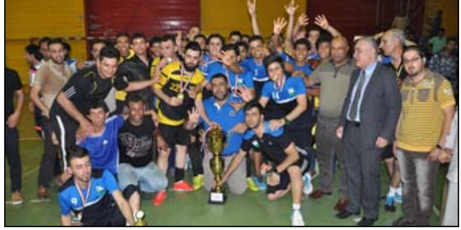
نفط الوسط يتطلع للقاء ايجابي مع بطل تايلاند

ثبتت لجنة المسابقات في الاتحاد الآسيوي لكرة القدم مواعيد مباريات بطولة أندية آسيا للصالات التي ستقام في مدينة أصفهان الإيرانية للفترة من ٣١ تموز الحالي ولغاية ٧ آب المقبل بمشاركة ١٢ ناديا من بينها بطل الدوري نفط الوسط. وذكر الموقع الرسمي للاتحاد الآسيوي في بيان اطلعت عليه (المدى): إن فريق نفط الوسط سيفتتح مشواره بمواجهة فريق تشونبوري التايلاندي في الساعة ١٢ ظهر يوم الجمعة المقبل بتوقيت بغداد ضمن منافسات الأولى من الدور الاول للمجموعة الثالثة على القاعة الرئيس لمدينة أصفهان الإيرانية فيما سيخوض مباراته الثانية مع الريان القطري في الساعة ١٢ ظهر يوم السبت المقبل على القاعة ذاتها . واضاف: ان اللجنة المنظمة للبطولة قسمت الاندية