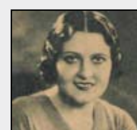
وفاة المطربة نادرة أمين

في مثل هذا اليوم، السابع والعشرين من تموز عام ١٩٩٠، توفيت المطربة الشهيرة نادرة والتي اقامت فترة في العراق وغنت في عدد من نواديها الاجتماعية. وولدت نادرة في ٧ تموز ١٩٠٦ في حي عابدين لأب مصري من رشيد بالجيرة فيما كانت أمها لبنانية الأصل، ولذلك اعتقد كثيرون أن نادرة شامية، وحين