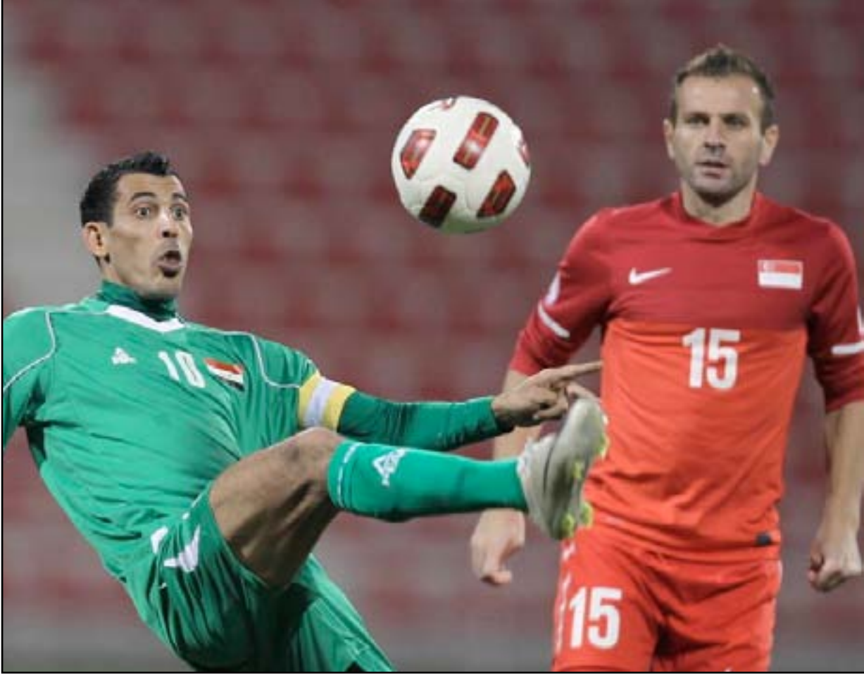
منتخبنا يتربح منهاج حاجي التدريبي ليه الاستعداد للتصفيات

وأوضح أن اتحاد الكرة سيقدّم المدرب حاجي وملاكه المساعد الى وسائل الإعلام المقروءة والمسموعة والمرئية في مؤتمر صحفي سيتم توجيه الدعوة فيها الى جميع الصحفيين والإعلاميين العاملين في الصحف والقنوات الفضائية من اجل الإجابة على جميع التساؤلات والاستفسارات التي سيتم طرحها عليه بشأن البرنامج التدريبي الذي سيتم الاتفاق مع اتحاد الكرة تحضيراً للاستحقاقات المقبلة التي تتنظر منتخبنا في التصفيات الآسيوية الموندبالية ودورة كأس الخليج العربي ٢٣