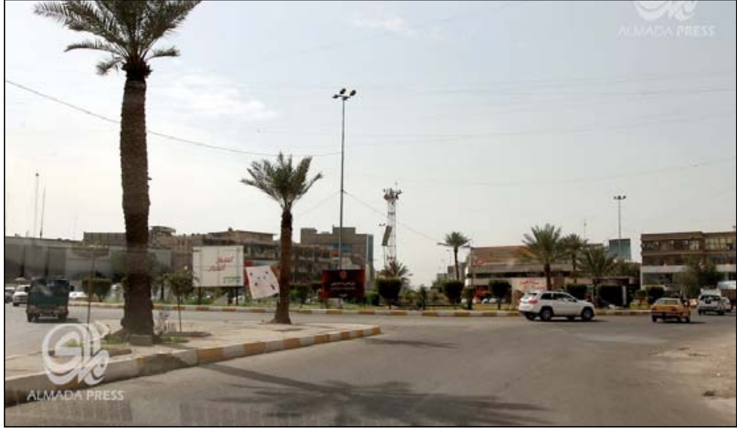
ساحة التحريات وسط العاصمة العراقية بغداد