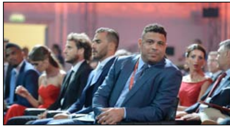
رونالدو ومشاق من حظوظ السامبا

وأوقت قرعة التصفيات التي سُحبت في قصر كونستانتين بمدينة سان بطرسبرغ الروسية عن وقوع المنتخب البرازيلي في المركز الخامس بتصفيات أمريكا الجنوبية (كونميبول) ومواجهته لتظهير التشيلي في بداية مشواره بالتصفيات.