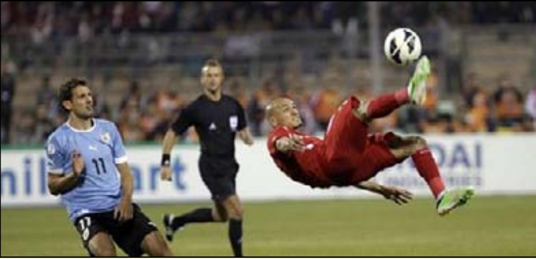
من لقاء سابق بين الأردن والأوروغواي في ملحق تصفيات المونديال

كما أوقعت القرعة المنتخب الفائز بصدارة تصفيات اتحاد أوقيانوسيا في مواجهة المنتخب الفائز بالمركز الخامس في تصفيات قارة أمريكا الجنوبية وذلك في صراع على مقعد واحد بنهائيات المونديال. وشهدت القرعة تحديها تين المواجهتين