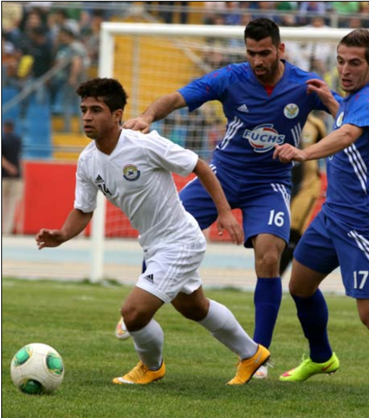
الزوراء يتربص الدعم المالي وملعبه الجديد

العاصمة الحبيبة بغداد فيها المتحف الوطني وفيها المتحف البغدادي فضلاً عن متاحف أخرى، لكنها الآن تحتاج إلى متحف رياضي حقيقي يضاف إلى تلك المتاحف حتى نستطيع أن نكرم نجومنا الراحلين عبر حفظ تاريخهم في هذا المتحف وكذلك نكرم نجومنا الأحياء "أطال الله في أعمارهم" لأنهم سيشعرون بالطمأنينة، كونهم وضعوا مقتنياتهم الصورية والتلفازية في مكان أمين يحفظها للأجيال اللاحقة، إذ أننا على ثقة تامة أنه بمجرد المباشرة بتأسيس المتحف الرياضي، فإن نجوم الرياضة سيقومون بتحصير أرشيفهم ومقتنياتهم الخاصة لكي يضعوها في هذا المتحف، بدلاً من تركها للزمن الذي قد يهملها أو يجعلها تباع في أسواق الهرج بأثمان بخسة جداً، كذلك أنا على ثقة تامة أن أي نجم رياضي مهما كان اعترازه بارشيفه الخاص وبمقتنياته الكثيرة سيصدر إلى استئناس تلك المقتنيات عبر التقنيات الحديثة وإرسالها إلى المتحف المقترح، لأنه بهذه المبادرة سيحافظ على تاريخه من الضياع، إنها مجرد فكرة، لكنها قابلة للتنفيذ إذا ما توافرت النوايا الحسنة والحرص على حفظ تاريخنا الرياضي من الضياع أيضاً.