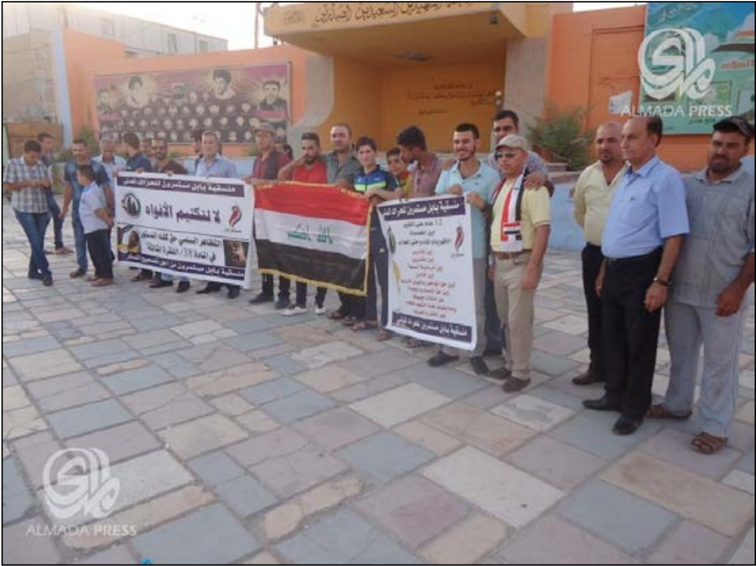
ناشطون بباليون يستنكرون تكميم الأفواه ويطلبون بالخدمات

أعلن ناشطون مدنيون بباليون عن سخطهم واستنكارهم لتعرض زملائهم في البصرة لأعمال عنف من قبل السلطات المحلية، بتحو "مخالف" للدستور والمواثيق الدولية، وفي حين طالبوا بتوفير الخدمات لأهالي المحافظة، ناشدوا المرجعية الدينية والمنظمات الدولية التدخل لإنقاذ الشعب العراقي من "الفساد المستشري" وتردي الخدمات.