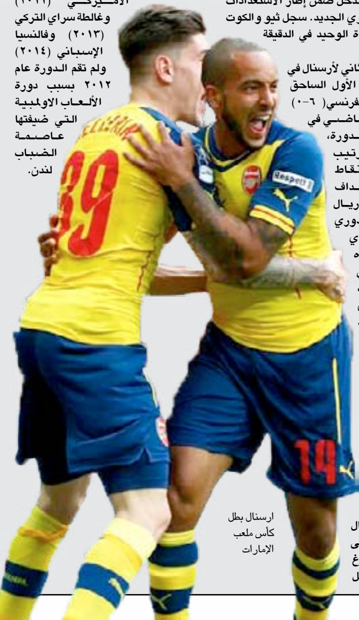
أرسنال بطل كأس ملعب الإمارات

الدوري الألماني ٢-١ في افتتاح الدورة. وهي المرة الرابعة التي يتوج فيها أرسنال بلقب الدورة بعد أعوام ٢٠٠٧ و ٢٠٠٩، و ٢٠١٠. وتقام الدورة منذ عام ٢٠٠٧، ونال لقبها مرة واحدة كل من هامبورغ الألماني (٢٠٠٨) ونيويورك ريد بولز الأميركي (٢٠١١) وغالطة سراي التركي (٢٠١٣) وفالنسيا الإسباني (٢٠١٤) ولم تقم الدورة عام ٢٠١٢ بسبب دورة الألعاب الأولمبية التي ضيفتها عاصمة الضباب لندن.