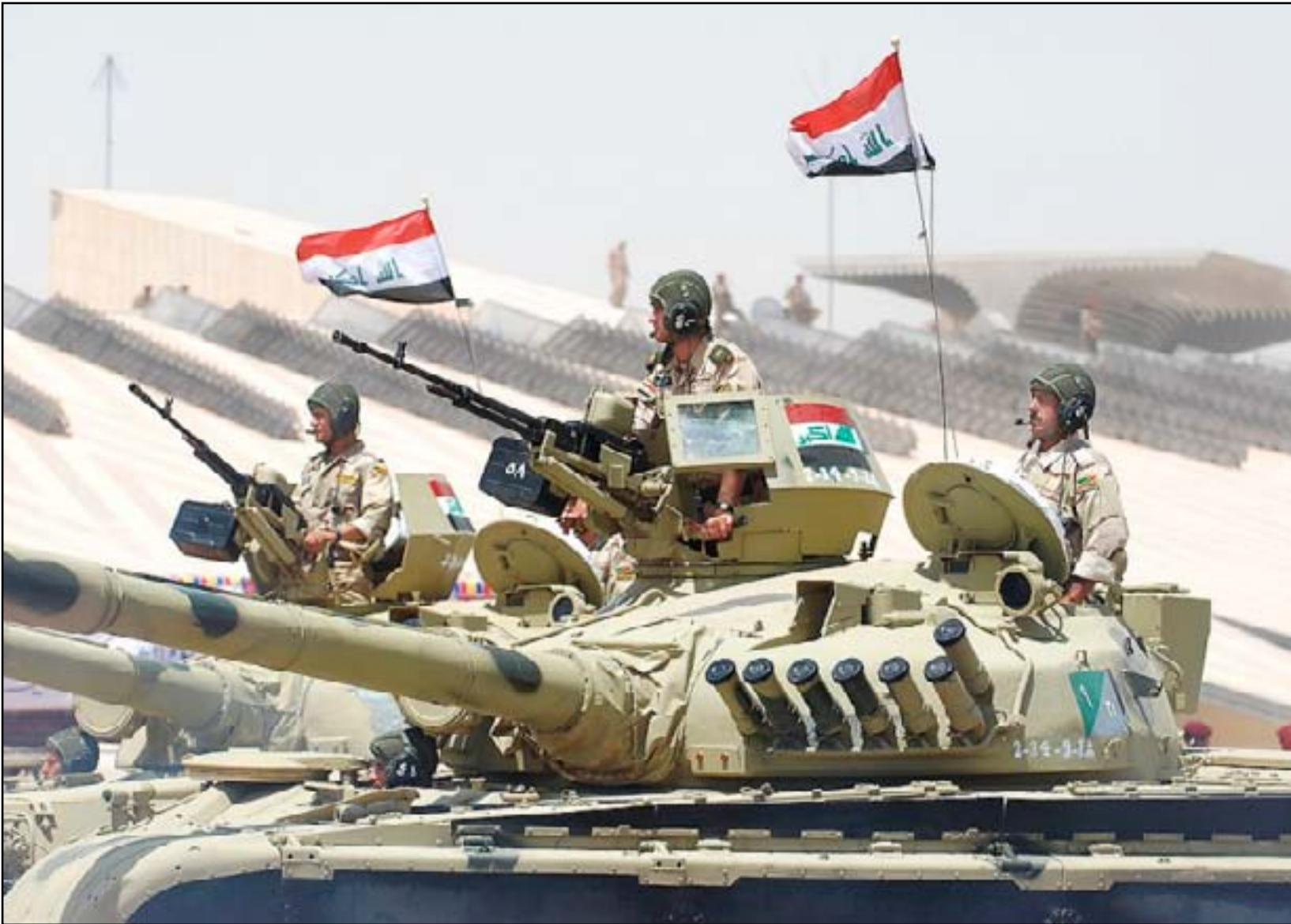
دبابه عراقية في استعراض عسكري..أرشيف

في آب قبل خمسة وعشرين عاماً، توغل جيش صدام حسين في الكويت، وبدأ عصر من التدخل العسكري الأميركي في العراق ولا يزال مستمراً حتى يومنا هذا. وقد هيمن السؤال حول ما يجب فعله بشأن العراق على النقاش الدائر ضمن أروقة السياسة الخارجية الأميركية لمدة ربع قرن حتى الآن، وسوف يكون هذا السؤال قضية مركزية مرة أخرى في انتخابات عام 2016 الرئاسية. وقد زار رئيس هيئة الأركان المشتركة العراق حديثاً الجنرال مارتن ديميسي، بهدف مراجعة سير عملياتنا العسكرية والمساعدة التي نقدمها هناك. وزار وزير الدفاع الأميركي، أشتون كارتر، العراق للتو أيضاً.