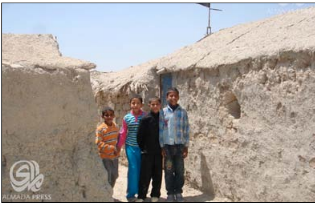
طلاب في مدارس طينية.. أرشيف

وبنايات جديدة بمدارس المحافظة التي تزدهم بالتلاميذ والطلبة"، مقترحاً ان "تقوم الحكومة المركزية وبالتعاون مع وزارة التربية بإطلاق