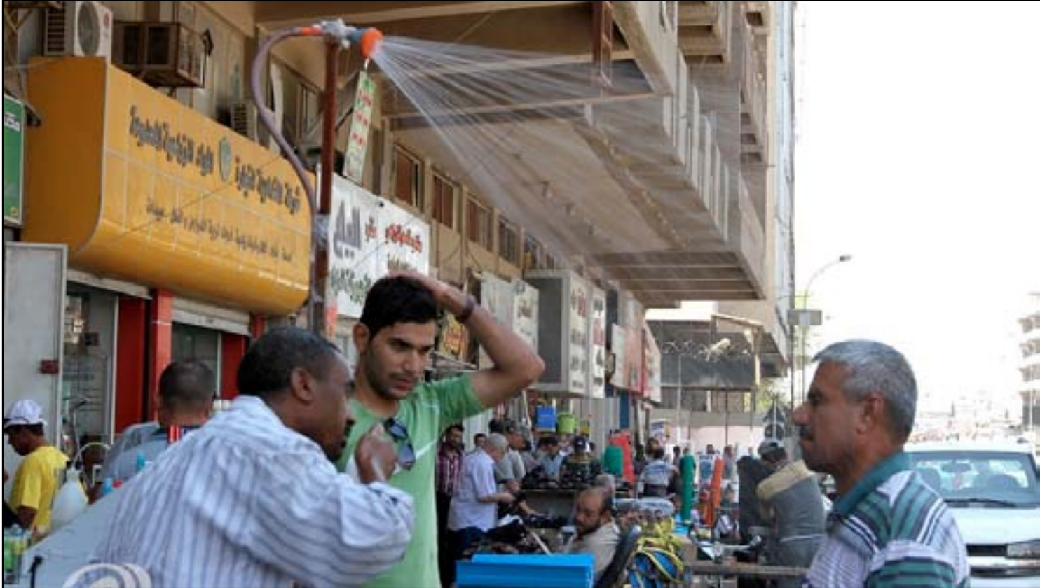
ارتفاع درجات الحرارة جعل اصحاب المحال في منطقة السنك وسط العاصمة ينصبون أكثر من دوش ماء لتعاش المارة

باعتقال مطلق النار. وكان محافظ ذي قار قد أجرى يوم الاثنين ( ١٩ كانون الثاني ٢٠١٥ ) مباحثات موسعة مع وزير الكهرباء قاسم محمد الفهداوي حول اجراءات توسيع الصلاحيات لدوائر الكهرباء العاملة في المحافظة واستحداث مديرية عامة في ذي قار بدلا من الارتباط بالمديرية العامة لكهرباء المنطقة الجنوبية، وذلك خلال اجتماع عقد بين الجانبين في مقر وزارة الكهرباء بالعاصمة بغداد .