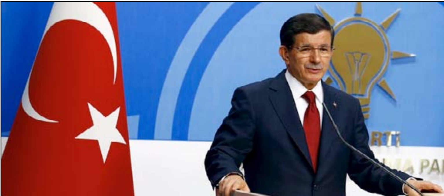
رئيس الوزراء التركي

وأكد في الوقت ذاته أن بلاده لن ترسل قوات برية إلى سورية قائلاً: «لن نرسل قوات برية إلى الأراضي السورية»، لافتاً في الوقت نفسه إلى أن تركيا «لا تريد أن ترى داعش بالقرب من حدودها». وبرز داود أوغلو العملية العسكرية ضد المتطرفين من خلال الإشارة إلى الهجوم الانتحاري في سوروتش (جنوب) قبل اسبوع والذي نسبتها السلطات التركية إلى التنظيم المتطرف بالإضافة إلى مقتل جندي تركي بإطلاق نار من قبل متطرفين الخميس الماضي. وتابع: «تريد التأكد من أن التنظيم يدفع ثمننا غالباً لمقتل ٣٢ شخصاً حتى لا يعيد الكرة أبداً». مشيراً إلى أن «مقتل الجندي سرح رندا». ورفض داود أوغلو إعطاء تفاصيل حول الاتفاق الذي تم التوصل إليه مع الولايات المتحدة لاستخدام قاعدة «إنجريك» (جنوب تركيا) لنشر غاراتها ضد المتطرفين في سورية والعراق، مؤكداً في