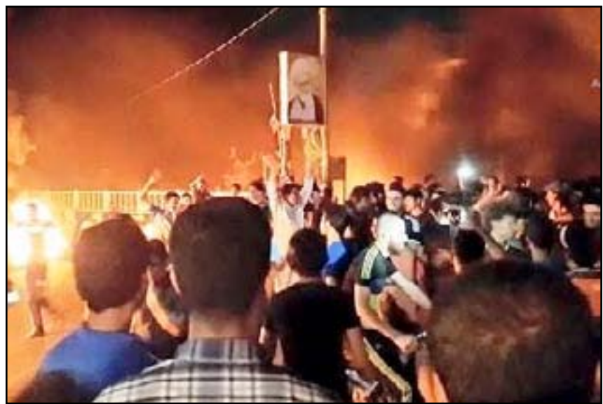
جانبا من التظاهرة

إلى (المدى برس)، إن "المئات من اهالي حي الشهداء في مدينة الناصرية خرجوا، في ساعة متقدمة من ليل الأحد، في تظاهرة احتجاجاً على انقطاع التيار الكهربائي المتكرر عن منطقتهم". وأضاف الناصري ان "التيار الكهربائي انقطع لساعات عدة عن حي الشهداء والمناطق السكنية المجاورة له نتيجة عطل في الخط المغذي لمحطة الشهداء الثانوية"، مؤكداً ان "اصلاح الخط تأخر لساعات في ظل الأجواء الحارة".