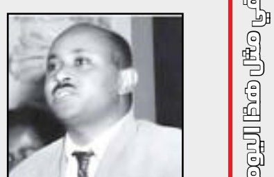
إعدام عبد الخالق محجوب

في مثل هذا اليوم الثامن والعشرين من تموز عام ١٩٧١ اعدمت السلطات السودانية المناضل عبد الخالق محجوب، القيادي البارز في الحركة الشيوعية العربية والسودانية، وكان معروفًا في المحافل الشيوعية العالمية له عدد من المؤلفات، التي عرضت لإمكانية إيجاد صيغة سودانية للماركسية، بدلا