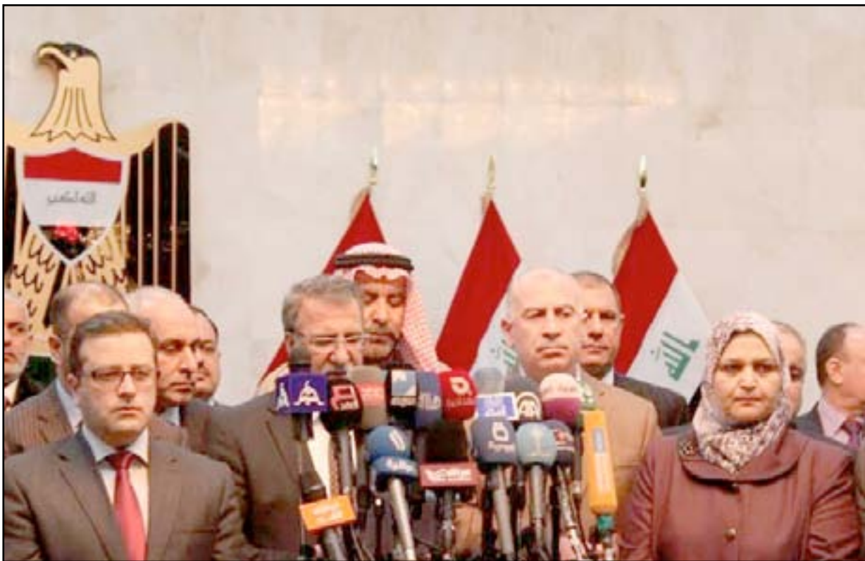
اعضا، تحالف القوى في مؤتمر صحفي.. أرشيف

انجاز". وتقول حكومة العبادي انها انجزت ابرز بنود الاتفاق السياسي، كإقرار النظام الداخلي لمجلس الوزراء، وحسنت الخلاف مع حكومة اقليم كردستان بشأن تصدير النفط. وهو اتفاق مازال متعثرا، وتعتبره القوى السنية دليلا بان المشكلة "ليست في تحالف القوى" وانما مع الحكومة التي يشتكي منها الاكرد ايضا. كما تقول الحكومة انها انجزت ملف البيشمركة، وهو امر يشكك بصحته الاكرد. وتؤكد رئاسة الوزراء انها ارسلت عددا من القوانين كالحرس الوطني والمساءلة والعدالة الى مجلس النواب، وهي مشاريع قوانين تواجه خلافات شديدة داخل البرلمان.