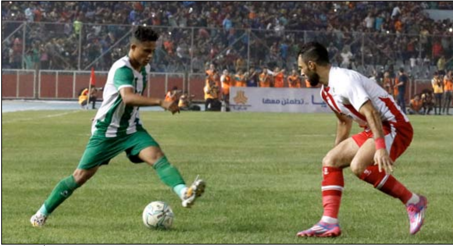
نظام الدوري الجديد يحدث انقساماً بين الأندية المشاركة