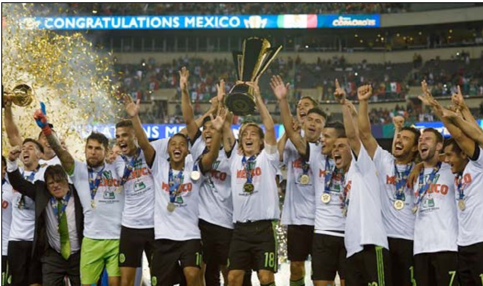
منتخب المكسيك يحتفل بلقب الكأس الذهبية

وكان جامايكا قد جردت الولايات المتحدة من اللقب بالفوز عليه 1-2 في نصف النهائي.