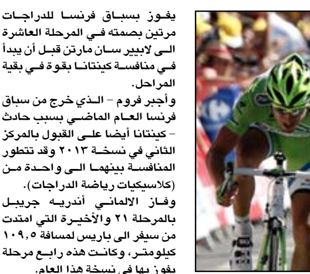
فروم يعزز مسيرته بفوزه في سباق فرنسا سباق فرنسا سريعا الى منافسة ثنائية بعدما تعرض الإسباني كونتادور بطل سباق فرنسا مرتين

□ باريس/ رويترز فاز البريطاني كريس فروم متسابق فريق سكاي بلقب سباق فرنسا للدراجات للمرة الثانية في ثلاث سنوات ليعزز سمعته كمتخصص في السباقات الكبرى. وهذه ثالث مرة في أربع سنوات يفوز فيها فريق سكاي بسباق فرنسا بعدما تفوق براندلي ويجينز في 2012 قبل أن يخلفه فروم في 2013. تفوق فروم البالغ من العمر (30 عاماً) - الذي بزغ نجمه عندما فاز بالمركز الثاني في سباق اسبانيا في 2011 - على الكولومبي نابيرو كيتانا في صدارة الترتيب العام بفارق دقيقة واحدة و 12 ثانية بينما حل الإسباني اليخاندرو بالبيردي زميل كيتانا في فريق موفيستار ثالثاً بفارق 5 دقائق و 25 ثانية عن