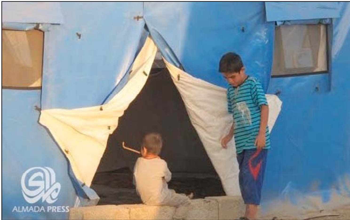
اطفال نازحون في أحد المخيمات