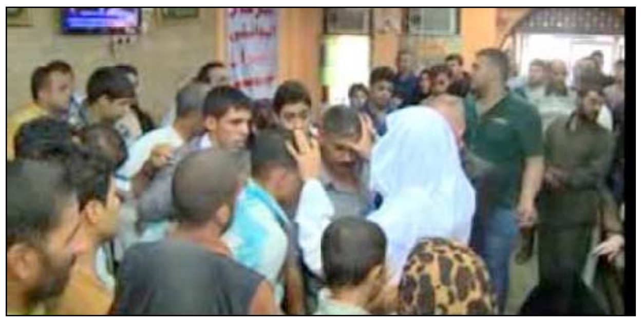
يعالج الشقيقة !!

والكثير من الناس تصدق مايقومون بعمله لبساطتهم. مضيفا: للاعلام دور كبير في التوعية والتثقيف، وابعاد الناس عن هذه العيادات الروحية. وكذلك للشرطة المجتمعية ومنظمات المجتمع المدني دور كبير من خلال عقد الندوات التوعوية في الجامعات والمؤسسات الحكومية، وكل اماكن جذب المواطنين، بالإضافة الى ذلك يجب ان يكون دور وزارة الداخلية رادعا، للذين يقومون بعمليات النصب والاحتيال، ولكنها تحتاج الى تشريع قوانين من قبل البرلمان، وبشأن اذا كانت هناك شكاوى بهذا الشأن