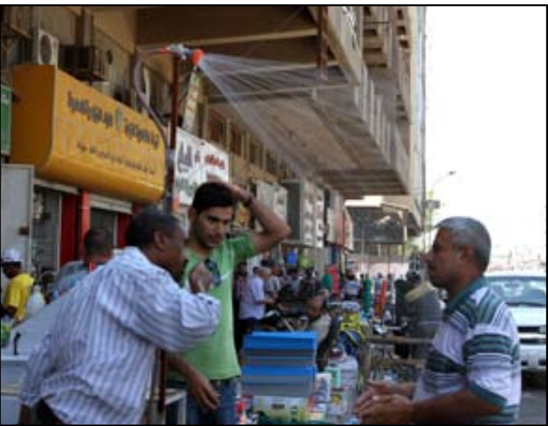
مواطنون يبردون اجسامهم بالماء، تقادياً لارتفاع درجات الحرارة