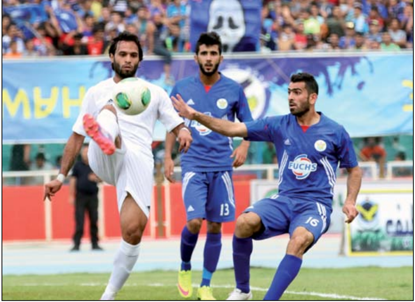
اتحاد الكرة يثير جدلاً واسعاً بخصوص آلية الدورة الجديدة

واضاف: لا يمكن اقامة دوري الكرة للدرجة الممتازة بطريقة المجموعتين فذلك يعني قتلاً عمداً للتنافس وضياح مليارات الدنانير التي أنفقت في إبرام العقود مع اللاعبين، لأنه اذا افترضنا ان قيمة عقد اللاعب ١٨٠ مليون دينار ومطالب بخوض ١٨ مباراة وفق نظام المجموعتين أي انه مقابل كل ٩٠ دقيقة يتقاضى ١٠ ملايين دينار وسيتبقي دور المجموعات يوم ١٦ آذار ٢٠١٦ وتجد اغلب الأندية نفسها بعد ستة اشهر خارج المنافسة في ظل صعود ثلاثة أندية فقط عن كل مجموعة، وهذا إجحاف غير مقبول لابد من التصدي له بالغاء القرار. وعزا عباس العزل بنظام الدوري العام للأندية العشرين الى