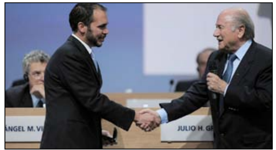
دعم عراقي كبير لترشيح ابن الحسين لرئاسة (فيفا)

مباراة سوريا التي كان من المقرر اجراؤها يوم ٢ حزيران الماضي. وأوضح أن لعلي بن الحسين فضلاً كبيراً على الكرة العراقية بعد أن فتح ابواب الملاعب الأردنية لاحتضان مباريات المنتخب العراقي في اقامة مبارياتها الودية والرسمية ضمن البطولات العربية والآسيوية والدولية فضلاً عن احتضان المعسكرات التدريبية نتيجة للحظر المفروض عليها من قبل الاتحاد الدولي للعبة، معرباً عن أمله في أن يكون للعرب وقفة مشرقة الى جانبه في الانتخابات الجديدة لرئاسة (فيفا) حتى يكون لنا صوت مسموع بقوة داخل المكتب التنفيذي الذي يضم اربع شخصيات عربية في الدورة الحالية بمعدل شخصيتين من قارة آسيا (سلمان بن ابراهيم وحمد الفهد) ومثلها من قارة أفريقيا (هاني بوريدة ومحمد رو راوة).