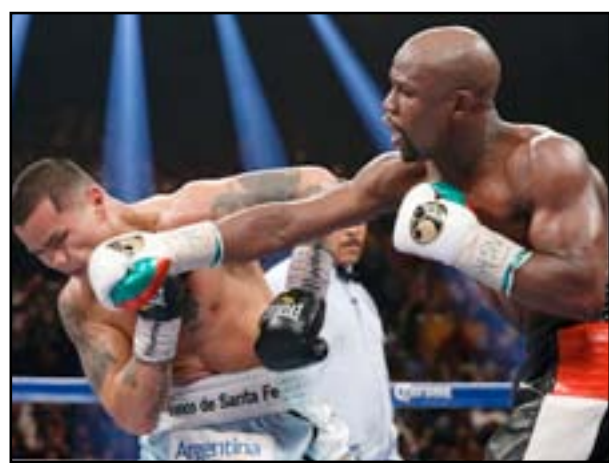
مايويندر في لقاء صعب أمام بيرتو

مرتين في وزن الوسط (٣٠-٣). انتصار مايويندر سيجعله يعادل الرقم القياسي لبطل الوزن الثقيل الراحل روكي مارسيانو الذي اعتزل في نيسان الماضي ١٩٥٦ بسجل يبلغ ٤٩ انتصاراً من دون أية هزيمة. وقال مايويندر: أنا مستعد للعودة إلى الحلبة في ١٢ أيلول المقبل لكي أثبت مجدداً لكل العالم أنني الأفضل على الإطلاق، وأضاف "إنه ملاك شاب وقوي ويشعر بالهزم لإسقاط الأفضل، ٤٨ ملاكاً حاولوا من قبل، وفي ١٢ أيلول سأجعلهم ٤٩ ملاكاً.