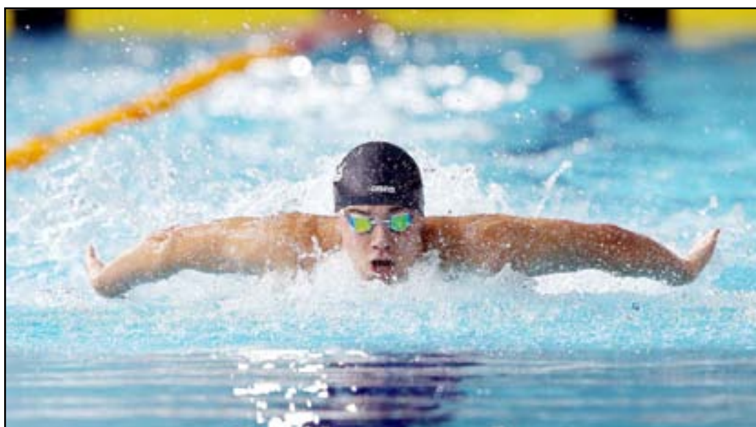
غاي يخطف ذهبية ٢٠٠ متر حرة

وتفوق غاي على الصيني سون والألماني بول بيدمان اللذين حققا الميداليتين الفضية والبرونزية على الترتيب فيما جاء الأميركي رايان لوكتي في المركز الرابع. وعرقل السباح البالغ من العمر ١٩ عاماً