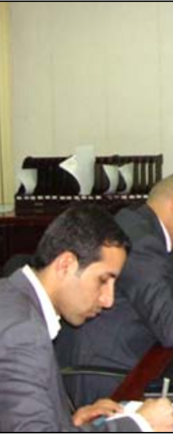
اجتمع سابق لاعضاء لجنة النزاهة البرلمانية

ارقام من النزاهة وتكشف بيانات هيئة النزاهة ان استجابة كشف الذم المالية لرئاسة الجمهورية ولرئاسة البرلمان اعتبارا من مطلع كانون الثاني الماضي ولغاية مطلع حزيران الحالي بلغت ١٠٠٪ لكل منهما، فيما بلغت استجابة رئاسة الوزراء ٧٥٪، بينما بلغت نسبة استجابة الوزراء ٩٦,٥٪. بالمقابل بلغت "نسبة كشف الذم لأعضاء مجلس النواب ٤٥٪"، اذ قام ١٤٢ نائبا فقط من اصل ٣٢٨ برلماني، بتقديم كشوفات عن ذممهم المالية. وحول الخزام رؤساء الهيئات والجهات غير المرتبطة بوزارة ومن هم بدرجة وزير وكشف ذممهم المالية، تكشف هيئة النزاهة عن إفصاح ١٨ مسؤولو فقط عن أوضاعهم المالية.