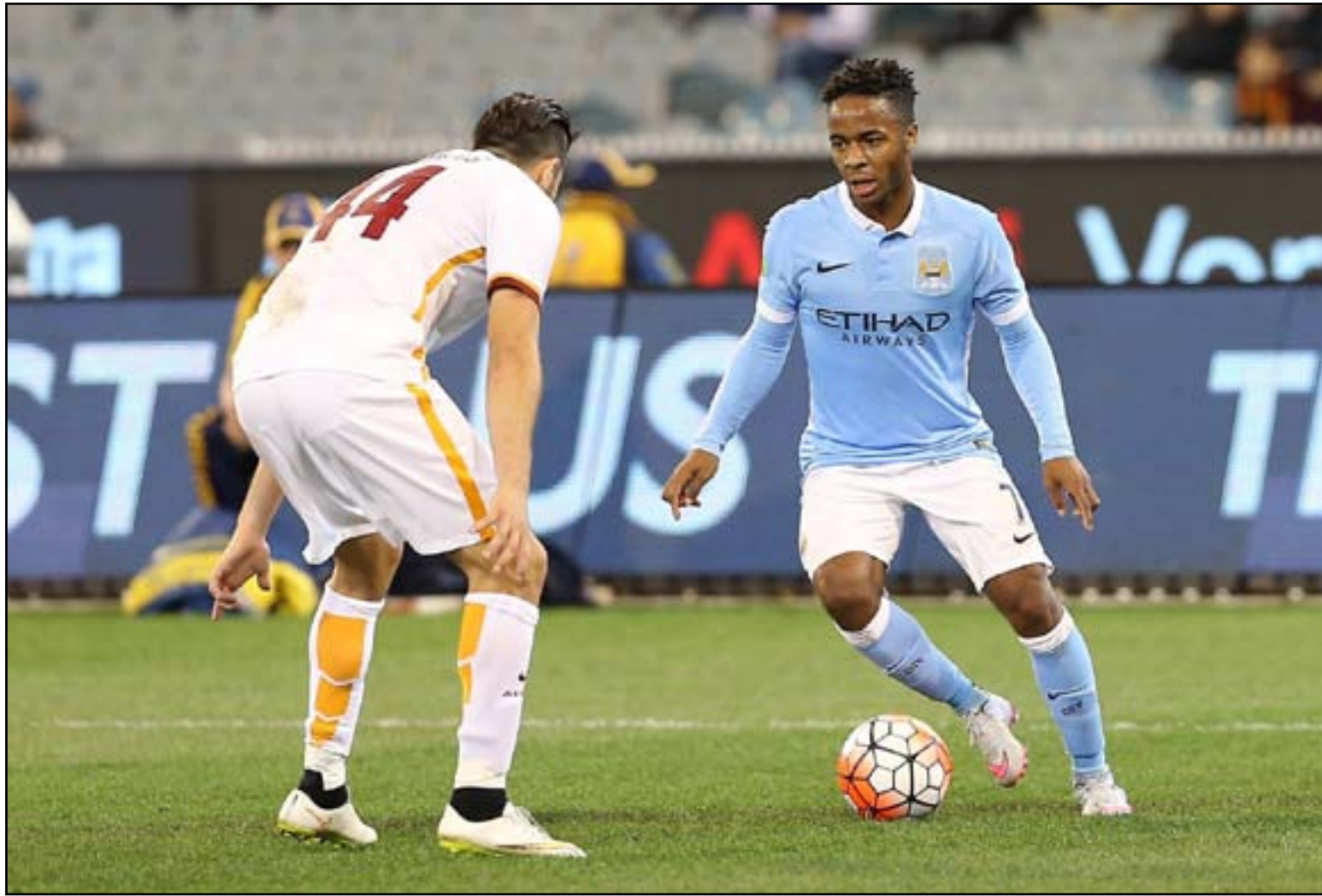
أندية البريميرليغ تعول على عوائد عقد البيث التلفزيوني

وأنفقت شبكة (سكاى سبورتس) البريطانية ٤ مليارات و١٧٦ مليون استرليني (٥ مليارات و٥٦٢ مليون يورو) للحصول على ٥ من باقات البيث الدوري الإنكليزي الممتاز بين ٢٠١٦ و٢٠١٨ في حين حصلت (بي تي) على الباقيتين الآخرين مقابل ٩٦٠ مليون استرليني (مليار و٢٩٨ مليون يورو).