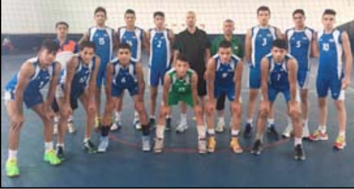
طائرة الناشئين تسمى للفوز على الجزائر