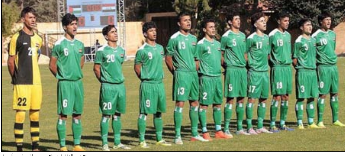
منتخب الناشئين يقرب من لقب غرب آسيا

على الصدارة برصيد ٩ نقاط بفارق ٣ نقاط عن المنتخب السعودي والإماراتي بانتهاء الجولة ما قبل الأخيرة من المنافسات التي جرت بطريقة الدوري الجزأ من مرحلة واحدة حسب تعليمات اللجنة المنظمة بعد انسحاب المنتخب الإيراني قبيل أيام من انطلاقها. وأوضح ان المنتخب الإماراتي سيرمي بكل شعاعه الوحيد وبفارق اهداف يصل الى ٧ اهداف من اجل خطف اللقب بعد ان تعرض الى خسارة مفاجئة من شقيقه المنتخب السعودي في المباراة الاخيرة التي جمعتهما جعلته يتعدى الى المركز الثالث خلفه بفارق الاهداف بعد ان تساويا في رصيد النقاط البالغ ٦ لكل منهما ، مشيراً الى انه وضع خطة تكتيكية تناسب اسلوب لعب المنتخب الإماراتي حرص