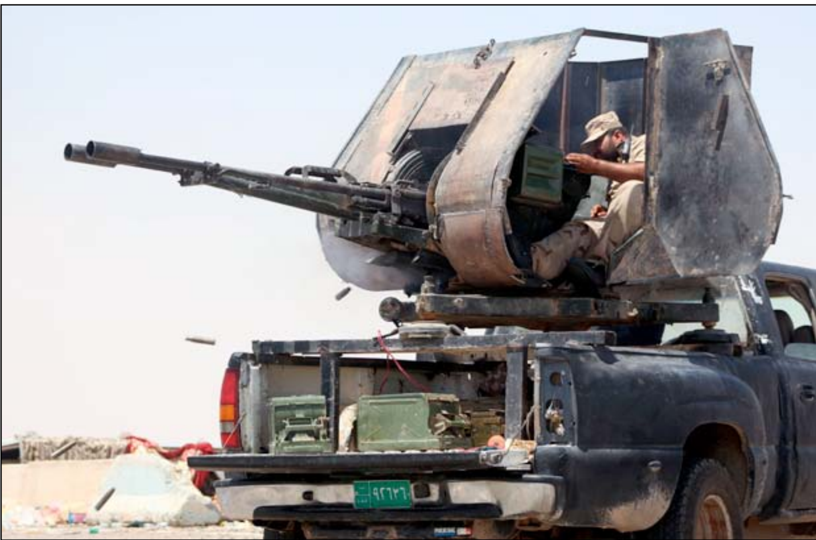
آلية عسكرية في الصقلاوية.

بأيدينا بعد قتل اعداد كبيرة منهم". بدوره قال احد مسؤولي فرق الرصد في القوات المشتركة حسن الجبوري في حديث الى (المدى برس) "استطعنا رصد وصد مجموعة من التعرضات للتنظيم من ثلاثة محاور"، مبينا أن "تلك المعركة كانت كفيلة بقتل اعداد كبيرة وتكبيدهم الخسائر في