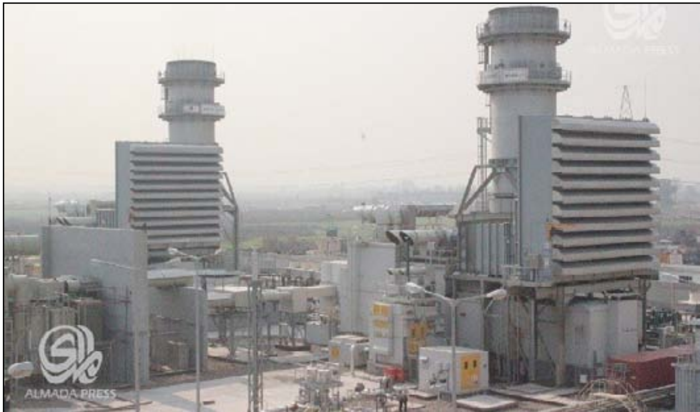
محطة كهرباء القدس الحرارية شمال بغداد

مبيناً أن "الأهم من ذلك الفساد المالي والإداري في ملف الطاقة". وأوضح عضو المجلس، أن "الحكومة المحلية تسعى لوضع الحلول لتلك الأزمة من خلال نصب أكثر من عشرة آلاف و ٦٠٠ مولدة كهربائية تنتج ٢٨٠٠ ميغاواط، وإقامة محطات توليد استثمارية"، كاشفاً عن "عزم الحكومة