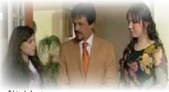
من مسلسل دنيا الورد