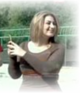
من مسلسل دولاب الدنيا

ما الذي يجعل شبكة الاعلام العراقي تحيل انتاجها الى عدد من الاسماء الفنية