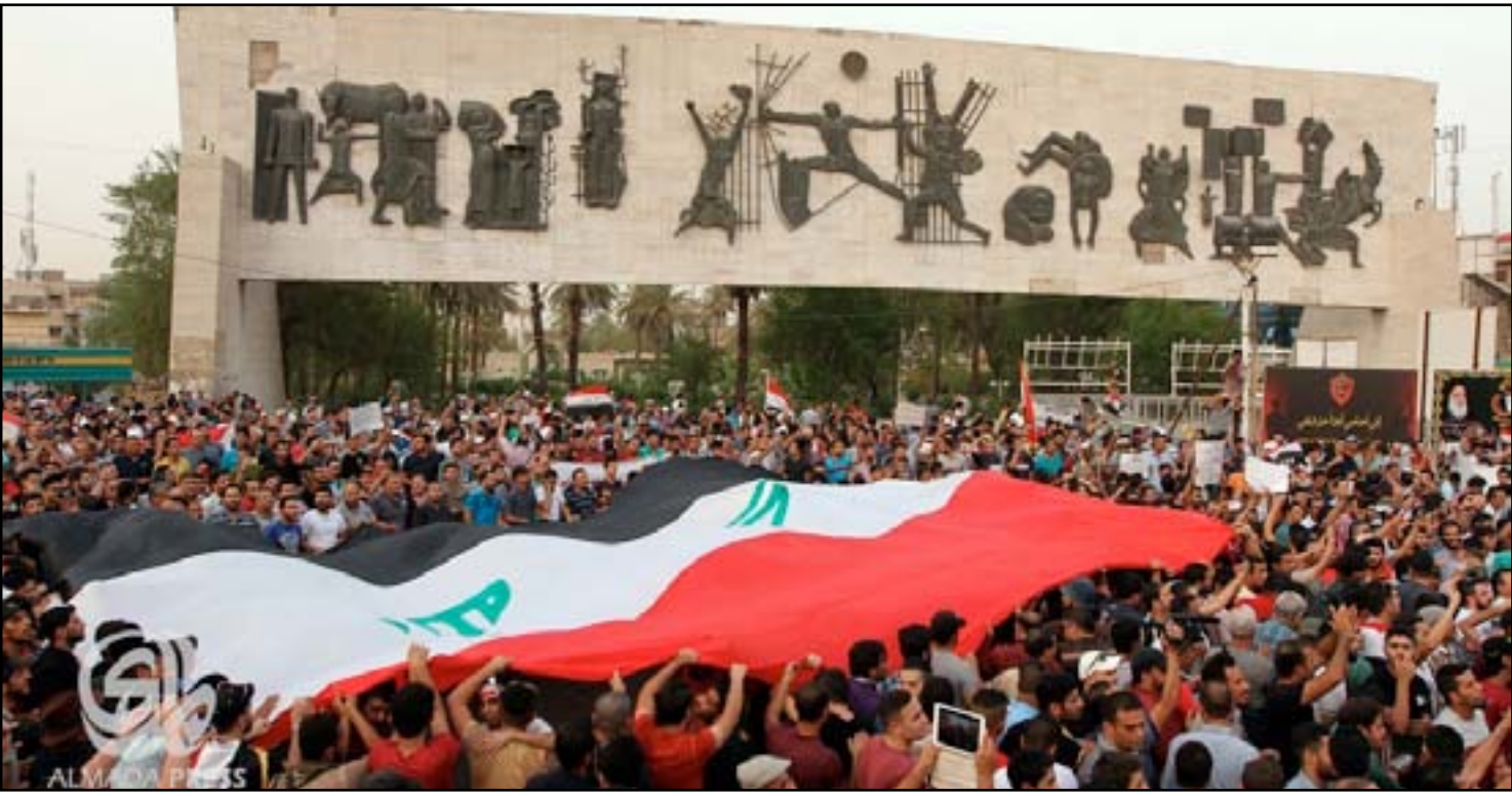
جانب من التظاهرة التي شهدتها ساحة التحرير الجمعة (٣١ تموز ٢٠١٥)

□ أكدوا أنّ الاحتجاجات السلمية مستمرة لحين تنفيذ المطالب