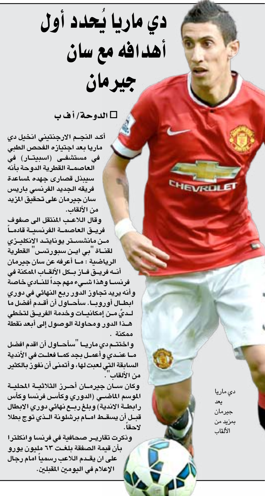
دي ماريا يعد جيرمان المزيد من الألقاب

وذكرت تقارير صحافية في فرنسا وانكلترا بأن قيمة الصفقة بلغت ٦٣ مليون يورو على أن يقدم اللاعب رسمياً أمام رجال الإعلام في اليومين المقبلين.