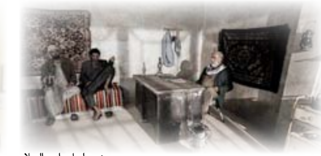
من مسلسل وادي السلام