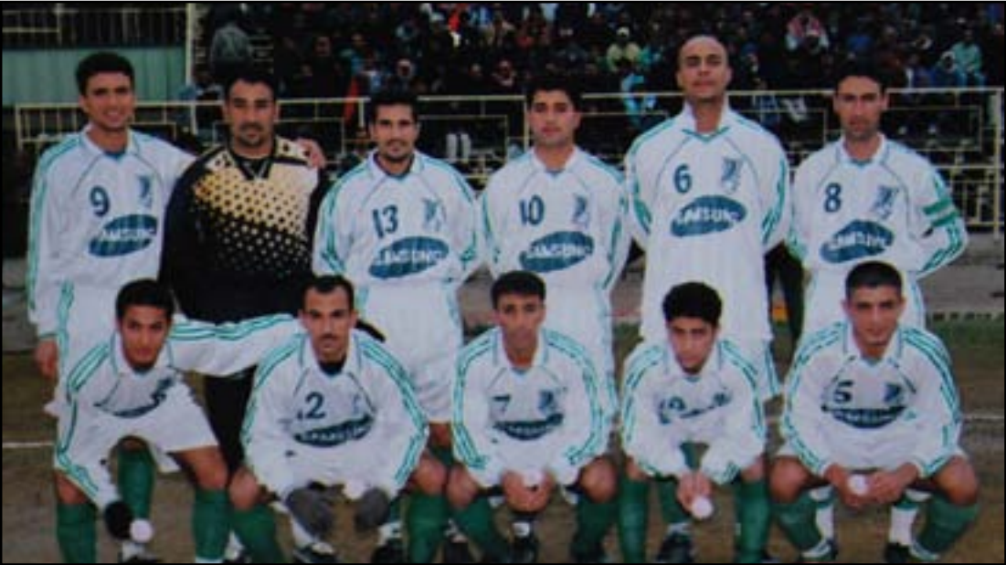
قضى ثلاثة مواسم مع الشرطة