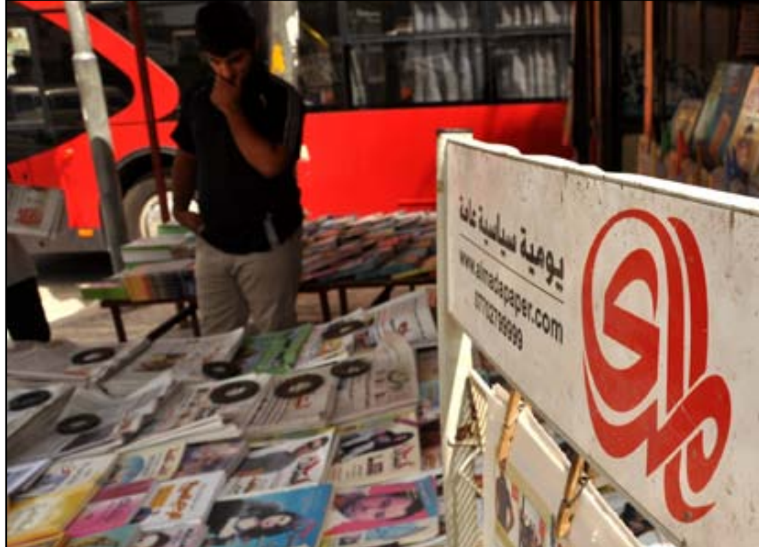
سياسيون ومثقفون يهنئون "المدى" بذكرى تأسيسها