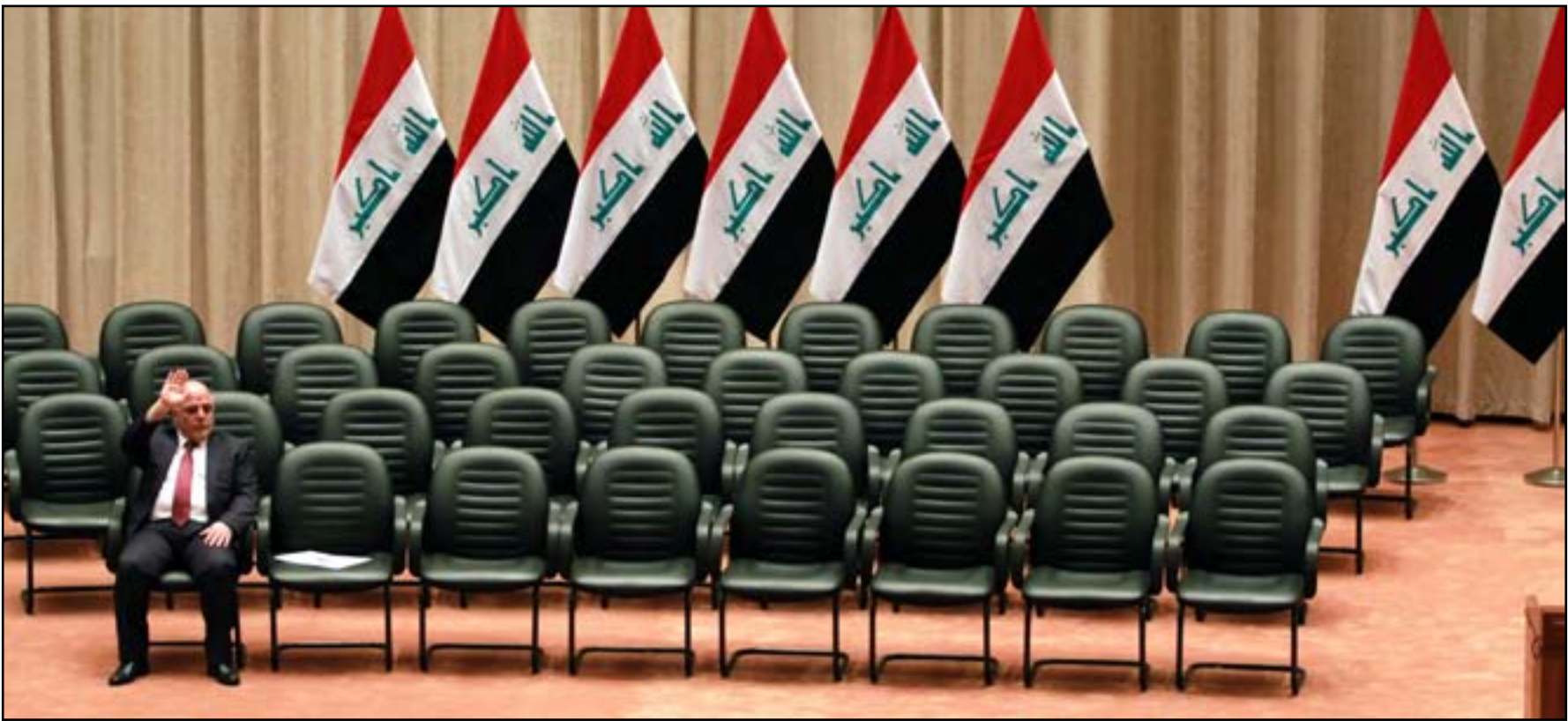
خلال جلسة منح الثقة للحكومة العام الماضي.. أرشيف

واضاف العبادي، في تصريح لـ(المدى)، أن العبادي سيقدم مجموعة ثانية من الإصلاحات إلى مجلس الوزراء ومن ثم يرسلها لمجلس النواب، وتتضمن ترشيح عدد من الوزراء وبعض المديرات التابعة لها، ودمج بعضها مع البعض