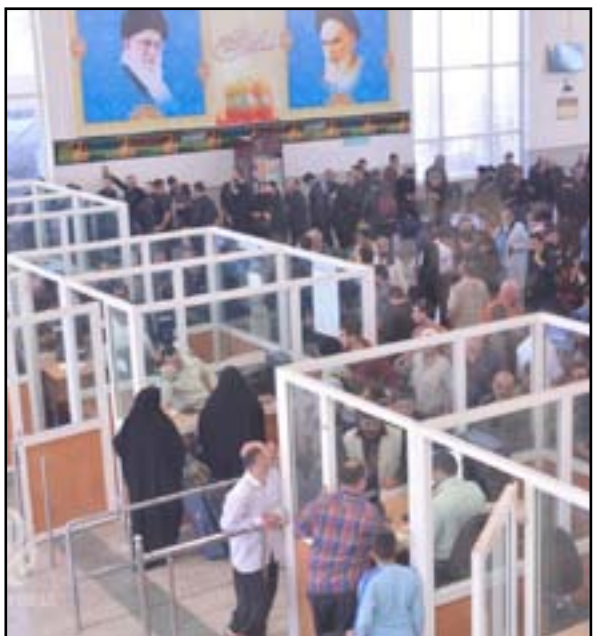
منفذ مهراق الحدودي بين العراق وإيران

منها، إن "وزير الداخلية محمد سالم الغبان، أكد خلال لقائه مدراء الجنسية العامة والمنافذ الحدودية ومديرية الإقامة على ضرورة تشكيل لجنة دائمة تأخذ على عاتقها عملية تسهيل دخول الزائرين والوافدين إلى العراق أثناء الزيارات المليونية وفق الضوابط القانونية". وأضاف البيان، إن الغبان أكد أيضاً على ضرورة وضع