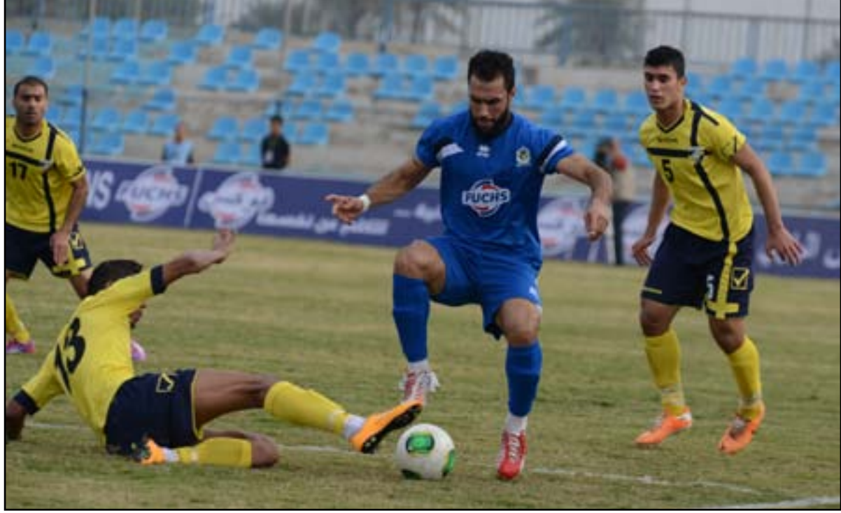
الجوية يعاني ضائقة مالية تقوض طموحاته للموسم الجديد