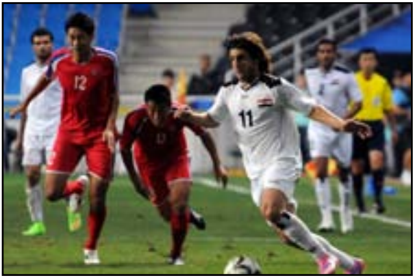
طاقم عماني يدير مباراة منتخبنا مع الصين تايبيه