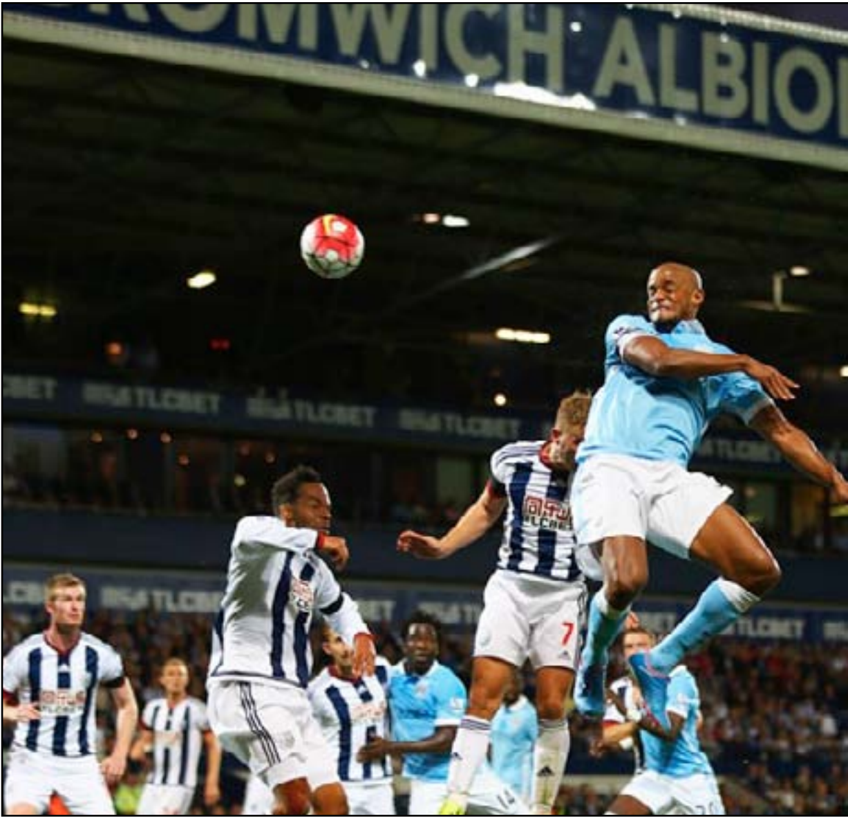
مانشستر سيتي يبدأ موسمه الجديد بفوز لاقت

في الجولة الثانية من الدوري الانكليزي، وقالت صحيفة "ميرور" الانكليزية ان ادارة سيتي بدأت مطاردة دي بروين خلال هذا الصيف بعرض قيمته 39 مليون جنيه إسترليني ثم رفعت العرض إلى 42 مليون إسترليني، وأبدت استعداداً