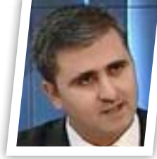
أرام شيخ محمد

أعلن نائب رئيس مجلس النواب أرام شيخ محمد تأييده لمطالب الشعب العراقي بتحسين الخدمات والإصلاحات الضرورية لأن الأوضاع لا تتحمل أكثر، مشددا على عدم التعامل مع هذه الأوراق كردة فعل. وقال شيخ محمد أن "التأييد مطلوب لهذه الورقة، شئنا أم أبينا، وهذا لشبيطين بسيطين كأفراد أو كتل لأن الوضع لا يتحمل أكثر وكلنا متفقون على أن الإصلاح ضروري، ولكن أطلب منكم أن لاتتعامل مع هذه الورقة أو غيرها كردة فعل، لأننا نقر بأن إحدى مسؤوليتنا هي الجانب الرقابي والبدء بالإصلاح والرقابة على السلطة التنفيذية الممتلئة بالحكومة في بلدنا". وحث البرلمانيين على "متابعة المتورطين بقضايا الفساد والعمل على ملفاتهم داخل الزمامة أو المحاكم من أدنى مستويات القضاة إلى آخر مستوياتهم وإطلاع الشارع العراقي على النتيجة".