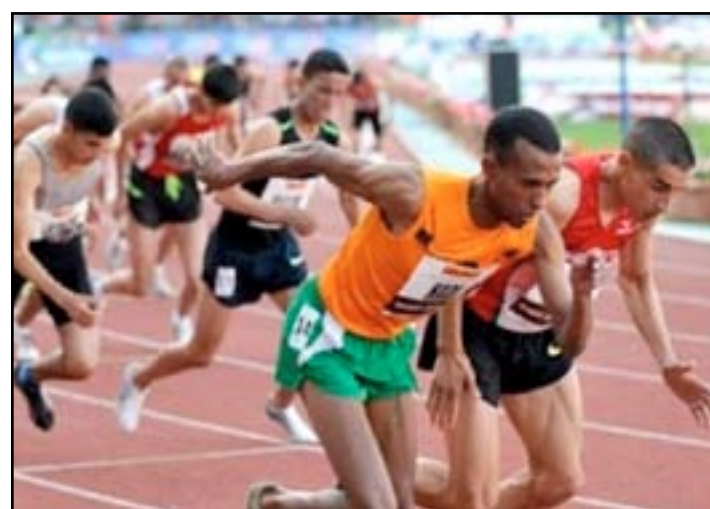
سيموندز أبرز الغائبين عن قوى أميركا

ومن المتوقع أن يكون اللقاء بين غاتلين والجامايكي يوسين بولت صاحب الرقم القياسي العالمي ضمن أبرز مواجهات ملعب (عش الطائر) في بكين في الفترة من ٢٢ إلى ٢٠ آب الحالي.