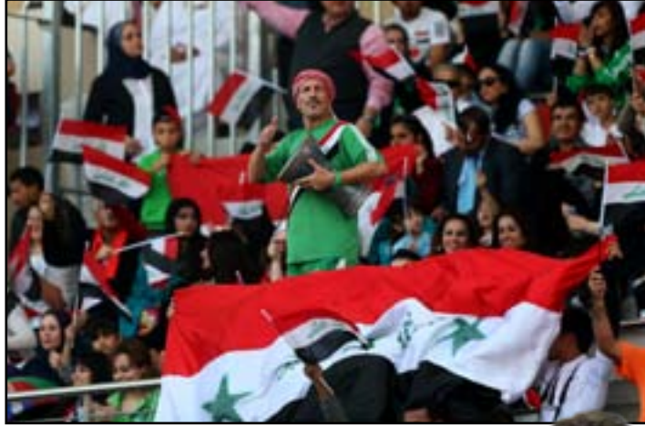
دورة الخليج تجمع الجماهير الرياضية لمؤازرة اللعب النظيف

الخليجية والعراق واليمن للاجتماع مالم تتم المخاطبة الرسمية من الهيئة العامة للدول المشاركة في الدورة، بحجة أنه ليس من المنطقي أن يتخذ قراراً بتأجيل الدورة عاماً، ثم يتراجع عنه خلال أسبوع فقط، خصوصاً أن مسؤوليه يرون وفقاً لوجهة نظرهم، أن المنشآت الرياضية غير جاهزة لضيفاقتها. واضافت تلك المصادر ان الاتحاد قرر أن يقعد رئيسه طلال الفهد مؤتمراً صحافياً الأسبوع المقبل، في محاولة لتسليط الضوء على صواب قرار التأجيل وللدرد على المؤتمر الذي عقدته الهيئة العامة للشباب والرياضة الثلاثاء الماضي وأكدت فيه جاهزية المنشآت الرياضية معتبرة أن قرار التأجيل جاء