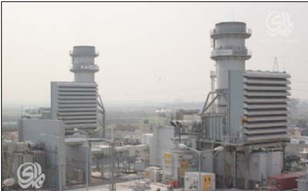
محطة كهرباء القدس الحاررية شمال بغداد