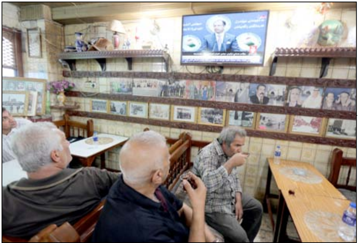
عراقيون يتابعون جلسة البرلمان من احدى مقاهي بغداد.. أ.ف.ب