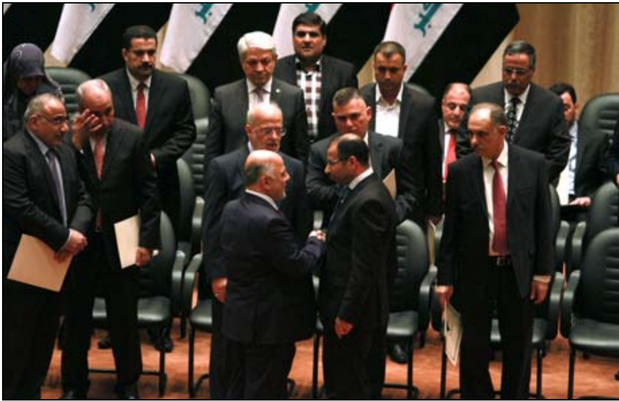
الجبوري يبارك للعبادي تشكيل الحكومة خلال جلسة منع الثقة... أرشيف

العمل كحكومة تصريف أعمال بصلاحيات واسعة وإعلان الأحكام العرفية.