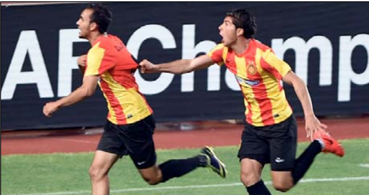
الترجي يحصد اول ثلاث نقاط في مجموعته الافريقية

وقرر الحكم الجنوب أفريقي فيكتور مانويل جوميز الذي أدار المباراة استكمال المباراة في اليوم التالي منذ الدقيقة 50 التي توقفت المباراة عندها بسبب هطول أمطار غزيرة على أرضية الملعب مما جعل اللعب عليها مستحيلًا. ولعب الفريقان بالتشكيل نفسه الذي كان يلعب به كل فريق قبل إيقاف المباراة بحسب ما تنص عليه المادة 12 باللائحة كانت اللائحة قد تم تعديلها في وقت سابق بعد أن وجهت انتقادات عديدة للاتحاد الأفريقي الذي كان قد أعاد مباراة الأهلي المصري أمام القطر الكاميروني في الدور نصف النهائي من بطولة دوري أبطال أفريقيا في عام 2013 للسبب ذاته.