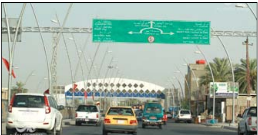
شارع التسبيح وسط مدينة الكوت

ظراً، عازياً ذلك إلى رغبته بـ "تخفيف العبء" عن تلك الشريحة الواسعة التي لم تتسلم رواتبها منذ أكثر من ثمانية أشهر، واستجابته لطلب أولئك الموظفين.