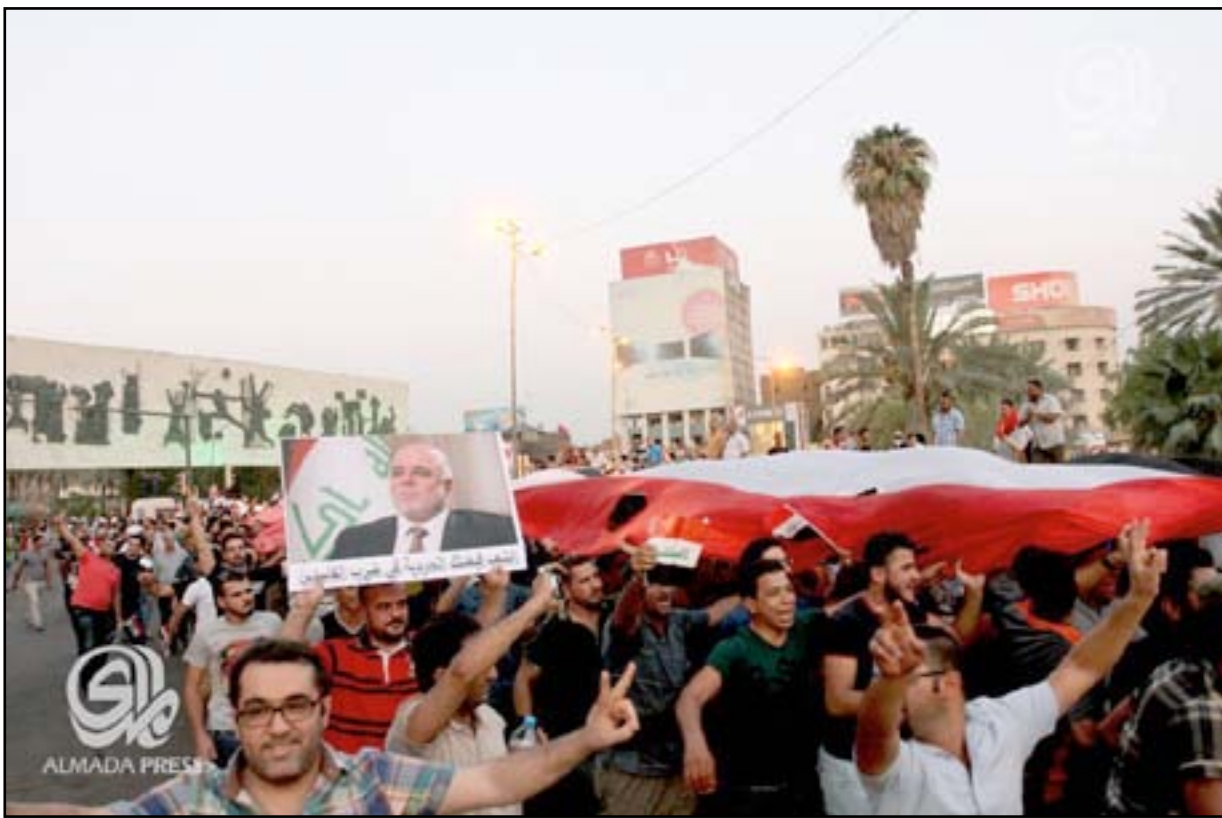
مواطنون وناشطون مدنيون يتوجهون الى ساحة التحرير دعماً لاجراءات الإصلاح التي اعلنها العبادي

الوضع الأمني الراهن. عزاوي دعا المتظاهرين الى رفع سقف المطالب وتوحيد جهتهم من خلال التأسيس لتنسيقية تتبنى طروحات المتظاهرين وتعمل على متابعتها مع فريق الإصلاح الحكومي. ودعا القائمون على تظاهرات بغداد الى التواجد في الساعة السادسة من مساء الجمعة القادمة للمطالبة بإكمال جميع الاصلاحات التي دعا اليها المتظاهرون، مؤكداً في الوقت ذاته ان التظاهرات ستستمر.