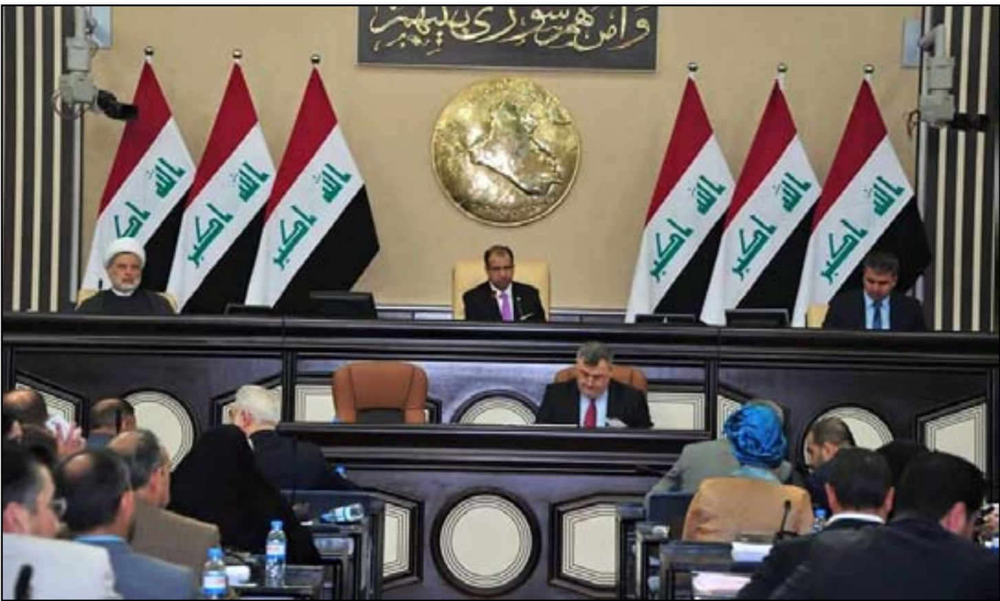
البرلمان العراقي يصوت بالاجماع على الورقة الاصلاحية، وعدد من المحافظات تؤيد القرارات

□ كربلاء تصوت على "تدوير" مدرائها.. و بابل تلزم محافظها بتقديم "ورقة إصلاحية"