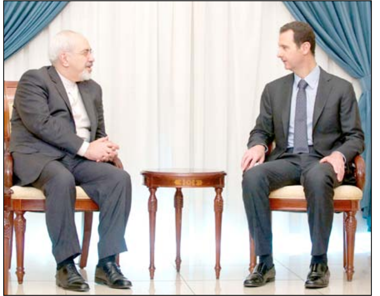
□ موسكو / رويترز، سكاى نيوز، بي بي سي، اف ب

الإيرانية محمد جواد ظريف سيصل مساء الأربعاء (اليوم) إلى دمشق لإجراء محادثات حول آخر تطورات الأزمة السورية وأوضاع المنطقة. في وقت كشف المؤتمر الصحفي المشترك، بين وزير الخارجية السعودي